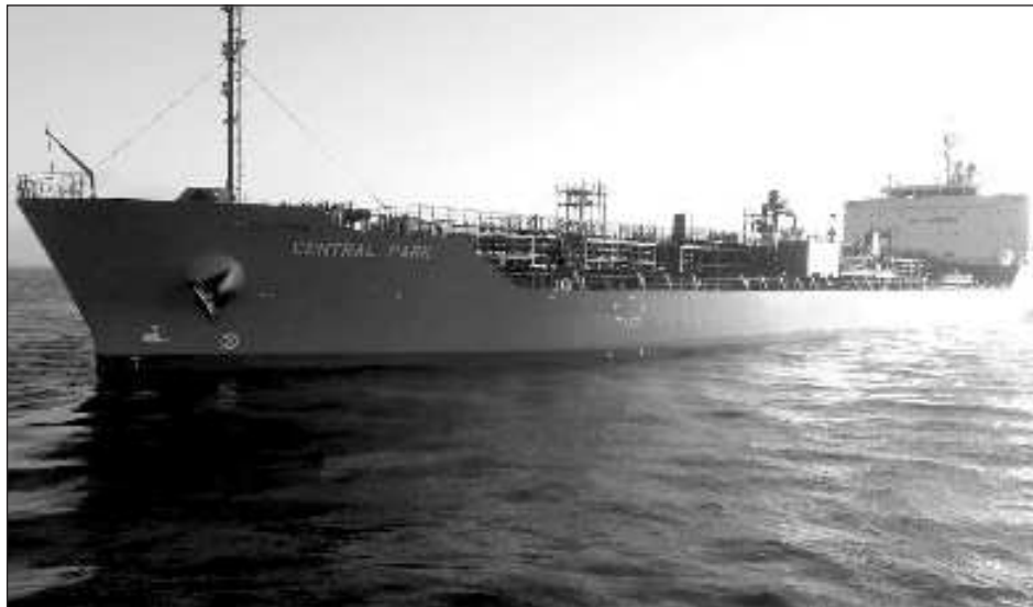
▲ Zodiac Maritime es una empresa de gestión de buques perteneciente a Zodiac Group y Ofer Global, propiedad del multimillonario magnate israelí Eyal Ofer, asentado en Mónaco.

Hasta el momento, los hutíes no se han atribuido esta acción, que se produce en un