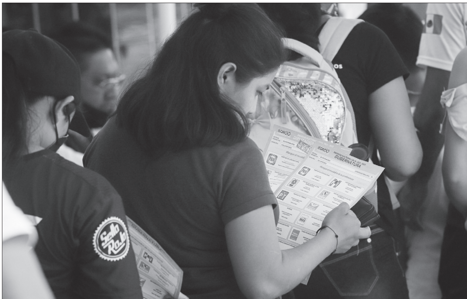
▲ “Es un escenario donde la ciudadanía no puede quedar del todo relegada del proceso electoral y ser una especie de testigo o simple ente legitimador en un proceso que, dicho sea de paso, esta versado en la descalificación, las injurias y los improperios de un bando hacia el otro”.