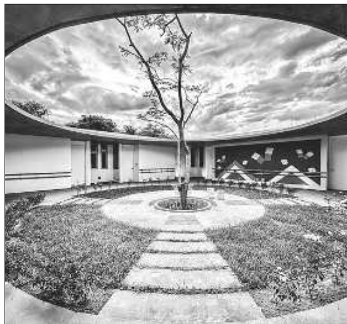
▲ Quedaban algunas preguntas al aire, como establecer la necesidad de un CRIT en la montaña, pero hoy sabemos que atenderá a casi mil 869 niños, la mayoría indígenas.

Y esa es la tarea del gobierno. Si los CRIT han acercado la atención, los programas sociales de AMLO han ido más allá de la dádiva. No se trata únicamente de la pensión para personas con discapacidad, sino también de