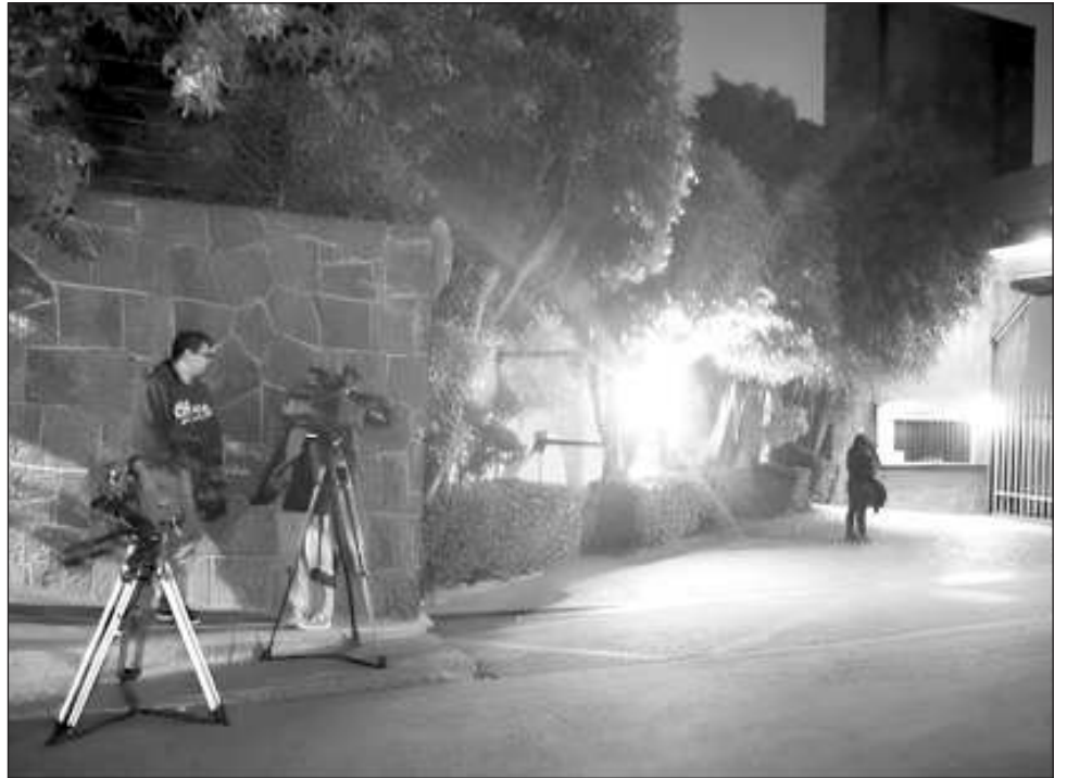
▲ El inmueble en Lomas de Bezares no puede ser devuelta ya que pesa sobre él otro aseguramiento por una causa penal diferente, reveló la fiscalía.

Agrega la FGR que el texto completo de la LNED ya fue examinado por la Suprema Corte de Justicia de