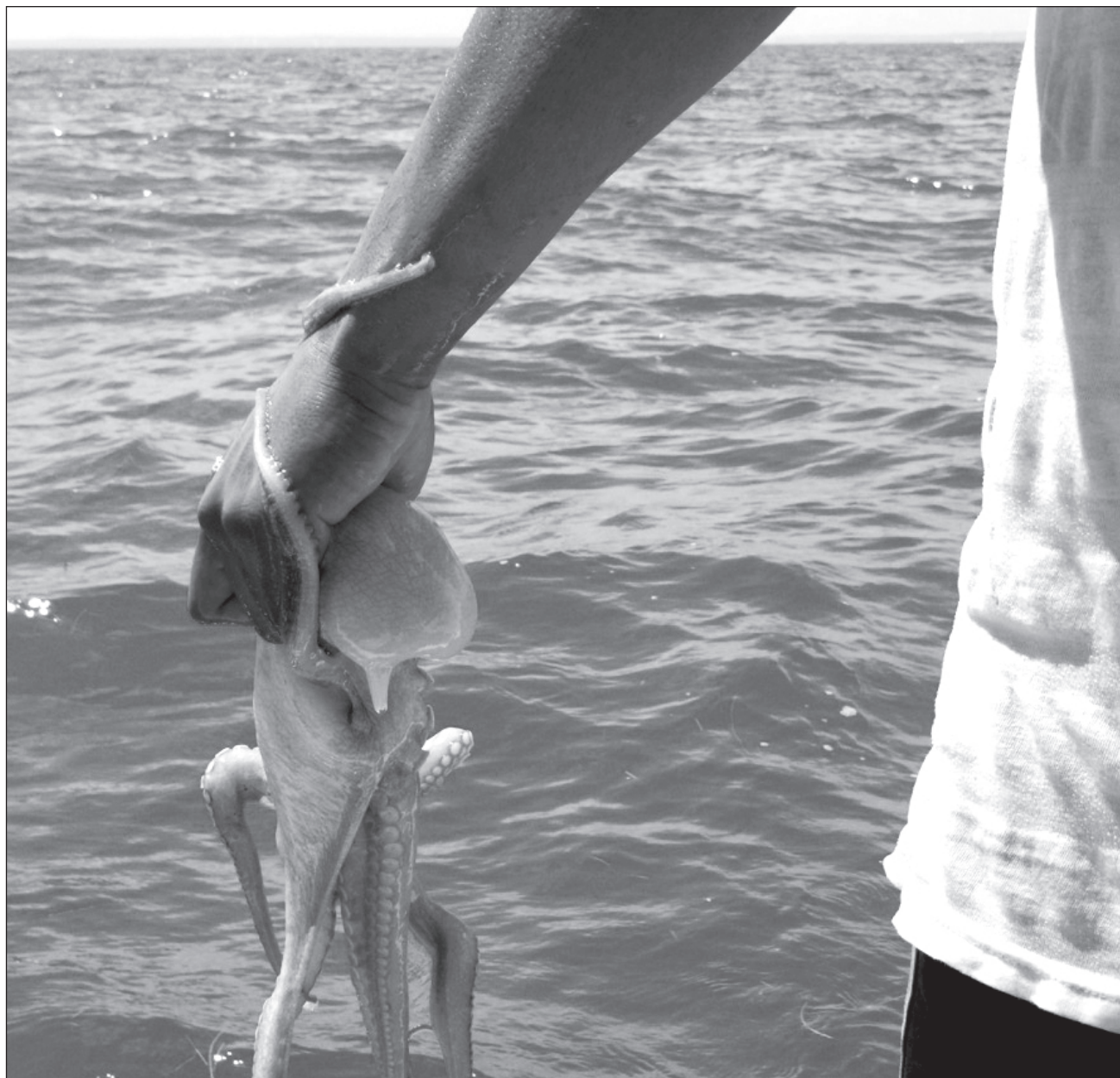
▲ En el encuentro se dio a conocer que también pretenden armar una agenda de trabajo intersectorial para que, con apoyo de las diversas instancias, el pulpo maya tenga un repunte en cuanto a la captura legal, cuidado, venta, distribución y exportación.

En esta reunión, se establecieron parámetros con los cuales se trabajará en busca de la calidad que demanda el producto de exportación y se marcaron las pautas para implementar políticas públicas con las que se pueda generar