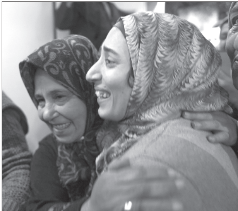
▲ Israel ha dicho que la tregua puede ampliarse un día más por cada 10 rehenes adicionales liberados, aunque ha prometido retomar con rapidez su ofensiva en cuanto termine.

Los 39 hombres jóvenes, vestidos con uniformes grises de prisión, fueron reci-