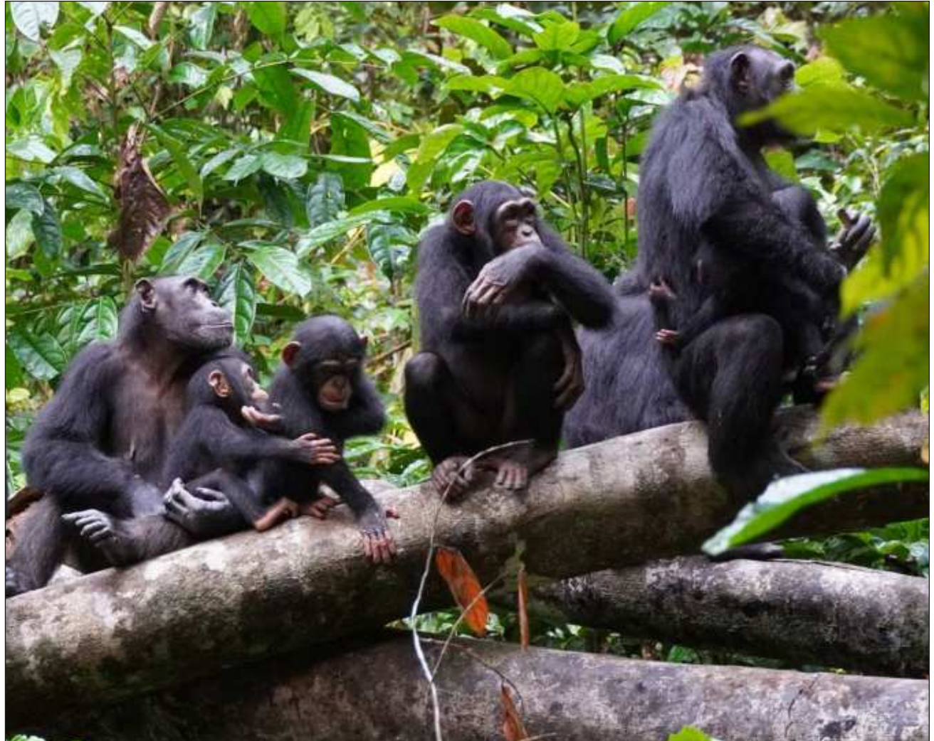
▲ A'alab te'e meyaj beeta'abo' u na'akal le ba'alche'obo' tak tu'ux p'íich ka'anale' ma' tu jach ma'alobkúunsik ba'ax ku yilko'ob yéetel le ku ba'atelo'ob, ba'ale' ku ch'a'anuktiko'ob bix u juum ba'al.

"Xaak'ale' tu ye'esaj beyka'aj u na'ato'ob, beyxan bix u múul meyajo'ob ti'al u yilko'ob tu'ux yéetel ba'ax k'iin u péeko'ob, ba'ale' ma' sajbe'entsil u ti'alo'obi'", tu ya'alaj Sylvain Lemoine, antropólogo biolojikoil ti' u noj najil xook Universidad de Cambridge yéetel