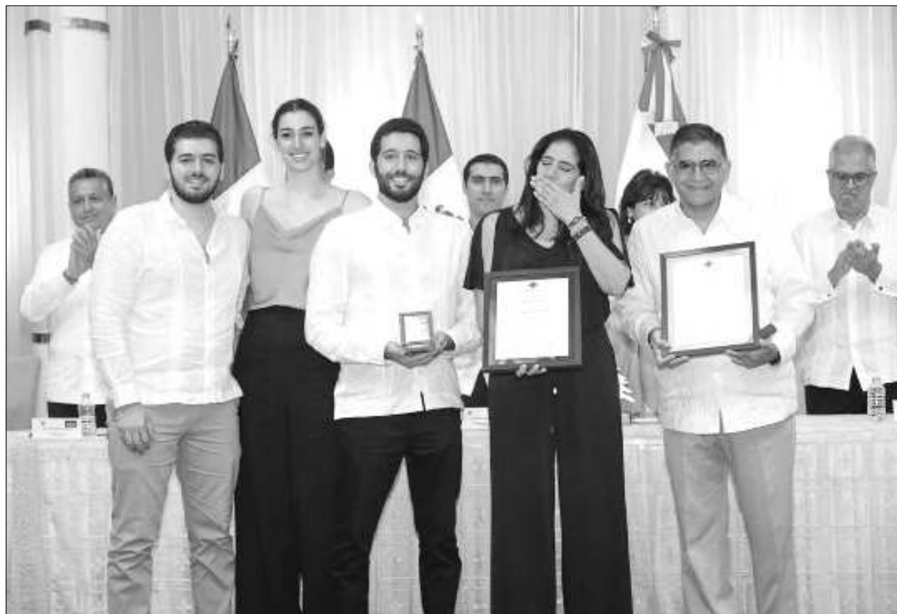
▲ Los Premios Cedros se entregan a descendientes de familias del Líbano o libaneses que residen en el país y que destaquen por su contribución social en áreas como la artística, científica, deportiva, humanística, empresarial o de humanidades.

En el evento realizado en la celebración del 80 aniversario de la Independencia