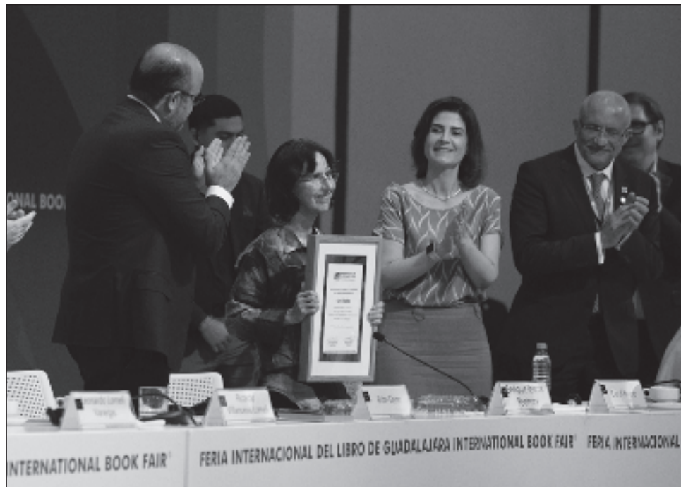
▲ La poeta definió el género al que se ha dedicado desde su juventud como “incesante y abierta búsqueda de sentido que nos guía sin definir de antemano su desenlace”.

Agregó que la poesía nos produce una constante sensación de descubrimiento, una manera de experimentar en un mismo proceso generativo las más diversas capacidades mentales y creativas de dar a la sensibilidad un importante lugar en nuestra vida. Es también gracias a sus expresiones