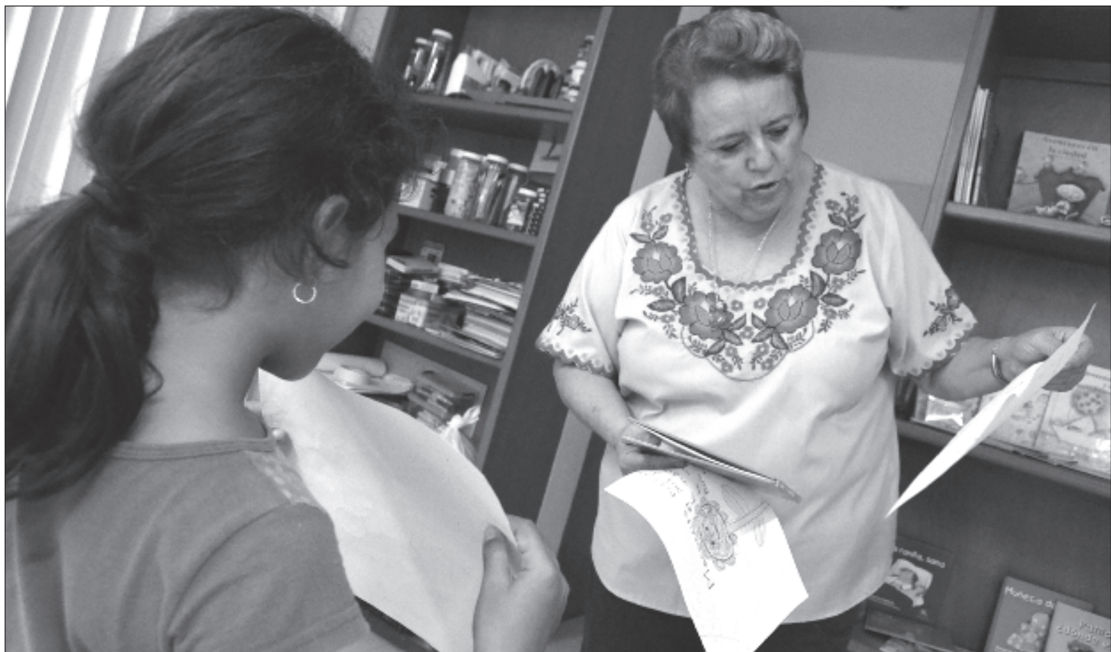
▲ “Me hubiera gustado hablar de mis bisabuelas, pero vivieron en tiempos poco propicios para extender sus alas y participar con más fuerza en la sociedad”.