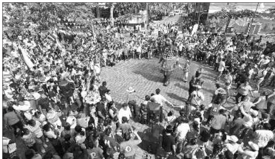
▲ La Pequeña Amal, marioneta de tres metros que representa a una niña siria refugiada, recorrió Tapachula, que concentra más de la mitad de todas las solicitudes de asilo del país.

Asimismo, Pierre-Marc René, asociado de información del Alto Comisionado de Naciones Unidas para los Refugiados (Acnur), señaló que la gira de la Pequeña Amal termina este domingo en Chiapas luego de tres se-