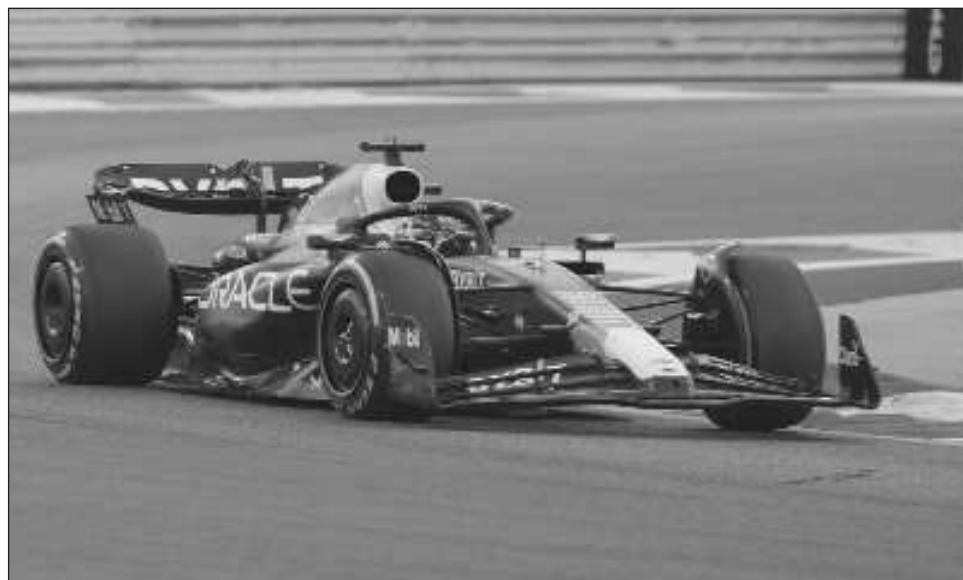
▲ Max Verstappen, en el Gran Premio de Abu Dabi, donde le dio otro triunfo a Red Bull.

"La rompieron toda este año", expresó el director de Red Bull, Christian Horner,