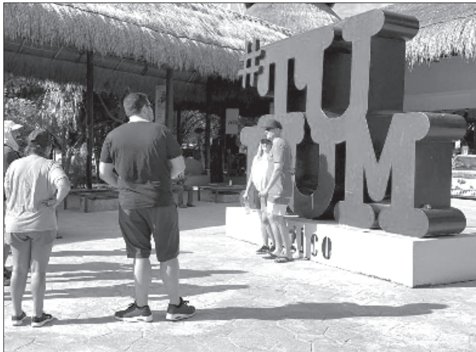
▲ Los prestadores de servicios turísticos esperan un repunte y llegar a los máximos niveles de operatividad durante las vacaciones invernales.

También dijo que esperan que sea únicamente tres días y no más, para poder sacar provecho de la incipiente temporada alta. "Sí afecta la economía porque