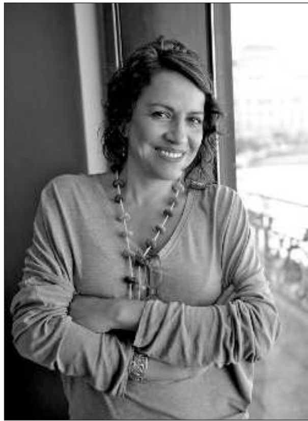
▲ “Sin querer, me volví gestora cultural para generar proyectos que me apasionaban y, por tanto, me convertí en productora, gestora de mí misma”.

—“Mi padre también nos encauzó de una manera severa pero muy libre, muy creativo, por algo era músico; podría calificarla de educación libertaria y conservadora a la vez, llena de contradicciones parecidas a las de