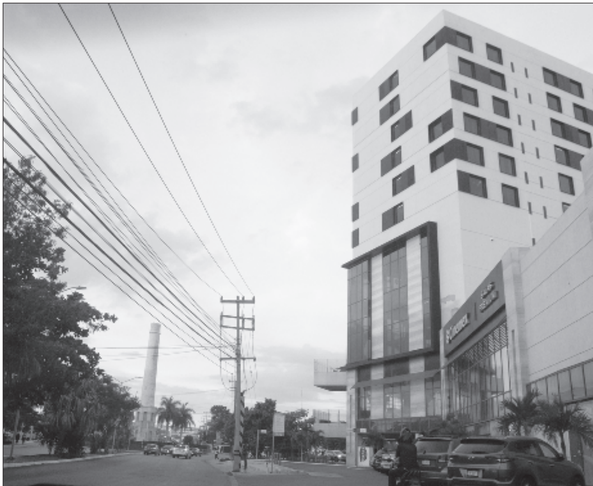
▲ “La consolidación de áreas comerciales y residenciales, así como la creación de polos industriales, ha alterado las rutas tradicionales y ha modificado la distribución de destinos clave en la ciudad”.

ESTOS CAMBIOS ESTRUCTURALES han redefinido la configuración de la ciudad, influyendo no solo en su aspecto físico, sino también en la forma en que los residentes interactúan con su entorno cotidiano y se está traduciendo directamente en la distribución de servicios, el acceso a infraestructuras clave, la movilidad, así como en la calidad de vida de los habitantes.