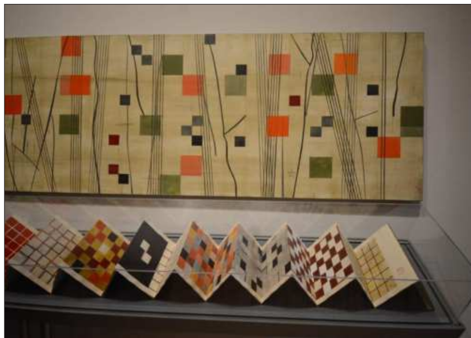
▲ El guión curatorial permite recorrer la trayectoria profesional de este artista abstracto, cuya obra, al principio de tonalidades oscuras y opacas, se volvió algo suntuosa.

Una lógica de la belleza comprende pintura, escultura, grabado, dibujo e instalación; se divide en cuatro secciones con la finalidad de mostrar los diferentes periodos en la obra, aunque los cambios nunca fueron abruptos: Resumen de una trayectoria, Materia, madera y damas: 1980-2000, Desfases: Vibraciones y cur-