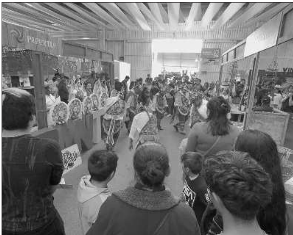
▲ Participaron 346 expositores en los stands, 442 maestras y maestros artesanos, 40 cocineras tradicionales, así como 25 médicos ancestrales de ocho entidades del país.

“Se trató del primer Tianguis de Pueblos Mágicos incluyente, en donde nadie se quedó atrás y nadie se quedó afuera”, afirmó el subsecretario de la Sectur.