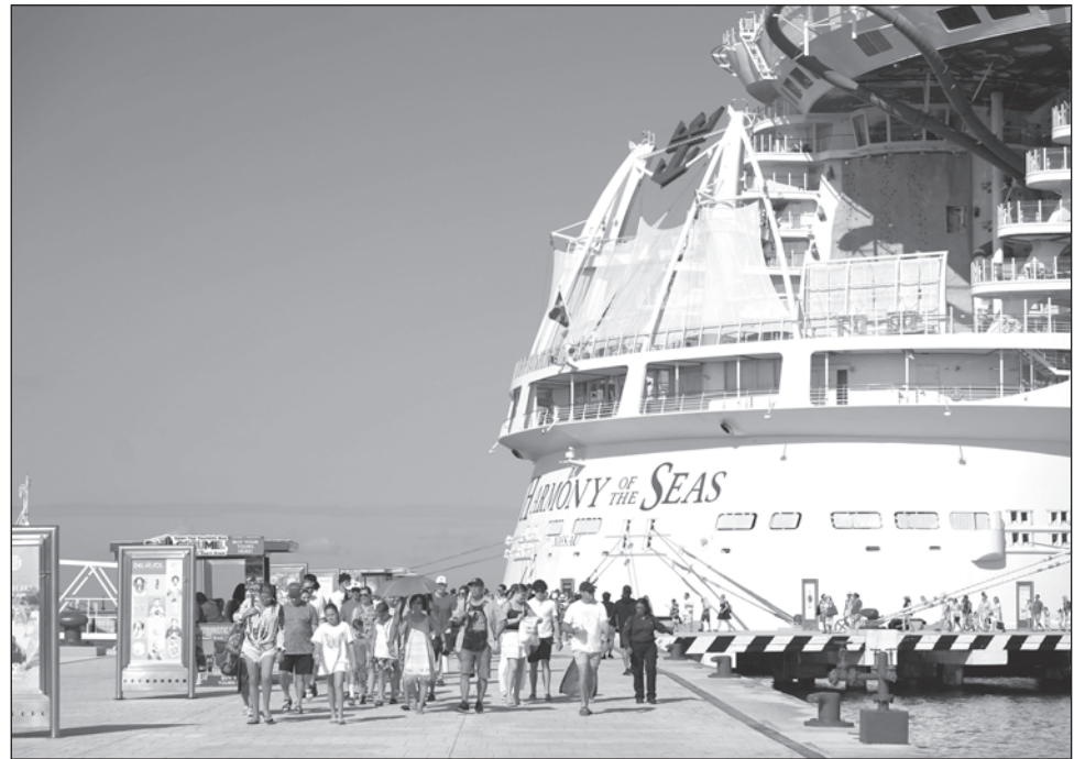
▲ La Amatur prevé que el arribo de visitantes durante invierno sea principalmente de Estados Unidos, Canadá, así como nacionales, ingleses y colombianos.

“Leí hace poquito que van a retirar 15 concesiones o que retiraron ya 15 concesiones, y que hay como 40 en lista; ojalá, porque lo único que han hecho con eso es afectar la imagen del destino, pues ha sido de impacto internacional el tema de la violencia de los taxistas, que le genera miedo a los turistas y si hay mucha gente que se pregunta si es seguro tomar un taxi o venir a Cancún por esa razón”, lamentó.