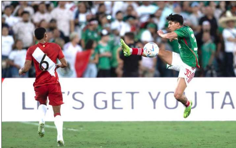
▲ El Tricolor, que tiene mucho que mejorar, choca hoy con Colombia en California.

Aquejados por diversas lesiones, Rogelio Funes Mori, Luis Romo, Jorge Sánchez, Raúl Jiménez y Héctor Herrera terminaron el domingo la concentración con la selección mexicana y regresaron a sus clubes para seguir rehabilitándose, informó la dirección de selecciones nacionales. Ninguno de los cinco pudo participar en la victoria ante Perú.