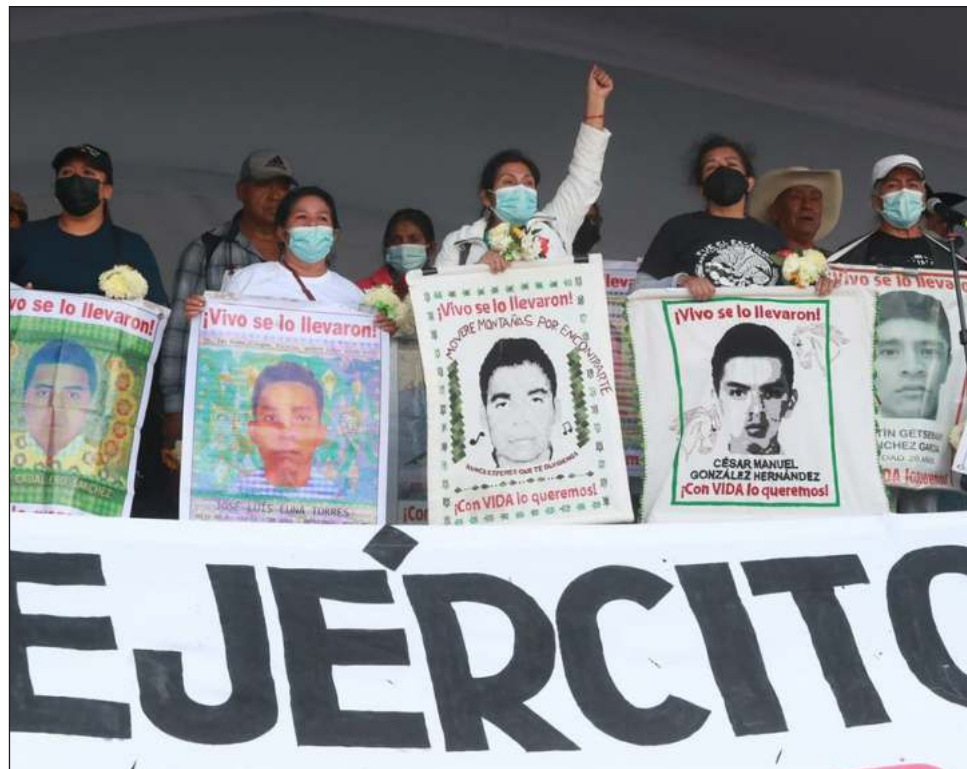
▲ Entre las consignas que portaron los manifestantes estaban: “¡Vivos los queremos!” y “¡Ayotzinapa vive!”; también unos jóvenes portaban dos féretros de cartón con la imagen del ex presidente Enrique Peña Nieto y el ex alcalde de Iguala, José Luis Abarca.

Además, a su paso por la calle de 5 Mayo un grupo de