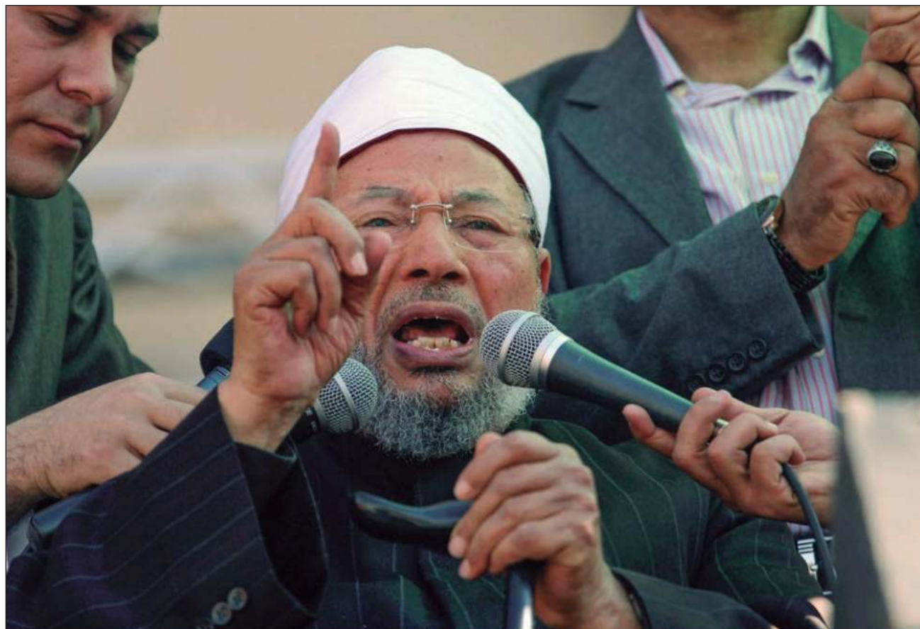
▲ Académicos más conservadores han criticado al clérigo egipcio por permitir que hombres y mujeres estudien juntos.

Después de la caída del régimen de Hosni Mubarak en Egipto tras las revueltas de 2011, Al Qaradawi apareció