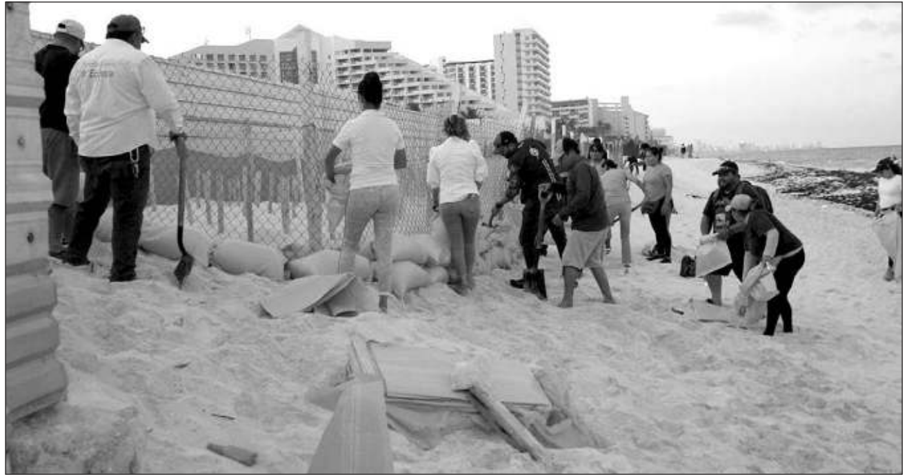
▲ Personal de la dirección de ecología municipal activó el plan de contingencia para la verificación de los 54 corrales de tortugas marinas y colocación de costales de arena al borde de ellos.

Exhortó a la gente a evitar compras de pánico, siempre atentos al desarrollo del meteoro, no hacer caso de rumores o noticias falsas y mantenerse informado solamente por los canales