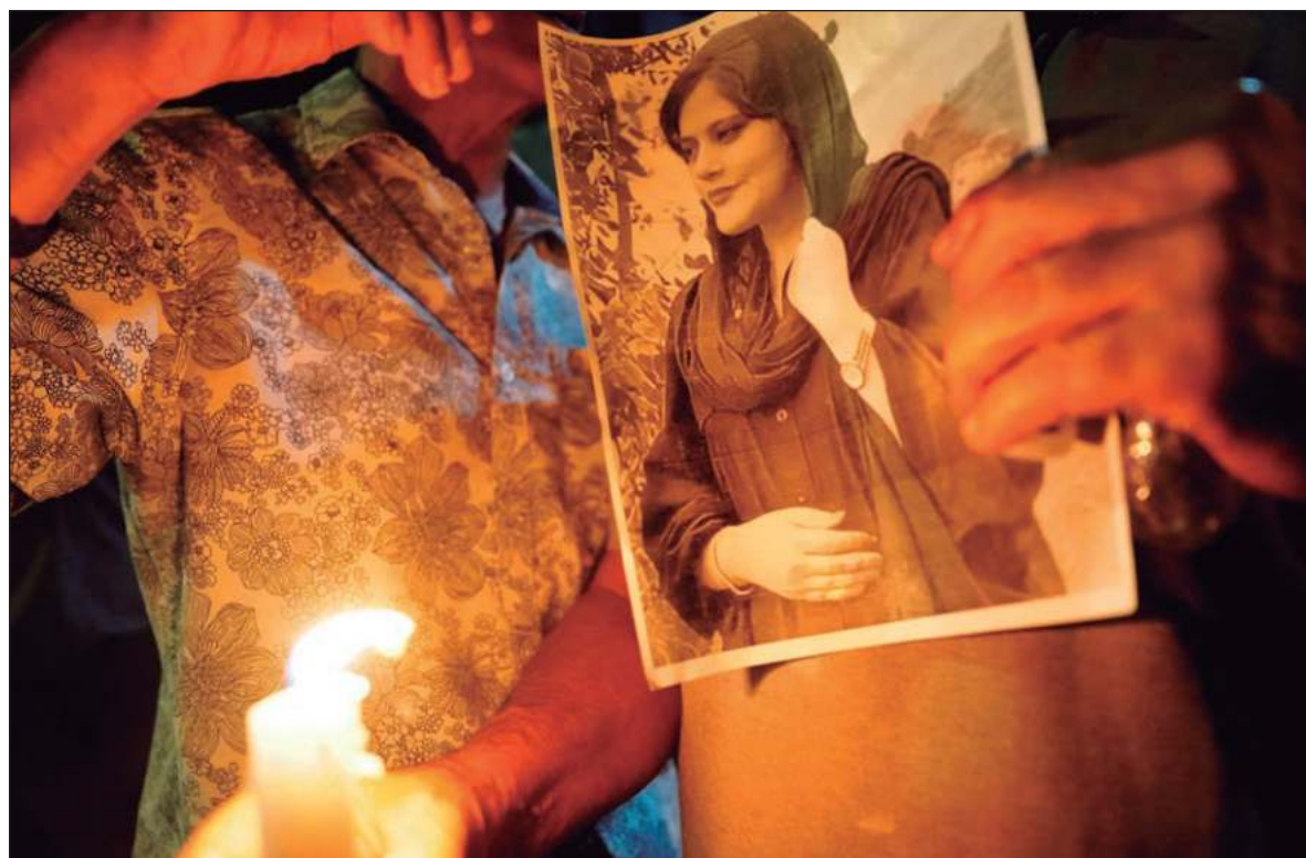
▲ "The murder of 22 year-old Maska Amini by moral police for simply wearing her hijab incorrectly has made the rallying point for opponents of the regime. There is again blood in the streets of Iran".

THE CURRENT REGIME of Ayatollah Khamenei is not as stable as followers would wish. In 2009, the regime witnessed a "Green Revolution" aimed against the