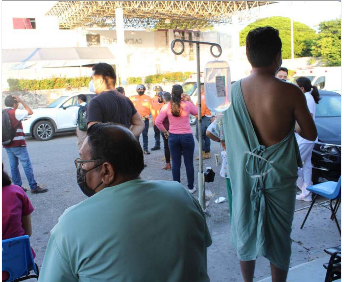
▲ Los testigos aseguraron que el corto circuito ocurrió en la cocina, generando el pánico en los empleados y causando la salida de administrativos, cuerpo médico y pacientes; señalan que a simple vista no hubo daños severos.

Los testigos señalan que a simple vista no hubo daños severos, pero harán lo señalado por los administradores.