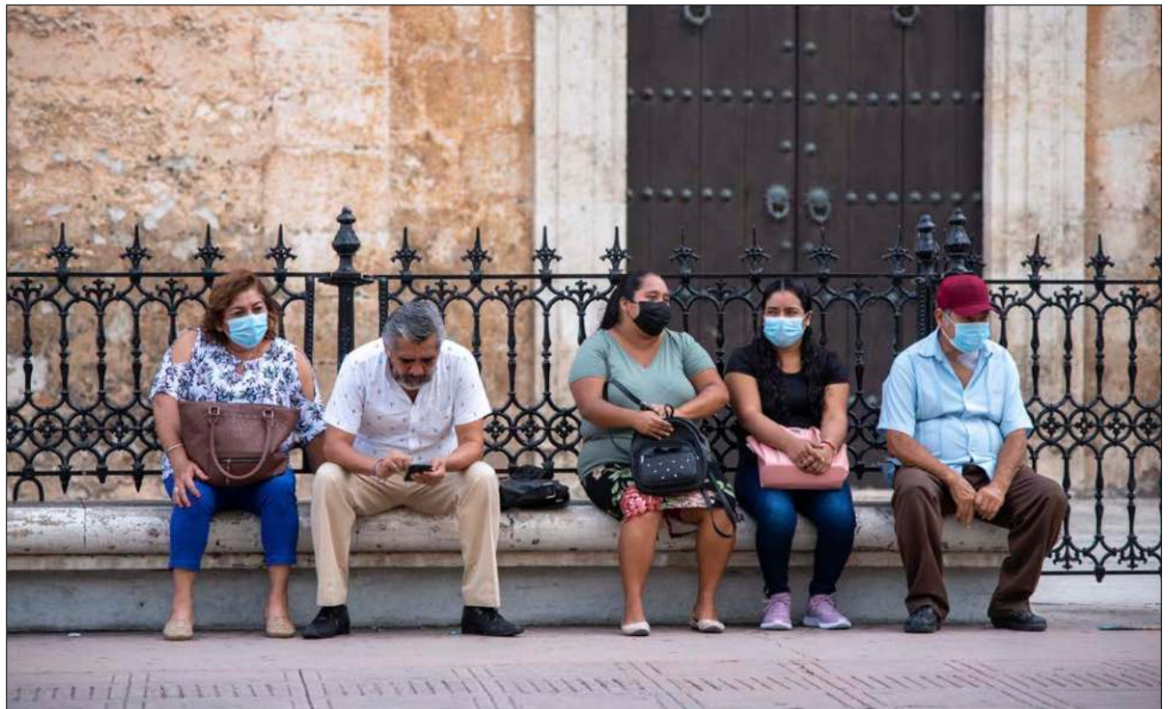
▲ En el primer día de uso voluntario del cubrebocas (portarlo es obligatorio únicamente en centros de salud y el transporte público), buena parte de los meridianos optó por

seguir empleando dicha prenda como protección contra el Covid-19. Algunas escuelas anunciaron que mantendrían la medida de utilizar la mascarilla.