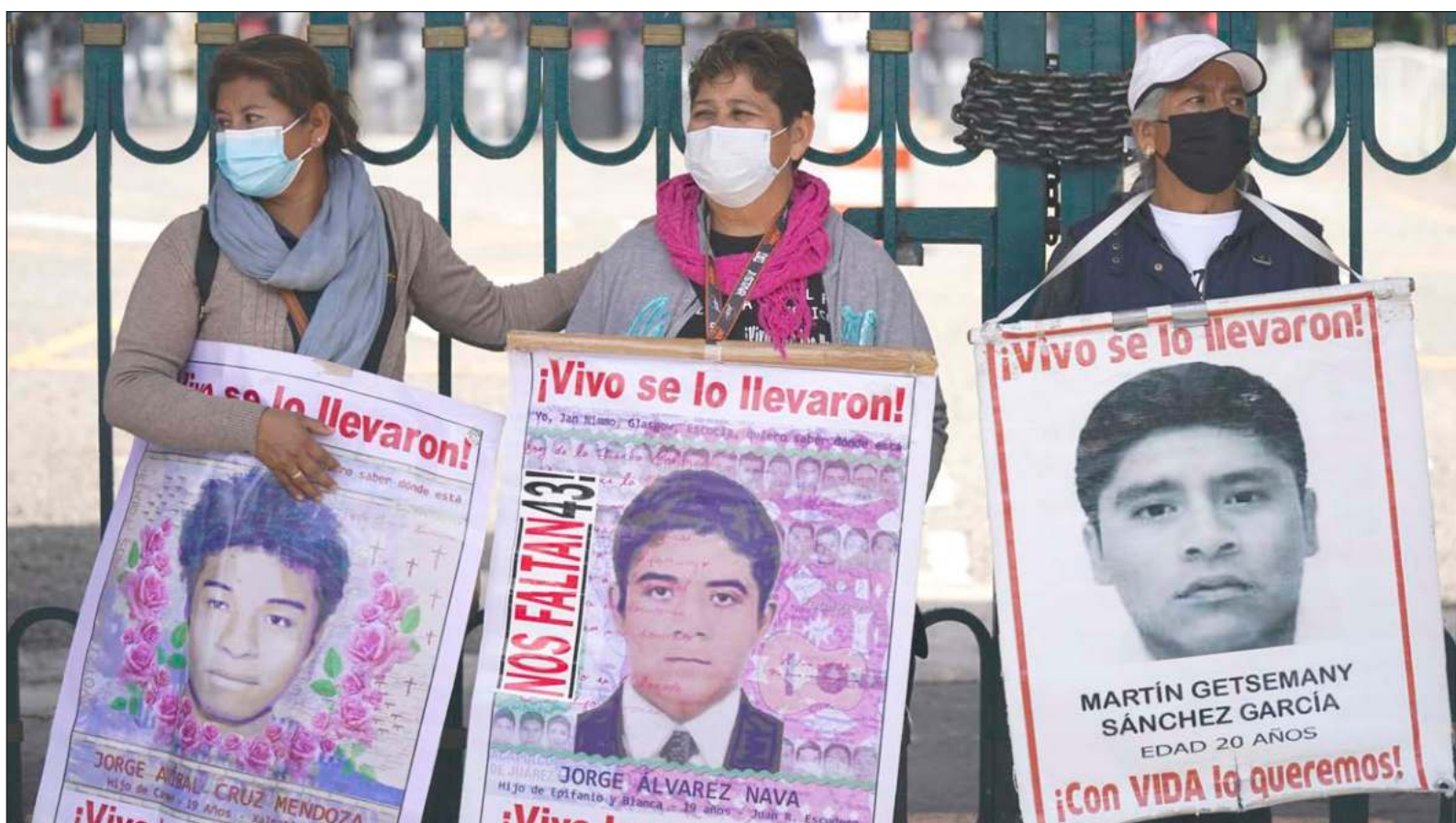
▲ "Lo primero que ha de preguntarse un periodista es si esa filtración favorece valores supremos, como en este caso la búsqueda de castigo a los perpetradores y cómplices de crímenes nefandos o si, por el contrario, se ayuda a romper y acaso dañar de manera definitiva esas expectativas justicieras".