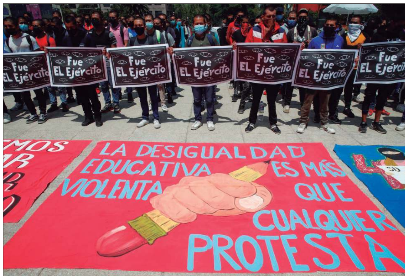
▲ Ante la falta de esclarecimiento de lo sucedido y para continuar los avances hasta ahora alcanzados, el Estado mexicano debe garantizar la independencia de la UEILCA, que parece haber sido desplazada de los trabajos ministeriales.

Sobre la UEILCA, indicó que ha recibido información preocupante indicando que esta unidad “estaría siendo objeto de desplazamiento en sus funciones ministeriales en el presente asunto. Al respecto, ha tomado conocimiento sobre la judicialización de carpetas de investigación relacionadas con los hechos del caso por parte de otras unidades