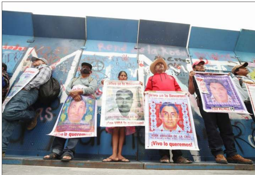
▲ Según indicó el presidente López Obrador, los padres de los estudiantes desaparecidos le plantearon la posible invalidez del proceso judicial por filtraciones de información. Durante la conferencia matutina de este lunes les ofreció disculpas.

A pregunta expresa de que la FGR ha detenido estas órdenes de aprehensión López Obrador rechazó la versión y dijo que en realidad es que “no les gustó que se actuara y que ya estén en la cárcel personas presuntamente responsables como militares, autoridades locales, como el ex procurador Murillo Karam. ¿Cuándo se