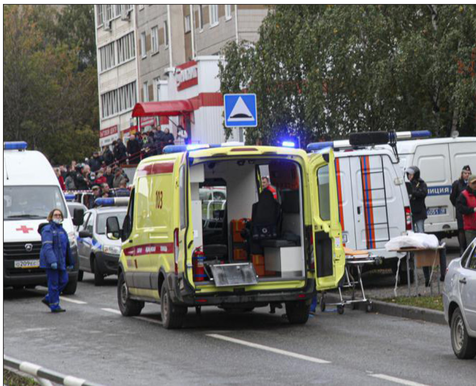
▲ El tirador, de 34 años, se había graduado de la misma escuela que atacó, empleando dos pistolas no letales adaptadas para disparar balas reales, indicó la Guardia Nacional.

Izhevsk, una ciudad de 640 mil personas, se encuentra al oeste de los montes Urales en el centro de Rusia.