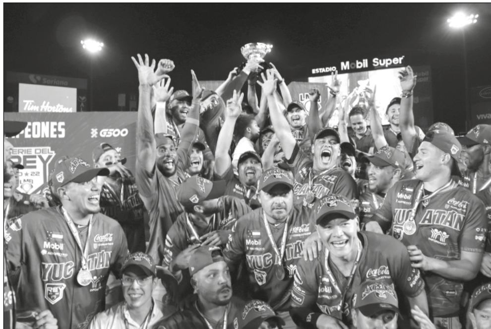
▲ Después de ser eliminados en serie final como visitantes en 1989, 2007, 2019 y 2021, los melenudos ganaron dos veces en Monterrey para conseguir su quinta estrella.

Dos movimientos durante los playoffs fueron claves para sacar adelante a los "reyes de la selva". Después de la baja de Starlin Castro, a quien casi no se le vio el talento que lo hizo estrella en Grandes Ligas, Ibarra retomó la