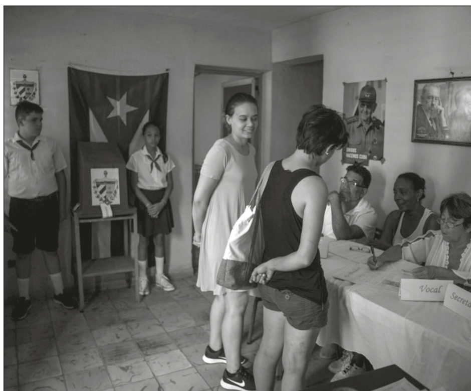
▲ El Código de las Familias cubano define el matrimonio como la unión “entre dos personas”, abriendo la puerta al casamiento homosexual y a la adopción para parejas del mismo sexo.

Uno de los principales retos que tienen los gobiernos será controlar el contrabando y garantizar la seguridad en la frontera, donde hay presencia de grupos armados ilegales como la guerrilla Ejército de Liberación Nacional, el Clan del Golfo y las disidencias de las extintas Fuerzas Armadas Revolucionarias de Colombia (FARC).