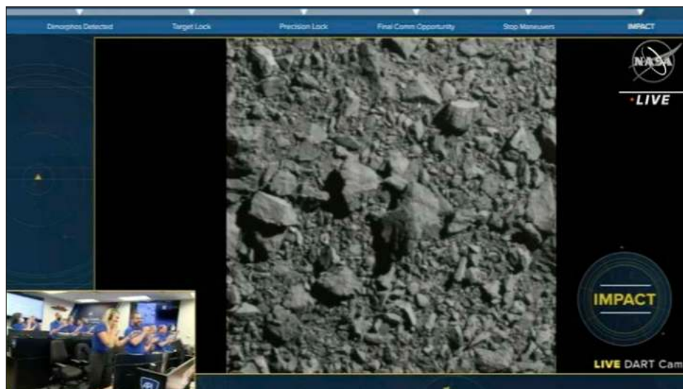
▲ El momento del impacto contra Dimorphos fue evidente, pues la última imagen se congeló. En tierra, los controladores de vuelo vitorearon y se abrazaron.

El objetivo del lunes: un asteroide de 160 metros lla-