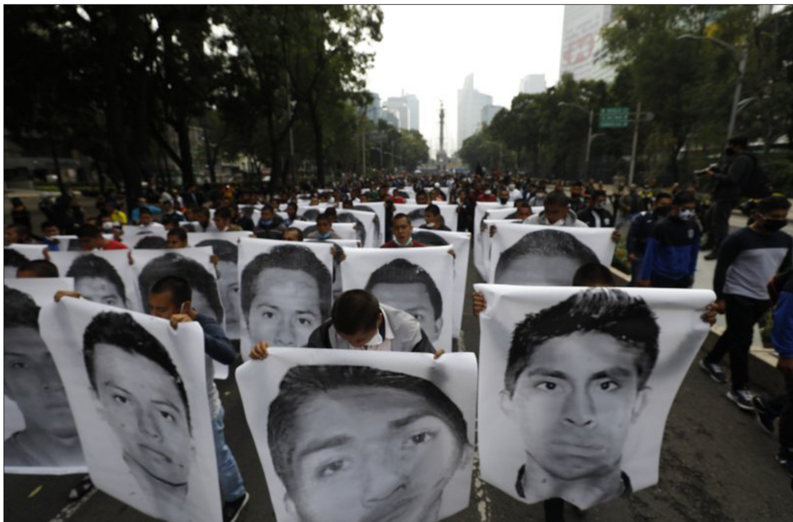
▲ La filtración "vuelve incansablemente a revelar la compleja complicidad entre autoridades, gobernantes, criminales y medios de comunicación, que actuando según sus intereses, encubriéndose y pervirtiendo los procesos de investigación, usan esta información para enturbiar los avances –pocos y lentos- que se han alcanzado".