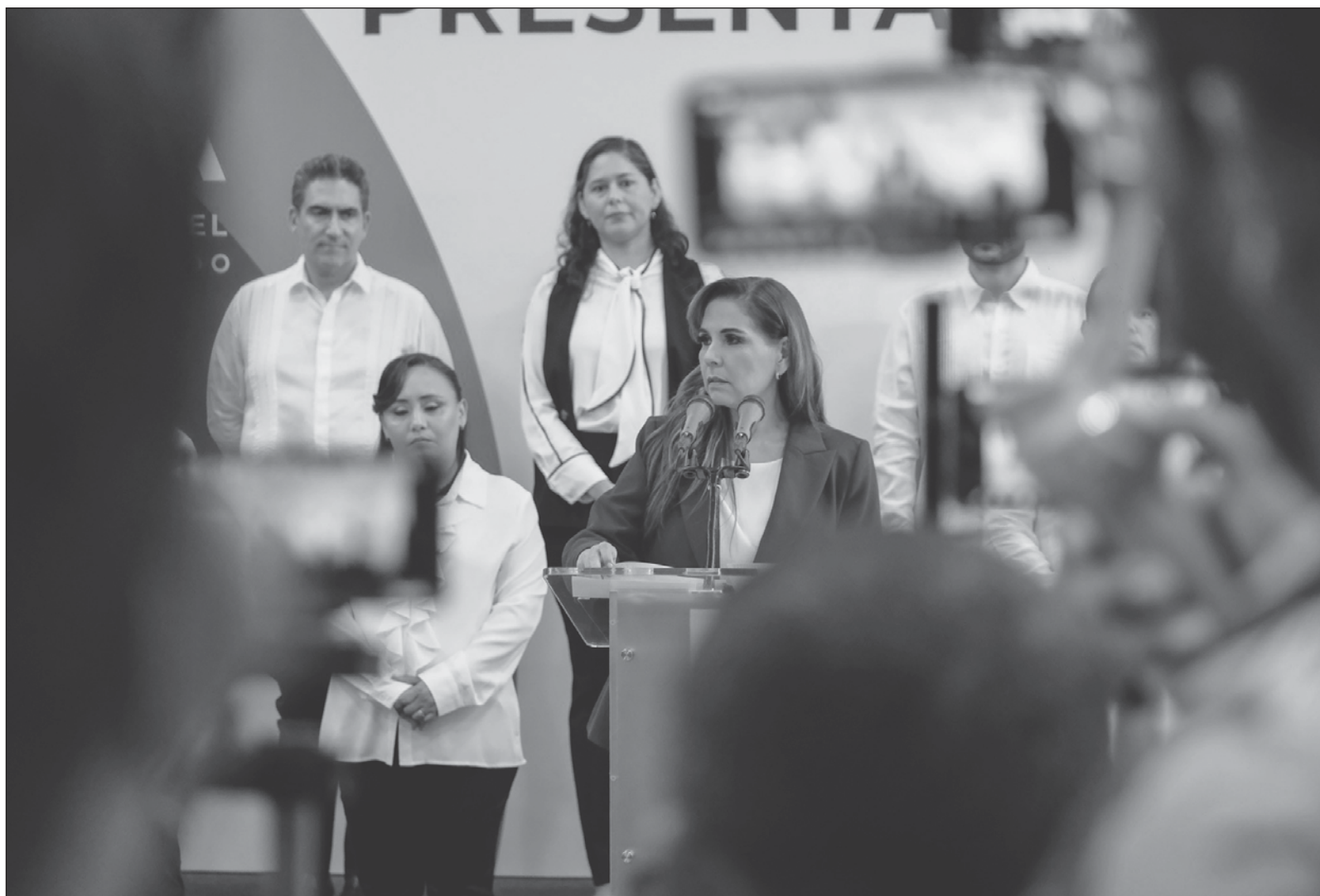
▲ En el gabinete de la nueva gobernadora Mara Lezama "hay balance de género, balance norte-sur, capital y experiencia política".