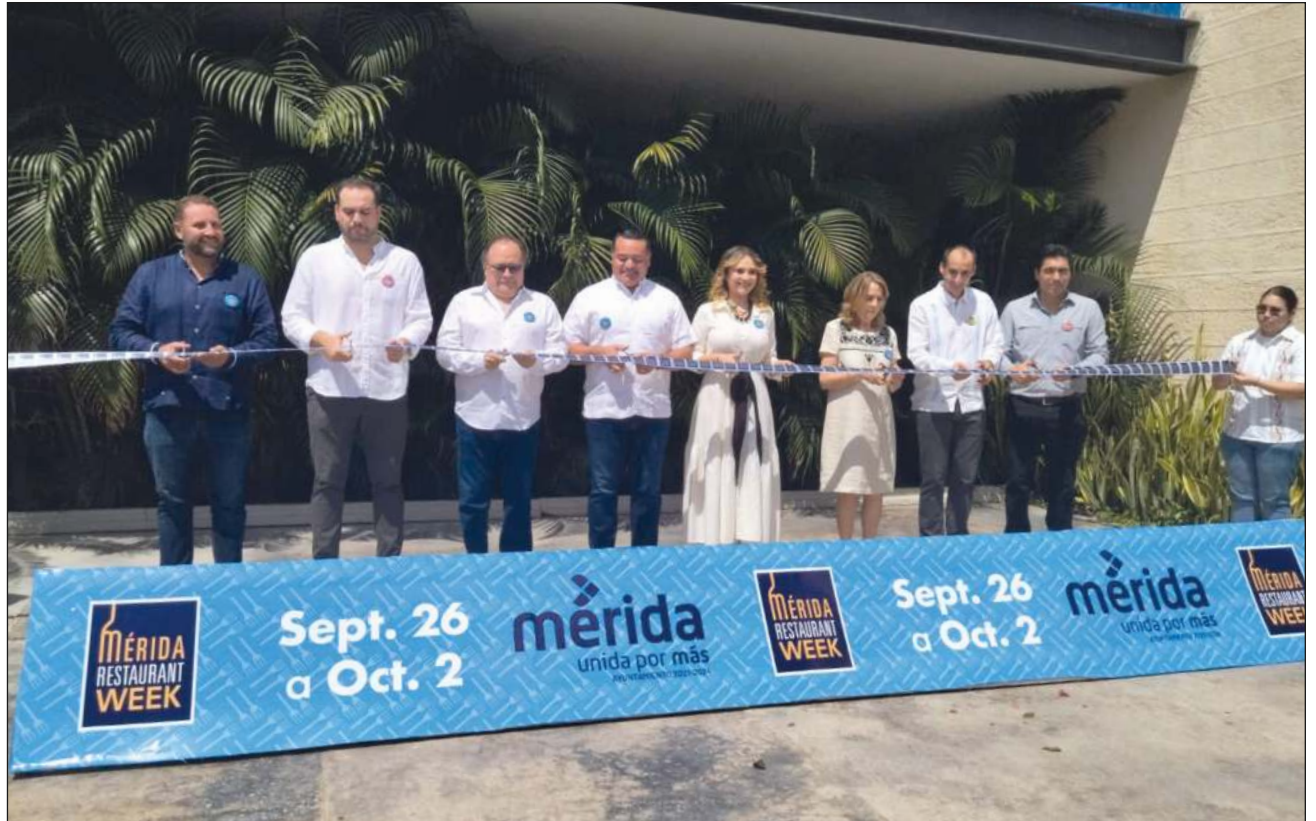
▲ Los restaurantes fueron de los sectores más golpeados por la pandemia; su recuperación está al 85%.

“Sabemos la cantidad de dinero que significa para miles de familias”, destacó.