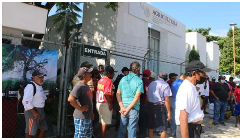
▲ Unos 30 pescadores ribereños se quejaron porque han sufrido robos de motores fuera de borda y alegan que las autoridades no les informan de avances en las investigaciones.

Sin embargo, al no encontrarse los encargados de la Comisión, decidieron tomar las oficinas de la Sader, que están en el mismo complejo, exigiendo que alguien los atendiera “como es debido” pues la depredación