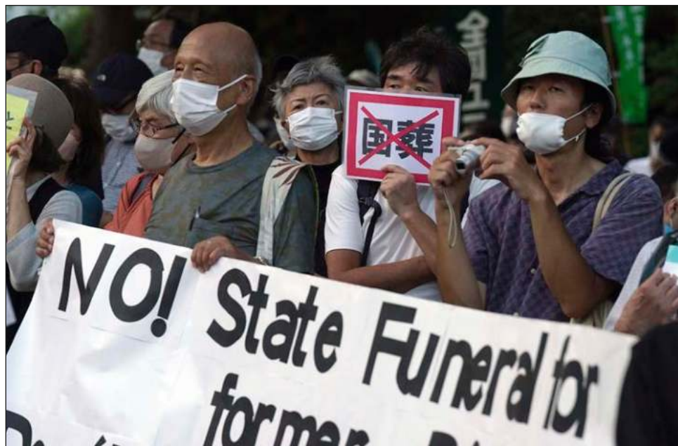
▲ Los críticos de la ceremonia fúnebre rechazan el desembolso público anunciado y el hecho de ensalzar a la polarizante figura del ex primer ministro, Shinzo Abe.

Aunque las inmediaciones del Nippon Budokan serán inaccesibles para cualquier persona que no se encuentre entre los invitados o el personal acreditado, se instalará un área de ofrenda de flores para