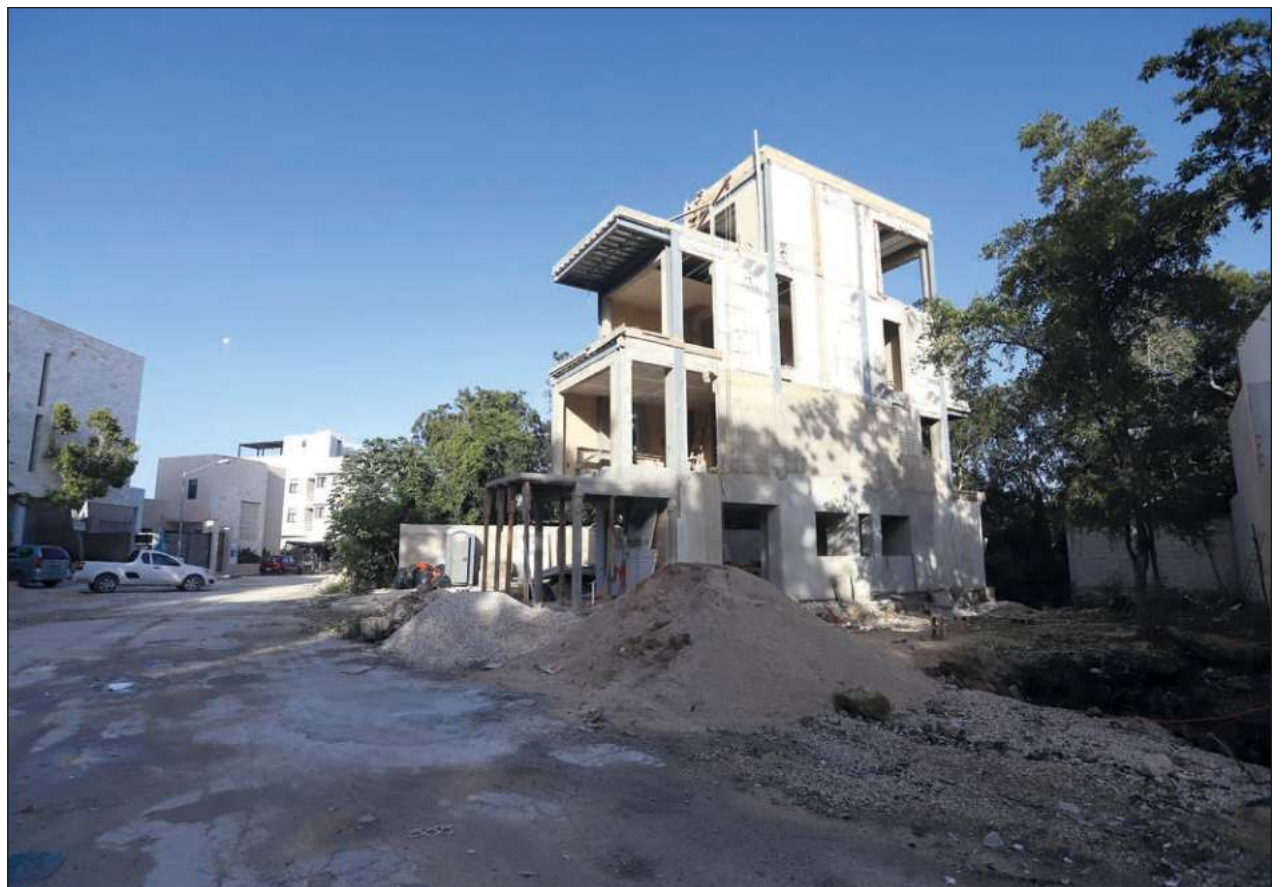
▲ La Asociación Mexicana de Profesionales Inmobiliarios trabajará de forma coordinada con el nuevo gobierno estatal, encabezado por Mara Lezama, para que el crecimiento del noveno municipio sea sustentable.

Hizo referencia a los proyectos grandes como el Aeropuerto Internacional de Tulum y el Tren Maya, que obligan a las autoridades y al sector inmobiliario a que los inversores sepan que hay un ordenamiento que tiene que cumplir para hacer inversiones que vayan acorde con las normas municipales, estatales y federales.