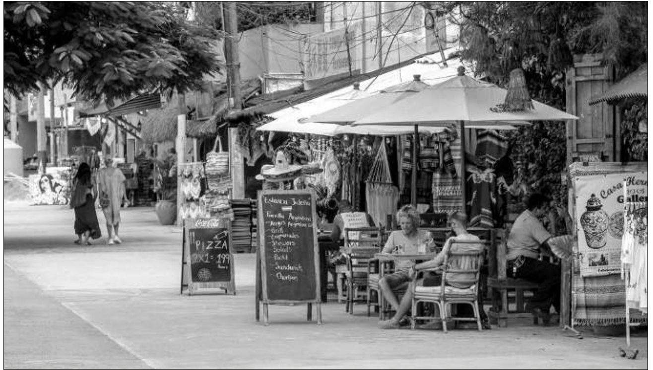
▲ El acuerdo logrado entre hoteleros, restauranteros y el ayuntamiento de Tulum incluye el cierre de los establecimientos dedicados a la venta de alcohol, que ahora es a la medianoche, y cuidar el nivel de los decibeles.

El acuerdo incluye el cierre de los establecimientos dedicados a la venta de alcohol, que ahora es a la media-