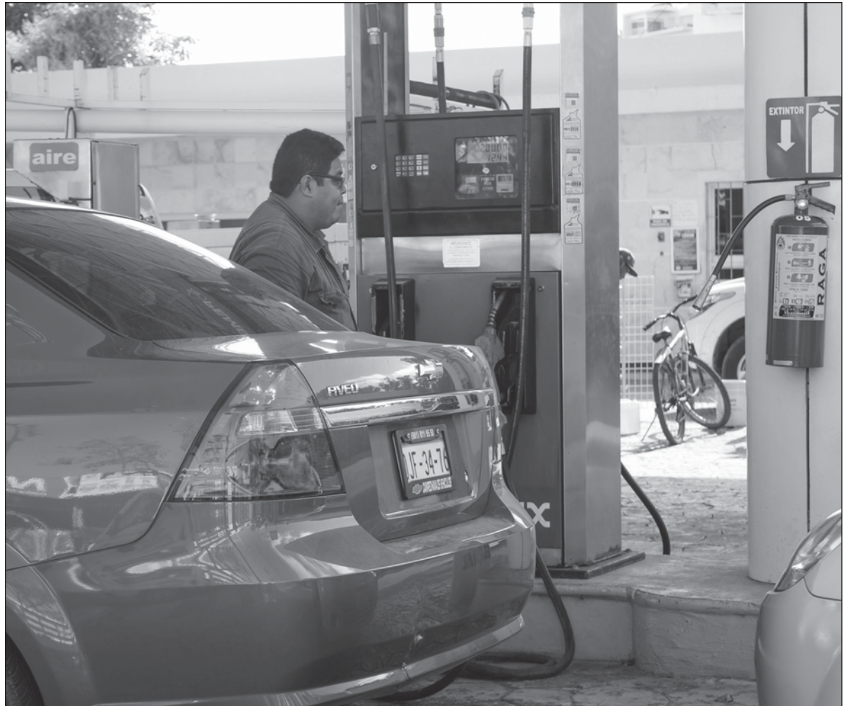
▲ El precio de la gasolina, al público, es de alrededor de 21 pesos en toda la república.

EL INSTRUMENTO A 91 días subió 12 puntos base a 9.49 por ciento (su mayor nivel desde