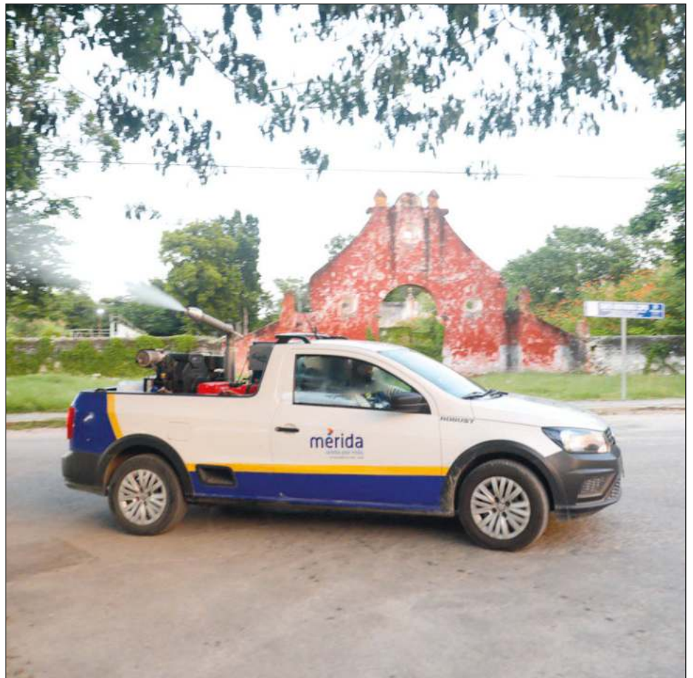
▲ Meyajo'ob ti'al u chan xu'ulsa'al le chi'ibal ba'alo'oba' táan u mu'uk'ankúusa'al le te'e múuch'kajtalo'obo' ti'al ma' u tsa'ayal k'oja'ano'ob ti' máak. Oochel Ayuntamiento de Mérida

Te'e k'iino'oba' máana', beeta'ab meyajo'ob tu múuch'kajtalilo'ob Chablekal, Sitpach, Santa María Chí, Yaxché, San Pedro Cholul, Floresta, Salvia, Tixcuytún, tu sooloojikosil Animaya yéetel Centenario, tu k'íiwikilo'ob Deportes Extremos, CEMCA, Juan B. Sosa, Loma Bonita, Chuburná, Bugambillas, San Pedro Uxmal, Lindavista, Dzityá, ichil uláak'o'ob.