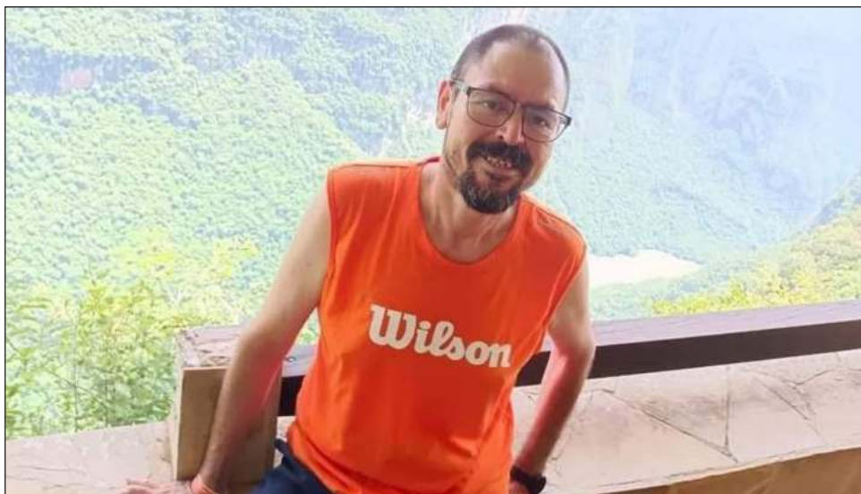
▲ Article 19 da seguimiento al caso del director de la página Chiapas denuncia ya .