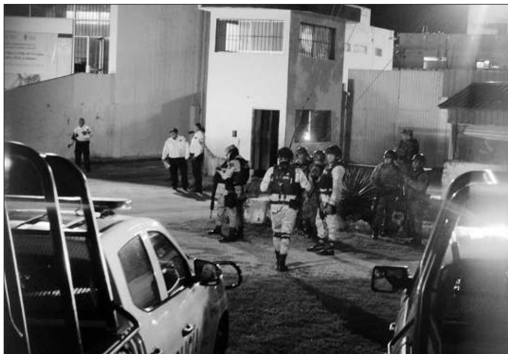
▲ Lo que ha caracterizado al tema Kobén es la ausencia de información provocada por la politización del asunto (...) existe la consigna de que lo que ocurra en el Cereso se queda en el Cereso.

Lo que ha dejado de manifiesto la situación del Cereso de San Francisco Kobén es que, en lo referente a la seguridad de los campechanos, quedan pendientes muchas deudas de información, pero sobre todo ha quedado patente que los funcionarios a cargo de ella han sido más reactivos que propositivos; en un área tan sensible, la planeación es fundamental. La misma entidad es ejemplo de que la seguridad puede perderse en muy poco tiempo por confiar en que se puede tener a los policías con equipo táctico deteriorado, o con una preparación mínima, y que aún así no habrá avance de la delincuencia en la entidad. Hemos visto que, todo lo contrario, si se descuida a los policías y deja de brindarse información pronta y confiable, el tejido social se descompone rápidamente.