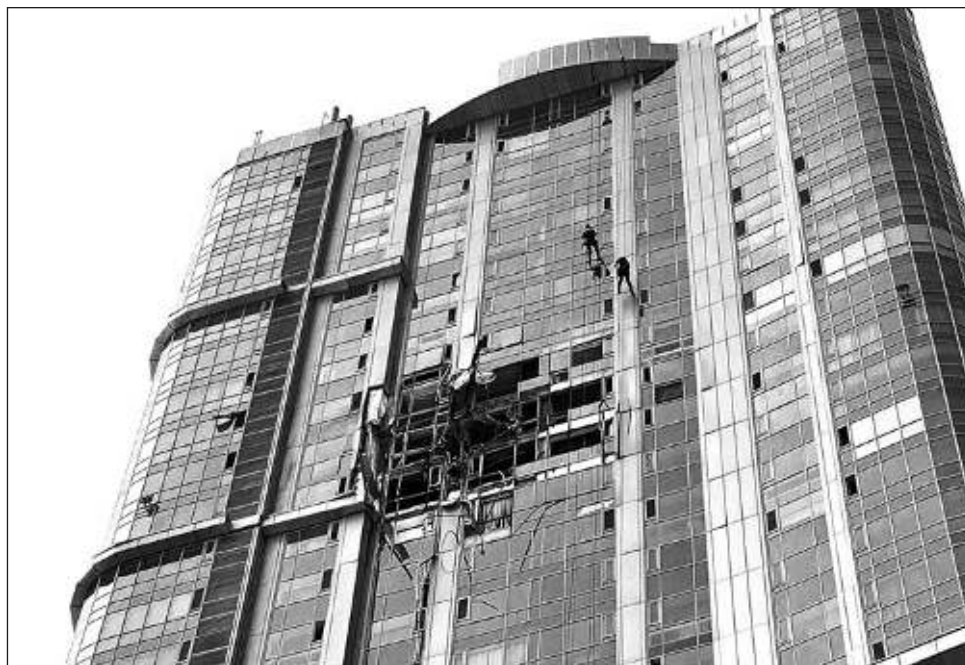
▲ Las autoridades ucranianas afirman que Rusia apuntó contra 15 regiones, en la mayor campaña de bombardeos realizada en semanas, en la que se utilizaron más de 100 misiles.

El Ministerio ruso de Defensa indicó que llevó a cabo un “bombardeo masivo” contra instalaciones energéticas necesarias para el “funcionamiento del com-