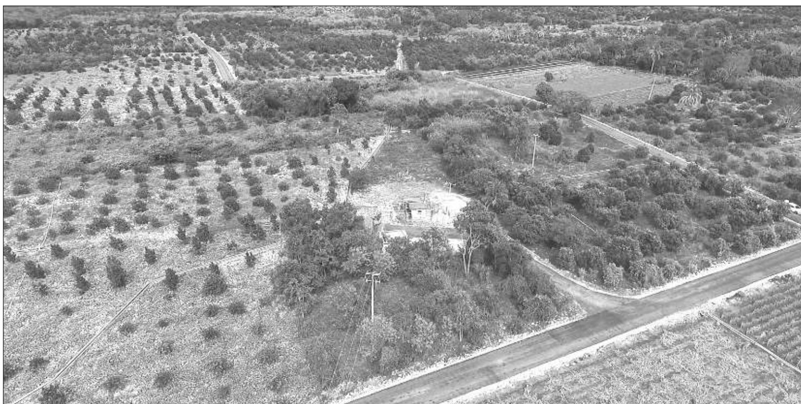
▲ "El anuario estadístico de la FAO, 2022, muestra que la producción de cultivos llamados primarios, de los cuales cuatro representan 50%, incrementaron su producción en 52% de 2000 a 2020; en el mismo periodo la producción de carne aumentó 42%, alcanzando 337 millones de toneladas. Impresionante".