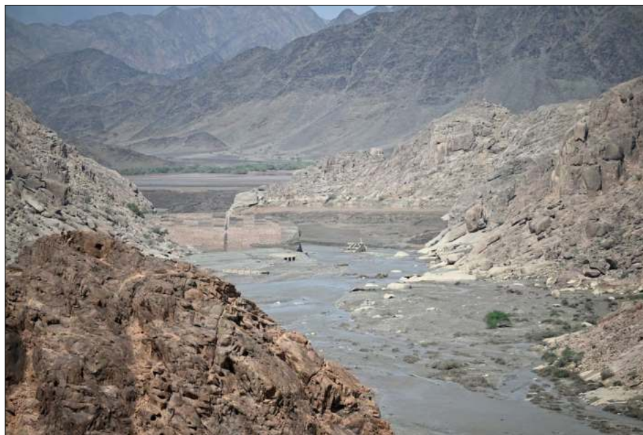
▲ Al menos cuatro personas murieron en la inundación que siguió al desplome de la presa, pero aún no hay una cifra aproximada del número de desaparecidos.

El sitio noticioso sudanés Medameek reportó que había más de 100 personas desaparecidas, y que muchos otros pobladores ha-