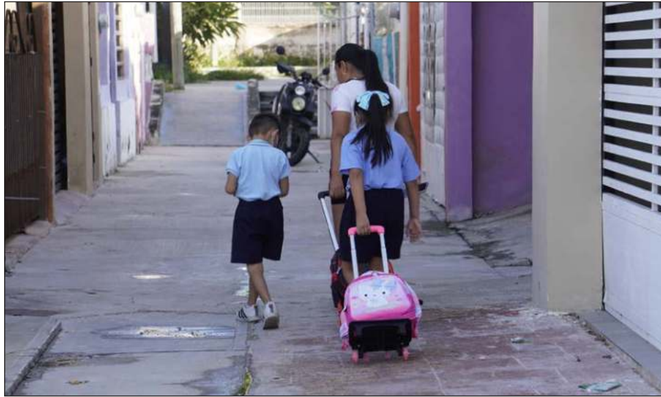
▲ Cerca del 25 por ciento del total de los estudiantes que iniciaron cursos son de nuevo ingreso; en las escuelas públicas entregaron libros y uniformes.

En este primer día a las escuelas públicas del es-