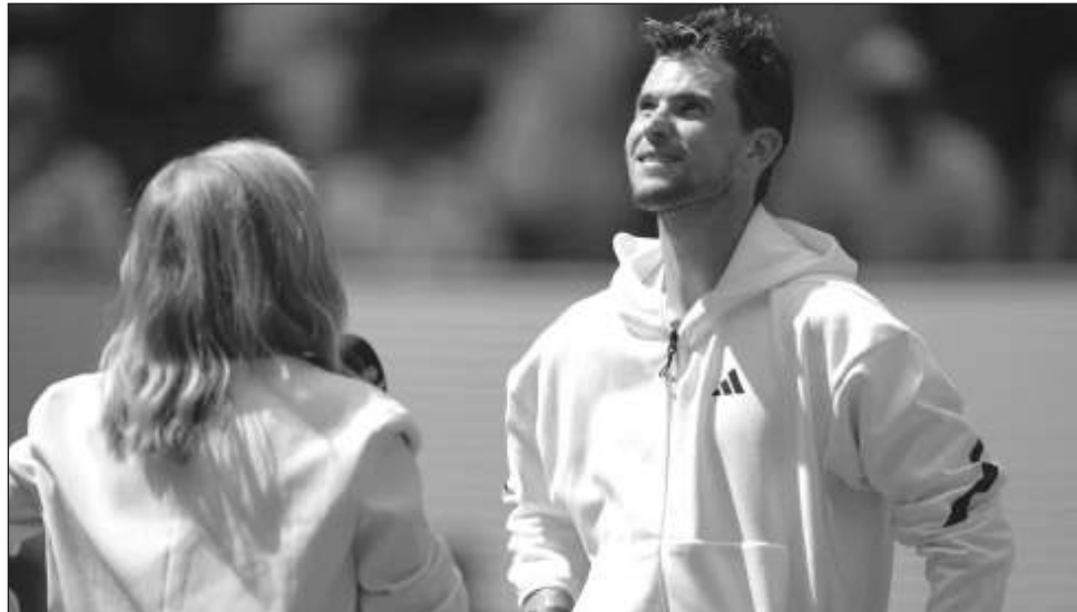
▲ Dominic Thiem observa un video con sus mejores jugadas en partidos del Abierto de EU, tras disputar su último duelo en el torneo. El austriaco llegó a ser uno de los tenistas más destacados del mundo.

En la jornada de apertura del último "Grand