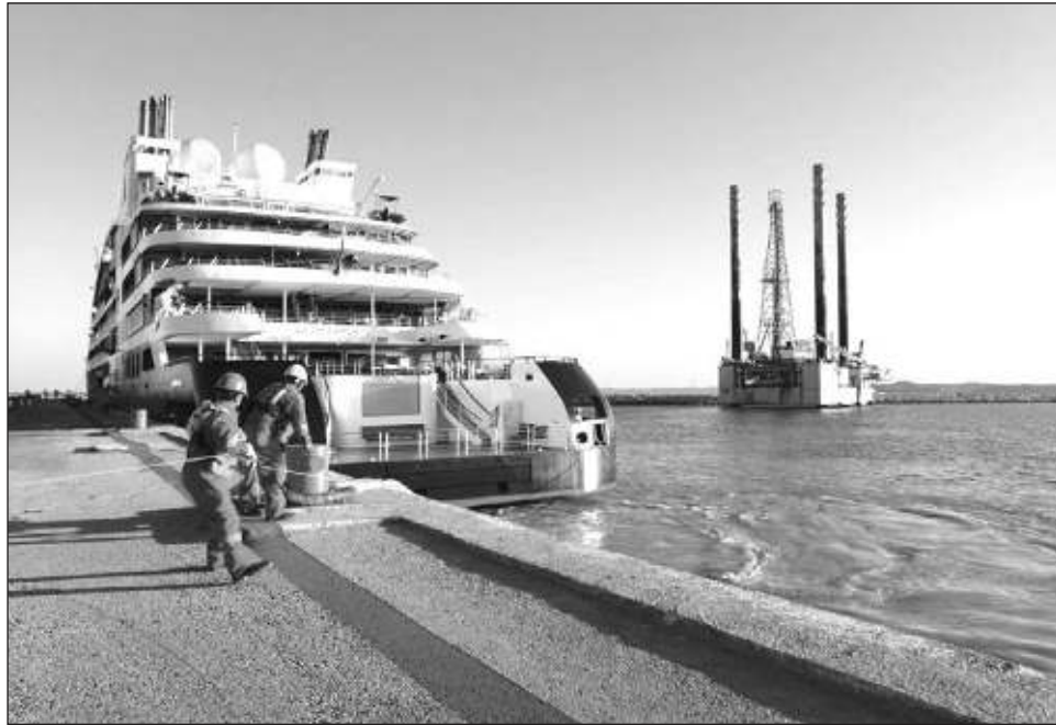
▲ Seybaplaya ofrece ventajas para que las empresas chinas establezcan operaciones en México, beneficiándose del acceso directo a mercados internacionales claves en la región.

Los invitó a establecer centros de distribución y bases operativas, aprovechando que actualmente el puerto es nodo logístico ideal, alineado con obras