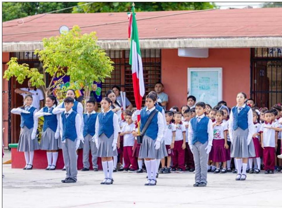
▲ Cerca de 14 mil estudiantes de nivel básico reactivaron actividades.

"Quiero que sepan que cuentan con todo nuestro apoyo. Estamos comprometidos en crear un ambiente seguro y de calidad para que puedan desarrollarse plenamente. Las puertas de nuestras escuelas están abiertas para ustedes, y también nuestros corazones. Estudien con dedicación, respe-