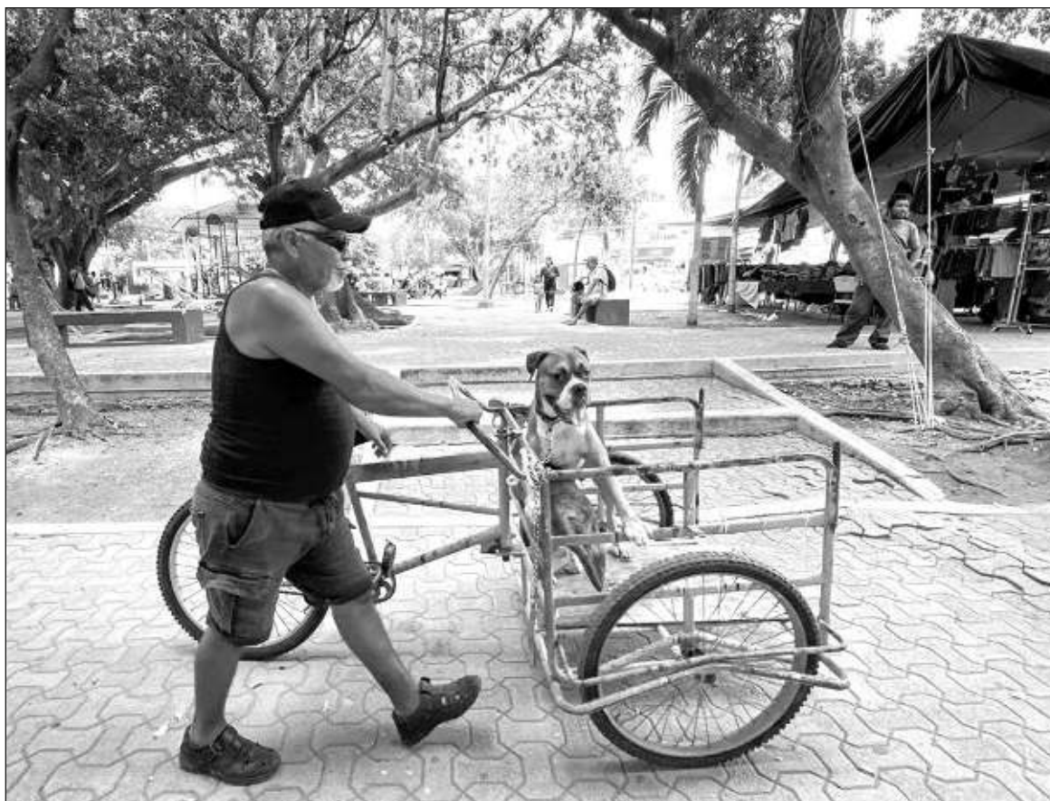
▲ “Compañía del solitario, júbilo de la familia, perros y gatos dejaron de ser mascotas para fungir como hijos sustitutos, todo lo adoptivos que se quiera, pero bien metidos en nuestros corazones en la zona reservada a la ternura. En términos sentimentales, la dependencia es mutua”.

Pasear al perro con correa se ha vuelto un ritual diario y masivo en México. Y el mundo. Con ello, la costumbre conmovedora