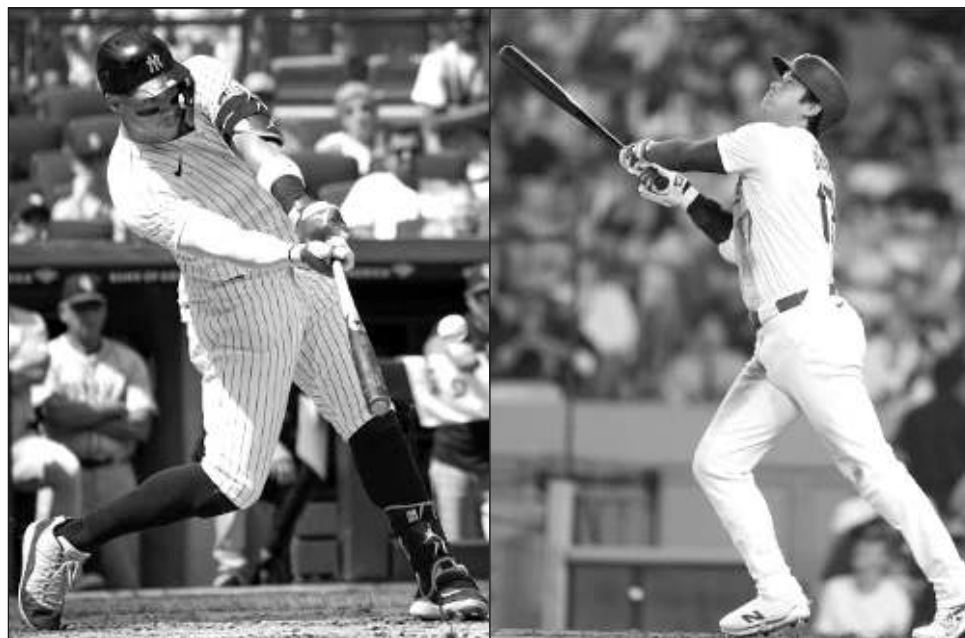
▲ Los Yanquis de Judge (izquierda) podrían enfrentarse a los Dodgers de Ohtani en la Serie Mundial.

Acá otros datos que resaltan cuán histórico es lo que Judge, nombrado el Jugador