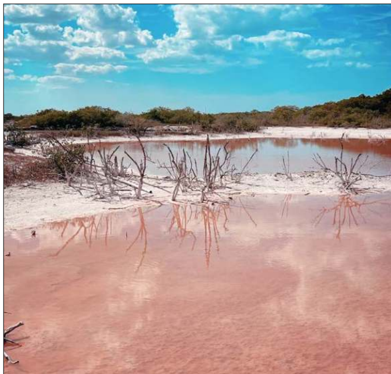
▲ "Las que nos tocan aquí cerca como las ya mencionadas Coloradas o las de Xtampú, ubicadas entre Telchac y Dzemul y que coinciden con el asentamiento arqueológico de Xcambó". En la imagen, salinas de Xtampú, Yucatán.

PERO QUÉ CREEN, la sal no solo estuvo vinculada a la economía y a los asentamientos. También tiene un protagónico dentro de la magia, la hechicería, la pre-