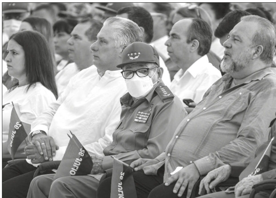
▲ Miguel Díaz-Canel encabezó el acto por el 69 aniversario de la toma de los cuarteles Moncada y Carlos Manuel de Céspedes, donde se encontraba también el expresidente Raúl Castro.

Este es el primer mitin presencial para recordar la fecha en dos años, luego de que la pandemia de Covid-19 paralizara a la isla y que en combinación un incremento de sanciones de Estados Unidos ocasionara una fuerte crisis con escasez de alimentos y medicinas, largas colas para obtener cualquier producto y un récord de migración de sus ciudadanos. El acto coincide también con un momento de tensión entre la población, crispada por apagones de horas --la luz suele usarse como elemento de cocción de alimentos en muchos hogares-- que hacen la vida difícil en medio del tórrido verano.