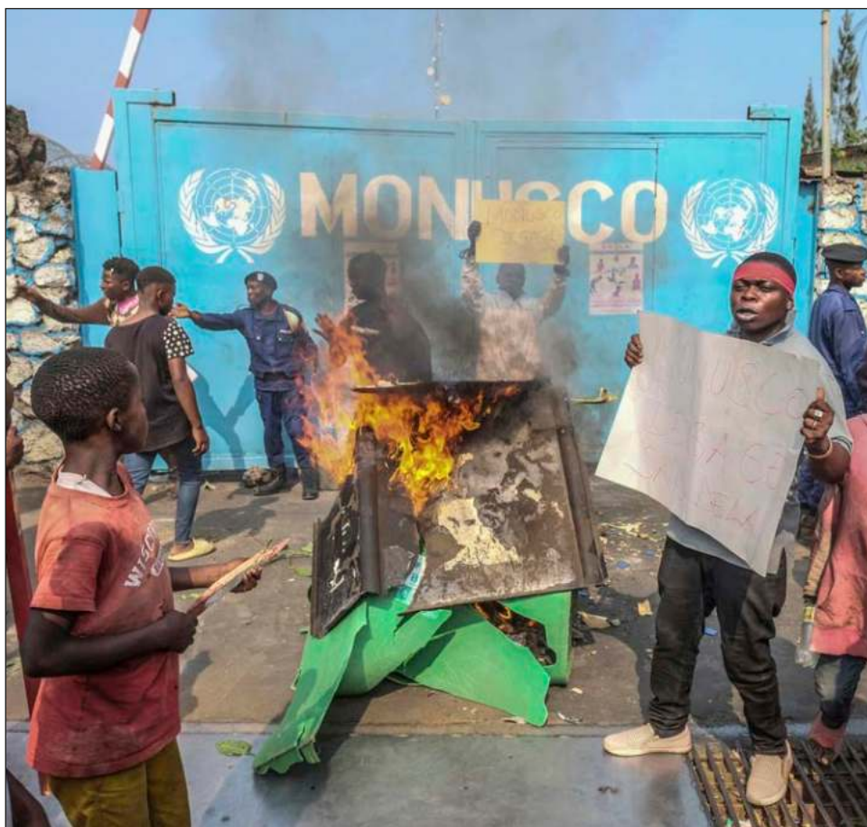
▲ La organización confirmó que tres de las víctimas eran miembros de Monusco.

Las protestas ocurren en momentos en que han aumentado los combates entre las tropas congoleñas y los rebeldes de M23, que han desplazado a casi 200 mil personas.