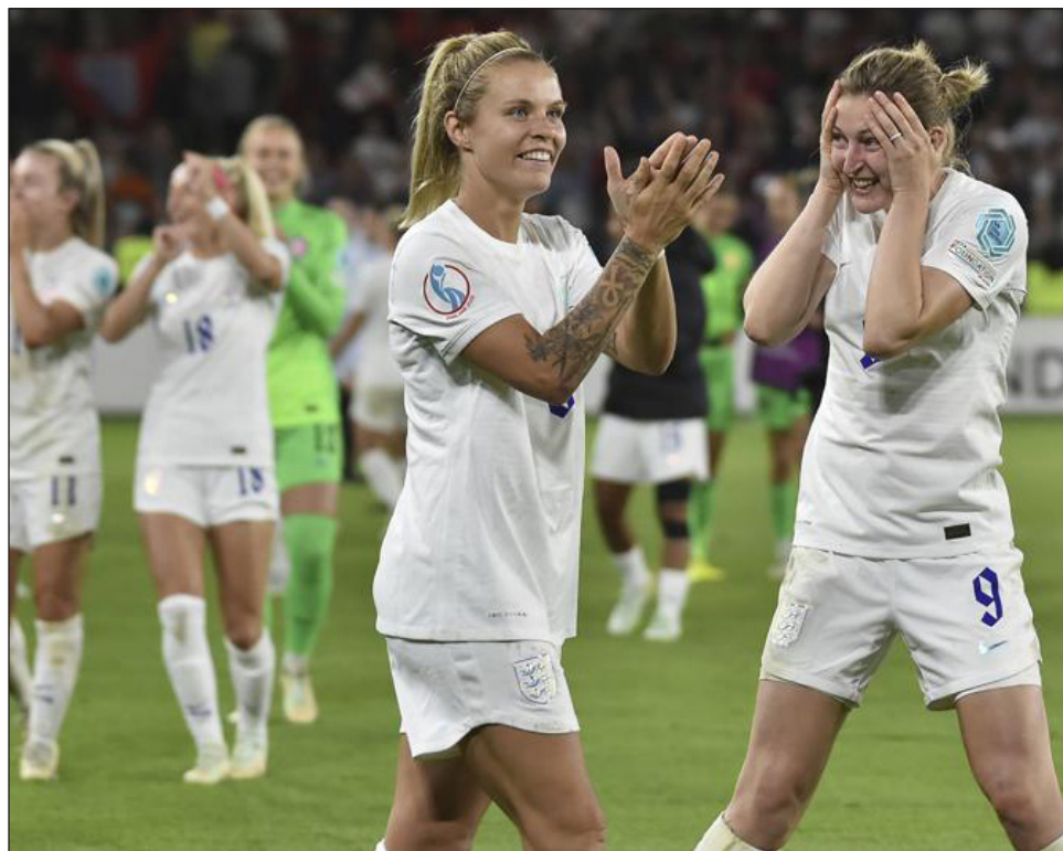
▲ Leah Williamson (centro) y Ellen White festejan el triunfo de la selección inglesa ante Suecia en las semifinales de la Eurocopa. Alemania y Francia definirán hoy al otro finalista.

El United hizo la presentación de Christian Eriksen como uno de sus fichajes para la próxima temporada. El enganche firmó como