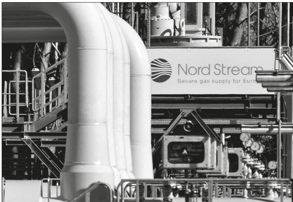
▲ El lunes, el gigante energético ruso Gazprom dijo que limitaría los suministros a la Unión Europea a través del gasoducto Nord Stream 1 a 20 por ciento de su capacidad.

El principal objetivo de los rusos ha sido la captura de Bakhmut."