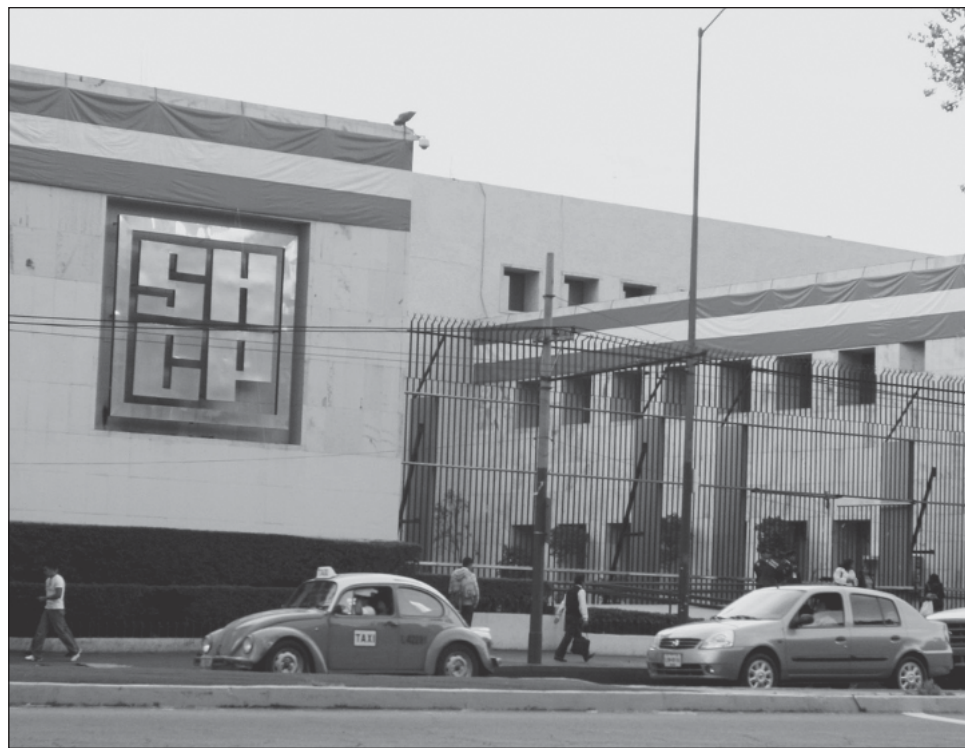
▲ La SHCP indicó que la empresa Bravo Solution asumió la falla.

Hacienda explicó que el 15 de julio la plataforma presentó fallas, debido a una falla en el espacio de almacenamiento, que no se pudo solucionar en breve porque