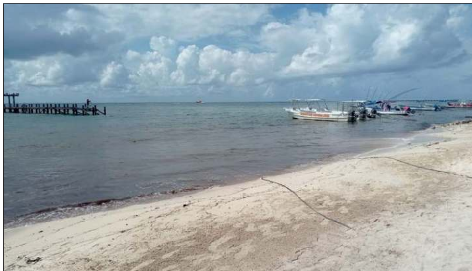
▲ Un ejemplo de la tregua brindada por el sargazo es El Recodo, en Playa del Carmen; aunque el agua no ha recuperado su claridad natural, se mantienen las labores de limpieza.