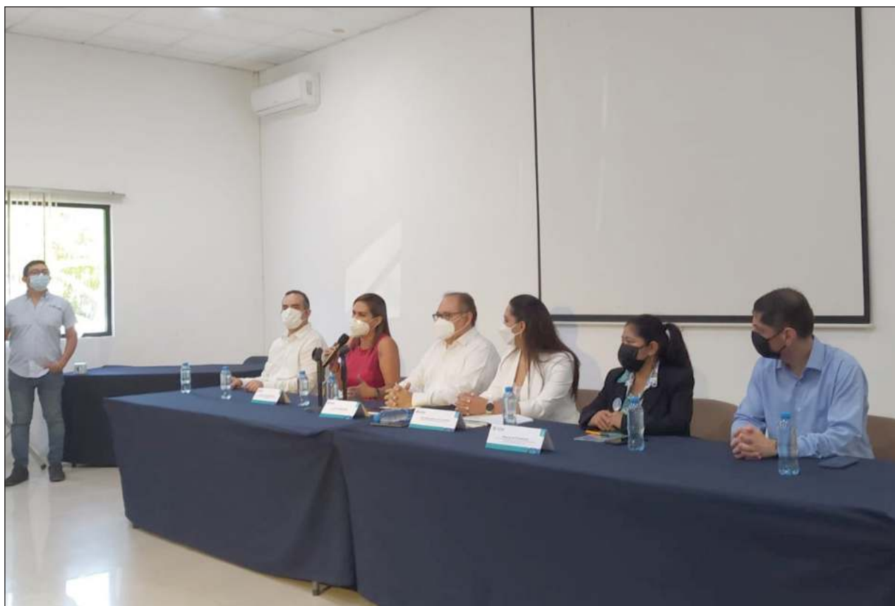
▲ En el país hay 50 mil personas trabajadoras del hogar, reveló la Dirección de Incorporación y Recaudación.