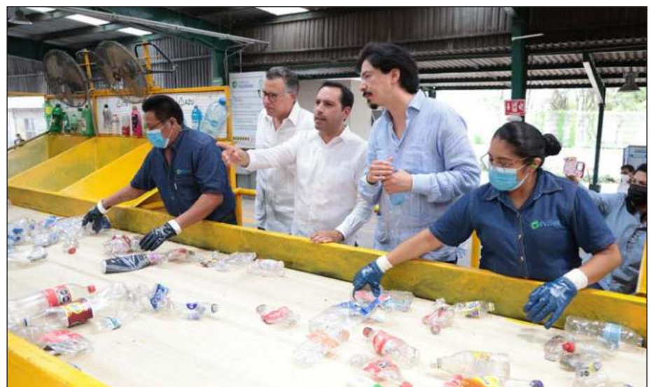
▲ El gobernador Mauricio Vila Dosal, junto con los miembros del presidium, realizaron la develación de la placa y un recorrido por la planta de acopio.

empresas." Posteriormente, el mandatario junto con los miembros del presidium, realizaron la develación de la placa y un recorrido por la planta de acopio.