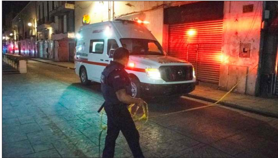
▲ Durante 2021 se registraron 50 homicidios por cada 100 mil hombres, mientras que para mujeres a estadística se mantuvo en seis crímenes por cada 100 mil femeninas.

De acuerdo con los datos preliminares, a nivel nacional y por entidad federativa, de los homicidios registrados en el país durante 2021,