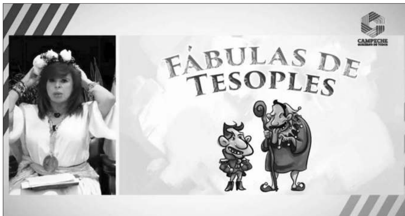
▲ La trama de las "fábulas" gira en torno al personaje denominado El Brother, que alude al presidente del PRI, quien por su soberbia lastimó a su pueblo, hasta que resulta vencido en la pelea en la que se enfrasca con el Jaguar nacido del pueblo.