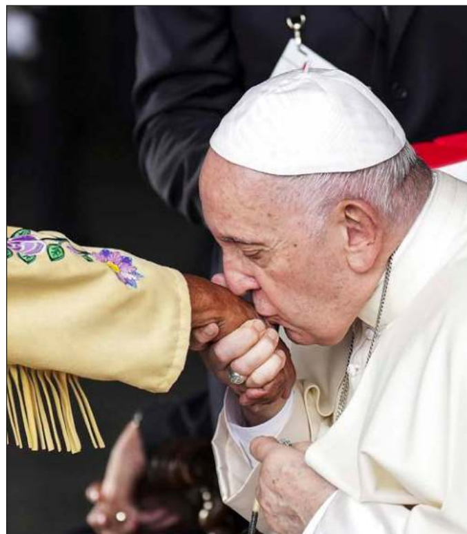
▲ El pasado sólo puede dejarse atrás cuando se reconocen los crímenes perpetrados y se muestra una voluntad de reparar los daños.

Presionado por estas revelaciones, en abril Francisco recibió en el Vaticano a una delegación de los pueblos indígenas, les expresó su “indignación y vergüenza” ante los hechos, y