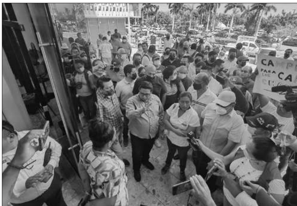
▲ Transportistas del estado consideran necesaria su participación en mesas de trabajo para explicar los problemas del sector y que la reforma ayude a mejorar sus espacios de trabajo.

Sin embargo también resaltó la mención de la entrada de Autobuses de Oriente (ADO) para prestar el servicio de transporte público en el estado en modalidad de urbanos y colectivos, esto según un proyecto presentado al IET meses atrás, y que posterior a la manifestación en el Congreso del estado, la dependencia aclaró que dicho proyecto está en análisis.