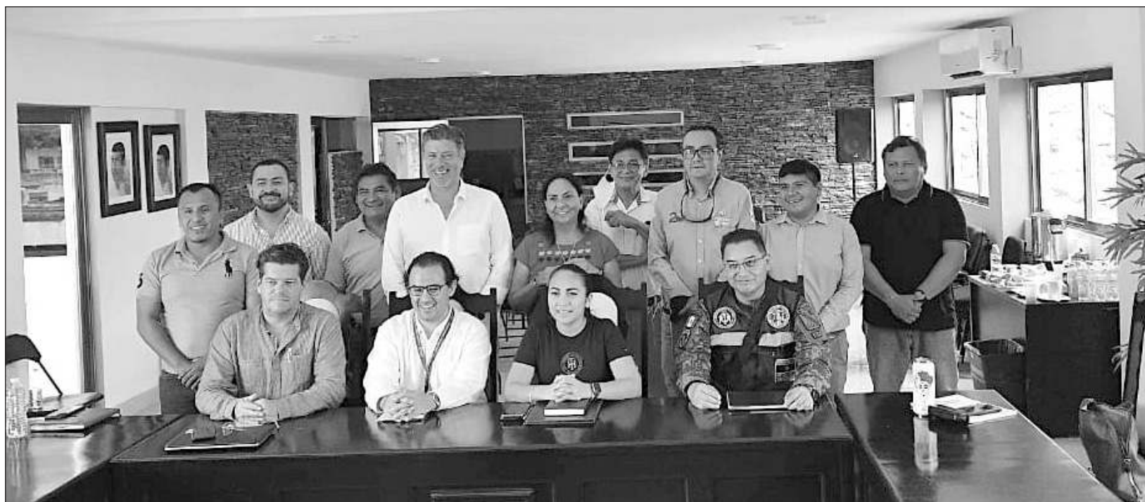
▲ Los asistentes a la sesión destacaron la importancia de armonizar y cumplir con las leyes tanto urbanas y ambientales.