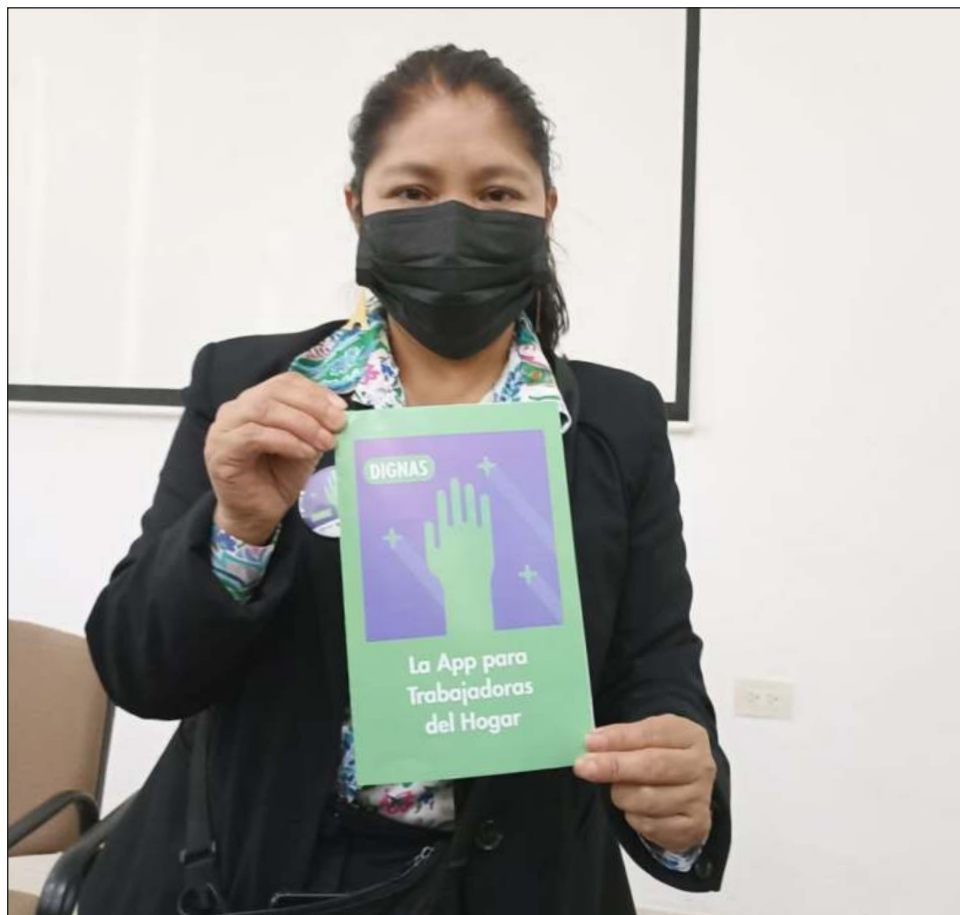
▲ La herramienta digital tiene el objetivo de que las trabajadoras y empleadores conozcan los derechos que están vigentes en la Ley Federal del Trabajo y en el Convenio 189.

“Tienen que conocer sus derechos y los empleadores tienen que cumplir”, sentenció la activista.