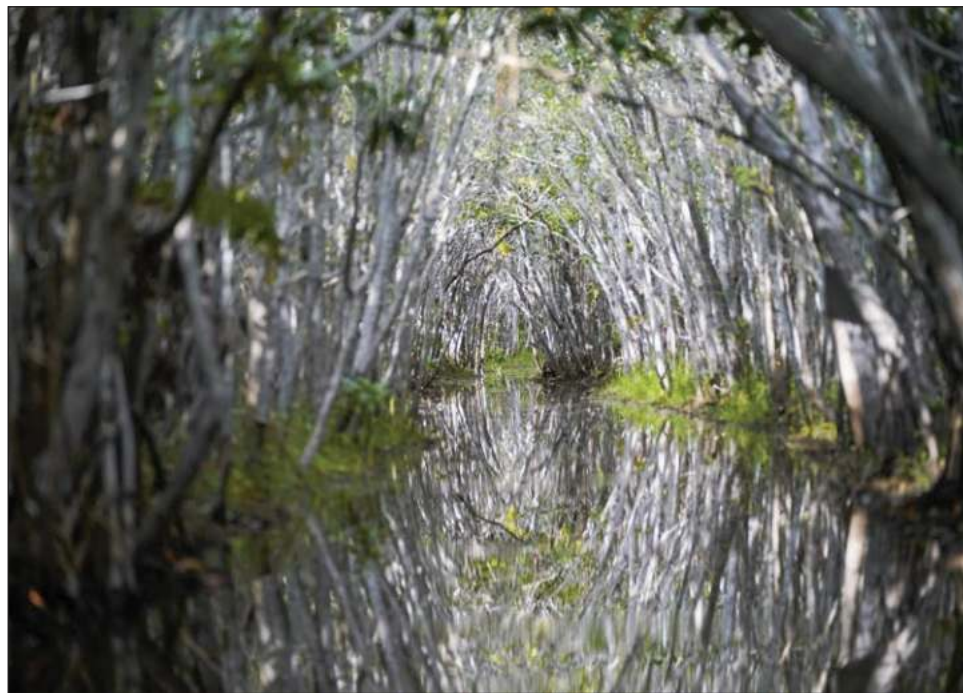
▲ Esta clase de vegetación es la primera línea de defensa natural frente a fenómenos marinos adversos, previniendo daños a la propiedad por un valor de más de 64 mil mde anuales.

Además, son capaces de capturar altas tasas de carbono, hasta el punto de que "una hectárea de manglar fija cien veces más carbono que otra de bosque tropical", ha explicado Ricardo Aguilar, director de expediciones de Oceana Europa.