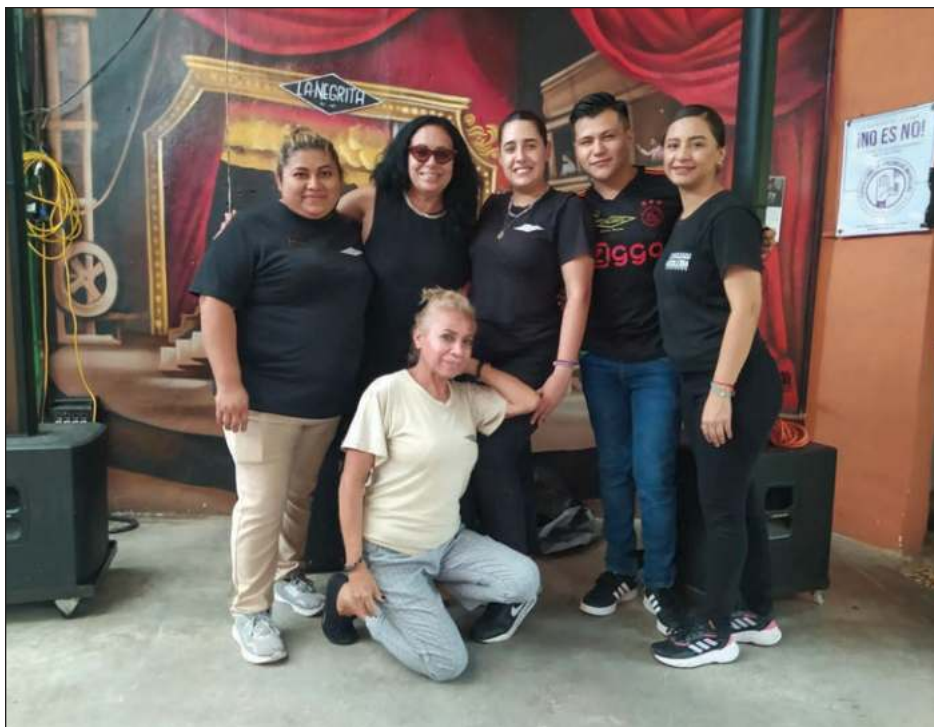
▲ Para Alina, La Negrita se trata de que ella y el público disfruten.

El viernes a las 20, horas en el Teatro Francisco de Paula Toro, se presentará Federico Wet Paint Jazz Fusion.