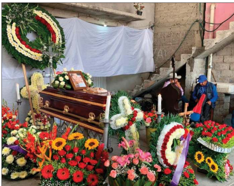
▲ El pasado 1 de julio, la víctima fue rociada con gasolina por un hombre que presuntamente era su familiar; diputada exige investigación a fondo.

Al ser cuestionado sobre la posibilidad de una autolesión, el fiscal dijo que todas las hipótesis se están investigando.