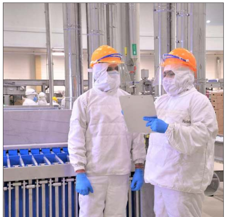
▲ La Planta Procesadora Sahé proyecta añadir 350 puestos laborales a los mil 500 que mantiene ahora, y los más de 7 mil que suma Kekén.

A través de todas sus operaciones en Yucatán y mediante su Centro de Identificación e Integración de Talento (CIIT), la empresa registra un promedio de 200 contrataciones mensuales, colocándose como uno de los pilares económicos y de empleabilidad en el territorio estatal.