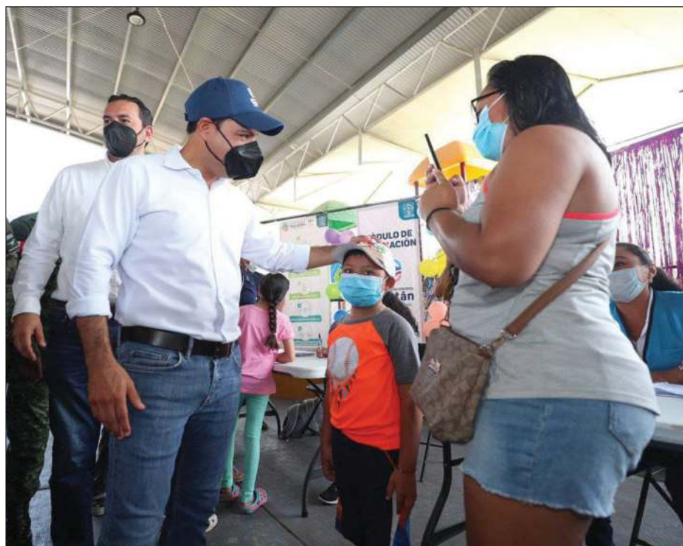
▲ La vacunación a niños de 5 a 11 años se realiza simultáneamente en los municipios de Valladolid, Kanasín, Tizimín, Progreso y Umán.

Luego de dormir en esta ciudad del oriente del estado, en donde desde el lunes desarrolló una gira de trabajo y que incluyó ayer el municipio de San Felipe y otras demarcaciones de la región, Vila Dosal acudió al parque deportivo “El Águila” para verificar el inicio de la aplicación de la primera dosis de la vacuna