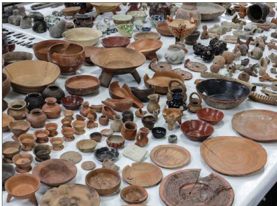
▲ El 11 de julio llegaron al país, procedentes de Barcelona, 19 cajas con 2 mil 522 objetos prehispánicos y novohispanos, indicó la secretaria de Cultura.

Ebrard Casaubón señaló que las recuperaciones se