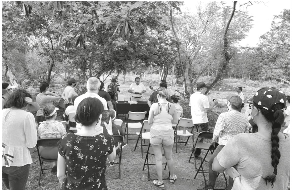
▲ La asociación Iniciativa Ciudadana de Vecinos de Altabrisa, trabaja desde 2010 exigiendo que se cumpla con el Proyecto de Desarrollo Urbano que se estableció desde un inicio.

Afirmaron que debido a que nuevamente está en riesgo de ser permutado el área verde que tiene una extensión de 31 mil 62 metros