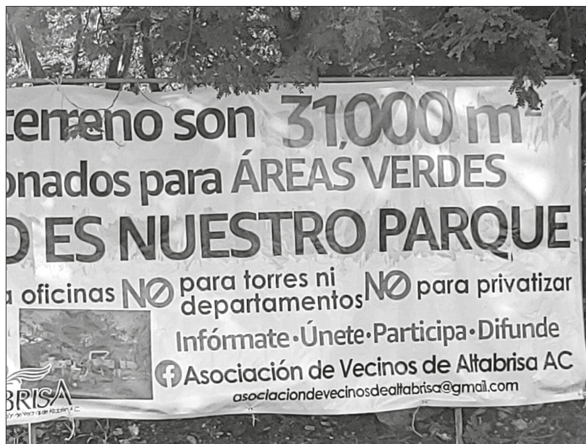
▲ “Lo que se pretende hacer realmente aquí es permitir que un particular se beneficie de la ubicación de este sitio y en cambio se deje a los vecinos de Altabrisa con las sobras”, aseguran pobladores.