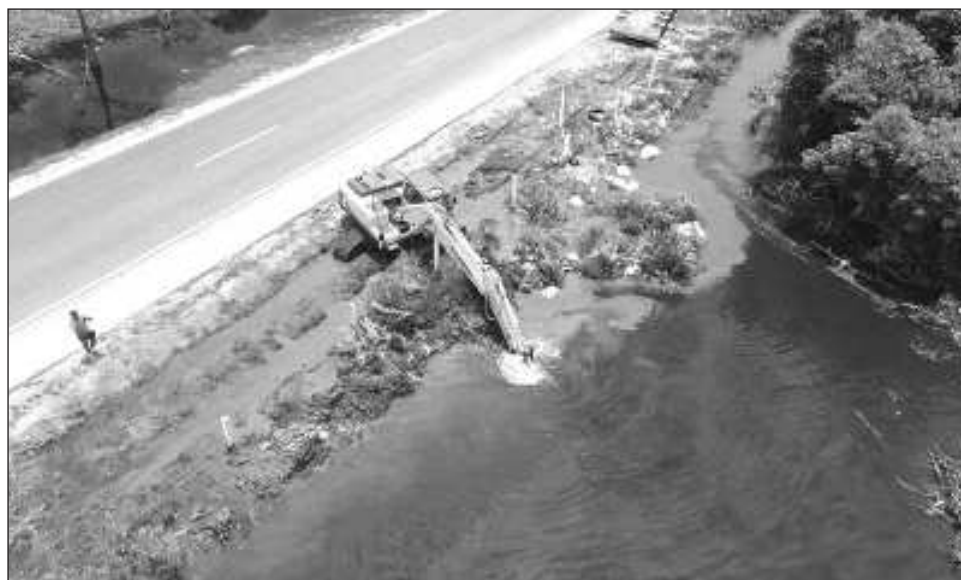
▲ Para llevar a cabo esta operación se utilizan dos máquinas excavadoras, con lo que se ha logrado contrarrestar la inundación en Seybaplaya.

Las intensas lluvias registradas los pasados días del mes en curso generaron un exceso de agua que llenó y comprometió a su máxima capacidad los drenes naturales, provocando el desborde y la inundación de viviendas, parcelas y parte de la autopista Campeche - Champotón, dando como re-