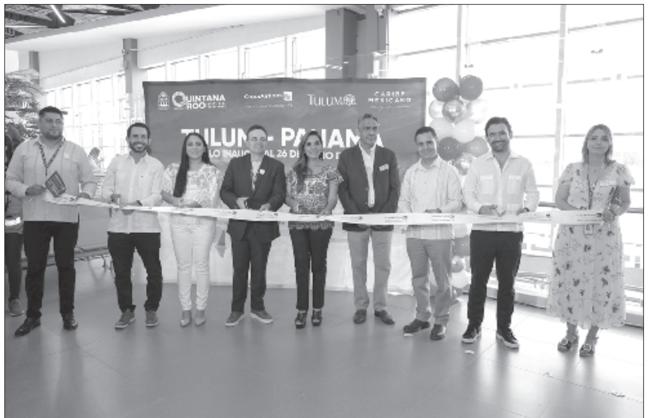
▲ La gobernadora Mara Lezama encabezó la recepción del vuelo en el Aeropuerto Internacional de Tulum, que a seis meses de operación, ya ha superado la cifra de medio millón de pasajeros, rompiendo todos los récords pronosticados.

Actualmente, el Aeropuerto Internacional de Tulum está conectado con nueve rutas a los Estados Unidos, seis nacionales, dos con Canadá y desde hoy, con Panamá. Se espera que en diciembre lo haga con Frankfurt, Alemania. Las aerolíneas que operan en esta terminal aérea son: American Airlines, Delta Airlines, United Airlines, Air Canada, Jet Blue y Copa Airlines. En diciembre se unirá Lufthansa/Discovery. Los vuelos nacionales son operados por Aeroméxico, Volaris, Mexicana y Viva Aerobus.