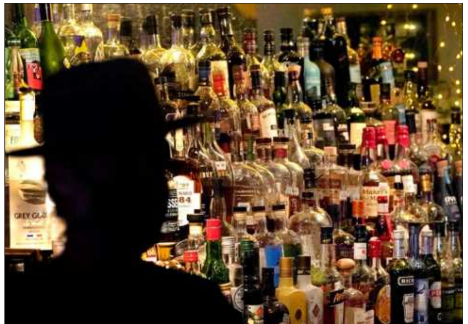
▲ De acuerdo con la OMS, del total de muertes atribuibles al alcohol en 2019, 474 mil se debieron a enfermedades cardiovasculares y 401 mil a distintos tipos de cáncer.

Los encuestados que declararon consumir alcohol reportaron un consumo de 27 gramos diarios, en promedio, lo que equivale a dos vasos de vino. Un 38 por ciento de los bebedores declararon que en el último mes consumieron alcohol en grandes cantidades en una o dos ocasiones.