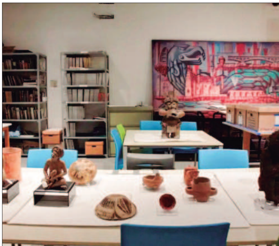
▲ Los trabajos de catalogación de la institución han permitido reconocer vestigios de otras culturas no mesoamericanas, provenientes de sitios de Perú y Chile.