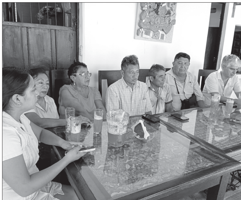
▲ Desde 1999, los campesinos piden constancias al comisario ejidal para probar que las tierras son trabajadas; los empresarios argumentan que desde el 2014 son propietarios.

El municipio Ixil es uno de los más ricos en diversidad biológica en el estado y cuenta con áreas naturales donde se ubica el calichal (selva baja con cactáceas), los manglares, la zona de la sabana, la selva baja caducifolia y más al sur, las tierras ejidales.