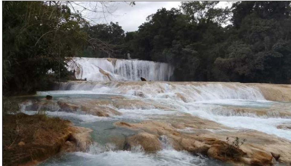
▲ Palenque es un destino en el que las cascadas son una experiencia única, pero también hay zonas arqueológicas importantes como Yaxchilán y Bonampak.

Entrevistado en Cancún, donde vino como parte de la caravana del estado de Chiapas que acudió el fin de semana a promocionar los atractivos de esa entidad en el Caribe Mexicano, el hotelero destacó que Palenque cuenta con hoteles desde una hasta cinco estrellas, buena calidad, buen servicio, sumando hasta ahora 30 afiliados a la asociación que representa, quienes cumplen con todo lo que marca la Secretaría de Turismo federal para dar la atención al cliente y ahora con la conectividad que tienen son ya varias formas para llegar a esa ciudad.