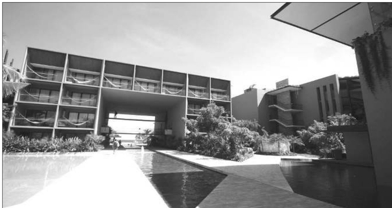
▲ Ante la situación, las y los empresarios han buscado en las poblaciones de la zona maya personas que quieran colaborar.

Ante esa situación han buscado en las poblacio-