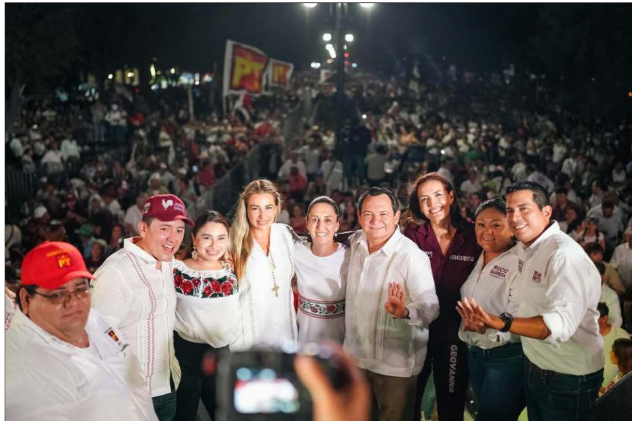
▲ Ante cerca de 40 mil personas, según cifras de los organizadores, reunidas en el Monumento a la Patria, Sheinbaum dijo que está segura de que Yucatán está listo para que Huacho sea su gobernador.

“Aquí no va a pasar la compra del voto, no va a pasar la amenaza, la calumnia, el pueblo de Yucatán va a decidir por la Cuarta Transformación... Aquí en Yucatán es votar por la