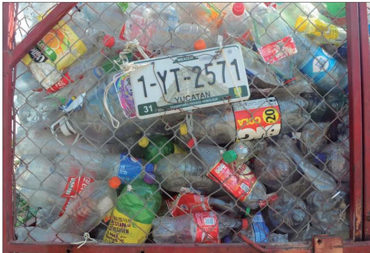
▲ "Pusimos en marcha los Diálogos participativos sobre la gestión de la basura en Mérida, de cuyo desarrollo y resultados hemos dado cuenta en columnas anteriores. De esa experiencia, hemos extraído tres valiosas lecciones para pensar el problema".

PERO, CONSIDEREMOS QUE la disposición final de los residuos es la última etapa del proceso de gestión, antes tenemos la generación, la recolección, transporte y tratamiento; si se hiciera una evaluación del funcionamiento de cada una de estas etapas, Yucatán saldría reprobado. Nuestros gobernantes lo saben y, aunque en los últimos tres años se han comenzado acciones que parecían prometedoras (como el Sistema