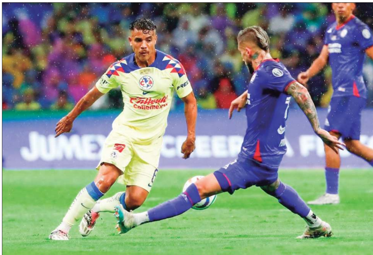
▲ Durante varios momentos del partido, Cruz Azul jugó de tal manera que revolvía las entrañas de sus rivales, pero no pudo sostenerlo, especialmente porque el campeón consagra o aniquila.

La Máquina Celeste se mantuvo dominando el encuentro, pero no concretó goles