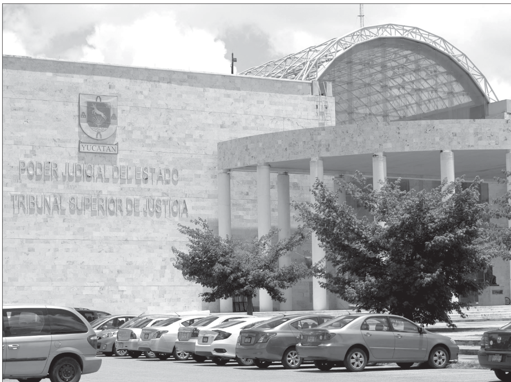
▲ En la península, Quintana Roo tiene 3 mil 413 expedientes abiertos y Yucatán tiene 2 mil 118, mientras que Campeche registra 2 mil 111.

Los principales sectores en donde hubo conflictos laborales fueron en comercio al por menor, servicios educativos, industrias manufactureras, comercio al por mayor y transportes, correos y almacenamiento.