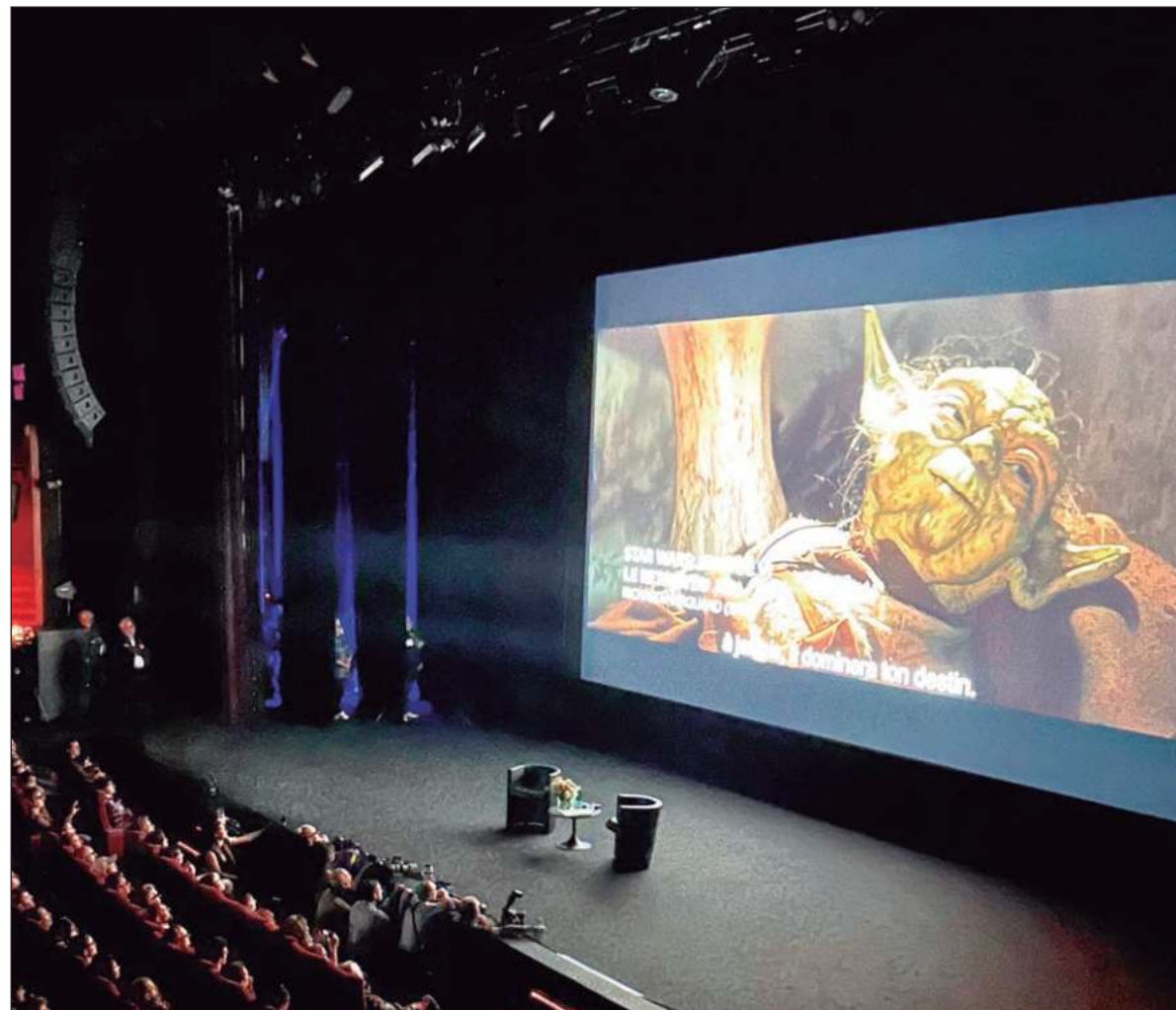
▲ "Mientras se hace la introducción de su entrevista honorífica en el Festival de Cannes, uno puede ver a George Lucas -con un poco de suerte de espectador- oculto tras bambalinas, en la segunda cortina del telón.

Él no pierde tampoco el tiempo y va directo al punto cuando la entrevista arranca. Star Wars es una saga que comenzó siendo para niños de 10