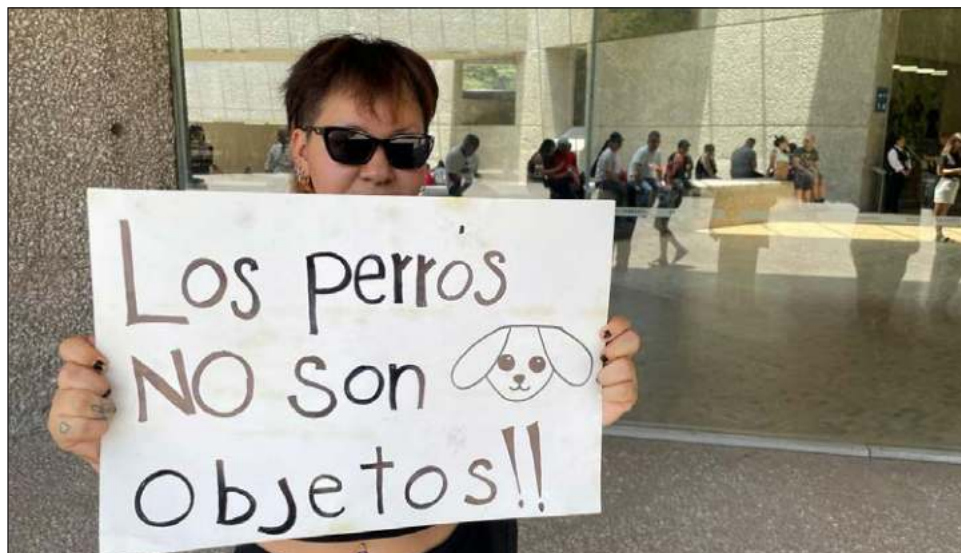
▲ Luego de que decenas de personas expresaran su inconformidad en redes sociales por el uso de perritos en el performance inaugural de la exposición Casts , de la artista danesa Nina Beier, la Secretaría de Cultura emitió un comunicado en el que solicitó al Museo Tamayo “no repetir” esa intervención artística. Foto Fabrizio León

Al acercarse a la fachada de mármol triturado ocurre el primer encuentro, si se es observador, pues un zapato insertado bajo la puerta de cristal impide que se cierre. “La muestra se convierte en el escenario de una serie de encuentros performáticos , discretos e intermitentes, que resignifican el contenido de las salas de exhibición de un momento a otro”, introduce el texto curatorial que da una breve explicación al inicio.