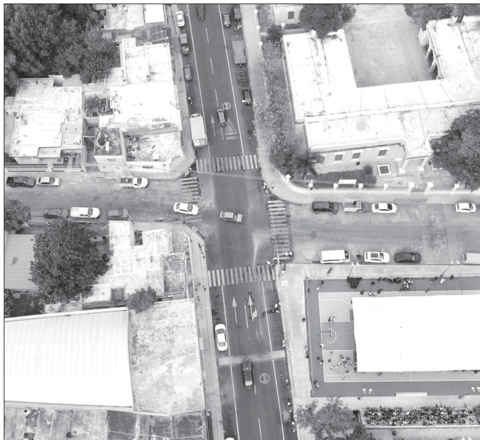
▲ La disponibilidad de los recursos se ve afectada por la mayor demanda de líquido y el uso de sistemas de climatización, advirtió la Conagua.

También se supervisa que la gestión que realiza la Oficina de Representación en Yucatán se lleve a cabo dentro de la normatividad y en los tiempos de ley, además de que se revisa el trabajo de los servidores públicos para encontrar mejoras en la prestación del servicio.