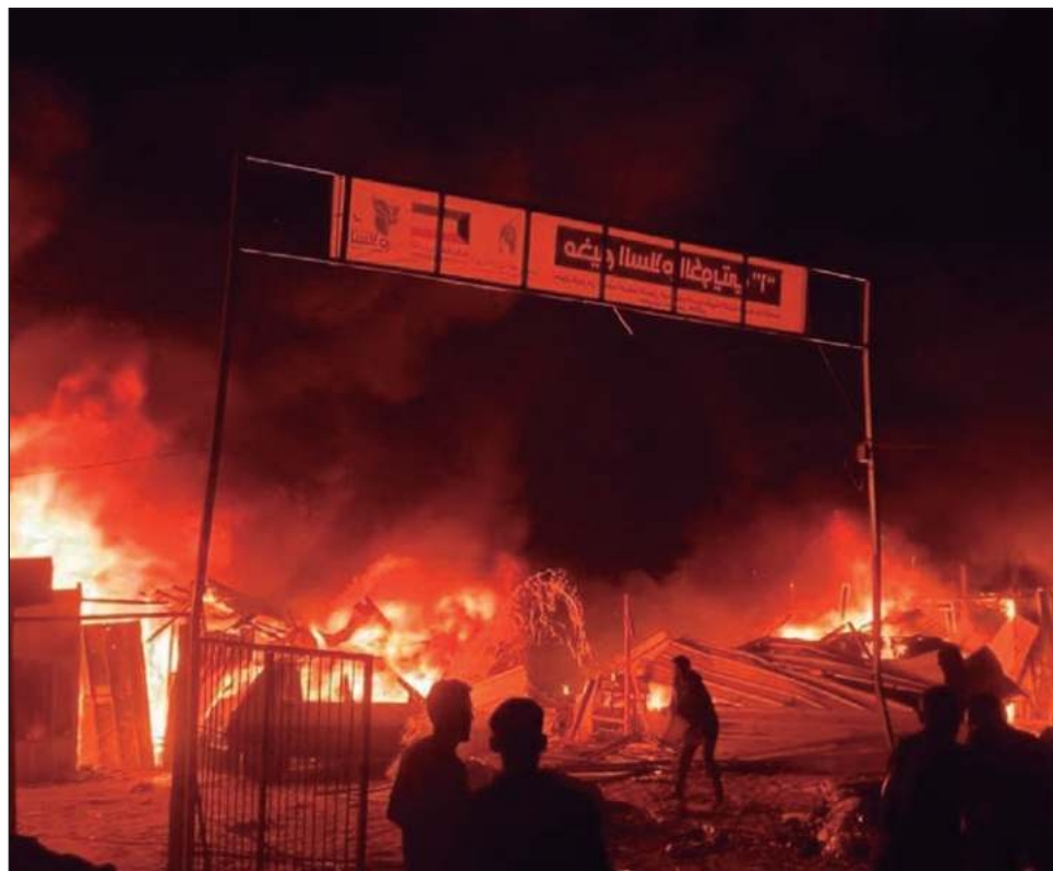
▲ Según las autoridades, la mayoría de los muertos y decenas de heridos eran mujeres y niños, varios habían quedado atrapado bajo los escombros en llamas luego del ataque.

El ataque se produjo dos días después que la Corte Internacional de Justicia ordenó a Israel poner fin a su ofensiva militar en Rafah, donde más de la mitad de la población de Gaza había buscado refugio antes de la reciente incursión israelí. Decenas de miles de personas permanecen en la zona, si bien muchas otras han huido.