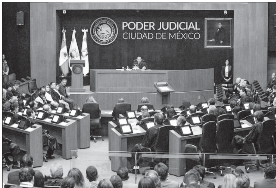
▲ En contra de la extinción de los fideicomisos hay mil 500 juicios de amparo interpuestos que esperan que la Corte emita un criterio para que se dicte sentencia definitiva en favor o en contra de la desaparición de los instrumentos financieros.

La información obtenida de funcionarios de la Suprema Corte de Justicia de la Nación (SCJN), refiere que hace dos semanas, durante