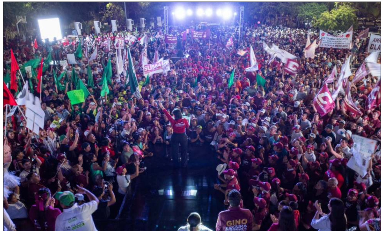
▲ La candidata agradeció a las y los militantes desde el fraccionamiento Villamar, en Solidaridad.

“Ha sido la campaña del amor porque principalmente ha sido liderada por mujeres, por esas combatientes mujeres solidarenses que todos los días se levantan muy temprano a ga-