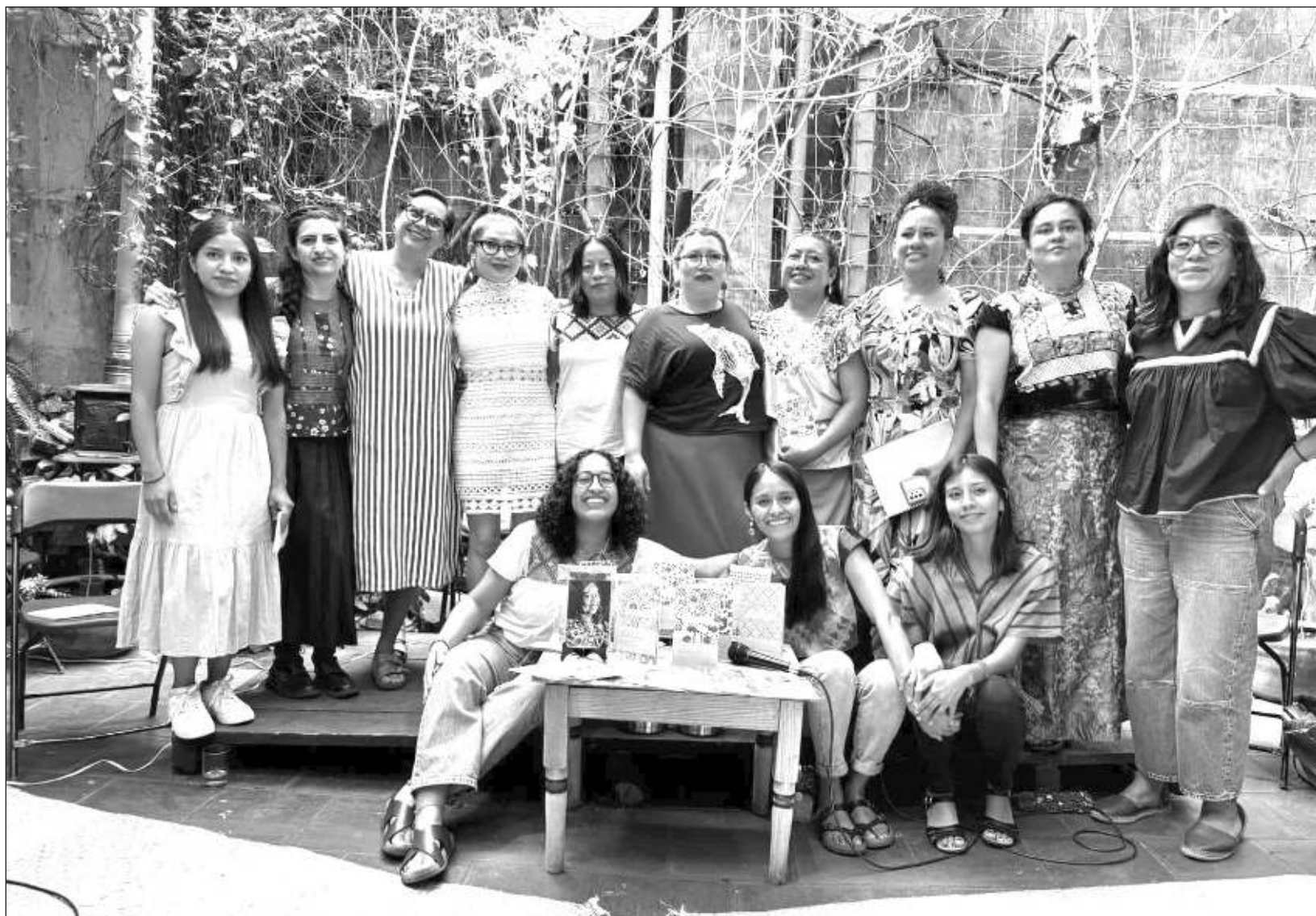
▲ Te'el ochela' ku chíikpajal u ya'abil máaxo'ob ts'íibna'ob yéetel táakpajo'ob ti'al u beetchajal le noj meyajá, tu kúuchil La Jacaranda. ochel Facebook Originaria

Ti'al u yojéelta'al ukáak' ba'alo'ob yóok'lal le meyajá, beyxan ti'al u yila'al le yáax meyajta'aobe', ku páajtal u xak'alta'al originaria.org.