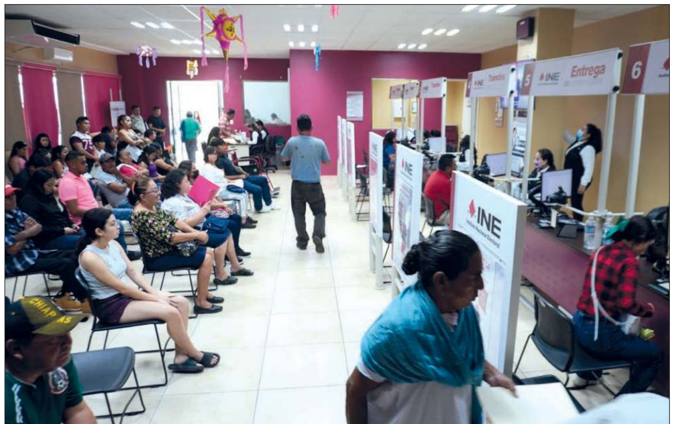
▲ En el estado de Campeche sólo hay dos módulos de credencialización fijos brindando atención a la ciudadanía, uno en la capital y otro en Ciudad del Carmen. El día 31 de mayo permanecerán abiertos de las 8 a las 21 horas.

Hasta el 20 de mayo se recibieron 7 mil cinco solicitudes de reimpresión por extravío