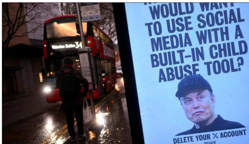
▲ Los investigadores dijeron que algunas imágenes sexualizadas generadas en la aplicación parecían incluir a menores. Algunos gobiernos prohibieron el servicio o emitieron advertencias.

El ejecutivo de la Unión Europea, compuesto por 27 naciones, indicó que estaba