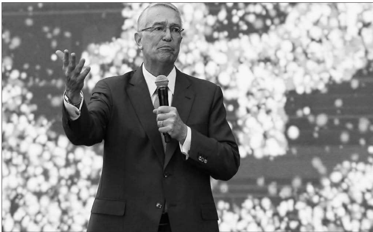
▲ La presidenta Claudia Sheinbaum destacó que al expresar su intención de pagar, Grupo Salinas se hace acreedor a diversos beneficios conforme a la ley, mismos que en su momento el SAT dará a conocer.

Sheinbaum informó que al expresar su intención de