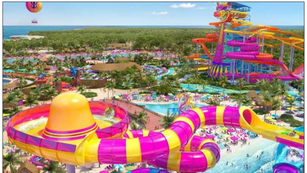
▲ La jueza federal reconoció en la suspensión que existen elementos que justifican la protección urgente del medio ambiente, considerando el posible riesgo al ecosistema de manglar, la presión sobre el derecho al agua y la infraestructura existente.

Asimismo, el órgano jurisdiccional consideró relevante que el propio contexto local presenta carencias en infraestructura de