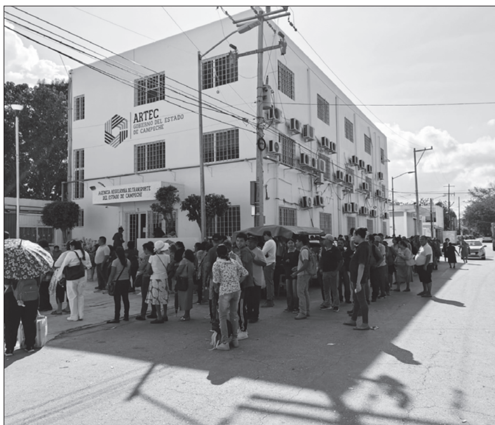
▲ Debido a los tiempos de espera, las y los campechanos tienen que pedir el día en sus lugares de trabajo para realizar la solicitud de tarjetas en las oficinas de la Artec.

El 1 de febrero iniciará el cobro del pasaje luego de meses de ofrecer servicio gratuito