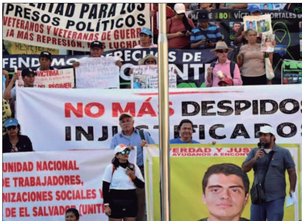
▲ El presidente conservador Nayib Bukele impuso el régimen de excepción para combatir las pandillas y los niveles de violencia: bajo esta política, más de 90 mil personas han sido detenidas desde 2022 y unas 8 mil fueron liberadas por ser inocentes. Foto crédito

“No más dictadura” y “Gobierno falso mentiroso”, se leía en algunas pancartas en la manifestación, que además protestaba contra la minería, el despido de maestros y de personal médico.