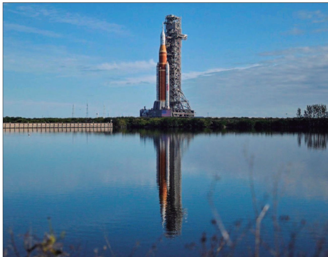
▲ La expansión hacia el espacio, que se expresa a través del programa Artemis, traerá transformaciones profundas, como debates sobre legislación espacial, gobernanza de recursos, derechos y responsabilidad.

Para Medina Tanco, esta expansión hacia el espacio, que se expresa a través del programa Artemis, traerá transformaciones profundas: debates sobre legislación espacial, gobernanza de recursos, derechos y responsabi-