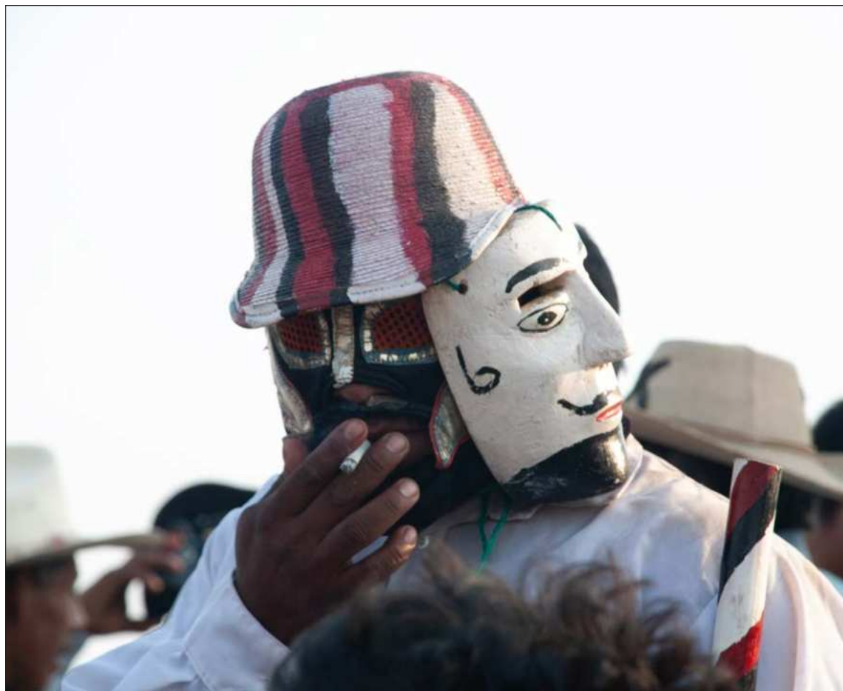
▲ “La verdadera cultura se hace a pesar de los funcionarios y a veces incluso en contra de las mismas instituciones culturales; la cultura es resistencia, mecanismo de defensa, perspectiva crítica, resiliencia y capacidad de persistir”.

Lo cultural tiene que mirarse al espejo, pero también tiene que atender los datos escondidos que le proporciona ese otro espejo que es la sombra.