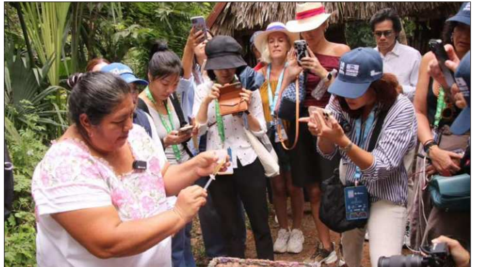
▲ Actualmente existen 10 rutas turísticas en comisarías como Xcunyá, Tamanché, Dzityá, Molas y San Pedro Chimay, entre otras, en las que se promueve la cultura viva.

Patrón Laviada recordó que en visitmerida.com están disponibles estas rutas para contratar los servicios.