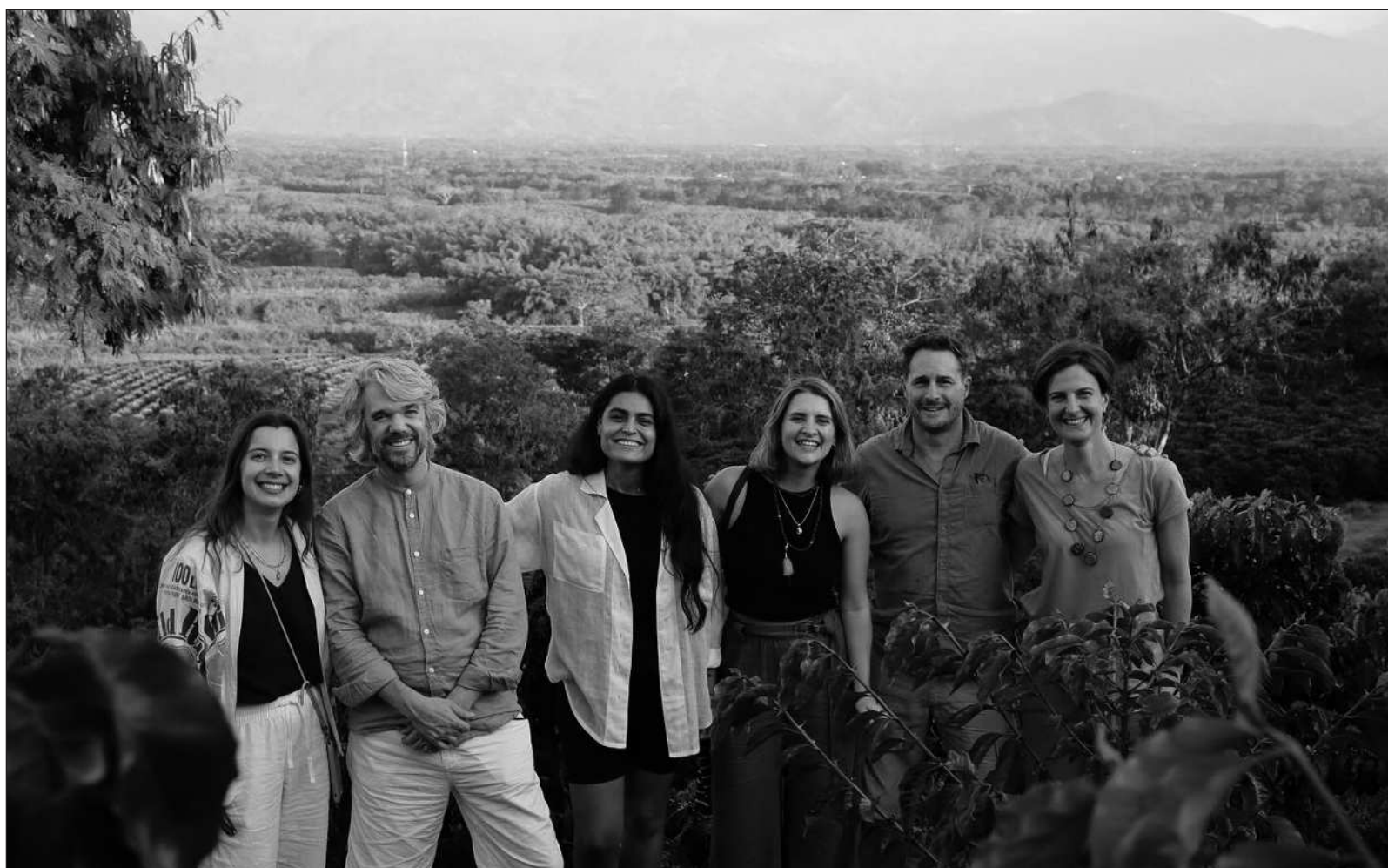
▲ “Los sistemas alimentarios, terrestres o acuáticos, tienen enormes problemas. Son responsables de la emisión de alrededor de 33 por ciento de los gases de efecto invernadero que causan el cambio climático, de la pérdida de biodiversidad por la expansión de la frontera agrícola y por los efectos de los pesticidas”.