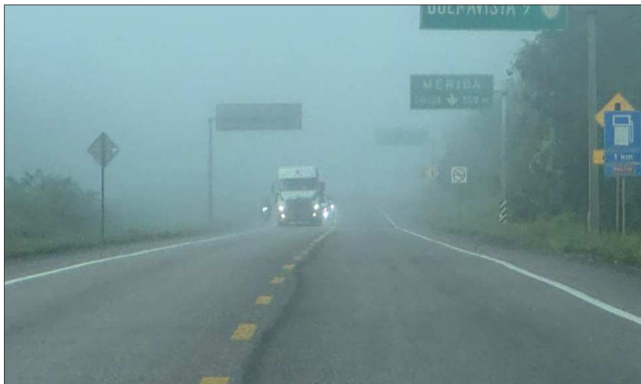
▲ El fenómeno se debe al descenso de temperaturas causado por el frente frío número 30, que afecta la península de Yucatán originando cielos nublados, chubascos y lluvias puntuales fuertes.

La masa de aire frío que impulsa al frente originará evento de “norte” con ra-