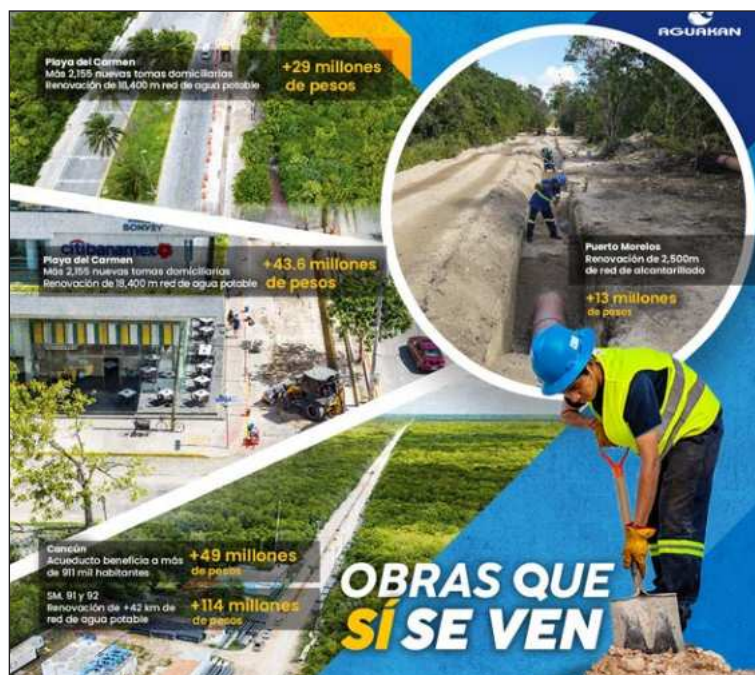
▲ En Cancún, está en proceso de construcción un tanque de almacenamiento de agua en el Polígono Sur, con una capacidad de 2 mil 300 metros cúbicos.

De forma complementaria, en la avenida Huayacán de Cancún continúan los trabajos de drenaje sanitario, con más de 1,600 metros de tubería instalada que beneficiarán a más de 19,000 habitantes; las obras siguen en proceso y próximamente se realizará la instalación de cuatro pozos y 19 descargas, con el objetivo de seguir fortaleciendo el