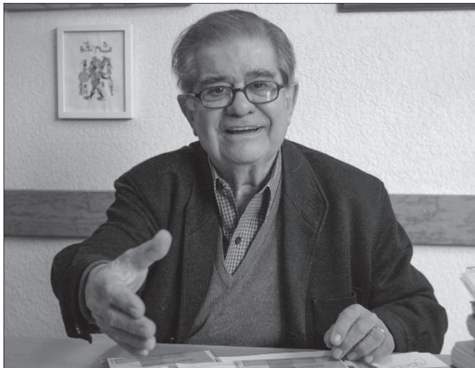
▲ En Soy mi memoria, León-Portilla plasmó su infancia (que reconoció como llena de afecto y cariño por sus padres), su paso por la Compañía de Jesús, donde realizó sus primeros estudios, y, posteriormente, su ingreso a los estudios superiores y la academia en la UNAM.