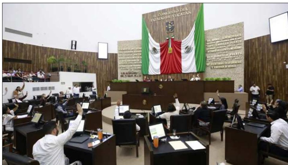
▲ El objetivo de la junta preparatoria es elegir a las personas que fungirán en los puestos de la presidencia, vicepresidencia, secretaría y secretarías suplentes.

El segundo periodo ordinario de sesiones correspondiente al segundo año del ejercicio constitucional comenzará el próximo domingo 1 de febrero.