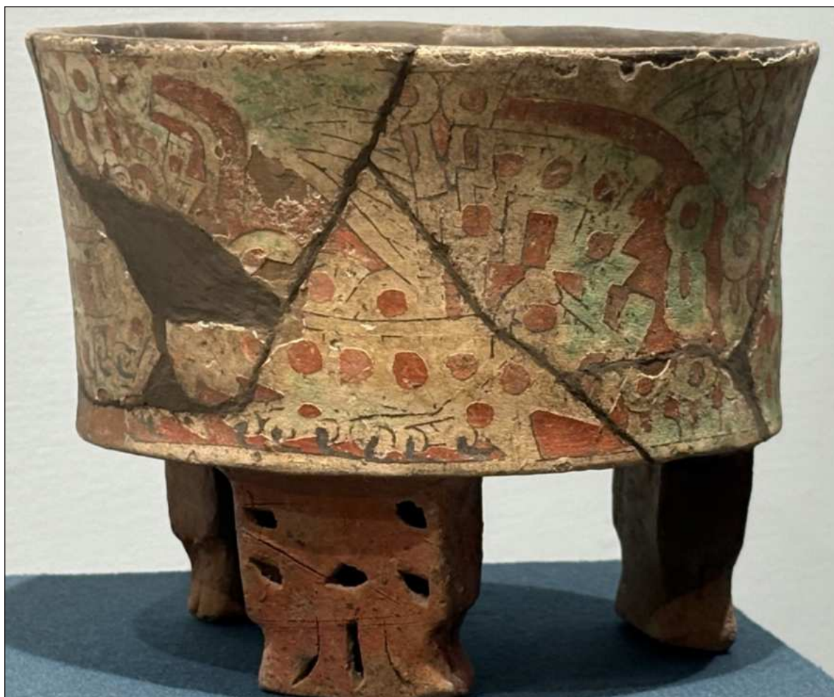
▲ “En una misma exhibición de objetos prehispánicos es posible ver algunas vasijas que parecen nuevas junto a otras que, aun habiendo sido ensambladas, se dejaron incompletas”. Vasija de Teotihuacán.