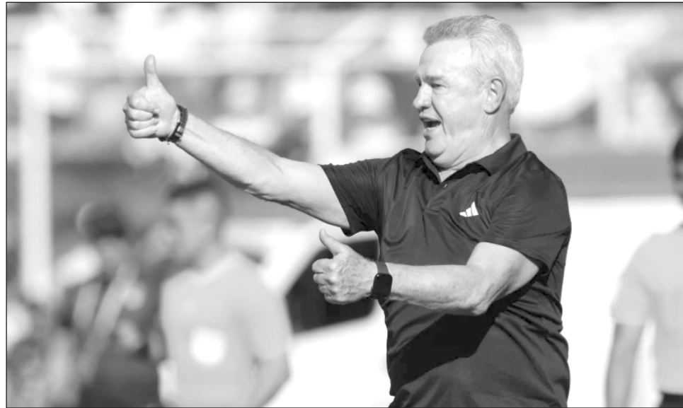
▲ El entrenador del Tricolor, Javier Aguirre, durante el partido amistoso ante Bolivia.

Los mexicanos volvieron a padecer la falta de profun-