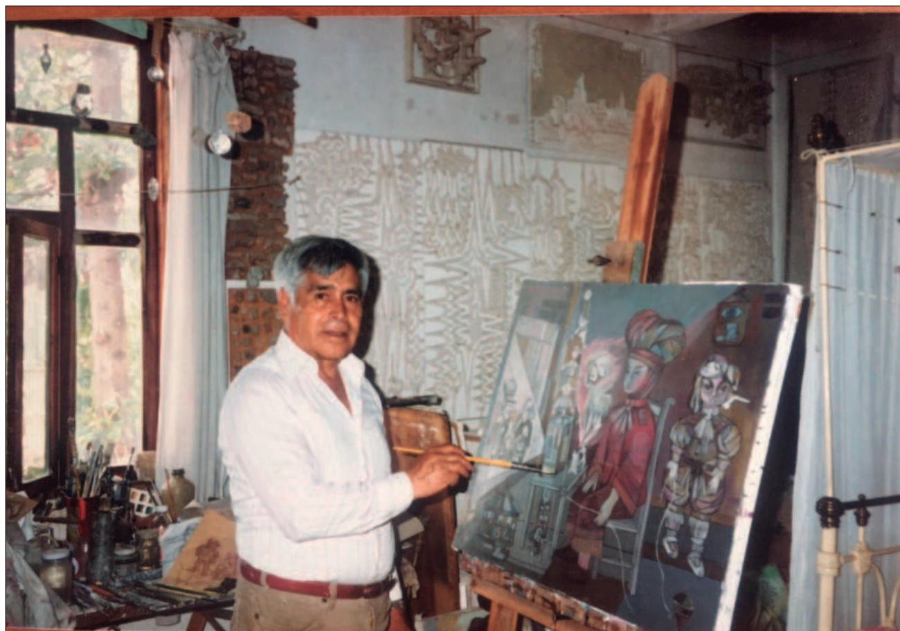
▲ En 2027 se cumplirá el centenario del natalicio de Nicolás Cuéllar, para lo cual sus herederos están en pláticas con el Museo de Arte Moderno, en la Ciudad de México, con el fin de realizar una retrospectiva amplia sobre su obra.

Dividido en tres segmentos, el texto es una narración que cubre su relación y su incursión en la pintura y la escultura, sus reflexiones en torno a su obra, su historia familiar y hasta su trabajo con otros artistas. Además, la obra fue seleccionada para formar parte de la colección Maestría del sello editorial Planeta.