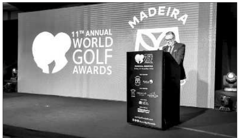
▲ El campo de golf PGA Riviera Maya fue reconocido en la ciudad de Madeira, Portugal, como el mejor de México durante los World Golf Awards 2024.