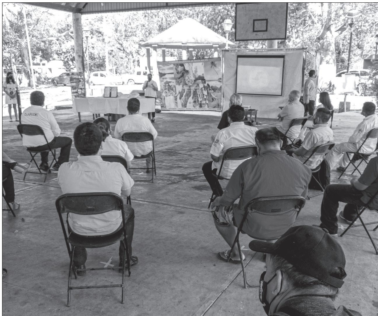
▲ Las empresas estarán preparadas para recibir a los visitantes con medidas sanitarias a través de protocolos adaptados al contexto donde se realiza la actividad turística.

Este proceso de certificación se llevó a cabo durante los últimos seis meses y aún no ha terminado