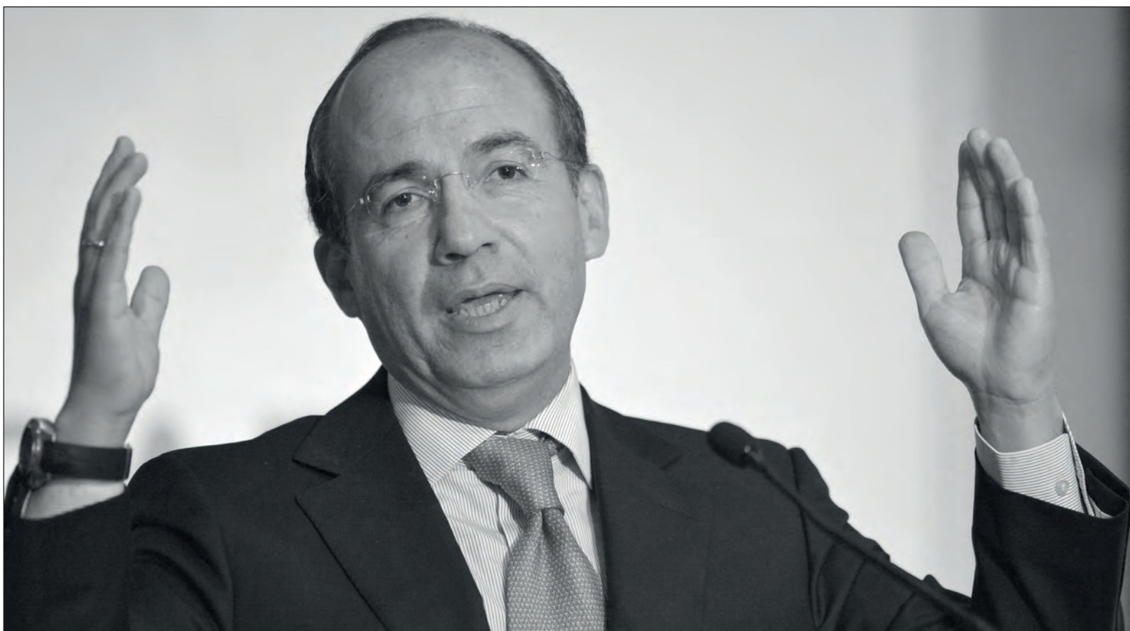
▲ El ex presidente Felipe Calderón ocupa el primer lugar de los políticos más repudiados, según un estudio de noviembre de la organización México Elige.