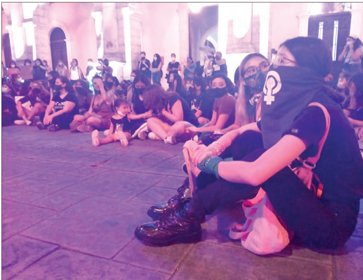
▲ ¿Por qué una niña va a salir a pedir justicia? Lamentablemente hay muchos motivos para reunir a mujeres de todas las edades en el reclamo.

El funcionario subrayó que a quienes acuden a los mercados a realizar sus compras se les recomienda también el uso de caretas y cubrebocas, la aplicación de gel antibacteriano y el respeto a la sana distancia.