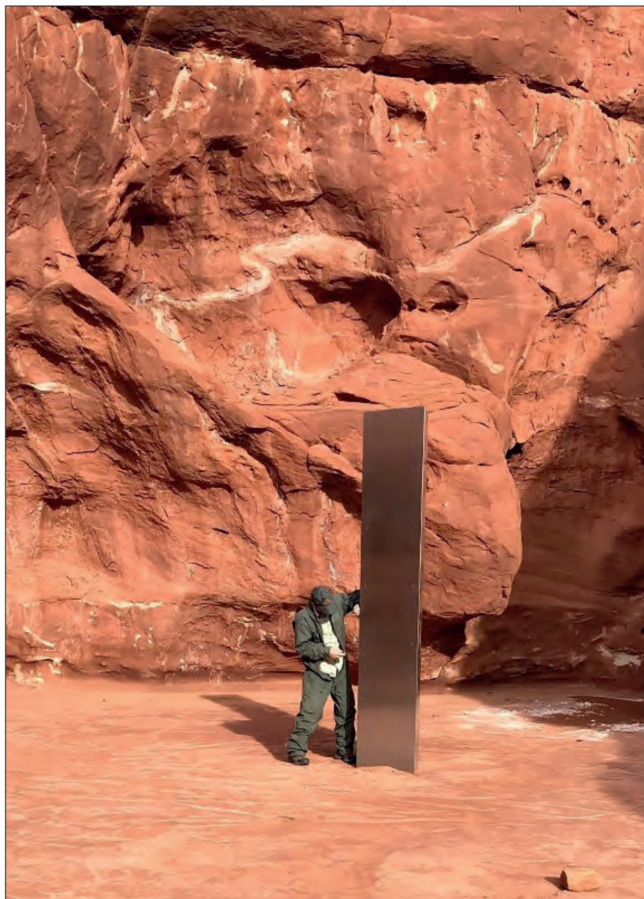
▲ Es ilegal instalar estructuras u obras de arte en terrenos públicos administrados por el gobierno federal, sin importar de qué planeta sea, indica el Departamento de Seguridad Pública de Utah.

La noticia del descubrimiento rápidamente se volvió viral en Internet, y muchos notaron la similitud del objeto con los extraños monolitos alienígenas que desencadenan enormes