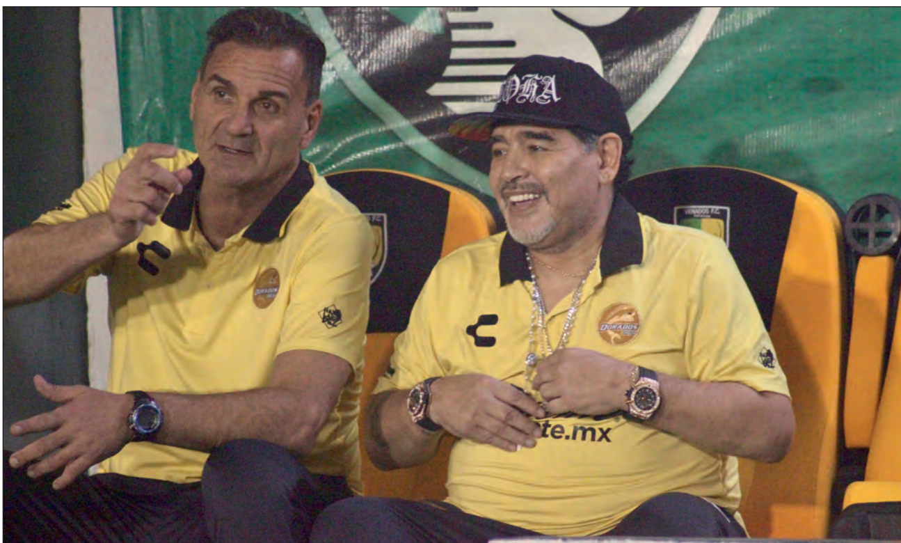
▲ Diego Armando Maradona fue adorado como un dios por millones de personas e hizo de su nombre un símbolo de reconocimiento mundial para cualquier argentino. En la foto, el ídolo deportivo durante su estadía en Mérida.

Una segunda sanción por consumo de sustancias prohibidas se produjo en 1994, cuando Maradona fue expulsado por la FIFA del Mundial de Estados Unidos tras dar positivo en un control por cinco derivados de la efedrina.