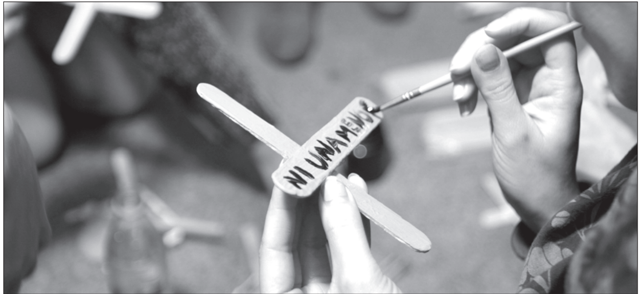
▲ La impunidad y la ausencia de resultados no pueden ser parte de esta administración, aclaró el mandatario Carlos Joaquín.

En el marco del Día Internacional de la Eliminación de la Violencia Contra la Mujer, el gobernador afirmó que la impunidad y la ausencia de resultados no pueden ser parte de este gobierno, y que "las justificaciones y las excusas de