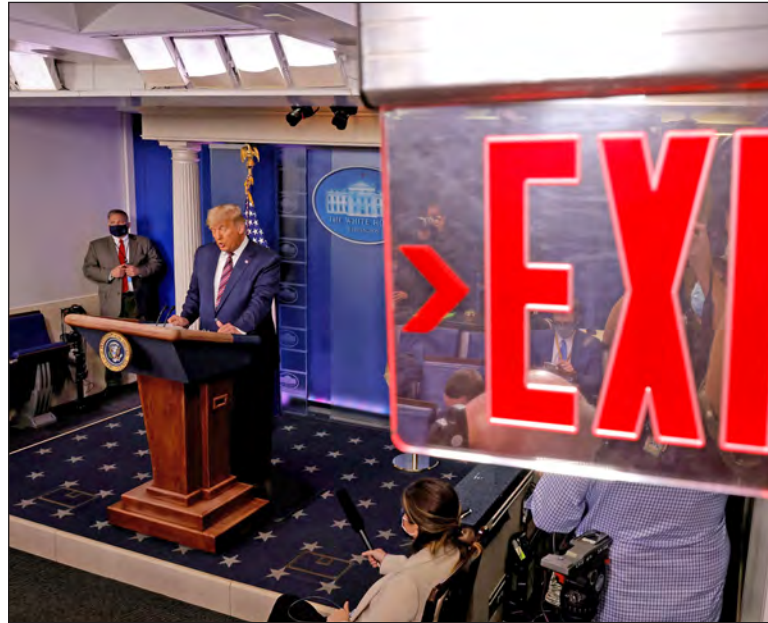
▲ Will Trump make good on his threat to create a new television network beholden only to him?

OR DO THEY find ways to channel Trump's connection with seventy-one million voters into policy options that