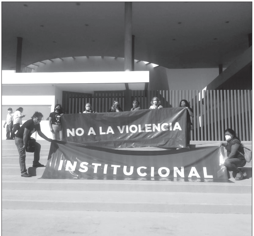
▲ La Comisión de Igualdad de Género del Congreso local recibió la propuesta del colectivo feminista y se comprometió a revisarla.