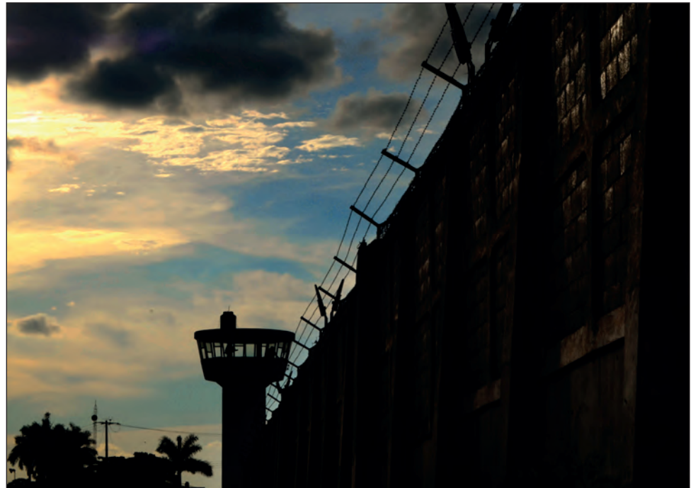
▲ Los reclusos "podrán ser lo que quieran", pero también tienen seres queridos de los que se han alejado por la prohibición de visitas.

Con corte al 24 de noviembre, la Comisión Nacional de los Derechos Humanos (CNDH) informó a través de su Monitoreo Nacional de Centros Penitenciarios que en Yucatán se han registrado 48 contagios de COVID-19, hay dos