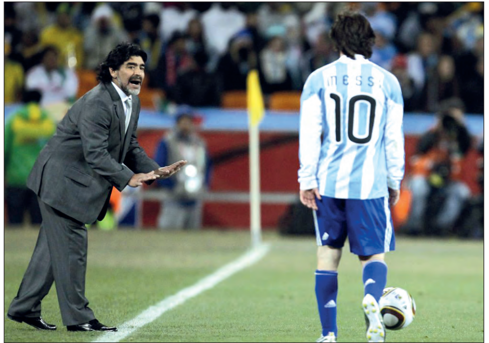
▲ Diego Maradona, como técnico de Argentina, da instrucciones a Lionel Messi durante el partido de octavos de final de la Copa del Mundo de 2010 entre Argentina y México en el Soccer City en Johannesburgo, Sudáfrica.

Muchos argentinos vieron la victoria ante Inglaterra como una venganza por la guerra de 74 días librada y perdida ante Gran Bretaña en 1982 por la posesión de las islas Malvinas, en el Atlántico Sur. “Fue más que tratar de