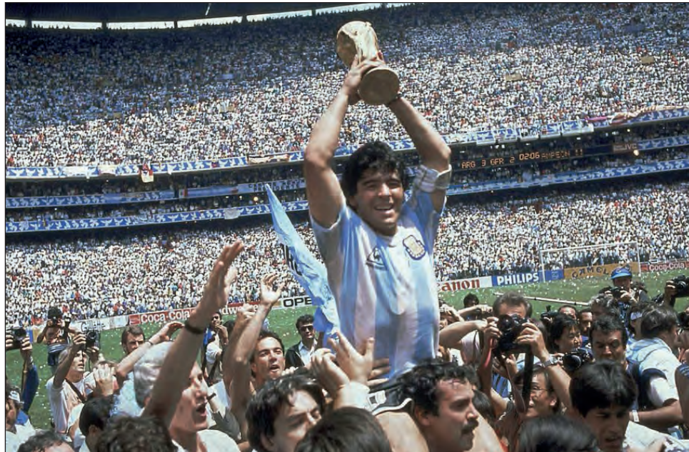
▲ Diego Maradona alza la Copa Mundial tras la victoria de Argentina 3-2 ante Alemania en la final de México 1986, en el Estadio Azteca de la Ciudad de México. El ícono del fútbol mundial falleció ayer a los 60 años.

bre, exactamente cuatro años atrás, murió el líder revolucionario cubano Fidel Castro, al que el ex futbolista admiraba y trató personalmente.