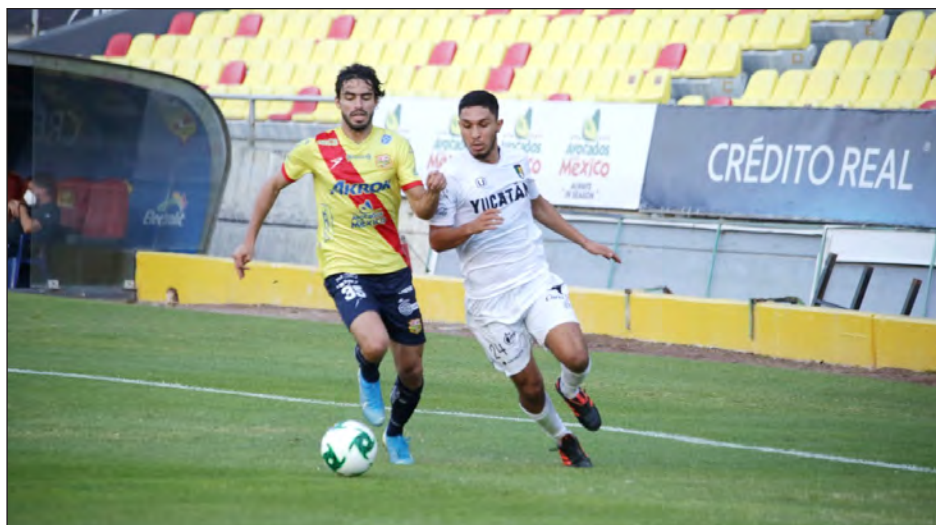
▲ Los astados fueron irregulares a lo largo del torneo y ayer se despidieron en Morelia sin poder anotar gol.

pada le devolvió el alma al cuerpo al equipo yucateco, que mantuvo la estrategia de quedar bien plantado en zona baja para recuperar y mandar rápidas ofensivas por las bandas. Sin embargo, los ciervos -con el avance del reloj- quedaron encerrados en su campo y se ocuparon más de detener las ofensivas michoacanas que de ofender a la meta de Alejandro Arana. El primer tiempo se terminó sin más sobresaltos y con un claro dominio michoacano.