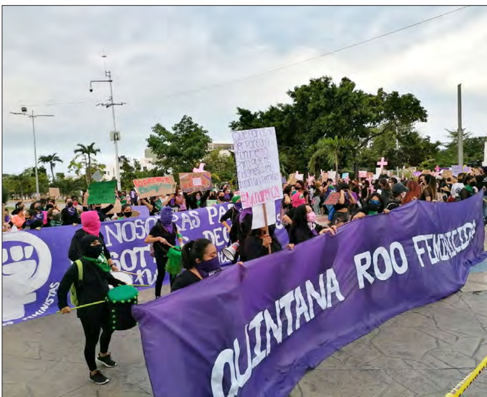
▲ Los colectivos que integran la Red Feminista Quintanarroense realizaron movilizaciones pacíficas en siete de los 11 municipios del estado, en el marco del Día Internacional para Erradicar la Violencia Contra las Mujeres.

pal, donde fueron recibidas por tres grupos de policías mujeres, quienes portaban lonas con la leyenda: “Hoy más que nunca TODAS