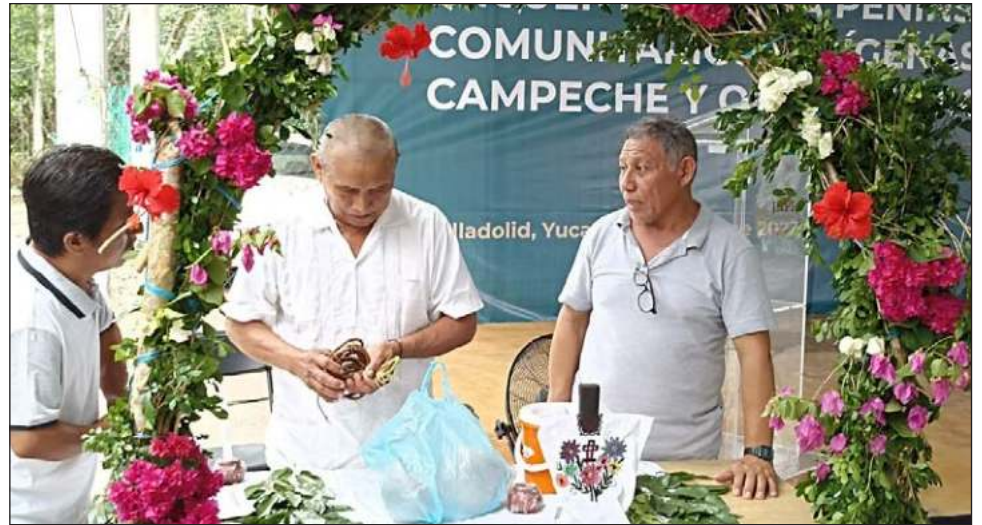
▲ Las autoridades del INPI indicaron que con la reforma a varios artículos de la Constitución se busca garantizar los derechos de las comunidades mayas.

Aunque la situación es similar en las 47 comisarías, opinó que en las más