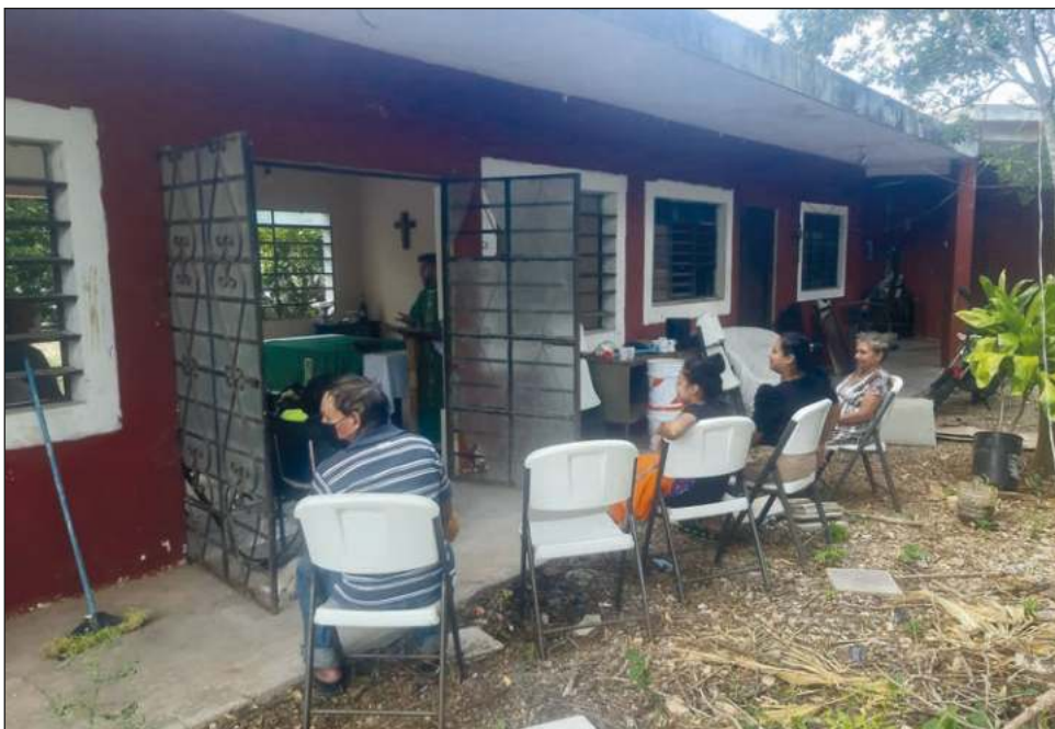
▲ La kermés del albergue se llevará a cabo el domingo 2 de octubre a partir de las 10 horas con la celebración eucarística; a las 11 será el evento.

Además de asistir a la kermés, se puede apoyar a la causa donando algún producto para su venta durante el encuentro, o bien, brindando un espectáculo cultural. Para ello, los interesados se pueden comunicar al 9981188084.