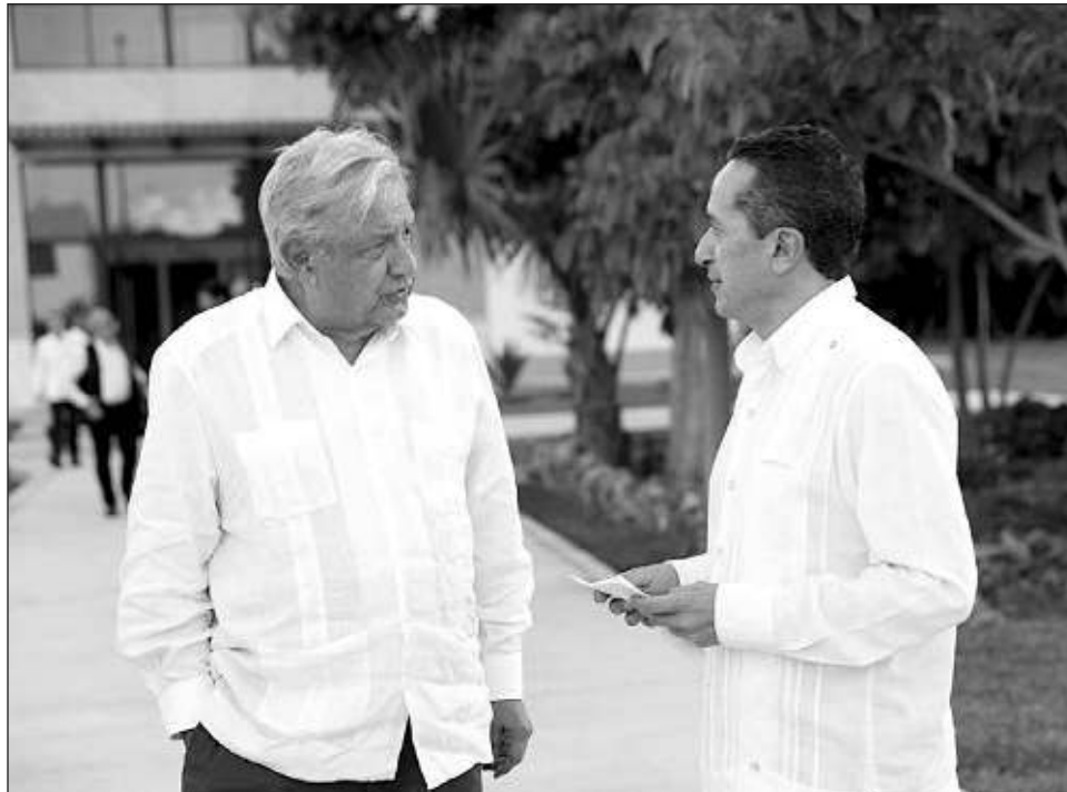
▲ El ex gobernador Carlos Joaquín será propuesto como embajador de México en Canadá, según anunció el presidente Andrés Manuel López Obrador.

Según ha dado a conocer el presidente López Obrador, tras terminar su cargo Carlos Joaquín será propuesto como embajador de México en Canadá. Se prevé que en los próximos