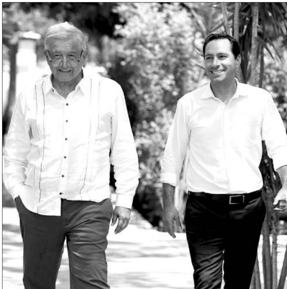
▲ El presidente López Obrador y el gobernador Vila Dosal hablaron sobre lo que se está haciendo como parte del proyecto de construcción del parque en La Plancha, para el disfrute de las familias yucatecas, y además contribuirá a la atracción del turismo a Mérida.

Cabe recordar que el pasado 20 de este mes Vila Dosal y el titular de la Secretaría de la Defensa Nacional (Sedena), Luis Crescencio Sandoval González, pusieron en marcha esta obra