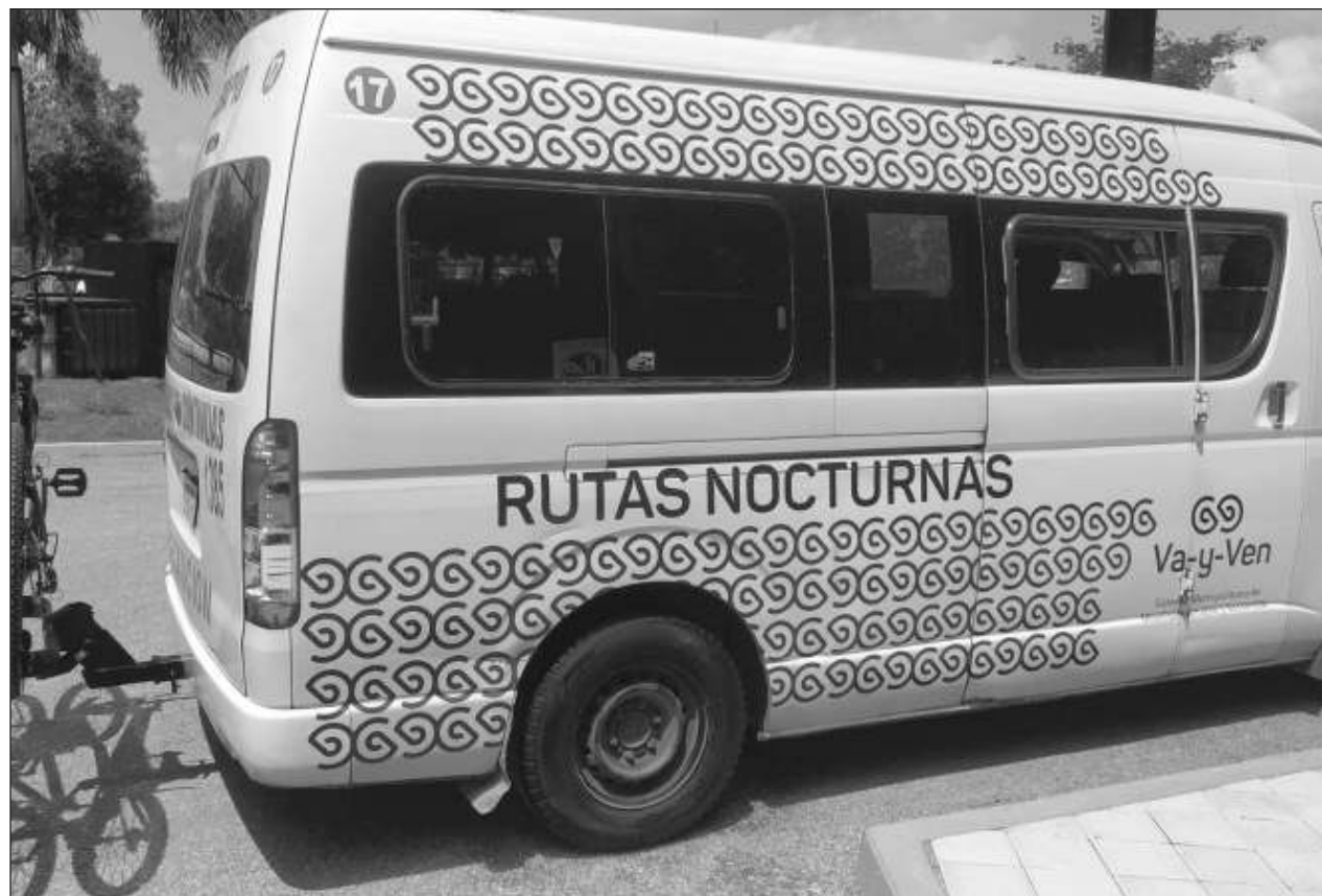
▲ Un sondeo de la Canirac arrojó que son mujeres 53% de los usuarios de transporte público nocturno.

SE TRATA DE un programa que mantiene el servicio constante de transporte público entre las 23 y 5 horas en 13 rutas de miércoles a sábado (finaliza el domingo a las 5 horas). El programa arrancó con 37 unidades tipo van del Frente Único de Trabajadores del Volante (FUTV) y 10 autobuses. A lo largo del mes de septiembre el servicio es gratuito, pero a partir de octubre funcionará mediante el pago con tarjeta inteligente y un costo único de 15 pesos por trayecto. Las 13 rutas, con sus correspondientes paraderos, están disponibles en https://vayven.yucatan.gob.mx/rutanocurna . Al observar el "mapa nocturno" es evidente que cumple con su propósito: comunicar el conjunto de la ciudad y permitir el desplazamiento de un lugar a otro con relativa facilidad y rapidez en horarios noc-