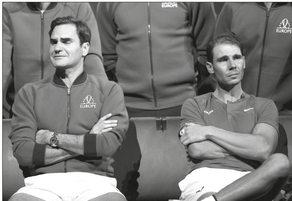
▲ Roger Federer y Rafael Nadal, tras el último partido de la leyenda suiza.

John McEnroe tenía récord de 0-4 como capitán de su equipo ante Bjorn Borg, su viejo rival y capitán del conjunto europeo. Ambos indicaron que volverán para la Copa Laver de 2023 en Vancouver, pero que sería su última.