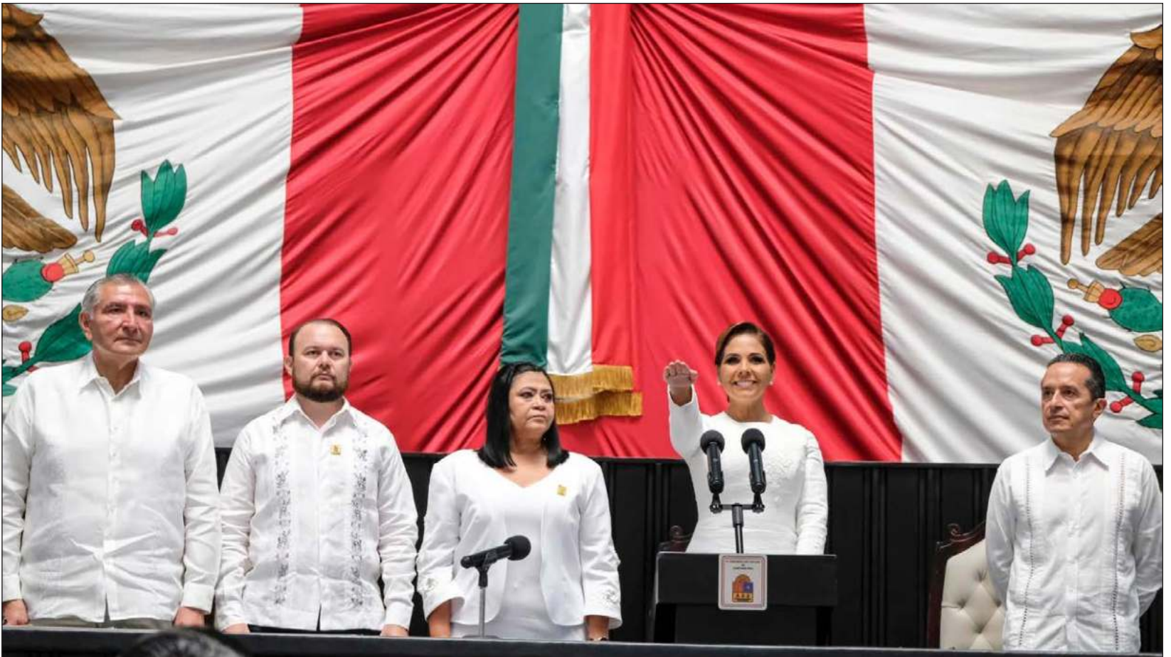
▲ La primera plana nacional y local de Morena arrojó a Mara Lezama, su segunda gobernadora en la península de Yucatán.