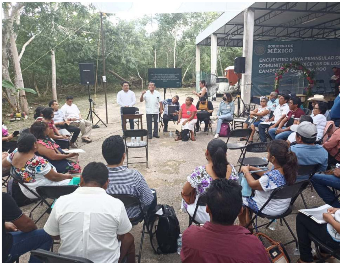
▲ Pese a que se encuentran divididos geográficamente, los mayas peninsulares comparten dolores similares tales como el despojo de tierras, discriminación, falta de acceso a la salud, educación y detenciones arbitrarias.

Otros líderes indígenas, acostumbrados a las luchas sociales, se sienten identificados, como si hubieran esperado escuchar esas palabras para continuar con la defensa de sus territorios.