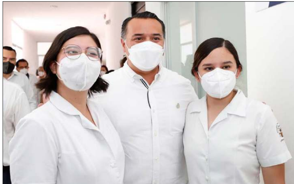
▲ El Centro de Atención Médica a la Mujer ofrece servicios de radiología, de detección de cáncer de mama y cervicouterino, y mastografías.

"A la atención médica, dental y de enfermería, le añadi-