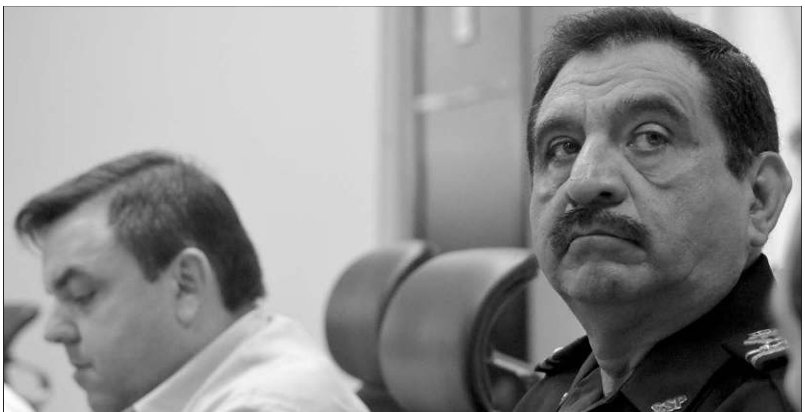
▲ "El comandante Saidén ha sido capaz de establecer una posición de fuerza y disuasión para los órganos de seguridad en el estado desde su nombramiento en el 2007 y la esfera política ha tenido la prudencia y el acierto de respaldarlo y aportarle los elementos básicos para realizar su tarea".