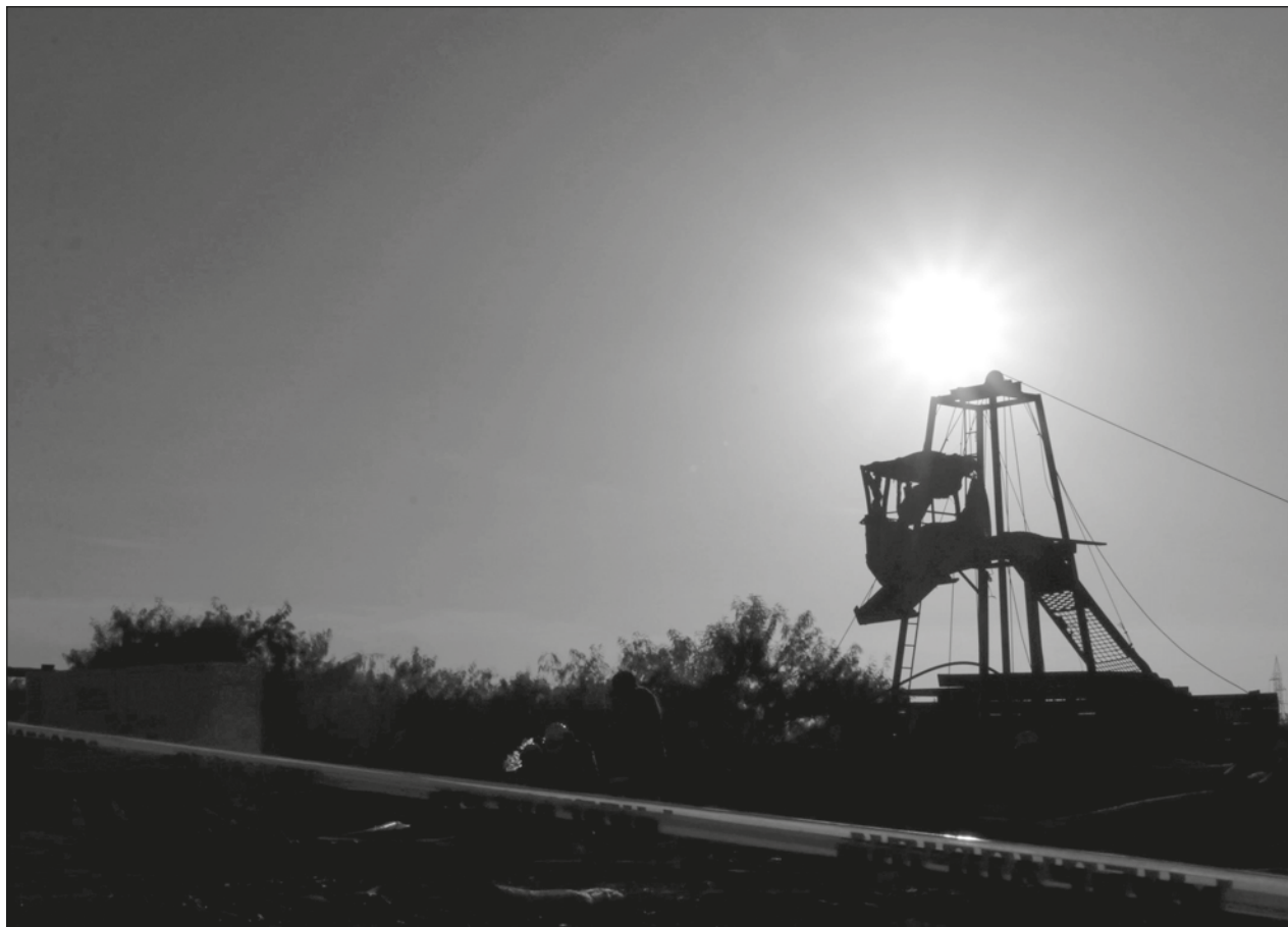
▲ El detenido es acusado de cometer el delito previsto en la Ley General de Bienes Nacionales, que consiste en aprovechar o explotar un bien que pertenece a la Nación, sin haber obtenido concesión, permiso o autorización.

“La Fiscalía General de República continúa con la búsqueda de los otros dos imputados para presentarlos ante la Justicia Federal”, afirmó la FGR.