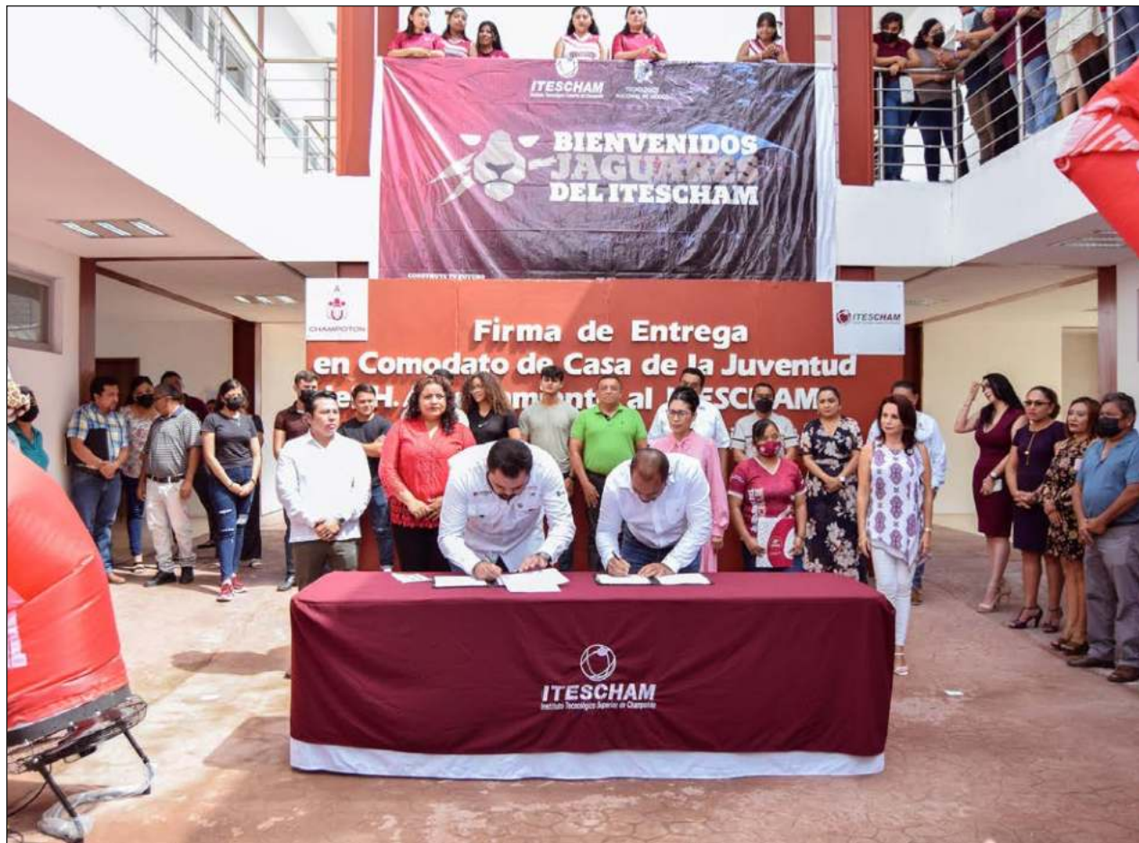
▲ La Casa de la Juventud Indígena permaneció abandonada tres años.

Según Cortés Moo, en el caso del inmueble recuperado, desde hace dos décadas o más aproximadamente, dicho edificio estaba entregado en comodato al PRI para que funcionara como oficinas de la representación municipal del partido, conocidos como Comités Directivos Municipales. Hoy permanece cerrado hasta culminar el proyecto con el gobierno estatal.