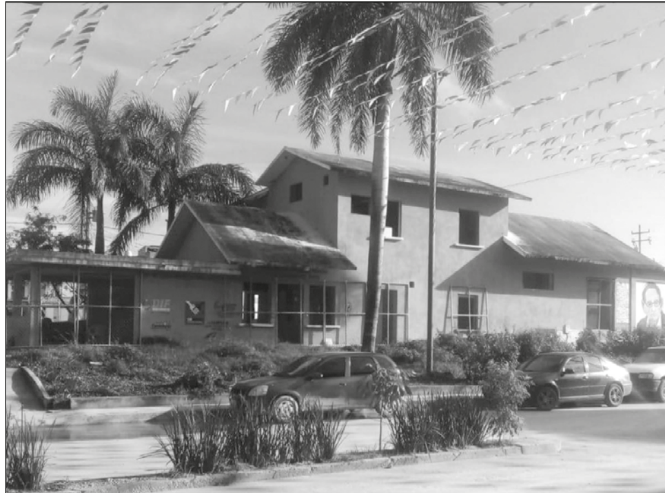
▲ Los cambios sin previo aviso han sido el común denominador en los municipios donde pasan los tres tramos de Campeche; Candelaria forma parte del tramo 1.

Hizo hincapié en que no está en contra del proyecto Tren Maya, al contrario "he sido uno de sus mayores defensores y promotores en Campeche, pero los cambios repentinos y la falta de