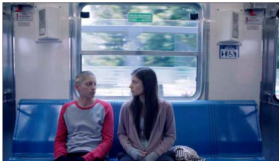
▲ El filme 50 (o dos ballenas se encuentran en la playa) refiere a los retos virales, particularmente uno al cual se le atribuyó la muerte de muchísimos adolescentes en el mundo. Foto Fotograma

Un rasgo característico de ambos personajes es que, explica, en un cierto momento, carecen de cejas, una característica facial que ayuda