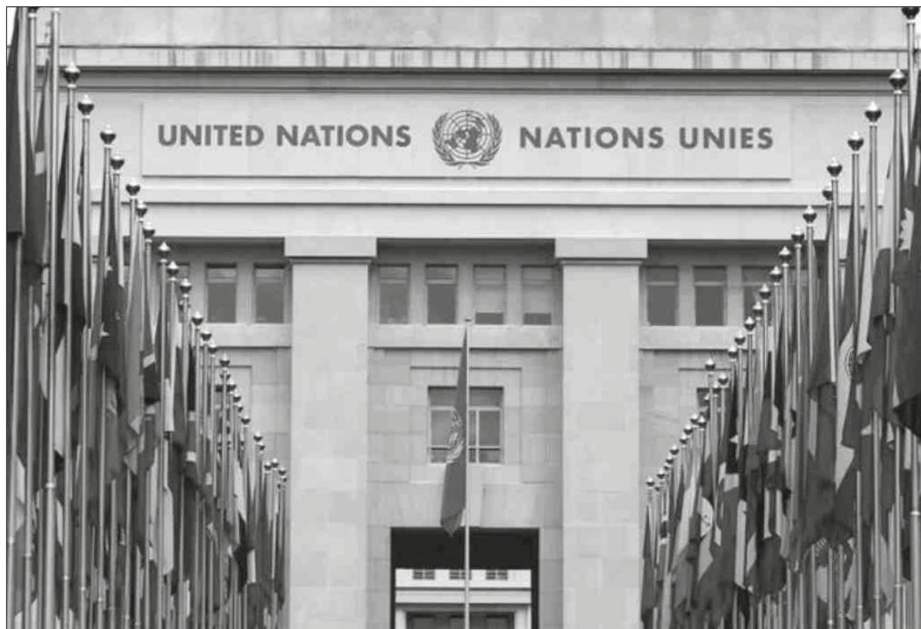
▲ Según los talibanes, las preocupaciones de los países “que no están listos para darle un lugar al gobierno afgano en la ONU, no tienen fundamento”; esto fue dicho en respuesta a declaraciones del primer ministro de Pakistán.

En su discurso, Sharif asecuró que su nación “comparte la preocupación de la comunidad internacional con respecto a la amenaza que representan los principales grupos terroristas que operan desde Afganistán”, en referencia al Estado Islámico de Khorasan, la rama afgana del grupo yihadista; el Takrik-e-Taliban Pakistan, y Al-Qaeda.