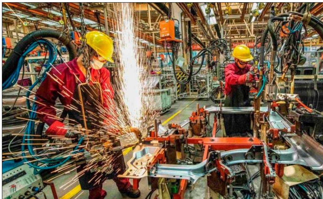
▲ Rogelio Ramírez de la O, titular de Hacienda, anunció la existencia de labores de convencimiento para que 15 grandes empresas trajeran sus actividades a territorio mexicano.

Lo cierto es que se trata de un paso en la dirección correcta para dar nueva vida a un sector con gran potencial, el cual sufrió un severo abandono durante el periodo neoliberal, y cabe desear que se fortalezca con las medidas necesarias a favor del desarrollo y el bienestar de industriales y trabajadores mexicanos.