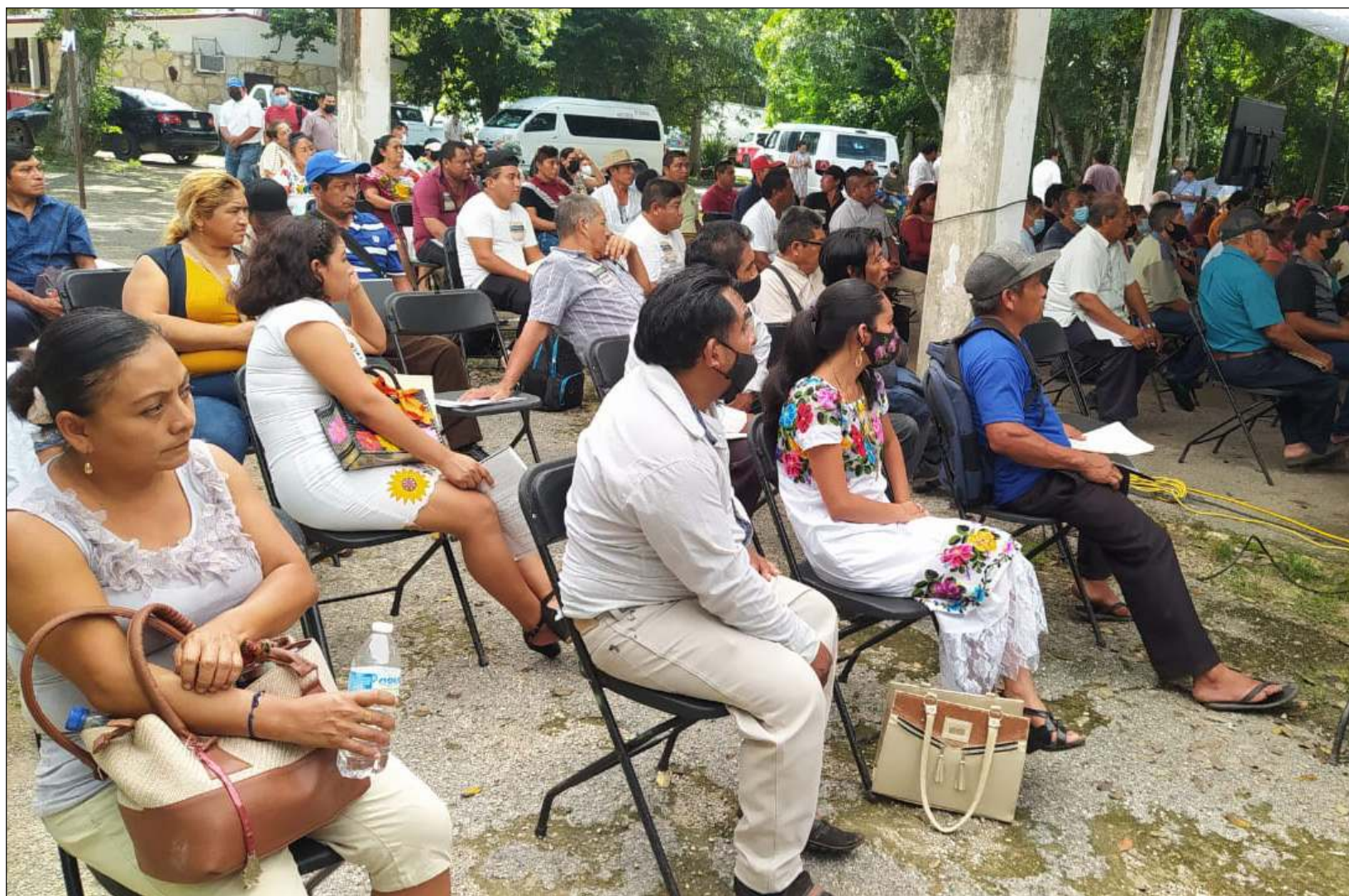
▲ Este fin de semana se llevó a cabo en Valladolid un encuentro organizado por el Instituto Nacional de Pueblos Indígenas, donde líderes comunitarios, comisarios ejidales, y mayas de los tres estados peninsulares abordaron la importancia de defender sus derechos humanos.