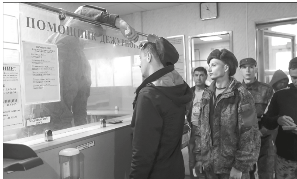
▲ Valeriy Fadeev, presidente del consejo de derechos humanos del Kremlin, citó el reclutamiento de 70 padres de familias numerosas en la región de Buriatia, en el extremo oriental, y de enfermeras y comadronas sin conocimientos militares a pesar de estar exentas.

Su hija publicó un video en las redes sociales que se hizo