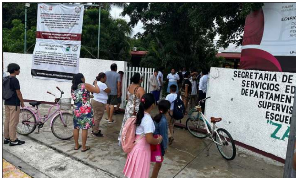
▲ La matrícula en el nivel básico del noveno municipio ya ha superado los 15 mil estudiantes, cifra que refleja la demanda educativa en este destino.

“La fecha límite para completar este trámite es el miércoles 28 de agosto, después de lo cual los padres de familia que no hayan