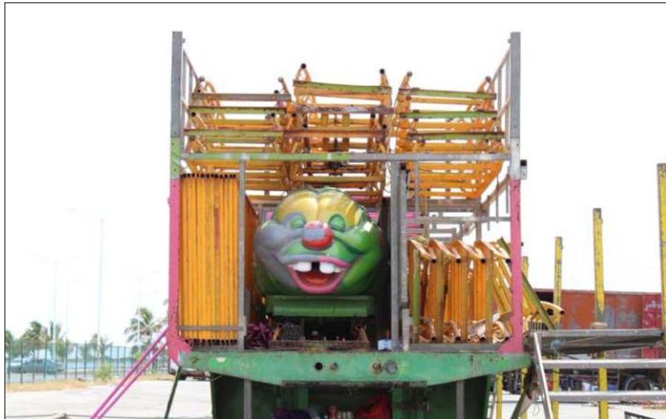
▲ El empresario que este año levantó la mano para administrar las ferias estaba cobrando a los pequeños comerciantes 105 mil pesos por el espacio de 30 metros lineales.

Al dialogar con él -por que no quiso decir su nom-