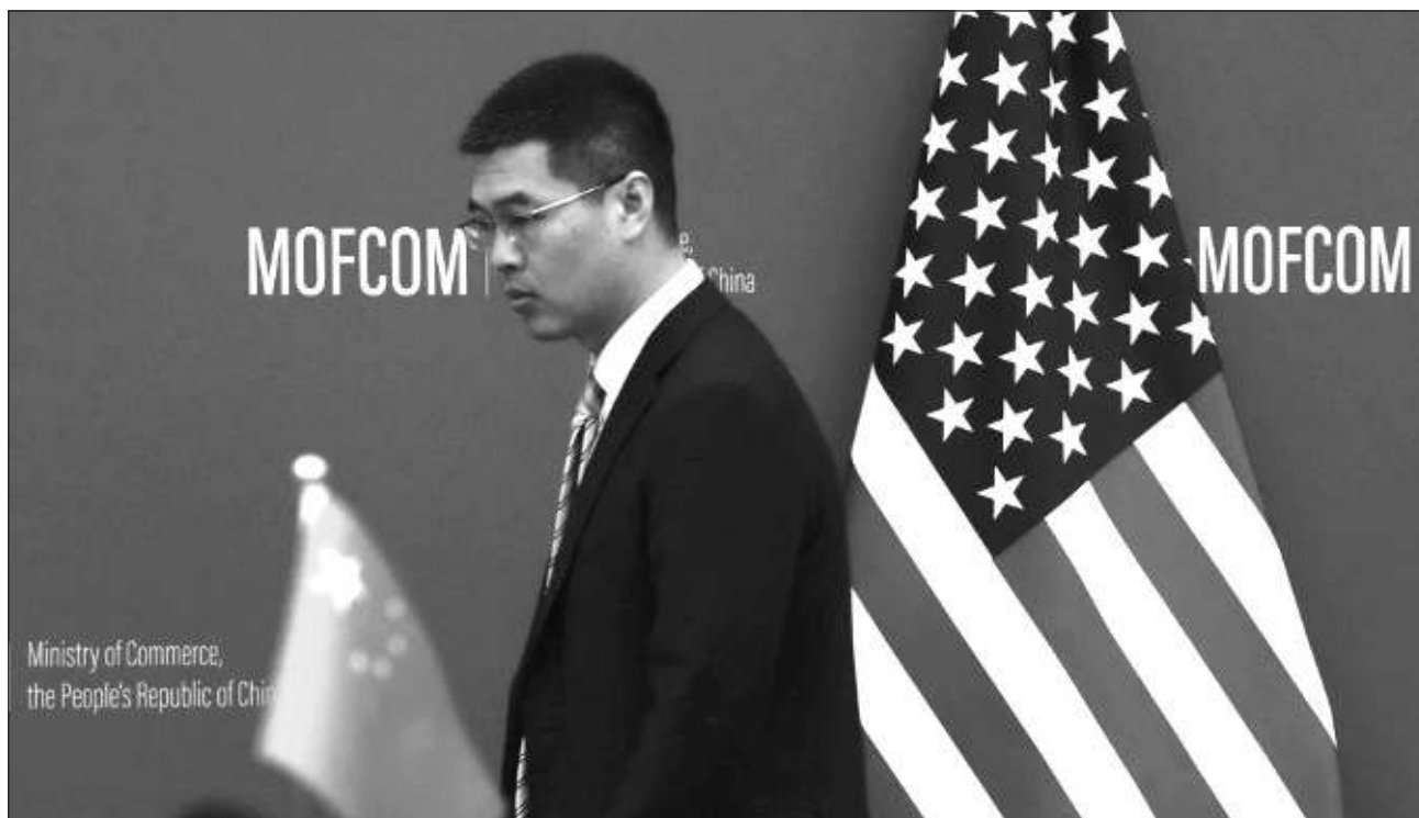
▲ El Ministerio de Comercio de China señaló que la medida de Estados Unidos son "sanciones unilaterales típicas" que alterarán los órdenes y las reglas comerciales globales y afectarán la estabilidad de cadenas industriales y de suministro en el mundo.

En su comunicado, el Ministerio de Comercio de China se opuso firmemente a que Estados Unidos incluyera varias empresas chinas en su lista de control de exportaciones. La medida prohíbe a dichas empresas comerciar con empresas estadounidenses sin obtener una licencia especial que es casi imposible de obtener.