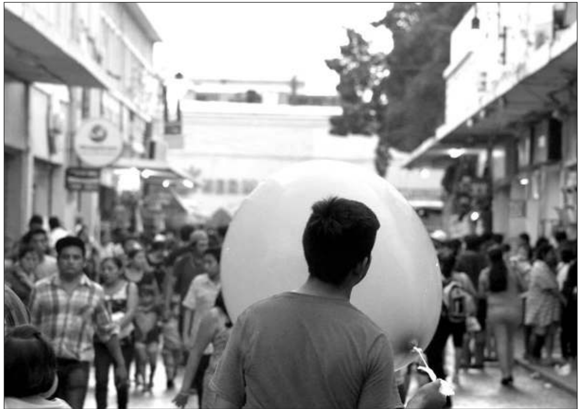
▲ "Para combatir el odio hace falta gente de buena fe y ésta se puede cultivar a partir de una política donde prevalezca la solidaridad y el sentido comunitario, algo que, con una figura como la de Jorge, apoyada por un amplio y diverso grupo de ciudadanos, se convierte en una posibilidad interesante".

Mirar lo que está pasando en nuestro país con los mismos ojos con que mirábamos el pasado,