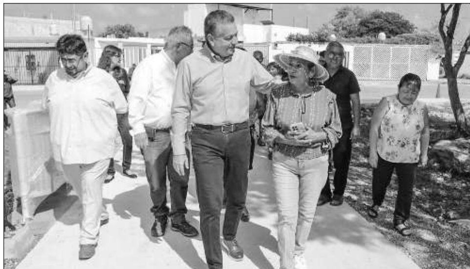
▲ Las vecinas agradecieron al ayuntamiento por la construcción y rehabilitación de los parques de la ciudad, sobre todo por realizar estas obras en conjunto con la sociedad.

"La mejor Mérida la hacemos todos los días trabajando en la infraestructura urbana, llevando los servicios públicos a todos los puntos de la ciudad y comisarías", afirmó el presidente municipal durante la supervisión del avance de uno de los parques que forman parte de las 19 obras ganadoras del concurso Diseña tu Ciudad , donde las y los ciudadanos eligieron los