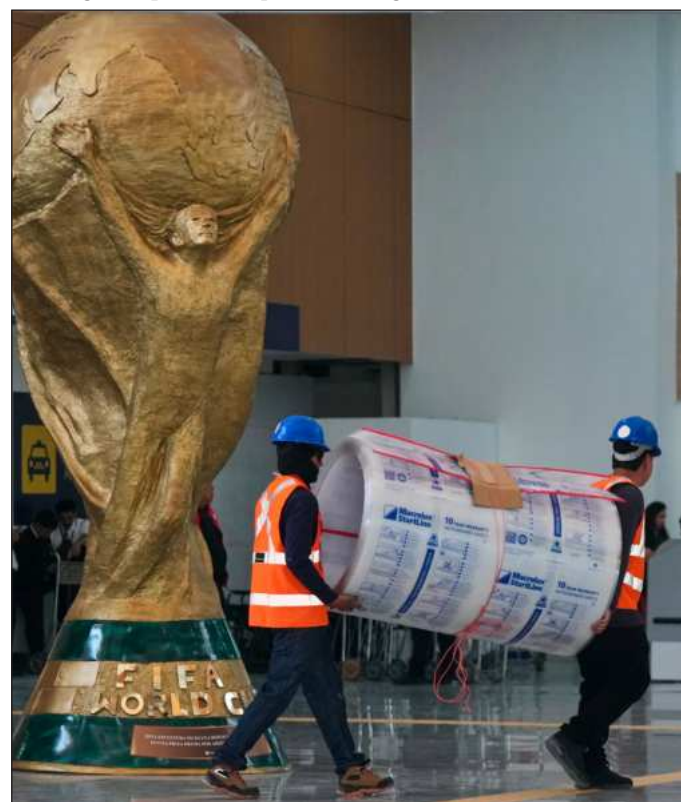
▲ Basta con tener dinero suficiente, ya no importa qué ocurra en la cancha, sino el poder proclamar en redes sociales "¡Yo sí estoy aquí!". Foto Ap

La afición futbolera mexicana está cuestionando precisamente ese modelo, al buscar opciones distintas a las plataformas controladas por la FIFA. De alguna manera, lo asociado en este momento al tercer Mundial que se celebra en el país tiene la sensación de ser algo ajeno y donde los habitantes no tienen cabida. Desde el intento por concluir anticipadamente el año escolar invocando al evento, hasta la criticada "ajolotización" de la Ciudad de México, y ahora la negativa a poder ver los partidos donde mejor parezca. La afición encuentra que se le niega el disfrute de su deporte favorito, y entonces éste puede dejar de ser negocio.