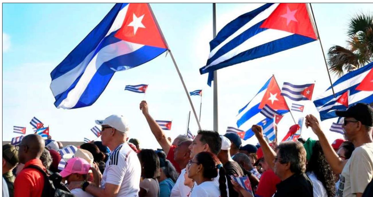
▲ Cuba, bajo embargo estadounidense desde 1962, enfrenta una grave crisis económica y energética.

"Resta objetividad y denota un marcado doble rasero no reconocer que el ilegal, cruel e injusto castigo colectivo que el gobierno de Estados Unidos impone al pueblo cubano, con un reforzamiento sin precedentes del bloqueo, el cerco petrolero y la amenaza militar, constituyen las principales causantes de la difícil situación que enfrentan hoy los cubanos", respondió en X el canciller de