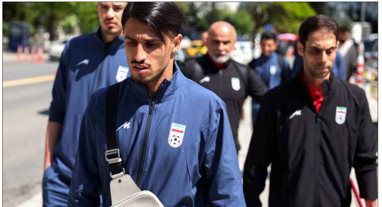
▲ Sheinbaum señaló que la FIFA expuso al gobierno mexicano que los juegos de Irán se mantienen en el país vecino

"Estados Unidos no quiere que la selección (iraní) se quede a pernoctar en ese país"