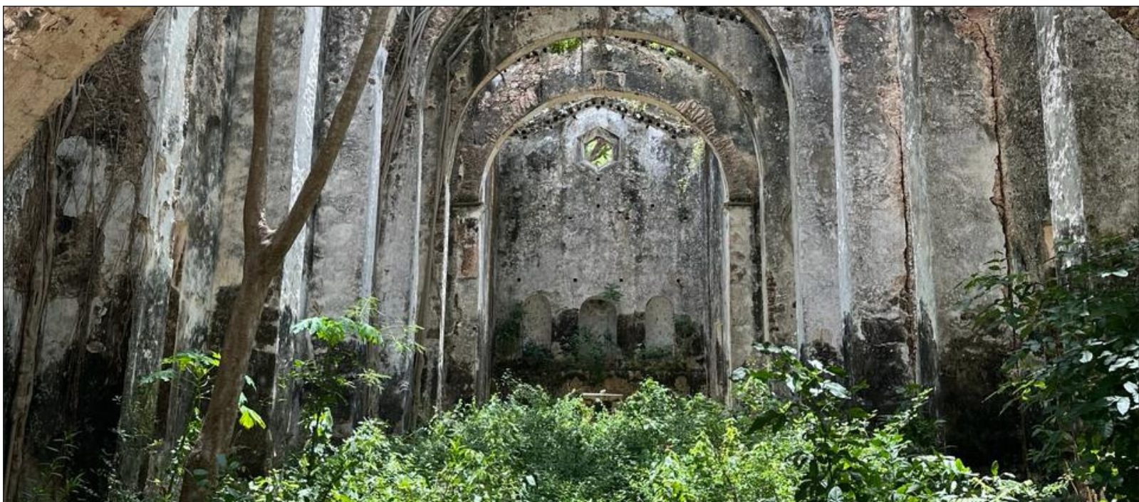
▲ "Desde construcciones de tierra hasta edificaciones con elementos pétreos, acabados y agregados, la arquitectura ha conformado el diseño, la estética, así como las expresiones de poder y agencia de las sociedades; es aquí donde la arqueología cobra relevancia".