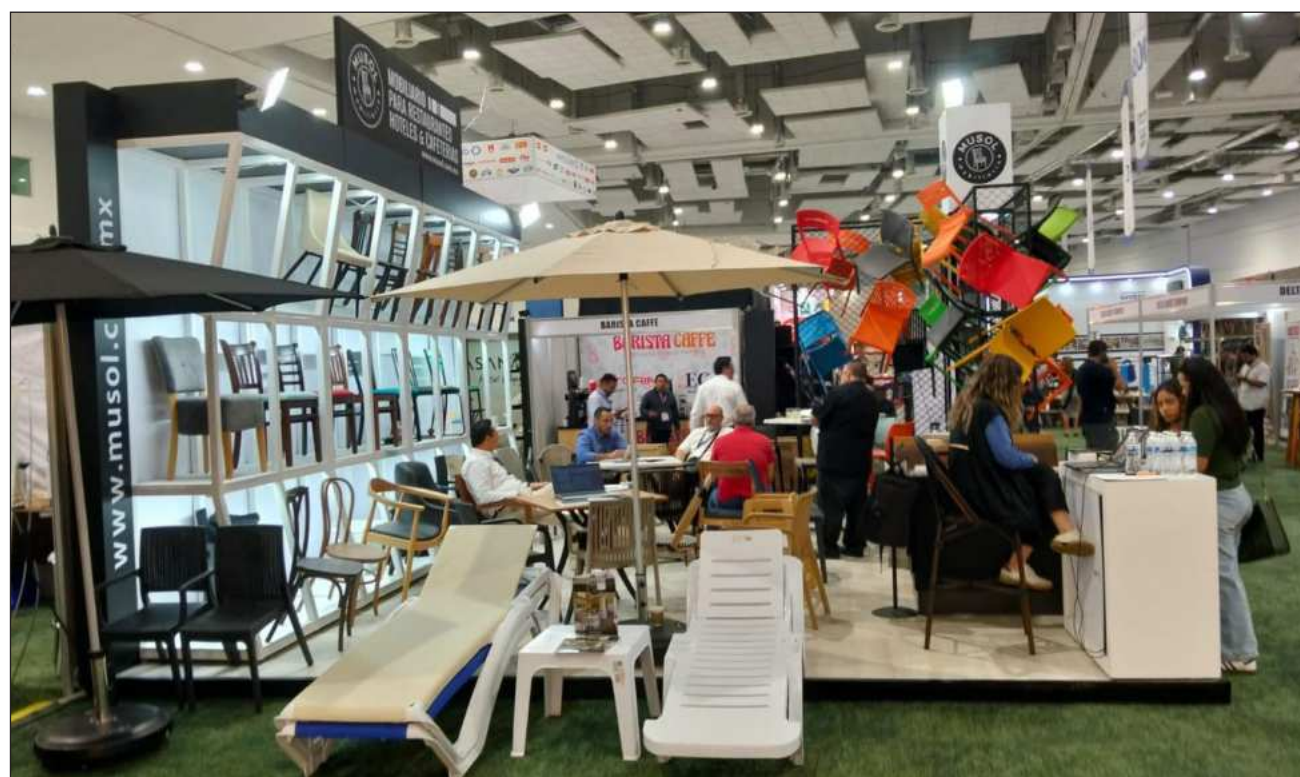
▲ Los proveedores son quienes suministran alimentos, químicos y servicios básicos a la industria hotelera.

Esta fragmentación administrativa obliga a las empresas a gestionar múltiples trámites individuales ante