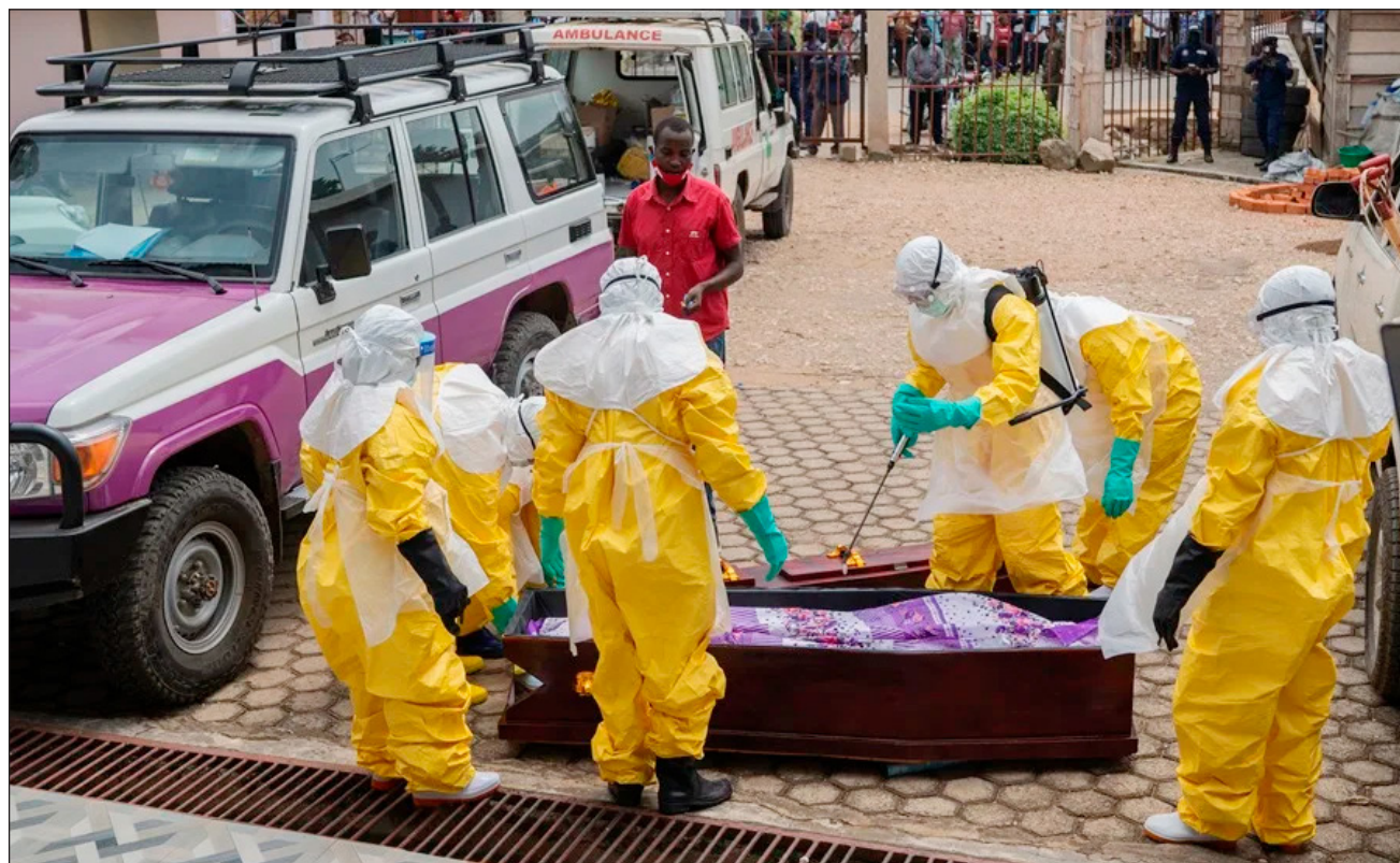
▲ “Estamos ampliando urgentemente las operaciones, pero la epidemia nos supera”, reconoció el jefe de la OMS.

Tedros también recordó que las provincias de Ituri y Kivu del Norte, ambas en el