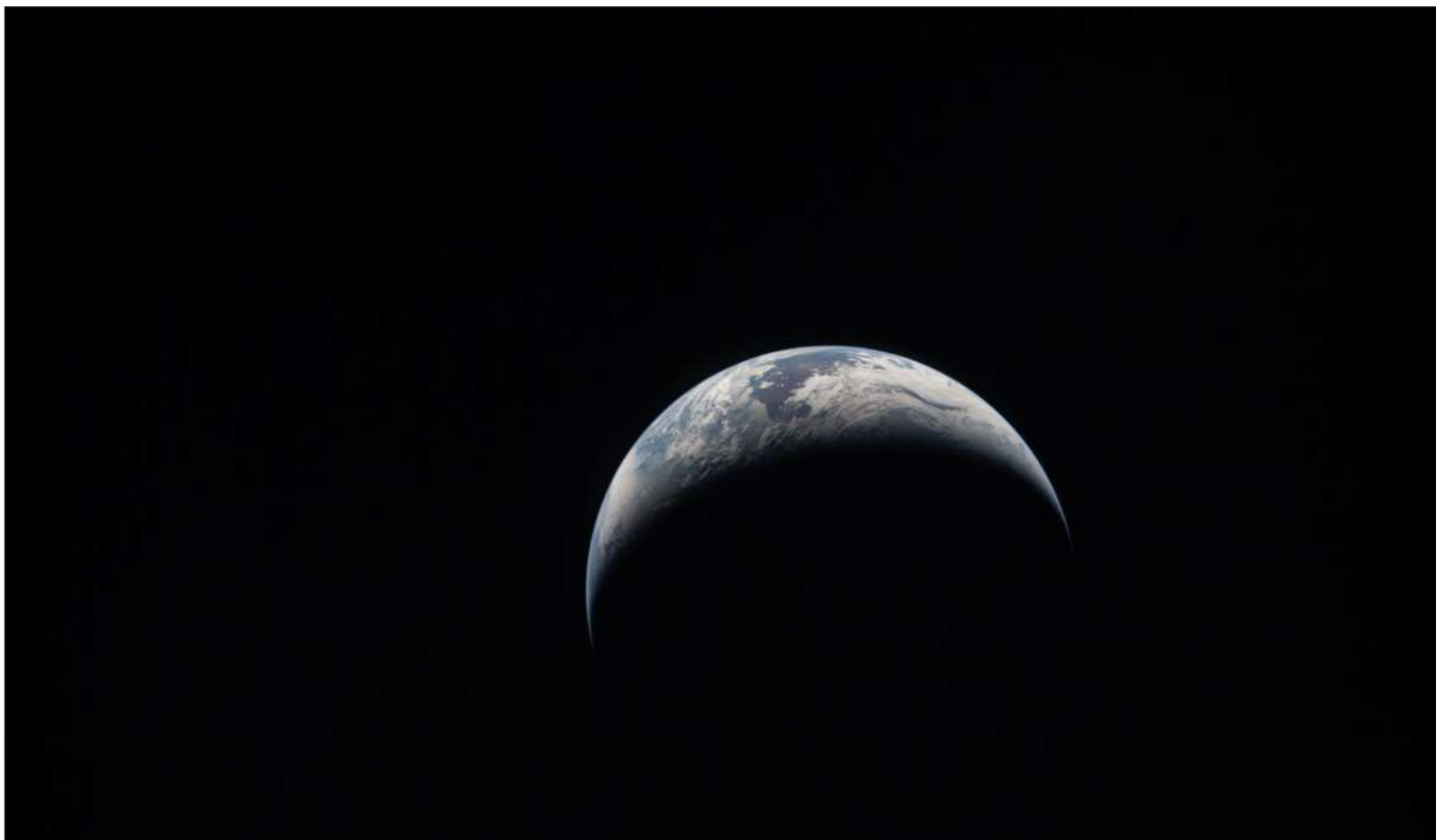
▲ “La iniciativa de ‘Un planeta, una salud’ no es ajena a las críticas. Entre otras, destaca la pregunta ¿cómo se va a financiar? También está el temor a una manipulación”.