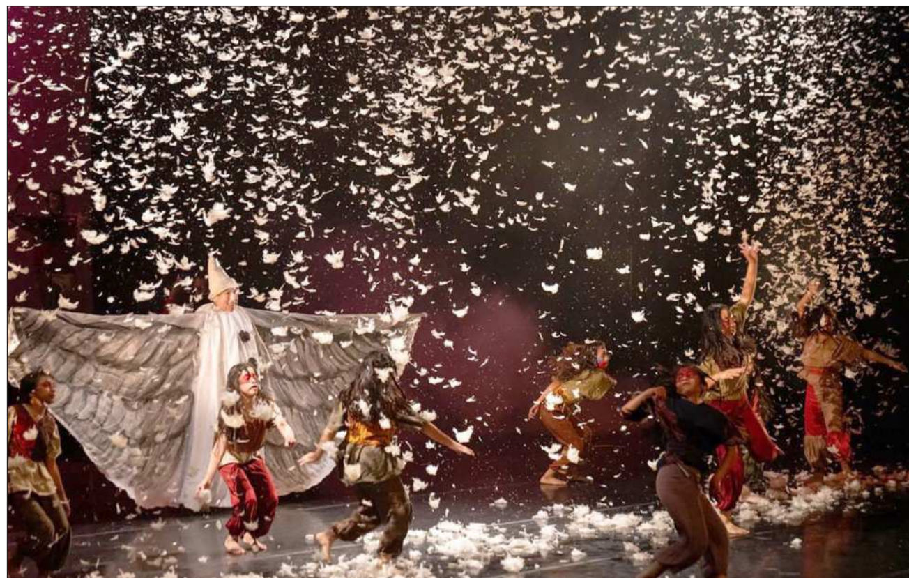
▲ "Gracias por creer que los niños y las niñas son la transformación de este país", destacó la coordinadora nacional.

"Nos parecía central que hoy pudiéramos hacer esta