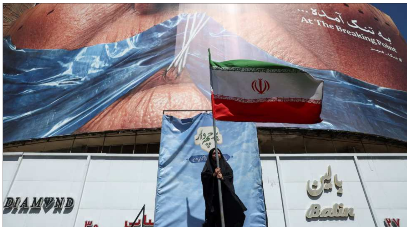
▲ Irán advirtió que todavía no está cerca de llegar a un acuerdo de paz con EU, aunque se han logrado avances.

Después, el mandatario instó en un mensaje en las