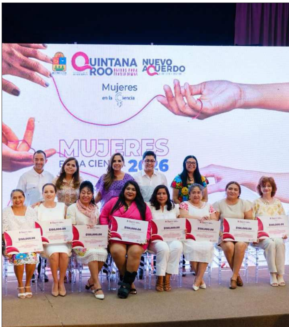
▲ Cada uno de los 10 proyectos del programa Mujeres en la Ciencia 2026 recibe 150 mil pesos de financiamiento, beneficiando a un total de 85 investigadoras.