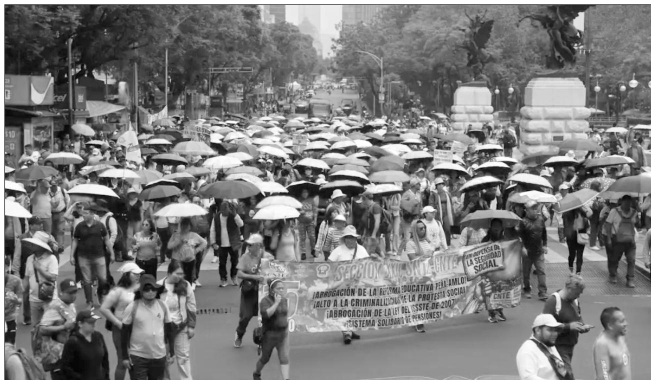
▲ Integrantes de la CNTE realizan una manifestación sobre Paseo de la Reforma con destino al Zócalo.

Concentrados desde muy temprano, salieron del Ángel de la Independencia rumbo al Zócalo capitalino, donde pretendían instalar un plantón permanente, lo cual no fue posible debido una valla policial que impidió el paso a