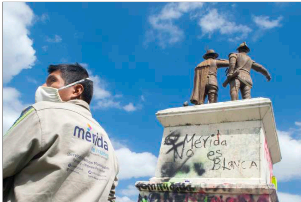
▲ Organizaciones solicitan que las autoridades municipales reconozca que el monumento a representa un símbolo de racismo, clasismo y violencia histórica contra el pueblo maya.

Sin embargo, en marzo de 2025, el ayuntamiento a través de la Dirección de Desarrollo Urbano respondió sin fundamento que no podían retirar el monumento por-