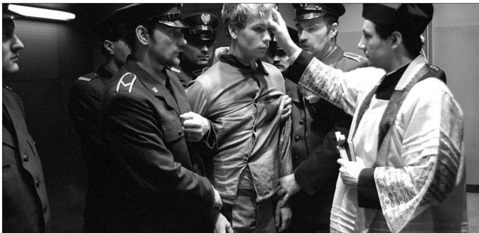
▲ La elaboración del argumento de la inquietante No matarás (1987) parte de varios hechos reales testificados por el propio Kieslowski con su cámara. Fotograma

La retrospectiva de Kieslowski finaliza el 31 de mayo en varias salas de la Cineteca Nacional Xoco.