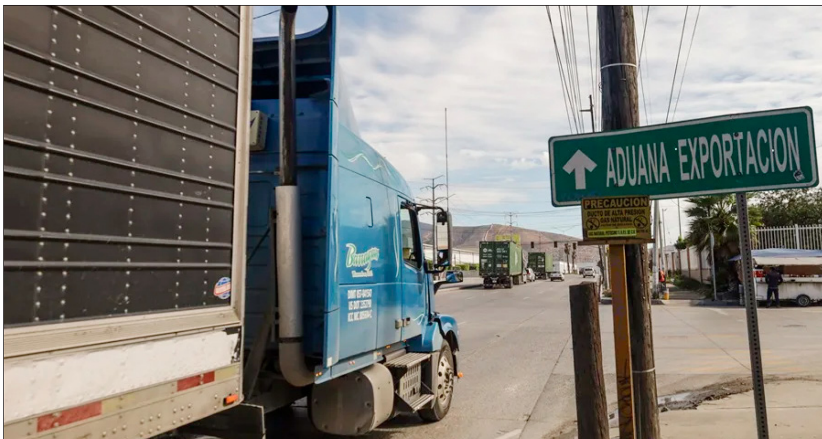
▲ En el periodo enero-abril de 2026, el valor de las exportaciones totales sumó 247 mil 628 millones de dólares, que significó un crecimiento anual de 21.8 por ciento.

Así, México registró un superávit comercial de 4 mil 520 millones de dólares. Dicho superávit se compara con el de 5 mil 932 millones de dólares reportado en marzo pasado. Para el primer cuatrimestre de 2026, la balanza comercial presentó un superávit de 3 mil 508 millones de dólares. En el mismo periodo de 2025 reportó un déficit de 314 millones de dólares.