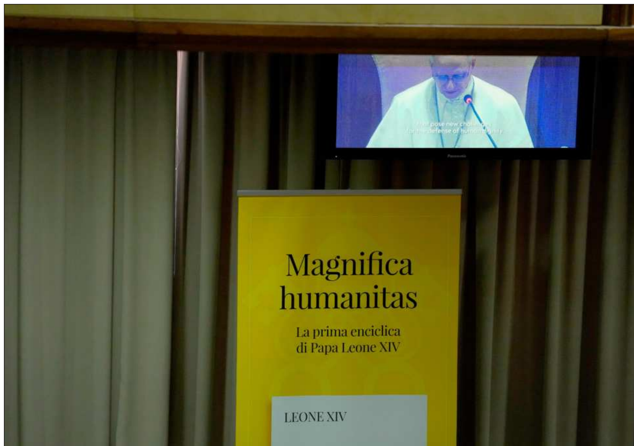
▲ “Necesitamos que más sectores del mundo hagan lo que Su Santidad ha hecho aquí: tomarse esto en serio, observar de cerca y empujar los acontecimientos en una mejor dirección”, apuntó el cofundador de Anthropic, Christopher Olah.

En un texto metódico, el Papa, licenciado en matemáticas, recorrió la historia de la doctrina social de la Iglesia católica y aplicó conceptos como justicia, solidaridad, dignidad del trabajo y destino universal de los recursos a la revolución digital.