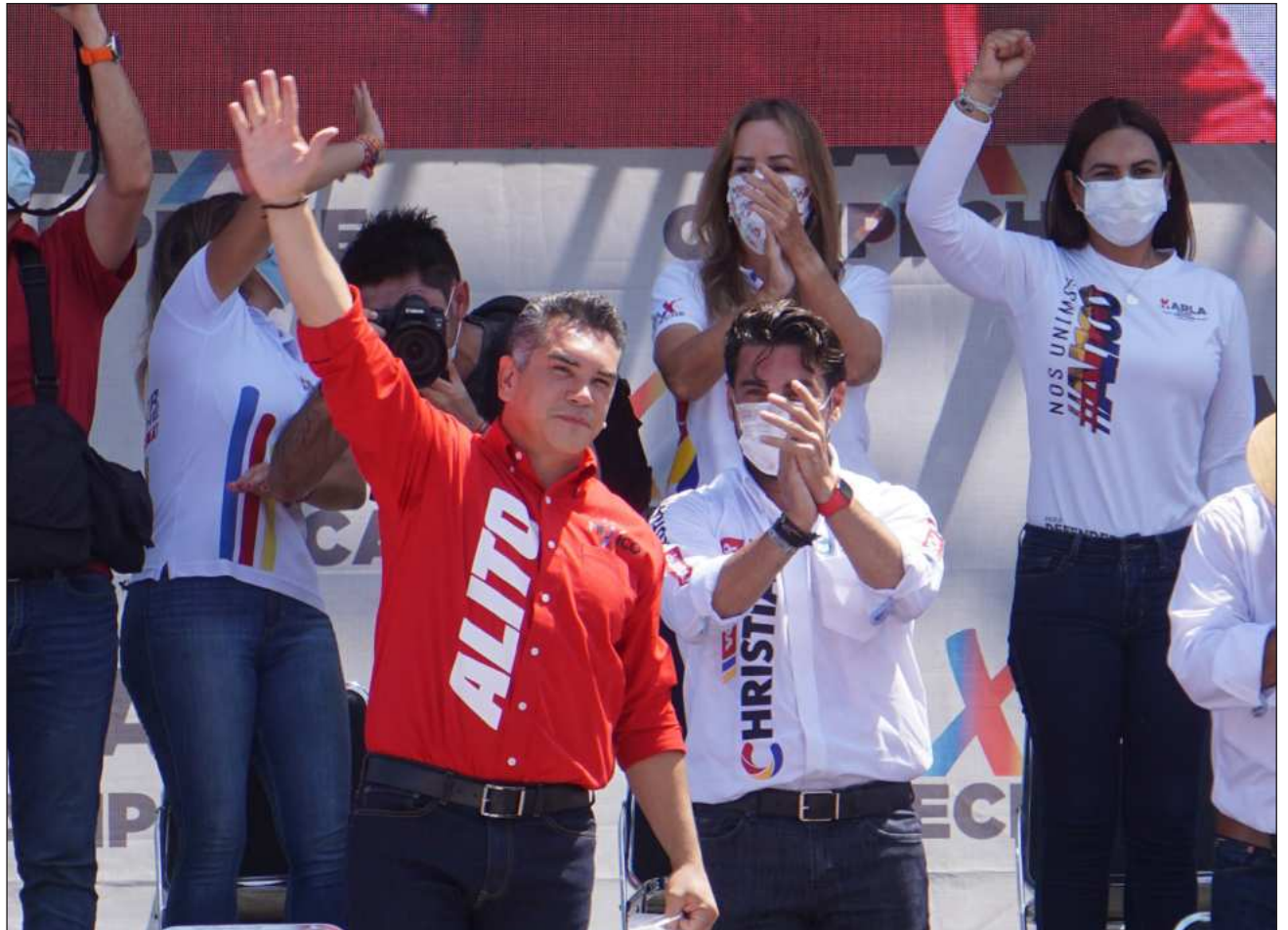
▲ Al no prosperar el proceso legal contra Alito , la mandataria consideró que ya corresponde a facultades de la FGR.

Sin embargo, dijo que al no prosperar el proceso