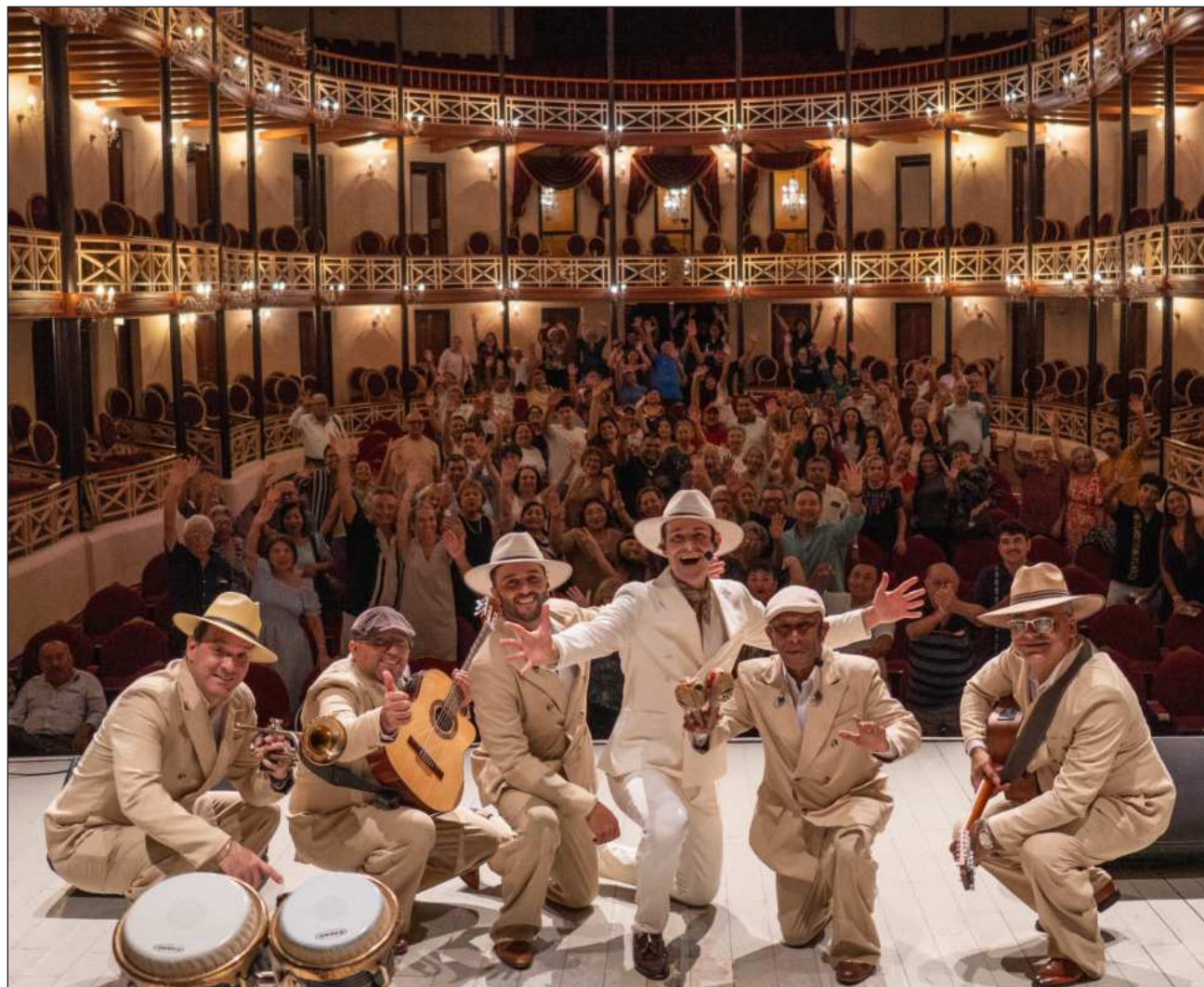
▲ Los asistentes conocerán las historias de las canciones mientras disfrutan de interpretaciones en directo.

Asimismo, indicó que Protección Civil de Tulum mantiene coordinación permanente con distintas dependencias municipales y con autoridades estatales, con el propósito de trabajar bajo la misma estrategia y compartir información actualizada sobre prevención y atención de emergencias.