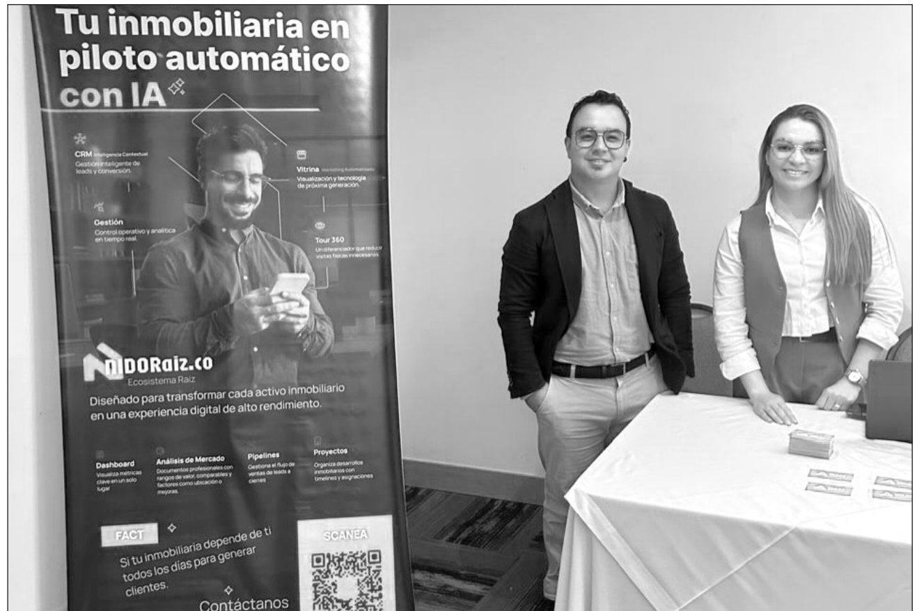
▲ La novena edición del Pro Tech Latam Summit Week abordará la transformación tecnológica del sector.

“Las reglas del juego están siendo rescritas por la tecnología, por nuevas formas de habitar, de construir, de