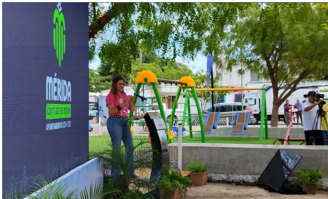
▲ “Tengan confianza en este gobierno que saca adelante a la ciudad”, subrayó la alcaldesa.

“El lanzamiento de este proyecto me permite decirles a todas las y los meri-