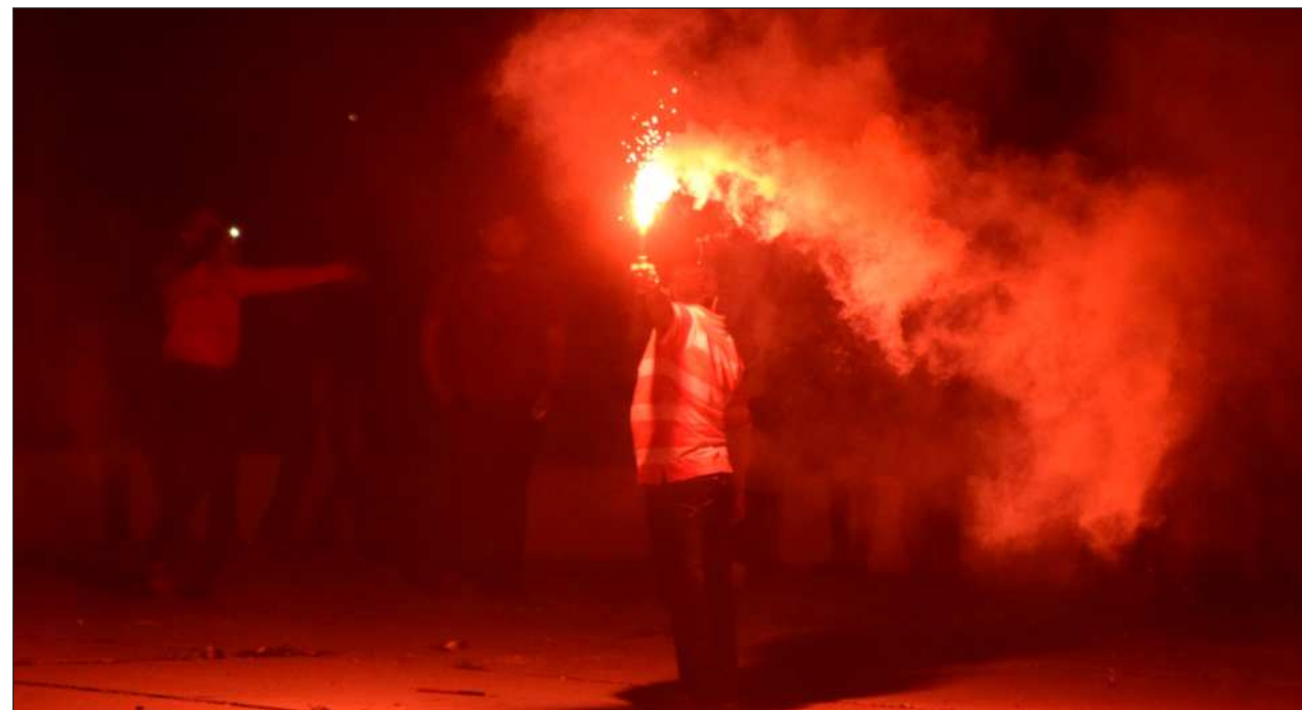
▲ Muchas de las celebraciones patronales se encuentran protegidas por la ley de usos y costumbres.

El funcionario recordó que recientemente hubo celebraciones en Calkiní, y recibieron denuncias, que no fueron ratifica-