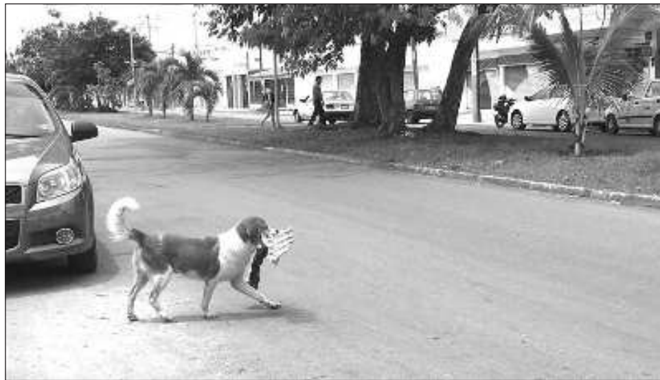
▲ Ofrecerán cena y subasta con causa pro animal en Puerto Morelos.