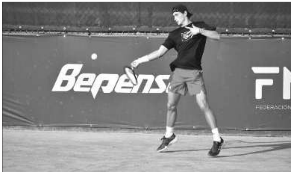
▲ Todo está listo para el comienzo de la 37a Copa Yucatán en el Club Campestre.

Se espera que el debut de Kostovic sea el martes.