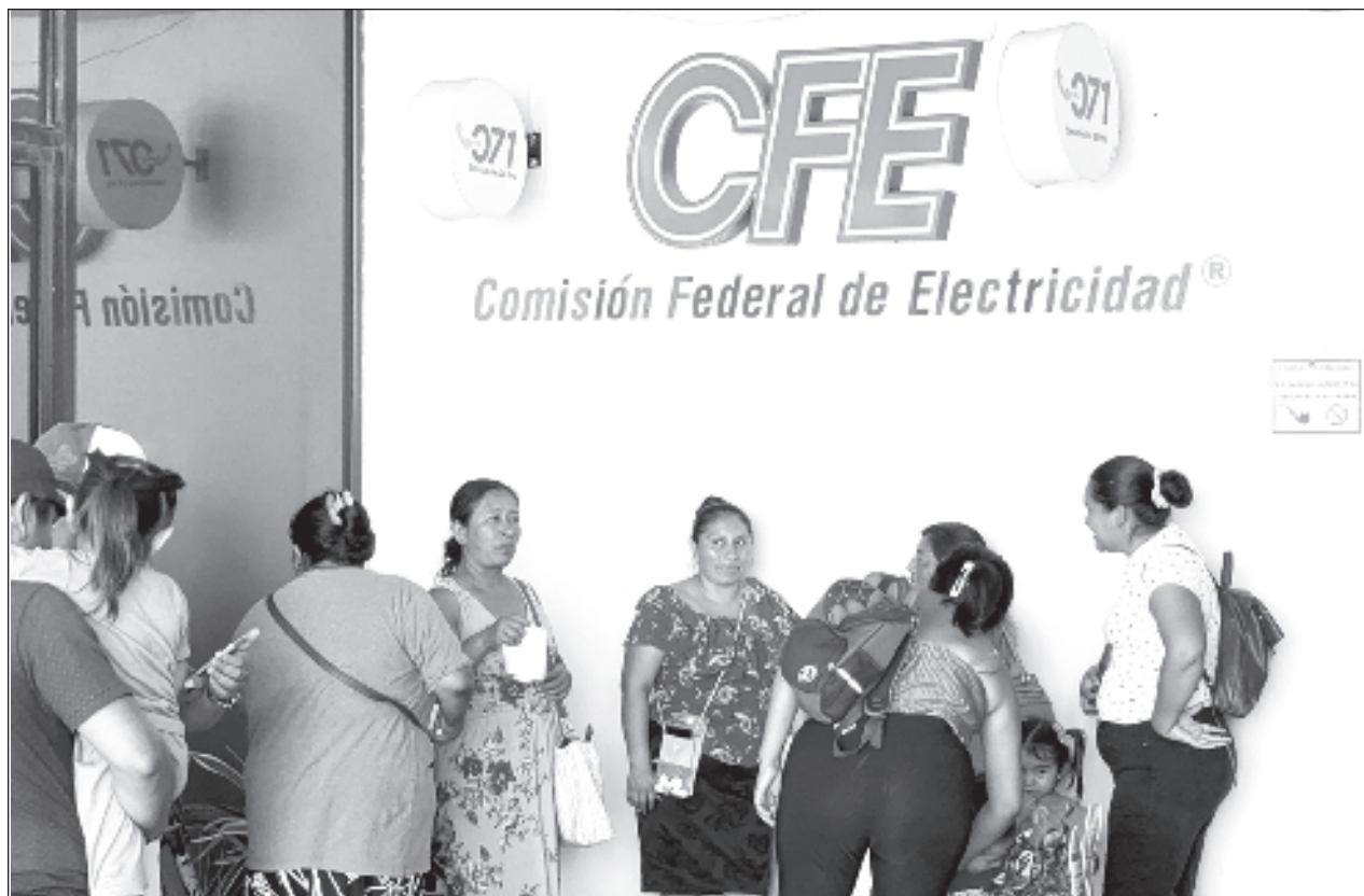
▲ A las y los afectados les llegó un recibo por 180 mil pesos hace seis meses y desde entonces se han ido acumulando los cobros por este monto, razón por la que ya se habían manifestado ante la falta de atención al tema.