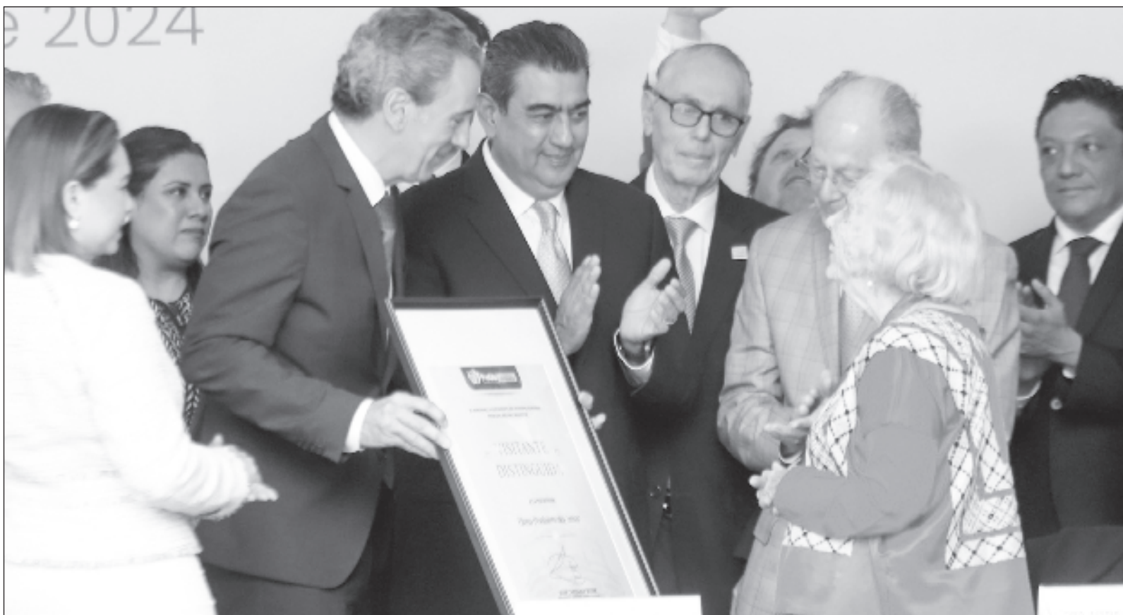
▲ “Al director del Instituto Nacional de Astrofísica Óptica y Electrónica, Guillermo Haro Barraza, le daría un sentimiento especial de agradecimiento y de alegría esta presea que ustedes me conceden, porque él, astrónomo, amó a Tonantzintla y a Puebla como a su vida”, señaló Elena.

Hoy, 20 de noviembre de 2024, resulta emocionante recordar el 114 aniversario de la Revolución Mexicana y encontrarnos en esta mañana en la Puebla de los Ángeles, en cuyo zócalo y bajo cuyos faroles los amigos de Guillermo Haro paseamos tantos viernes y sábados, así como nos abrían la puerta de la maravillosa capilla de Santa María Tonantzintla, cuyos ángeles han sabido cubrir con sus alas la cabeza de hombres y mujeres leales al conocimiento humano.