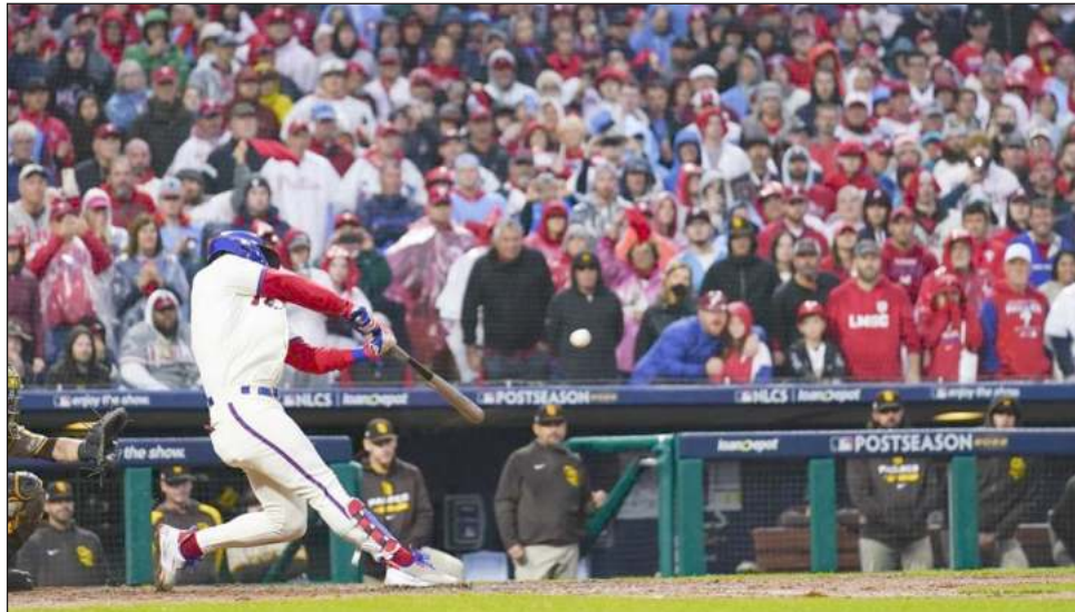
▲ Bryce Harper, el Jugador Más Valioso de la Serie de Campeonato de la Liga Nacional.

Los Astros tienen marca de 7-0 en estos playoffs después de barrer en cuatro juegos a los Yanquis de Nueva York en la final de la Liga Americana. El sencillo de la ventaja de Alex Bregman fue