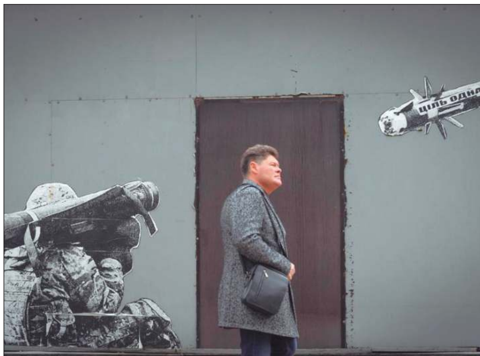
▲ Kiev ha rechazado el señalamiento del ministro de Defensa ruso, Sergéi Shoigu, del posible uso de una “bomba sucia” en el propio territorio ucraniano.

un artefacto nuclear sino una bomba convencional envuelta en materiales radioactivos destinados a ser diseminados en forma de polvo durante la explosión.