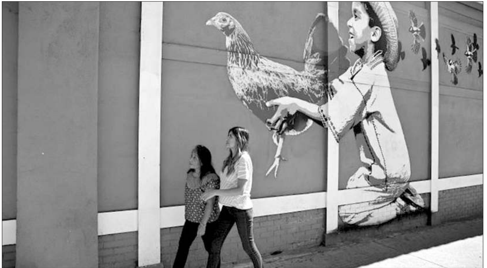
▲ “En México el racismo es muy fuerte, pero como señalan Camhaji, Coronó y Serrano, sencillamente no se quiere ver”.