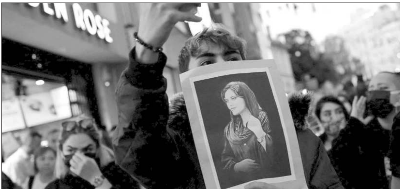
▲ "Today, Iran is again in upheaval. Women and, especially, girls, are demonstrating and being killed daily in the streets of the country".