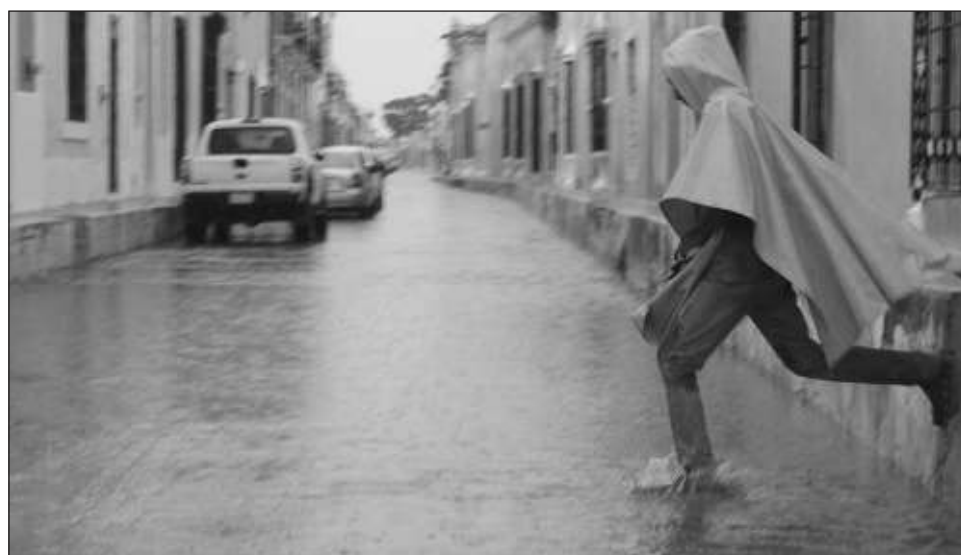
▲ Desde el miércoles 18 se presentó una fuerte lluvia considerada como atípica que obligó a suspender las clases ese día y el siguiente, sin afectar el plan de estudios.

Explicó que durante el pasado martes 18 de octubre se presentó una fuerte lluvia,