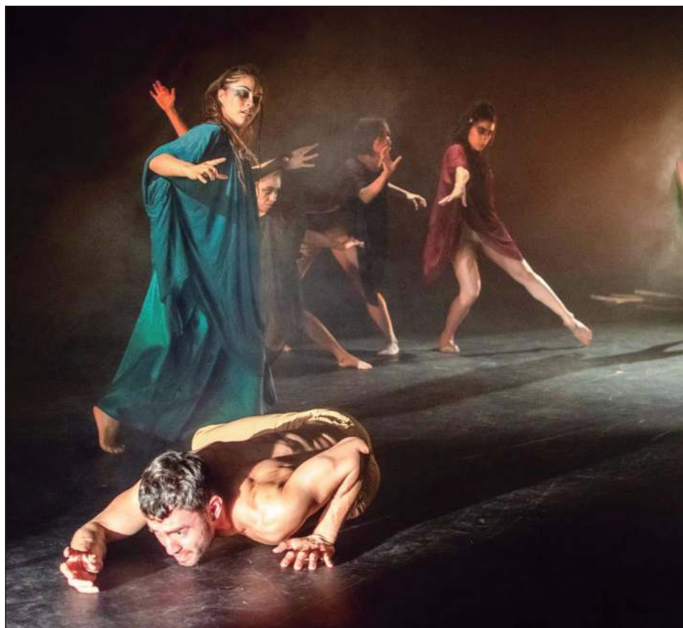
▲ La obra dancística relata la historia de una familia en el México colonial asentada en las orillas de un bosque de encinos en Guanajuato.

Las funciones son el 28 y 29 de octubre en el Centro Universitario Cultural, ubicado en Odontología 35, Copilco Universidad, Coyoacán. Los boletos están a la venta en https://filarmonicadelasartes.com.mx/boletos#oct