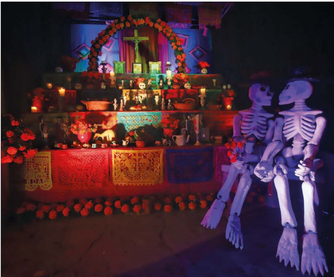
▲ El concurso de altares se realizará el 29 de octubre a las 17 horas en las instalaciones del planetario.

De igual forma, invitó a la ciudadanía de Tulum a que visite y compare los precios de todas las tiendas que presentarán el logo distintivo por El Buen Fin.