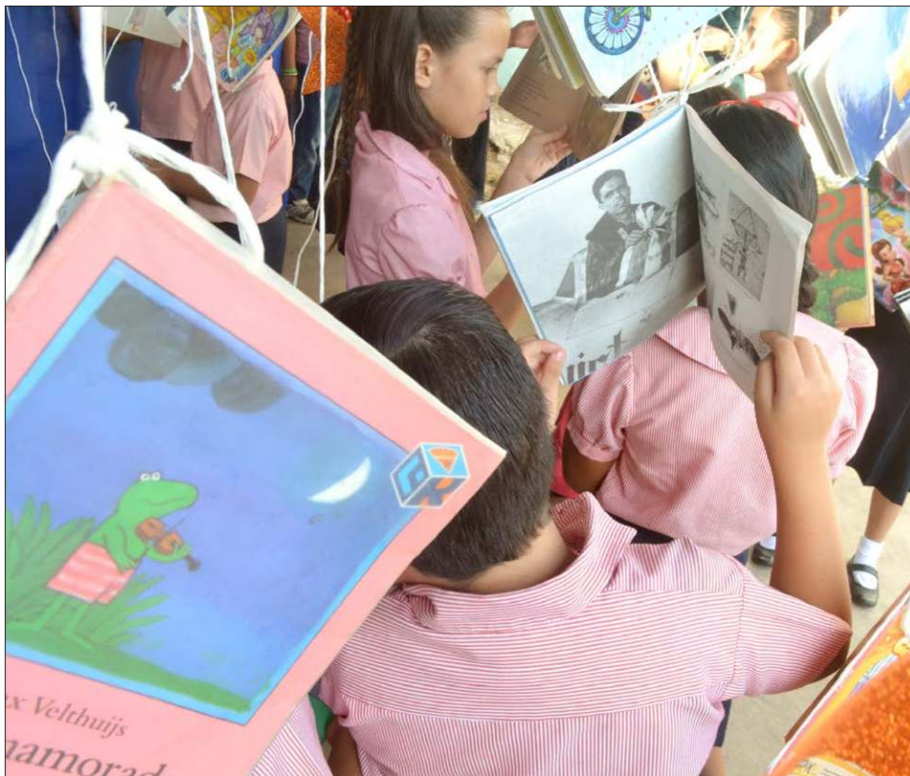
▲ “En definitiva, la perspectiva de que la ciencia es condicionada por elementos culturales tiene argumentos sólidos que, sin embargo, no la demeritan. Por ello, afirmé que la concepción filosófica de la ciencia es un debate abierto”.

En relación a los ejemplos que ofrecí en el artículo referido, voy a argumentar