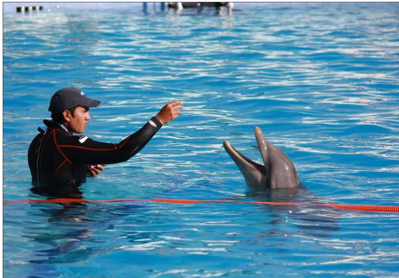
▲ De acuerdo con la Asociación Mexicana de Hábitats para la Interacción y Protección de Mamíferos Marinos, se está cometiendo un grave error, al haber hecho una iniciativa en la que no fueron escuchados especialistas.