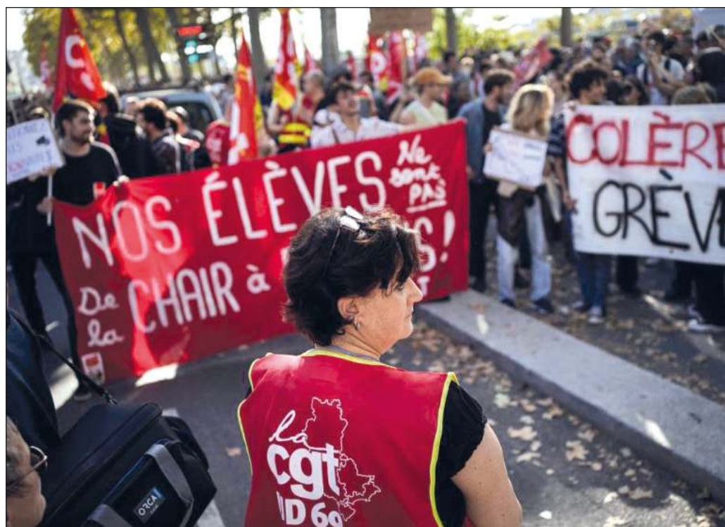
▲ Francia se encuentra convulsionada por un nuevo ciclo de protestas sociales y huelgas en demanda de incrementos salariales para paliar la inflación. En imagen, paristas en Lyon.

Por añadidura, el paradigma de democracia parlamentaria representativa también ha perdido respaldo de importantes sectores de la sociedad y en la mayor parte de las naciones europeas la política es vista como un juego excluyente de clanes, tecnocracias y oligarquías que margina, golpea y reprime a minorías nacionales y a mayorías laborales. Lamentablemente, no queda claro de qué manera podría Europa superar la crisis multifactorial en la que se encuentra. Y mientras tanto, el invierno se aproxima.