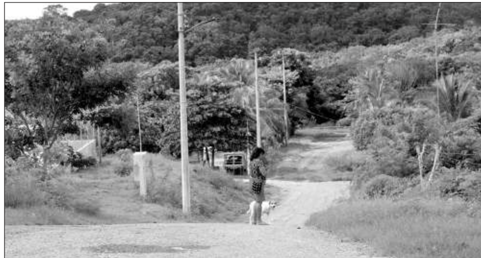
▲ Comunidades en Oaxaca y Michoacán han logrado su autonomía y hoy gestionan sus propios recursos, refirió el coordinador general de Planeación del INPI. En la imagen, aspecto del poblado de San Antonio Ebulá, en Campeche, donde sus habitantes piden la construcción de calles.

El funcionario indicó que pueden acercarse a la dependencia para que les apoyen en las gestiones y