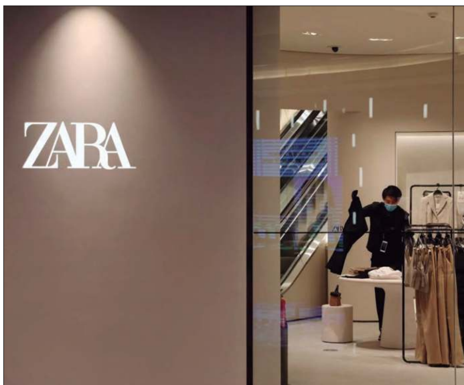
▲ Árabes israelíes y palestinos difundieron videos en las redes sociales en los que quemaban ropa de la marca Zara como protesta contra la extrema derecha.