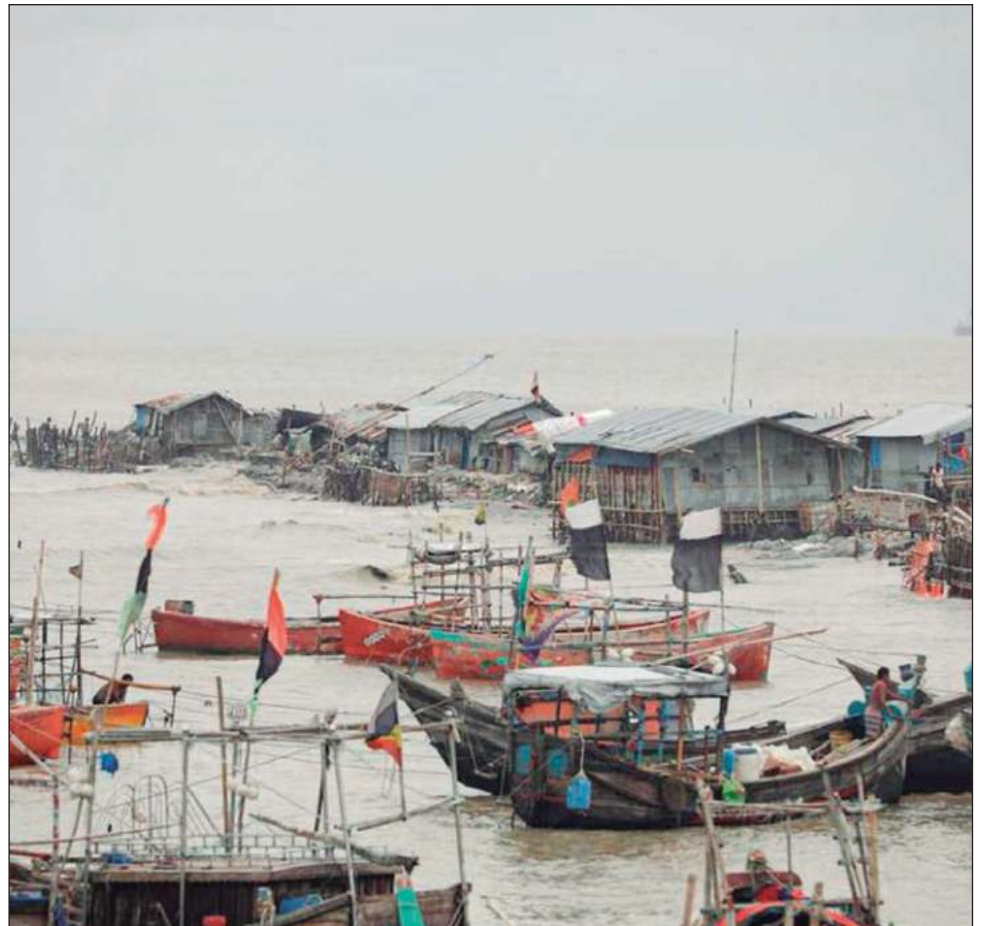
▲ Se esperan olas de tres metros de alto que podrían inundar una amplia zona de terrenos bajos a lo largo de la costa de Bangladés donde viven millones de personas.

De acuerdo con los científicos, es probable que el calentamiento climático haga que los ciclones sean más intensos y más frecuentes en los países de Asia del sur con costas en el golfo de Bengala.