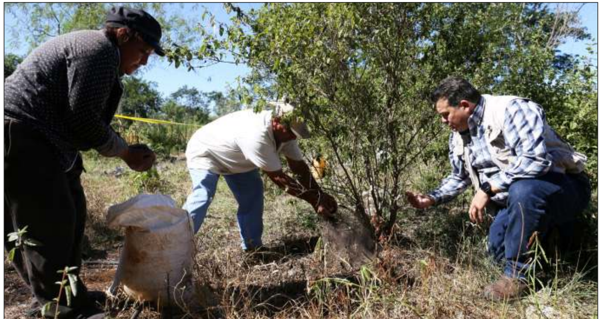
▲ Mujeres de Kinchil aumentan su producción de orégano con abono sustentable de Kekén.

“Ahora Kekén nos está dando una gran oportunidad con el abono, porque yo estoy viendo la mejoría en las plantas, más verdes y bonitas. El orégano es dinero, nos ayuda un montón con la economía, a la semana sacamos hasta 10 sacos para vender”, explica.