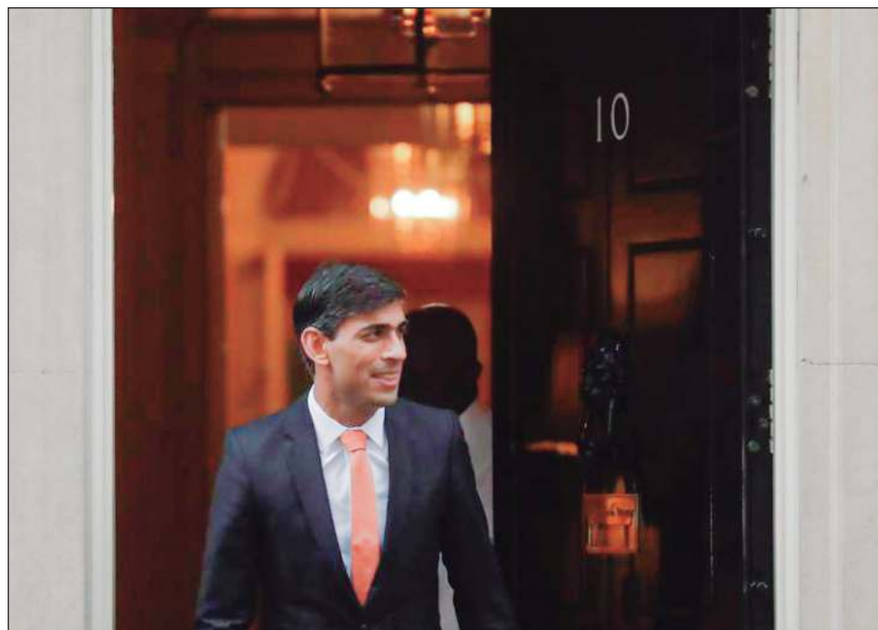
▲ Sunak es un defensor de reducir el papel del Estado que admira a Margaret Thatcher, pero dedicó millones del gobierno para mantener a ciudadanos durante la pandemia.

Rishi Sunak será el primer mandatario británico no blanco y el primer hindú en asumir el cargo. Tiene