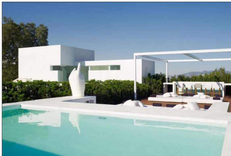
▲ El tiempo para la acción penal ya prescribió, tanto el conflicto de intereses como el presunto otorgamiento irregular de 33 contratos ocurrieron entre 2012 y 2014.

La Jornada presentó solicitudes de información pública a las secretarías de la Función Pública (SFP) y de Hacienda y Crédito Público (SHCP), a la Procuraduría Fiscal de la Federación (PFF), el Servicio de Administración Tributaria (SAT), la Unidad de Inteligencia Financiera (UIF) y la Auditoría Superior de