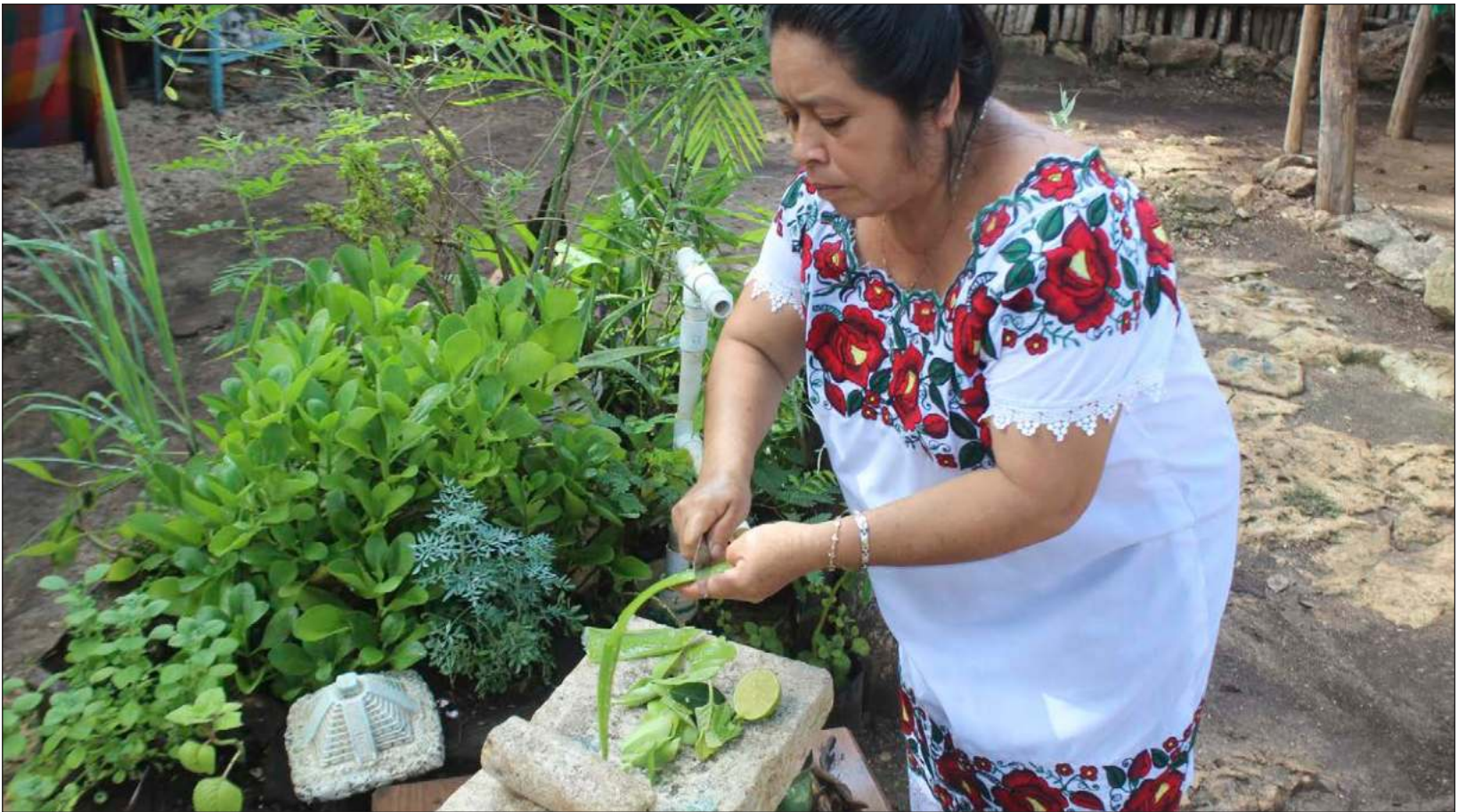
▲ La reforma constitucional permitiría fortalecer la institucionalidad indígena para que puedan ejercer el control de sus territorios; protegerlos, salvaguardarlos o puedan consultar a sus asambleas y autoridades y así generar espacios de decisión para controlar la totalidad de su población.