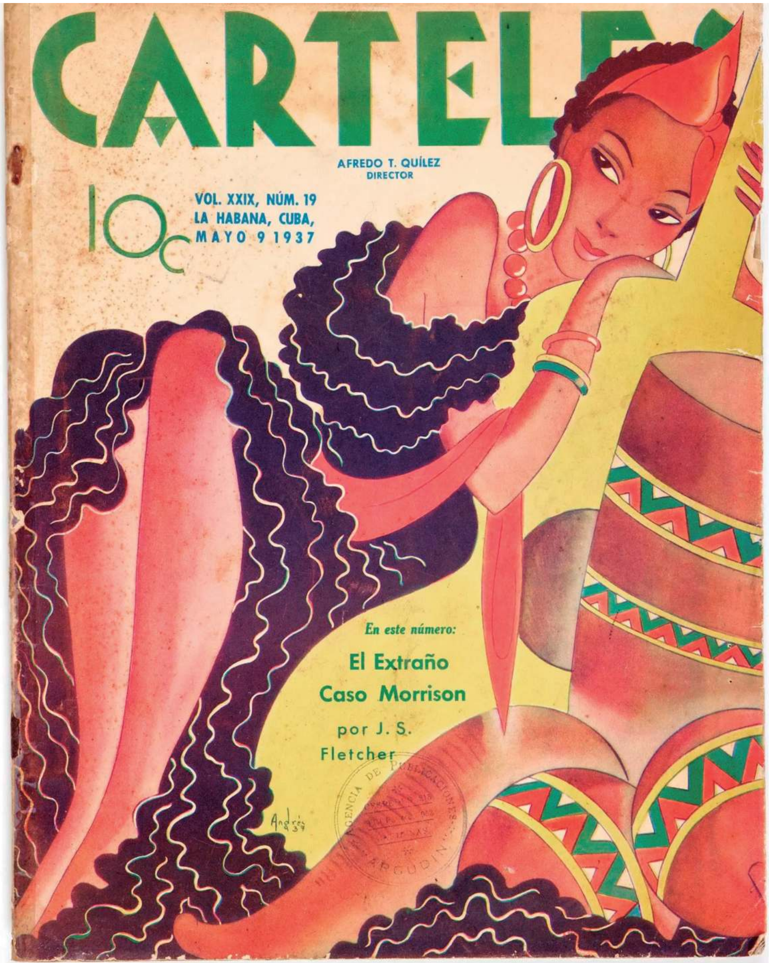
▲ Turn the Beat Around (Que suene el ritmo) , una exposición que se inaugura esta semana en el museo Wolfsonian de Miami, muestra, a través de fotografías, carteles, álbumes de discos y otros objetos, cómo los ritmos afrocubanos “cambiaron para siempre el paisaje musical” de EU.