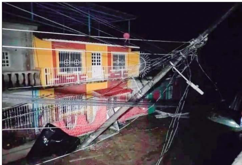
▲ La mandataria puntualizó que "no hay nada más importante que la vida, los daños materiales se pueden recuperar. Hacemos atento llamado a todas las personas de la Costa Chica a que se continúen resguardando, busquen espacios seguros".

En su reporte, la gobernadora Salgado indicó que