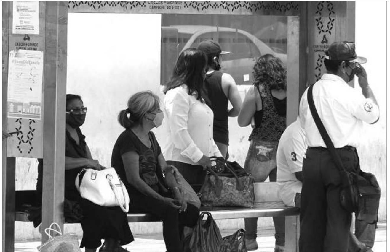
▲ Con el inicio de operaciones del sistema de transporte público Ko'ox, 30 paraderos serán intervenidos por los encargados de obra de la Sedumop, esto sin detallarse aún cuál será su ubicación.