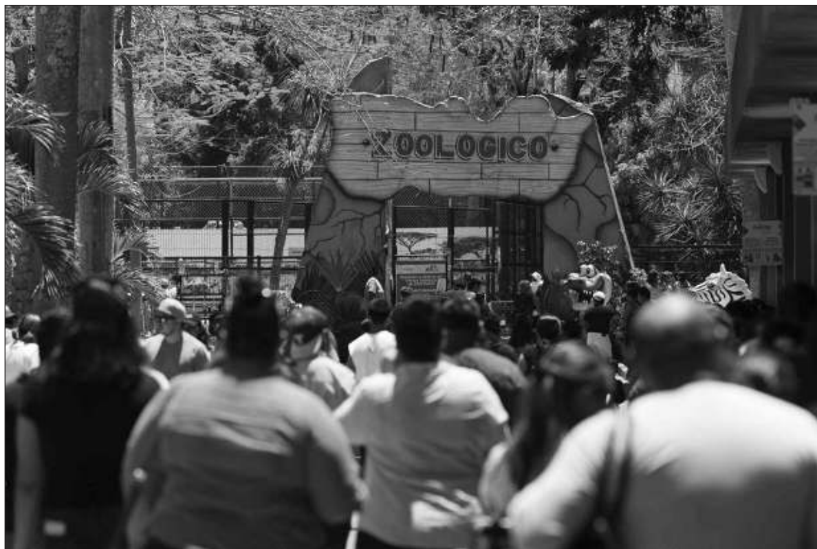
▲ "Tras la barrera, en donde se sentían a salvo, los niños intensificaron sus gritos, y comenzaron a imitar a la bestia, encorvándose, dando pequeños, torpes saltos, tratando de balbucear ululatos y gruñidos; una regresión colectiva de la especie".

La jauría de niños quedó en silencio unos segundos. Como si fuera una quimera mitológica, todos al mismo tiempo miraron, primero, a ver a la mona, y, después, a su víctima. La olvidaron a ella y comenzaron a burlarse de su compañero. No se dieron cuenta cómo el animal, en