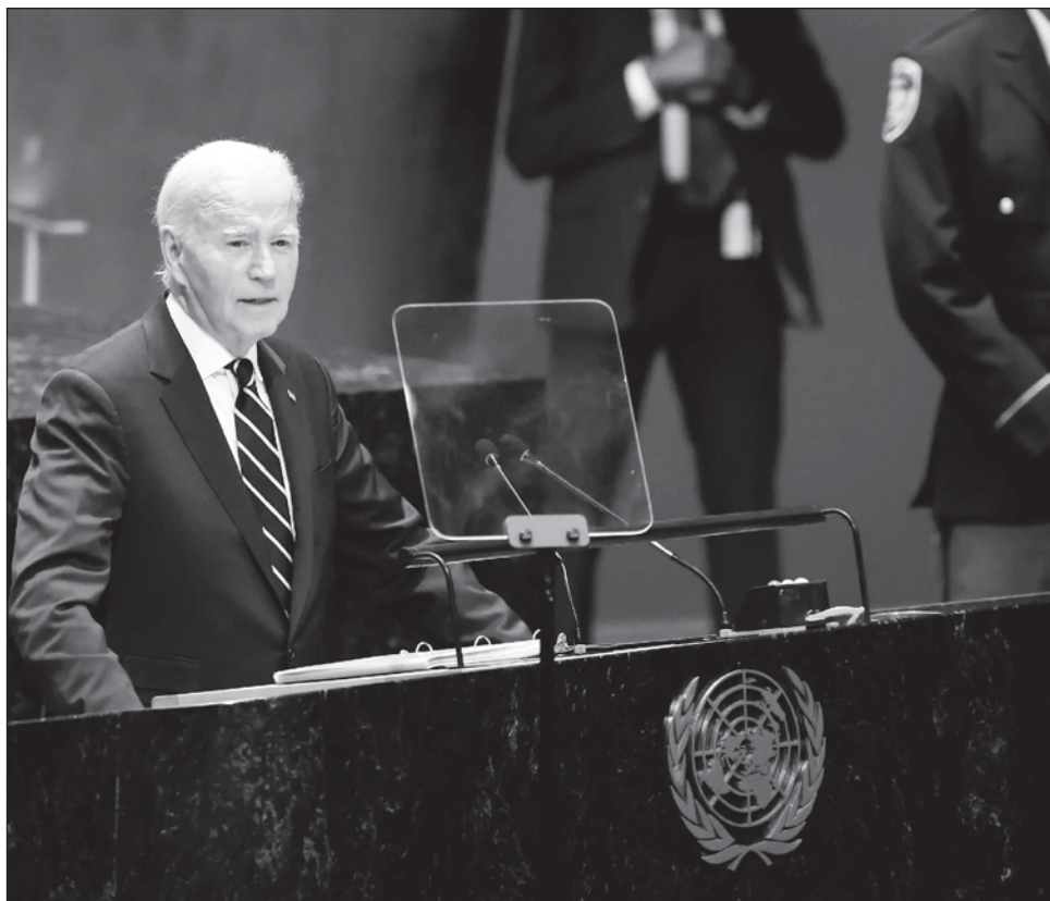
▲ Biden llegó a la presidencia de Estados Unidos prometiendo retirar a su país de “guerras eternas”.

Biden llegó a la presidencia prometiendo rejuvenecer las relaciones de Estados Unidos en todo el mundo y retirar a su país de “guerras eternas” en Afganistán e Irak que consumieron la política exterior estadounidense en los últimos 20 años.