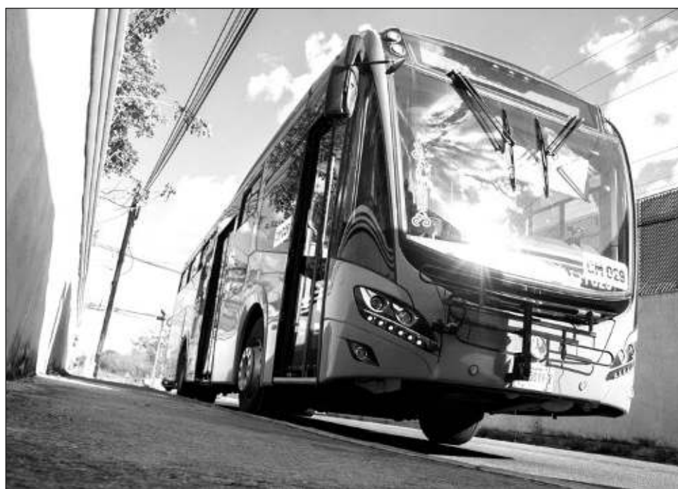
▲ Sobre la información que circuló en redes sociales que un hombre había secuestrado una unidad de Va y Ven de la Ruta Periférico con todo y pasajeros, la Agencia de Transporte de Yucatán (ATY) lo desmintió al

señalar que se trató de un cambio de turno de operador que no contaba con el uniforme. El conductor será sancionado por no acatar las medidas contempladas para el manejo del sistema de transporte.