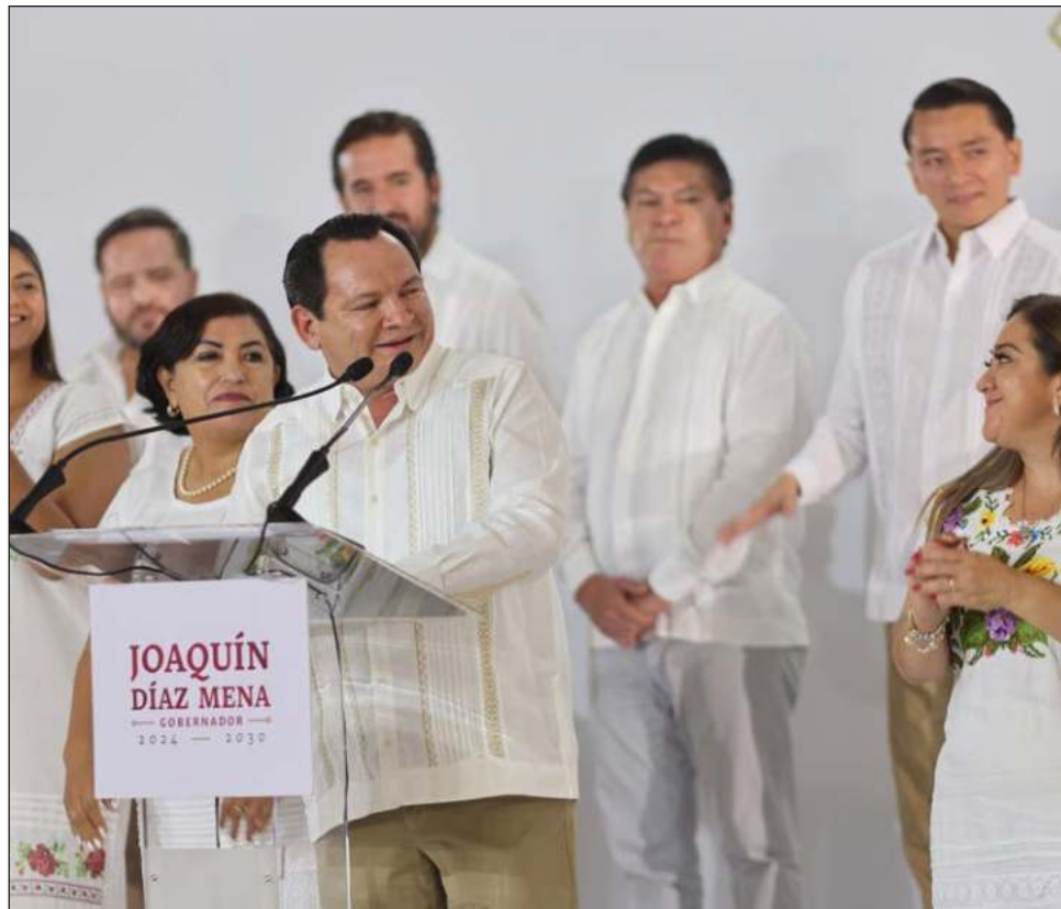
▲ “Los funcionarios entrantes tienen la tarea de actuar con transparencia para asegurar una correcta recepción de la información”, subrayó el gobernador electo.

Entre las dependencias que ya han cumplido con el proceso de Entrega-Recepción destacan la Secretaría de Pesca y Acuicultura Sustentables, la Secretaría de Obras Públicas, el Colegio de Estudios Científicos y Tecnológicos, el Instituto del Deporte y la Secretaría Técnica de Planeación y Evaluación, entre otras.