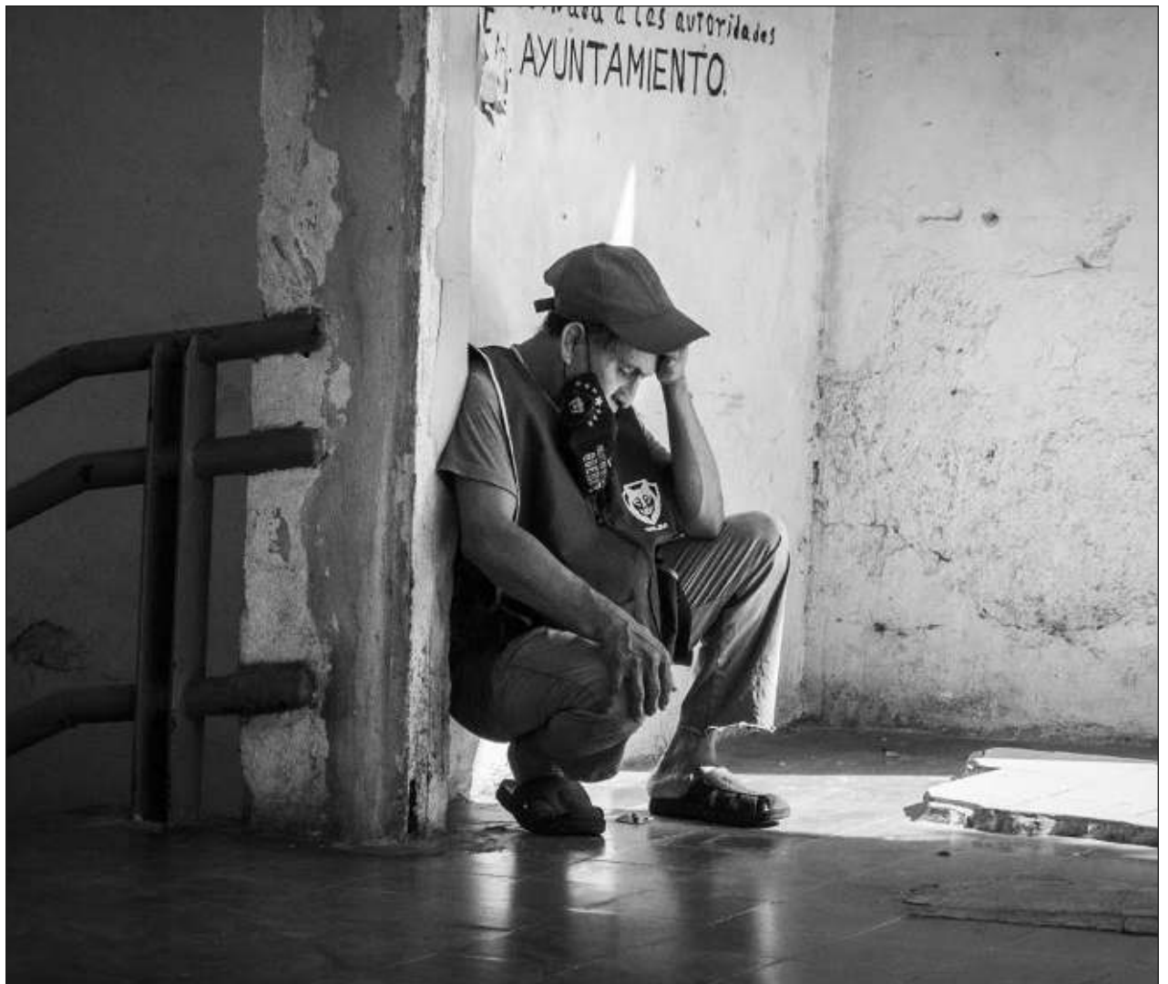
▲ La campaña Hablemos de suicidio, cambiemos la narrativa se aplica en diversos puntos del estado y en escuelas, y está enfocada en detectar signos de alarma en familiares o conocidos, con indicios de suicidio.

Dijo que la certificación consiste en analizar todos sus entornos, que sean limpios, incluyendo su mercado principal, "La organización panamericana para la salud ha impulsado el programa para fomentar la salud de la población, que cada habitante tenga".