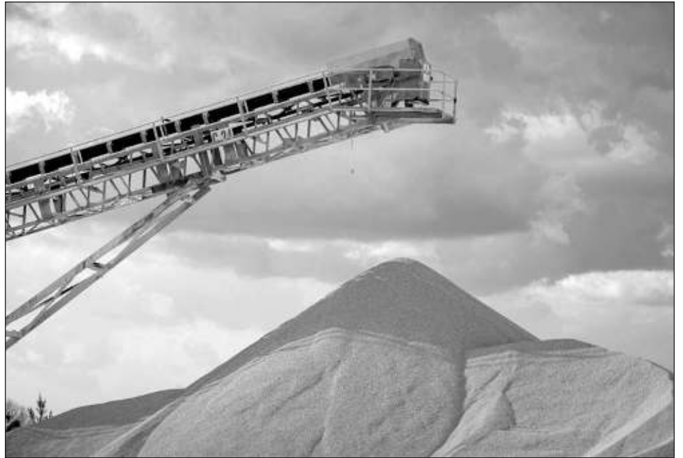
▲ AMLO dijo en julio que su objetivo antes de terminar su gestión el 1º de octubre era lograr que la clausura de las instalaciones de la empresa estadounidense fuera “definitiva” en términos legales.

La mina está en la península de Yucatán, al igual que uno de los proyectos de infraestructura más importantes de la gestión del mandatario, el Tren Maya, un ferrocarril turístico de