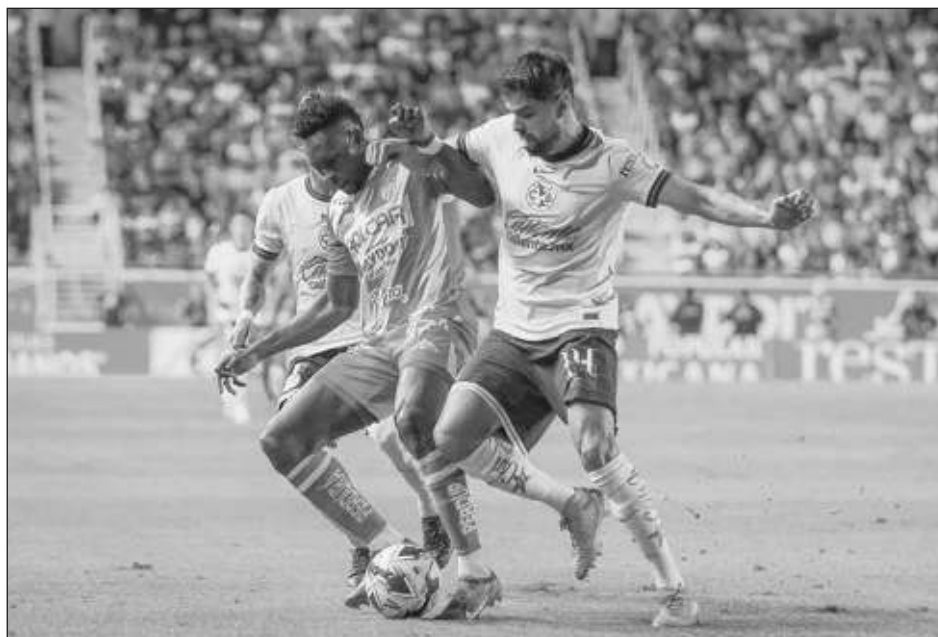
▲ Las Águilas marchan en el décimo lugar del torneo Apertura de la Liga Mx.

"Cada campeonato que jugamos es algo que nos proponemos, nosotros nos paramos en cada cancha