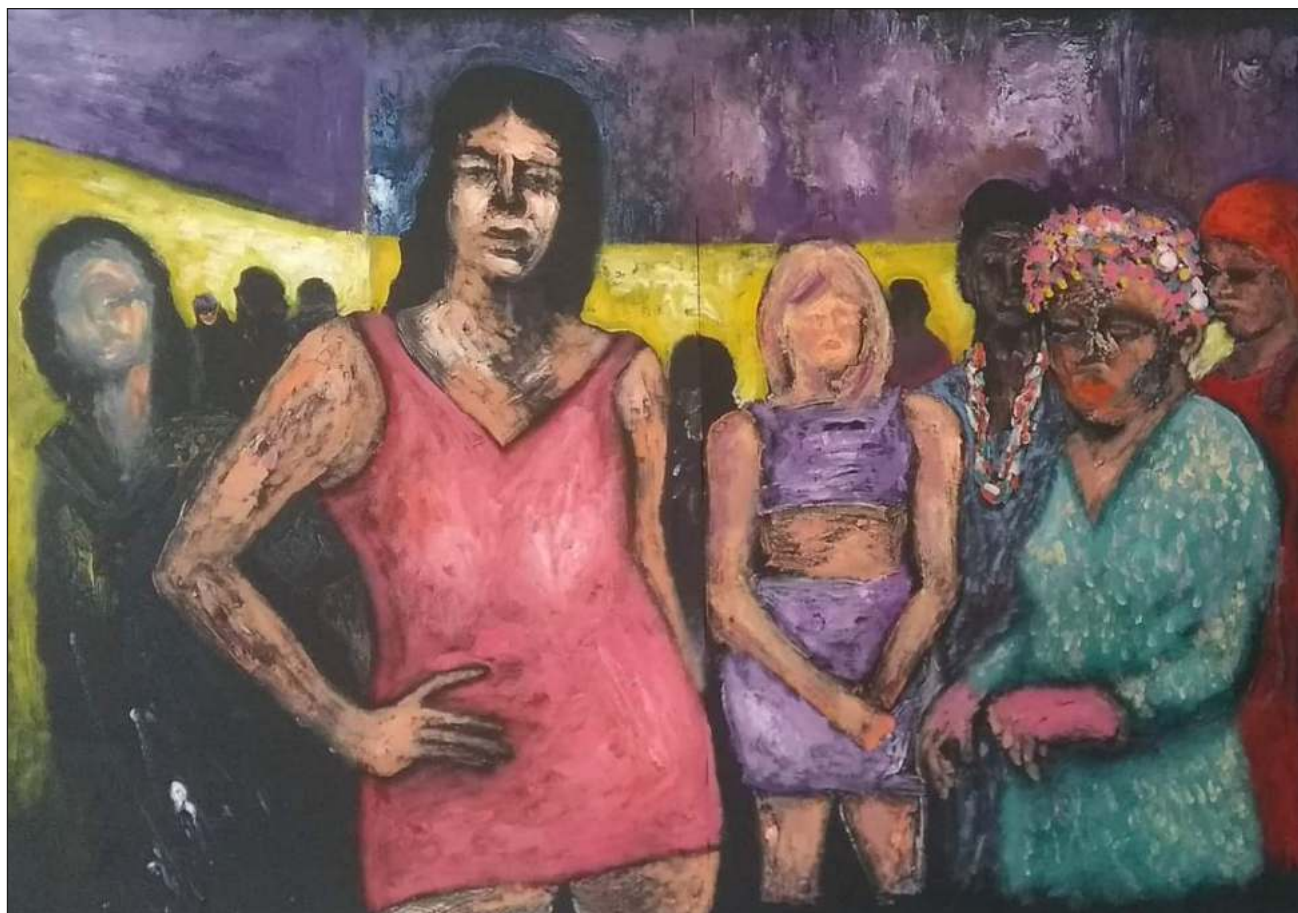
▲ El óleo De reven con las manos manifiesta la presencia de la diversidad en espacios que de pronto parecen negados en un contexto de profundo conservadurismo, usando colores que tienen sentido en el paisaje yucateco.

“A dos calles de donde nosotras estábamos viviendo, había un lugar que se llamaba La pura sabrosura, es un lugar muy raro. Es un lugar donde hay un trabajo sexual velado. Entonces cuando estaba haciendo la pintura, estaba haciendo un recuerdo de mis manos. Nosotras como pintoras somos personas que crecimos en la sociedad, pero nosotras no hacemos el cuadro, el cuadro lo hace otra, el cuadro lo hace una que en ese momento no va a tocar la vida con las