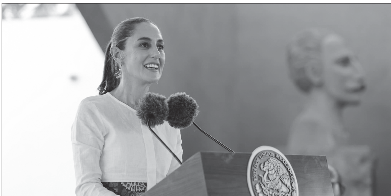
▲ “El anuncio hecho por Claudia Sheinbaum no tuvo buena recepción. Ciertamente es que teóricamente la FGR es un organismo autónomo, pero en la realidad el titular de dicha instancia federal fue propuesto e impulsado por el Presidente de la República saliente”.