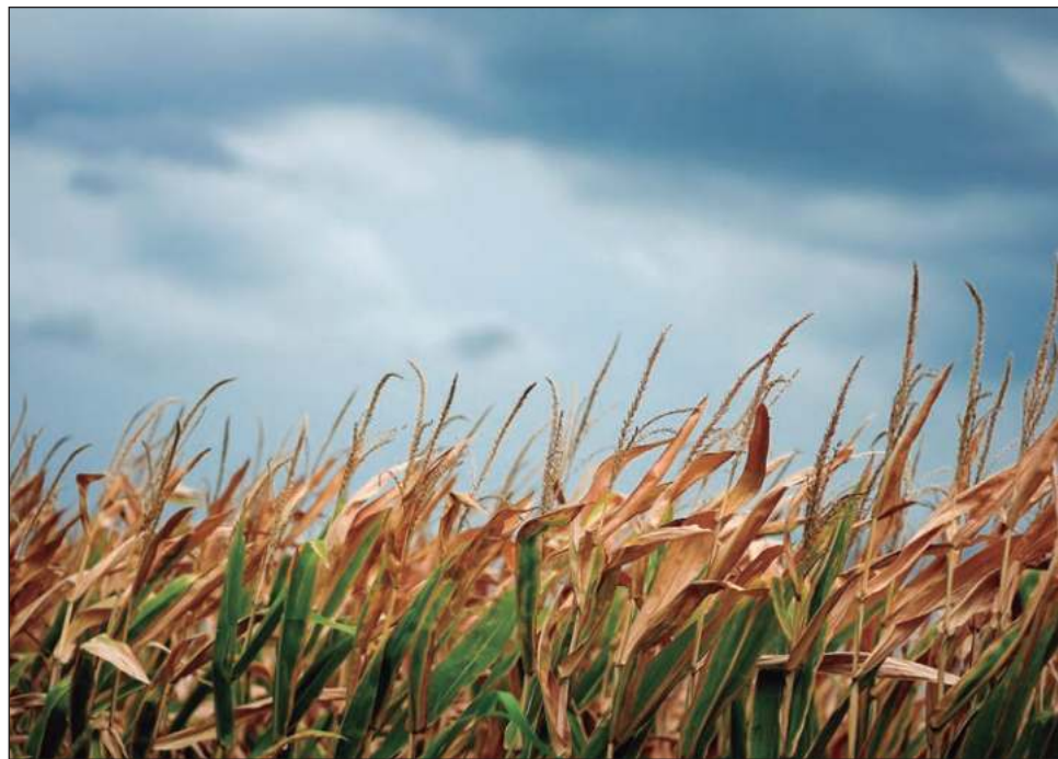
▲ En los primeros cinco años del presidente Andrés Manuel López Obrador la producción se mantuvo en 40 millones 100 mil toneladas, cifra que se estima sea menor para 2024

Para el final de la administración de Vicente Fox (2000-2006), la producción alcanzó 34 millones 600 mil toneladas, un incremento de 5 millones de toneladas, el mayor de todas las administraciones que han pasado hasta la fecha, según Anaya, debido a que en este lapso las políticas de apertura al comercio exterior y la mo-