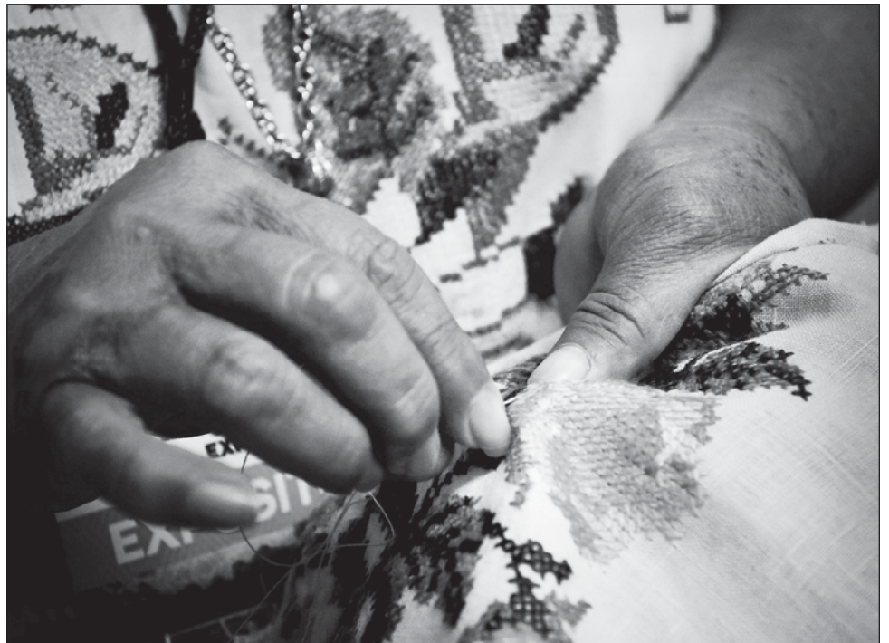
▲ La exposición y la mesa panel preparadas para el 27 de septiembre buscan dar a conocer y resaltar la labor que realizan las yucatecas en sus comisarías.

Lo que se busca con este plan, dijo, es garantizar la venta y comercio justos, implementar políticas de inclusión y con perspectiva de género, además de establecer programas de actualización y reconocimiento de los conocimientos de las bordadoras.