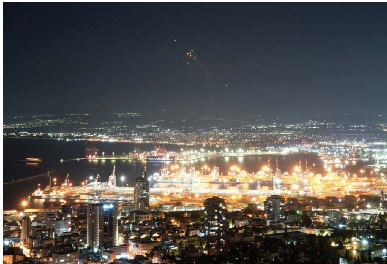
▲ De acuerdo con las autoridades libanesas, al menos seis personas murieron y otras 25 resultaron heridas en el bombardeo contra la capital del país; siendo este el quinto ataque que ha recibido desde que inició el conflicto.

El Dahye ya fue objeto de otro ataque israelí el lunes, del que salió ileso el coman-