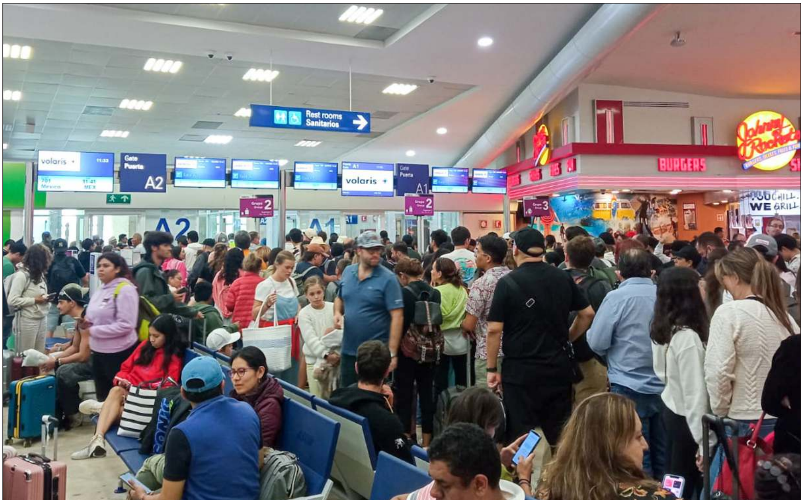
▲ Los protocolos y check list para admitir a extranjeros en México se han vuelto cada vez más objetivos para evitar discriminación.

Lo que se ha generado, aseguraron, es una distorsión del trato a los ciudadanos colombianos, pues siempre se presentan las inconsistencias de quienes no son admitidos en el país tras el check list .