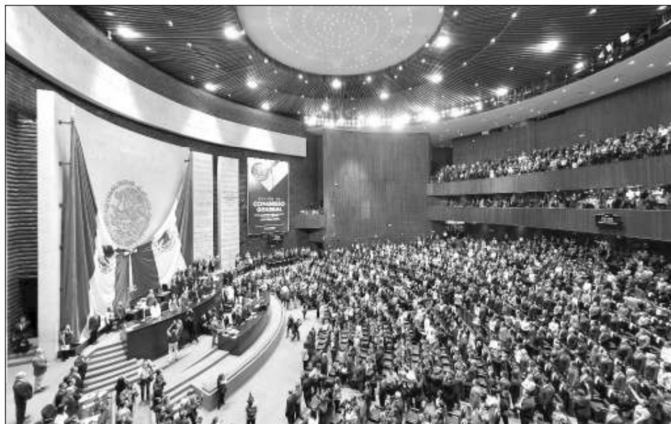
▲ Pese a que no había controversia alguna sobre la aprobación de la reforma, se presentaron 123 reservas al dictamen, en voz de 34 oradores, para ampliar la participación.

"Es decir, una en la cual diversos impartidores de justicia federal solicitan a esta Suprema Corte verificar si la reforma al texto constitucional en materia del Poder Judicial, publicada el quince de septiembre de dos mil veinticuatro, es compatible o no con diversas garantías judiciales y principios, entre ellos, la división de poderes, la independencia judicial, así como aquellos inherentes al Estado Constitucional de Derecho", plantea el proyecto.