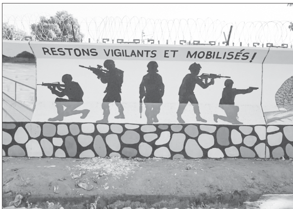
▲ Un gobierno transicional ha estado dirigiendo al país africano luego que los militares tomaron el poder durante 2022, aprovechando el descontento popular.