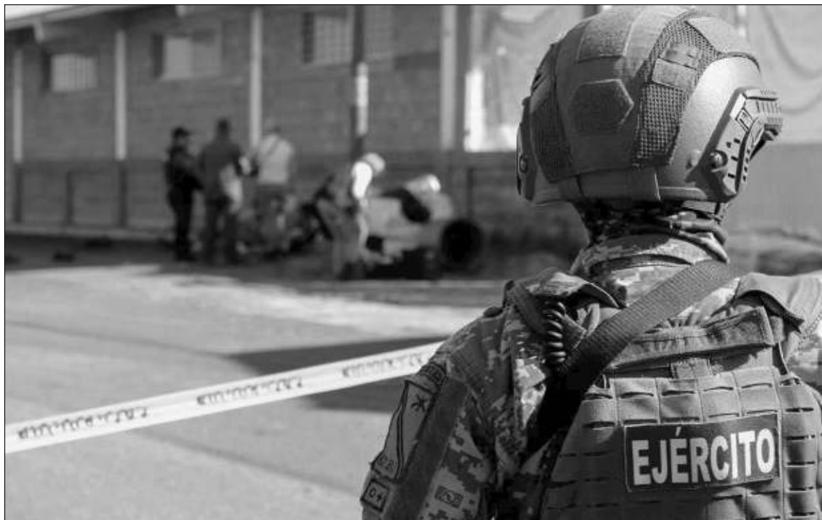
▲ “Los malandros tendrán que decidir cuándo dejar de matarse entre ellos, y nos toca a los demás contemplar como lo hacen, escudados tras la valerosa valla uniformada. Tampoco logro entender, en mi obstinada cerrazón, que quienes han generado las condiciones que ocasionan la violencia en Sinaloa han sido las autoridades de Estados Unidos”.

Como uno es tozudo y obtuso, no acaba de comprender que la Guardia Nacional, gracias a que está compuesta en buena medida por elementos y mandos de origen castrense, actúa de manera impecable como garante de la seguridad de todos los mexicanos y mexicanas. Por eso uno malinterpreta al comandante de la zona militar que nos explica que la paz