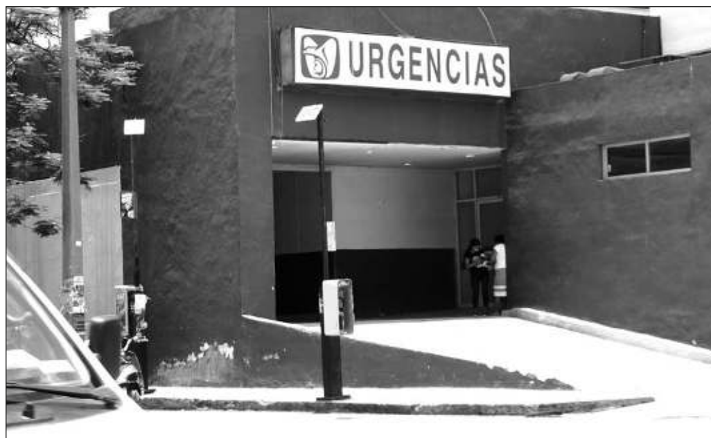
▲ El dato es contradictorio, pues si bien el aumento en capacidad es un indicador positivo, el reverso de la moneda es que hay más de 50 millones de mexicanos sin seguridad social.

Agreguemos que la capacidad de atención a personas sin seguridad social era, en 2019, de 12.3 millones de personas. Ahora se le brinda a 53.2 millones. El dato es contradictorio, pues si bien el aumento en capacidad es un indicador positivo, el reverso de la moneda es que hay más de 50 millones de mexicanos sin seguridad social. Esta será la parte de justicia social que le tocará atender a la administración que encabezará Claudia Sheinbaum y que comienza la próxima semana.