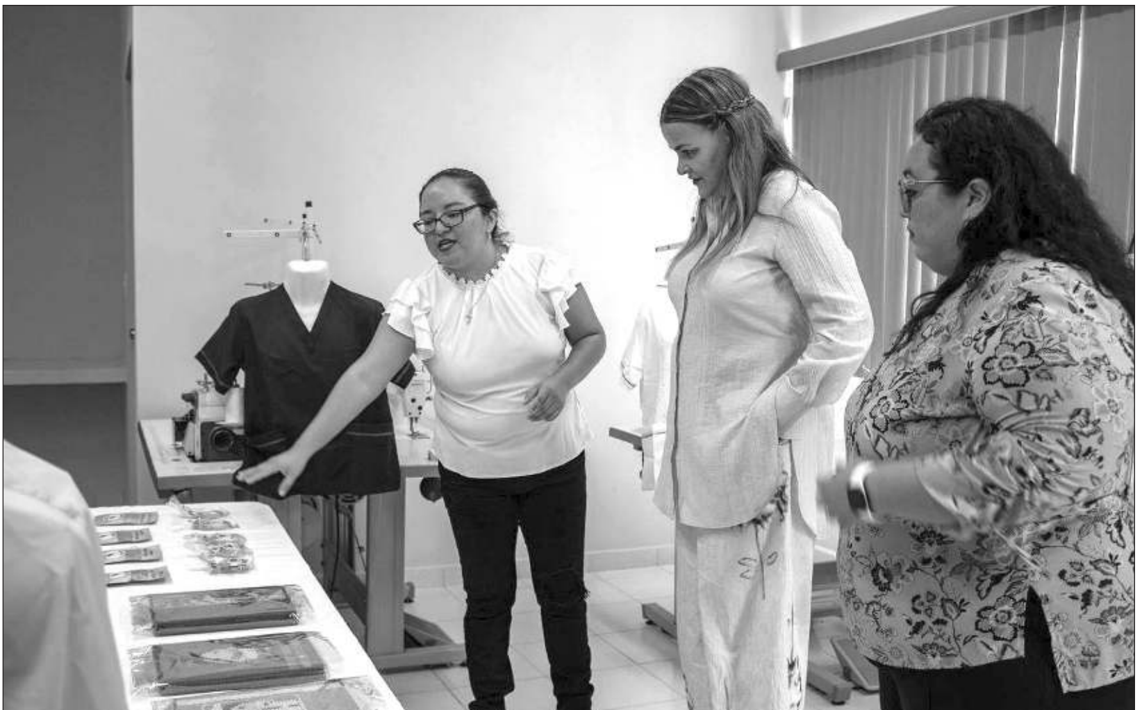
▲ La presidenta municipal dijo en su visita que “las mujeres que llegan a este lugar pueden sentirse seguras que aquí las vamos a cuidar, las vamos a acompañar en todo momento y las vamos a empoderar, porque para romper el círculo de la violencia es necesario que ustedes tengan las herramientas necesarias para seguir adelante”.

Cecilia Patrón Laviada reiteró que esta nueva forma de gobernar, la atención, el apoyo, el cuidado y promover la autonomía de las mujeres son una prioridad.