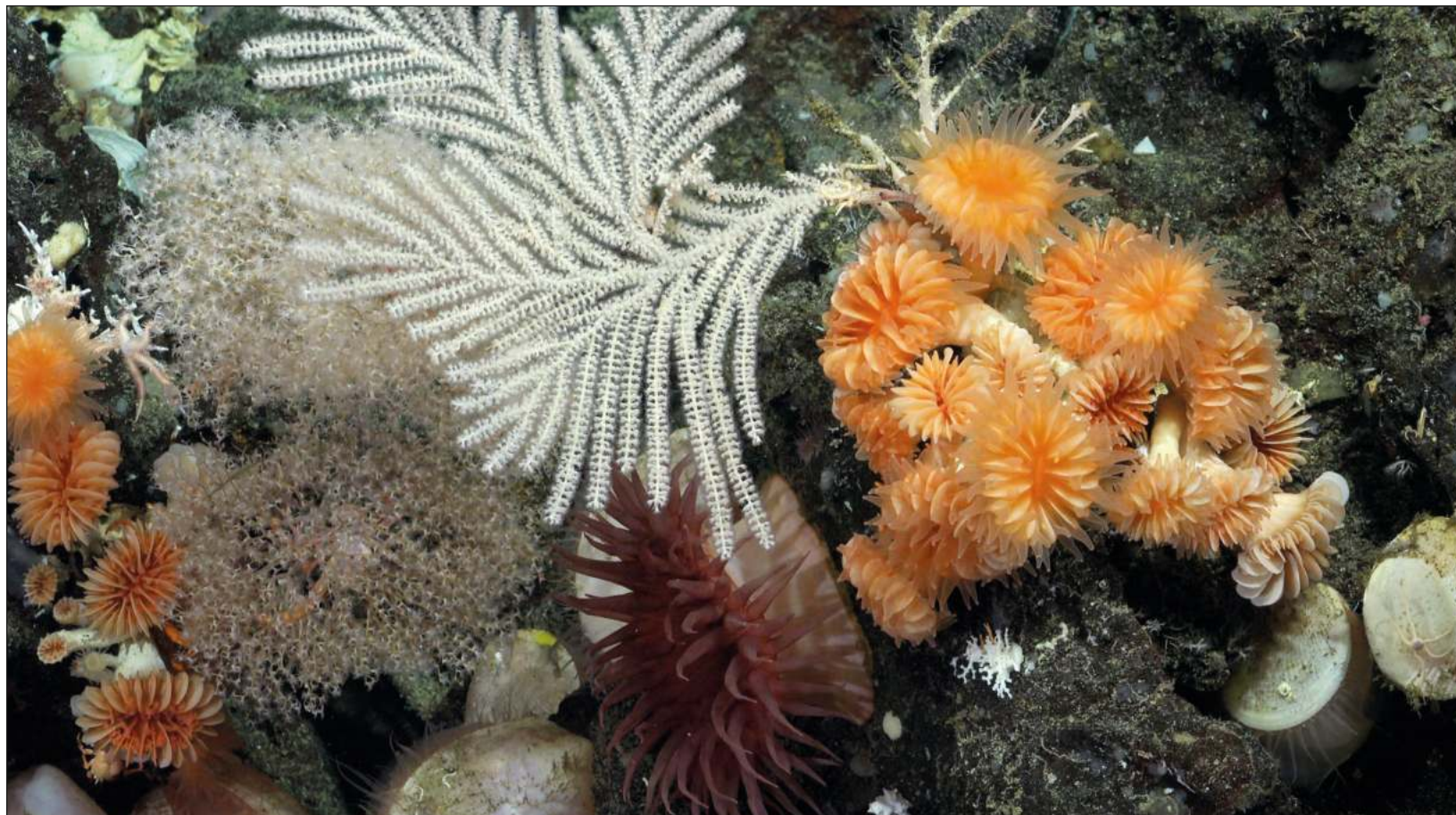
▲ El equipo autor del estudio publicado en la revista Science of the Total Environment plantea la hipótesis de que el coral pudiese actuar como un “sumidero” de plástico marino, secuestrando los desechos plásticos del océano, de la misma manera que los árboles retienen el dióxido de carbono del aire.

En un artículo publicado en la revista Science , un grupo de expertos afirma que nunca ha sido más urgente adoptar medidas a escala mundial para abordar todas las formas de microplásticos.