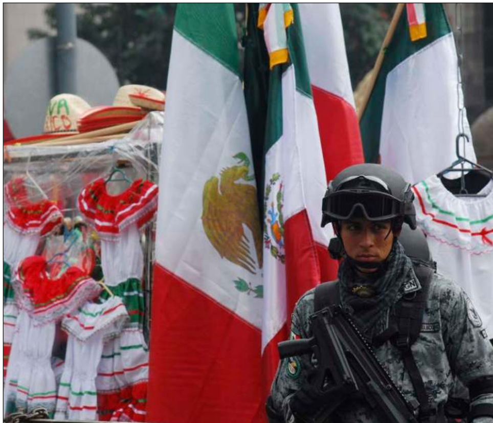
▲ Los especialistas alertan que "de aprobarse la propuesta de reforma constitucional, esta asignaría de forma permanente funciones de seguridad pública a las Fuerzas Armadas".

El mandatario negó el viernes pasado que la reforma implique "militarismo" y "represión".