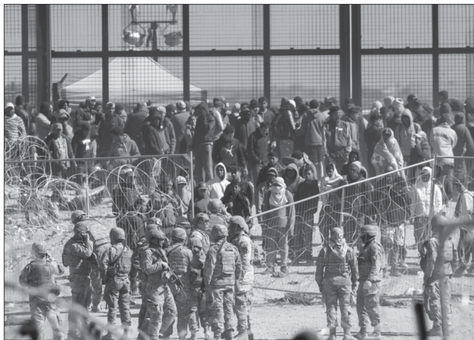
▲ Las detenciones atrajeron más atención a las operaciones de Texas en la frontera, donde el gobernador republicano ha implementado agresivas medidas para frenar los cruces ilegales.

Un juez del condado había desestimado el lunes los cargos en contra de quienes fueron detenidos este mes, determinando que no había suficiente causa probable. Una abogada pública que representa a los migrantes