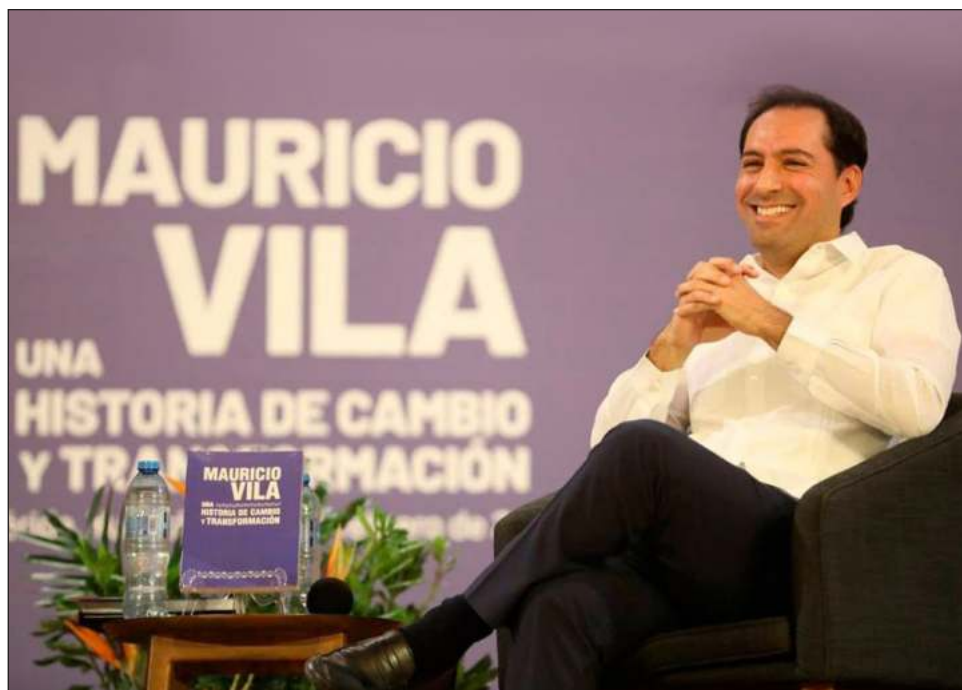
▲ A través de un comunicado, el gobierno del estado informó que Vila Dosal se encuentra a la espera de la notificación del TEPJF para darle cumplimiento.

“(Mauricio Vila) tiene el mando de la policía en todos los distritos electorales que comprenden el estado y sigue desempeñando su encargo de gobernador y a la vez tiene un registro como candidato