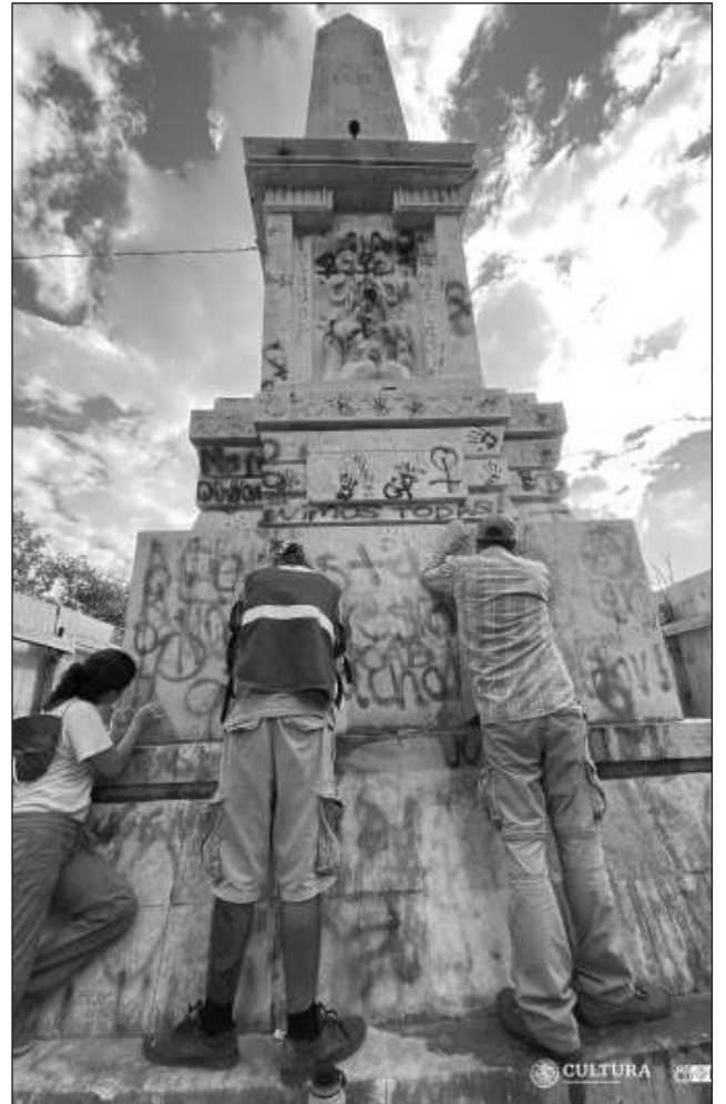
▲ En la intervención se han considerado tanto las piezas escultóricas como los elementos metálicos y pétreos que las conforman, así como el registro detallado de ambas obras.

Cabe destacar que ambos bienes inmuebles poseen un carácter patrimonial y están protegidos por el INAH, de acuerdo con lo establecido en la Ley Federal sobre Monumentos y Zonas Arqueológicas, Artísticas e Históricas, dado su simbolismo y por encontrarse en el emblemático Paseo de Montejo, el cual forma parte de la declaratoria de Zona de Monumentos Históricos de la Ciudad de Mérida, emitida en 1982.