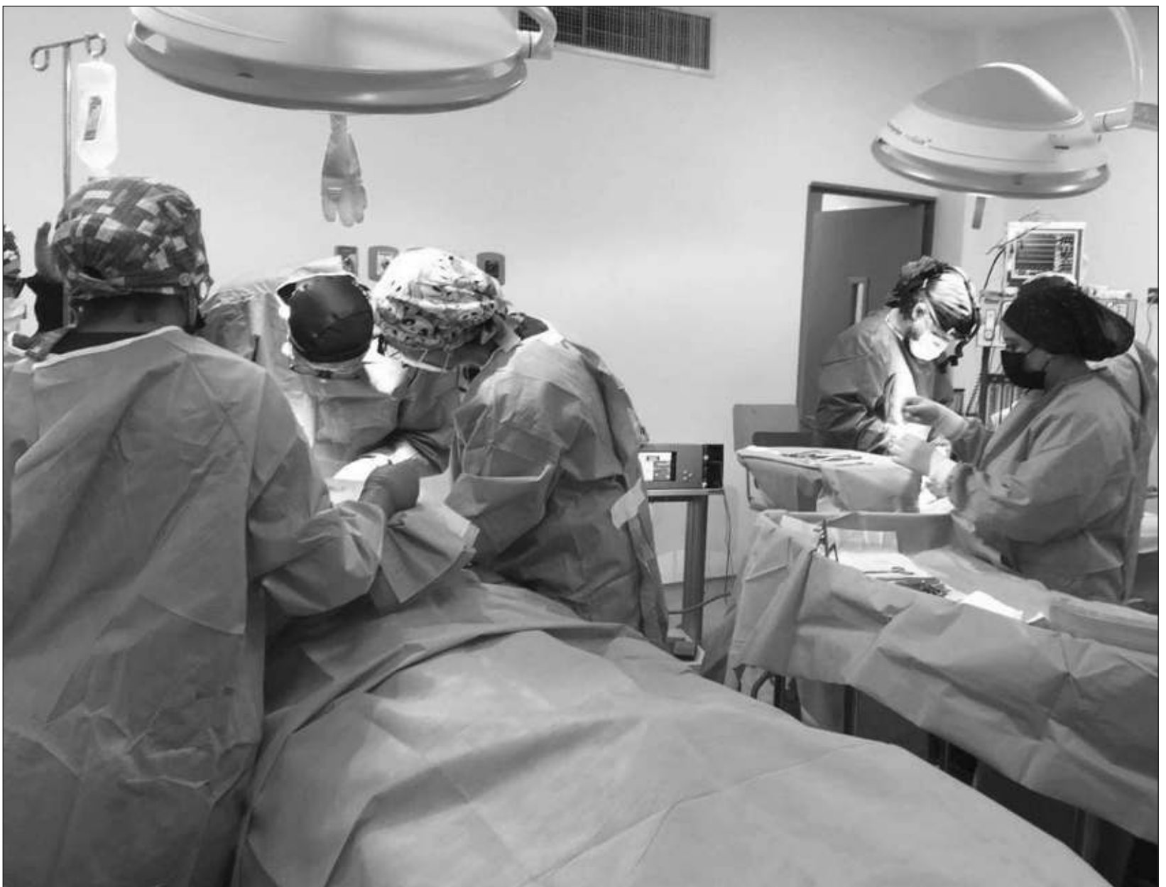
▲ El director médico del Issste expuso que con una inversión de 7 mil 256 millones de pesos, se han adquirido 13 mil equipos y bienes para modernizar la infraestructura.

Señaló que se compraron cuatro aceleradores lineales, 31 salas de hemodinamia, 39 mastógrafos, 146 equipos de ultrasonido, 84 equipos de radiología, 18 fluoroscopios, 38 tomografía computarizados y 16 distribuidores magnéticos, que han sido instalados en distintos hospitales en todo el país.