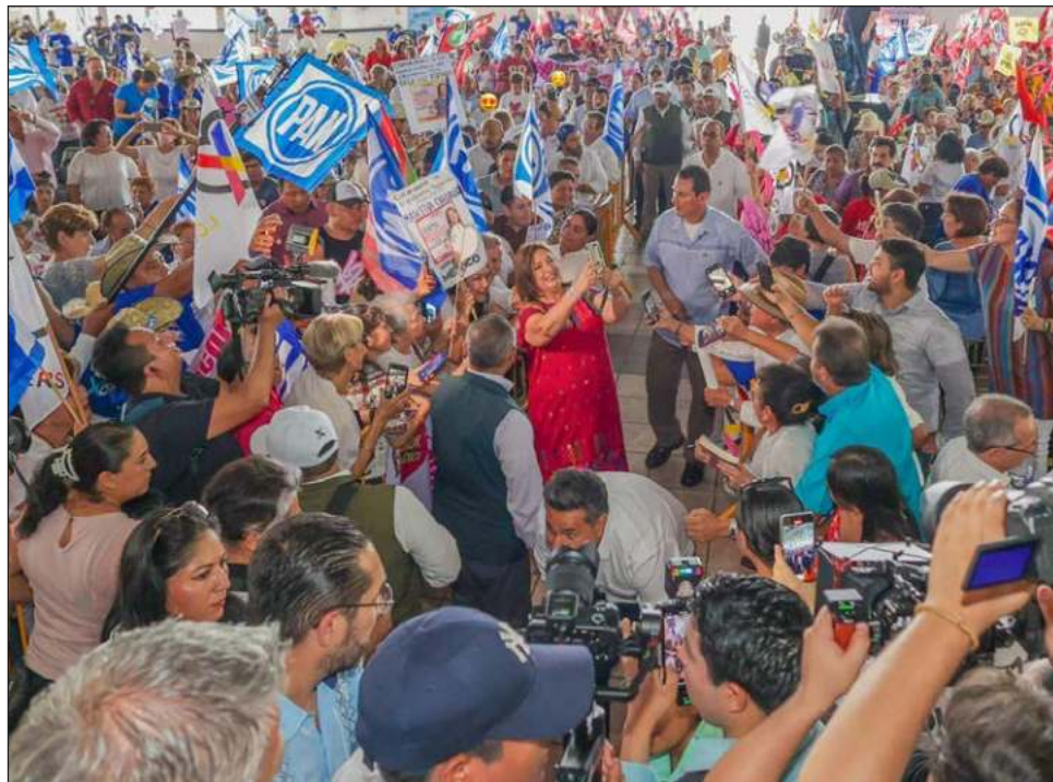
▲ La Comisión de Quejas del INE indicó que “bajo la apariencia del buen derecho, se advierte una posible campaña, a través del probable uso indebido del logotipo del organismo público autónomo, que podría confundir al electorado”.

Por ello, la Comisión resolvió que es procedente la adopción de las medidas cautelares solicitadas, porque “bajo la apariencia del buen derecho, se advierte una posible campaña, a través del probable uso indebido del logotipo del organismo público autónomo, que podría confundir al electorado”.