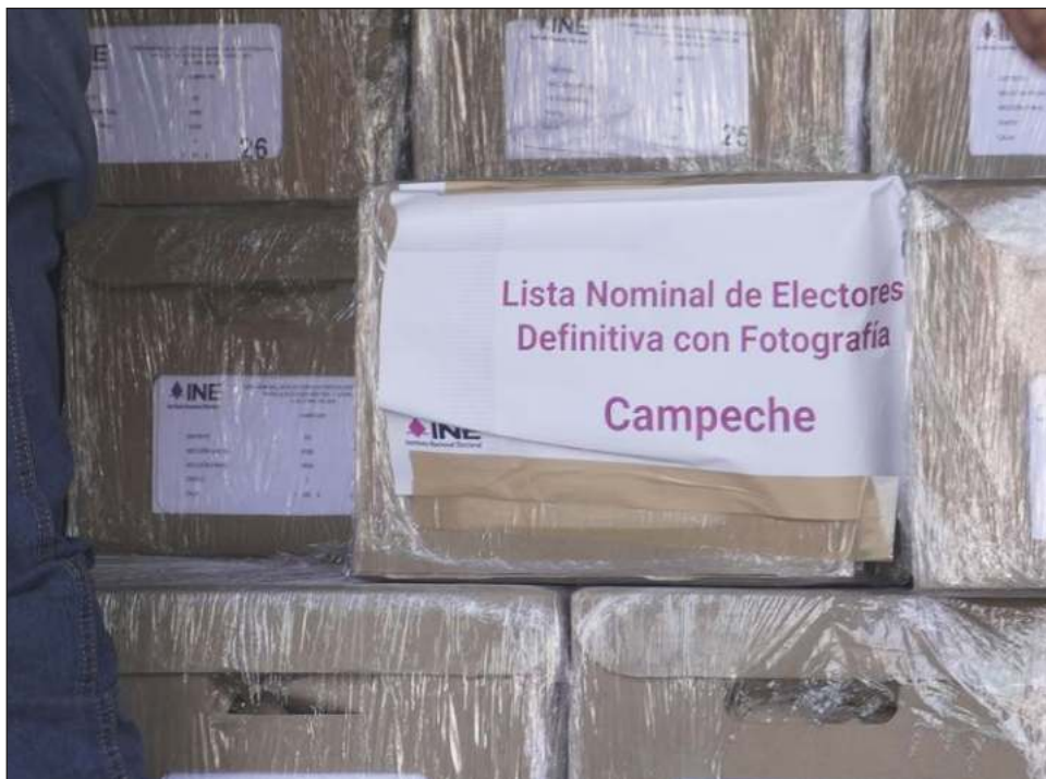
▲ El Consejo Local del INE entregó las Listas Nominales de Electores.

Es preciso señalar que en la Lista Nominal de Campeche se tienen registrados a 26 mil 147 jóvenes de 18 y