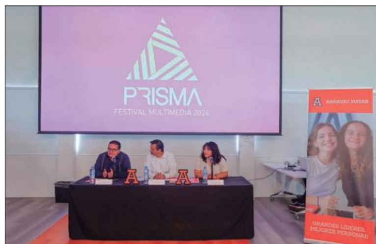
▲ El encuentro, a realizarse el 9 de mayo, fue organizado por alumnos de sexto semestre de la Licenciatura en Diseño Multimedia.