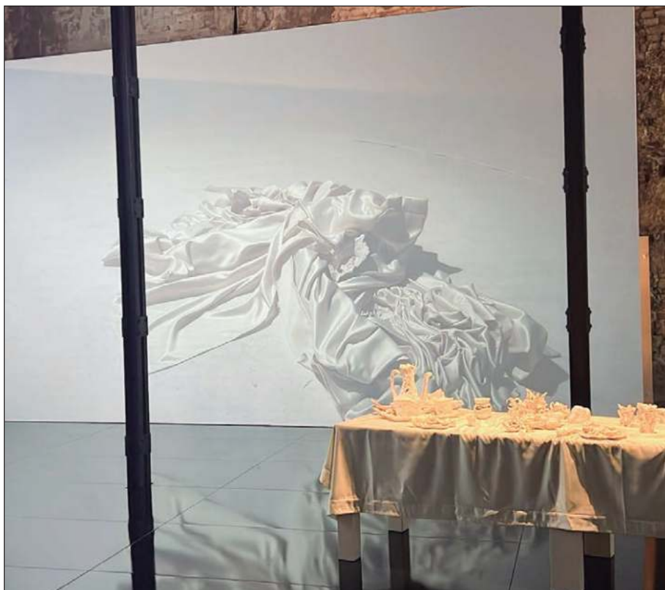
▲ Esta instalación se compone de un espacio integral centrado en una larga mesa rectangular, sobre la cual se exhibe una vajilla creada por el propio artista.

“Es una familia muy especial -dice el artista- que utiliza la comida, el canto, el baile y la poesía albanesa para comunicarse, así como para volver a crear su tierra en cada comida. Cuando lo vi, sentí una nostalgia de algo que yo no tuve en mi infancia por mis orígenes libaneses, porque mis abuelos decidieron cortar completamente con el Líbano, lo que me generó un fantasma afectivo muy grande. Son culturas diferentes, pero hay algo en los sabores, la emoción, en ese cariño que hay en los libaneses, en el contacto físico, que reconocí en ellos.”