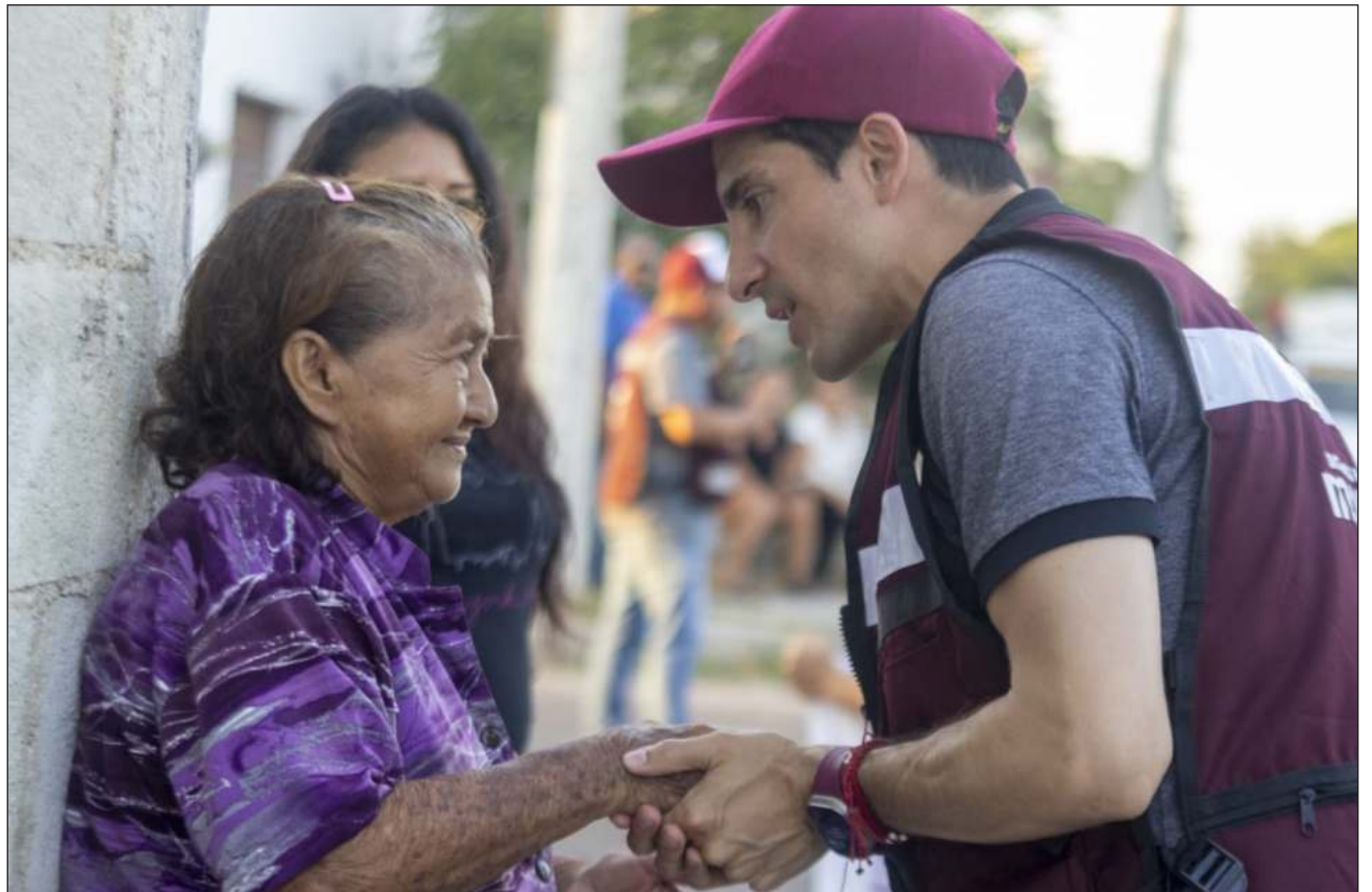
▲ De acuerdo con las propuestas del candidato Rommel Pacheco, las colonias del oriente de Mérida tendrían la infraestructura como las colonias de la zona norte. También señaló que la ciudad “ha sido gobernada por un modelo que ha favorecido la desigualdad”.

Al final del evento, el contingente se acomodó en el parque de la colonia Lázaro Cárdenas, convocaron a los vecinos y se tomaron la foto del recuerdo. El candidato, en ese punto, platicó