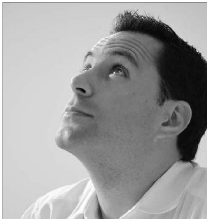
▲ Todo depende de si Vila Dosal desea permanecer como gobernador, algo que prometió al bajarse de la contienda por la candidatura presidencial de la coalición entre el PAN, PRI y PRD.

Ahora, Mauricio Vila se encuentra en la séptima posición entre los candidatos plurinominales al Senado y se encuentra como suplente en la quinta; ninguno de los dos lugares le asegura la entrada a la Cámara Alta, pues esto depende de la cantidad de votos que logre el Partido Acción Nacional (PAN) y del acuerdo con los parti-