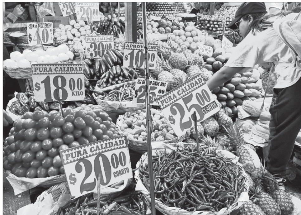
▲ En la primera mitad de abril, la inflación subió 0.09% respecto a las dos semanas anteriores; el chile serrano presentó una variación quincenal de 31.81%.

En medio de la discusión sobre el rumbo de la política monetaria mexicana, de bajar o mantener el costo del crédito, actualmente en 11 por ciento, en las próximas reuniones del Banco de México, la variación del INPC sorprendió nuevamente al consenso de los analistas que consultó Citibanamex, que pronosticaron una inflación general de 4.5 por ciento anual.