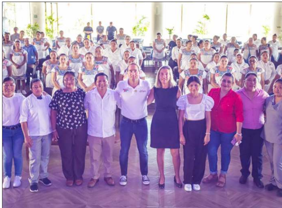
▲ Las mujeres trabajadoras de la CROC manifestaron su apoyo para que el candidato de Sigamos haciendo historia sea ratificado como presidente municipal de Tulum.

Reconoció el doble esfuerzo que ejercen las mujeres desde el campo laboral y en los hogares