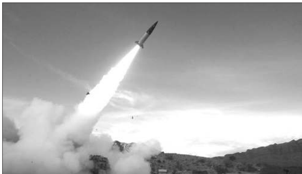
▲ Por meses, EU se resistió a enviar los misiles de largo alcance por preocupaciones de que Kiev pudiera usarlos para atacar territorios muy al interior de Rusia, lo que provocaría la ira de Moscú.

Uno de los funcionarios dijo que Estados Unidos está proporcionando más de este tipo de misiles en un nuevo paquete de ayuda militar promulgado por el presi-