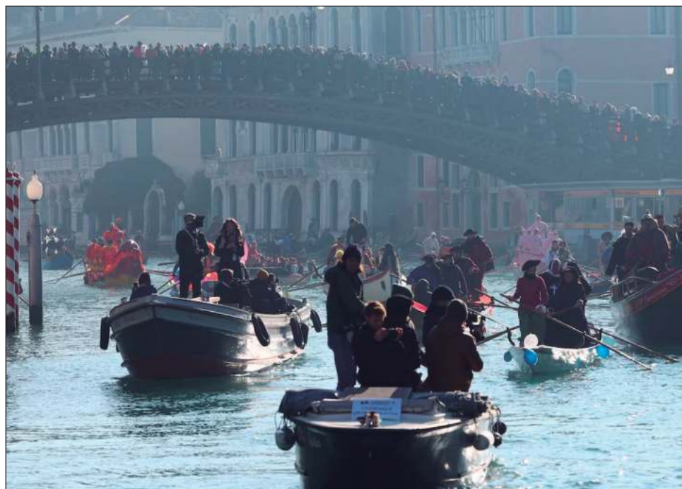
▲ Aunque la tarifa es moderada y el sistema no impone un límite de visitantes, las autoridades confían en que disuada a algunos de los turistas que atestan callejuelas y puentes.

El problema del exceso de turismo ha generado movimientos de rechazo