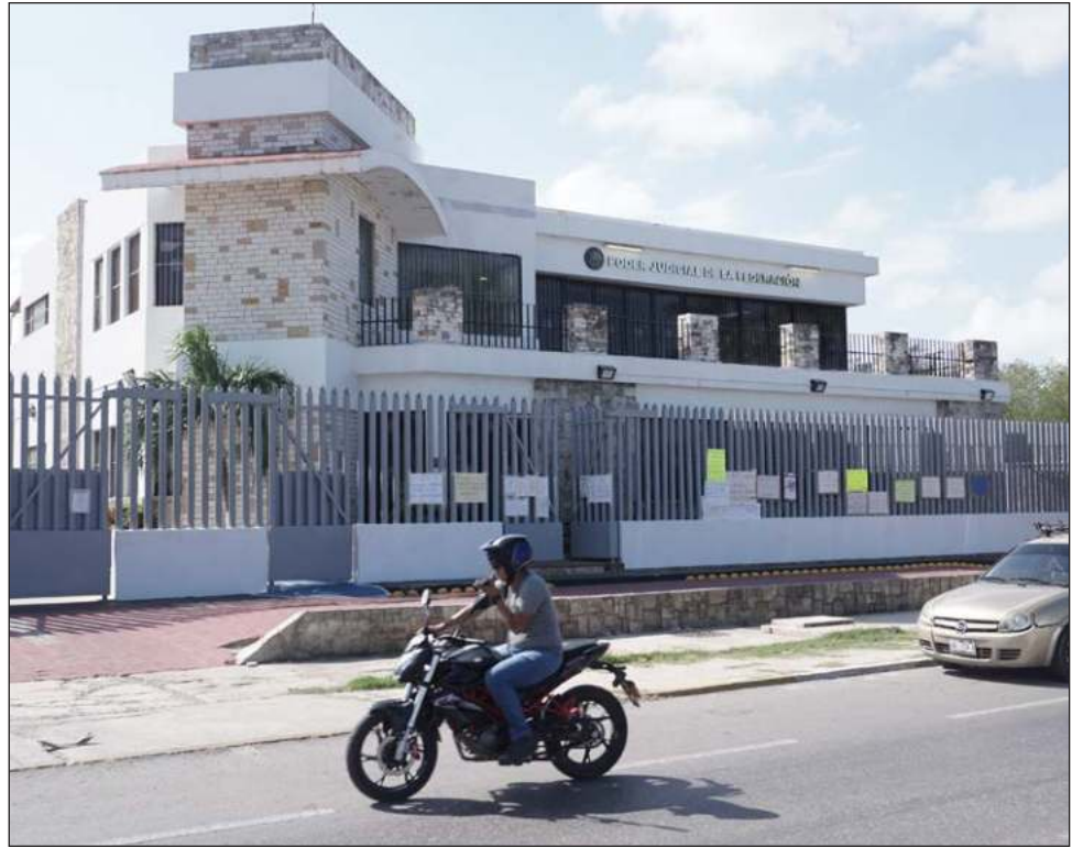
▲ El texto entrará en vigor tras su publicación en el Diario Oficial de la Federación y deja sin efectos el anterior código, así como cualquiera otro que haya sido aprobado por la SCJN.

Respecto de los alcances del nuevo Código y la posibilidad de investigar a todos los integrantes del PJF, se trate de servidores públicos con cargos menores o impartidores de justicia, desde jueces hasta ministros, se establece: el código de ética no busca imponer sanciones disciplinarias, sino generar buenas prácticas destinadas a mejorar la calidad en la prestación del servicio de impartición de justicia ética. A pesar de lo anterior, este documento cumple con la Ley de Responsabilidades Administrativas.