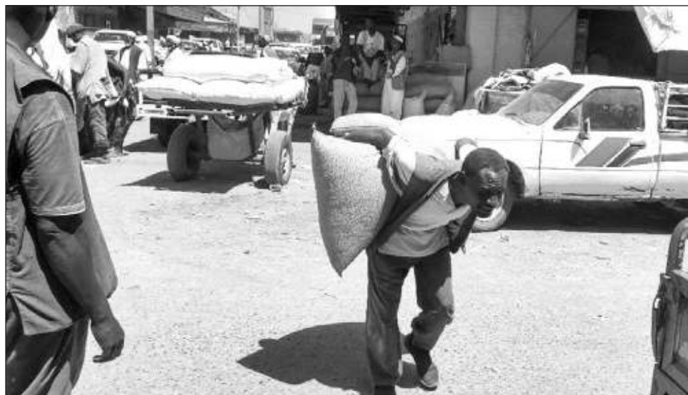
▲ António Guterres señaló que "en un mundo de abundancia, los niños mueren de hambre. Las guerras, el caos climático y la crisis del costo de vida, combinados con una acción inadecuada, resultan en cerca de 300 millones de personas enfrentando una crisis alimentaria aguda en 2023".

Unas 700 mil personas se hallaban al borde de la