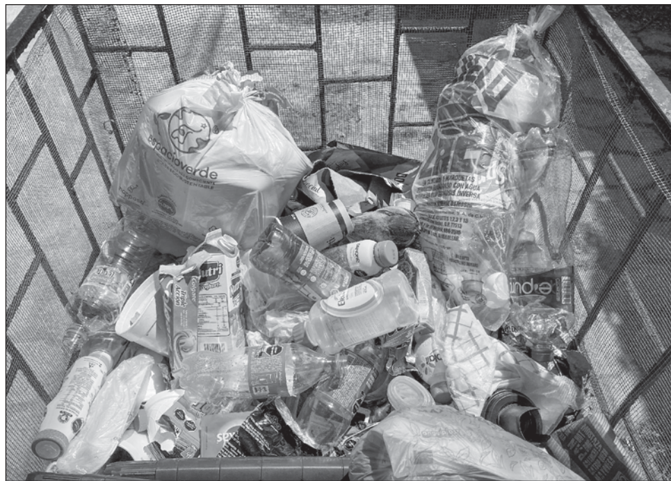
▲ Los autores argumentan que estos hallazgos ponen de relieve la necesidad de un etiquetado obligatorio en productos para hacer cumplir la responsabilidad corporativa.

La investigación internacional liderada por el Instituto Moore de Investigación sobre la Contaminación por Plásticos (EU) y que publica Science Advances señala además que cada aumento de 1 por ciento en la producción de plástico se asocia con un incremento del mismo valor en la contaminación por plástico en el medioambiente. Así, de 2000 a 2019, la producción mundial de este material se ha duplicado a más de 400 millones de toneladas y los