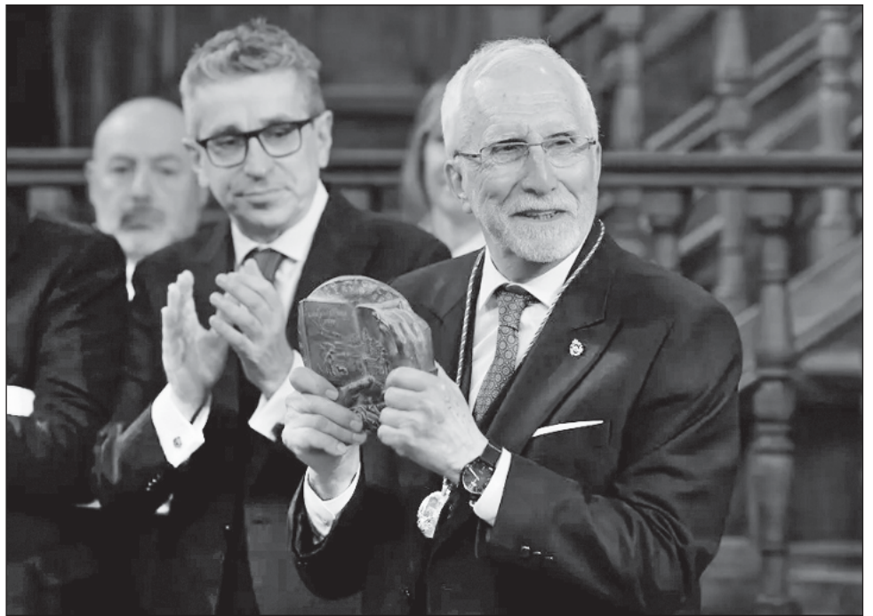
▲ El novelista y cuentista Luis Mateo Díez recibió en el paraninfo de la Universidad de Alcalá de Henares, el Premio Cervantes, consagrándose como un clásico vivo de la literatura en español.

Como es habitual en los discursos de recepción del Premio Cervantes, el galardonado hizo alusión a Don Quijote de La Mancha: El libro que escuché con mayor deleite y aprovechamiento