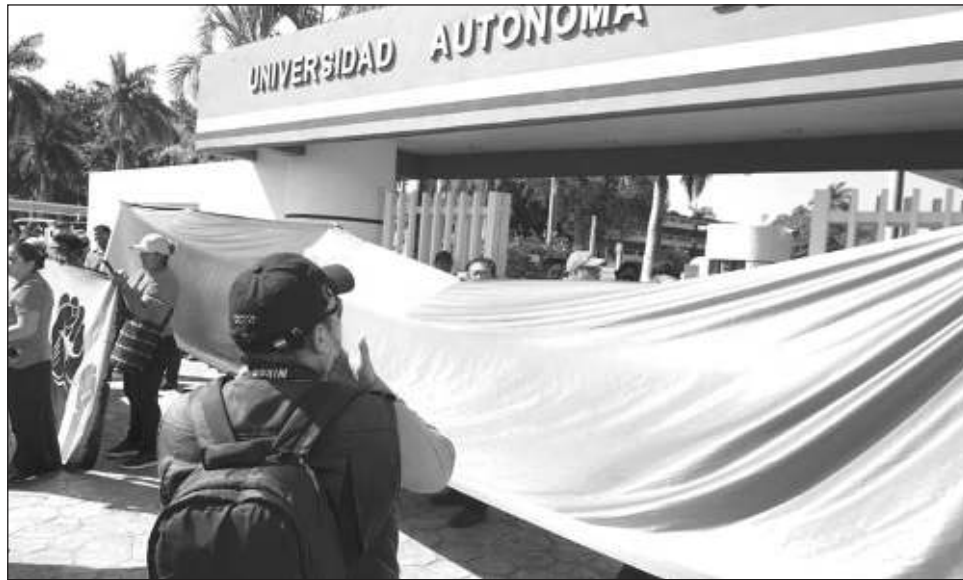
▲ Luego de 17 días de huelga, los manifestantes lograron obtener un aumento salarial del 4 por ciento, además de la revisión de las 100 cláusulas que integran el contrato colectivo.

En un comunicado en que no se detallaron los acuerdos a que llegaron ante las autoridades laborales, la Universidad de Campeche solo convocó a los estudiantes a regresar a las aulas, y anunció que se reprogramarán las fechas de exámenes y de los plazos para los trámites académicos.