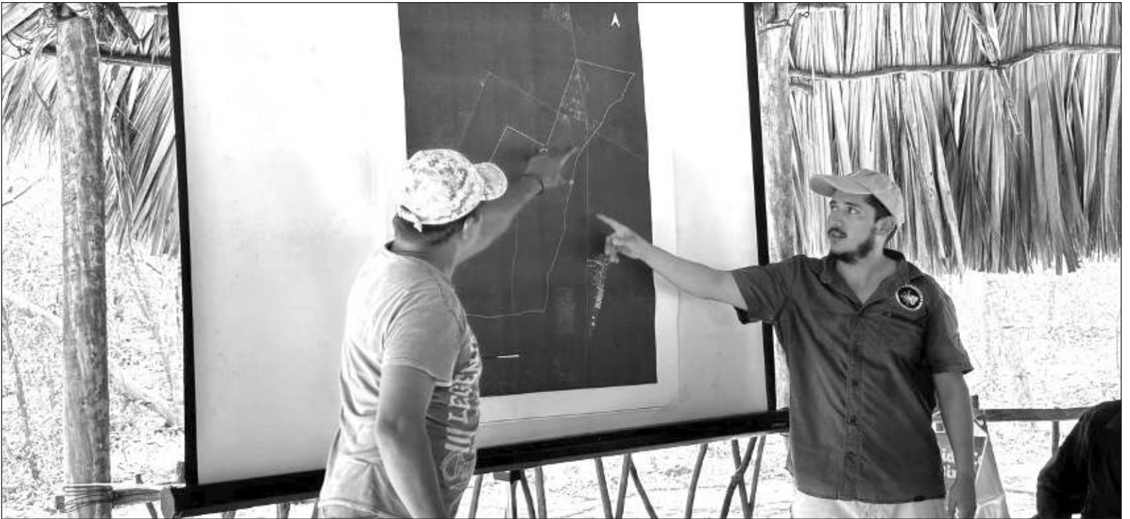
▲ La idea de Camino del Mayab es reactivar la economía en ejidos de Yucatán con prácticas de bajo impacto ambiental.