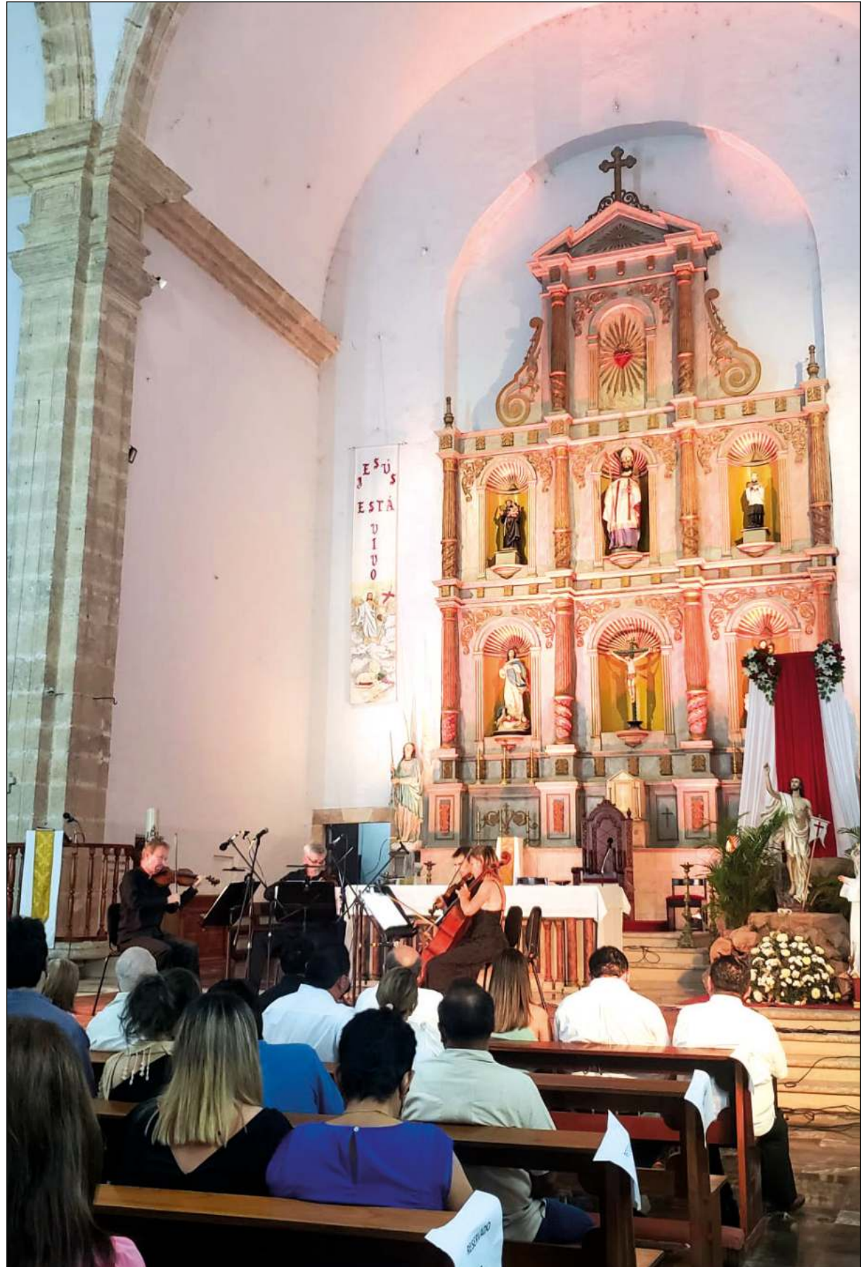
Más de 300 personas pagaron 200 pesos para contribuir a los gastos de mantenimiento del templo.

Para el padre Tuz, el arte también es parte de la evangelización: la iglesia promueve la música, ya que considera que es algo bello "y lo bello siempre nos va a remitir a Dios", concluyó.