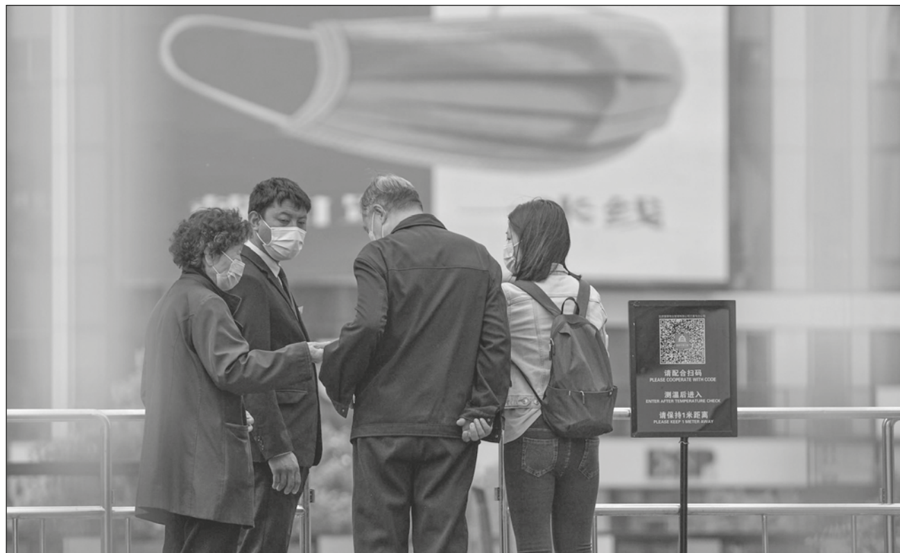
▲ El anuncio sobre las nuevas medidas contra contagios de Covid-19 provocó compras de pánico el domingo por la noche. Las verduras, huevos, salsa de soya y otros artículos se agotaron de los estantes de los supermercados.

Un nuevo brote ha infectado al menos a 41 personas,