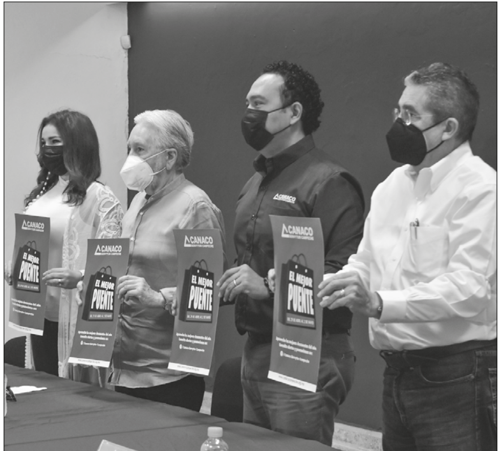
▲ El Mejor Puente fue presentado por la Canaco y el CCE Campeche.

La propuesta de la Canaco para los participantes es que sean un negocio formalmente establecido, que hagan ofertas atractivas para la temporada, registrarse en el portal www.elmejorpuente.com , informar a Cámara si tienen venta en línea, y enviar logotipo de la empresa y listado de sucursales con domicilio y página web.