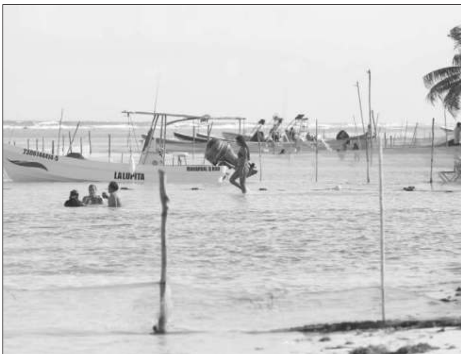
▲ La industria hotelera reconoce que sí hay sargazo, pero no todos los días ni en todas las playas, por lo que el sector se enfoca en promocionar los arenales limpios.