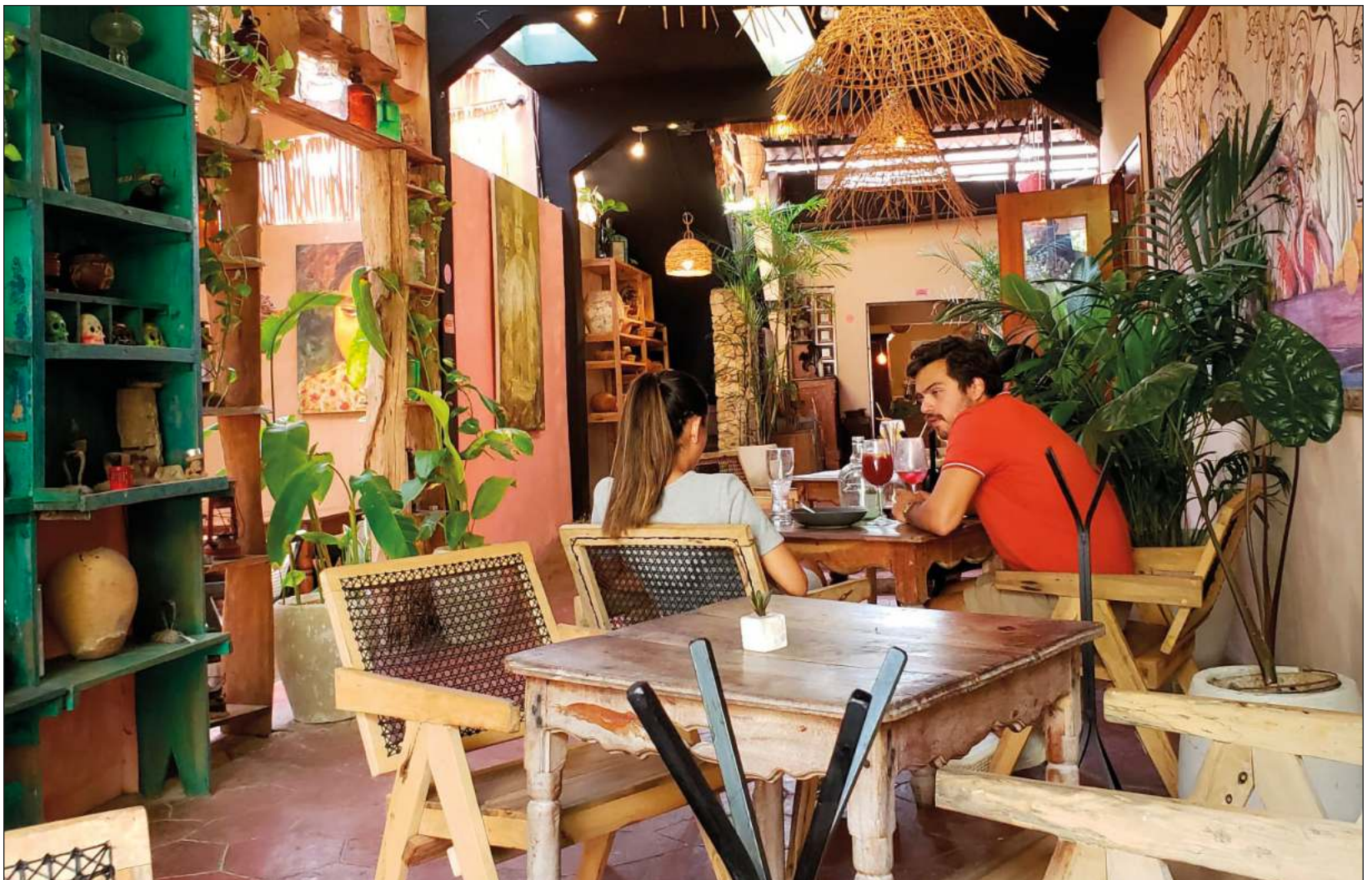
La oferta gastronómica en Valladolid es amplia. Los comensales pueden hallar establecimientos de cocina japonesa, italiana o de carnes.

“El crecimiento de ha sido paulatino y dentro de otros siete años no vamos a reconocer lo que estamos viendo hoy”