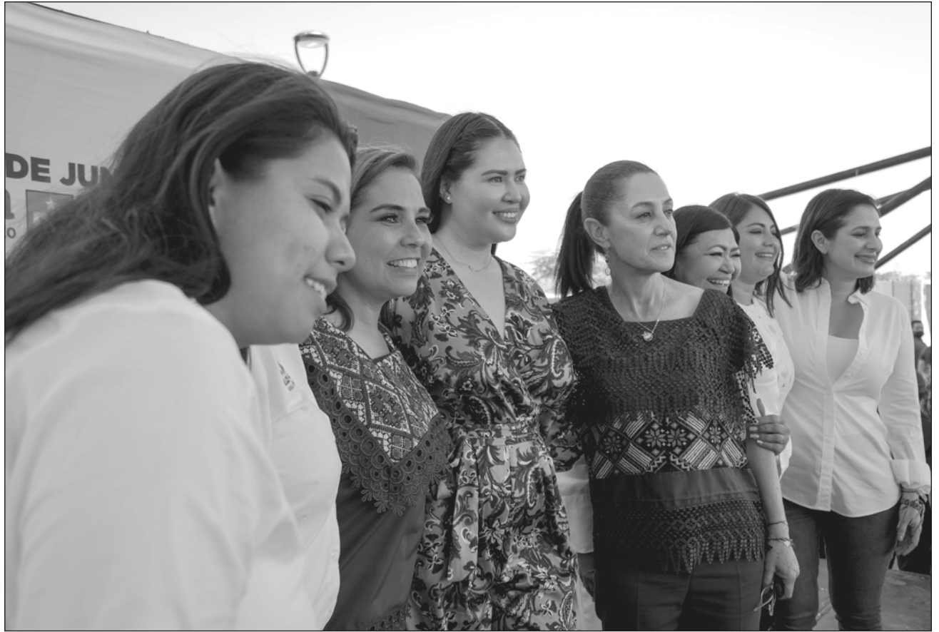
▲ La candidata de Morena estuvo acompañada por Claudia Sheinbaum, jefa de gobierno de la Ciudad de México.

“A lo largo de la historia a las mujeres se nos ha tratado de someter, hacernos a un lado, excluirnos de la vida pública y relegarnos de la toma de decisiones”, prosiguió la candidata. Esa