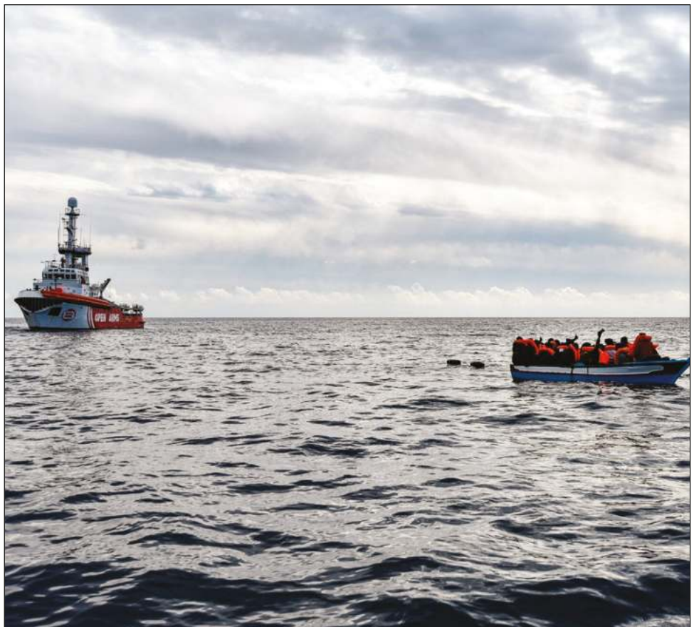
▲ Personas procedentes sobre todo de África subsahariana viajan a Túnez con el objetivo de llegar luego a Europa, atravesando en precarias embarcaciones.

En 2021, cerca de 2 mil migrantes han desaparecido o perecido ahogados en el Mediterráneo, contra mil 401 en 2020, según la Organización internacional para las migraciones (OIM).