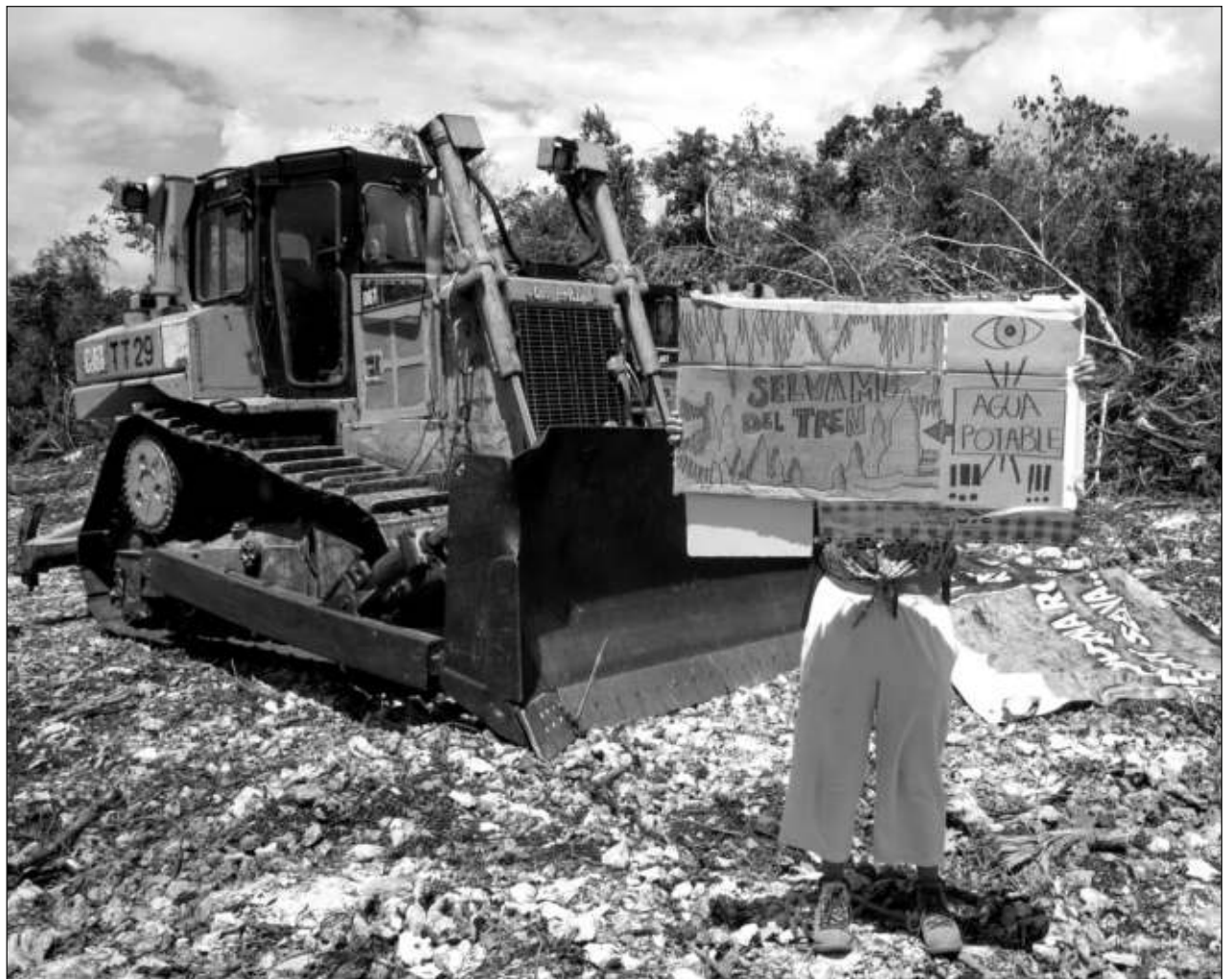
▲ El sábado, en Playa del Carmen, ambientalistas colocaron letreros de “clausurado” a maquinaria utilizada en el tramo 5 Sur e hicieron un recorrido para comprobar las condiciones del terreno, donde reportan el hallazgo de varias cuevas.

los interesados a visitar esta región de Quintana Roo (entre Playa del Carmen y Tulum) y hablar con pobladores, comunidades indígenas y familias de ejidatarios que viven a lo largo del tramo 5 del tren, “así se enterarán que sí se informó y consultó a la gente. A lo largo del Tren Maya la gente sabe del proyecto y se ha consultado comunidad por comunidad, además de que su construcción se lleva a cabo protegiendo el medio ambiente y patrimonio arqueológico y no se afectarán cenotes, ríos subterráneos ni cavernas”.