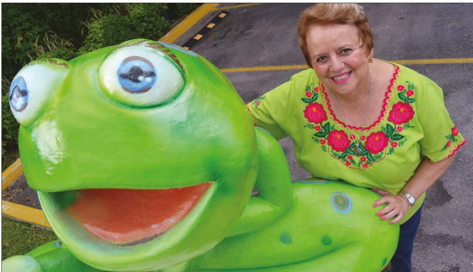
▲ “Este 25 de abril cumpla mis primeros 72 años. La tendencia siempre ha sido esconder la edad cuando tendría que ser motivo de júbilo”.