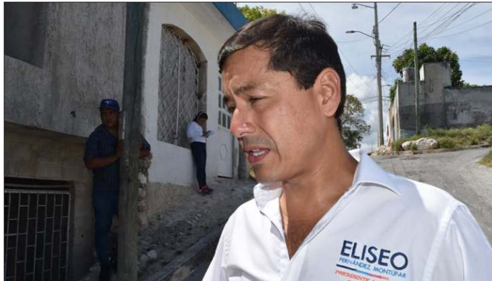
▲ La Fiscalía Anticorrupción de Campeche solicitó la comparecencia del ex alcalde E.F. M., y el hecho de que éste no haya comparecido originó una orden de aprehensión en su contra.

Durante la entrega de uniformes a mil agentes de la