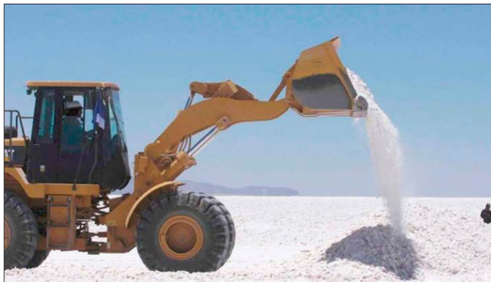
▲ Las reservas de carbonato de litio estimadas en el yacimiento concesionado a Bacanora Lithium ascienden a 8.8 millones de toneladas y se necesitarían 250 años para agotarlas.

El mayor yacimiento de litio en México conocido hasta el momento y catalogado como el prospecto con el mayor depósito de mineral del mundo, será explotado por compañías extranjeras hasta 2115; sin embargo, el presidente An-