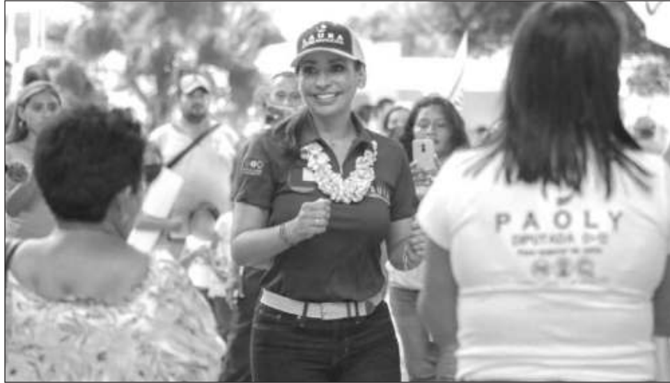
▲ Aseguró que incluirá a José María Morelos al programa turístico estatal.

Anunció que durante su gobierno se fomentará el turismo rural y alternativo para mejorar a las familias de esta región, donde recibió el respaldo de los habitantes de las comunidades de Felipe Carrillo Puerto y José María Morelos. Señaló que la Ruta de las Iglesias, donde se refleja el pasado colonial de Quintana Roo, debe promoverse como un gran atractivo cultural.