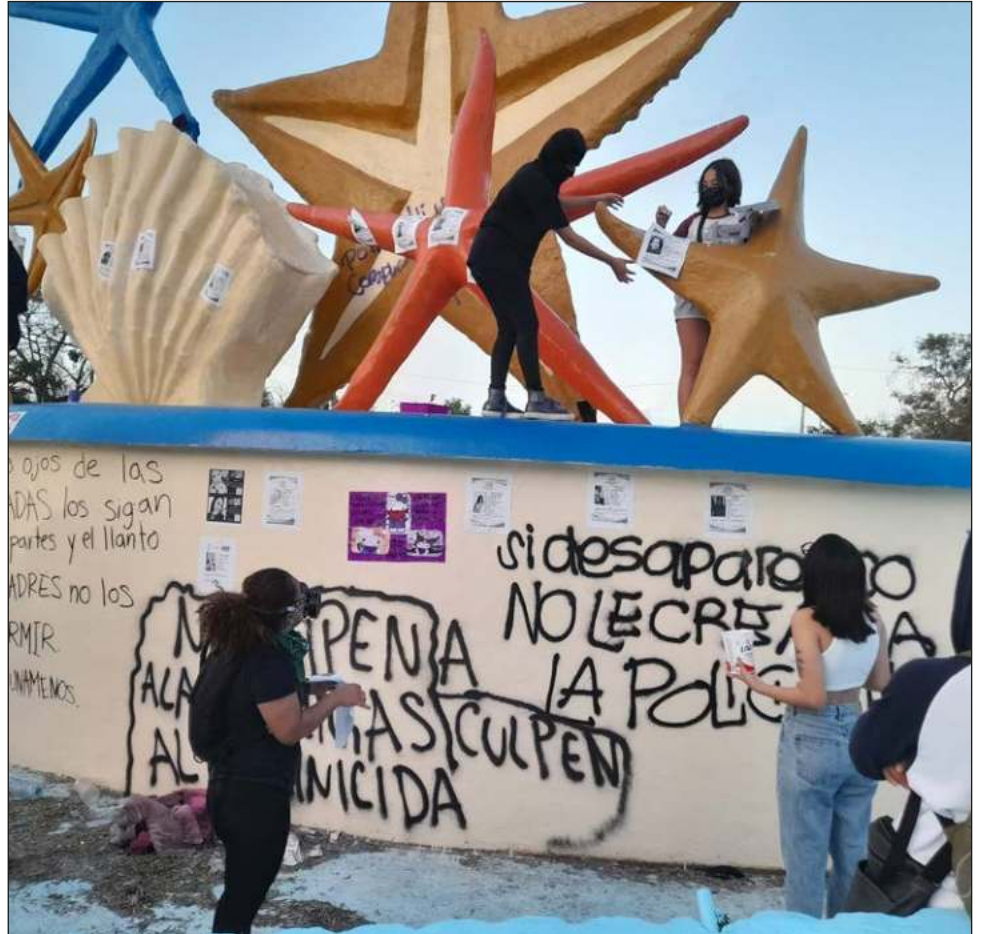
▲ En Cancún, las activistas hicieron una velada a las 18 horas en la glorieta del Ceviche, exigiendo un alto a la violencia feminicida.