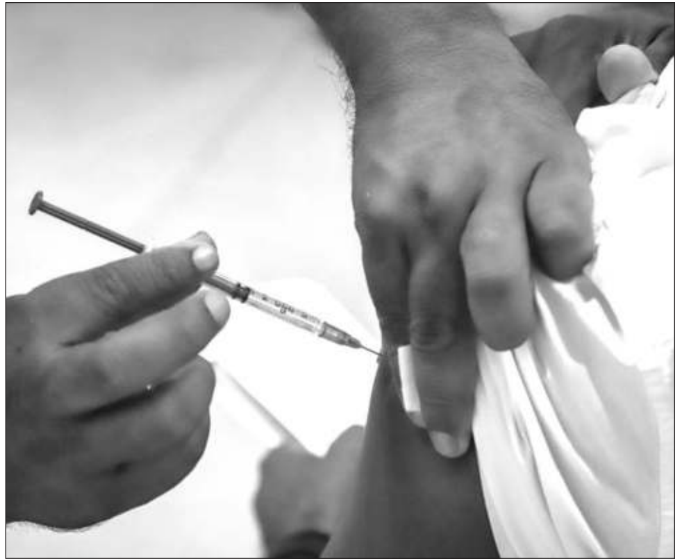
▲ Para personas adultas mayores y personal de salud tanto de hospitales públicos y privados, la aplicación será el 25 para quienes nacieron en enero o febrero.

Recuerdan también acudir con ropa de manga corta para realizar la aplicación, así como tomar los medicamentos y alimentos como de costumbre.