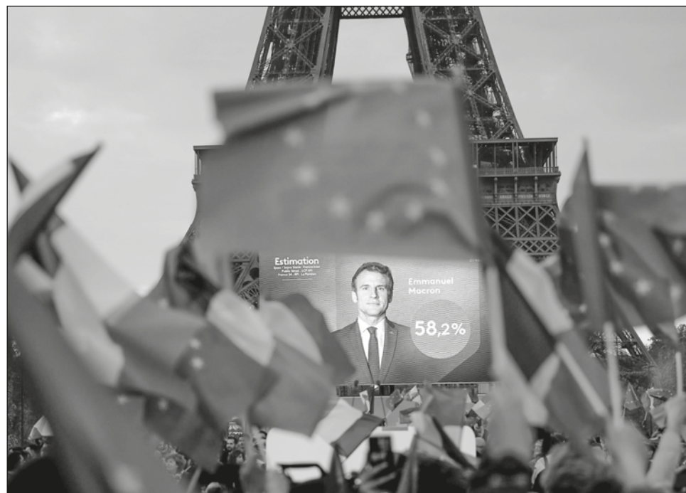
▲ Con entre 57.6 y 58.2 por ciento de votos, el candidato de La República en Marcha (LREM), de 44 años, derrotó de nuevo a su rival ultraderechista, Marine Le Pen.

La crisis de los chalecos amarillos fue su máximo exponente. Esta protesta, surgida en 2018 por el alza de los precios del combustible, se extendió por Francia para