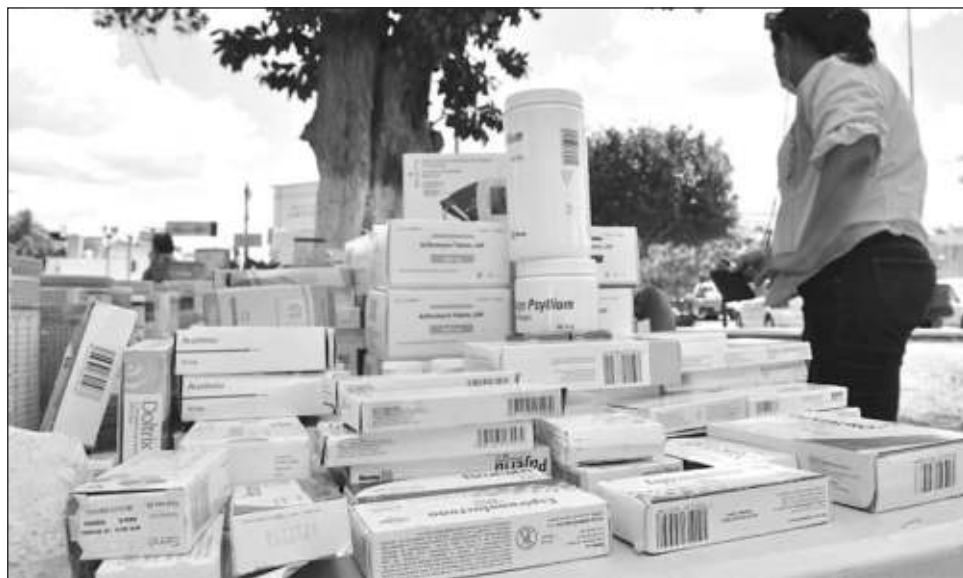
▲ Se encuentran instalados estratégicamente 18 contenedores en Campeche.

Ante ello, el Sistema Nacional de Gestión de Residuos en Envases de Medicamentos a.c. (SINGREM), dispuso de los contenedores en diversos puntos de la ciudad. SINGREM es una asociación civil sin fines de lucro, única en su tipo en México y surgió en el 2008