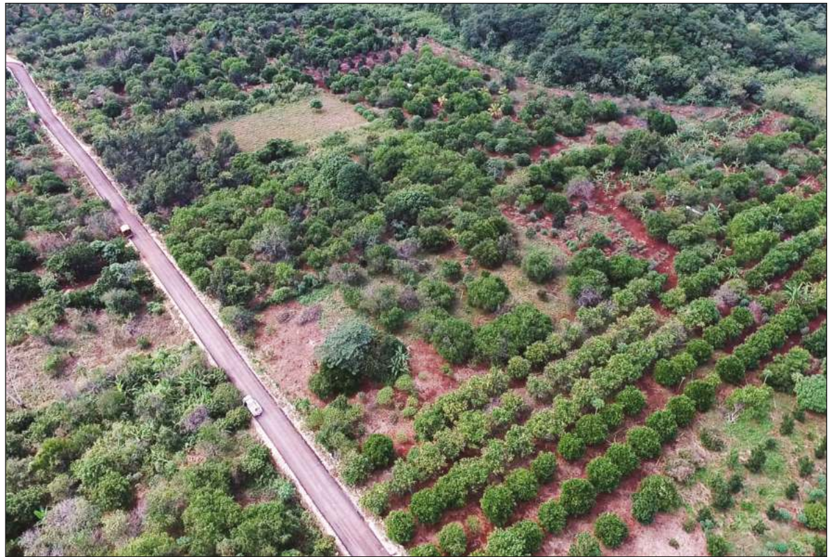
▲ "¿Cuáles son sus propuestas de gobierno en relación a la seguridad y soberanía alimentaria en un estado donde en el 2020 el 70% de la población no tenía acceso a la alimentación nutritiva?".

NO OBSTANTE, ALGUNAS unidades productivas parecen sí tener claro el rumbo que debe seguir la Seguridad Alimentaria en Quintana Roo. Del 11 al 14 de marzo pasados nos trasladamos al municipio de José María Morelos, Quintana Roo (JMM) para conocer el desarrollo de tres unidades productivas y dos asociaciones civiles en favor de la SSA. En esta