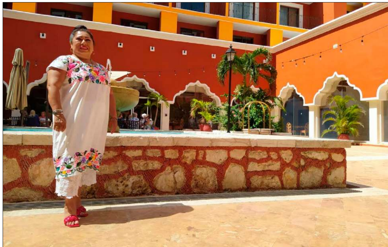
▲ “Aquí me hospedo hasta que me muera”, sentencia la mujer que asiduamente visita el hotel.

“Todos querían estar en el mejor lugar. Comenzaron a buscar haciendas, pero yo