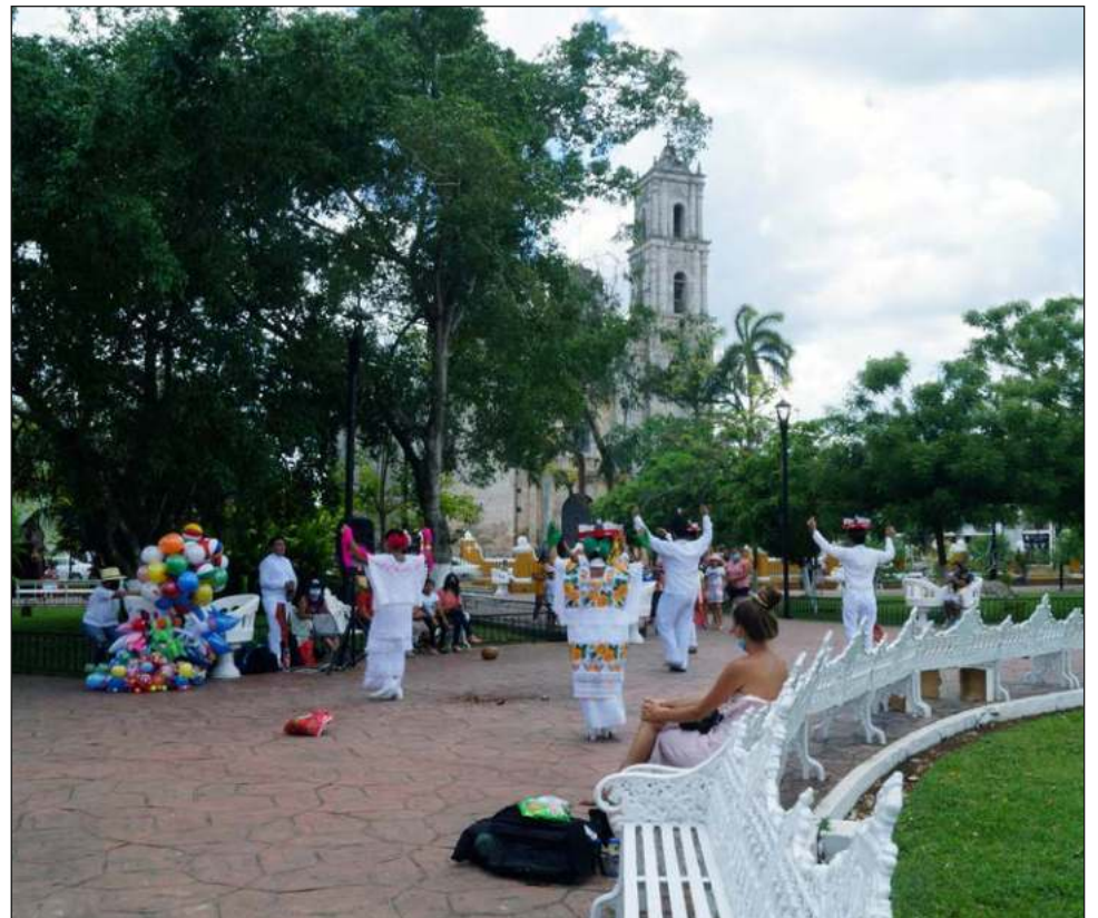
Por los alrededores de Valladolid ya es prácticamente imposible caminar sin toparse con turistas nacionales o extranjeros y trabajadores del Tren Maya.

La cultura, tradición, vanguardia y crecimiento convergen en la perla del sureste, uno de los nuevos viejos destinos que redescubrimos para nuestros lectores con el objetivo de invitarlos a reconocerlo.