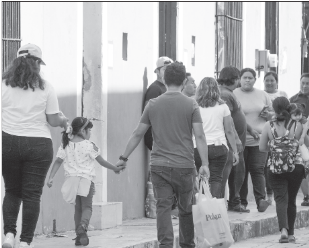
▲ “La democracia mexicana no será moderna ni políticamente eficiente en una mar de pobreza y desigualdad. Esto lo habrá aprendido ya el presidente López Obrador y habrá que insistirles a los aspirantes que lo hagan”.

Uno de sus más agresivos componentes es la desigualdad económica cuya persistencia, extensión y profundidad obliga a tener siempre presente sus raíces históricas: concentración secular de la riqueza, de la propiedad y del poder político. Y de ahí, la oprobiosa desigualdad