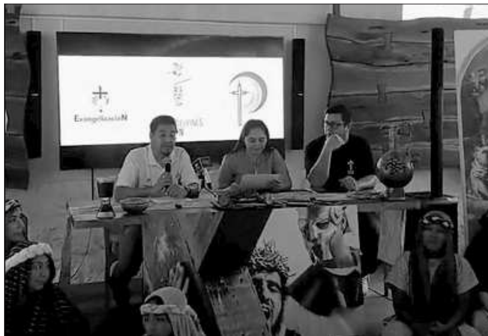
▲ En los últimos tres meses los cerca de 80 participantes voluntarios, que son familias cancenenses, han estado ensayando para el evento, al que se han sumado foráneos.

El año pasado, cuando se retomó el proyecto luego de la pandemia, se registraron