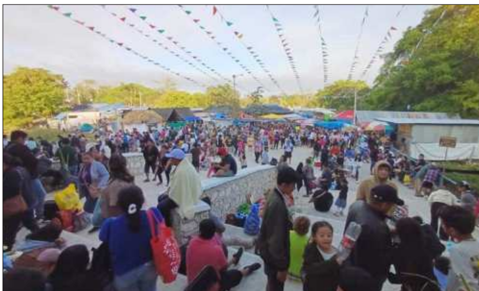
▲ Desde el viernes 27 de marzo inició el peregrinar de devotos al Santuario de la Virgen de Chuiná, mismo que se prolongará hasta el jueves Santo.

Los visitantes buscan áreas comunitarias para estacionar sus unidades, "colgar" sus hamacas de los árboles cercanos o instalar sus casas de campaña, para posteriormente acudir al Santuario de la Virgen de Chuiná, encender sus veladoras, aceites o entregar sus promesas.