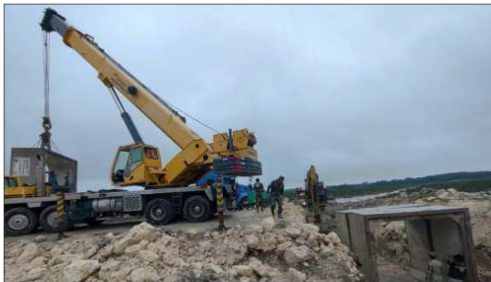
▲ Autoridades avanzan en los trabajos en la carretera 186, que quedó incomunicada, colocando cajas de concreto, haciendo relleno y compactado material.

Denunciaron que el martes 22 de octubre fue personal