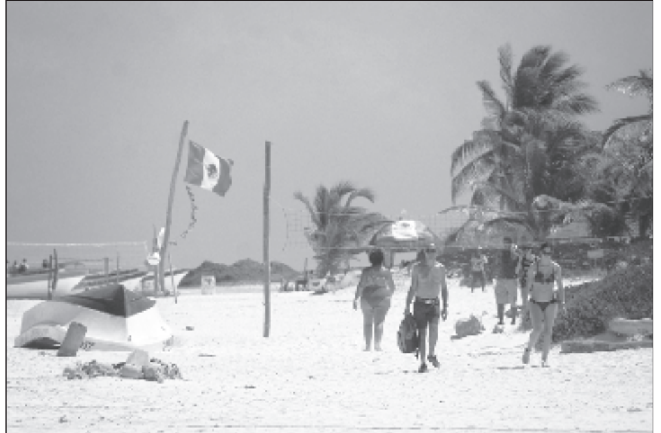
▲ Las tendencias indican que 2025 será el año de las experiencias de viajes inmersivas y compartidas, en las que Tulum ocupa el segundo puesto.

"Skyscanner ha publicado un reciente informe de tendencias de viaje a 2025 donde en España el destino