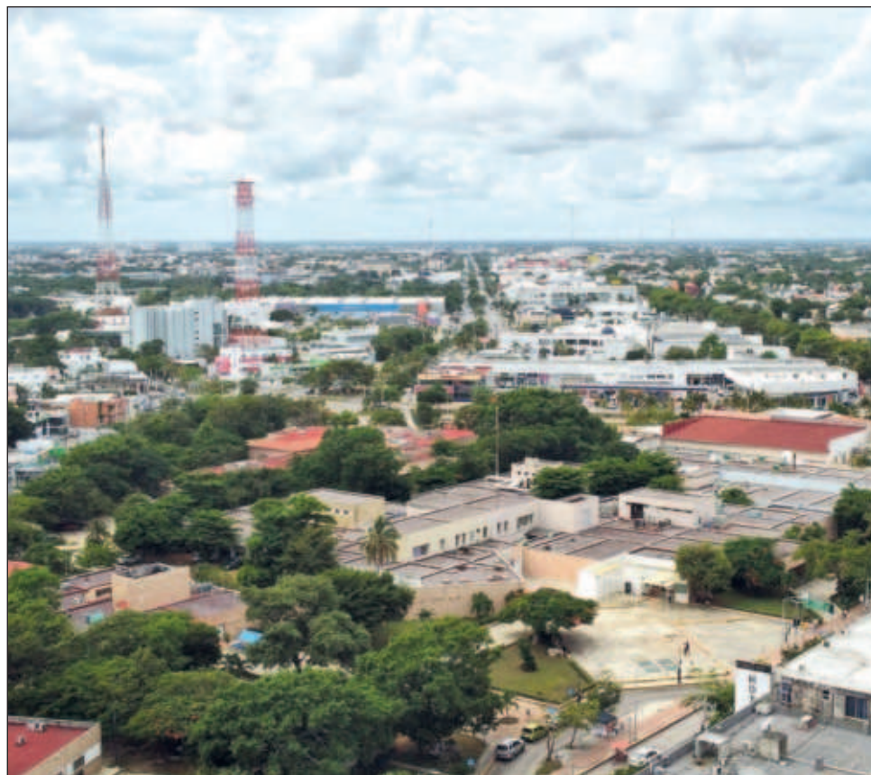
▲ La presidenta Claudia Sheinbaum manifestó que se trabaja en coordinación con la gobernadora Mara Lezama, quien promueve la inversión y protege las reservas naturales.

“Muchas veces se venden cuartos de hotel muy caros, principalmente para turismo extranjero, y las y los trabajadores no tienen las mismas condiciones de bienestar, y nosotros lo que queremos es que vengan las inversiones, que haya desarrollo pero con bienestar y protección del medio ambiente”, mencionó la mandataria.