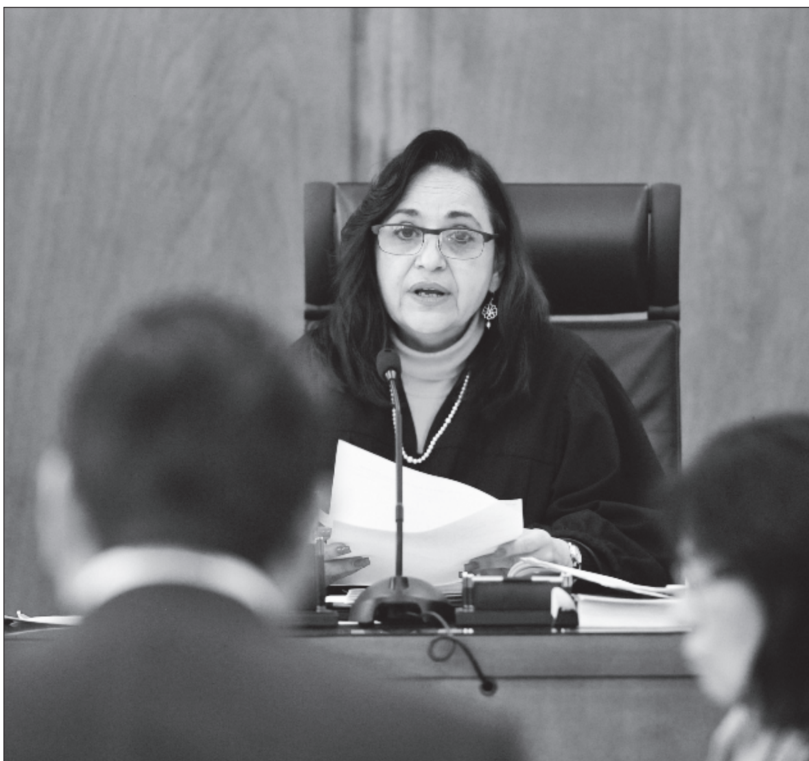
▲ "Ahora su nuevo riesgo se decidirá en el Tribunal Electoral del Poder Judicial de la Federación, donde la facción dominante, integrada por tres de cinco magistrados, está por resolver si es procedente la elección de juzgadores".