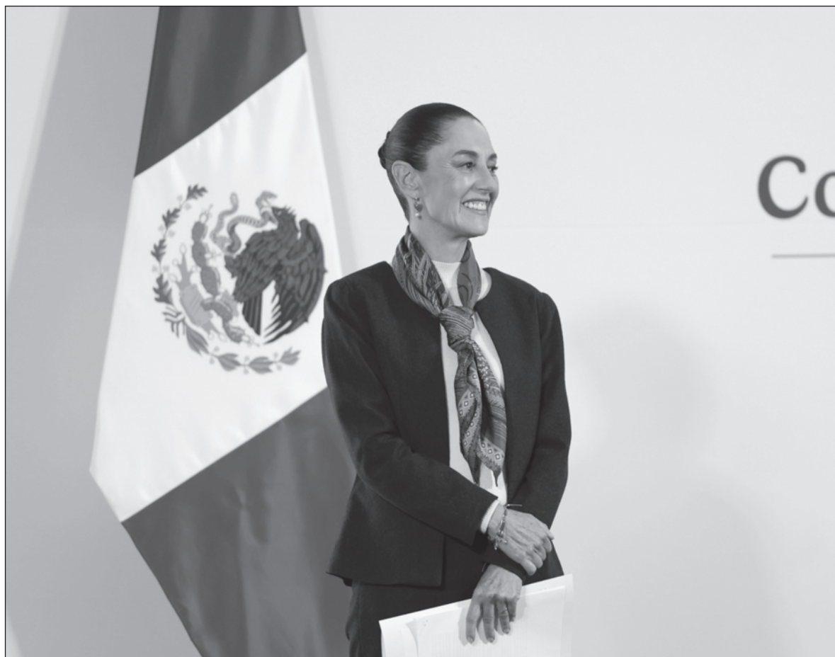
▲ “Habrá que reconocer que Claudia es una mujer de temple, ni se ha quejado ni ha arrojado culpas. Creo que nunca lo haría porque también es leal y firme. Está resistiendo con serenidad, inteligencia y mucha paciencia”.

“ SOY MADRE, ABUELA , científica y mujer de fe, y a partir de hoy, por voluntad del pueblo de México, la presidenta constitucional de los Estados Unidos Mexicanos. Gobernaré para todos y para todas, y tengan la certeza de que pondré mi conocimiento, mi fuerza, mi historia y mi vida misma al servicio del