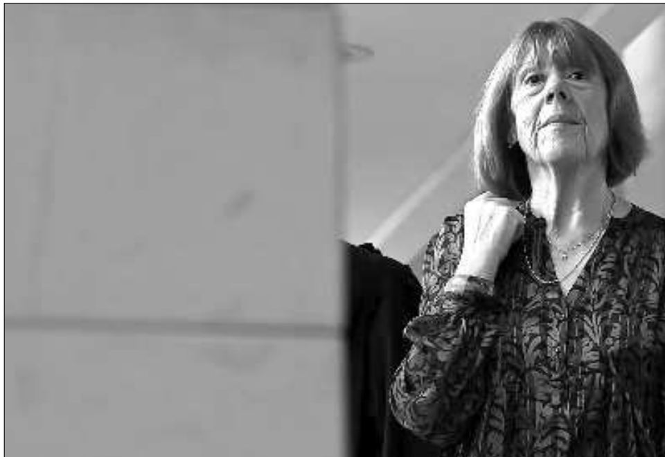
▲ Muchos de los acusados afirman que no se dieron cuenta del estado inconsciente de Gisèle. El veredicto de este proceso está previsto hacia el 20 de diciembre.

El veredicto de este proceso, que ha dado la vuelta al mundo, está previsto hacia el 20 de diciembre.