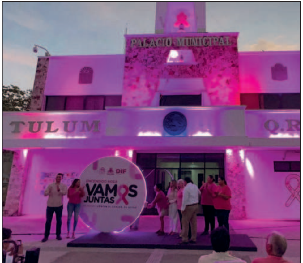
▲ Autoridades intensifican los esfuerzos en la detección temprana.

Expuso que aunque octubre es el mes de la concienciación sobre el cáncer de mama, las iniciativas de prevención deben llevarse a cabo de manera continua a lo largo del año.