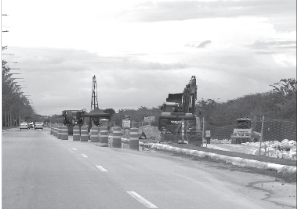
▲ Los hechos de romper los sellos de clausura de obra, bajo el consentimiento de la Sedena, conllevan a una multa por encima de los 18 millones de pesos.

En este caso, la denuncia ingresada el pasado viernes en la FGR, apenas será aceptada, por lo que no tiene folio. Sin embargo, la Smapac también está cuantificando los daños en este rubro para posteriormente dar los por menores a la agencia.