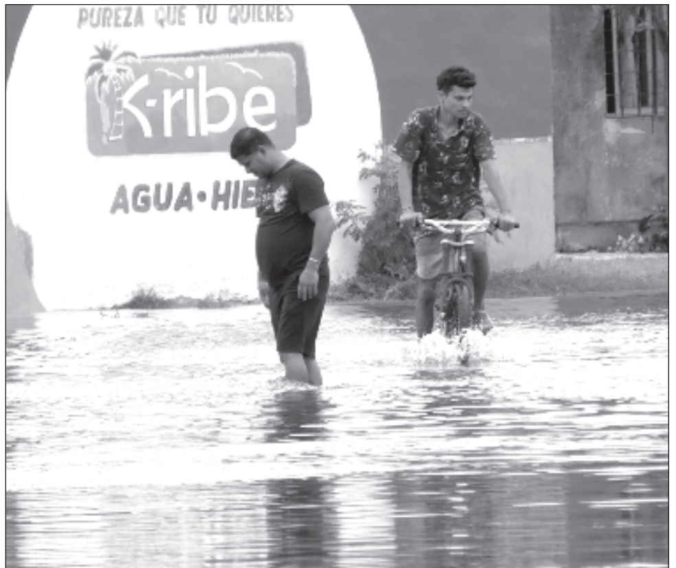
▲ Ante los estragos que han generado las lluvias de los últimos días, el gobierno del estado gestionó ante la Comisión Nacional del Agua (Conagua) el traslado e instalación de equipos de bombeo para desalojar el agua que inunda

calles y predios en diversas áreas de la unidad habitacional Siglo XXI. La ayuda también consistió en la distribución de despensas entre decenas de familias afectadas en la referida demarcación.