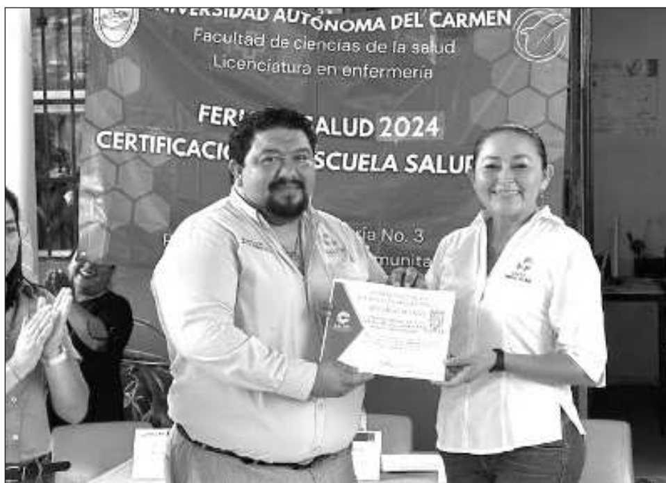
▲ El certificado fue entregado por la Secretaría de Salud, luego de que el plantel educativo cumpliera satisfactoriamente los lineamientos establecidos por el componente de escuela y bienestar.

Cabe señalar que, entre los criterios de evaluación para obtener esta certificación, destacan la cobertura de vacunación en los niños, eliminación de criaderos de mosquitos, alimentación sana, valoraciones de salud visual, auditiva, peso y talla, limpieza del entorno, entre otros lineamientos.