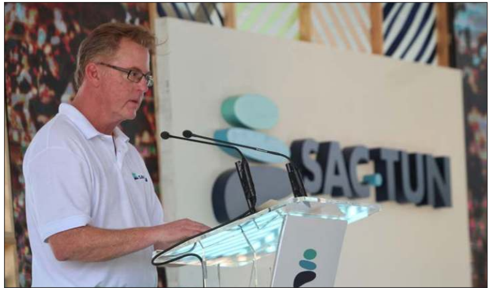
▲ De acuerdo con las autoridades mexicanas, la actividad en la región de la empresa estadounidense ha provocado daños al medio ambiente y pérdida irrecuperable del subsuelo.

De acuerdo con las autoridades mexicanas, la ac-