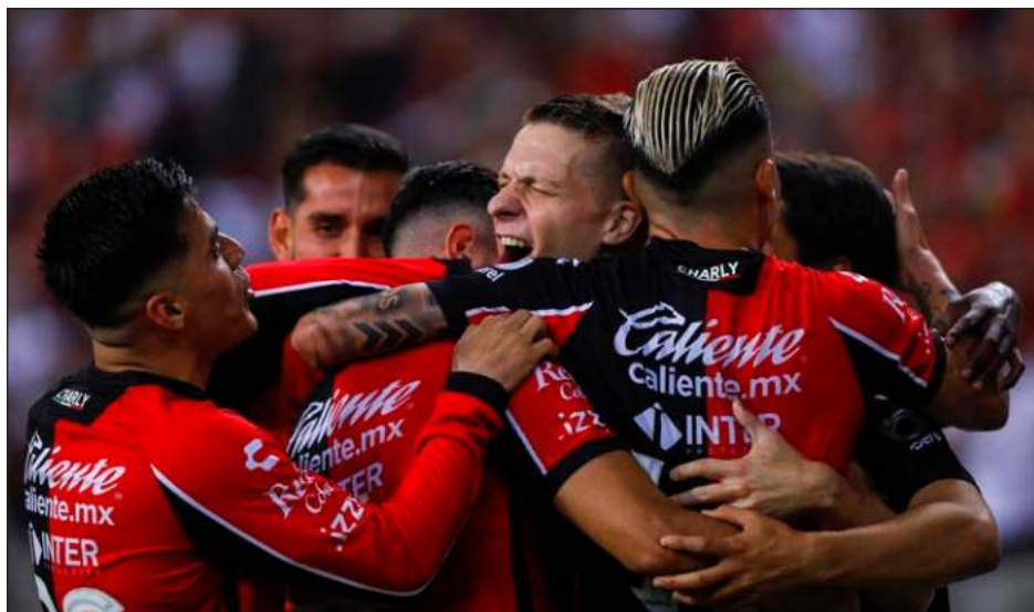
▲ Los Rojinegros tendrán que superar al líder general Pachuca para conquistar el bicampeonato.

Atlas terminó tercero en la tabla en la fase regular con 27 puntos, 11 menos