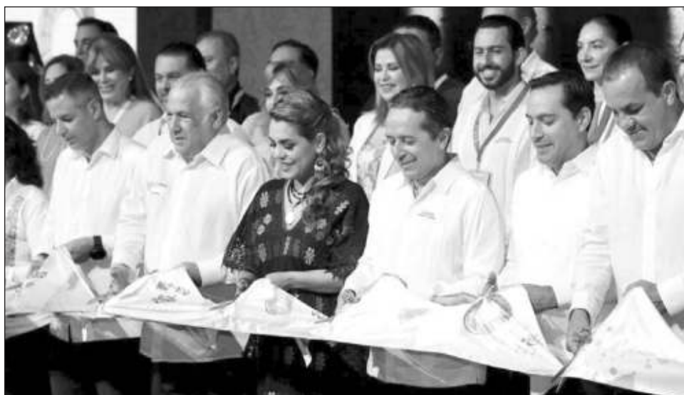
▲ El corte del listón del Pabellón del Caribe Mexicano fue encabezada por el gobernador Carlos Joaquín, quien estuvo acompañado de autoridades federales y estatales.

“Fue un diálogo abierto en el que los empresarios expresaron preocupaciones, solicitudes y a su vez él nos dio un panorama de la parte internacional, y lo importante que es diversificarse”, concluyó.