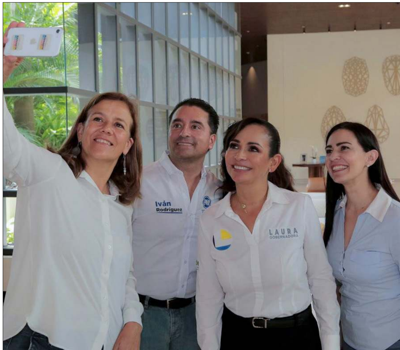
▲ Los abanderados de Va por Q. Roo están comprometidos en serio para mejorar la vida de las familias quintanarroenses, aseguró la diputada federal del PAN, Margarita Zavala, durante su visita a Cancún.