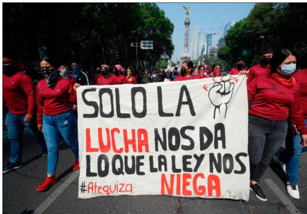
▲ "Por largas décadas, gobiernos y grupos dominantes han visto en estas escuelas focos de agitación, lo que se tradujo en asfixia presupuestal, desdén y abandono".

Es necesario retomar el modelo original de los internados mixtos y asumir que estos espacios pueden ser valiosos factores de superación de rezagos sociales y económicos, motores para la reactivación del campo, sitios de realización para las y los jóvenes del campo e incluso importantes auxiliares para la construcción de la paz en regiones desgarradas por la violencia delictiva, la inseguridad y los conflictos agrarios.