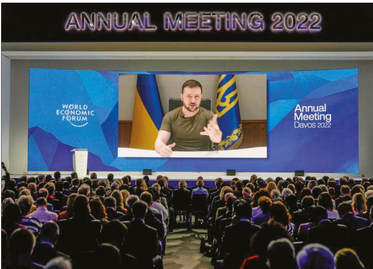
▲ La intervención por videoconferencia de Vladimir Zelensky fue aplaudida de pie por los asistentes a Davos.

Una de las razones por las que Argentina, Colombia o Perú tienen considerablemente una mayor participación de las mujeres en el mercado laboral comparado con México, se debe a la carga de cuidados que se agravó con la pandemia, explicó Ramírez de la O.