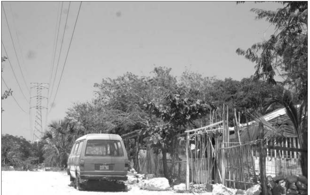
▲ La Agencia de Proyectos Estratégicos del Estado lleva a cabo programas de regularización y comercialización de lotes que actualmente están siendo ocupados de manera irregular, anunció su director general, José Alonso Ovando.

En personal de salud con esquema completo, el total de dosis de refuerzo aplicadas es de 12 mil 934, en adultos mayores de 60 años de 96 mil 572, en el grupo de 50 a 59 años de 112 mil 762, en los de 40 a 49 años de 139 mil 381, en la población de 30 a 39 años de 150 mil 084 y en los de 18 a 29 años de 270 mil 685.