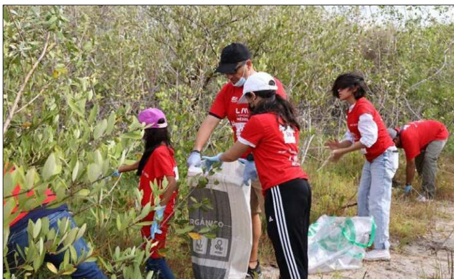
▲ La limpieza se llevó a cabo en la zona de manglar de Chelem en el municipio de Progreso Yucatán.

director general de Fundación Azteca añadió, “Con Limpiemos México por #UnMundoSinResiduos, los jóvenes podrán demostrar por segunda ocasión que son el cambio que necesita nuestro país. Nuestro medio ambiente los necesita y con nuestras acciones podemos hacer la diferencia”.