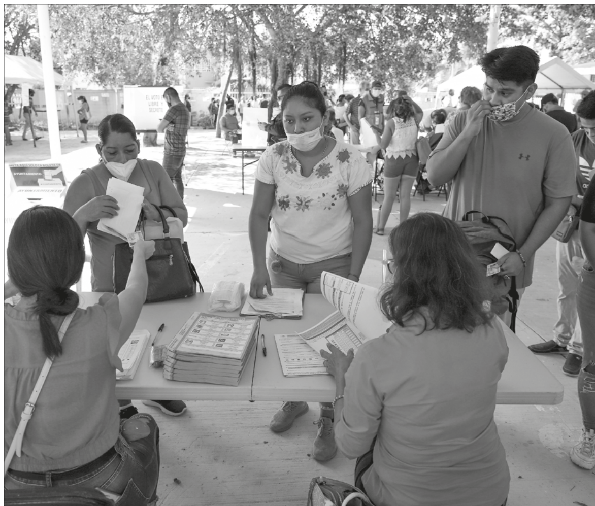
▲ "El reto del INE es cómo hacer la distribución geográfica de cada distrito en el estado, tanto de lo federal como del estatal, tomando en cuenta no solo la población sino la representatividad étnica".

Un criterio asumido por el INE es que una comunidad/municipio con 40% o más de indígenas es considerado indígena