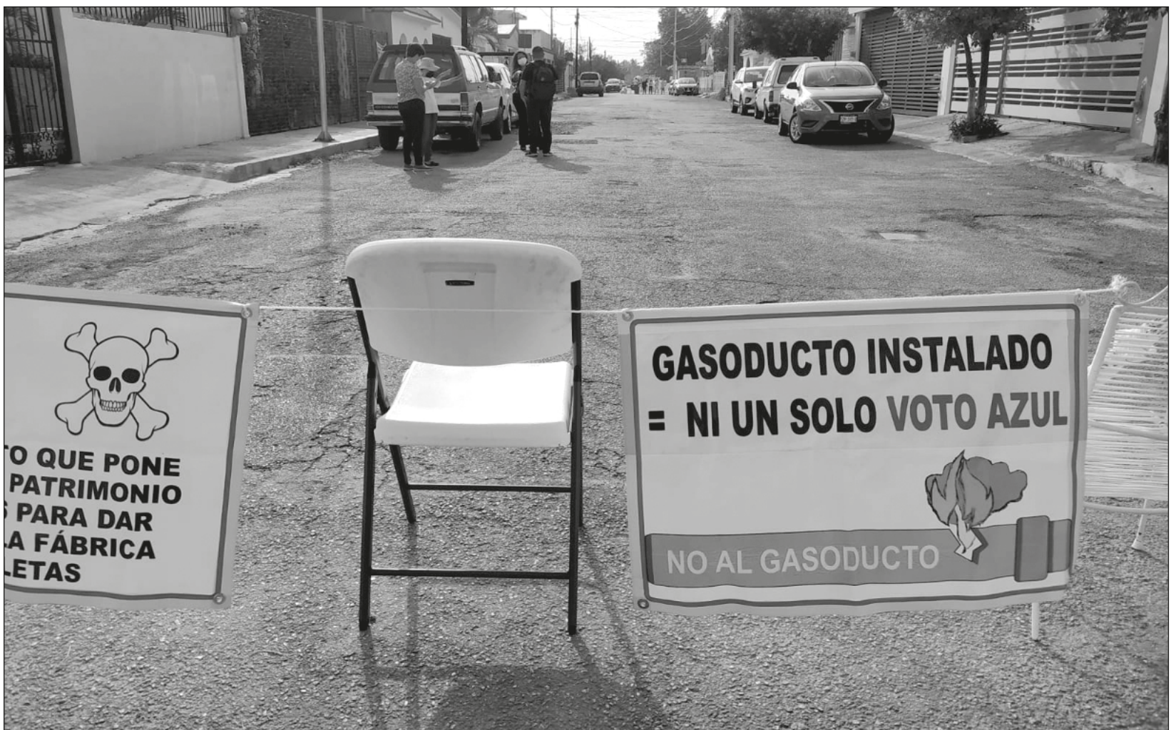
▲ Los colonos bloquearon parcialmente la calle 13 con 46 y 48 del asentamiento; aseguran que no desistirán.

Durante la protesta, se pudo observar una camioneta con el logo de la empresa Engie que se encontraba cerca del lugar con trabajadores y material de construcción, también estuvo una patrulla de la Secretaría de Seguridad Pública (SSP).