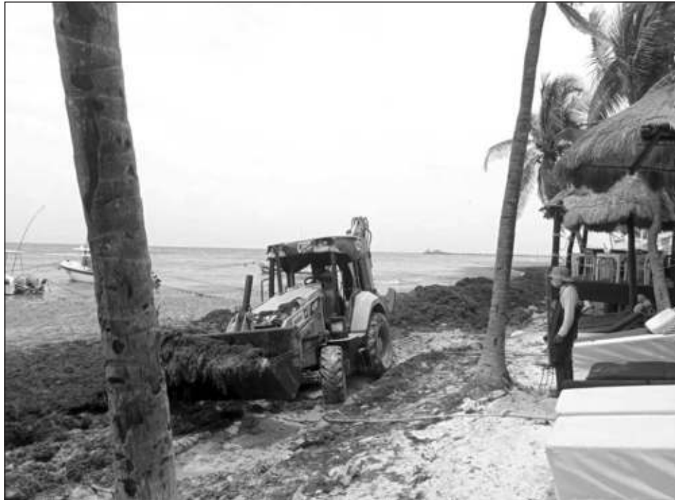
▲ En la playa El Recodo, en el municipio de Solidaridad, fue necesario meter maquinaria pesada a la playa, con la consecuente erosión que viene con ello.

Durante el fin de semana visitantes de los parques Xcaret y Xel Há, de Grupo Xcaret, ubicados en la Riviera Maya, compartieron en redes sociales fotografías del recalcado de sargazo en estos lugares, que alcanzó niveles considerables. En el caso de Xcaret, los turis-