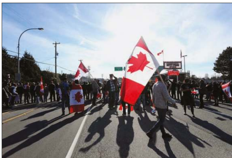
▲ "The extreme right has come to Canada, and its goal is to take over the Conservative Party, the country's current official opposition party".

HE RAILS AGAINST the "elites" despite being a member of parliament - the elite of elites - for his entire adult life. He subscribes and promotes ridiculous conspiracy theories and aims to tap into the discontent that the radical right has with govern-