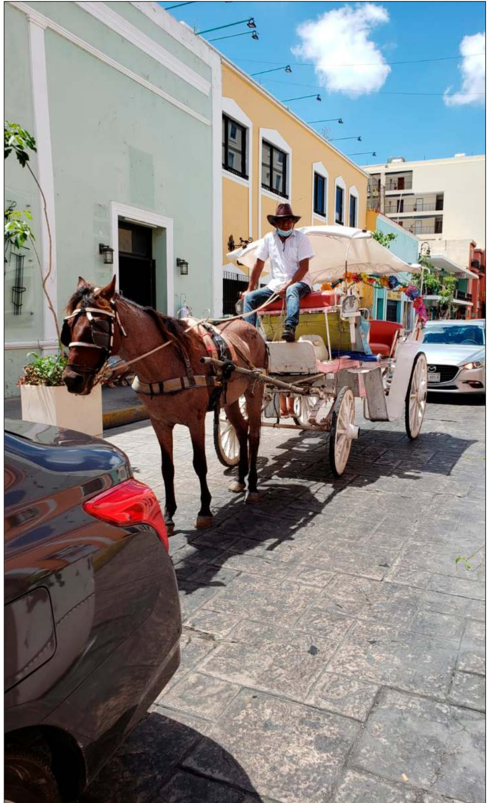
▲ Son 78 los carruajes que prestan servicios turísticos, por lo que seis calesas llegadas de China no serán suficientes para mitigar el presunto maltrato, opinó Arceo.

“¿Cuántos trienios más van a pasar y los animalitos siguen sufriendo? Aunque hagan sus convenios con la UADY, nosotros conocemos la realidad”, concluyó.