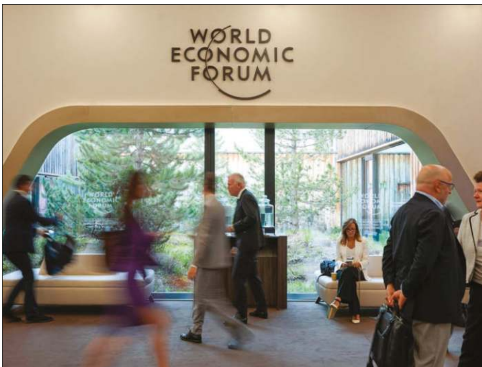
▲ El director del programa de las Naciones Unidas dijo este lunes a los multimillonarios que es "momento de dar un paso al frente" ante la amenaza global de hambruna.

Esta última acudió a una comisaría en 2012 y denunció por "violación" en 2017. Ambas denuncias se archivaron: la primera por la inacción de la denunciante, que no continuó con el proceso, y la segunda al no darse todos los elementos del delito.