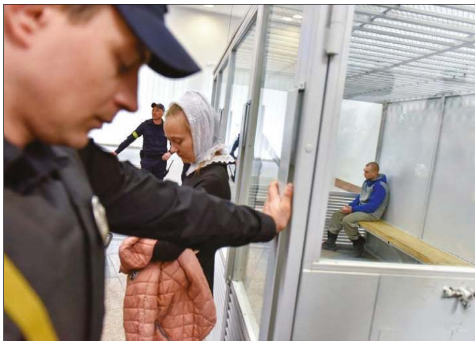
▲ Desde Moscú se ha criticado que el militar no haya contado con la defensa de un abogado ruso; el abogado de Shishimarin declaró que presentará recurso contra la pena.

El abogado había pedido para su defendido la libre