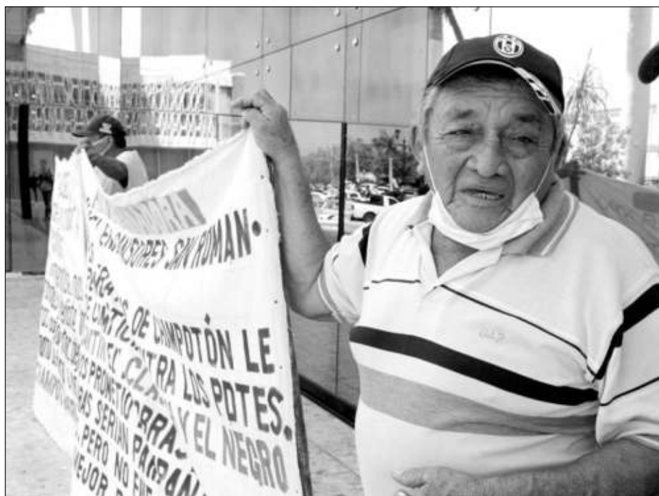
▲ Este lunes fue la segunda vez que obreros de la construcción de Champotón se manifestaron en los bajos de Palacio de Gobierno, y alegan que no son recibidos por la gobernadora.

Al cuestionarle cuáles fueron los resultados de la