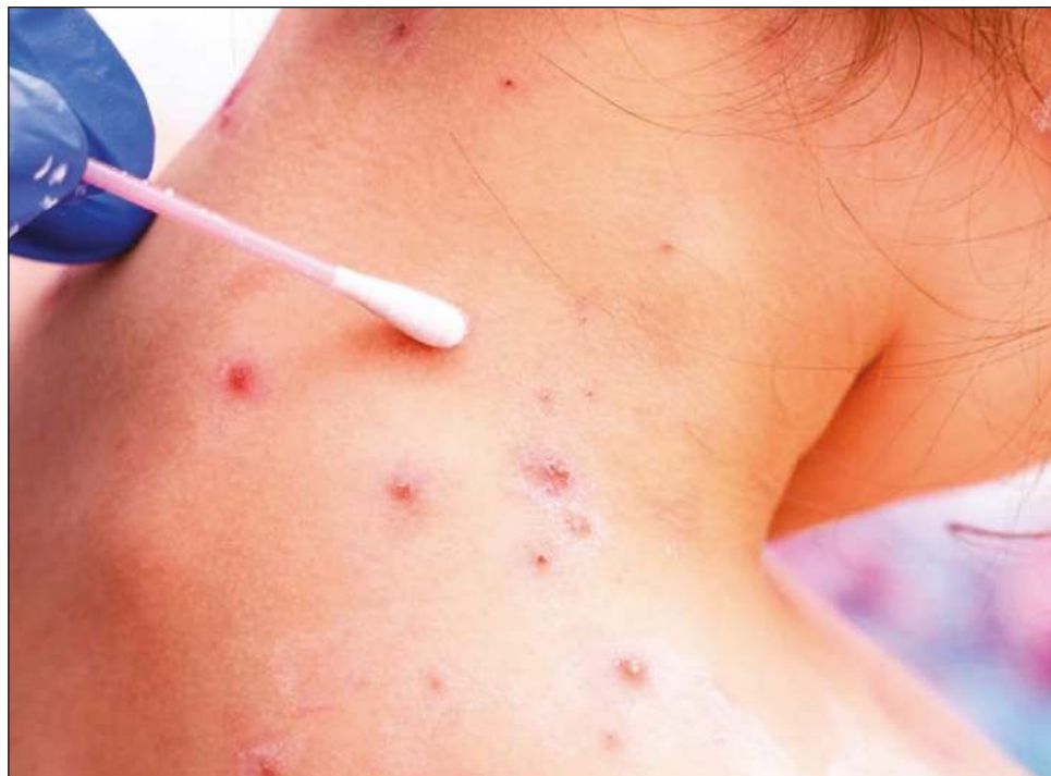
▲ La organización insistió en que una retórica estigmatizadora puede crear un clima de miedo que lleve a mucha gente a no acudir a los servicios de salud.

ONUSIDA recordó que pese a que una importante parte de los 92 casos del actual brote en 12 países se han detectado en personas LGBTTTI, el riesgo de contagio no se limita a ese colectivo, sino a toda persona que haya tenido contacto físico cercano con personas que se hayan contagiado de la enfermedad.