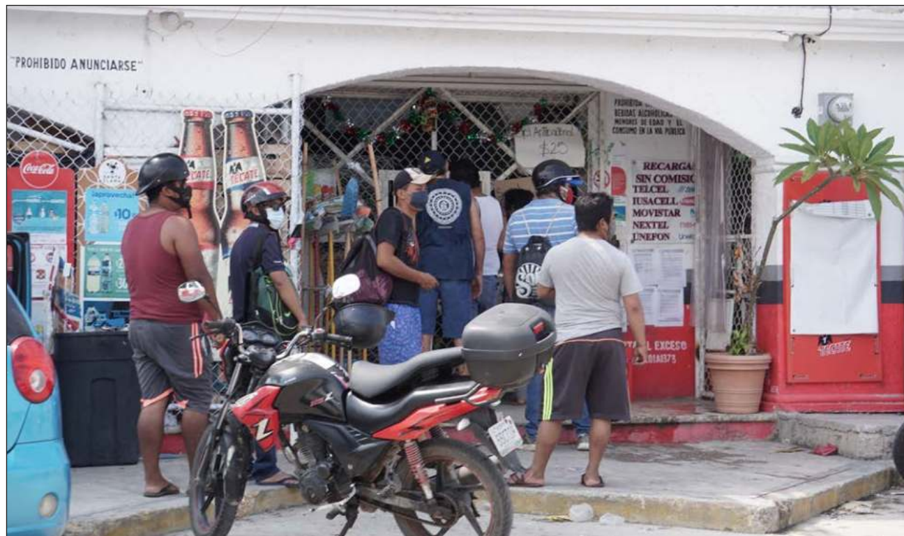
▲ La Copriscam advierte que procederá a aplicar multas a los propietarios que no tengan permiso vigente.

El funcionario destacó que el pasado 30 de abril venció el plazo para que estos establecimientos renovaran sus permisos, por lo han iniciado los recorridos de supervisión de la documentación de estos giros, para verificar que se encuentren dentro del marco legal.