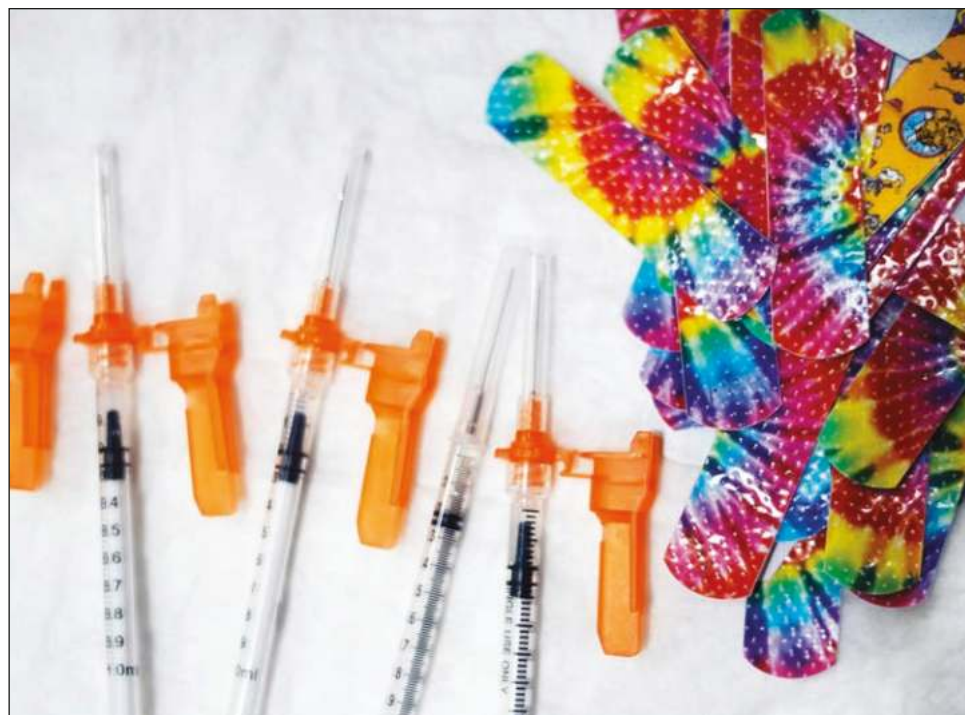
▲ La dosis propuesta para los niños es apenas una décima parte de la cantidad que reciben los adultos; mientras, la FDA ya revisa los datos de la farmacéutica Moderna.

La Administración de Alimentos y Medicamentos (FDA por sus siglas en inglés) ha empezado a revisar los datos de la farmacéutica