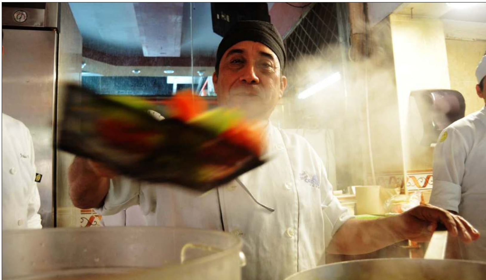
▲ En Quintana Roo, la relajación de medidas sanitarias influyó para que más personas fueran contratadas en hoteles y restaurantes.