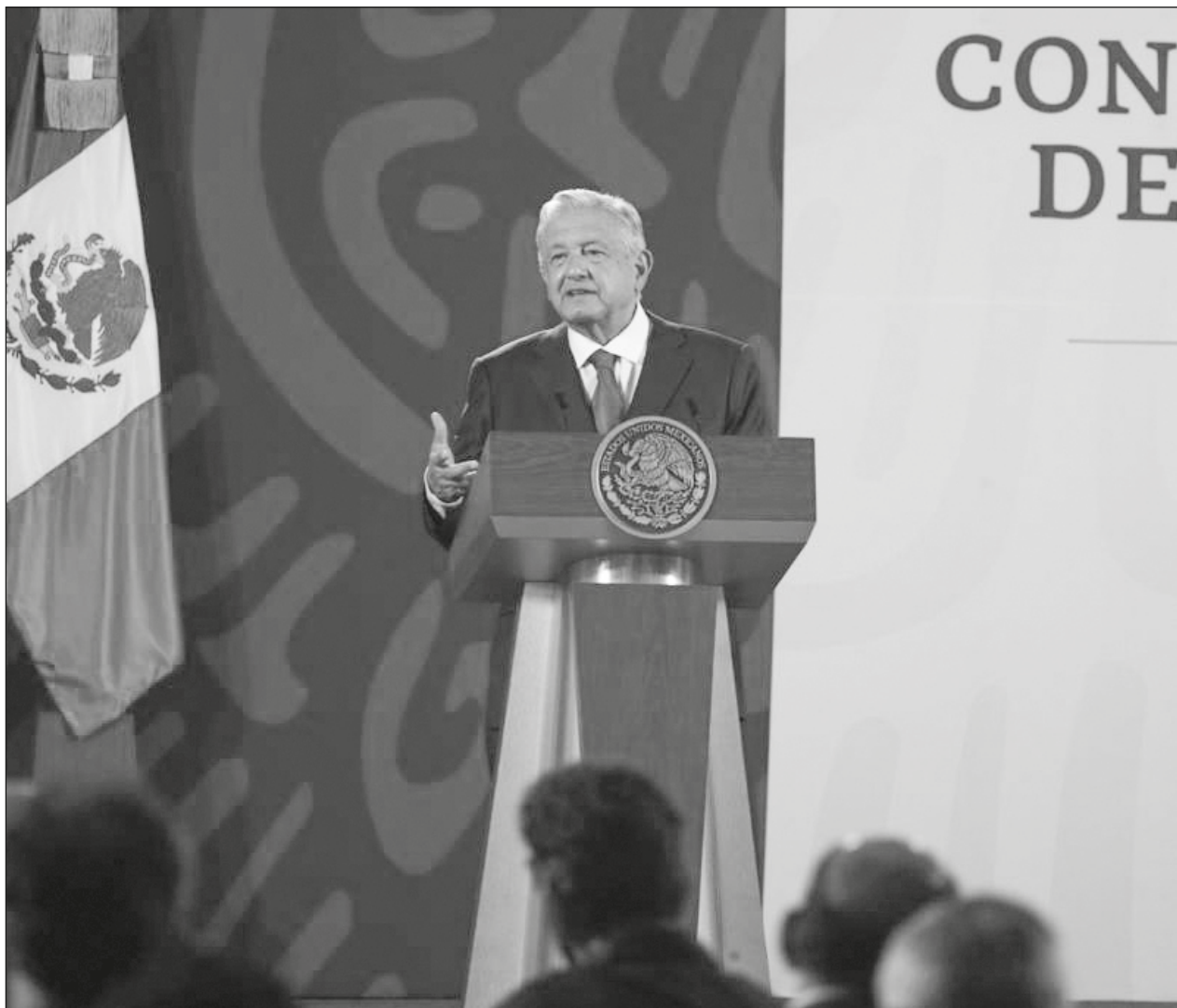
▲ A diez días para la IX Cumbre de las Américas, el presidente López Obrador mantiene la postura de no asistir a menos que Washington convoque a todos los países del continente, incluyendo a Cuba, Venezuela y Nicaragua.