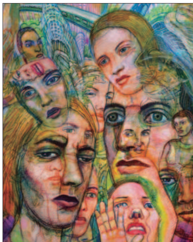
▲ En las páginas de Narrar lo propio, la ciudad de Chicago se vuelve un lienzo enorme de vivencias.