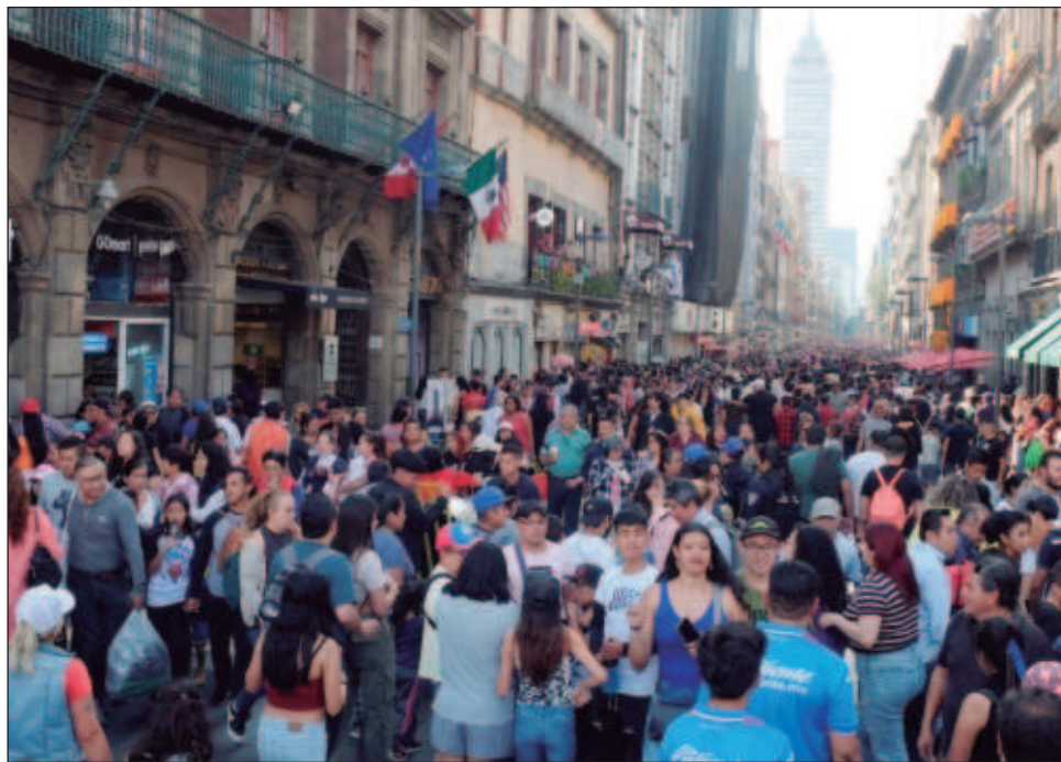
▲ La Encuesta Nacional de Inclusión Financiera mostró que más de la mitad de los mexicanos hacen frente a las crisis económicas mediante la reducción de gastos.

Se trata de un concepto conocido como vulnerabilidad financiera, mismo que ha sido relacionado con la inestabilidad financiera de los hogares, el sobreendeudamiento, la fragilidad ante choques económicos, la incapacidad de tomar oportunidades y su incapacidad de realizar pagos a tiempo, entre otros, explica el documento.