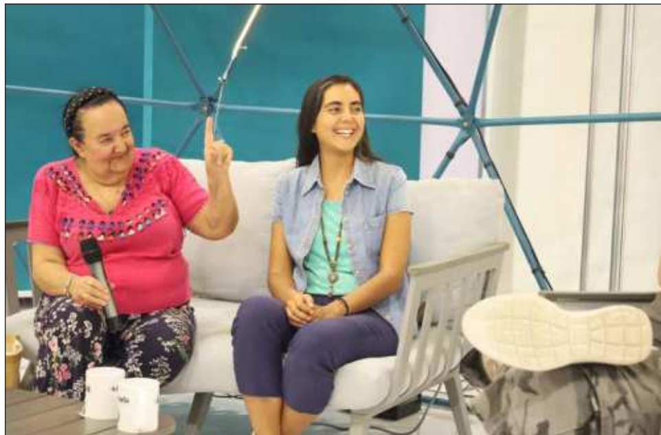
▲ Actualmente Radioecológica acaba de recuperar la concesión de la radio y quieren desarrollar proyectos con el Fondo Agroecológico de la península de Yucatán.

“Creo que en colaboración o en red esto funciona más, a través de los medios de comunicación te saturas si ves tanta tristeza, odio y problemas. pero hay una