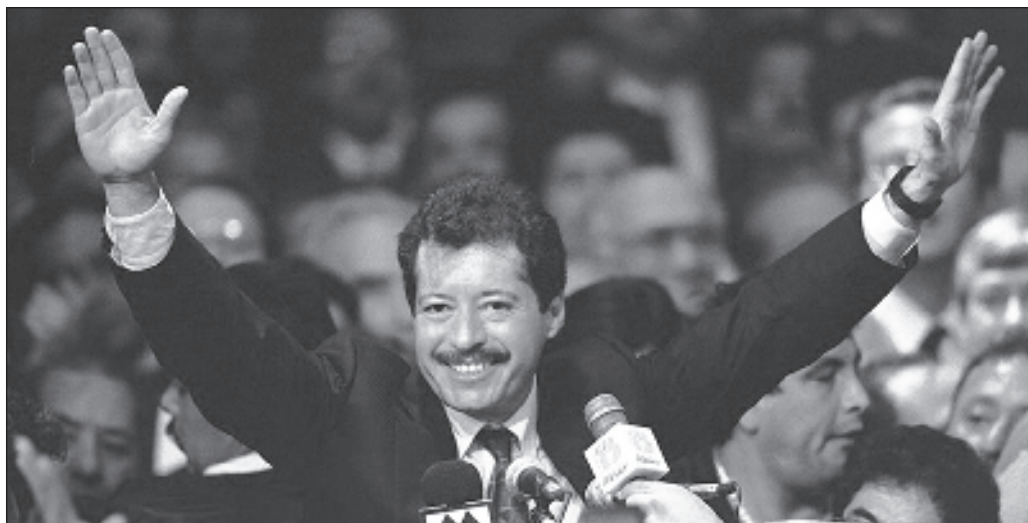
▲ Este domingo se cumplieron 31 años del asesinato de Luis Donaldo Colosio Murrieta, quien fuera candidato presidencial del Partido Revolucionario Institucional a la Presidencia.

A nadie le sirve una sociedad que deje de involucrarse en la política y no reaccione con indignación a los crímenes que pudieran cometerse, independientemente de su impacto. Esta será una ciudadanía muy limitada, que difícilmente participará en cualquier ejercicio de democracia directa y a duras penas buscará ejercer el derecho a ser votada y hacer una diferencia y marzo deje de ser un mes en el que se acumulan hechos que lastiman la memoria.