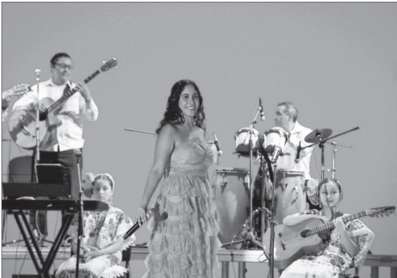
▲ En el Día del Trovador Yucateco, integrantes de las asociaciones más representativas de este género musical en la entidad conjuntaron sus guitarras y su pasión para recordarnos que la trova es un rasgo de identidad enraizado en la cultura de Yucatán.

Luego telón cayó, pero no así el romance que permeó en toda la sala principal del Teatro Armando Manzanero y que seguramente se fue acompañando a cada una de las personas entre el público, cuya emoción era aún evidente.