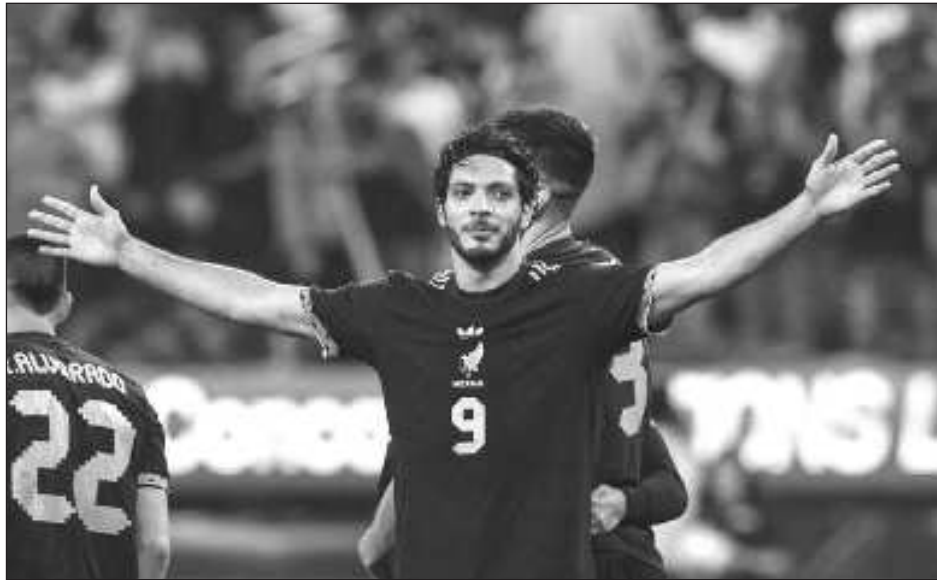
▲ Raúl Jiménez fue decisivo en la etapa final de la Liga de Naciones de la Concacaf.

El triunfo le dio a Javier Aguirre su primer cetro en la que es su tercera etapa al frente de la selección mexicana.