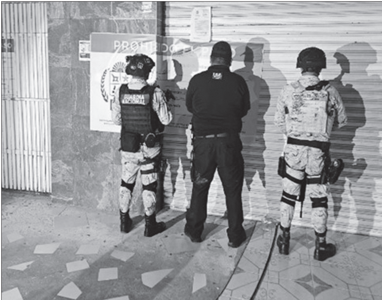
▲ En ambos lugares los elementos aseguraron indicios como bitácoras donde anotaban los servicios, además de notas de remisión y preservativos; los inmuebles quedaron bajo resguardo de la representación social.

También era investigado por el Centro Nacional de Niños Desaparecidos y Explotados de Estados Unidos, la Policía Nacional de España, Sección Ciberdelincuencia de Málaga y AMERIPOL, así como por la Policía Nacional de Colombia, Gendarmería Nacional Argentina, Unidad Fiscal Especializada en Delitos y Contravenciones Informáticas del Ministerio Público de la Ciudad de Buenos Aires y la División de Investigaciones de Delitos Informáticos de Venezuela.