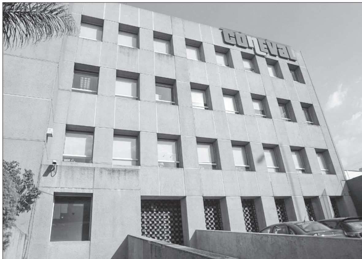
▲ "El Coneval ha definido diversos tipos de evaluaciones tratando de cubrir el ciclo "clásico" de las políticas públicas: diagnóstico, específica, de procesos, de diseño, estratégica, específica de desempeño, complementaria, de consistencia y resultados, integral y de impacto".

EL CONEVAL SOBRESALE no sólo por su labor gestora del entendimiento e instrumentación de la política pública. Las metodologías de sus evaluaciones son, en sí mis-