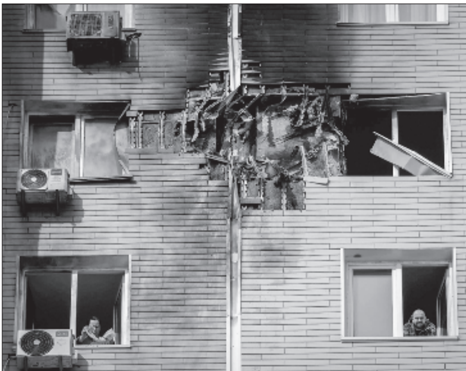
▲ En el marco de la reunión entre Washington y Moscú, el presidente ucraniano, Volodimir Zelenskiy, pidió presión para que Rusia cese con sus ataques.

En esa provincia se reanudó la actividad armada del M23, un grupo formado principalmente por tutsis que sufrieron el genocidio ruandés de 1994, en noviembre de 2021 con ataques relámpago contra el Ejército congoleño.