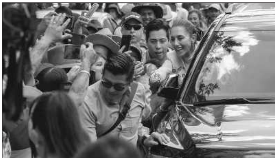
▲ De visita por el centro del país, la mandataria mencionó que sus adversarios políticos aún no comprenden las razones por las que los gobiernos de la 4T tienen tanto apoyo popular.

Ante cientos de personas que se dieron cita en este municipio para externarle su apoyo, la mandataria federal