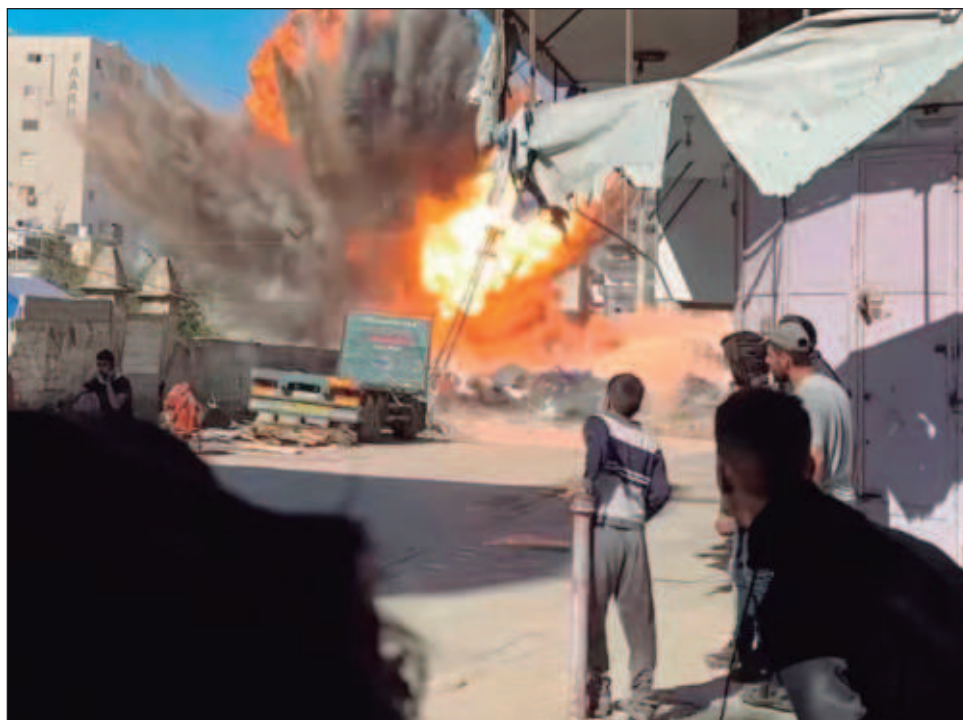
▲ El pasado 18 de marzo, Israel rompió el alto el fuego en la Franja de Gaza.

En total, la ofensiva israelí lanzada en Gaza en respuesta a ese ataque dejó 50 mil 21 muertos, en su mayoría civiles, y más de 110 mil heridos, según un balance difundido el domingo por el Ministerio de Salud de Hamás, cuyas cifras la ONU considera fiables.