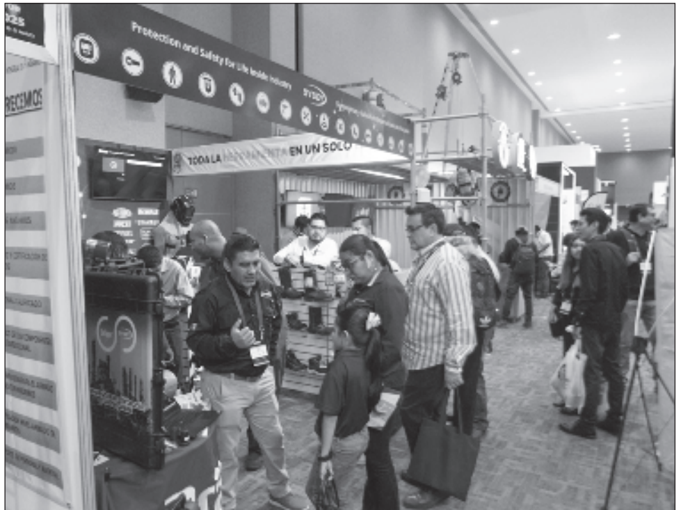
▲ Con un foro de más de cuatro mil 500 personas, fue clausurado el Segundo Foro Industrial Portuario Carmen 2025.

“Cabe destacar que en este año, se tuvo mayor vinculación con los hoteleros y restaurantes, por lo que los beneficios fueron mayores, incluso en el tema de los servicios”.