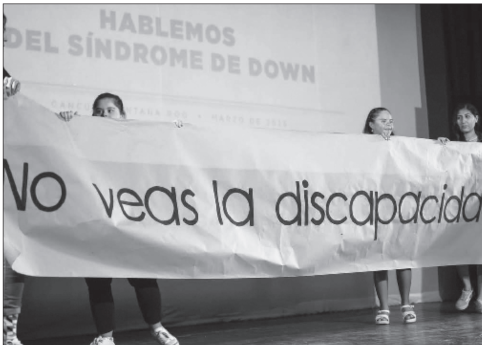
▲ Las personas con síndrome de Down normalmente son contratadas en hoteles para el área de atención al cliente, ya que son muy disciplinadas, aseveró la Fundación AMI.

Reconoció que todavía prevalece el estigma, pero con programas que se realizan desde diferentes fundaciones y desde el mismo gobierno se ha ido reduciendo, ha desaparecido bastante, integrándolos más al día a día. Respecto al censo de personas con este síndrome en Cancún, dio a conocer que tienen que actualizarlo y por ahora no hay datos específicos, pero esperan concretarlo próximamente.