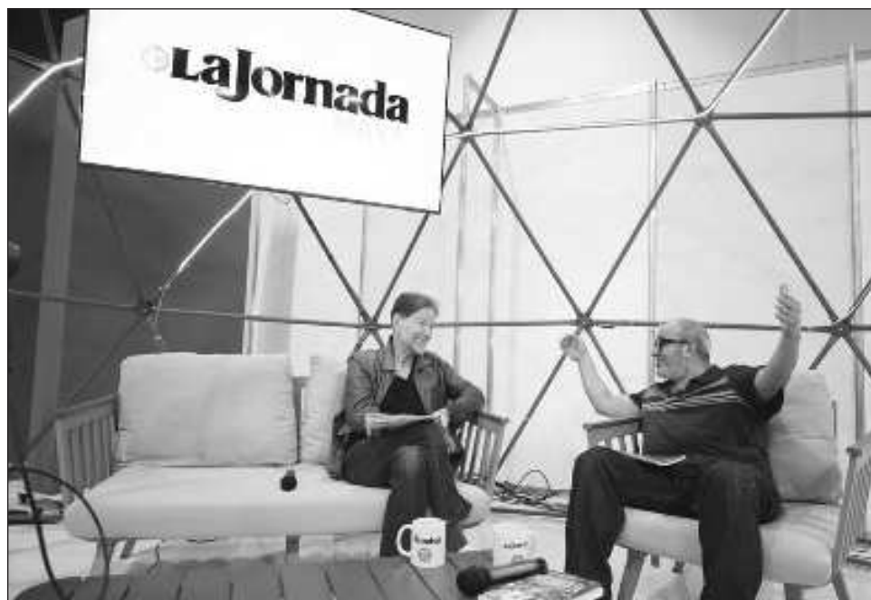
▲ La biografía de la mandataria nació desde la campaña presidencial de 2024, en la cual el seguimiento de Patterson fue clave para configurar la figura de Sheinbaum.

Entre las diferencias entre Claudia Sheinbaum y el ex presidente Andrés Manuel López Obrador, el último recurrió a la pola-