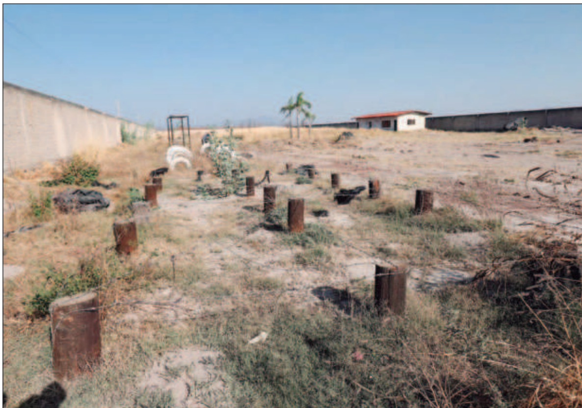
▲ “La violencia que vivimos se concibe como la explotación y, de alguna forma, la naturalización de esa vulnerabilidad extrema que resulta en la desaparición y la muerte de determinados grupos sociales en manos del crimen organizado en el que conviven redes de negocios legales e ilegales y de poder”.

De acuerdo con la filósofa estadounidense, si bien todos los seres humanos somos vulnerables y en ese sentido estamos expuestos a la violencia, esta vulnerabilidad se vuelve desmedida en sociedades terriblemente desiguales, como aquellas con lógicas altamente neoliberales. Condiciones estructurales de pobreza, racismo, colonialismo y machismo generan formas de vida desproporcionadamente precarias. No sólo porque determinados grupos sufren de condiciones de vida socialmente desprotegidas, sino que la precariedad misma está conformada por identidades que no son reconocibles como vidas valiosas de preservar: “habitan cuerpos que dejan de ser lamentables para