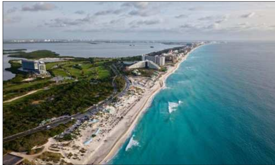
▲ El nuevo presidente hotelero sostuvo que lo más importante es demostrar el amor por el destino, cada quien desde su trinchera, para abordar los retos del sector.