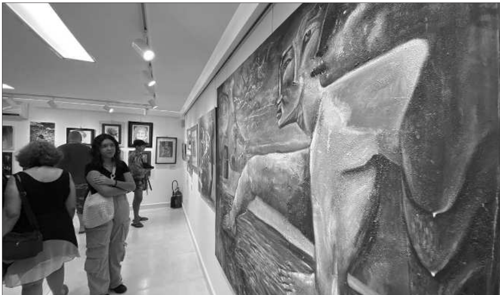
▲ "La intencionalidad es esa cualidad especial de la obra de arte que logra establecer una comunicación entre el autor creativo y el espectador".

Por todo lo anterior, resulta imprescindible que las instituciones que ofrecen programas de educación artística consideren la necesidad de formar futuros artistas capaces de, primero, captar aquellos aspectos de la vida, personal o social, para posteriormente manejarlos en sus visiones artísticas con el propósito de imprimirles intencionalidad estética y, consecuentemente, trascendencia. Si no hay trascendencia, no hay intencionalidad, y si no hay esta última, no hay arte.