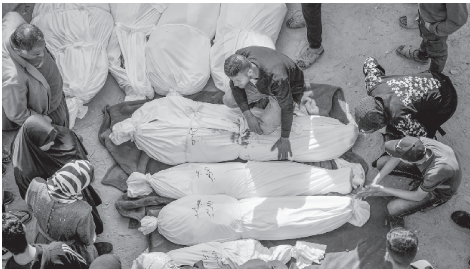
▲ "Las cifras generales (...) señalan con base en un informe del Ministerio de Salud que 49 mil 747 palestinos han sido asesinados".