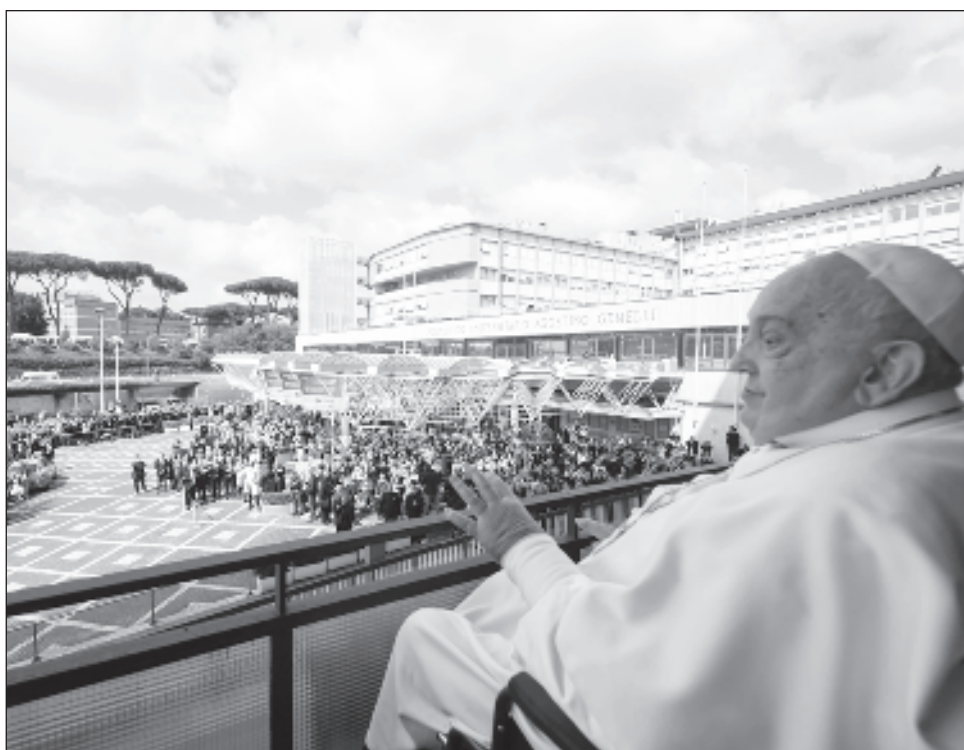
▲ «¡Gracias a todos!», dijo el pontífice de 88 años con voz débil ante un micrófono, sentado en una silla de ruedas y saludando a cientos de personas reunidas bajo un balcón del hospital.

El alta del pontífice, cuyo estado mejoró paulatinamente en las últimas semanas, se esperaba con impaciencia ante el aumento de los interrogantes sobre su capacidad para reanudar sus actividades.