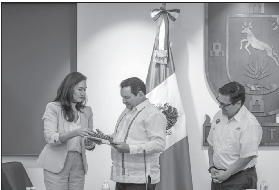
▲ El gobernador Joaquín Díaz Mena resaltó que uno de los pilares de esta etapa de colaboración es la movilidad académica, para que más yucatecos puedan tener la oportunidad de crecer profesional y personalmente.

“Queremos alumnos con todas las competencias y capacidades desarrolladas para ocupar cualquier cargo en una empresa extranjera que pudiera venir a Yuca-