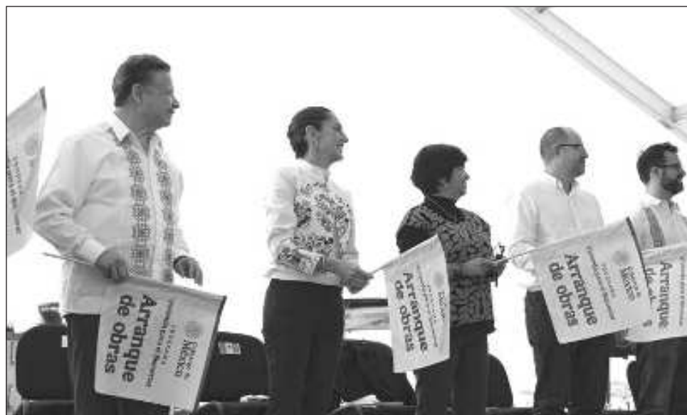
▲ En la jornada de ayer, la presidenta dio arranque al programa de vivienda en Tlaxcala.

lo queríamos poner en la ley, pero no hubo suficiente información, pero de todas maneras lo vamos a hacer. Para todos los trabajadores del Estado, para los que son del Politécnico, para los maestros, para todos los que trabajamos como un equipo, vamos a hacer