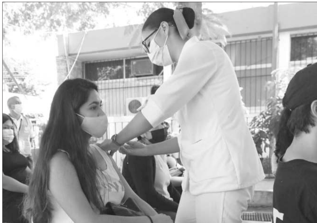
▲ En esta jornada de vacunación, las dosis se aplicarán en Motul, Temozón, Espita, Conkal, Muna, Baca, Dzilam González, Uayma, Sucilá, Chumayel, Yaxkukul, Cantamayec, Sinanché, Bokobá, Telchac Puerto, Yobaín, Sudzal, Cuncunul, Teya, Suma, Sanahcat, Quintana Roo, Peto y Halachó.

-El miércoles 2, en Sucilá, Chumayel, Yaxkukul, Cantamayec y Sinanché.