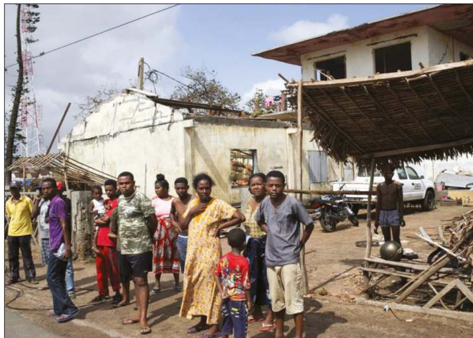
▲ El ciclón Emnati tocó tierra en torno a la medianoche local en el distrito de Manakara Atsimo en el sureste.

Madagascar, una isla al este del continente africano