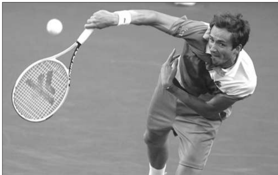
▲ Daniil Medvedev, durante su actuación de ayer en Acapulco.