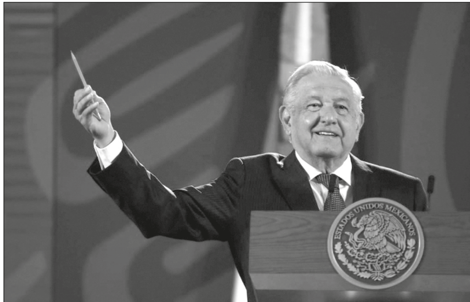
▲ El Presidente asoció lo dicho por el secretario de Estado con la intervención de los grupos conservadores de México, asociados a las posturas de Estados Unidos.

El tabasqueño asoció esa postura de Blinken con la