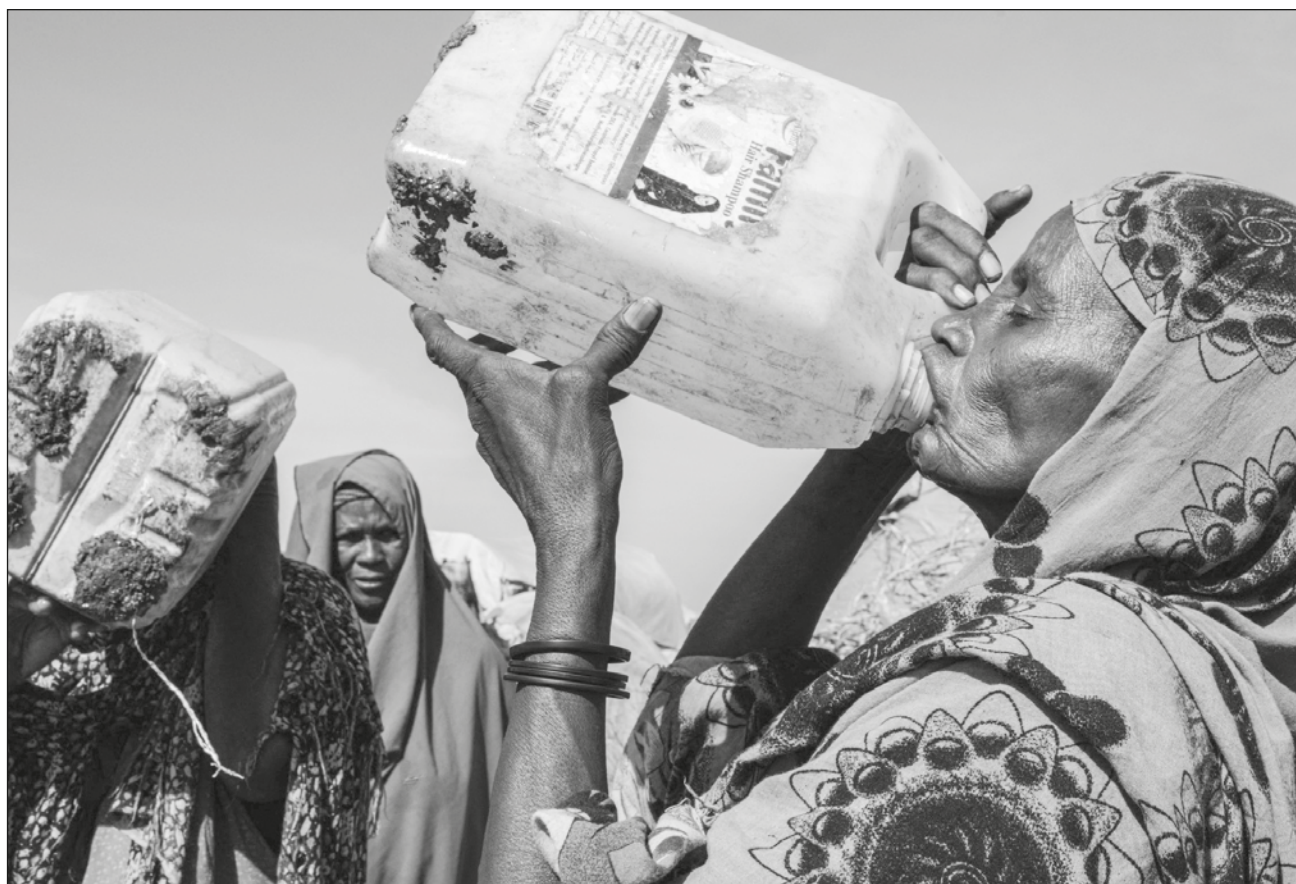
▲ Desesperadas, hambrientas y sedientas, cada vez más personas acuden a la ciudad de Baidoa desde las zonas rurales del sur de Somalia: más de 554 mil personas han abandonado sus hogares en busca de agua, alimentos y pastos.

En la última década, Baidoa, a unos 250 kilómetros al noreste de la capital Mogadiscio, se ha acostumbrado a grandes flujos de población.