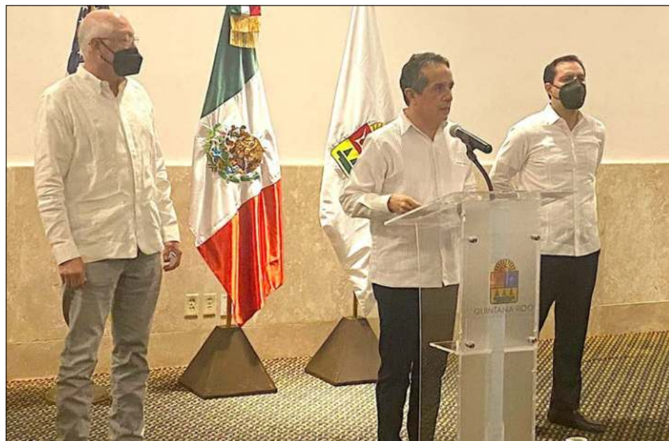
▲ Los dirigentes estatales y el diplomático estadounidense acordaron cinco propuestas en materia medio ambiental, económica, social y política.

Este miércoles se llevó a cabo en Cancún el Tercer Encuentro de Gobernadores del Sur-sureste con la Embajada de Estados Unidos de América, representada por Kenneth Lee Salazar, en donde estuvieron presentes los gobernadores de Tabasco, Carlos Merino Campos; Campeche, Layda Sansores San Román y de Yucatán, Mauricio Vila Dosal, así como el de Quintana Roo, Carlos Joaquín González, un representante de Chiapas, y funcionarios de la Secretaría de Hacienda y Crédito Público (SHCP), Se-