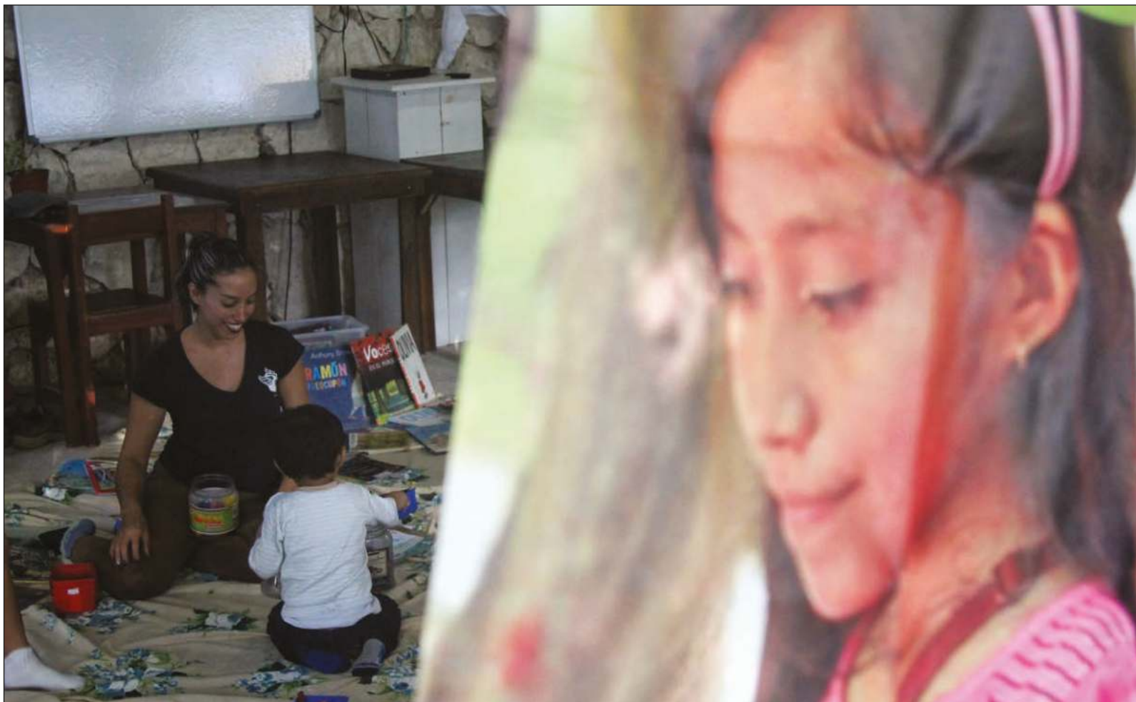
▲ Es muy habitual que el tratamiento de los asuntos culturales no sea considerado de interés en la pedagogía.