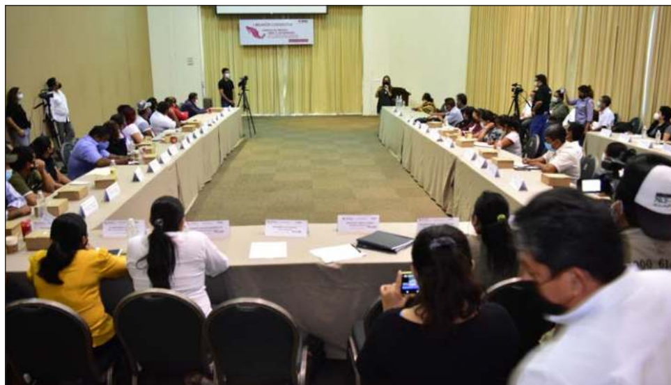
▲ El Instituto Nacional Electoral celebró este miércoles una consulta para la redistribución de Campeche, en la cual traductores e intérpretes de q'anjob'al y otras lenguas mayenses expresaron la falta de apoyo a la promoción de su cultura.

En dicha consulta previa no hubo caras conocidas, ni asociaciones de defensa de los derechos de pueblos indígenas; sí hubo gente del Instituto Nacional de los Pueblos Indígenas (INPI), pero el titular, Nehemías Chí Canché, pese a la importancia del evento, no asistió para acompañar a los agentes municipales de distintas comunidades de la entidad y a los intérpretes y traductores