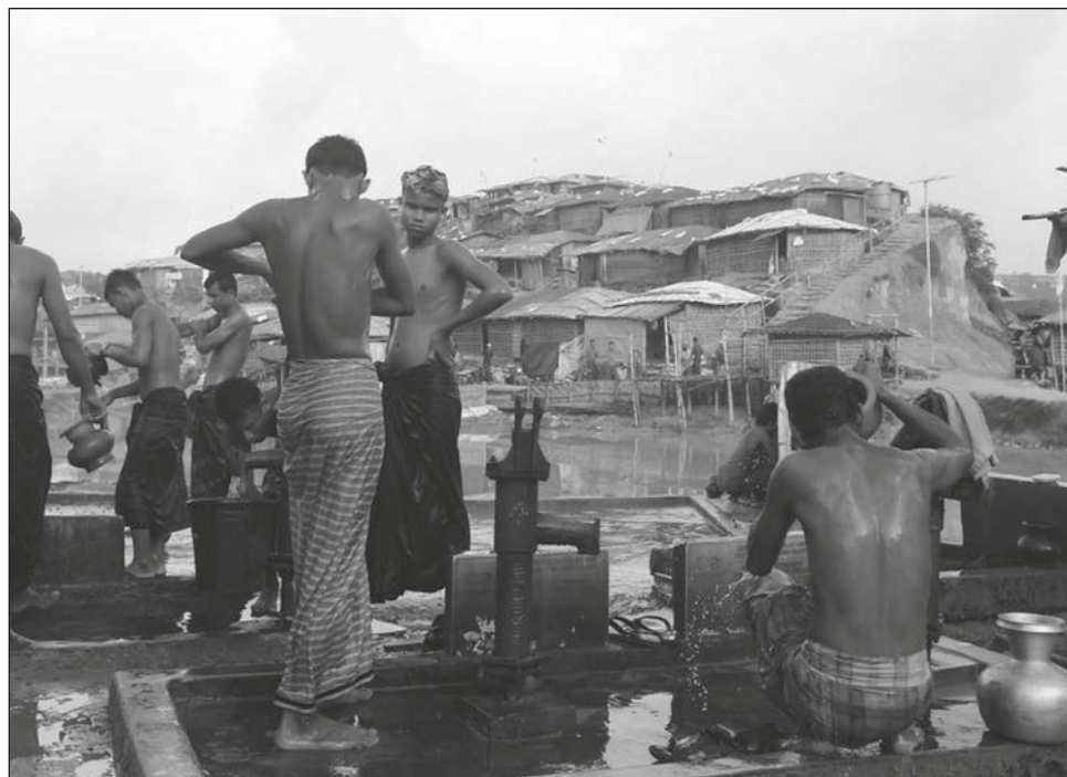
▲ Mientras los jueces de La Haya se declaran competentes, miles de rohinyás siguen esperando en los campos de refugiados de la vecina Bangladés.

La extinta República presentó objeciones preliminares que retrasaron la sentencia y la corte, en 2007, definió como genocidio el asesinato de unos 8 mil musulmanes varones en Srebrenica. Es decir, doce años después de la matanza.