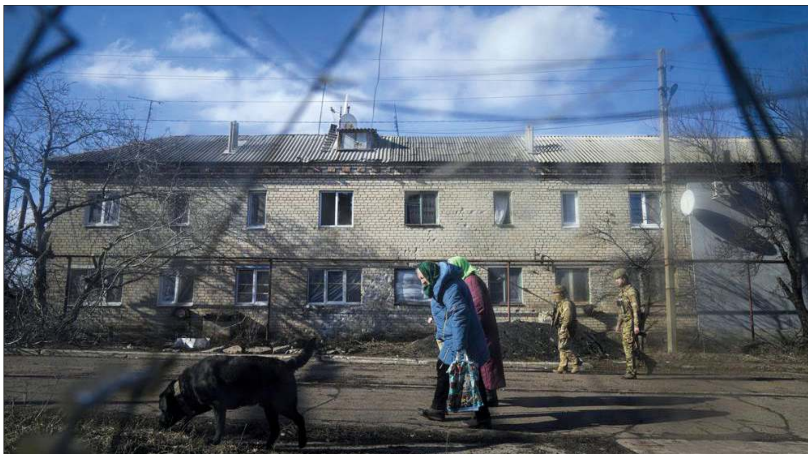
▲ Con el aumento de la tensión tras el anuncio de Vladimir Putin sobre enviar tropas rusas a la región de Donbás, en Ucrania, quedan manifiestos los efectos de la llamada “guerra híbrida”, que afecta principalmente la economía del segundo país. La presencia del ejército en las calles es cada vez más patente y este miércoles, el presidente Volodymyr Zelensky inspeccionó el armamento con que cuentan las fuerzas de Kiev.