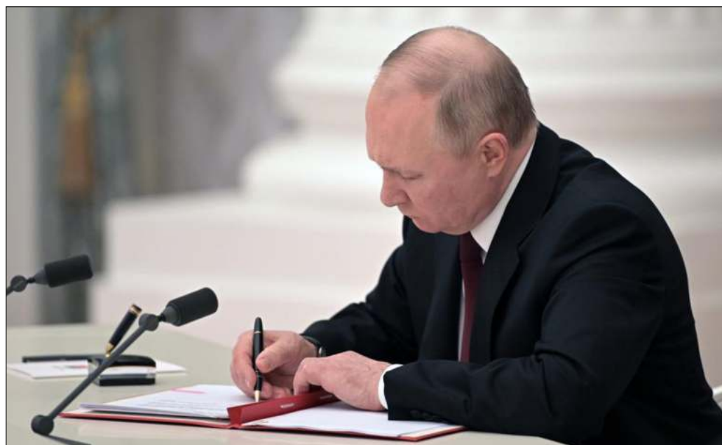
▲ El presidente de Rusia, Vladimir Putin, firmó un decreto con el que ordena el ingreso de las tropas rusas a los territorios de Donetsk y Lugansk, en "misión de mantenimiento de la paz".

Al respecto se expresó la cancillería, al pedir que se apueste por la diplomacia para dar una salida a las tensiones geopolíticas en la región y respaldar el exhorto del secretario general de Naciones Unidas, Antonio Guterres, en favor de un proceso pacífico para resolver el conflicto y evitar una escalada.