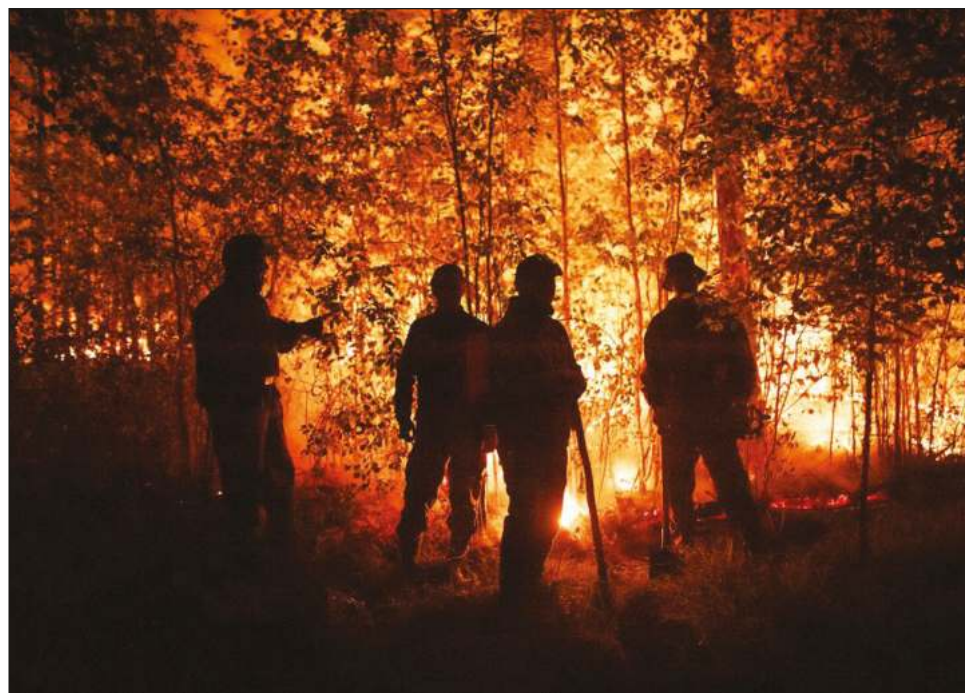
▲ Según investigadores de la ONU, los gobiernos siguieron dedicando mucho tiempo y dinero a combatir los incendios, pero no el suficiente para prevenirlos.

Zonas que antes se consideraban seguras ante grandes fuegos dejarán de ser inmunes. Es el caso del Ártico, donde según el documento es "muy probable" que aumenten los fuegos de forma significativa.