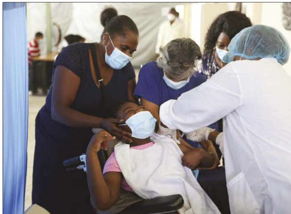
▲ Las Américas han sido durante meses el epicentro de la pandemia y una de las regiones del mundo con más dificultades para acceder a la vacunación.

De los 13 países de la región que aún no han alcanzado la meta de vacunación del 40% fijada por la Organización Mundial de la Salud para finales de 2021, 10 están en el Caribe. Además de Haití,