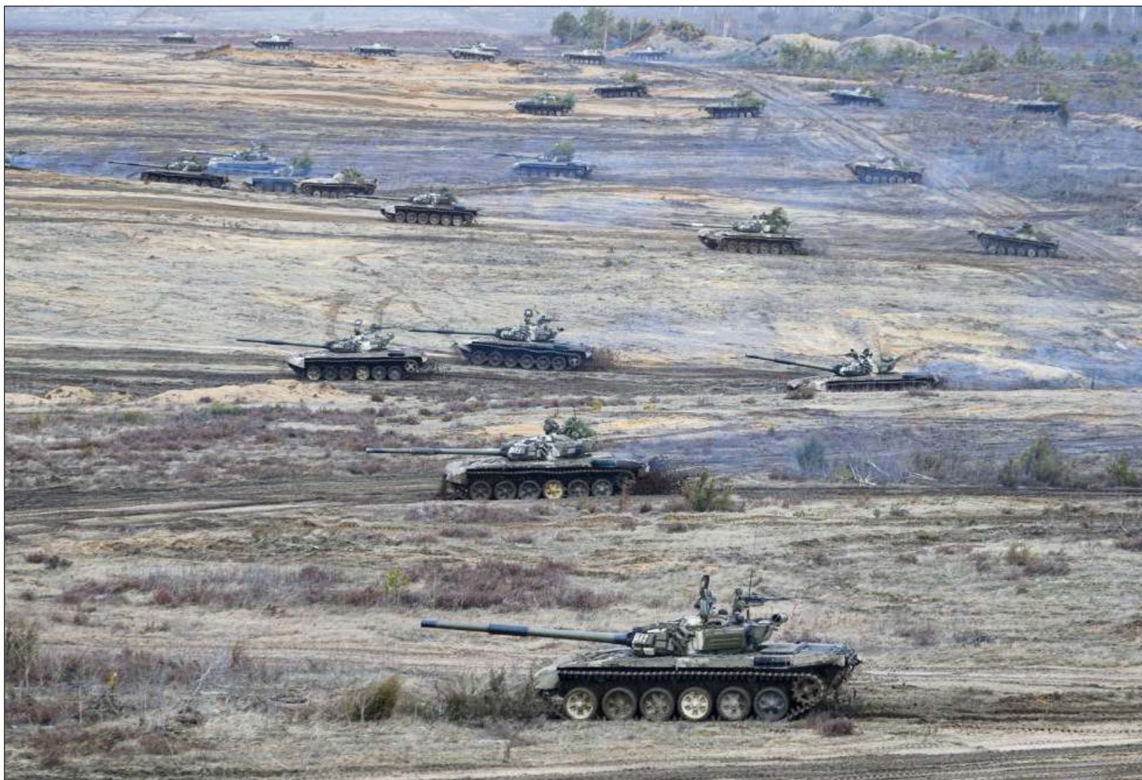
▲ Una invasión rusa a gran escala podría causar una enorme cantidad de víctimas y derrocar al gobierno elegido democráticamente en Ucrania.

Zelenskyy señaló que pidió concertar una llamada con Putin la noche del miércoles, pero que no obtuvo respuesta del Kremlin.