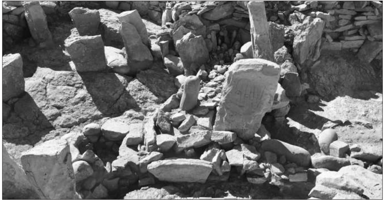
▲ En el yacimiento encontraron también unas enormes trampas que se cree que fueron utilizadas para acorralar a gacelas salvajes.

Dentro del santuario había dos piedras talladas con