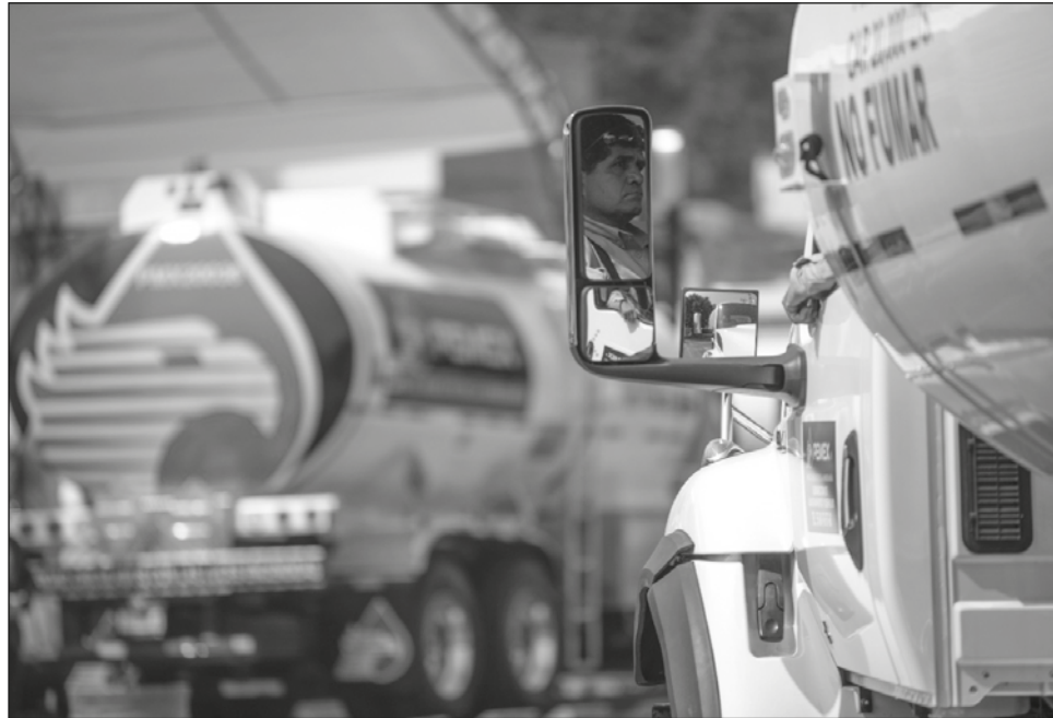
▲ La secretaria general de la Unión Nacional de Técnicos y Profesionistas Petroleros informó que los accidentes laborales aumentaron debido a las pocas horas de descanso que tienen los trabajadores.

Explicó que ante las extenuantes jornadas laborales que impone Pemex al personal, se aumentan las posibilidades de accidentes en las instalaciones, tanto en tierra como marinas, ya que los niveles de concentración de los obreros no son los mismos, además de que se violentan tratados internacionales, así como las leyes, que mandatan un período de ocho horas.