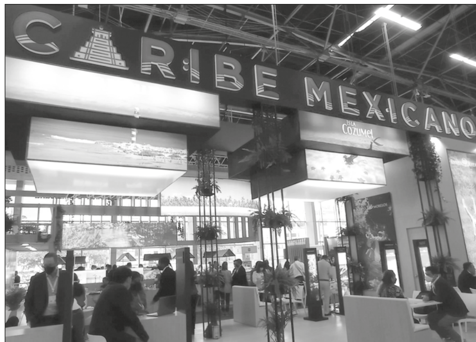
▲ El Caribe Mexicano y sus diferentes destinos tienen un stand de 108 metros cuadrados en la ventana turística de la Anato.

Respecto al tema del sargazo, mencionó que no es una gran preocupación para los touroperadores porque entienden que no es permanente ni en toda la costa “hay días que hay una arribazón más intensa que otros y esto sucede en diferentes puntos de la costa, además es un fenómeno natural, así que no hay una preocupación mayor, por eso debemos difundir el trabajo de prevención que se está haciendo”.