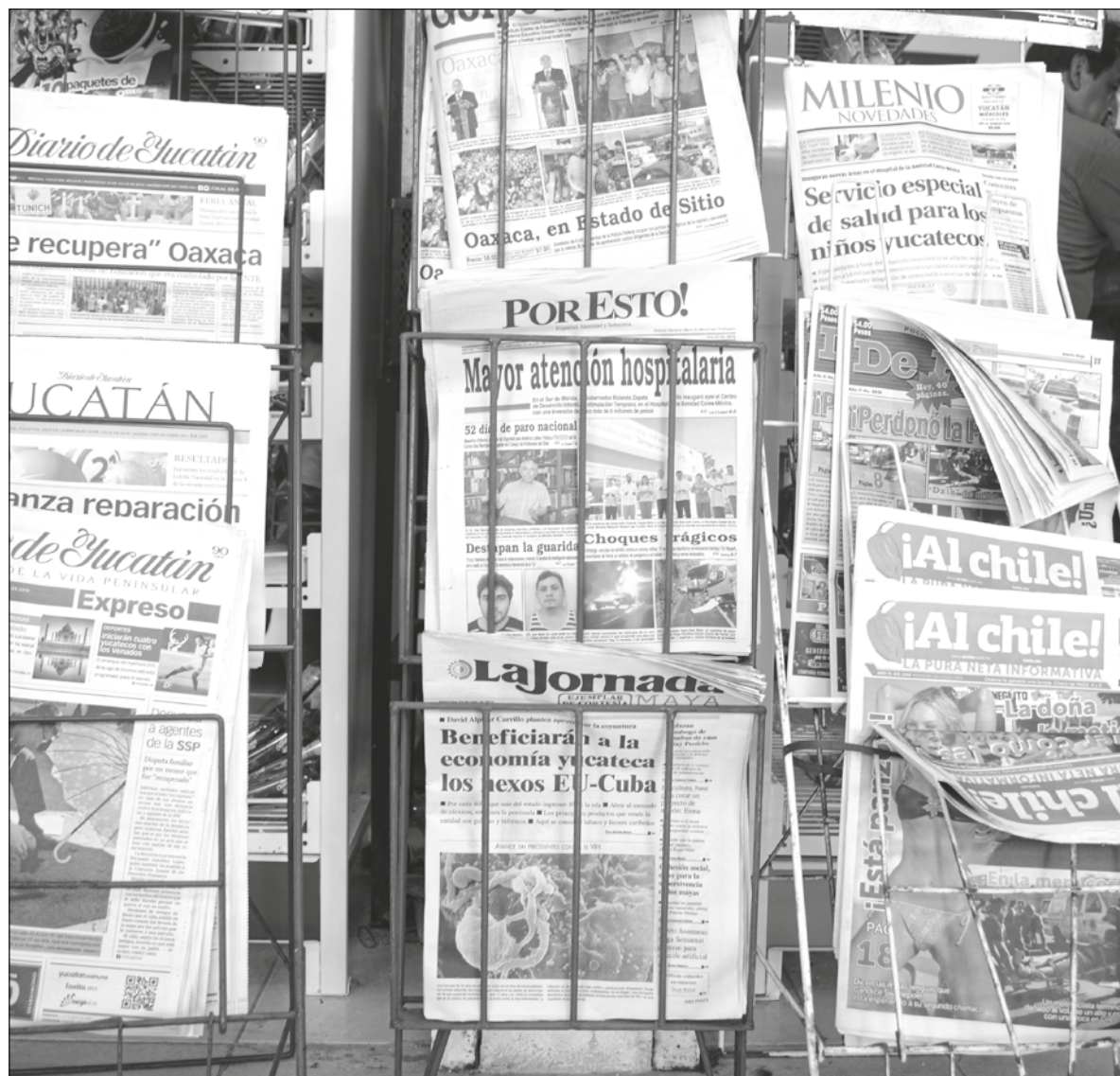
▲ La política mexicana actual está cimentada en la búsqueda de destruir reputaciones.

LA FALTA DE verdad lastima la convivencia humana y su carencia como acertadamente Nietzsche