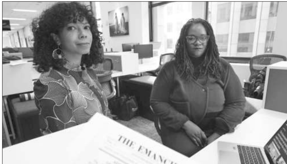
▲ The Emancipator original fue fundado en 1820 en Jonesborough, Tennessee, por el empresario metalúrgico Elihu Embree, con el fin explícito de “abogar por la abolición de la esclavitud”.

La muerte en plena juventud de Embree puso fin a la breve vida del The Emancipator que, sin embargo, alcanzó una tirada