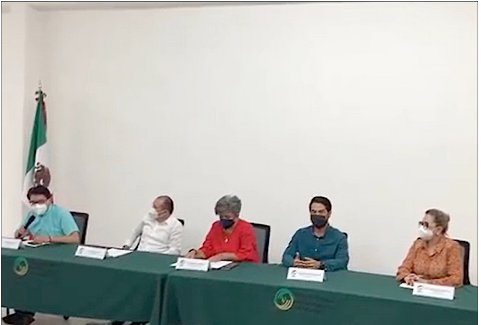
▲ Academia, profesionales, asociaciones civiles y ciudadanía en general están convocados para presentar candidatos al Comité de Participación Ciudadana del Sistema Estatal Anticorrupción de Yucatán.