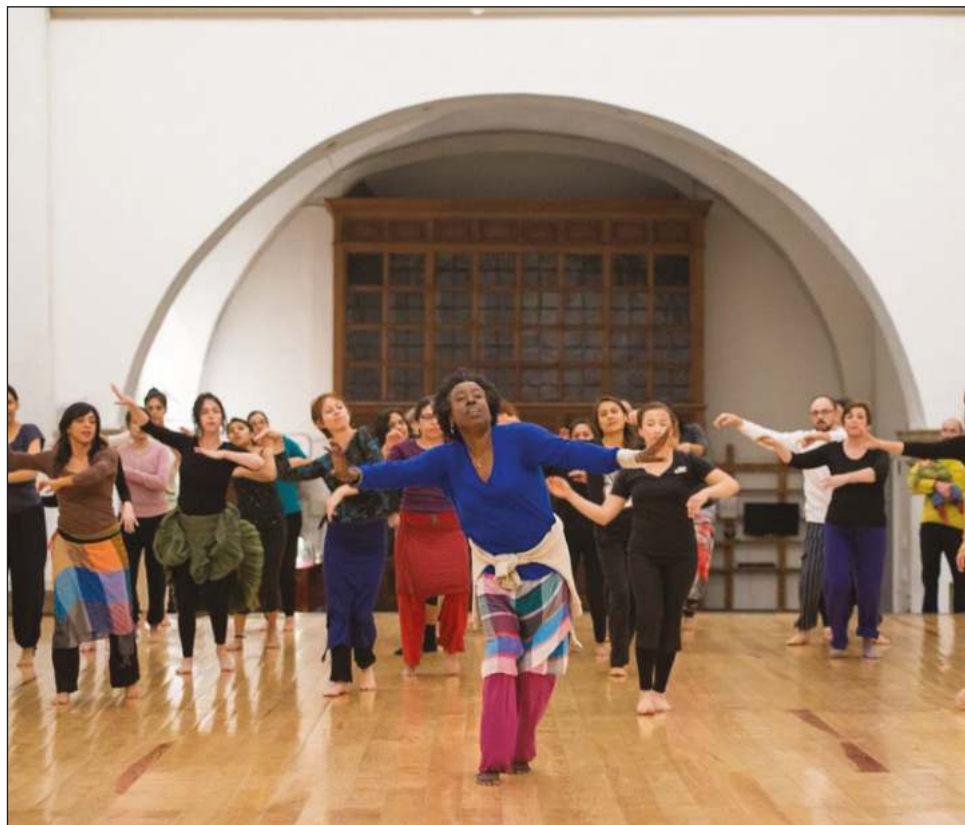
▲ No es la primera vez que la bailarina visita Mérida; en esta ocasión sus motivaciones son tejer un encuentro entre la riqueza cultural de Ruanda y México.

La charla es para todo público; y el taller está dirigido a personas bailarinas, pedagogas, músicas, artistas visuales, investigadoras de todas las disciplinas y público en general que desee explorar el cuerpo, el ritmo y la danza.