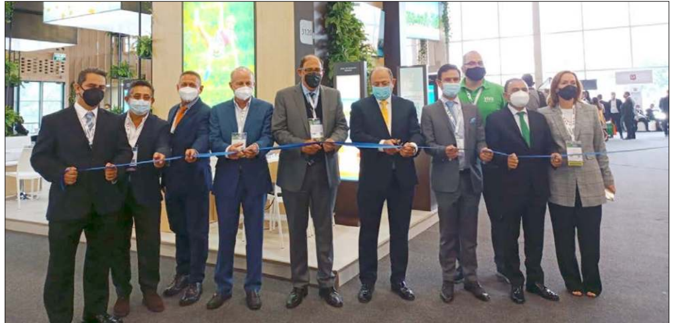
▲ El diplomático fue el encargado de hacer los cortes de listón en los pabellones de México.

Recordó que 2020 fue un año difícil para la industria turística y se espera que este 2022 marque la recuperación de la industria sin chimeneas, para ello se han