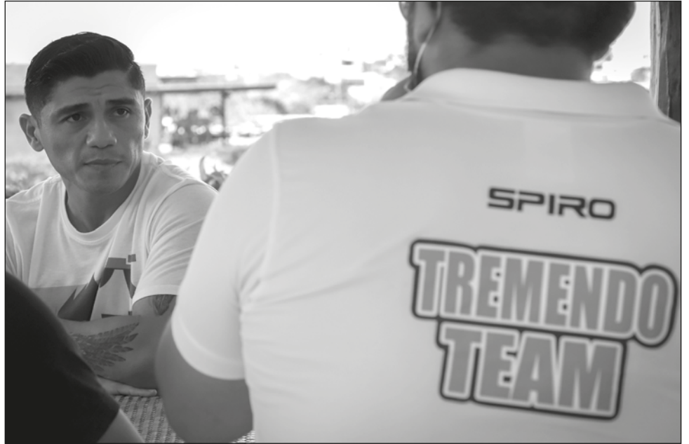
▲ El Tremendo se enfrentará a El Diamante Mosqueda, en un encuentro de peso súper ligero pactada a diez rounds.

“Es todo un orgullo escribir una historia en este deporte. Es una pelea muy importante, es una pelea que tiene mucha relevancia en mi carrera como boxeador. Voy a disputar dos títulos, además soy contendiente mandatorio al campeonato latino de las 140 libras, que es uno de los campeonatos más importantes de jerarquía del consejo mundial y la pelea es un paso importante”, sostuvo.