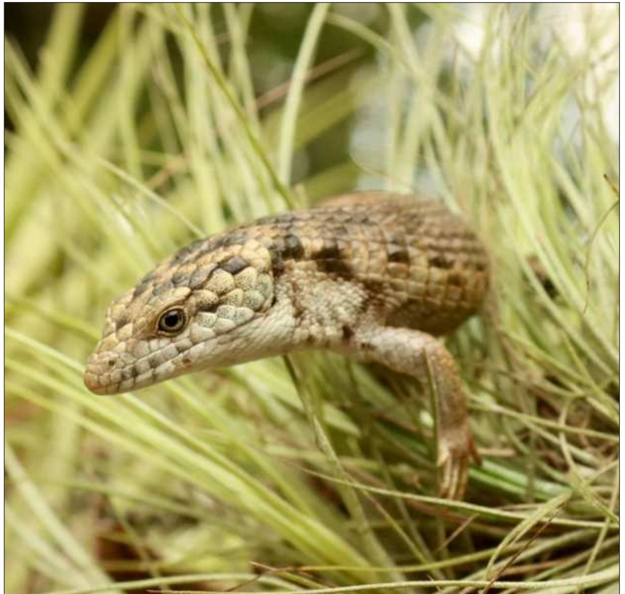
▲ Dragoncito de Coapillae' juntúul ba'alche' siijil te'e péetlu'umilo' yéetel sajbe'entsil yanik u ch'éejel.

Chan ba'alchee' kaja'an tu jach ka'analil che'ob, ts'o'oke' je'el u na'akal tak 20 meetrós; chéen ku péek'o'ob ti'al u bino'ob tak tuláak' che'e' ba'ale' ma' maas náach ti' 10 meetrosi'; u aalile' kex 20 graamós yéetel ku p'isik kex 15 sentimeetrós u chowakil.