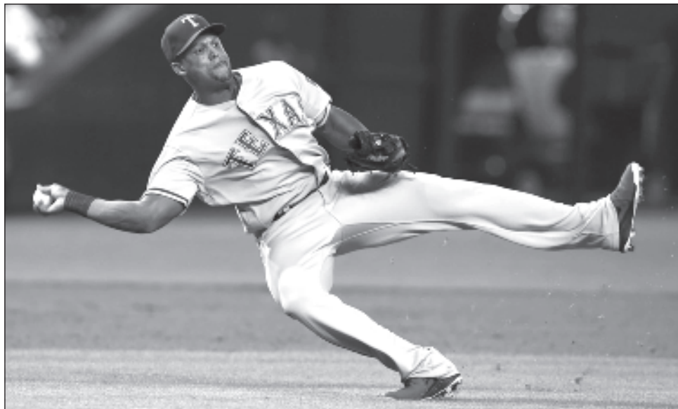
▲ Con Adrián Beltré, ya son 19 latinos exaltados en Cooperstown.

Mauer también fue elegido en su primer intento al recibir 293 votos para 76.1 %.