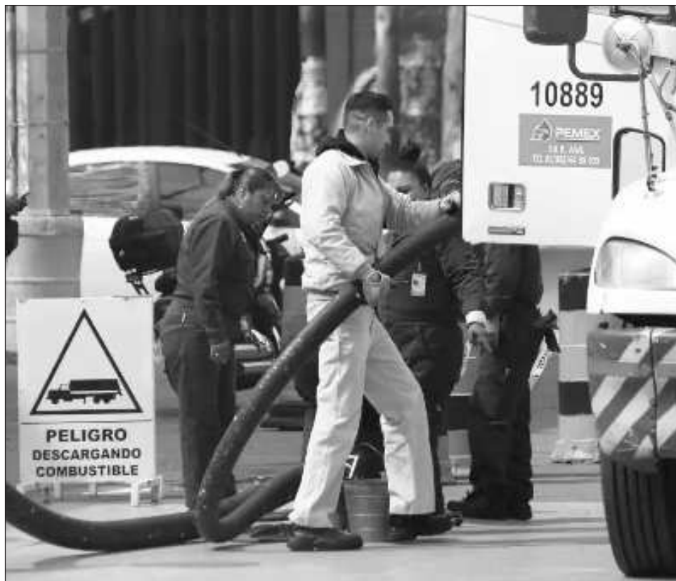
▲ La economía de Campeche y de Carmen se encuentra estrechamente ligada a la actividad petrolera, por lo que el impago de Pemex provoca afectaciones en todos los sectores de la población.

Destacó que a finales del 2023, se había anunciado una posible reunión del director general de Pemex, Octavio Romero Oropeza, con los empresarios locales, para explicar las acciones