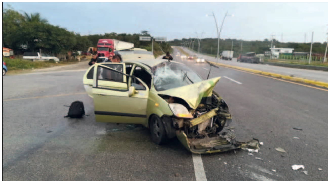
▲ El año pasado, del total de 165 homicidios en Yucatán, 130 correspondieron a accidentes viales; en el caso de Quintana Roo, de los mil 596 homicidios registrados en 2023, 432 fueron ocasionados por arma de fuego.

En Campeche los homicidios causados por accidentes de tránsito han ido en aumento en los últimos cinco años: 56, 41, 85, 113 y 121 del año 2019 a 2023; en los últimos dos años representó 55.6 y 56.8 por ciento respectivamente.