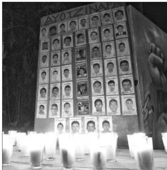
▲ Los acontecimientos de la noche del 26 al 27 de septiembre de 2014 todavía repercuten en la agenda política nacional en buena medida porque se considera un asunto no resuelto.

La liberación ha producido reacciones encontradas en el gabinete presidencial. Alejandro Encinas, ex subsecretario de Derechos Humanos de la Secretaría de Gobernación y ex presidente de la Comisión para la Verdad y el Acceso a la Justicia para este caso, y que en 2005 sustituyó a López Obrador como jefe de Gobierno del entonces Distrito Federal, lamentó que los abogados de la Secretaría de la Defensa Nacional (Sedena) "litiguen contra la investigación que dirigió el presidente de México", como si los militares no tuvieran derecho a una defensa.