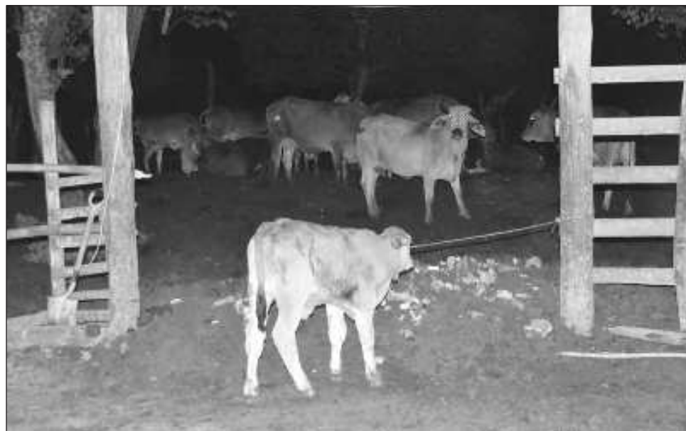
▲ Robo de ganado ha dejado pérdidas millonarias y no hay detenidos, dicen productores.

Destacó que considera raro que con una constancia de residencia hayan soltado