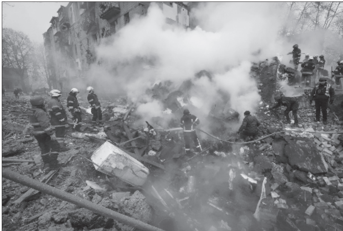
▲ “Estados Unidos y Gran Bretaña, así como otras naciones de la OTAN, han enviado buques al Mar Rojo y comenzaron a bombardear la capital Sana, entre otras 28 localidades y más de 60 objetivos, según el Pentágono, de una de las naciones más pobres”.

Claro Bauer no mencionó que la OTAN ya está en guerra con Rusia en Ucrania, a través de la guerra proxy que mantienen desde hace ya