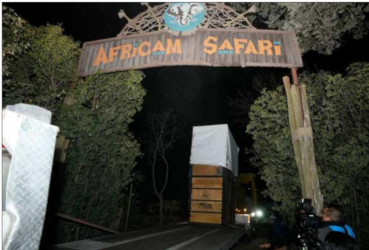
▲ En la madrugada, pasadas las 3 horas, el grupo llegó al zoológico ubicado en la junta auxiliar de San Francisco Totimehuacan, donde Benito fue colocado en establo especial, en el que se mantendrá durante dos días.

El mayor número de homicidios se dieron con disparo de armas con fuego, con 10 mil 615; le siguieron agresiones por medios no especificados, con mil 598 eventos; y agresión con objeto cortante, mil 365 hechos. El estrangulamiento, ahorcamiento y sofocación registraron mil 14 homicidios a nivel nacional en los primeros seis meses de 2023.