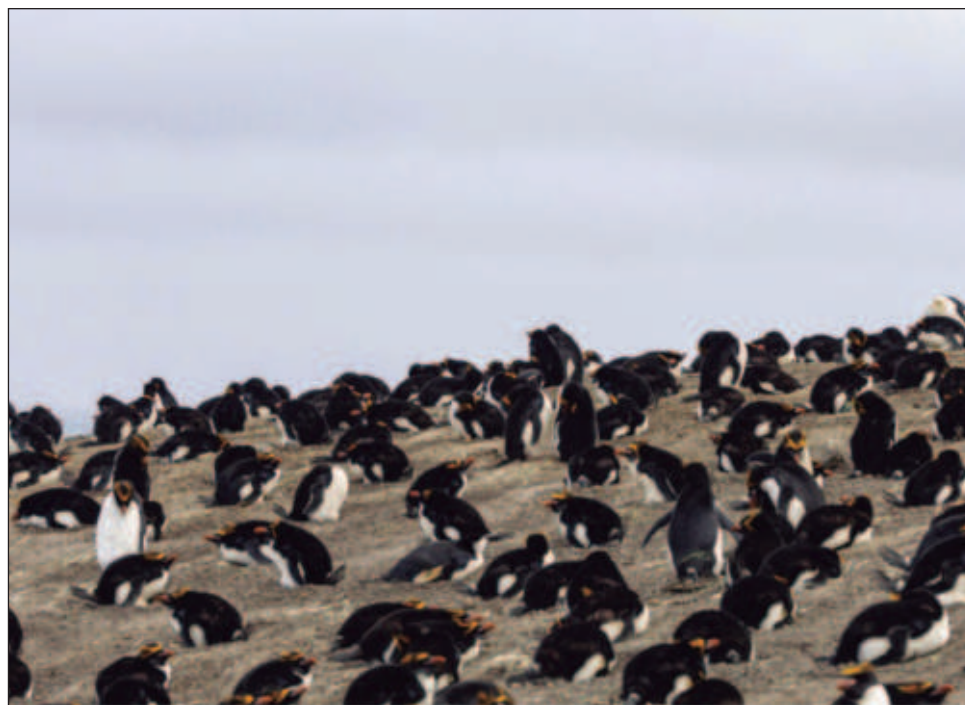
▲ Más de un millón de pingüinos de la especie Pygoscelis antarcticus viven en la ínsula volcánica de Zavodovski del archipiélago de las islas Sandwich del Sur.

Investigadores de la Prospección Antártica Británica (BAS, por sus siglas en inglés), llevó a cabo estudios aéreos de la remota isla volcánica, como parte de un proyecto más amplio financiado por Darwin PLUS, un equipo de seis científicos realizó un viaje de mil 300 millas, navegando durante siete días a través de uno de los océanos más agitados del mundo.