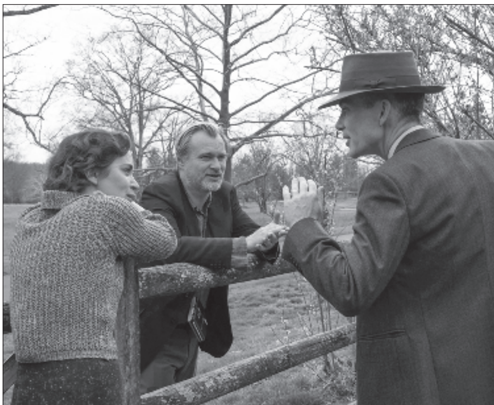
▲ La cinta sobre J. Robert Oppenheimer competirá en 13 categorías: por mejor película, la dirección de Nolan y las actuaciones de Cillian Murphy, Robert Downey Jr. y Emily Blunt.

Los Oscar se entregarán el 10 de marzo y serán transmitidos por ABC en Estados Unidos.