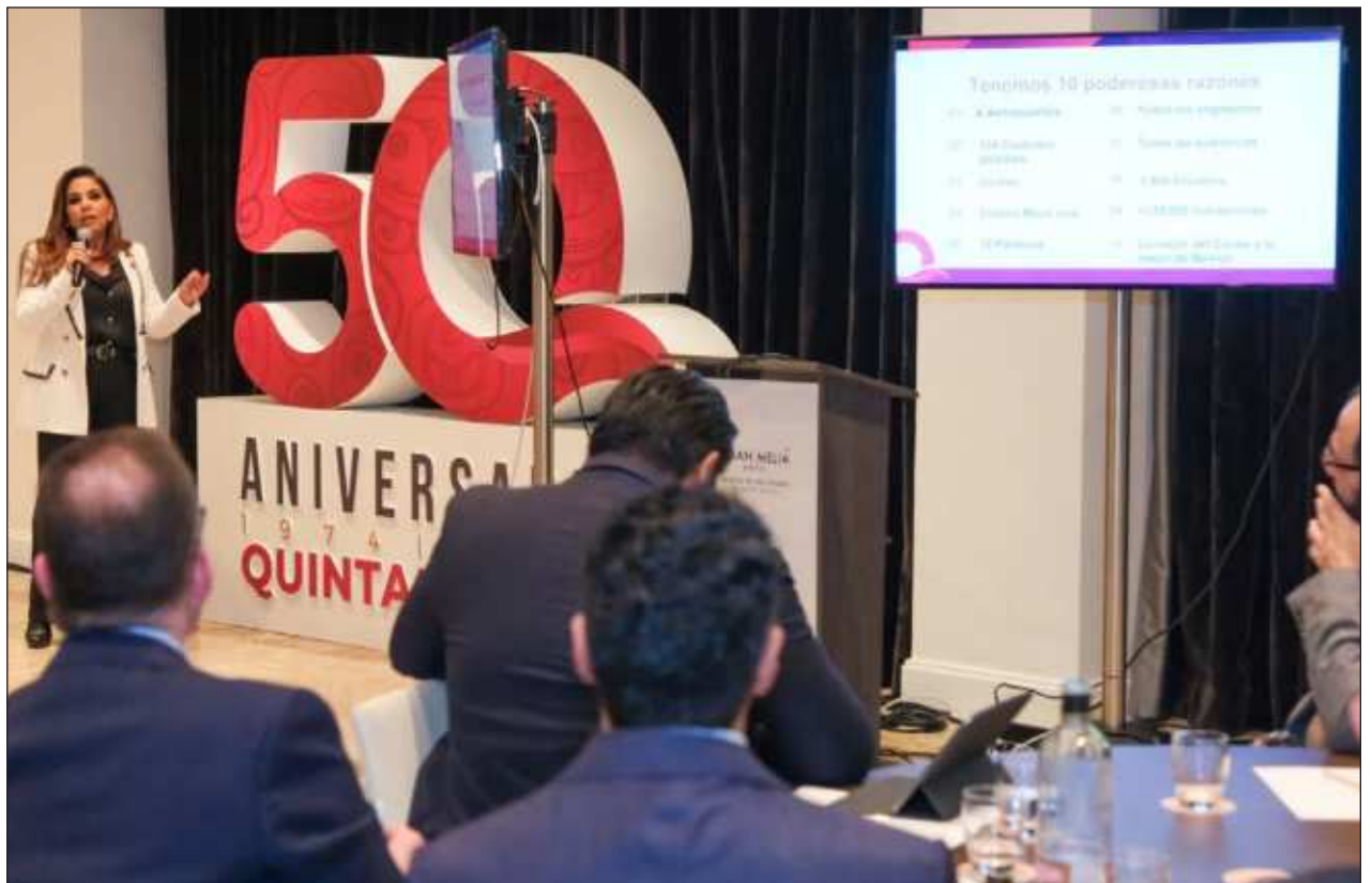
▲ Ante touroperadores, agentes de viajes y ejecutivos de aerolíneas, la gobernadora Mara Lezama compartió los resultados obtenidos en 2023 que confirman el liderazgo turístico mundial de la entidad y su expansión como a los 12 destinos del Caribe Mexicano que permitirá al mundo conocer a través del Tren Maya.

Previamente la gobernadora Mara Lezama Espinosa se reunió con corresponsales de medios de comunicación acreditados en España, ante quienes añadió que en estos primeros 50 años Quintana Roo vive una nueva era para el turismo con la fusión de la cultura milenaria con la modernidad.