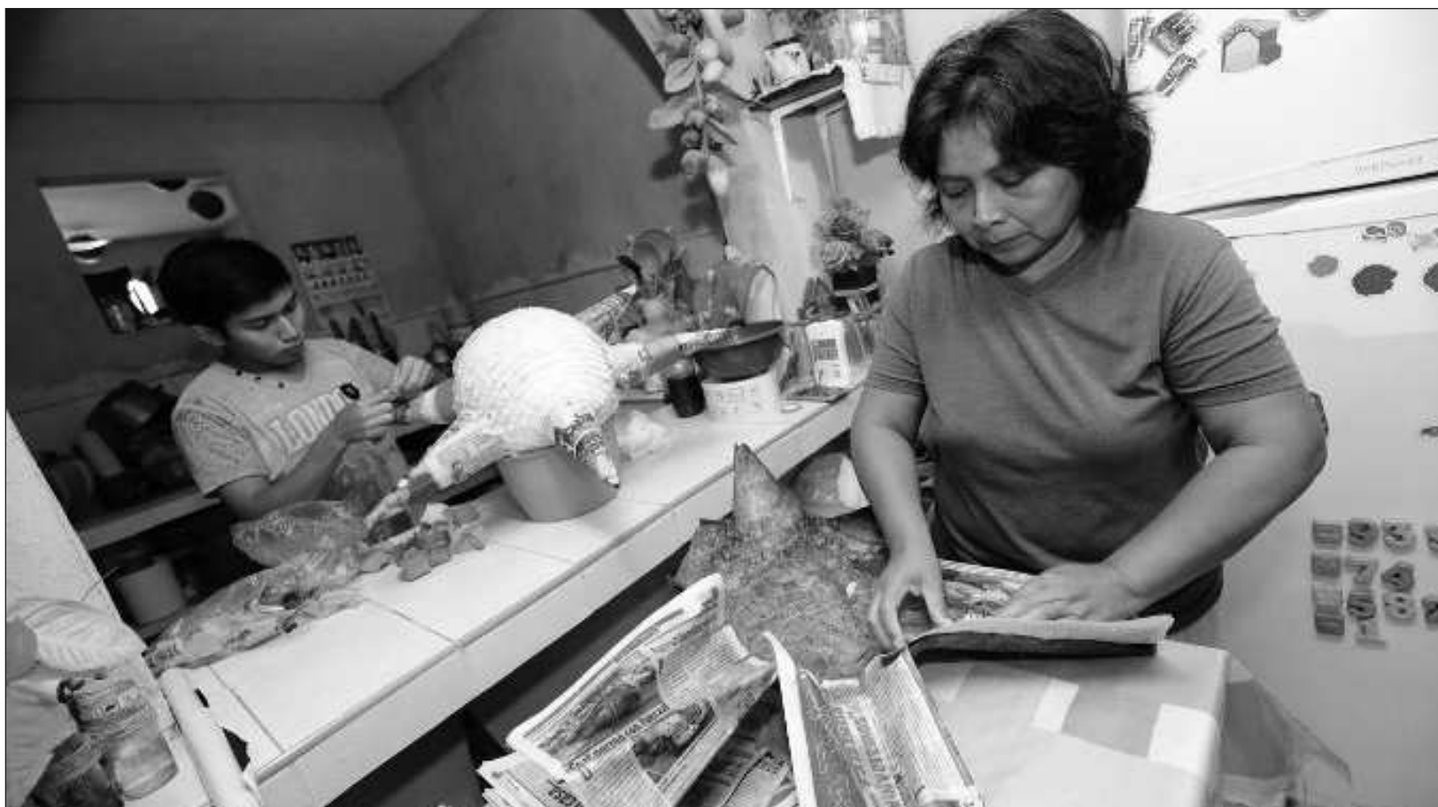
▲ Los cursos incluyen clases de cultura de belleza, barbería, manualidades, corte y confección, técnicas de pintura, entre otras.

Finalmente, para mayores informes, las y los interesados pueden consultar los detalles de los cursos en las redes sociales de la Dirección de Desarrollo Económico y Turismo, o bien, llamando al teléfono 9999-28-69-77, extensión 81521 y 81535 en un horario de 08:00 a 15:00 horas.