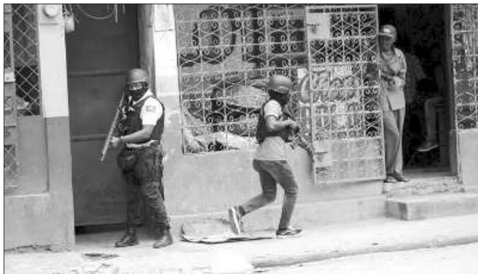
▲ "Es vital redoblar los esfuerzos para que Haití sea un lugar seguro y estable, tenga bases sólidas para el desarrollo sostenible y sea un país donde se protejan los derechos humanos de todas las personas", puntualiza Guterres en el informe.

En 2023 se denunciaron 4 mil 789 víctimas, entre ellas 465 mujeres, 93 niños y 48 niñas, lo que equivale a una proporción de 40.9 homicidios por cada 100 mil habitantes, frente a los 2 mil 183 registrados en 2022 (18.1 homicidios por cada 100 mil habitantes), señala el informe que subraya que en el número de secuestros se elevó a 2 mil 490, un 83 por ciento más que en 2022.