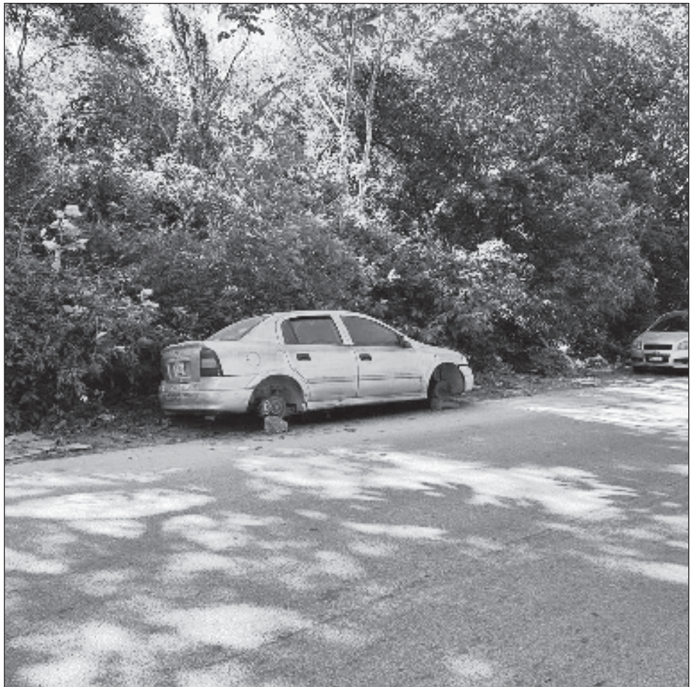
▲ Las autoridades de Tránsito municipal de Tulum han encontrado vehículos en la vía pública en total estado de abandono, inservibles y hasta desvalijados.