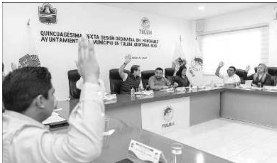
▲ Previo a la aprobación, se detalló que cada beneficiario de la beca deportiva recibirá un importe único de 6 mil pesos que será pagado en dos exhibiciones trimestrales.

De acuerdo a lo detallado en el acta de la sesión, las 605 becas se pagarán de manera trimestral a los beneficiarios, quedando así: 355 becas para el nivel primaria, con importe de 400