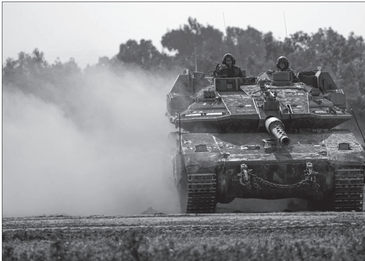
▲ “Como dijo el presidente de Israel, Isaac Herzog, en Davos: ‘¡Adivina qué! A nosotros nos importa, nos duele que a nuestros vecinos se les esté causando tanto daño’. Les importa, dice, pero no encuentran otra solución que matar”.

Aunque la burundanga no es otra cosa que escopolamina, una droga extraída de plantas como la belladona y la mandrágora, se le asocia con la violación, se le ha llamado “la droga de la verdad”, y se le conoce como “la droga zombi” porque tiende a suprimir la voluntad de quienes la consumen; en la letra de la canción nos remite a un contenido aún más terrorífico, que remite a la irracionalidad de la guerra, y desnuda a quienes la alientan y la pretenden justificar, dándoles el carácter de destructores de todo lo que nos hace humanos. Esta idea de lo irracional de las guerras no es en absoluto novedosa. Aparece una y otra vez en casi todas las culturas. Otro ejemplo destacado nos remite precisamente a las diferencias que causan enfrentamientos violentos entre sunitas y chiitas, que Jonathan Swift caricaturizó magistralmente en el siglo XVIII, en sus Viajes de Gulliver , cuando describe