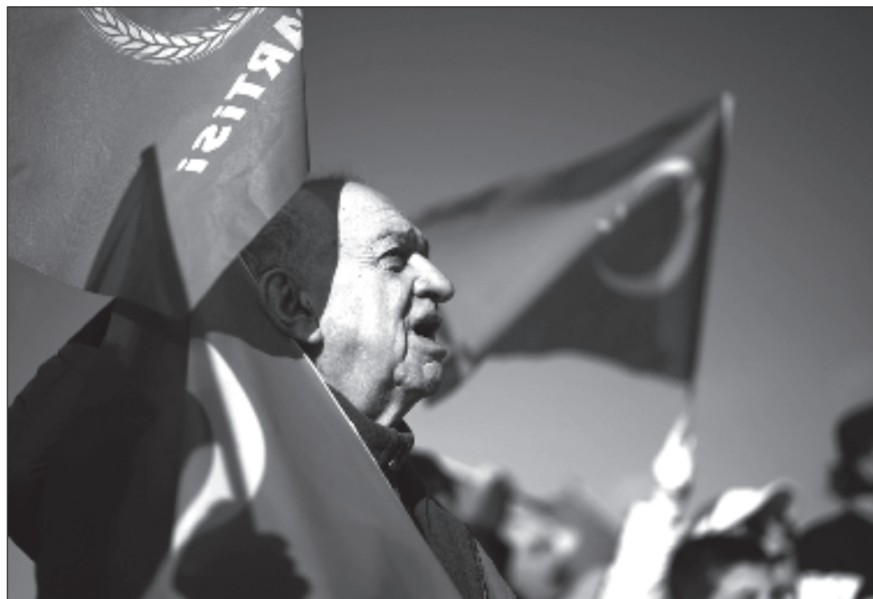
▲ La candidatura sueca se enfrentó a una serie de obstáculos de Turquía, que acusó al país de albergar a militantes de movimientos kurdos calificados de “terroristas” por Ankara.

El país nórdico presentó su candidatura poco después del inicio de la invasión