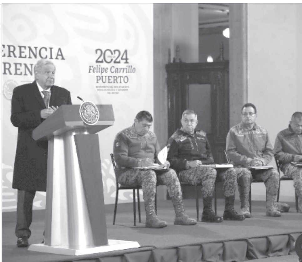
▲ “¿Qué traen ahora? Elección de Estado. ¿Cuál elección de Estado? Nosotros queremos que la gente vote libremente por el candidato, por el partido que quiera”, acotó el Presidente.

López Obrador sostuvo que la relación que ha tenido México tanto con el actual Jefe de la Casa Blanca, Joe Biden, como el ex presidente Donald Trump ha sido buena y respetuosa.