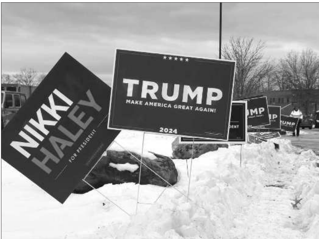
▲ Con 24 por ciento escrutado en Nuevo Hampshire, Trump aventaja con 52.5 por ciento a Haley con 46.6 por ciento.