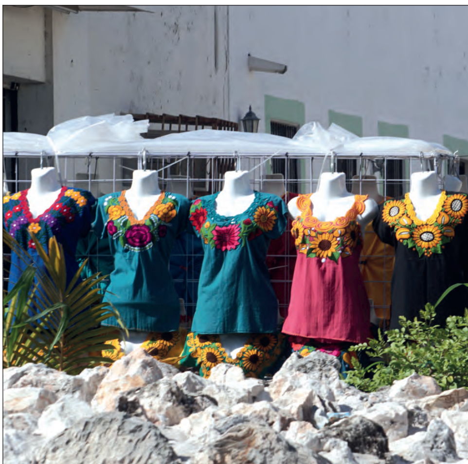
▲ Algunos ambulantes han optado por ofrecer sus frutas, verduras o ropa en sus domicilios, dejando de salir a las calles.

"Incluso hemos visto que algunos comercios sacan a su personal a las calles para promover sus productos y de esta manera generar ingresos, ya que las ventas en sus establecimientos se encuentran muy bajas", concluyó.