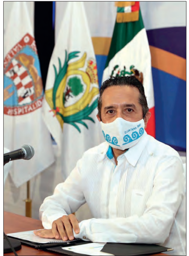
▲ El gobernador de Quintana Roo fue elegido el sábado como presidente del organismo.