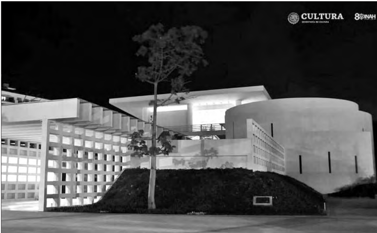
▲ En su Sala Permanente, el recinto exhibe y resguarda una gran colección arqueológica conformada por piezas representativas de la cultura maya.