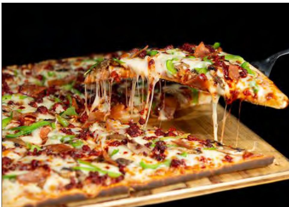
▲ Fotos Pizza Casa Jaguar

Alimentos preparados al horno de leña son el distintivo de este restaurante