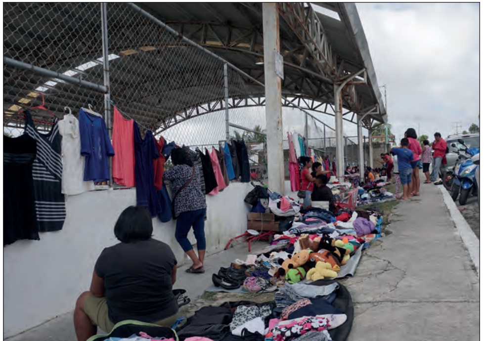
▲ Al no contar con un permiso legal para vender, los ambulantes tampoco son objeto de revisiones por parte de las autoridades reguladoras de sanidad.

Agregó que nadie le aplica algún control sanitario o medidas de higiene para el manejo de los productos que vende, por lo que el cuidado y la seguridad en el manejo del producto es decisión personal de cada vendedor, pero así como es decisión de cada uno, él es responsable de no manipular los cubrebocas antes de su venta y trata de vender los suyos empaquetados desde que