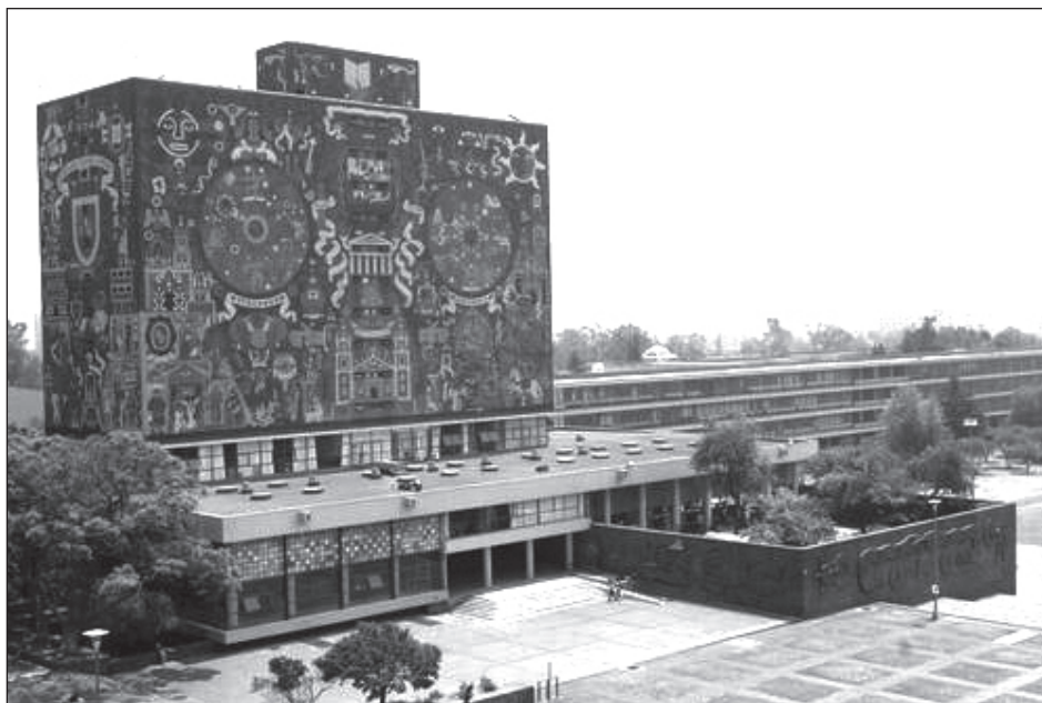
▲ La UNAM reporta que siete de cada 10 de sus alumnos no cuenta con Internet en casa para seguir las clases a distancia.

“Autorizar estas terapias con anticuerpos monoclonales puede ayudar a los pacientes ambulatorios a evitar ser hospitalizados y aliviar la carga de nuestro sistema de salud”, afirmó Stephen Hahn, comisionado de la Administración de Drogas y Alimentos de Estados Unidos (FDA).