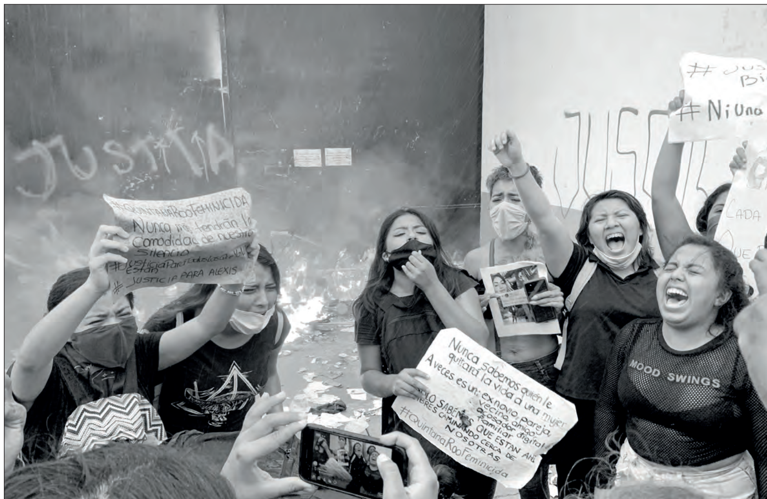
▲ La brutalidad gubernamental ha dado nueva muestra de su razón y finalidad, pues en lugar de contribuir al esclarecimiento de los feminicidios cometidos ahora y antes, lanza su fuerza sobre quienes exigen el fin de la violencia contra las mujeres.