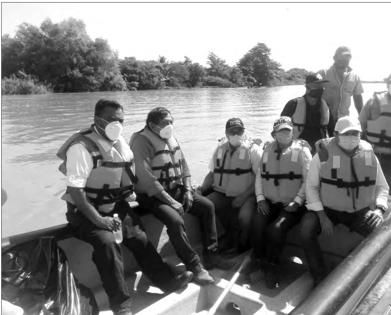
▲ Este fin de semana, las lanchas pudieron llegar a algunas viviendas afectadas, tanto río arriba como río abajo.

Este año tampoco hay un panorama viable para la contratación de veladores, por lo que tendrán que esperar a organizarse con las autoridades de seguridad para tener una mejor respuesta cuando haya reportes de robos. En su caso, hablarían de sistemas de seguridad como cámaras de vigilancia.