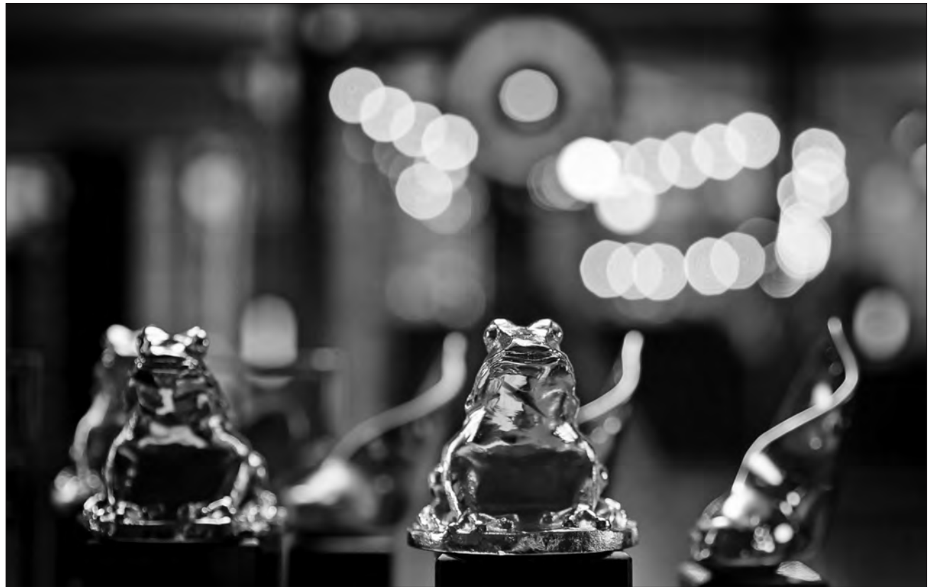
▲ Los mexicanos Rodrigo Prieto y Guillermo Navarro son otros mexicanos que han ganado la Golden Frogg, el primero por Amores perros y Navarro por El laberinto del fauno .

El cinefotógrafo ya había trabajado con luz natural en el único premio que había ganado, el del Gran Jurado Panavisión en