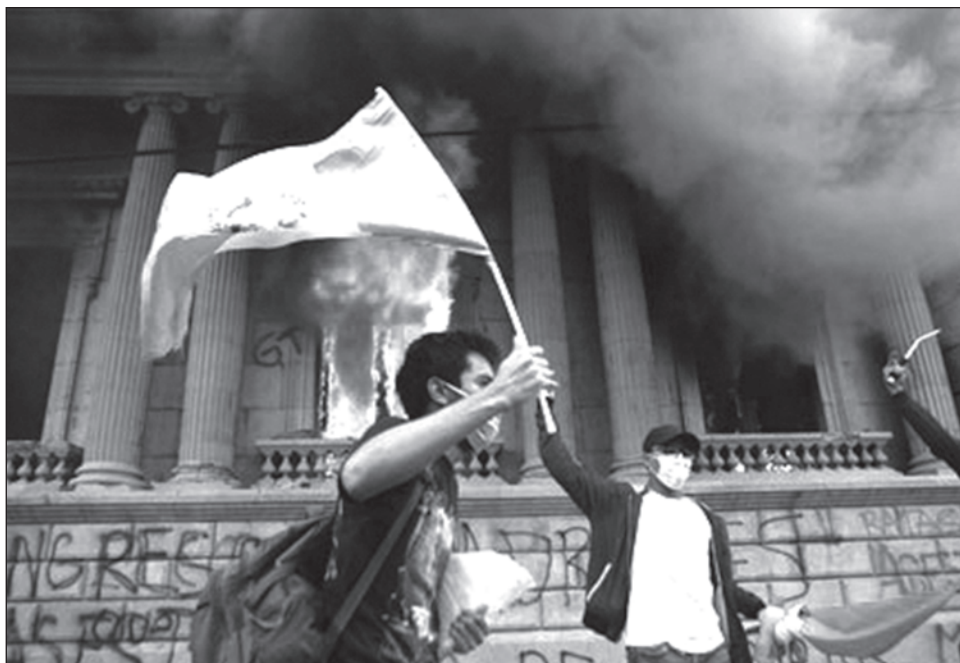
▲ Un grupo de manifestantes destruyó e incendió una parte de las oficinas del Congreso durante una protesta masiva contra el presidente y el cuerpo legislativo.

Los hechos de violencia, que se saldaron con al menos 22 detenidos, contrastaron con las 7 mil personas que tomaron pacíficamente la Plaza de la Constitución para manifestarse frente al Palacio Nacional, como pasó en las protestas de 2015 que rechazaban a las denuncias de corrupción en el gobierno y que llevaron a la renuncia del general Otto