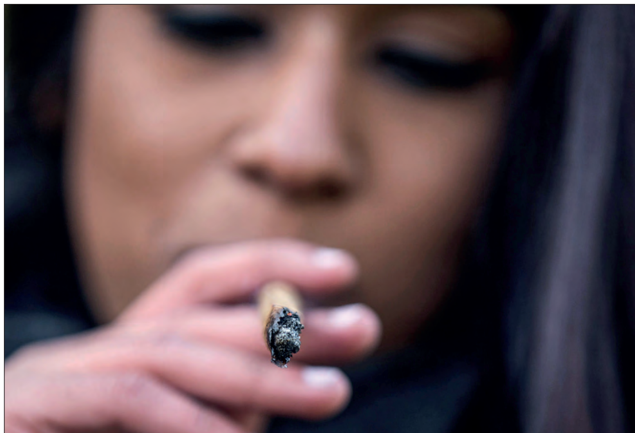
▲ El dictamen aprobado en la Cámara de Senadores, según los colectivos cannábicos, únicamente beneficiará a empresas trasnacionales y no al campo mexicano.

El dictamen, añadió, no aprobó la mariguana medicinal. Se contempla el uso personal o autoconsumo, por asociaciones de con-