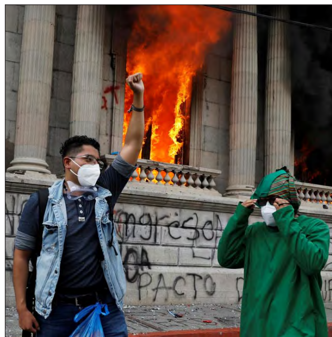
▲ Miles de inconformes prendieron fuego al Congreso guatemalteco.

Pérez Molina es un general retirado que en la década de los