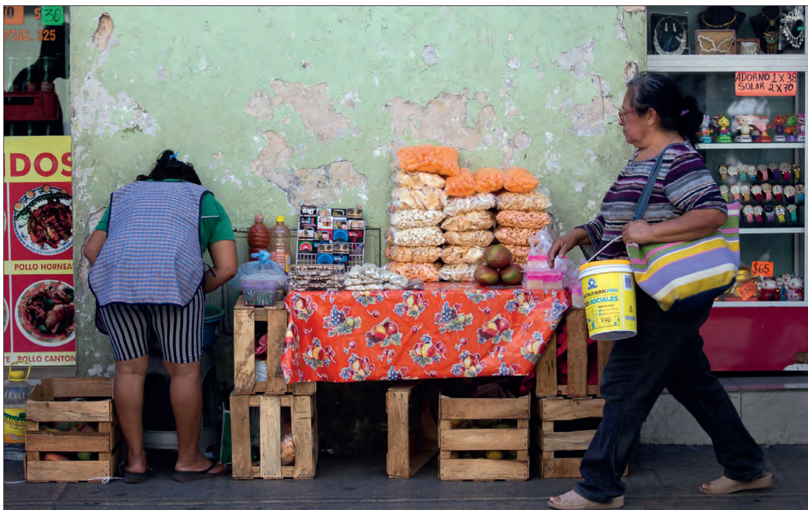
▲ El ambulante y el comercio informal ya estaban presentes desde antes de la pandemia.