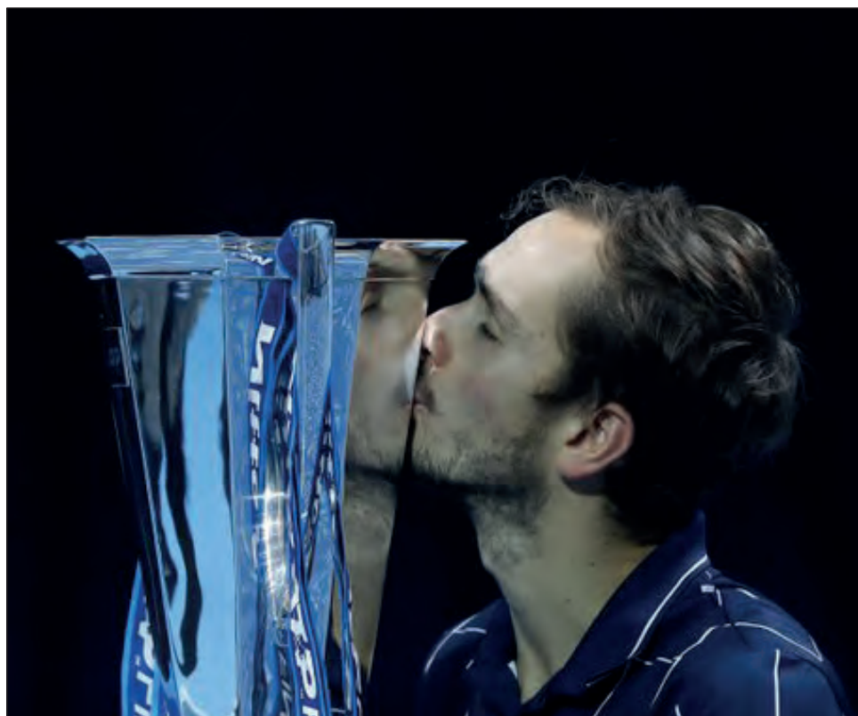
▲ Daniil Medvedev, tras proclamarse campeón de la Copa Masters.

El triunfo sobre Thiem en una cancha dura bajo techo y en una arena sin espectadores debido a la pandemia del coronavirus, se dio poco después de doblegar a Djokovic en la ronda de todos contra todos y de dejar en el camino a Nadal en las semifinales del sábado.