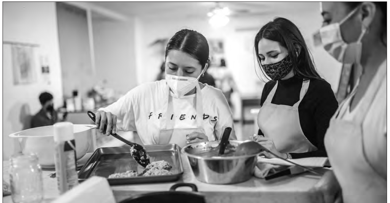
▲ En las clases de cocina vegana se brindan las herramientas y el conocimiento para poder difundir este modo de vida que busca la abolición de la violencia contra todo ser vivo.

El proyecto busca erradicar la violencia en todas sus formas a través del refuerzo positivo, brindando un espacio para que las personas puedan divertirse mientras cocinan, hacer preguntas sobre veganismo y llevar al