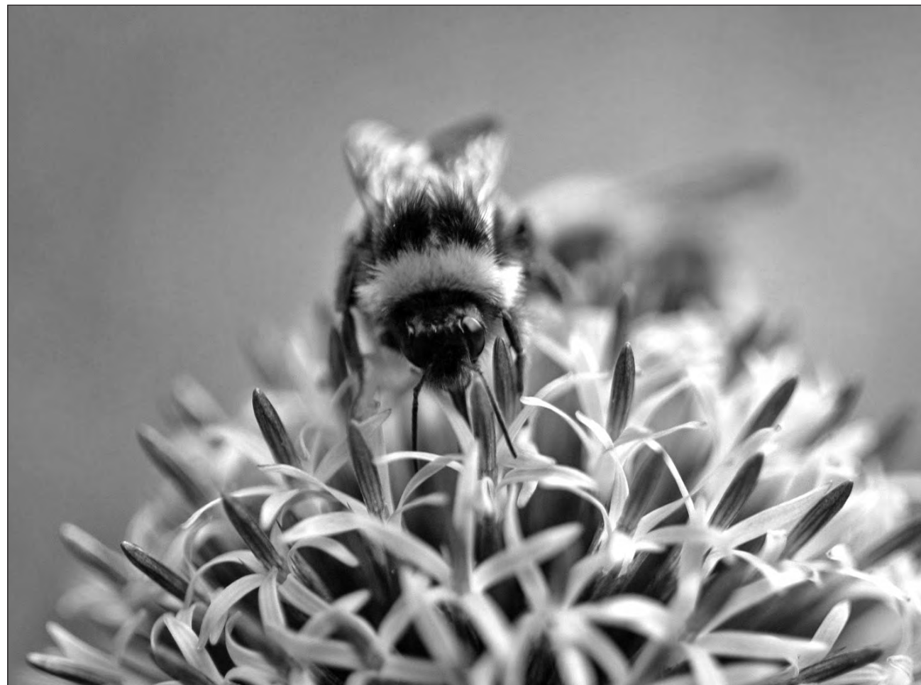
▲ Yucatán destaca a nivel nacional e internacional por la calidad de la miel que produce.