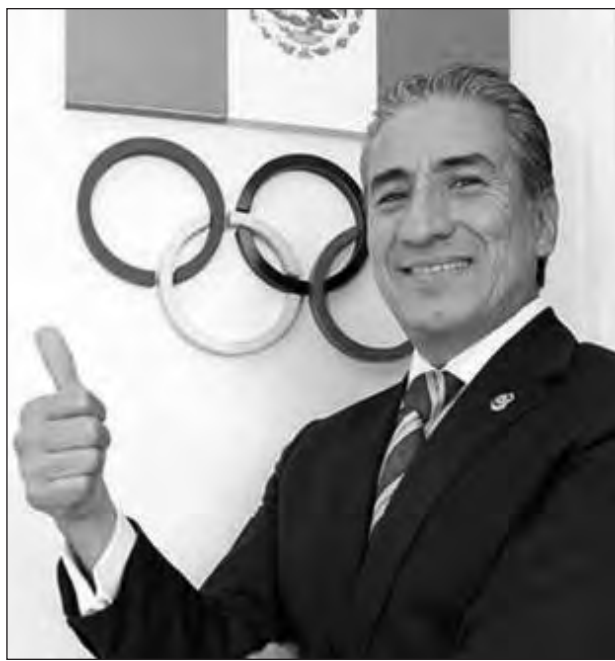
▲ Ernesto Canto se despidió de las pistas con honores en Seattle en 1990.

“Un año antes les gané a todos y no tengo por qué dar explicaciones”, decía Ernesto recordando el Campeonato Mundial de Atletismo de Helsinki