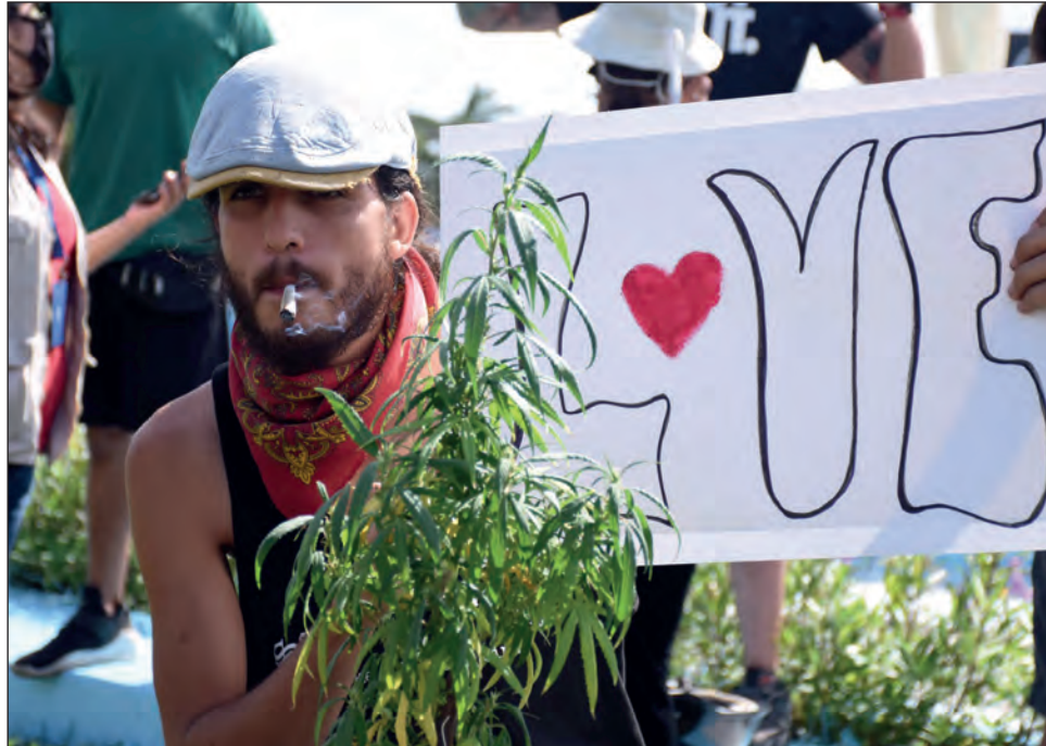
▲ Los ejidatarios se mostraron a favor de una apertura "sana" en el tema, sin caer en el libertinaje.

Novelo Flores consideró que es un negocio multimillonario y que en cuanto se es-