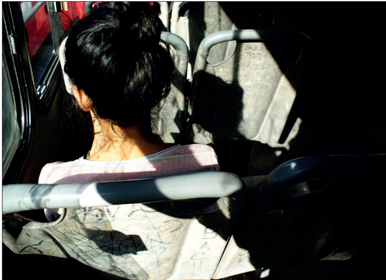
▲ Violencia psicológica, física, económica y sexual son algunos de los reportes que han incrementado desde el mes de marzo.

Una mujer egresa y entran dos, por lo que siem-