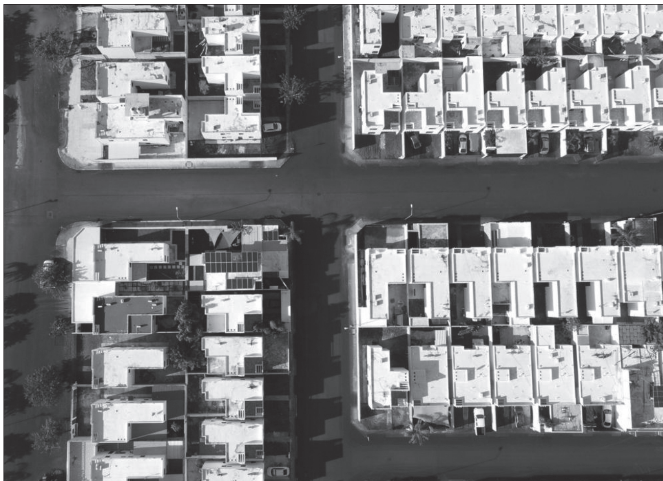
▲ A partir del 2013 Mérida experimentó un crecimiento acelerado, particularmente fuera del anillo periférico, con fraccionamientos que hoy experimentan problemas como inundaciones.

La arquitecta precisó que la Ley de Desarrollos Inmobiliarios de Yucatán y la de Asentamientos Humanos son grandes "soportes" jurídicos para orientar el desarrollo y crecimiento de la ciudad, junto con los programas de desarrollo urbano.