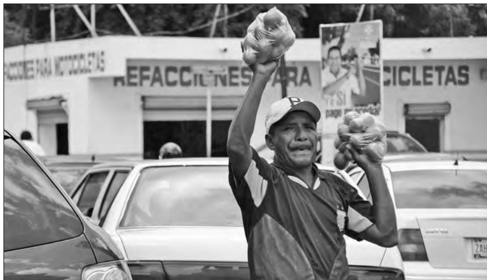
▲ El Banco Interamericano de Desarrollo informó que se redujo en 3 millones 810 mil el número de trabajadores sin acceso a prestaciones laborales, es decir, son informales.

Trabajar no es suficiente para garantizar que una familia pueda adquirir bienes básicos, incluso comer. De acuerdo con David Kaplan, investigador de mercados laborales en el Banco Interamericano de Desarrollo (BID), en el tercer trimestre de este año 44.5 de cada 100 integrantes de la población se encontraban en situación de pobreza laboral. Esto significa que su ingreso es insuficiente para comprar la canasta alimen-