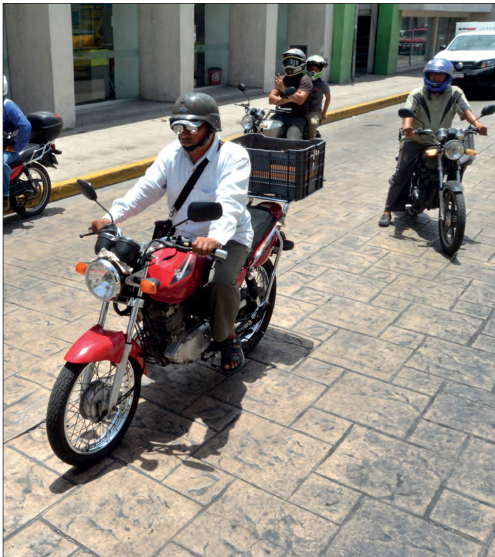
▲ Los "Moto diligencieros, anexos y similares de Quintana Roo" aglutina a más de un centenar de prestadores de servicios.

Con la promesa de "entregas seguras y confiables", varios prestadores ofrecen sus servicios desde las 8:00 hasta las 22:00 o 23:00 horas.