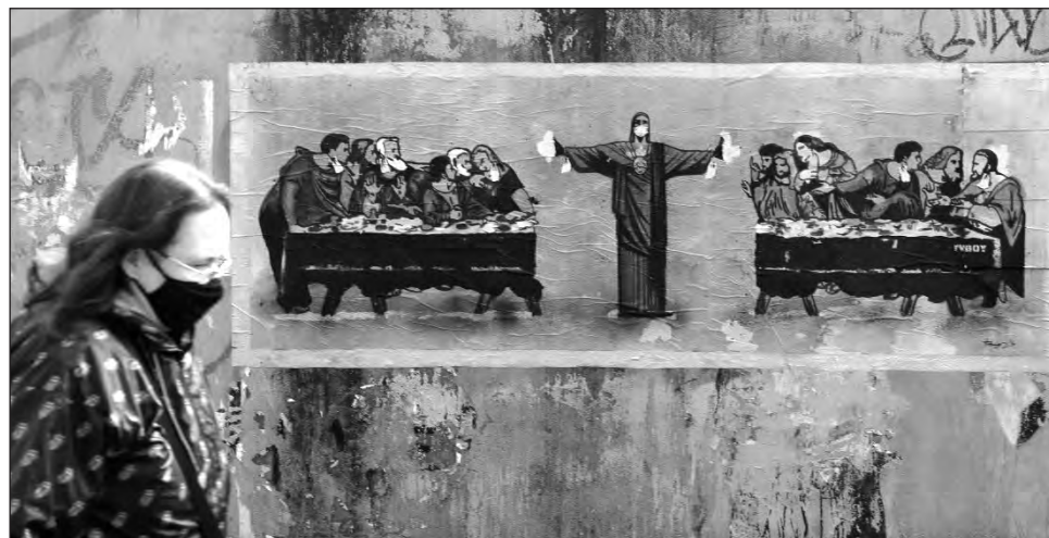
▲ La mitigación de la pandemia y la elaboración de medidas que contribuyan a combatir el cambio climático fueron los temas principales en la reunión virtual que llevaron a cabo los países miembros del G20.

Tras agradecer a los demás líderes del grupo su participación en los dos días que ha durado el foro,