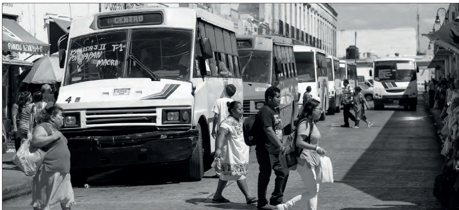
▲ El transporte público de Mérida no está a la altura de una ciudad que se presume segura, cosmopolita y de primer mundo.

LO ÚLTIMO HA sido que el gobierno ha implementado un sistema de transporte interparaderos en el Centro Histórico de Mérida. ¿En verdad es la solución que requiere la ciudad en estos momentos? Nunca olvidaré la plática que alguna vez tuve con un chofer en la CDMX: “A la gente le vale madre el servicio, lo que la gente quiere es eficacia, que llegues rápido a destino; cómo sea pero que llegues rápido”. Esa es la lógica de las urbes que estresan a sus habitantes, donde el transporte público continúa siendo deficiente y poco eficaz ¿En dónde se encuentra Mérida?