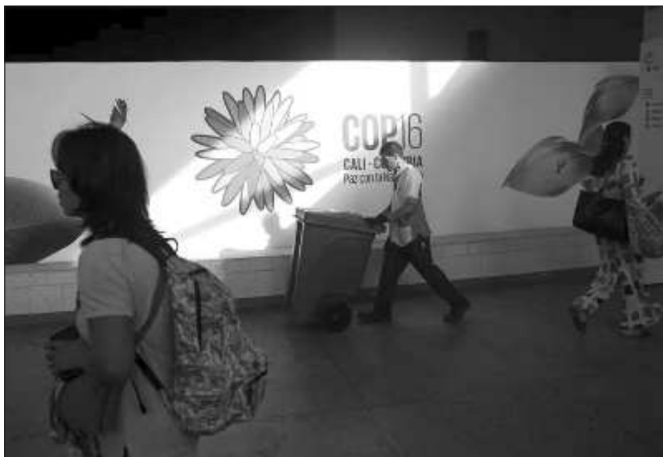
▲ Los rebeldes conocidos como Estado Mayor Central (EMC) amenazaron a los asistentes a la mayor cumbre de Naciones Unidas sobre biodiversidad, que se realiza en la ciudad de Cali.

“La carga explosiva fue detonada a unos 100 metros antes de que el camión llegara. (...) afortunadamente