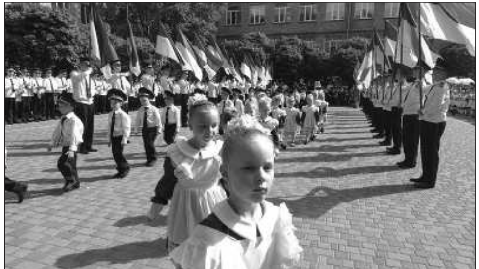
▲ El índice de natalidad que se tiene registrado en la nación ucraniana es uno de los más bajos del mundo y “muy por debajo” del umbral para renovar la población, que es de 2.1 hijos”.

Ya antes del conflicto, Ucrania tenía una de las tasas de natalidad más bajas de Europa y, como en