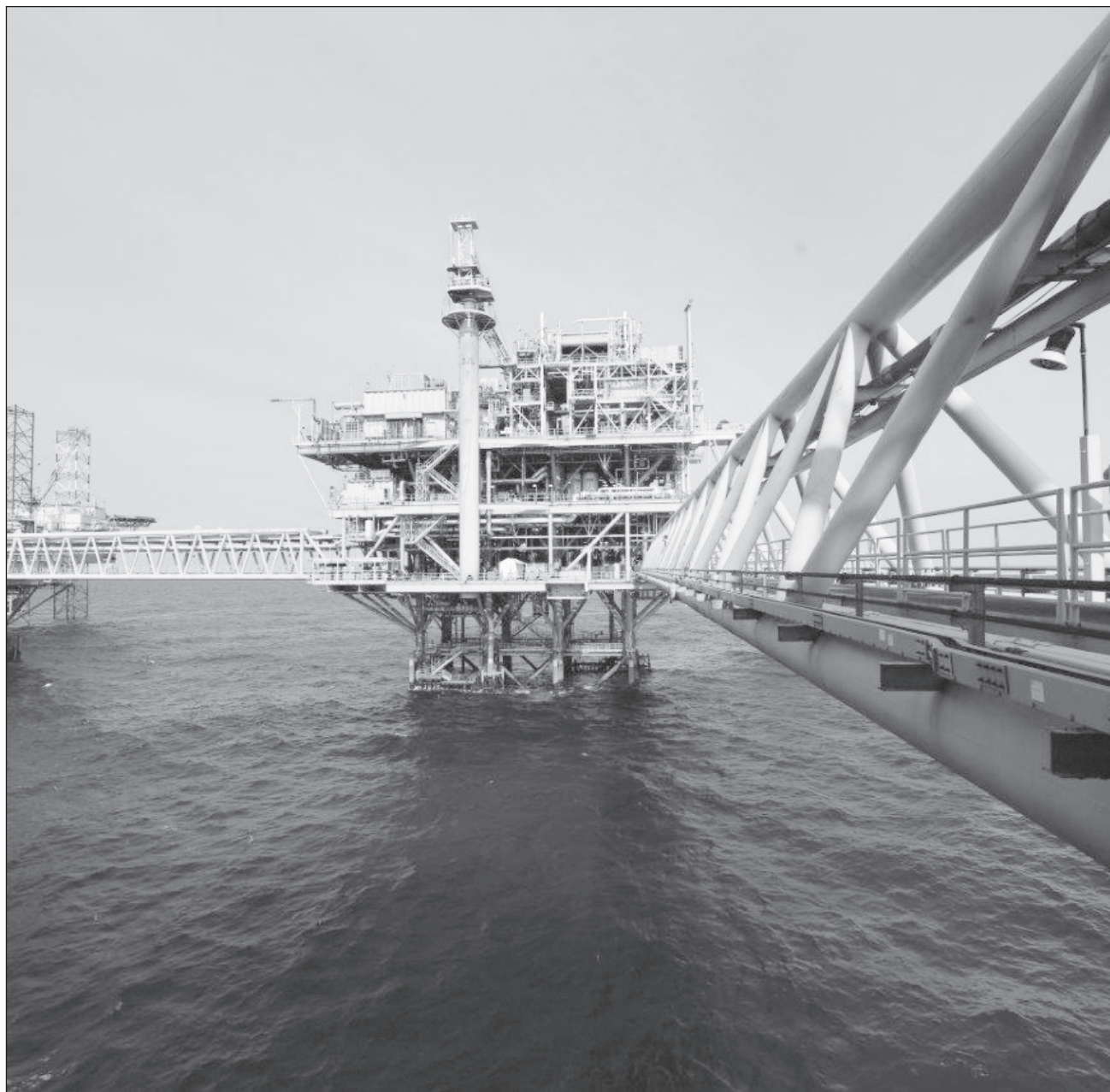
▲ Las fuentes consultadas coincidieron que en esta ocasión no se presentaron lesionados ni daños a las instalaciones, ya que de inmediato pusieron en marcha las medidas de contención y emergencia necesarias.

Como ha sucedido en ocasiones anteriores, hasta el momento, Pemex no ha dado ha dado posicionamiento sobre el incidente, ni tampoco la empresa que realizaba los trabajos.