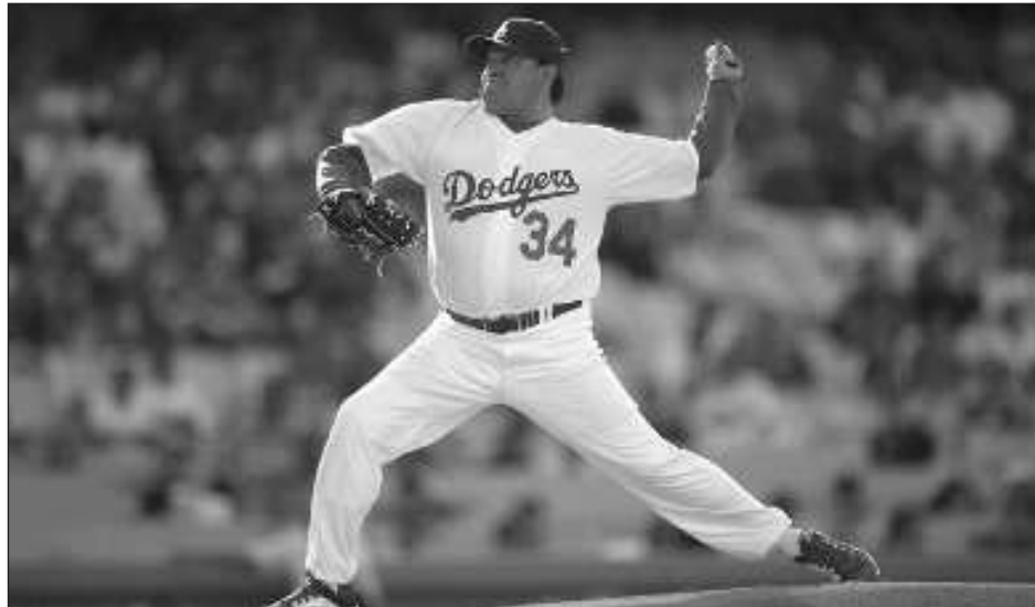
▲ Fernando Valenzuela lanza en un juego de veteranos disputado el 8 de junio de 2013 en Los Ángeles.

Valenzuela había dejado su trabajo como comentarista en la transmisión en español de los Dodgers en septiembre sin dar explicaciones. Se dio a conocer que fue hospitalizado a principios de este mes. Su trabajo lo mantenía como una presencia regular en el Dodger Stadium. Antes de los partidos, solía cenar en el