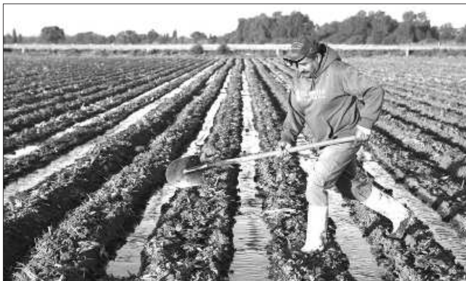
▲ Los cinco programas del Bienestar que se aplican en el campo se mantendrán.

Dijo que la política para el campo implica una atención a los jornaleros para garantizarles su derecho a