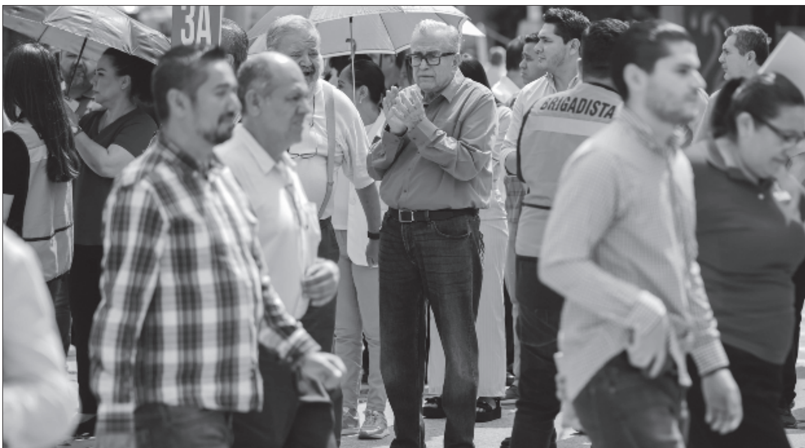
▲ "Rocha Moya sobrelleva su marginalidad con base en declaraciones y actos protocolarios, mientras en Palacio Nacional se valora el tamaño de la crisis".

X: @julioastillero Facebook: Julio Astillero juliohdz@jornada.com.mx