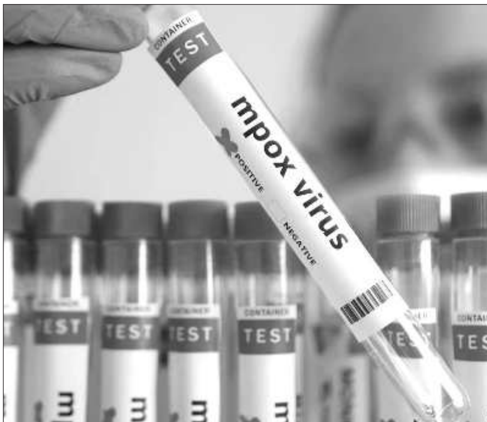
▲ El mpox, anteriormente conocido como viruela del mono, se propaga de los animales a los humanos, pero también se transmite entre personas, causando fiebre, dolores musculares y lesiones en la piel.

A principios de octubre se lanzó una campaña de vacunación en RDC, el país de África Central más afectado por el virus en el mundo.