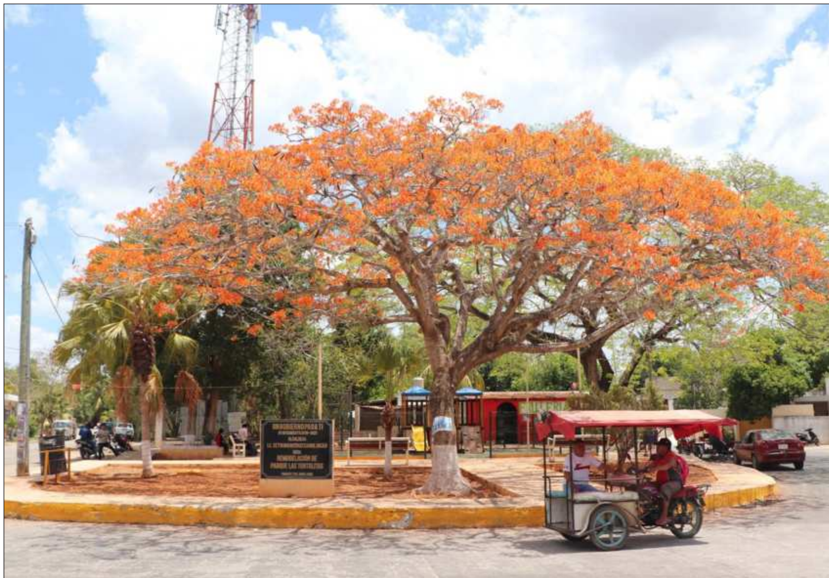
▲ El pasado lunes Campeche capital apareció como la ciudad de la península que más mejoró en la percepción de inseguridad al bajar de 55.9 a 46.3 por ciento, es decir, 9.6 puntos menos de su población la considera insegura; Mérida bajó 2.5 puntos y se ubica como la más segura de la región.

También Yucatán apareció recientemente como el estado del país con mayor porcentaje de acciones implementadas para mejorar su seguridad durante el año pasado con 43.1 por ciento cuando la media nacional fue de 28.1 por ciento, conforme a la Encuesta Nacional de Victimización y Percepción Sobre Seguridad Pública (Envipe 2024), del Instituto Nacional de Estadística y Geografía (Inegi).