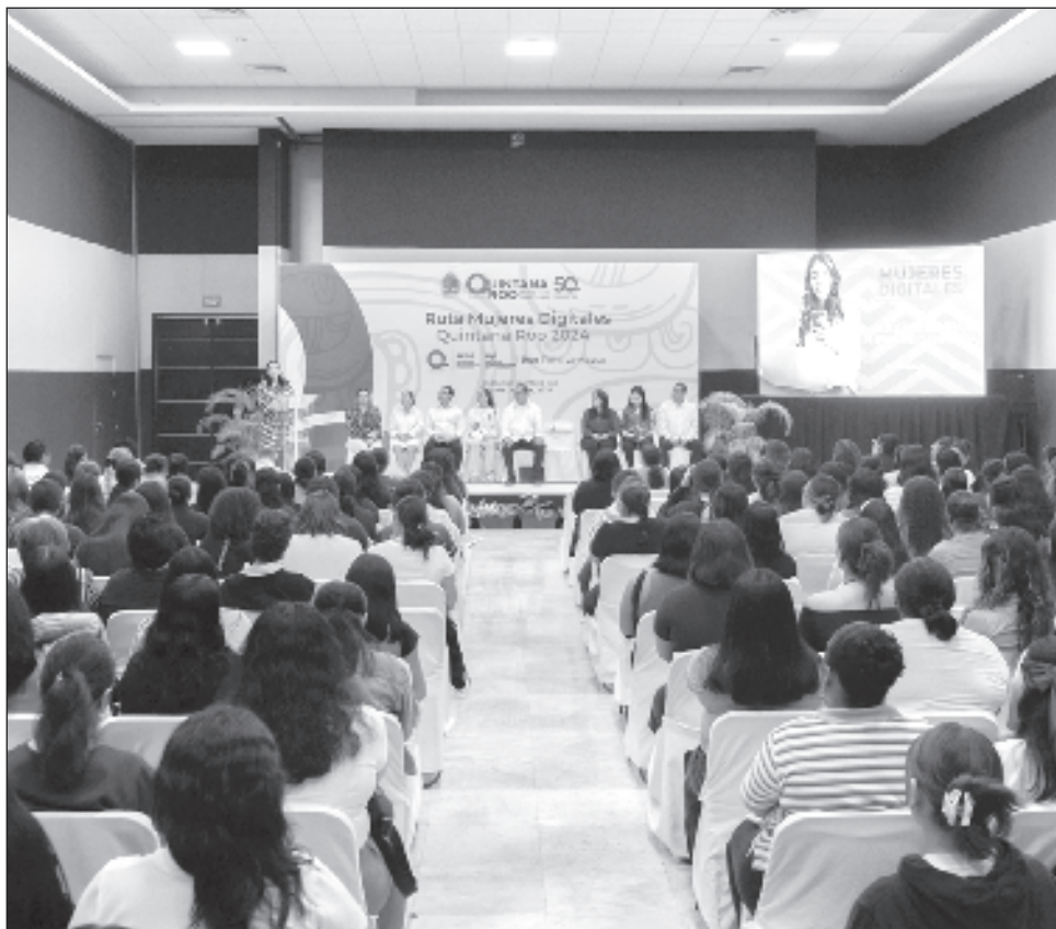
▲ El curso busca empoderar a socias repartidoras, conductoras y restauranteras de Uber, lo que les permita crecer sus emprendimientos.

Prueba de ello es que 91 por ciento de los comercios que se han integrado a la aplicación de Uber Eats han visto un incremento en sus ingresos. Incluso 64 por ciento de estos negocios define a la aplicación como algo crucial para el éxito de su negocio actualmente.