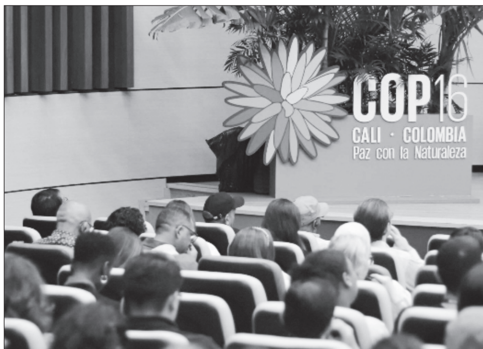
▲ La COP16 es el órgano rector del Convenio sobre la Diversidad Biológica, adoptado en 1992, el cual en este 2024 tiene como sede Cali, bajo el lema "paz con la naturaleza".

Expresó el agradecimiento a la ONU México por invitarlos para dar a