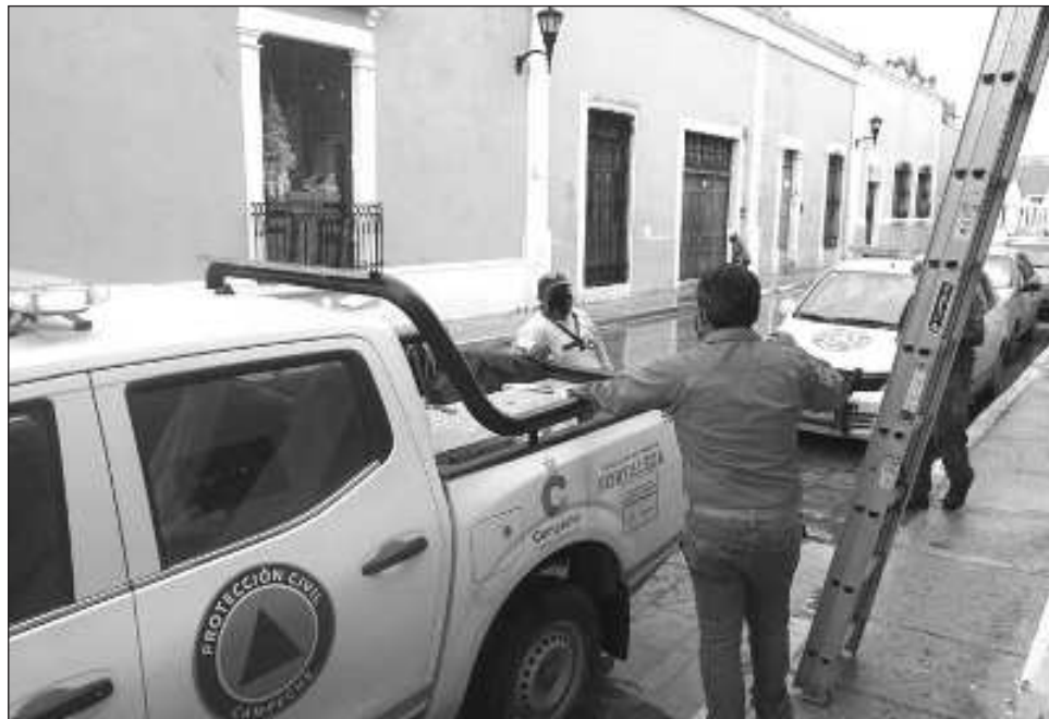
▲ Los tres involucrados son acusados de simular el pago a una empresa "facturera" por más de 600 mil pesos para la remoción y reconstrucción de tres módulos de bomberos en la ciudad capital, sin que haya evidencia administrativa y física de estos trabajos.

El mencionado, junto con Edgar N., Mario N. y un sujeto más también identificado como Ricardo N. respectivamente, son acusados de simular el pago a una empresa "facturera" por más de