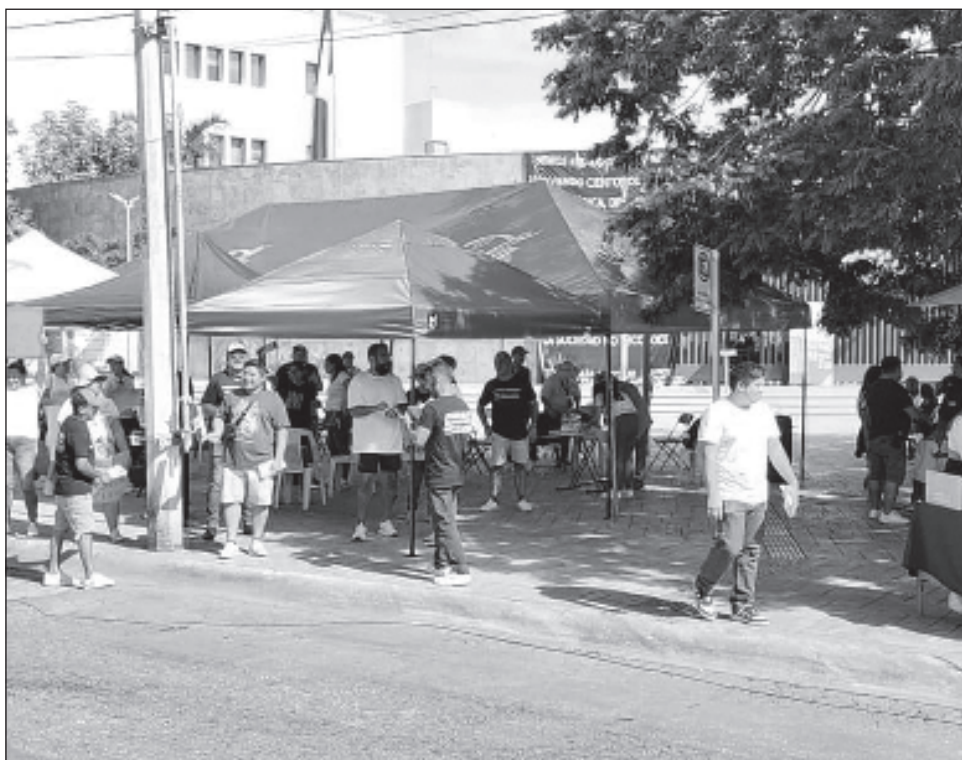
▲ Pese a que decidieron no realizar más bloqueos viales, la base trabajadora del Poder Judicial seguirá en paro en Cancún, así como en todo el país, al menos hasta el miércoles 23 de octubre, pero seguirán atendiendo los casos prioritarios.

Chi Flores adelantó que buscan organizar una feria jurídica; prevén tener al menos dos módulos con titulares y algunos compañeros que expliquen tanto a niños como jóvenes, adultos y adultos mayores, todo lo que necesiten conocer de las leyes. El llamado, dijo, es a que los sigan apoyando y sobre todo que tengan la certeza de que están tratando de pelear por un México libre.