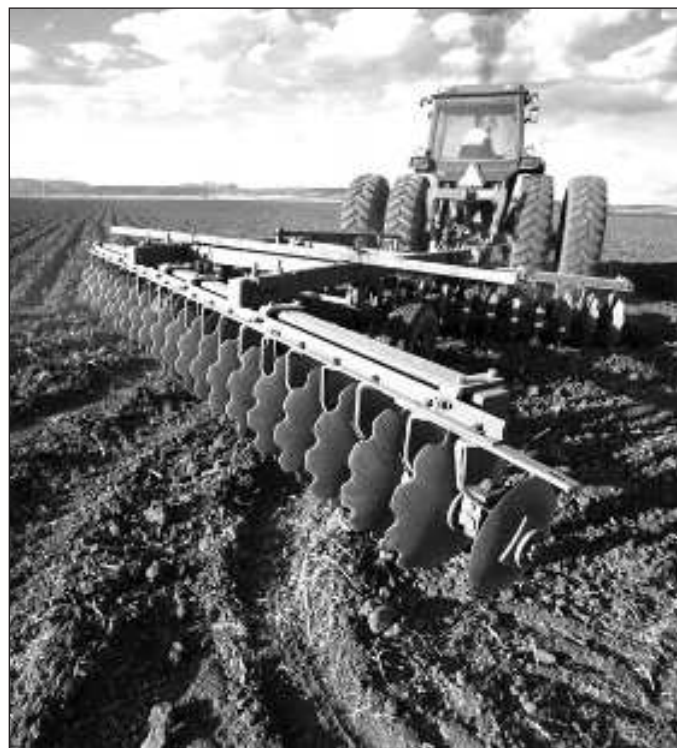
▲ Alcanzar la soberanía alimentaria, entonces, implica que el Estado intervenga en la competencia por el uso del suelo agrícola, en la cual los sembradíos de amapola o mariguana tienen un importante peso.

Hay entonces una diferencia entre producir lo que se va a consumir y lo que se producirá y obtendrá del mercado internacional. La prioridad estará en que los agricultores locales sean los primeros beneficiados y lo que se obtendrá a mediano plazo será, posiblemente, una mayor diversidad en la oferta de comestibles nacionales; sin duda una excelente contribución para que la alimentación