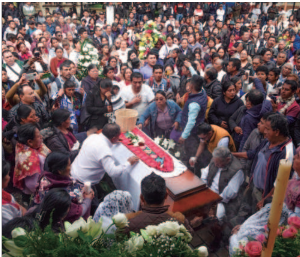
▲ La Fiscalía General de la República será la instancia que estará informando avances del tema al haber atraído la investigación del caso del padre Marcelo.

Por su parte, el gobernador de Chiapas, Rutilio Escandón, confirmó esta información en su cuenta de X: “Mi reconocimiento a las autoridades de Procuración de Justicia, quienes me han informado que ha sido detenido el autor material de la muerte del padre Marcelo”, publicó Escandón.