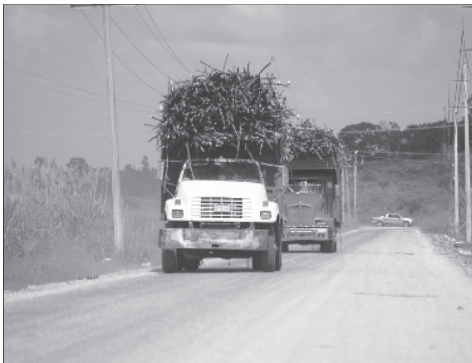
▲ Empresarios se suman al llamado de la gobernadora para atender las vías.

Por su parte, el Consejo Coordinador Empresarial del Carmen y los organismos que lo integran, manifestaron su apoyo a la mandataria estatal, en su posicionamiento ante la presidenta de México, Claudia Sheinbaum Pardo, en “el justo reclamo que por justicia merece el estado de Campeche, solicitando la