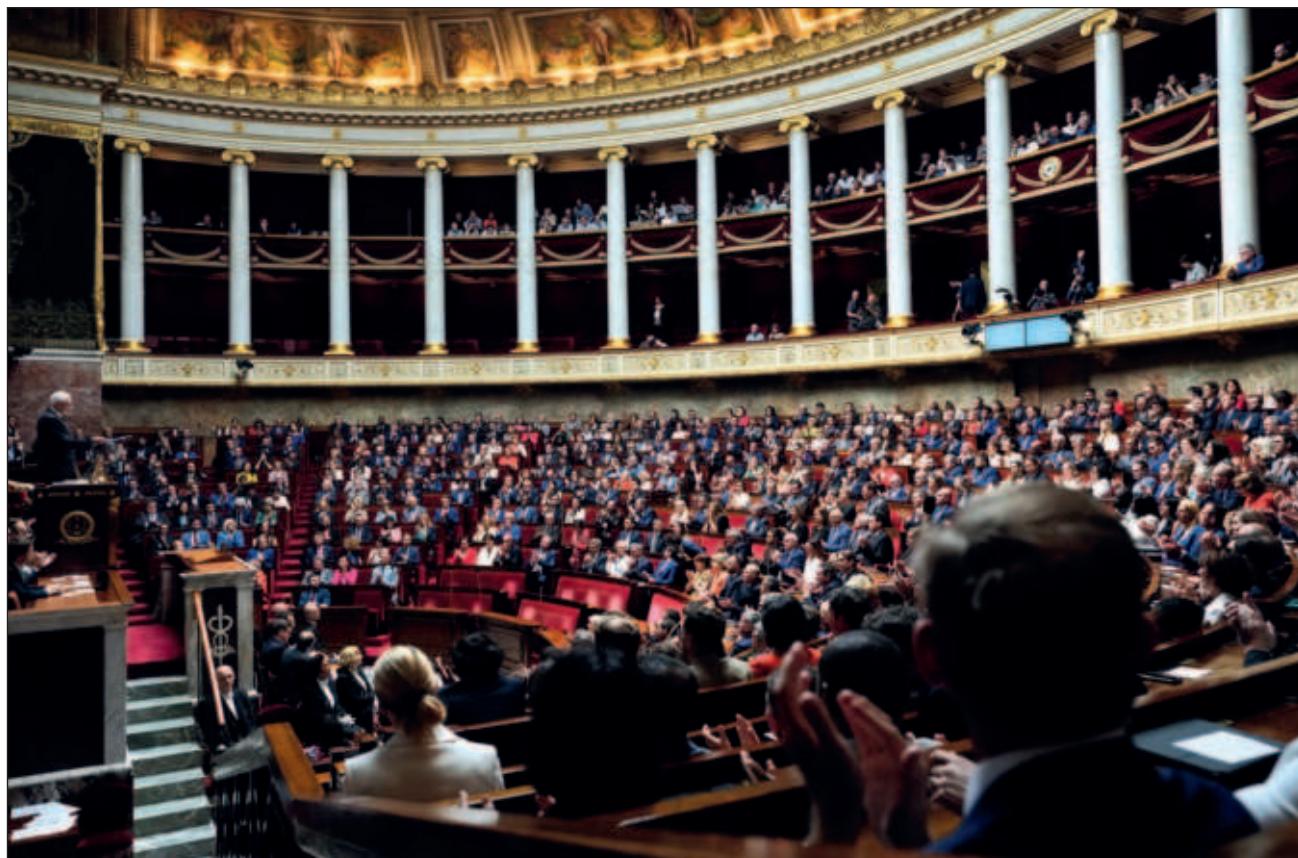
▲ La decisión de Emmanuel Macron de convocar unas elecciones anticipadas dio pie a un Parlamento dividido, en el que la alianza de izquierdas Nuevo Frente Popular quedó de manera sorpresiva en primer lugar.

La decisión de Macron de convocar unas elecciones anticipadas dio lugar a un Parlamento dividido, en el que la alianza de izquierdas Nuevo Frente Popular quedó inesperadamente en primer lugar, por delante de los centristas de Macron y el ultraderechista Reagrupamiento Nacional de Marine Le Pen.