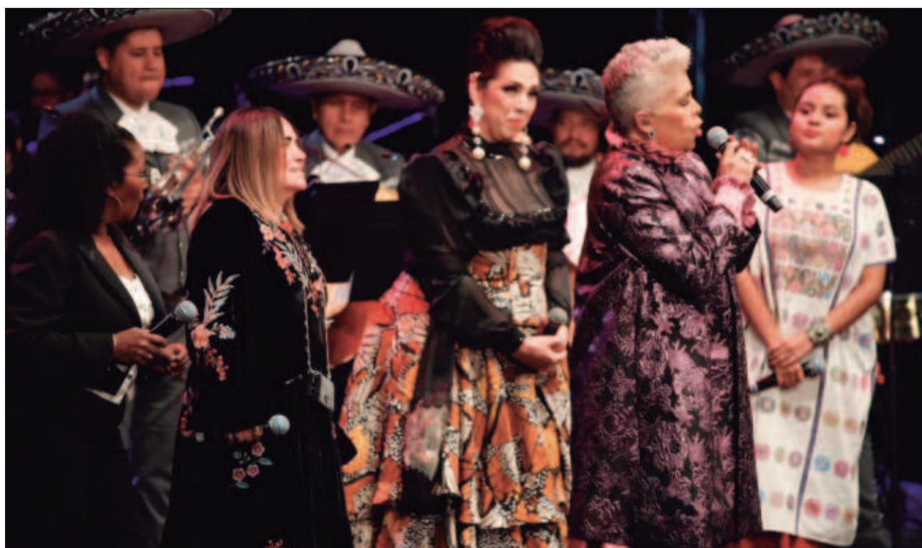
▲ En el programa de La fiesta del bolero, de México y Cuba para el mundo hubo de todo y para todos. Tanto bolero acompañado a piano y a guitarra, en trío y sinfónico hasta bolero norteño, arrabalero y ranchero.

Muchos de los grandes éxitos del género, como Bésame mucho , de Consuelo Velázquez, la canción más grabada de la historia en el mundo; clásicos de Los Panchos, como Contigo y Sin ti ; Sabor a mí y Seguiré mi viaje , de Álvaro Carrillo; un popurrí con temas de Roberto Cantoral, como Reloj y La barca , fluyeron de la voz de esos artistas, calando en lo más profundo del ánimo y los sentimientos de la audiencia.