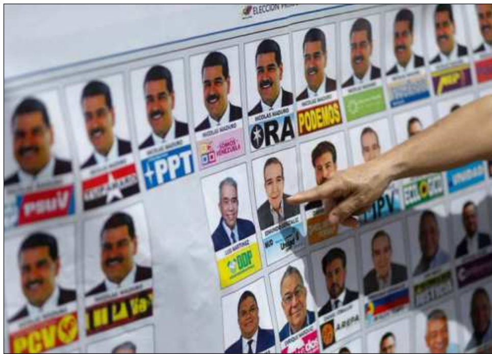
▲ Estados Unidos también quiere evitar la llegada de una eventual nueva oleada migratoria si Nicolás Maduro se reelige, un asunto clave en su propia campaña electoral.

Pero el chavismo lo desestima y sostiene que esos