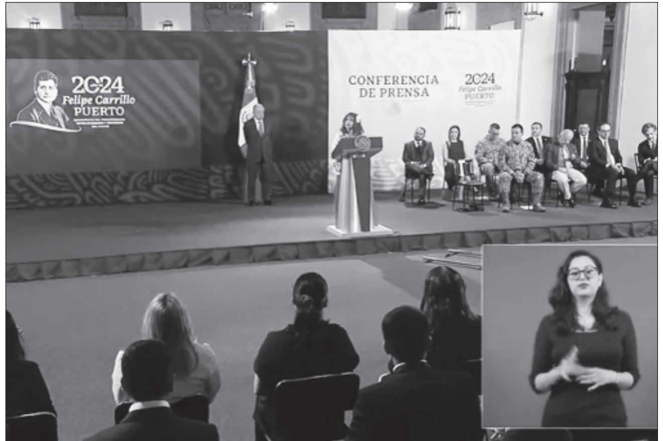
▲ En Palacio Nacional, la gobernadora Layda Sansores San Román subrayó que en Campeche se hablará de un antes y un después del Tren Maya, obra visionaria implementada por el presidente López Obrador.

“No dudamos que Claudia, nuestra próxima presidenta, tiene la misma convicción de que Campeche