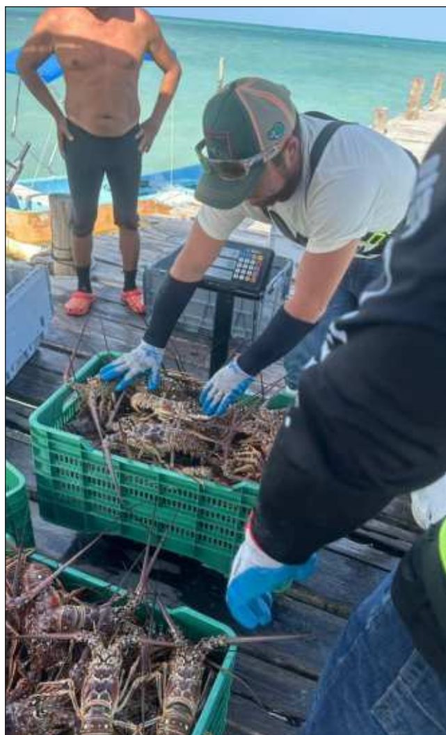
▲ Los hombres del mar pertenecientes a la cooperativa Vigía Chico mantienen la esperanza de una mejora económica en las próximas semanas y meses.