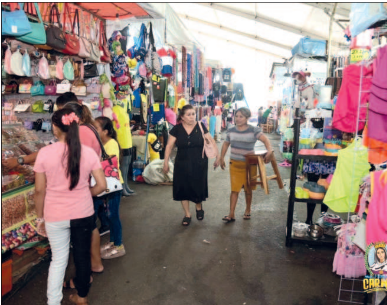
▲ El presidente de la Unión de Locatarios del Mercado indicó que los días que aún faltan de la Feria Carmen 2024 se esperan muchas visitas más, por lo que se preparan para recibir a los visitantes.

Los quejosos resaltaron que es importante que los trabajadores en las mismas condiciones alcen la voz, pues cuando se han presentado casos similares las medidas tomadas es dar de baja a quienes reclaman sus derechos.