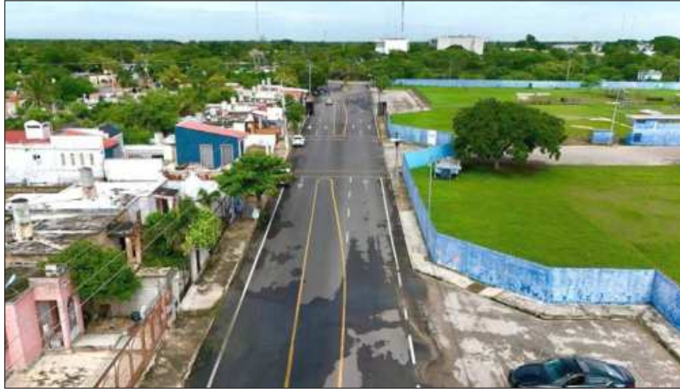
▲ El alcalde Alejandro Ruz Castro entregó los trabajos de repavimentación de la calle 145 entre 50 y 54 de la colonia San José Tecoh, ubicada al sur de la ciudad.

En la entrega de los trabajos de repavimentación de la calle 145 entre 50 y 54 de la colonia San José Tecoh, ubicada al sur de la ciudad, el alcalde acompañado de Julio Sauma Castillo, secretario municipal, y David