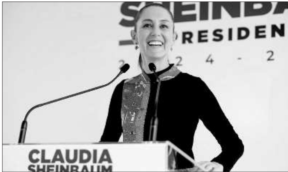
▲ La virtual presidenta electa reiteró durante su conferencia de prensa que "con quien elija el pueblo de Estados Unidos" para su presidencia, habrá una buena relación comercial y de amistad.

Estimó que el Tribunal Electoral del Poder Judicial de la Federación (TEPJF) prevé concluir la calificación de la elección a finales de julio, por lo que le entregarían la constancia de presidenta electa en la primera o segunda semana de agosto.