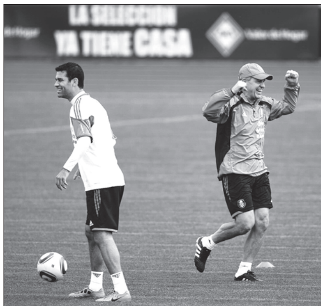
▲ Javier Aguirre (derecha) y Rafael Márquez serán presentados el 1 de agosto y debutarán en sus nuevos cargos con la selección nacional en septiembre.

Márquez, de 45 años, fue capitán de la selección nacional en cinco copas del mundo.