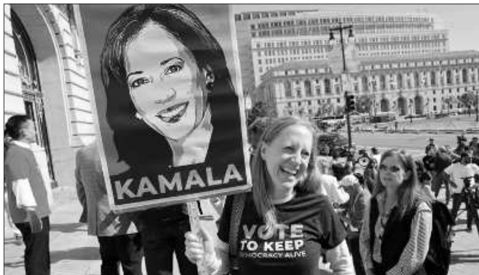
▲ Con el objetivo de dejar atrás semanas de drama intrapartidista sobre la candidatura de Biden, destacados demócratas y organizaciones políticas se unieron rápidamente en torno a Harris.

Pero con la torrente de apoyo y endosos de sus correligionarios y también 81 millones de dólares en donaciones en las últimas 24 horas,