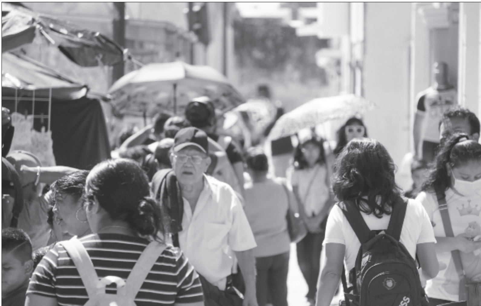
▲ "Las explicaciones a la aceptación popular que tiene la reforma al Poder Judicial es una señal del hartazgo a una normalización de corrupción, de mala interpretación de las leyes, de usar la justicia para encubrir o proteger autoridades. No está mal, pero precisamente porque ésta es némesis del desarrollo".