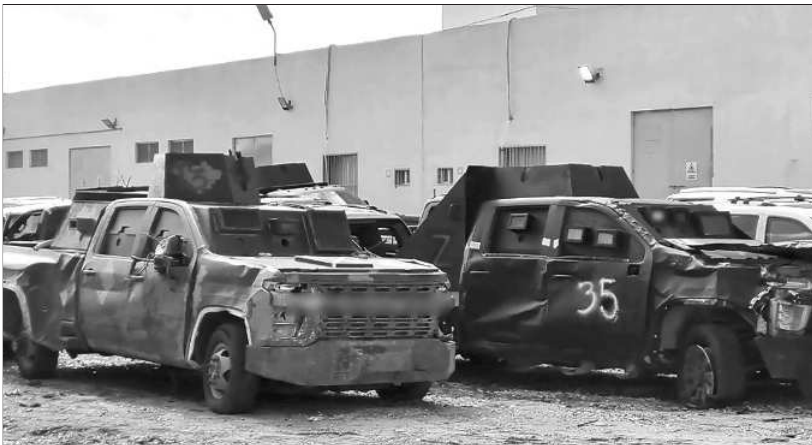
▲ El acto se llevó a cabo en las instalaciones de la FGR en el municipio de Reynosa, una de las principales zonas de operación de Los Escorpiones .