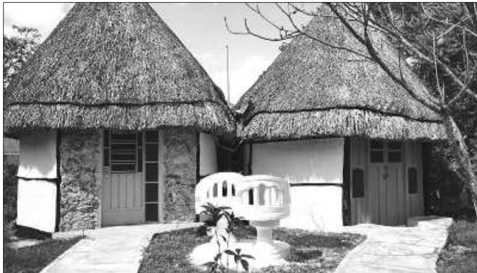
▲ El hotel Aldea Maya Toktli Orígenes ofrece la posibilidad de hospedaje con la reducción de más del 87 por ciento de la huella ecológica por noche.

"Fue un proceso de tres años porque al trabajar con la naturaleza requiere ir a los tiempos de la naturaleza, por ejemplo, tenemos un sistema de tratamiento de aguas residuales a través de microor-