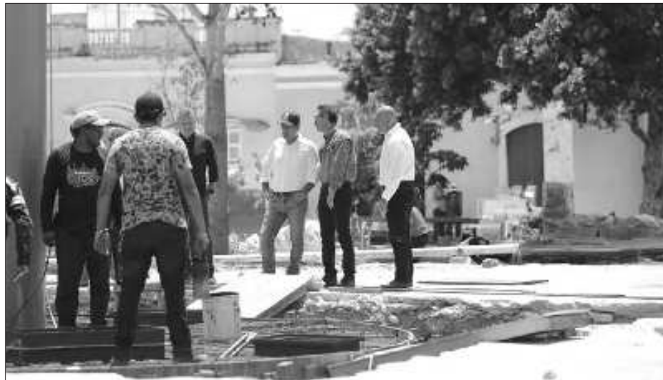
▲ Vila Dosal verificó que se están adecuando las vialidades que rodean a la Plaza Grande, donde se establecerá un solo nivel para el área peatonal y el área vehicular.