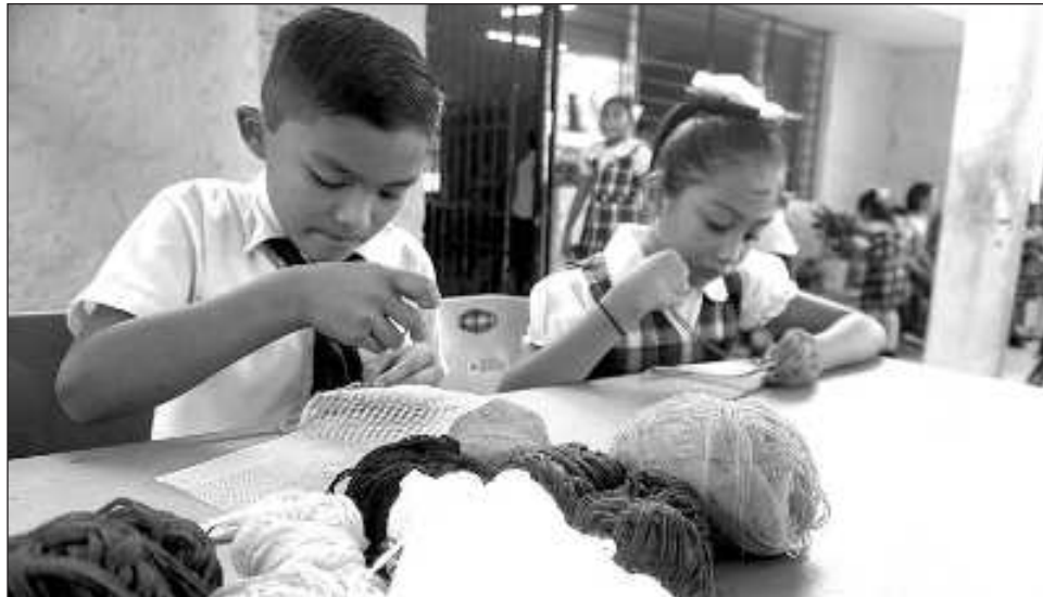
▲ En el proyecto, que fue impulsado por el personal docente y directivo del plantel, participaron 80 estudiantes en acciones de articulación y conexión de los saberes locales.

En el proyecto, que fue impulsado por el personal docente y directivo del plantel, participaron 80 estudiantes en acciones de articulación y conexión de los saberes locales con los conocimientos escolares, abordando preocupaciones sociales de los entornos escolares. De este modo, con la participación de madres de familia y artesanas locales, se obtuvieron resultados en el aprendizaje de las alumnas y alumnos como el diseño y elaboración de piezas como