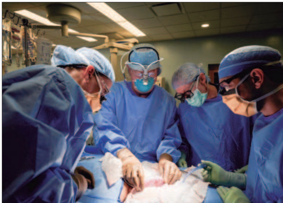
▲ La terapia celular combinada en pacientes trasplantados condujo a una respuesta inmunitaria reducida de las células T, que pueden reaccionar en contra del nuevo órgano.

El método logra preservar la diversidad del repertorio de receptores de células T