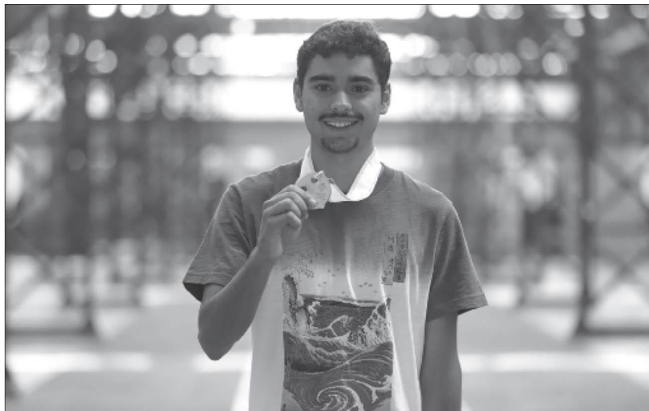
▲ "A los niños y niñas que están comenzando en las olimpiadas de matemáticas les digo que los sueños son algo que vale la pena seguir", sostuvo el estudiante de bachillerato originario de Aguascalientes.

Con mis compañeros comenté entonces acerca de la posibilidad de ser la primera persona en México en lograr dos medallas de oro; afortunadamente, este año el sueño se logró, lo cual significa mucho trabajo invertido y sobre todo la pasión que tengo por las matemáticas. Esta es mi última olimpiada preuniversitaria. Ahora toca que todos se enteren de esa parte que hay detrás de esta medalla, de todo el trabajo que hace la Olimpiada Mexicana de Matemáticas.