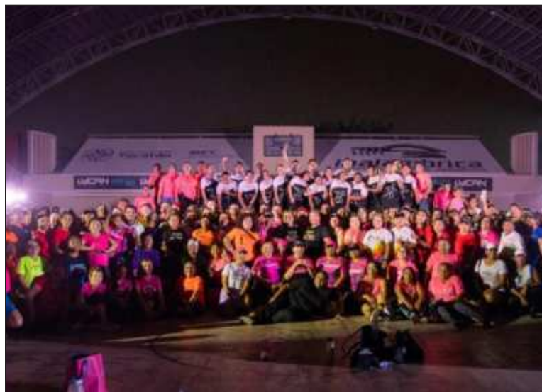
▲ La iniciativa de Fundación Bepensa ha beneficiado a más de 200 mil personas en los estados de Yucatán, Quintana Roo y Campeche.

El impacto de esta iniciativa es significativo, cubriendo 48 parques