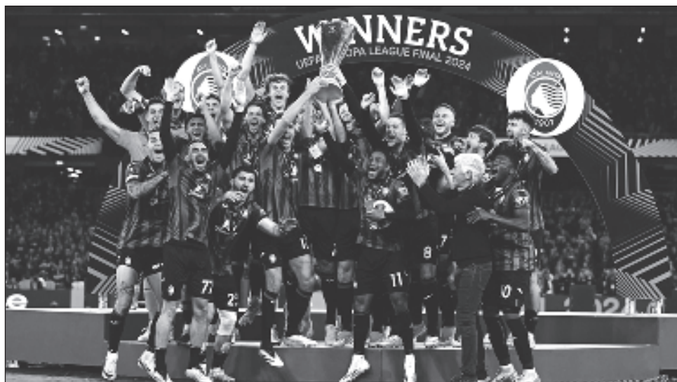
▲ Atalanta logró su primer título continental al derrotar con autoridad al Bayer Leverkusen.

El Atalanta y su técnico veterano Gian Piero Gasperini son protagonistas de una