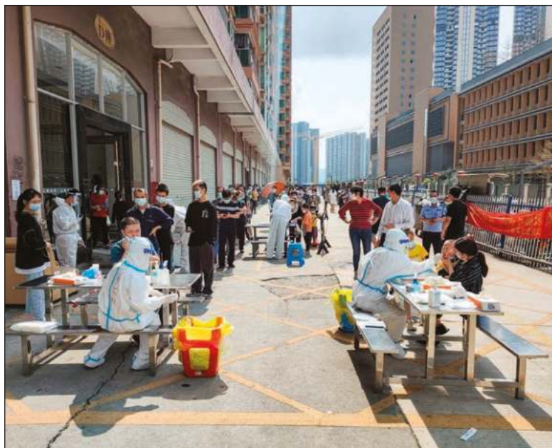
▲ Chinese government has announced the complete lockdown of Shenzhen, a major manufacturing center of 17 million people, for two weeks due to an outbreak of a new strain of Covid.

THIS ASPECT OF globalization will continue to be in the national interest of most countries although there is always the danger that actual or emerging leaders will continue to question science with "other information" which, although false, attracts the interest and support of vested interests. We can look no further to climate change for example.