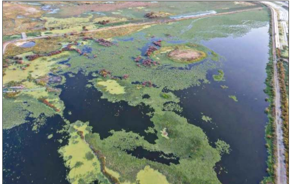
▲ El FPDT consideró que con la declaratoria de Área Natural Protegida del ex lago de Texcoco se le pone fin a un modelo de desecación y una forma de despojo que se había sistematizado en la región.

Esta Área de Protección de Recursos Naturales ubicada en el Estado de México abarca los municipios Atenco, Texcoco, Nezahualcóyotl, Chimalhuacán y Ecatepec, así como once núcleos agrarios.