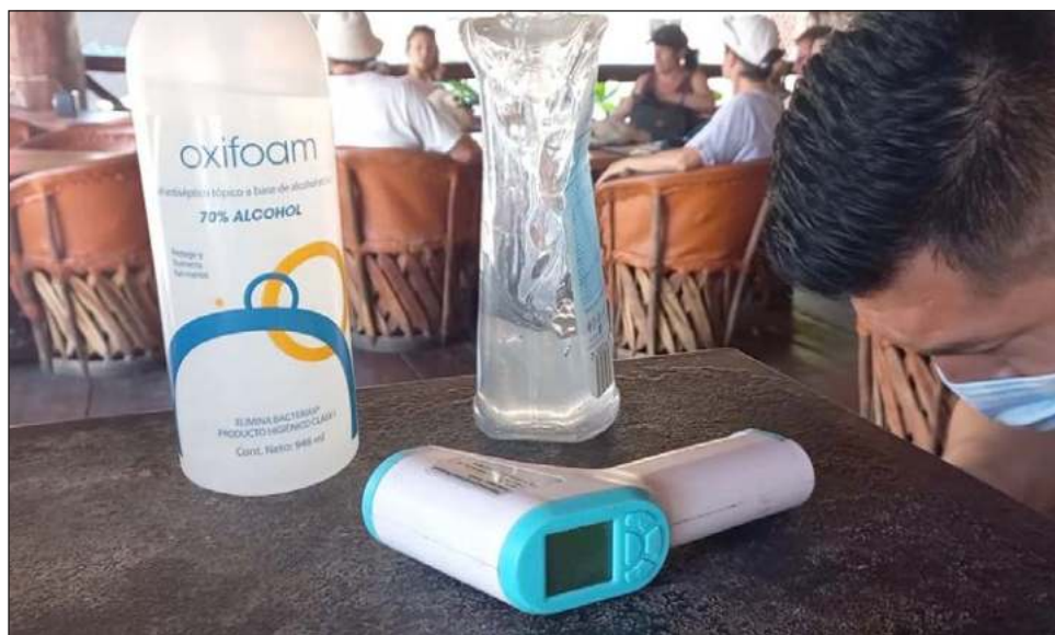
▲ El uso de mascarillas y gel antibacterial es requisito para dar servicio a los clientes.

“Nosotros no vamos a bajar la guardia, todos los empleados de acá vamos a seguir utilizando el cubrebocas para fortalecer las medidas de seguridad para nuestro personal y nuestros clientes”, sostuvo.