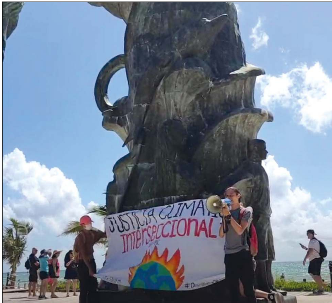
▲ El portal maya de Playa del Carmen fue escenario de una manifestación este martes.