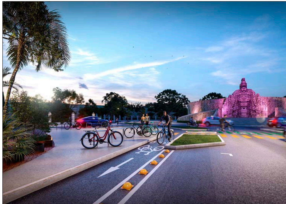
▲ Empresarios consideran que deben haber más espacios para estacionamiento de automóviles.

No obstante, el también dirigente del Consejo Empresarial Turístico de Yucatán (Cetur), aclaró que no están en contra de este proyecto en Paseo Montejo, sino que quieren que se haga sin