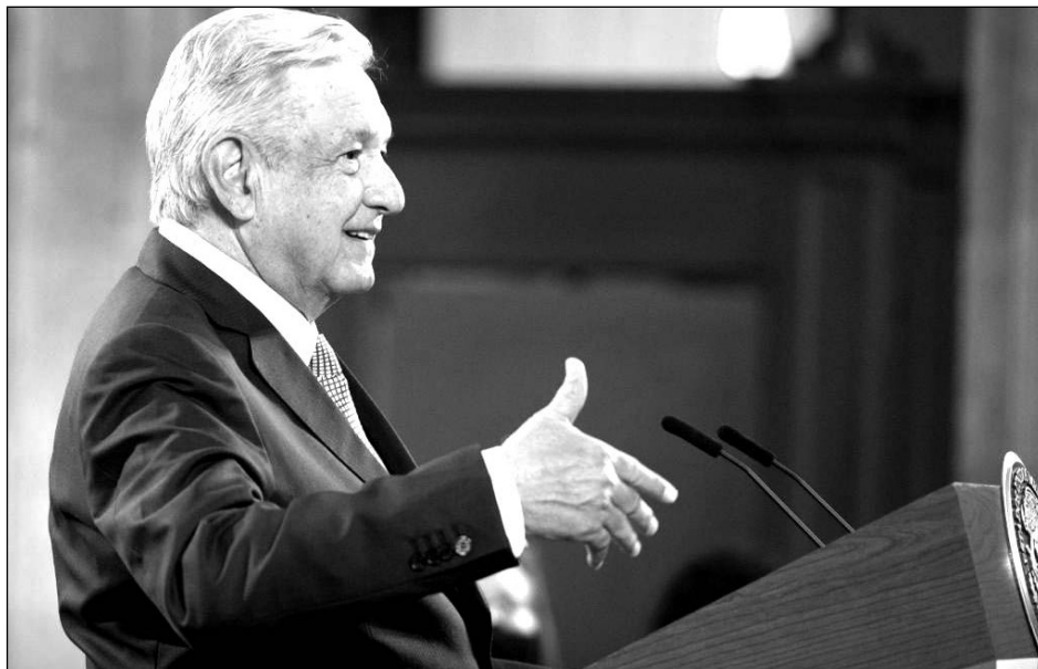
▲ En el extranjero ya no se habla de los escándalos de corrupción, subrayó López Obrador en su conferencia matutina, este lunes.

En una de sus respuestas también refirió el estado de