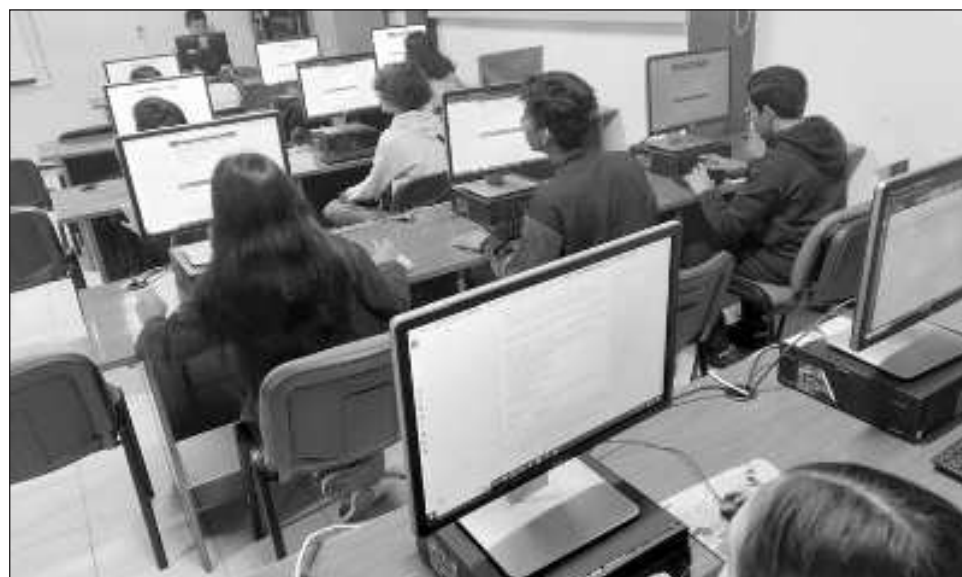
▲ Los 22 centros educativos del Colegio de Bachilleres que ahora cuentan con una conexión a Internet del Jaguar , permiten a los estudiantes y educadores acceder a recursos educativos en línea, colaborar en proyectos digitales y participar en programas de aprendizaje.

Los 22 centros educativos del Cobacam que ahora cuentan con una conexión a Internet del Jaguar , permiten a los estudiantes y educadores acceder a recursos educativos en línea, colaborar en proyectos digitales y