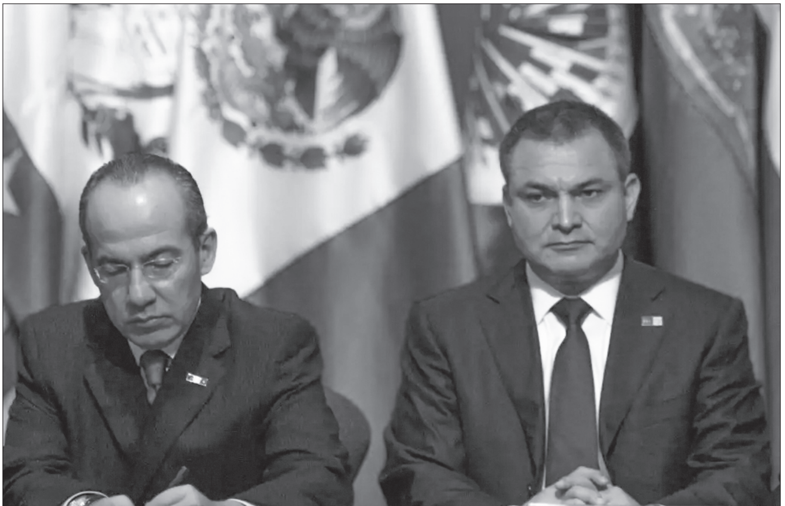
▲ “Muchas de las estructuras de gobierno aún están plagadas de representantes de esa corrupción (...) la sentencia a García Luna es buena y es bien recibida por quienes deseamos un país de justicia, pero, sin duda, más bueno será cuando los ex presidentes estén frente a la justicia”.