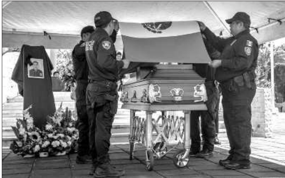
▲ El evento congregó a autoridades del ayuntamiento y federales, miembros de la Guardia Nacional, Marina, Fuerza Táctica, regidores y habitantes del municipio.

"Tu sacrificio no será olvidado. Que descanses en paz, sabiendo que tu ejemplo seguirá vivo en cada uno de nosotros", expresó Mary