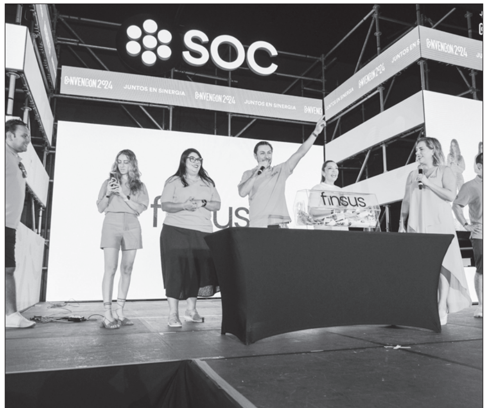
▲ SOC, empresa de asesoría de créditos hipotecarios, realizó su 11 convención nacional en Cancún en días pasados, donde expusieron las tendencias del mercado.

La mayoría de las instituciones bancarias ya tienen productos para que los extranjeros viviendo fuera de México puedan comprar en el país azteca, pero son mayormente paquetes para los norteamericanos y sólo dos bancos tienen esta opción para sudamericanos. Encontrar instituciones financieras en México que les otorguen créditos inmobiliarios también les da grandes ventajas, como tasas fijas, cobros en pesos y por ello ven más atractivo contratar aquí que en sus países.