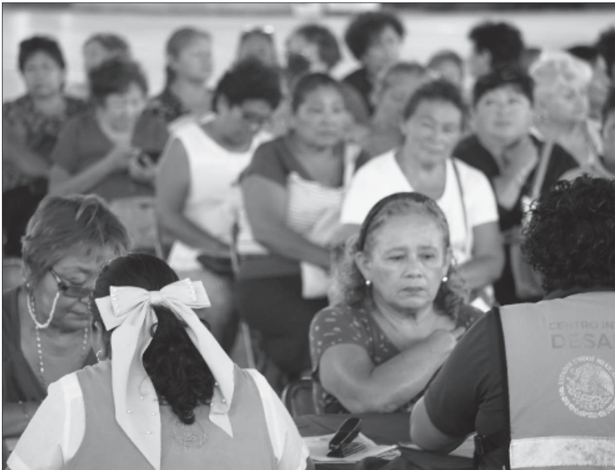
▲ Para llevar a cabo el registro hay 2 mil 600 módulos dispuestos en todo el territorio nacional.

El titular de la SEP explicó que la campaña informativa se apoyará en las guías del buen comer y para alimentación saludable y económica, mismos que ha delineado la secretaría de Salud federal.