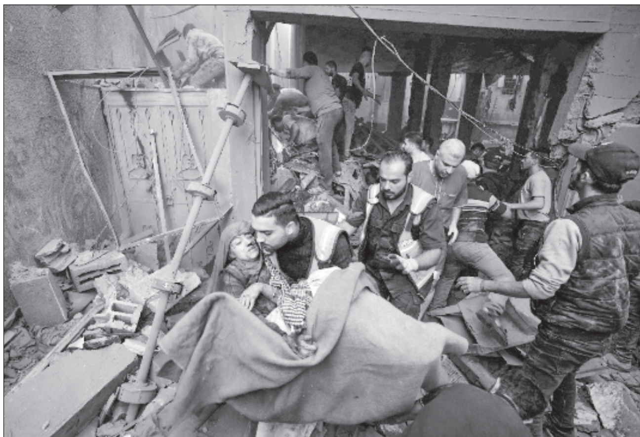
▲ Desde octubre de 2023, la OMS ya hizo posibles unas 600 evacuaciones médicas hacia siete países europeos.

La OMS -la agencia de salud de la ONU- y los países de la UE concernidos ayudarán en el dispositivo de evacuaciones, agregó.