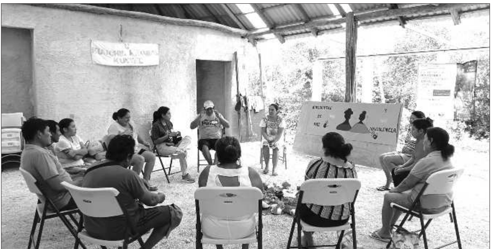
▲ El foro también se llevará a cabo Calakmul, Campeche, el 24 y 25 de octubre, porque la intención es continuar con este trabajo del fortalecimiento de la red.

Este encuentro continuará realizándose de forma anual para promover la paz en las comunidades de los tres estados convocantes: Campeche, Quintana Roo y Yucatán.