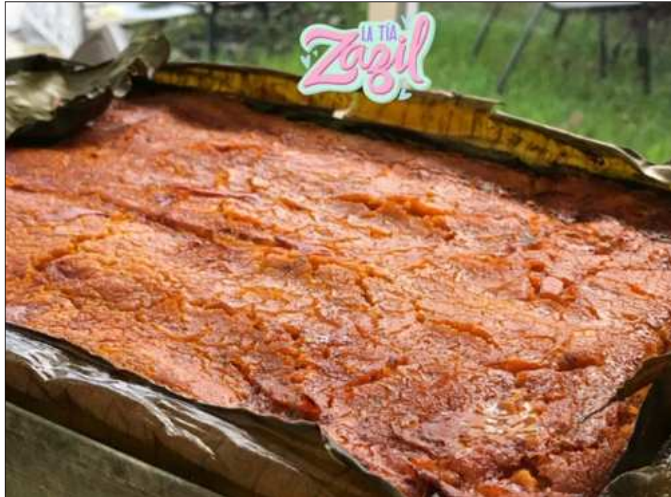
▲ En este platillo una gastronomías como la libanesa y la yucateca.

“Mi abuelo materno le explicaba cómo hacer las cosas a mi abuela, ambos tenían ascendencia libanesa. Hay un recado que nosotros preparamos que es para comida libanesa y para comida yucateca, que viene siendo un recado para todo, eso lo agregamos al col. Ese toquecito de especias