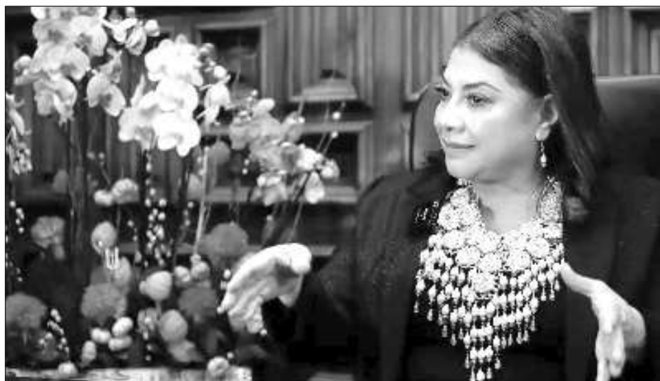
▲ La mandataria capitalina traza las líneas generales de lo que será su gestión: “hoy, que estoy en el gobierno, se trata de aterrizar todos esos programas que históricamente hemos querido”.

El tema era obligado y la gobernante recalcó que combatir la violencia y la delincuencia es una de sus tareas más importantes y por ello desde el inicio de su gestión fue el tema número uno.