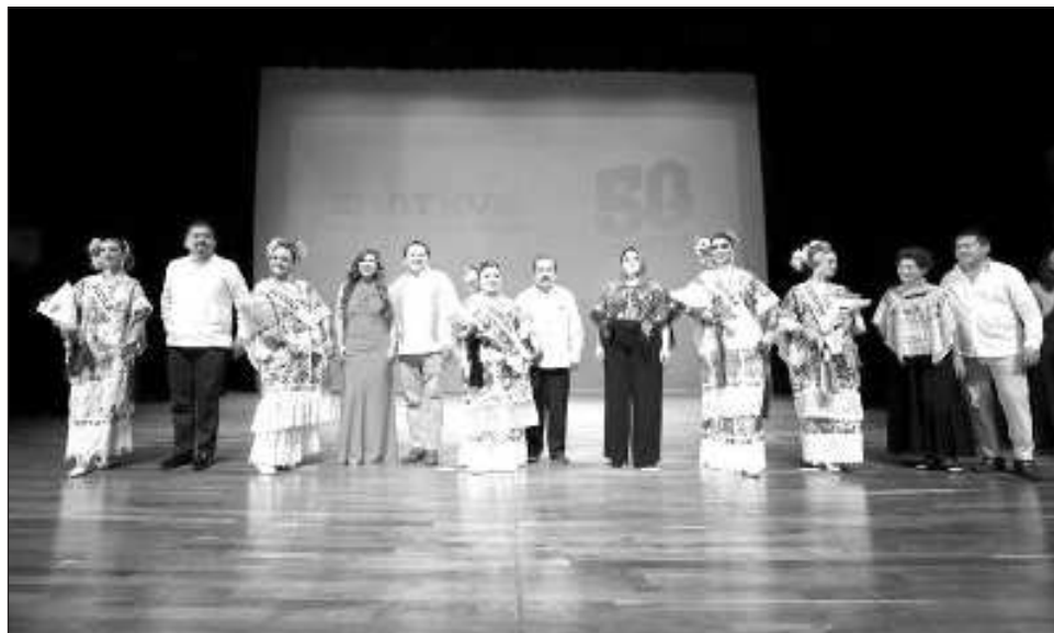
▲ El gobernador Joaquín Díaz Mena asistió acompañado de su esposa e hijo Julián, a la segunda jornada de semifinales regionales del certamen y disfrutó del ameno espectáculo.

Díaz Mena también asistió acompañado de su hijo Julián, a la segunda jornada de semifinales regionales del certamen y disfrutó del ameno espectáculo donde lució la vaquería, típica fiesta yucateca, poco antes de que se conociera a las cinco nuevas semifinalistas de entre las 19 participantes de los municipios de Bokobá, Buctzotz, Calotmul, Cenotillo, Chankom, Cuncunul, Dzemul, Dzidzantún,