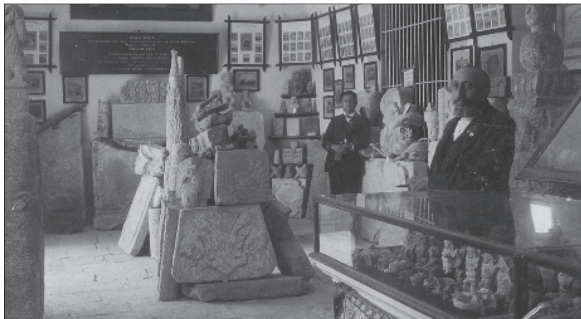
▲ "Desde la creación del museo se comenzó a integrar una importante colección de retratos y de restos óseos identificados que creció notablemente a partir de 1900, cuando su entonces director, Arturo Gamboa Guzmán, se propuso reunir óleos de todos los gobernantes de Yucatán". En la imagen, Museo Yucateco en 1903.

FINALMENTE, BAJO EL mandato del gobernador Manuel Cirerol