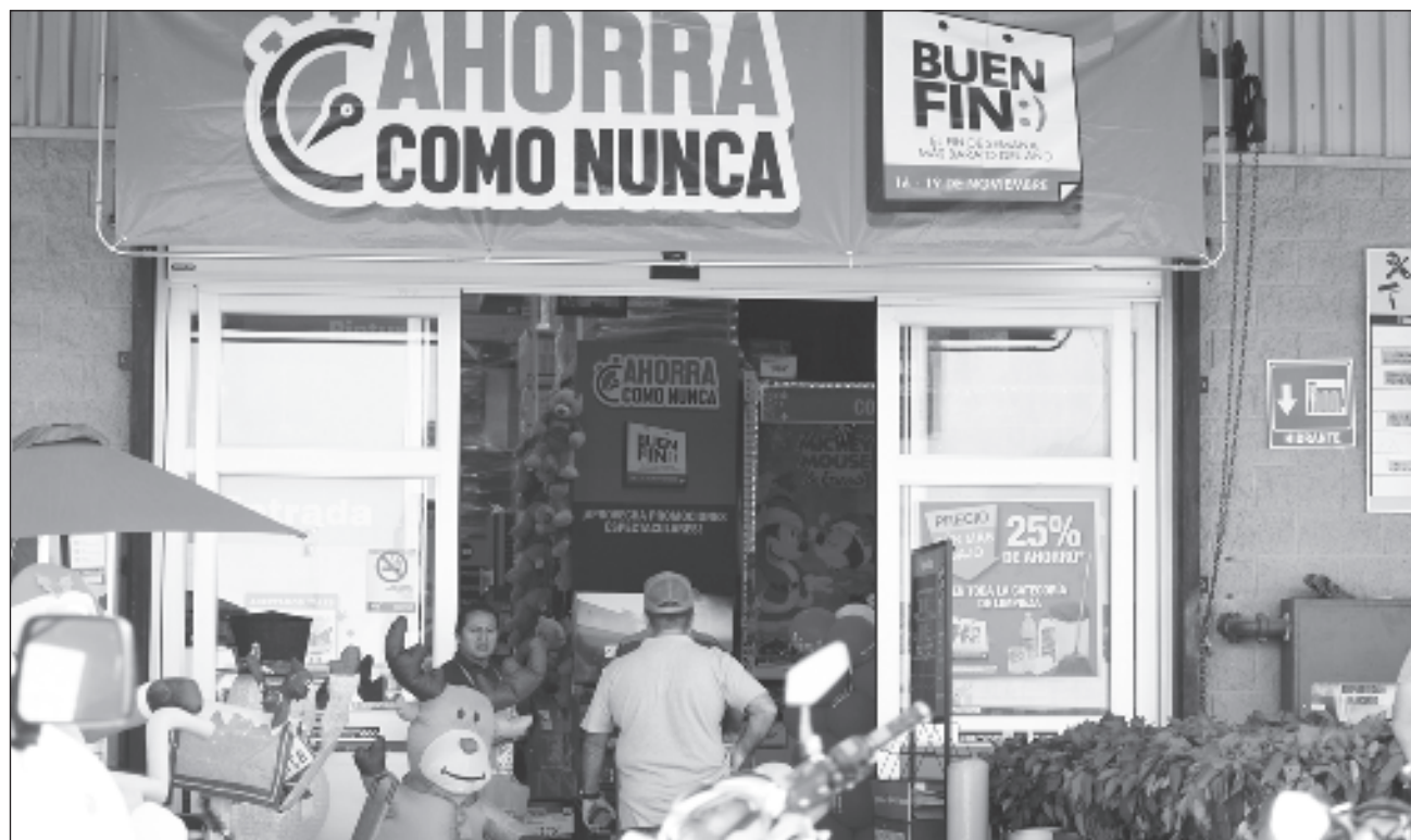
▲ De acuerdo con el presidente de la Canaco-Servytur en Carmen, “será un gran evento, porque estamos convencidos de que la sociedad espera con ansias ese fin de semana y que indudablemente, tendremos el mejor Buen Fin de la historia”.

“Estamos seguros de que será un gran evento, porque estamos convencidos de que la sociedad espera con ansias ese fin de semana y que indudable-