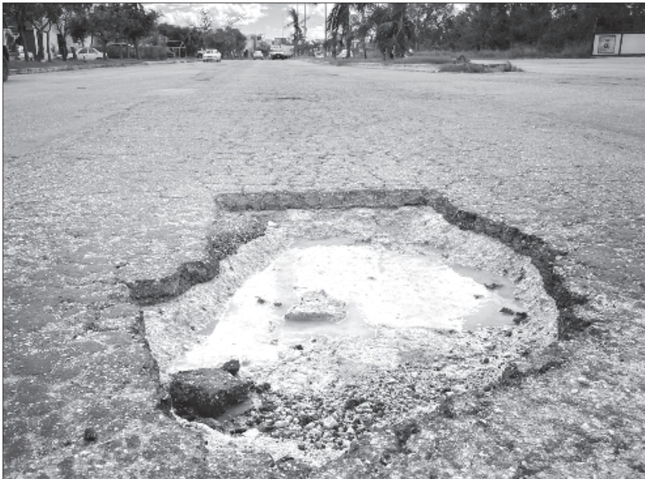
▲ Al lugar llegaron elementos de la Cruz Roja para atender a la herida y confirmar la muerte de otras dos mujeres, así como elementos de la GN, quienes dirigían el tráfico para asegurarse de que todos pasaran con precaución.

Significó que es necesario que se retome este proyecto y se lleven las gestiones necesarias para retomarlo y desarrollarlo para seguridad y tranquilidad de los ciudadanos.