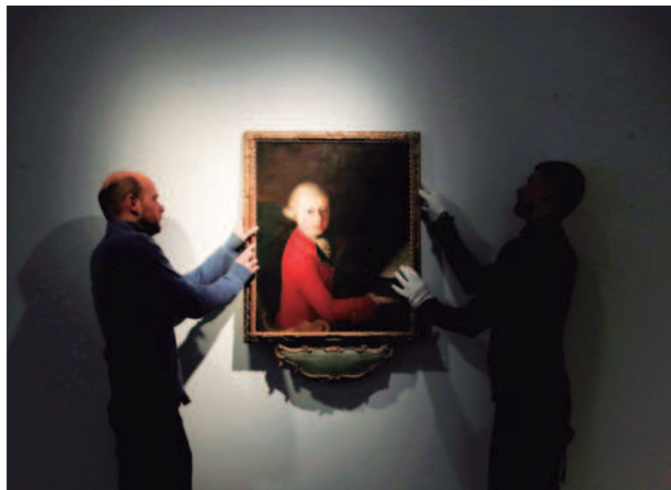
▲ La presentación de la versión orquestal de la Serenata en Do K 648 fue hecha en la sede de Universal Music México, a cargo de la Orquesta de la Gewandhaus de Leipzig.

En su introducción, compartió su asombro y emoción por este descubrimiento, al señalar que esta obra (de 12 minutos) tiene siete movimientos que son miniatura y