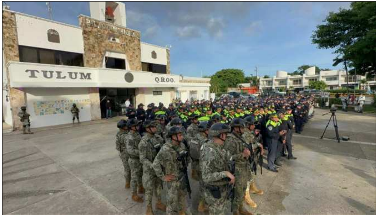
▲ En la Estrategia Integral para la Construcción de la Paz, llamada Blindaje Tulum, participarán policías municipales y estatales, así como elementos de la Sedena, Semar, FGE, FGR y trabajadores del Poder Judicial.

Expuso que se busca consolidar un Modelo Óptimo