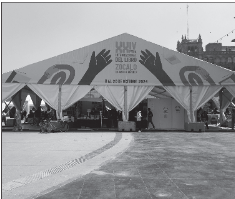
▲ El domingo transcurrió bajo un cielo nublado y un ambiente frío, que millares de visitantes desafiaron para recorrer la plancha del Zócalo en busca de libros.

Se constató que se trata de una celebración de la lectura, refirió Paloma Saiz