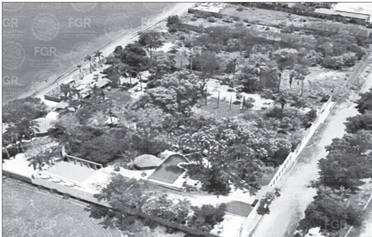
▲ Se mantiene la demanda de que el gobierno de EU ofrezca datos a México sobre el acuerdo y la operación en Sinaloa.

A pregunta expresa sobre el informe de Estados Unidos, Sheinbaum comentó que se mantiene su demanda de que el gobierno estadounidense ofrezca datos a México sobre el acuerdo y la operación en Sinaloa para aprehender a Zambada.