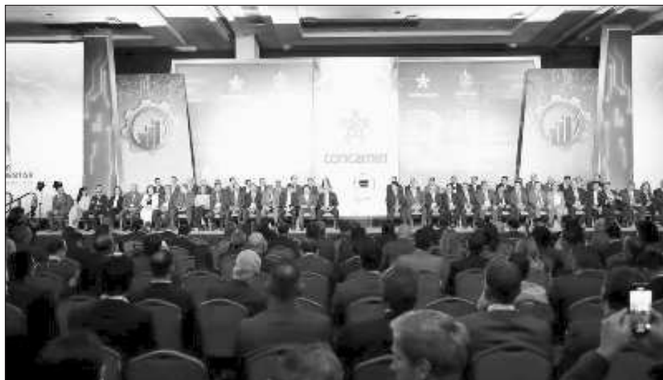
▲ Al inaugurar la Reunión Anual de Industriales, el dirigente reconoció que el sector secundario valora “la visión humanista de la Presidenta de avanzar juntos hacia la prosperidad compartida”.

Al inaugurar la Reunión Anual de Industriales (RAI) 2024, el dirigente reconoció que el sector secundario no sólo valora “la visión huma-