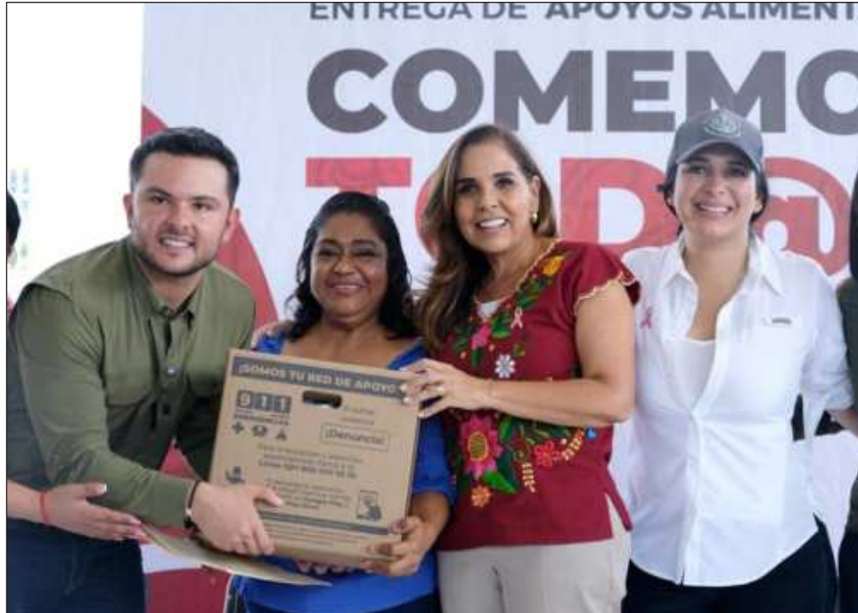
▲ La gobernadora estuvo acompañada de la alcaldesa Estefanía Mercado en la entrega de 430 paquetes del programa alimentario Comemos Tod@s.

Mara Lezama recorrió también los diferentes módulos de la Caravana del Bienestar, donde entregó actas de nacimiento. Fueron más de 80 servicios institucionales