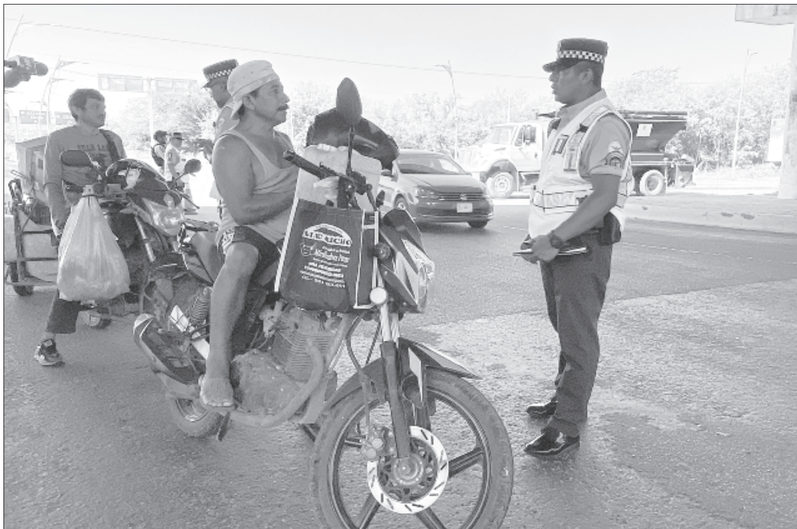
▲ La ENSU, elaborada por el Instituto Nacional de Estadística y Geografía (Inegi), establece que con corte a septiembre de 2024, 58.6 por ciento de la población de 18 años y más, residente en 91 ciudades de interés en el país, consideró que es inseguro vivir en su ciudad.

Ninguna ciudad de la península destacó en este rubro, como en anteriores ocasiones estaban Mérida y Campeche. En cuanto a la percepción de inseguridad en espacios físicos específicos, en septiembre de 2024, 67.3 por ciento de la población manifestó sentirse insegura en los cajeros automáticos localizados en la vía pública; 61.8 en el transporte público; 53 en la carretera, y 51.3 por ciento en las calles que habitualmente usa y en el banco.