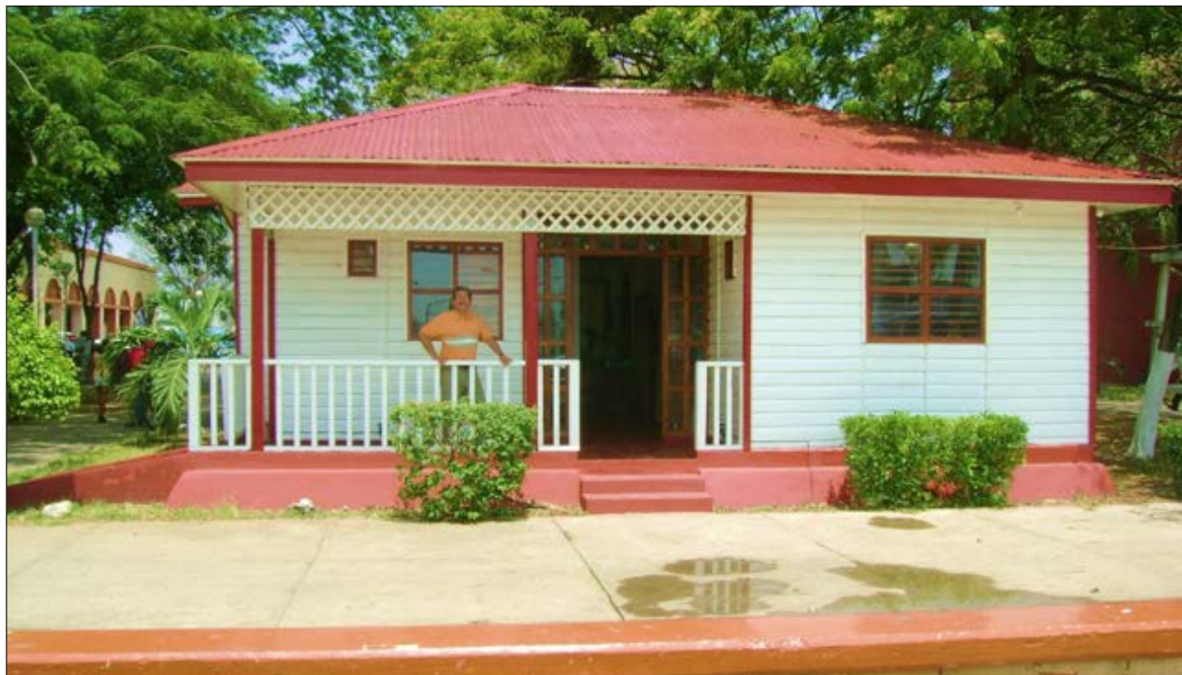
▲ Muchas de estas emblemáticas casas son usadas como restaurantes o renta en Airbnb.

Las casitas de madera de Chetumal, que se remontan a la entonces Payo Obispo con influencia de la arquitectura británica con estilo victoriano que caracterizaba a Belice, son consideradas parte del patrimonio cultural de la ciudad. Sin embargo, ya escasean y muchas de ellas son usadas como restaurantes o renta en Airbnb. El Instituto de la Cultura y las Artes (ICA) proyectó un programa de rescate, pero el presupuesto no permitirá llevarlo a cabo.