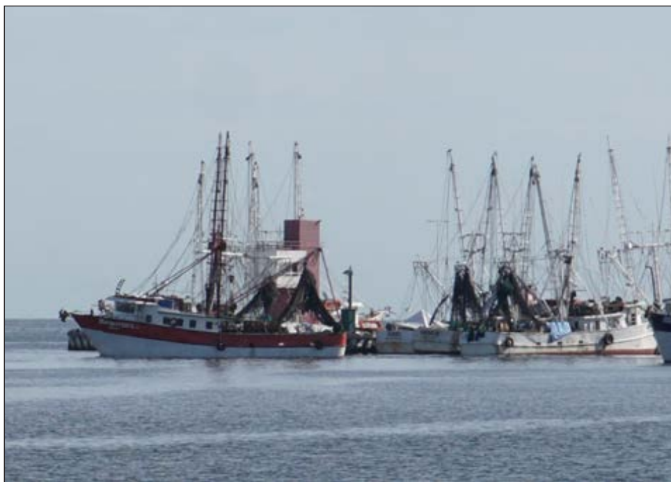
▲ Un precio del diésel más competitivo beneficia a varios sectores económicos, no sólo al pesquero, señaló el presidente del CCEC.