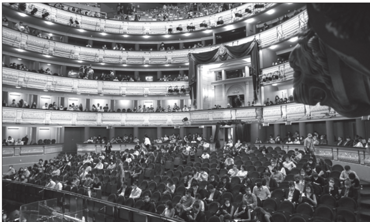
▲ Para la función, se habían vendido 905 entradas; menos del 50% del aforo del Teatro Real, respetando a rajatabla las medidas sanitarias para evitar contagios de COVID-19.

Se apagaron las luces, entró el director musical, el italiano Nicola Luisotti, cuando una veintena de personas, situada en el anfiteatro, empezó a gritar sin tregua suspensión y seguridad. La protesta, que duró más de una hora, provocó la primera cancelación de una función en la historia del Teatro Real, que además coincidía con el recuento del tenor mexicano Ramón Vargas con el público madrileño, en el papel de Riccardo, en Un ballo in maschera , de Giuseppe Verdi.