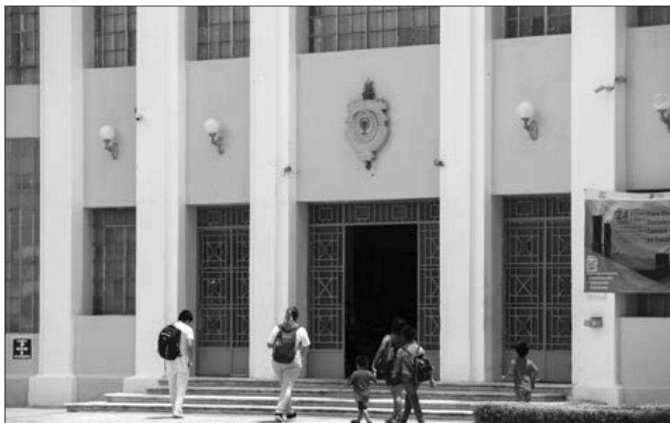
▲ En redes sociales, estudiantes de la UADY manifestaron que a la casa de estudios no le interesa su salud y los considera mano de obra barata.

Luego de que la Facultad de Medicina emitiera un comunicado indicando que "se siente profundamente conmovida por el fallecimiento de la médica pasante K.J.G.K.", usuarios de redes sociales reclamaron a la escuela su falta de