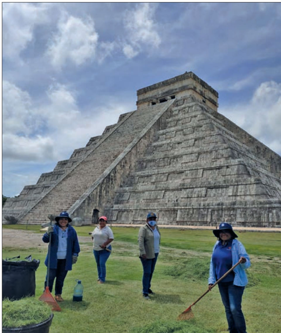
Los agentes de Cancún y la Riviera Maya generan el 70 por ciento de los turistas que recibe Chichén Itzá.

“Afortunadamente en medio de la crisis económica generada por la pandemia Cancún está saliendo bien librado porque es un destino exitoso, muy demandado por turistas y rápidamente se está recuperando”, destacó.