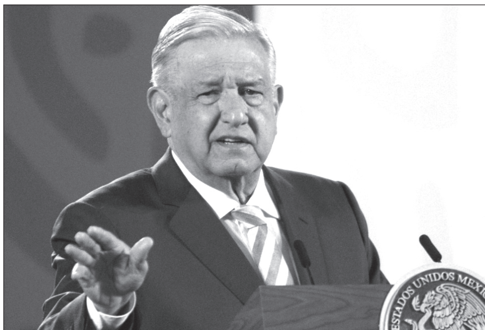
▲ El Presidente considera importante que se realice una encuesta para que se tengan elementos sobre lo que opina la gente.

Al ser cuestionado sobre presunta inequidad en las restricciones de cruces en la frontera entre quienes buscan internarse a Estados Unidos y quienes cruzan a México, dijo que la cancillería informará sobre esta situación, pero destacó que la relación México-Estados Unidos es muy buena e incluso.