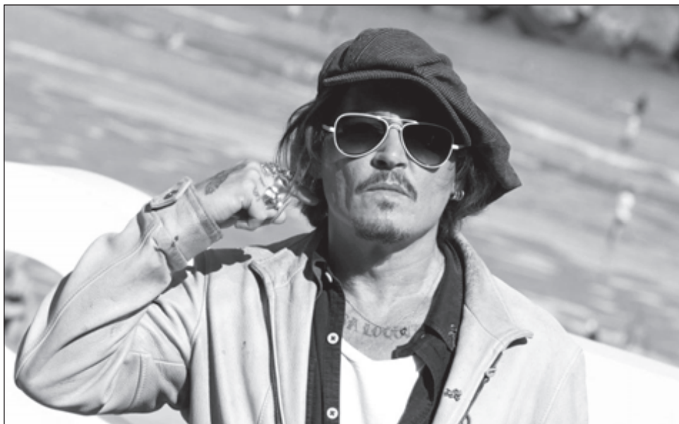
▲ Johnny Depp es una de las caras más celebres presentes en esta edición del Festival de San Sebastián.

¿Tenemos los humanos un déficit de 0.5 por ciento de alcohol en la sangre?, pregunta formulada por un sicólogo noruego, es el núcleo de esta pro-