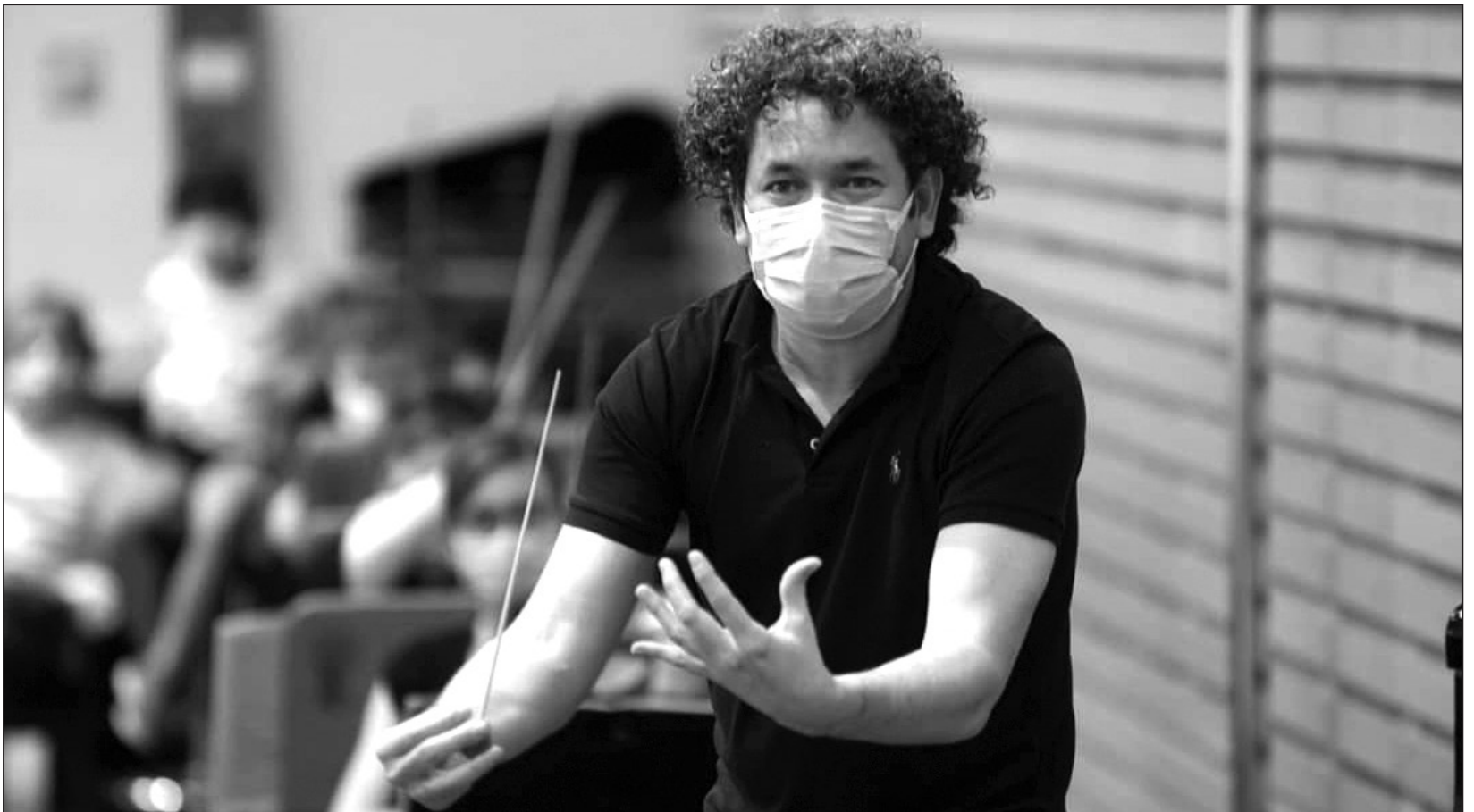
▲ El Teatro Real de Madrid celebra el 250 aniversario del nacimiento de Beethoven interpretando algunas de sus más reconocidas obras, como la Novena Sinfonía .