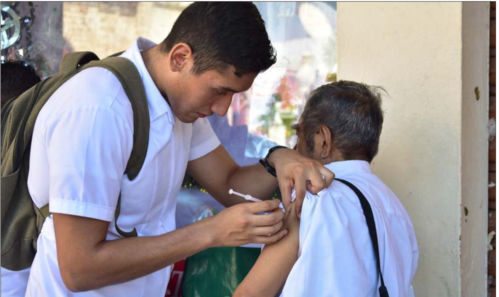
▲ Hasta ahora, las autoridades de Salud sólo han aplicado 22 mil 698 dosis de las 43 mil dosis meta.