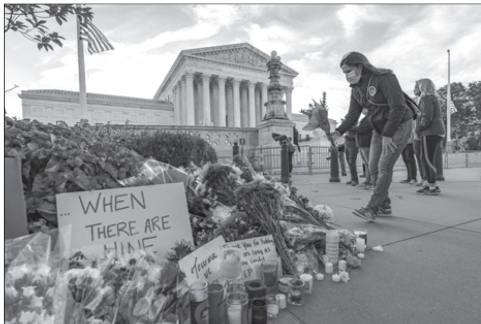
▲ Varias personas dejaron arreglos florales frente a la Corte Suprema en Washington, en honor a la fallecida juez Ruth Bader Ginsburg.

El mandatario agregó que quería esperar a que terminaran los servicios fúnebres en honor a Ginsburg, que falleció el viernes a los