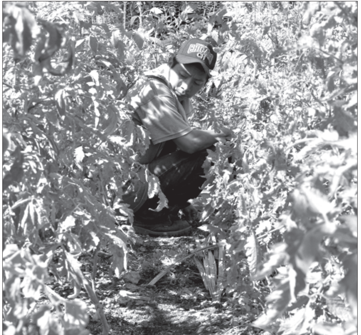
▲ Siglos de experiencia respaldan los conocimientos de la agricultura tradicional, muchos de ellos vigentes y reconocidos, otros en proceso de descripción científica.

Tanto en la AT como en la convencional, agronegocios, los productores se enfrentan a docenas de plagas y enfermedades. En el primer caso no se usan productos químicos para su control, en el segundo caso sí, y en forma abundante. No obstante, en el primer caso siempre hay produc-