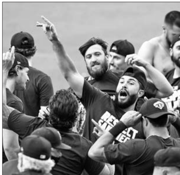
▲ Los Padres están contentos por haber terminado con su sequía de playoffs, pero le apuntan a cosas mucho más grandes.

Luego de nueve temporadas perdedoras de manera consecutiva, los Padres reforzaron su roster durante el invierno. Arrancaron el año pensando que habían armado una escuadra capaz de tocar a la puerta de los playoffs. Comenzaron a jugar, y no sólo tocaron dicha puerta. Más bien la echaron abajo. Los frailes tienen el segundo mejor récord en