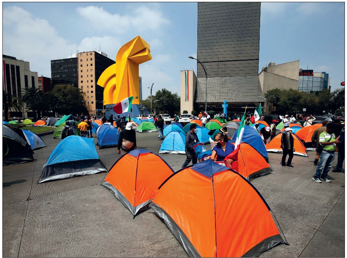
▲ Los frenados constituyen un complemento de faena en calle, de la movilización en desplegado que han organizado antiobradoristas como Enrique Krauze y Héctor Aguilar Camín.

PLANTEADO LO ANTERIOR , ha de decirse también que carecen el grupo llamado Frena (Frente Nacional Anti-AMLO), y en espe-