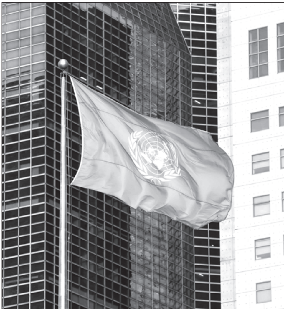
▲ Este año, la Asamblea General anual de la ONU se celebrará de manera virtual a raíz de la pandemia de COVID-19.

A partir de este martes, durante una semana, los mismos líderes pronunciarán otro discurso en el marco de la 75ª Asamblea General anual de la ONU, que este año se celebra de manera virtual a raíz de la pandemia. Los discursos en la asamblea no deben exceder los 15 minutos.