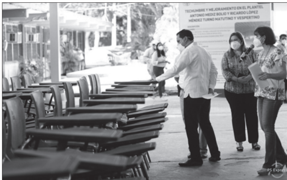
▲ Las piezas entregadas permitirán que alumnos y maestros cuenten con muebles más seguros y cómodos, cuando las condiciones de la pandemia del COVID-19 lo permitan y vuelvan a las clases presenciales.

También constató los trabajos de mejoramiento del sistema pluvial que permitirá que circule el agua de las lluvias para