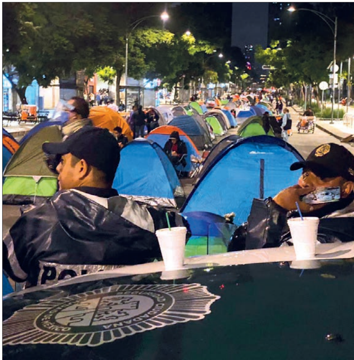
▲ Grupos con tiendas de campaña prometen aguantar hasta llegar a la Plaza de la Constitución y allí frente al Palacio Nacional -a la casa del Presidente-, para seguir exigiendo su renuncia.

El poeta Javier Sicilia le manda una quinta carta abierta, esta es más dura y directa; en el escrito, el activista le indica a AMLO que no sólo se ha dedicado a dividir, crear odio y desprecio para obtener popularidad entre sus seguidores. También, López Obrador ha desestimado los gritos de ayuda de las víctimas con tal de seguir en una