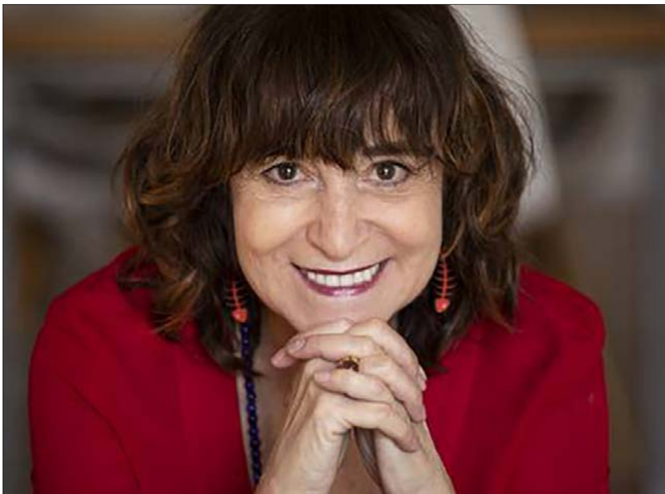
▲ Volver a la literatura y a la creación me hizo aterrizar más o menos en este mundo y salir adelante durante la pandemia.

Así, La buena suerte es una novela de esperanza en nuestra capacidad de aprendizaje, de reinención, de esperanza en perder el miedo a vivir. Vivir da mucho miedo, nuestros propios sentimientos nos hacen muy vulnerables. Hay personas que por miedo, como Pablo (el personaje principal), se amurallan; me parece que eso es elegir la muerte en lugar de la vida.