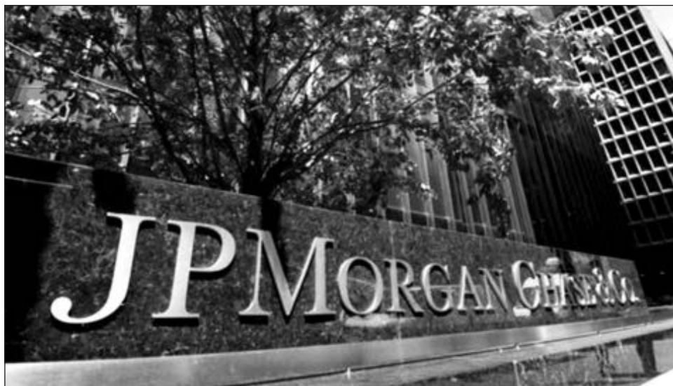
▲ Entre las principales entidades financieras involucradas en actividades de lavado se encuentran JPMorgan, HSBC, Standard Chartered Bank, Deutsche Bank y Bank of New York Mellon.

En el caso mexicano se hicieron 57 transacciones por un monto enviado de 5 millones 75 mil 970 dólares, y recibido 338 mil 730 dólares. Se ven involucrados entidades financieras como BBVA, Banorte, Citibanamex, Banco del Bajío, Actinver, Santander, Banco Base y CIBanco.