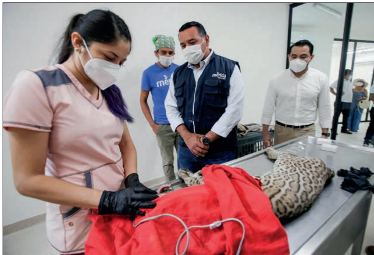
▲ El hospital veterinario recibirá también a animales que estén bajo la administración de autoridades federales y estatales, como la Profepa, la Semarnat y la SSP.

Debido a esto, se construyó un área de 461.70