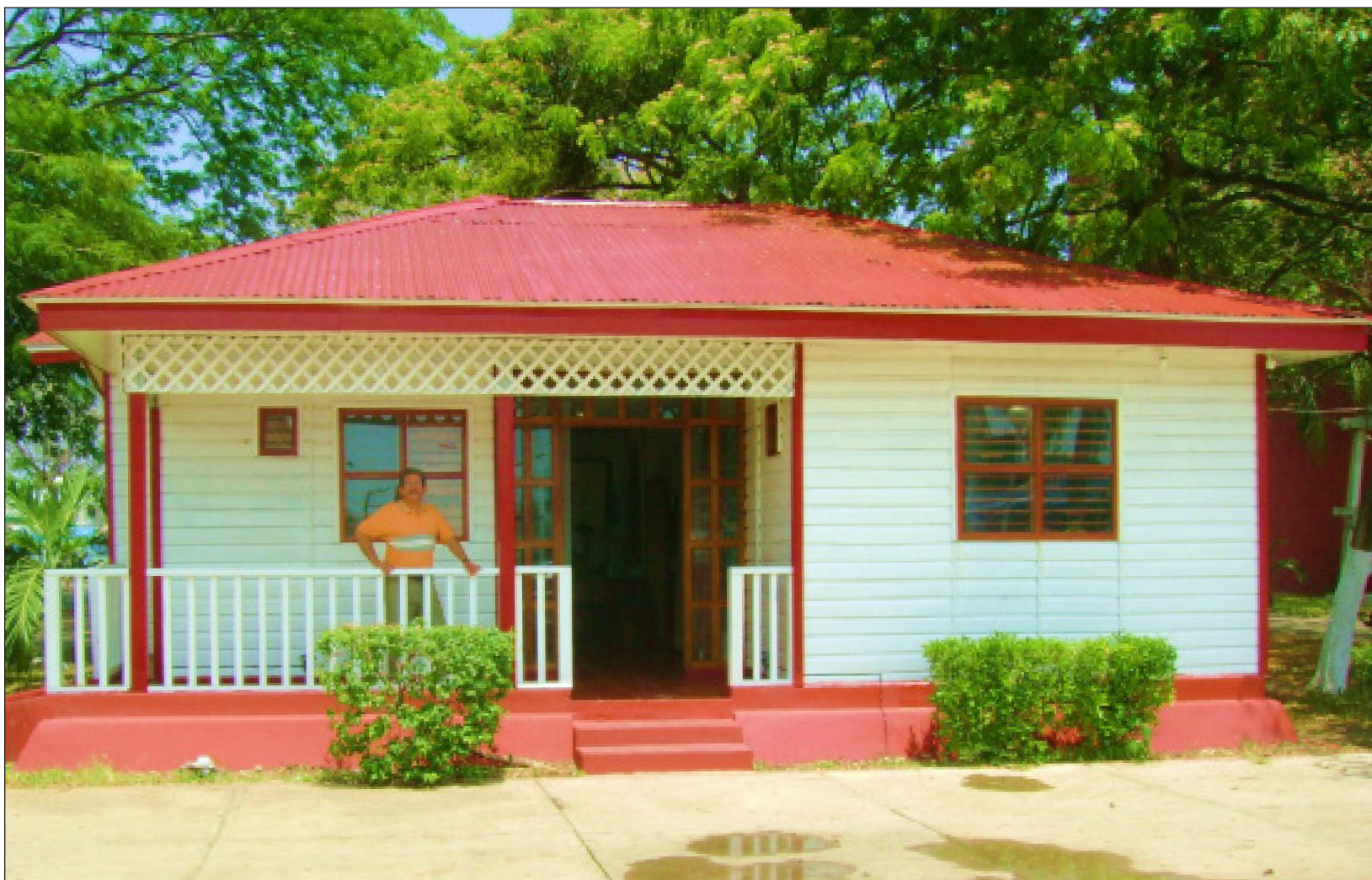
Las casas están influidas por el imperio británico y del Chattel House.

CAMPECHE · YUCATÁN · QUINTANA ROO · AÑO 6 · NÚMERO 1321 · www.lajornadamaya.mx