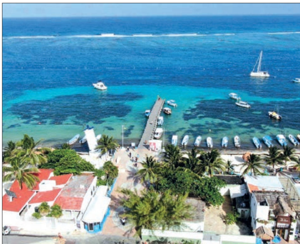
La AMAV en Quintana Roo confía en poder comercializar sus productos sin movilizarse, y se mostró optimista de que los costos del Tianguis Turístico sean sumamente menores a comparación de un evento presencial.

En cuanto a la recuperación de Cancún y Quintana Roo, mencionó: “Estamos al