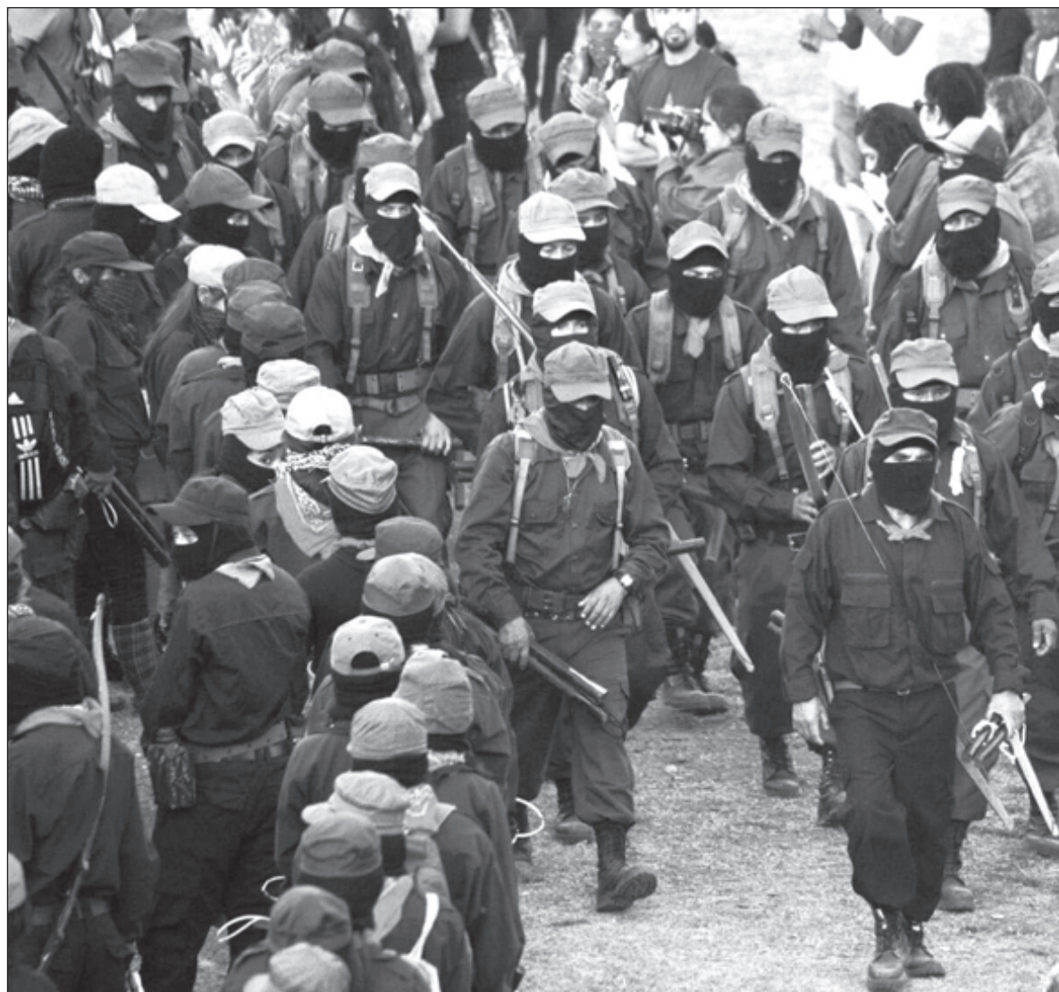
▲ En Chiapas, el paramilitarismo se recrudeció después de la aparición pública del movimiento zapatista.