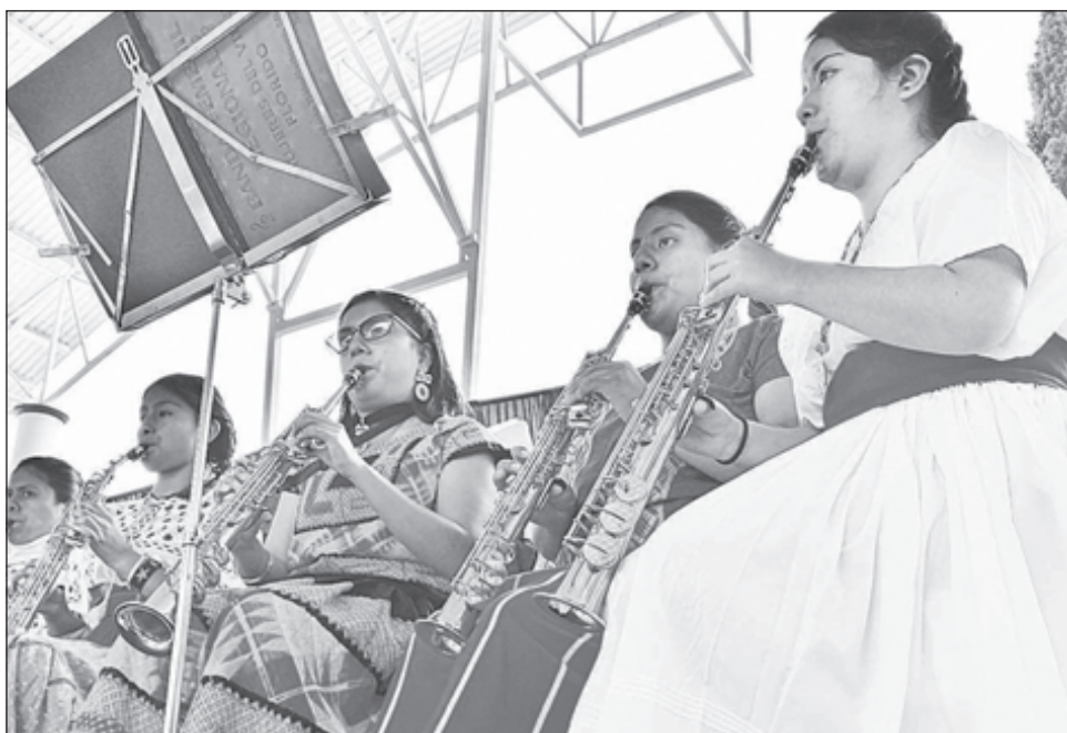
▲ La banda Mujeres del Viento Florido está integrada por niñas, jóvenes y adultas originarias de comunidades zapotecas, mixes y mixtecas.

A mis padres les preguntaban que cómo era posible que me dieran permiso de ir a los conciertos donde acudían puros hombres, eso no lo veían bien. Sin embargo, para mí no había diferencia entre ser mujer u hombre y tocar en una agrupación. Para mí eso era normal y así continué hasta formar la banda que