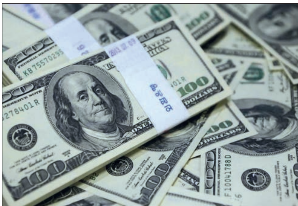
▲ El llamado lavado de dinero no es otra cosa que la puesta en circulación legal de utilidades financieras resultado de actividades ilegales.

La mayor filtración de datos financieros registrada en la historia del Departamento del Tesoro de Estados Unidos no permite, además, alegar inocencia o desconocimiento: en algunos casos, las instituciones bancarias siguieron gestionando con alegría los fondos ilegales, aun después de que las autoridades estadounidenses de control financiero les advirtieran que si seguían en ese plan iban a terminar en una corte penal.