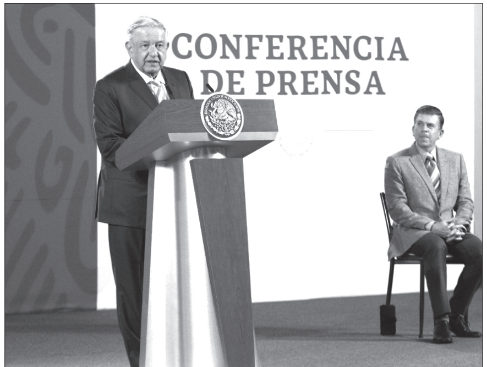
▲ El presidente, Andrés Manuel López Obrador, señaló que algunos "intelectuales orgánicos" acomodaban a sus cercanos en universidades y centros de investigación.

Señaló que ellos no solamente tenían sus empresas editoriales, sino que tenían mucha influencia en el gobierno y acomodaban a sus cercanos en universidades, en centros de investigación, o sea, "eran padrinos en el mundo intelectual".