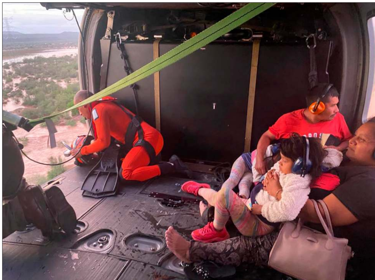
▲ A bordo de un helicóptero Black Hawk, nadadores de rescate de la ENSAR salvaguardaron a una familia de seis integrantes que se encontraba arriba de un vehículo en inmediaciones del arroyo Los Cuates, del Ejido Santa María.

Las siete personas rescatadas fueron trasladadas a la Base Aeronaval de Guaymas para recibir atención médica.