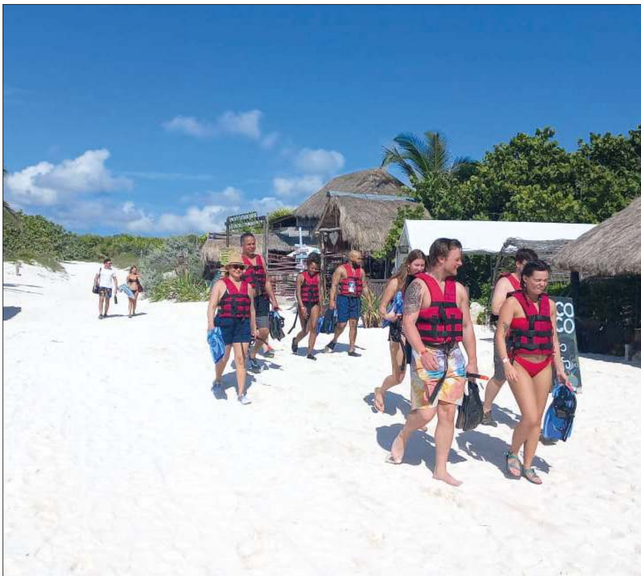
▲ Pese a la gran afluencia de turistas nacionales, la contratación de los servicios náuticos ha sido baja.

Asimismo, comentó que quedará un adeudo con proveedores que en estos momentos asciende a cerca de 650 millones de pesos, que podría reducirse a cerca de 450 antes de que concluya la administración y lo que resta lo podrá ir pagando el gobierno siguiente.