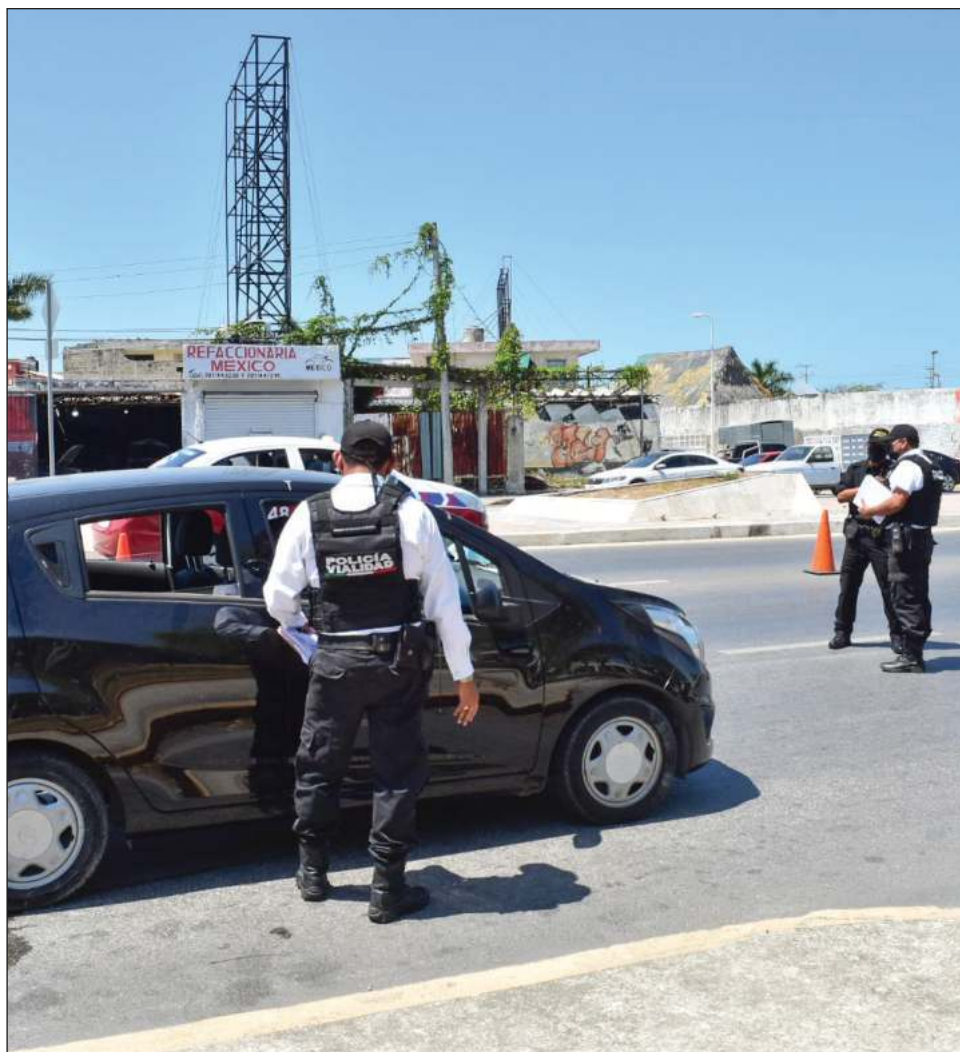
▲ Aunque los agentes cometieron una falta grave, el denunciante también violó la Ley de Vialidad del estado, por lo que se le impuso la multa correspondiente.

Finalmente destacaron que el reportante violó la Ley de Vialidad, por tanto también le pusieron la multa pertinente para que acuda a actualizar su permiso o en su caso porte su licencia para evitar retenciones futuras.