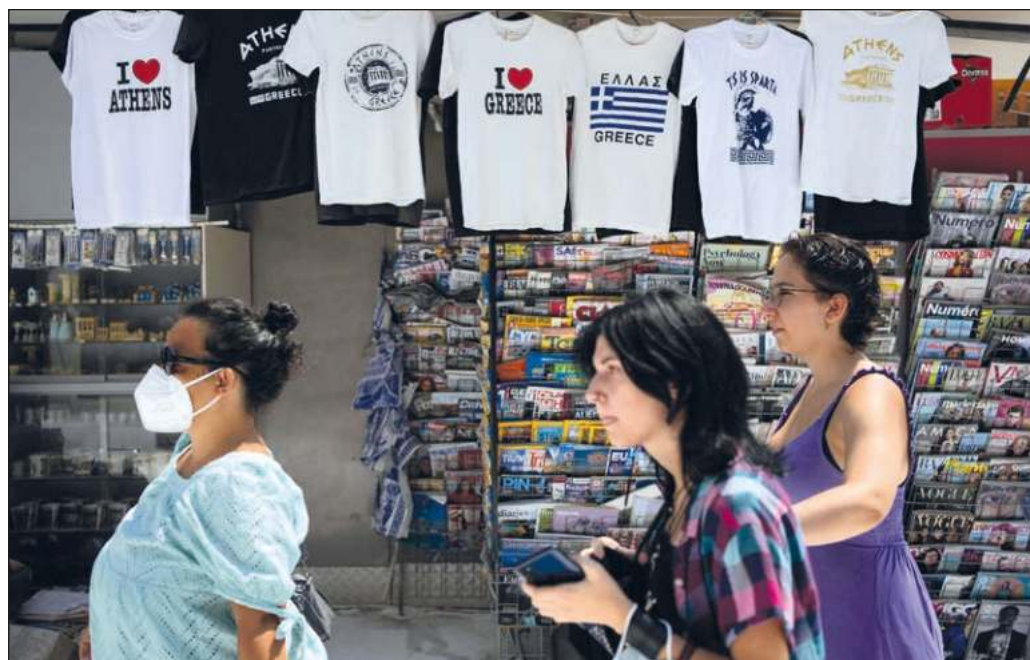
▲ Desde 2010, Grecia fue sometida a un sistema que no puede calificarse sino de colonial.

Por último, no debe olvidarse que en 2015 el pueblo griego votó en referéndum por rechazar las condiciones de la troika y encarar las consecuencias de un default (cesación de pagos), pero la ex canciller Merkel y la Comisión presionaron a las autoridades helenas hasta obligarlas a aceptar un plan ruinoso para el país. En este sentido, la historia de esta nación balcánica debe servir de ejemplo y denuncia de la nula importancia que la democracia tiene para los líderes occidentales cuando se trata de decidir entre el respeto a la voluntad popular o la defensa de los grandes capitales.