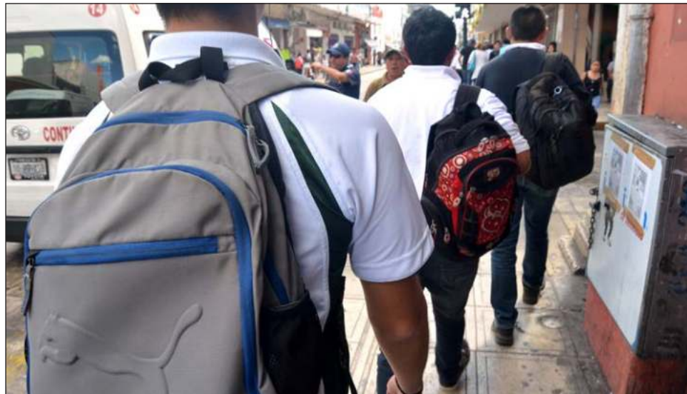
▲ El programa ¡Cuenta conmigo!, de la Segey, cumple 15 años de ofrecer apoyo para estudiantes y sus familias, al igual que capacitación en escuelas secundarias de Yucatán.

"Mi respeto y reconocimiento a este equipo de profesionales que con dedicación y vocación trabajan cada día en los planteles