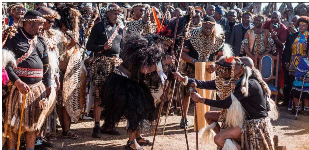
▲ Misuzulu kaZweilithini se sometió al ritual conocido como ukungena esibayeni para marcar el inicio de su reinado.

A la muerte del rey el año pasado, la madre de Misuzulu kaZweilithini fungió como regente un mes antes de su muerte pero en su testamento nombró a su hijo