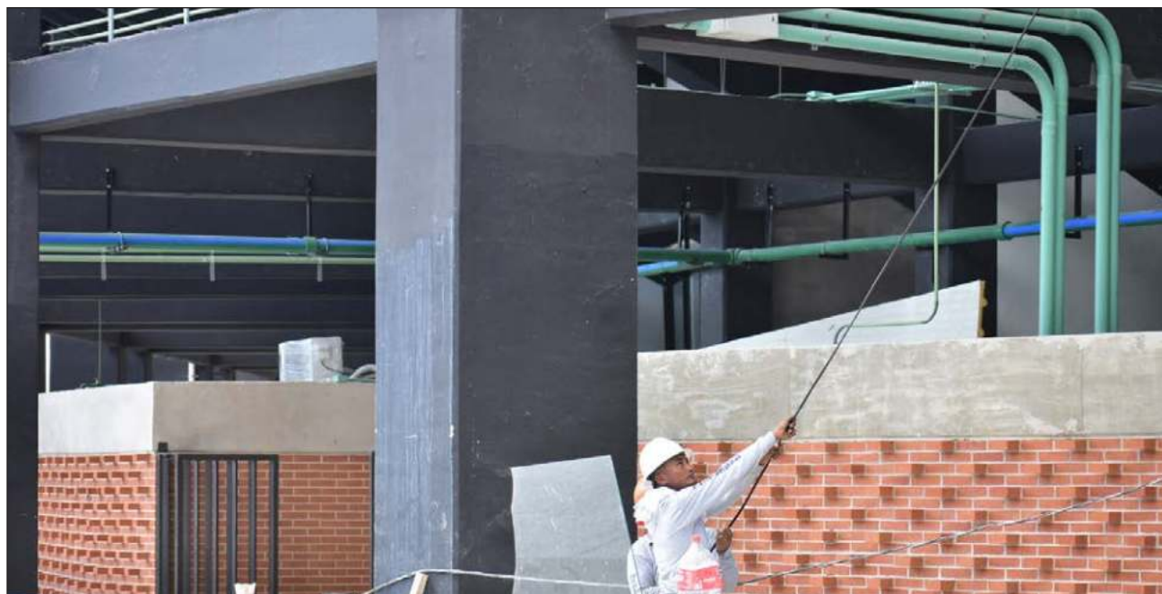
▲ Empresarios consideran que en temporadas como ésta, apostar por invertir aún más es la respuesta para lo que venga en el futuro; “eso nos causa un poco de optimismo”, señaló la CMIC, que espera que el sector siga fluyendo de manera armónica.

Apuntó que inversionistas miran en temporadas como ésta que apostar por invertir aún más es la respuesta para lo que venga en el futuro; “eso nos causa un poco de optimismo”, con lo cual espera que las inver-