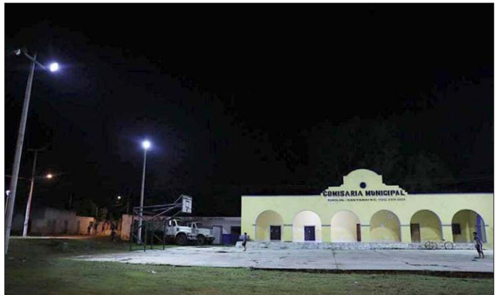
▲ El Instituto para el Desarrollo y Certificación de la Infraestructura Física, Educativa y Eléctrica de Yucatán se encargó de renovar el alumbrado e instalar 50 luminarias nuevas.

Además de esta acción, vecinos también destacaron diversos beneficios como la instalación de una cámara de videovigilancia en la entrada del pueblo para velar por su seguridad, así como la entrega de distintos apoyos como fertilizante y el programa Peso a Peso , que está impulsando fuertemente a los trabajadores del campo.