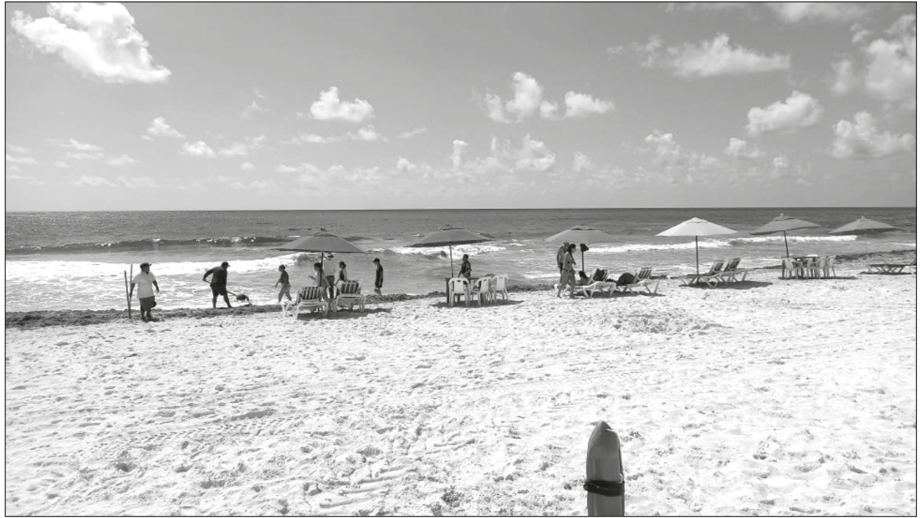
▲ En las próximas semanas se espera una presencia de mercados principalmente estadounidense y sudamericano; los canadienses llegarán hasta noviembre, reveló la Asociación de Hoteles de Cancún, Puerto Morelos e Isla Mujeres.

Incluso dio a conocer que se tienen ya proyectos importantes de promoción para seguir manteniendo el interés en el destino, y para el mes de octubre se realizará -como cada año- el Travel Mart Cancún, que reúne a un importante número de tour operadores y agentes mayoristas.