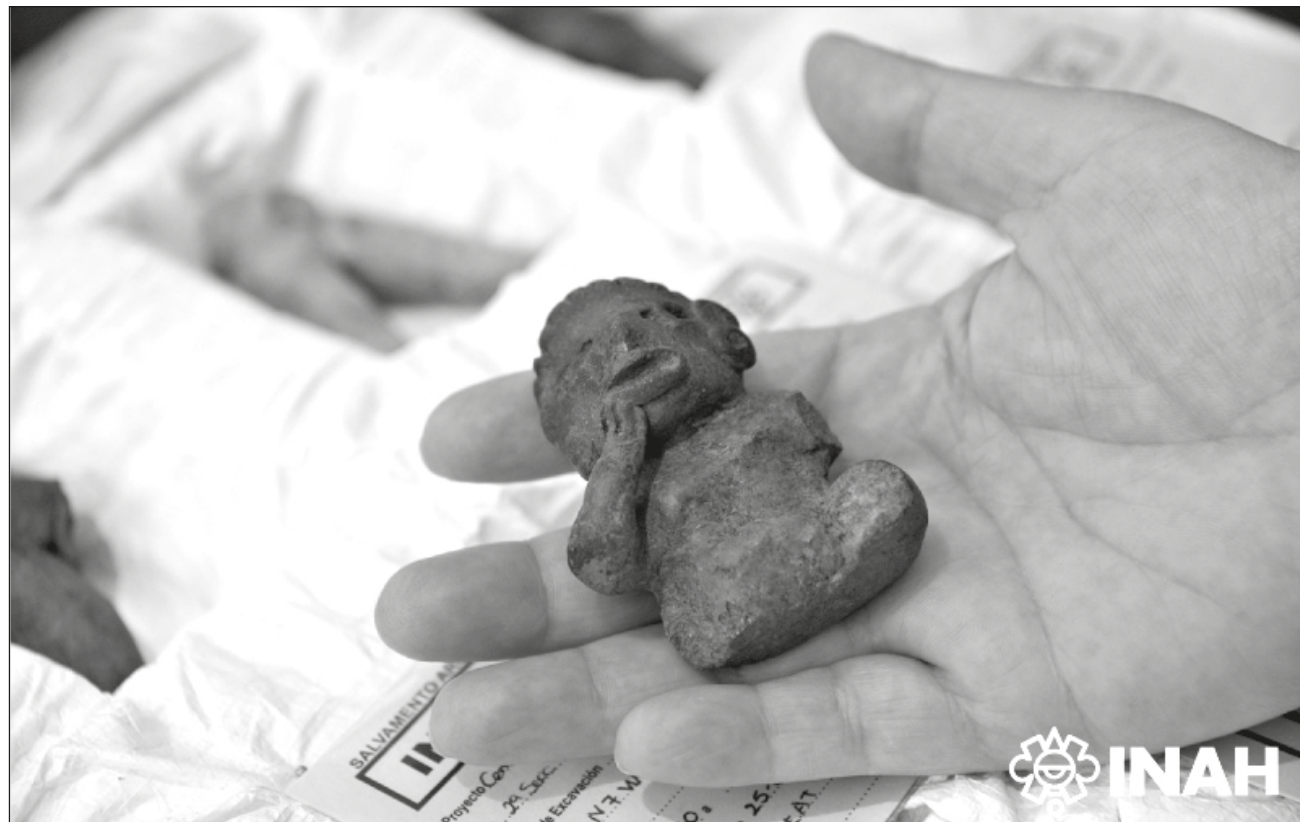
▲ La concentración de materiales del Preclásico Medio estaba conformada por pedazos de platos y decenas de rostros y figurillas zoomorfas y antropomorfas, de las que sobresalen representaciones femeninas de "piernas regordetas" y de enanos.

No obstante, la reciente detección de esta concentración de materiales del periodo Preclásico Medio (1200-600