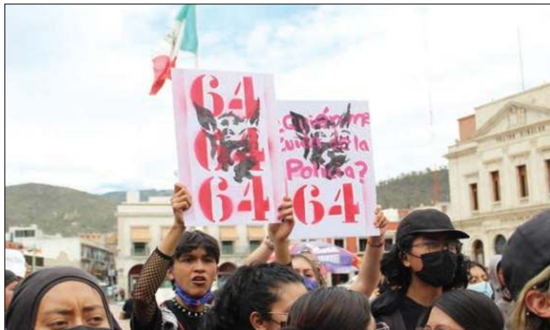
▲ "Hidalgo sigue siendo cuna de políticos llenos de nepotismo, haciendo parecer que en este lugar todo está bien".