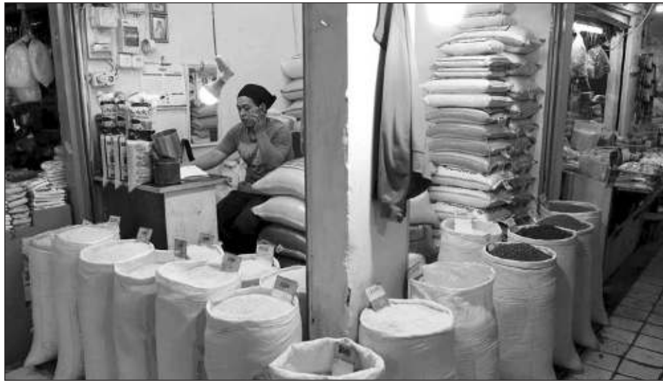
▲ Gamisha, quien vive en Uganda, ha notado un fenómeno llamado "reduflación": es posible que un precio no cambie, pero una dona que solía pesar 45 gramos ahora pesa 35.

Los gobiernos, las empresas y las familias en todo el mundo están sintiendo los efectos económicos de la guerra apenas dos años después de que la pandemia del coronavirus devastara el comercio mundial. La inflación y los costos de la energía se han disparado, lo que