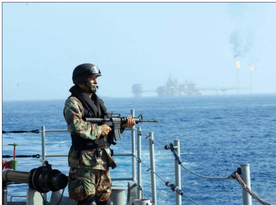
▲ La empresa Dryad Global califica a la Sonda de Campeche y zonas del Golfo de México como "Áreas de Riesgo para la Actividad Offshore", en su informe.

De acuerdo con la publicación en su página de Internet, Dryad Global califica a la Sonda de Campeche y Golfo de México, de manera puntual la bahía de Campeche, las costas de Ciudad del Car-