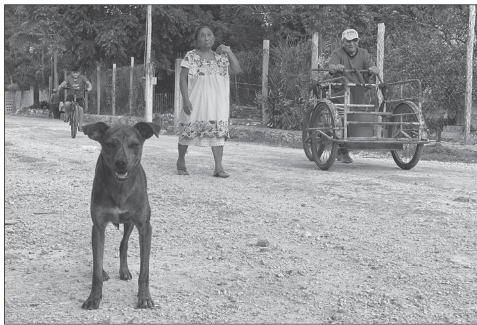
▲ En Campeche han prevalecido los ajustes al sistema de justicia para proteger los derechos indígenas, pero aun así una familia pasó injustamente ocho años en el Centro de Reinserción Social de San Francisco Kobén.

Mencionaron que el joven cometió homicidio en defensa propia, pero durante las diligencias de