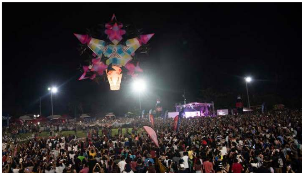
▲ Figuras con distintos personajes y temáticas se elevaron por el cielo durante el inicio del segundo Festival del Globo Maya en el que participaron artesanos de México y Colombia.

Asimismo, pudieron recorrer el pabellón de artesanías donde se encontraba el trabajo de exponentes de Hochtún, Homún, Xocchel, Timucuy, Tahmek, Seyé, Huhí, Hocabá, y Sotuta, con hamacas, textiles bordados, tallados de madera, productos de miel, entre otros. También disfrutaron la actuación del Ballet Folklórico Juvenil con las coreografías de Fandango Veracruzano y Campeche de mis amores .