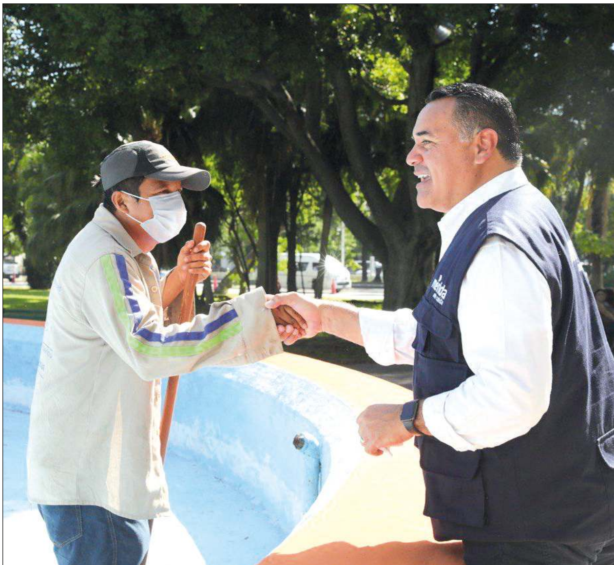
▲ De acuerdo con lo previsto por la Dirección de Servicios Públicos Municipales, la rehabilitación de fuentes y glorietas avanza a buen ritmo y esperan entregarlas en los primeros 15 días de septiembre.

En otro tema, el director de Servicios Públicos Municipales adelantó que, con motivo de las fiestas patrias, personal de la dirección a su cargo ya se encuentra trabajando en la colocación de los casi 600 adornos patrios en calles, avenidas, glorietas y parques principales de Mérida así como del Centro Histórico.