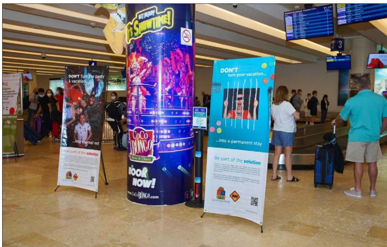
▲ Con el plan piloto del gobierno federal, los turistas internacionales que lleguen al Aeropuerto Internacional de Cancún podrán pasar el filtro de Migración en 10 minutos para finalmente dirigirse al área aduanal.

Lo que sigue ahora -dijo- es esperar que para los meses de septiembre y octubre, que suelen ser los de menor presencia turística, registren mejores números que en 2019.