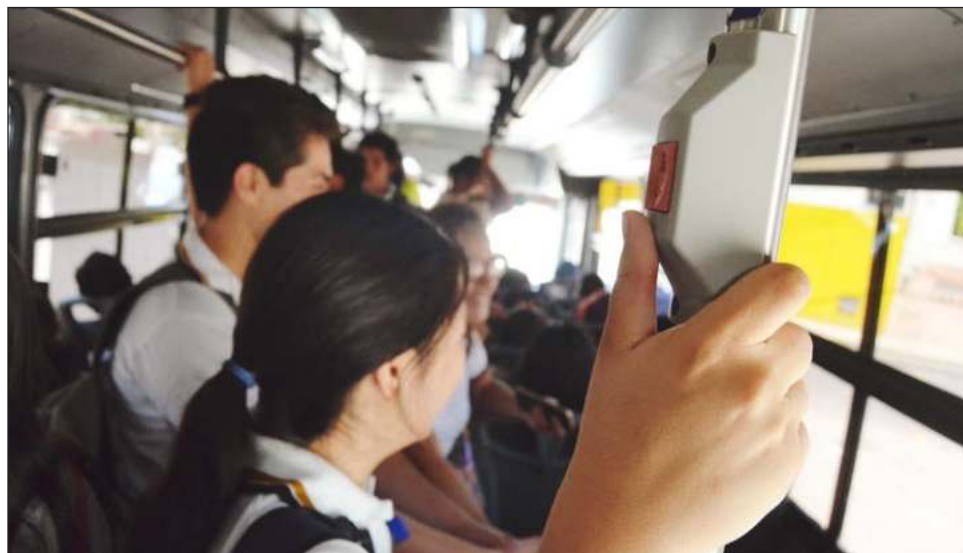
▲ Los estudiantes proponen que cada escuela gestione ante el SITUR la reactivación colectiva de las credenciales de quienes se inscriban a cada curso escolar.

“Este trámite implica no sólo el pago de una constancia que acredite que nos hemos inscrito o reinscrito a un nuevo semestre, sino también tener que trasladarnos hasta las oficinas de SITUR, lo