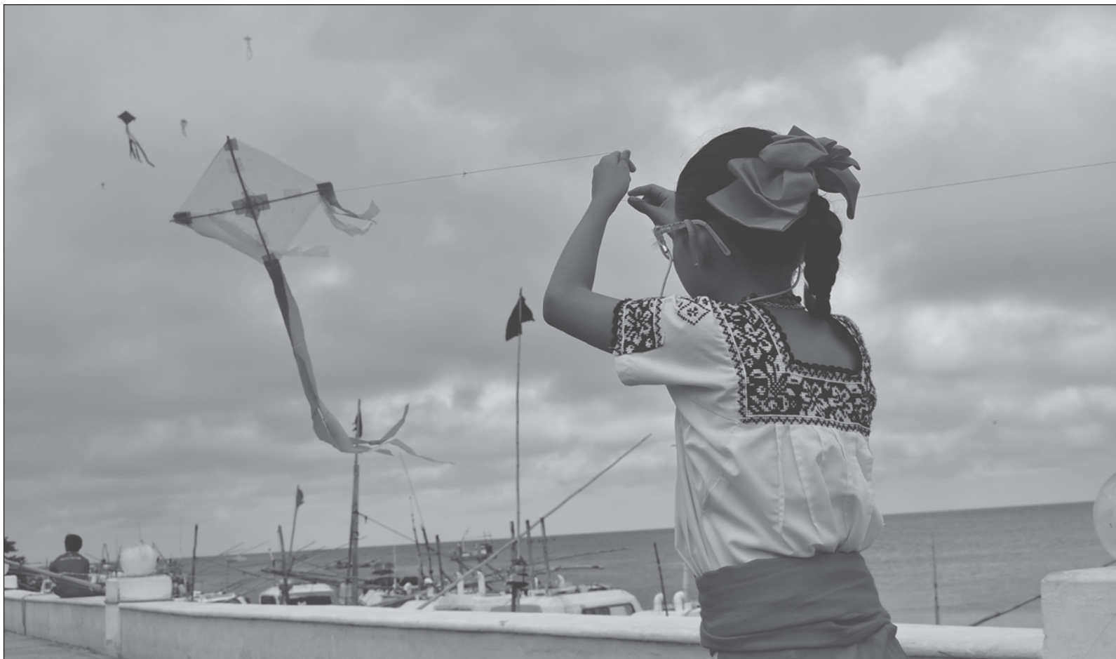
▲ “Nuestros jóvenes dependen emocionalmente de la cantidad de likes, y su ausencia les provoca tomar decisiones dañinas”.