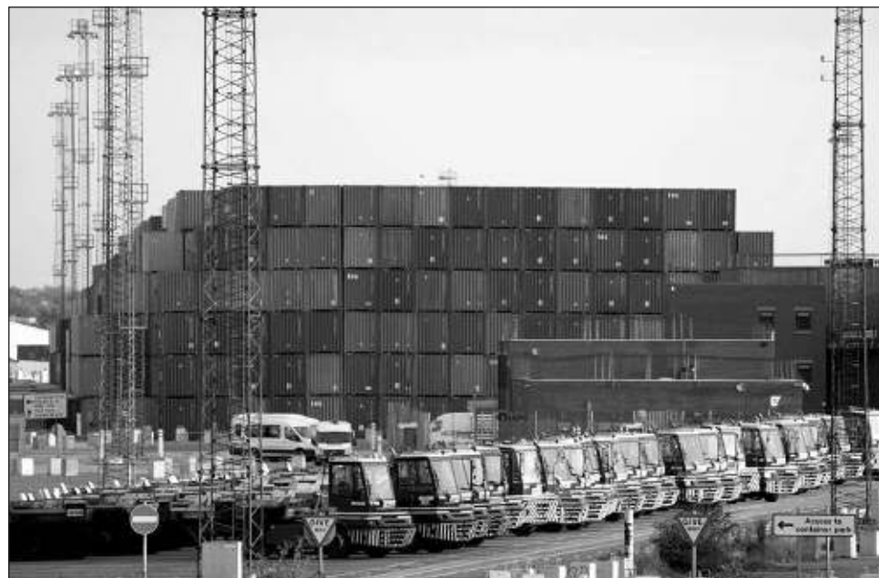
▲ El puerto de Felixstowe, el mayor de Gran Bretaña, maneja 4 millones de contenedores de unos 2 mil buques al año, casi la mitad de toda la carga comercial que entra al país.