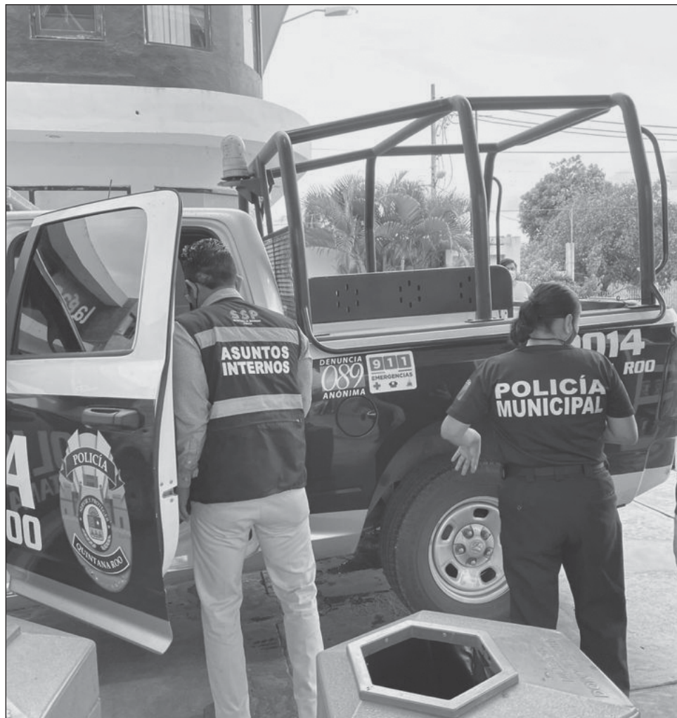
▲ La Dirección de Asuntos Internos de la SSP aplica justicia pronta y expedita a las quejas, las cuales son canalizadas al Consejo de Honor y Justicia.

Durante el periodo de enero a julio del 2022 se han realizado 173 supervisiones, de las cuales 23 han sido intervenciones en la