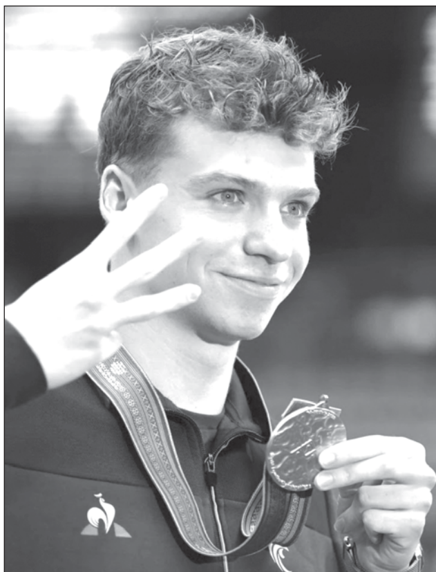
▲ El francés Léon Marchand se perfila para ser uno de los protagonistas de la natación en los Juegos de París.

—Summer McIntosh, Canadá. La nadadora de 17 años aspira al oro en múltiples pruebas, incluyendo los 800 libres, carrera dominada por Ledecky durante más de una década.