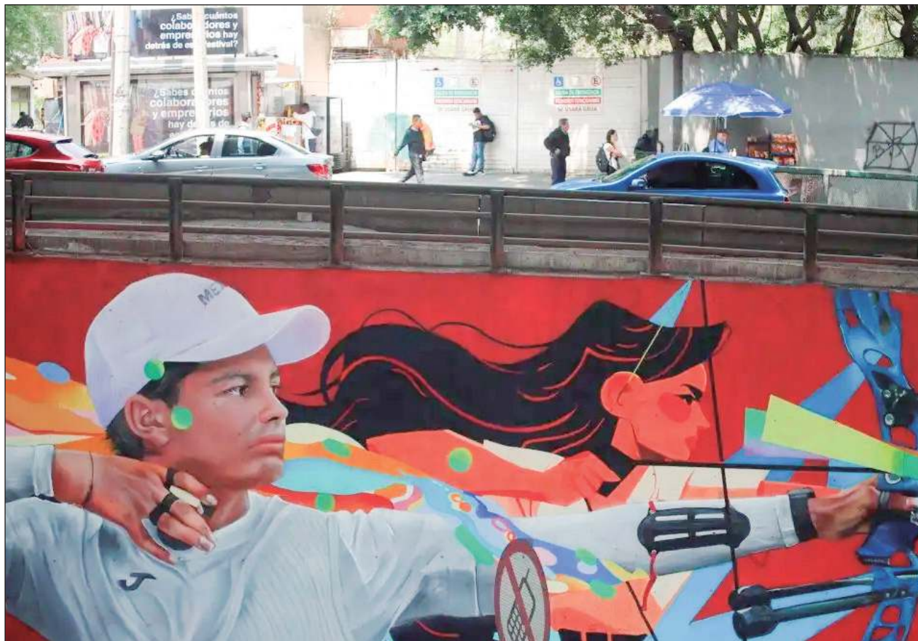
▲ Los nuevos 35 murales dedicados a los atletas olímpicos mexicanos fueron elaborados en las dos primeras semanas de julio y se ubican en Periférico Norte, en los cruces con calzada Legaria y las avenidas Ejército Nacional y Conscripto.

Los nuevos 35 murales dedicados a los atletas olímpicos mexicanos fueron elaborados en las dos primeras semanas de julio y se ubican