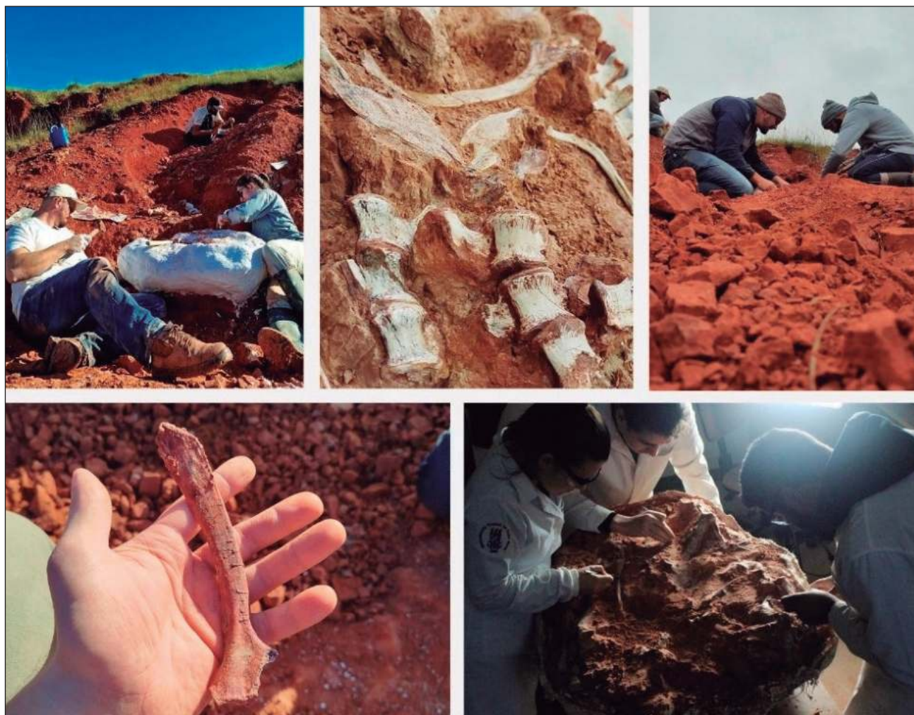
▲ Según las primeras observaciones, se trata de un espécimen de unos 2.5 metros de largo de la familia de los herrerasáuridos, depredadores carnívoros que habitaron lo que son hoy las pampas de Argentina y Brasil.