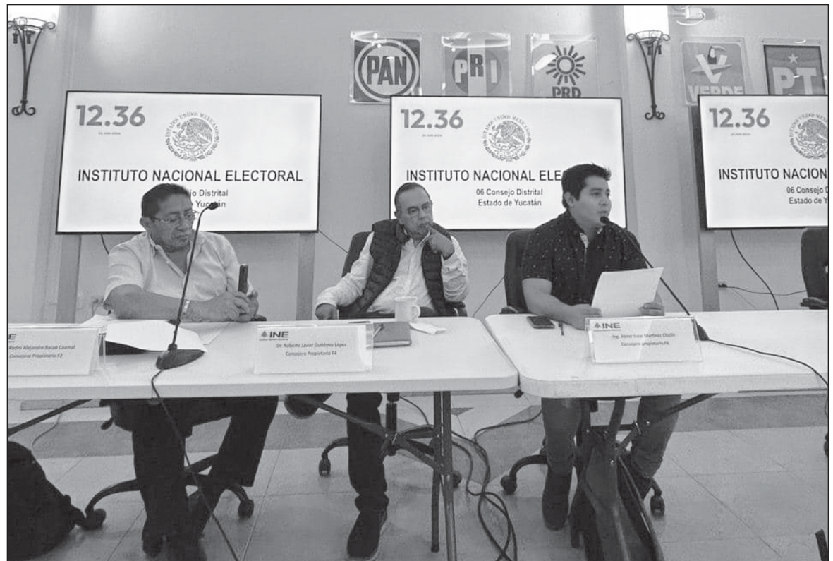
▲ “El INE es una construcción que ha costado años de esfuerzo y largos debates partidistas para lograr consensos que garanticen cada vez más la legitimidad de nuestros representantes electos y el absoluto respeto a la decisión de la mayoría, considerando igualmente la representación de las minorías”.

NO DEBEMOS OMITIR , que esta ha sido la elección no solamente más grande, sino la más compleja de la historia de nuestra democra-