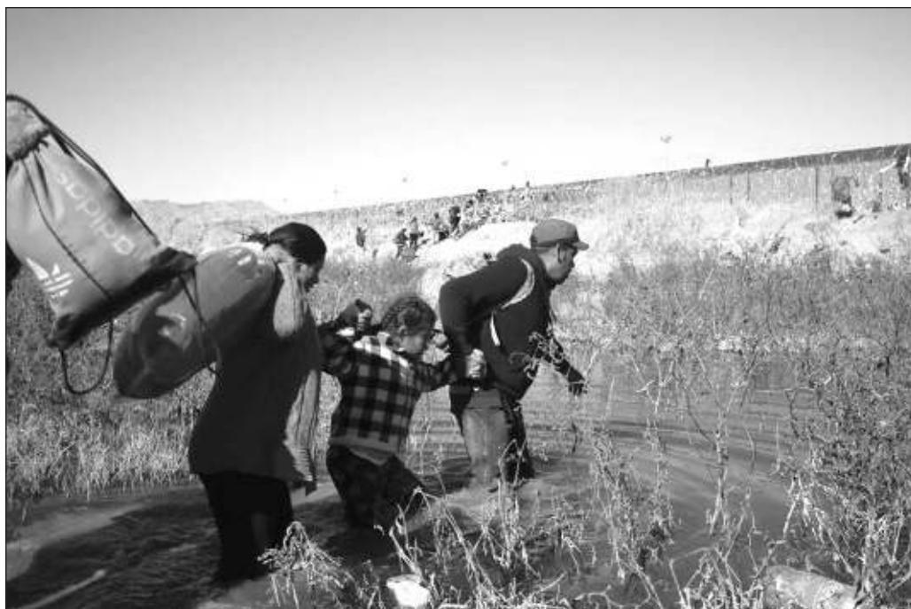
▲ El escándalo muestra las atrocidades a las que conduce la lógica de privatizar y subrogar funciones irrenunciables del Estado, que por su naturaleza requieren un enfoque absoluto de derechos humanos.

Para los menores de edad migrantes que se encuentran a merced de los agresores en las instalaciones de Southwest Key, el sueño americano en pos del cual dejaron atrás sus lugares de origen se ha convertido en una auténtica pesadilla, una paradoja particularmente brutal si se considera que quienes ingresan a Estados Unidos se sienten a salvo de los peligros que los amenazaban en sus regiones de partida y de los que enfrentan en el camino hacia el norte. Con independencia de las sanciones penales y administrativas que deben fincarse a quienes han perpetrado o facilitado la violencia sexual contra niños, niñas y adolescentes en los centros de reclusión, es evidente que este horror no parará mientras persista el fallido enfoque securitista y racista en el manejo de la crisis migratoria.