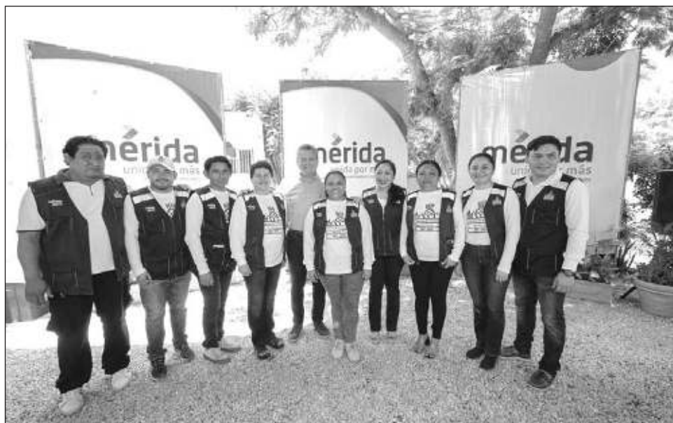
▲ El nuevo espacio se une al complejo de esta central, con una inversión de 600 mil pesos en beneficio de 28 trabajadoras, 28 trabajadores y más de 60 locatarios.

También, en el marco del 42 aniversario de la Central