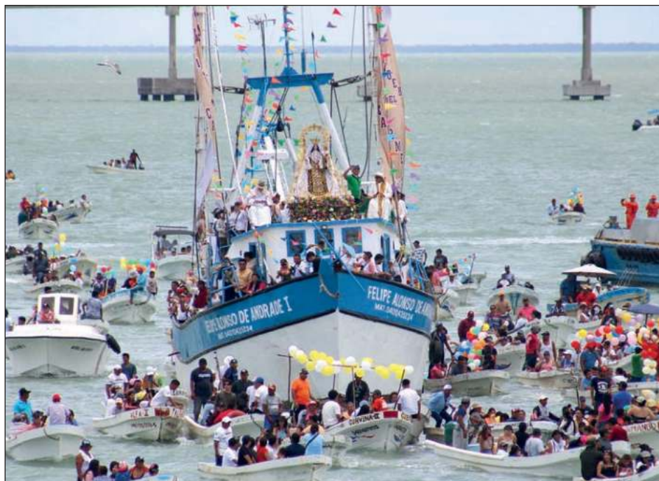
▲ La imagen de la Virgen del Carmen fue cargada en hombros por los fieles y llevada en procesi3n hasta el Malec3n de la ciudad, donde se llev3 a cabo la ceremonia eucar3stica.

Pese a la amenaza de lluvia, familias completas, llegadas de estados cercanos como Yucat3n, Quintana Roo, Tabasco, Veracruz, Tamaulipas, Puebla, Chiapas y Puebla, entre otros, se desplegaron a lo largo del recorrido de la imagen que parti3 del Santuario Mariano Diocesano de la Virgen del