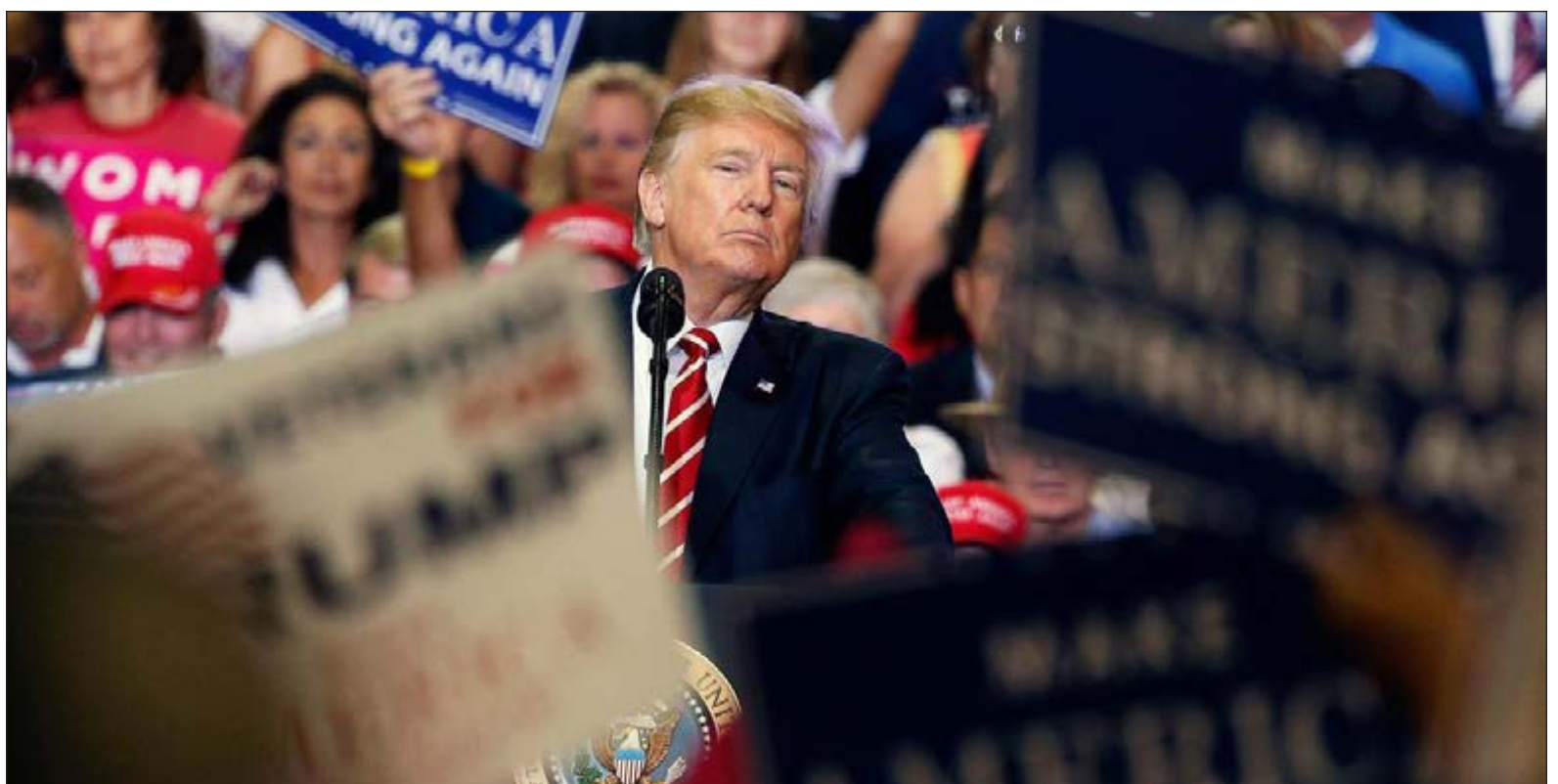
▲ A president of the United States who will do anything to cling to power and even expand his hold on it is a danger to the country, and voters willing to follow such a president are a danger unto themselves.