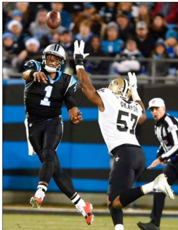
▲ Cam Newton tiene el potencial para darle gran dinamismo a la ofensiva patriota.

Con el joven Jarrett Stidham remplazando a Tom Brady, el panorama lucía complicado para los seis veces monarcas. Pero con Cam al 100%, los "Pats" tendrían un arma pocas veces vista en la NFL, un pasador con gran estatura, físico y habilidad para correr. El dé-