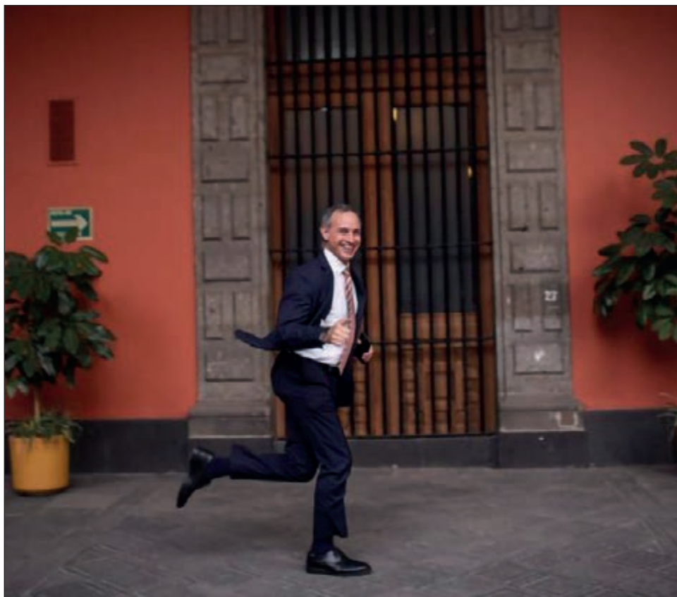
▲ El subsecretario de Salud federal, Hugo López-Gatell, fue captado emprendiendo la carrera para llegar a la conferencia de cada tarde en Palacio Nacional, donde ofrece el panorama del avance de la pandemia en el país.