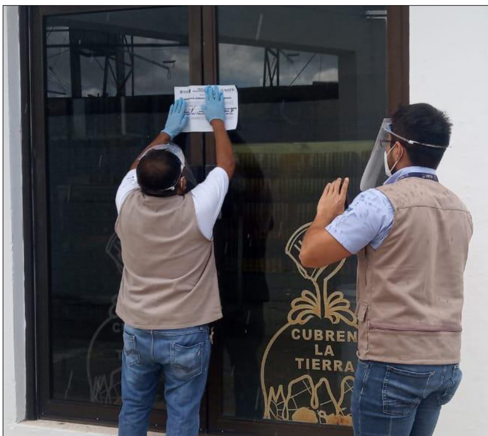
▲ Los cierres se realizaron luego de una primera revisión de la que resultó un apercibimiento.