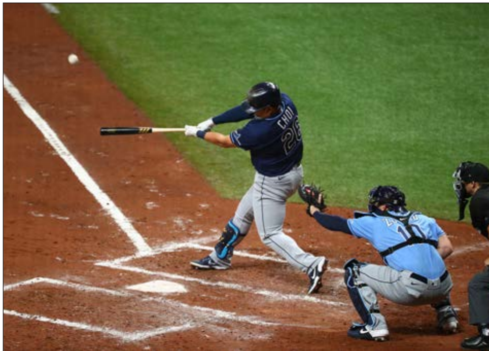
▲ Las Mantarrayas cuentan con el arsenal para pelear en la División Este de la Liga Americana con los Yanquis.

Charlie Morton, Blake Snell y Tyler Glasnow encabezan una rotación con argumentos para considerarse