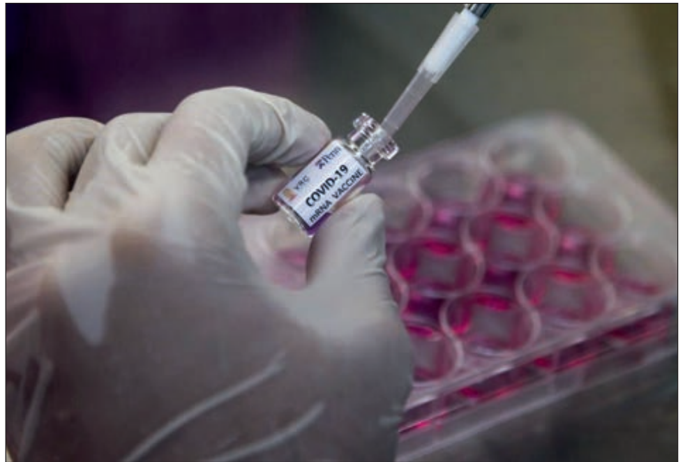
▲ Los resultados de apuntan a que este año podríamos contar con una vacuna contra el COVID-19.

Gavi, CEPI y OMS han creado en conjunto, añadió, la plataforma Acceso Global para la Vacuna contra el COVID-19, cuyo “objetivo primordial es distribuir al