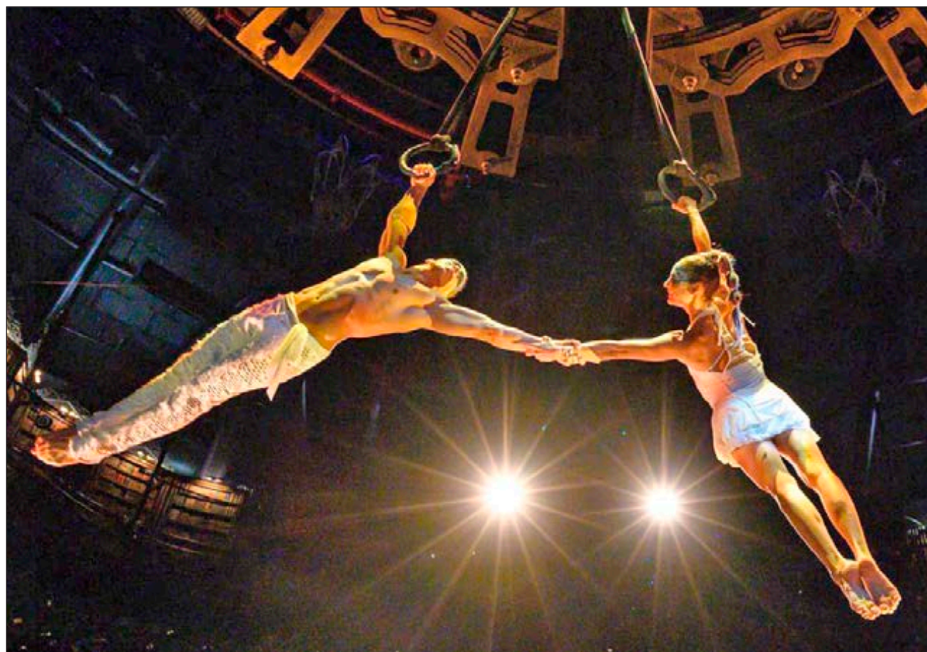
▲ JOYÀ es el primer espectáculo residente del circo en América Latina y se exhibe en un teatro construido especialmente para la obra, frente al complejo Vidanta.

JOYÀ, inaugurado en 2014 por la compañía canadiense Cirque du Soleil en sociedad con la cadena hotelera mexicana Vidanta, es el segundo espectáculo que reabre en el mundo. En ju-