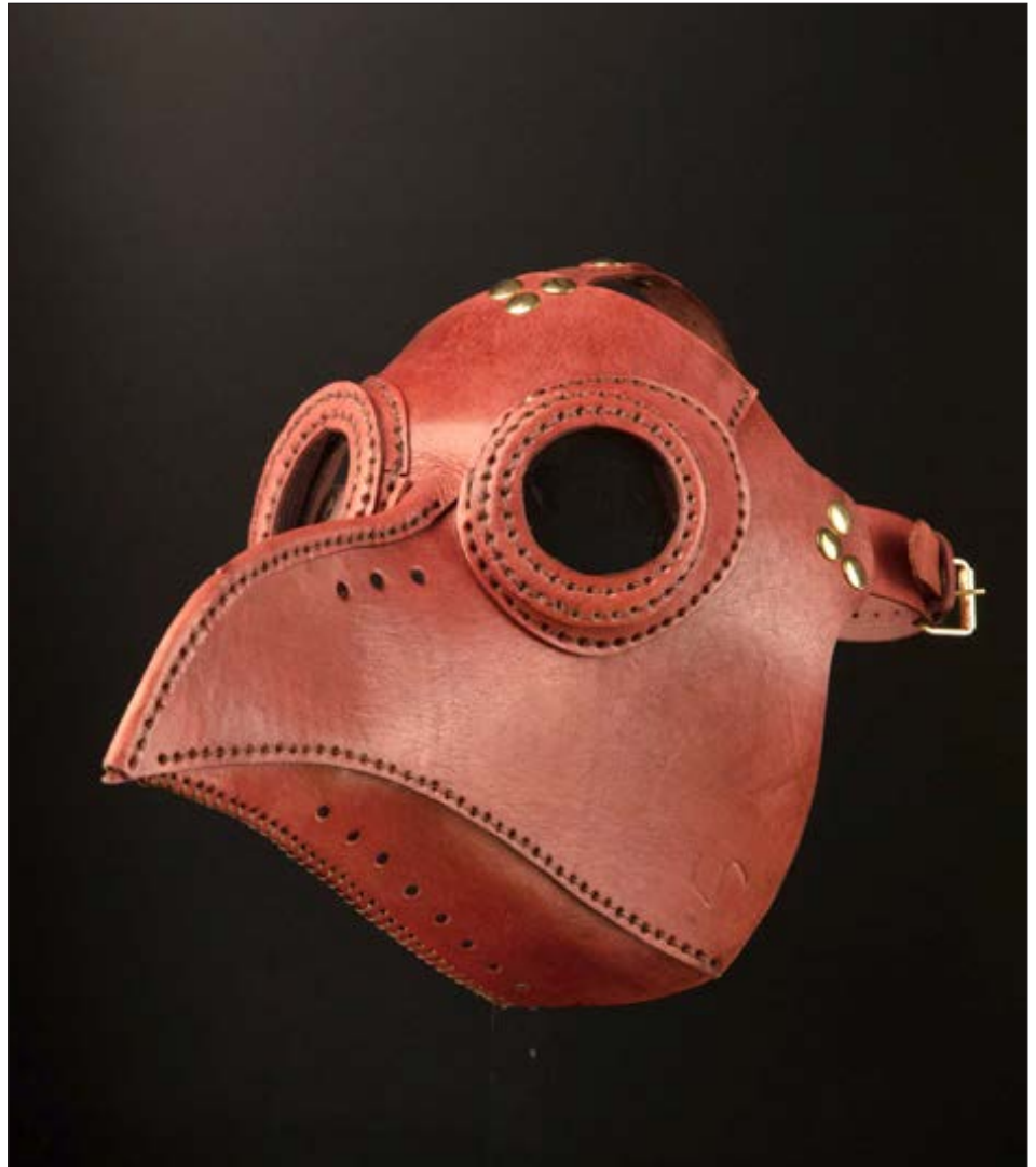
▲ Las máscaras son artesanales, hechas con cuero de vaca y cosidas a mano.

Son piezas artesanales, hechas con cuero de vaca y cosidas a mano. "Vienen con mi firma, tienen un certificado de autenticidad, están numeradas...", destacó José Rocha. Cada una le lleva desde unas cuantas horas hasta cinco días de trabajo. Los diversos modelos pueden consul-