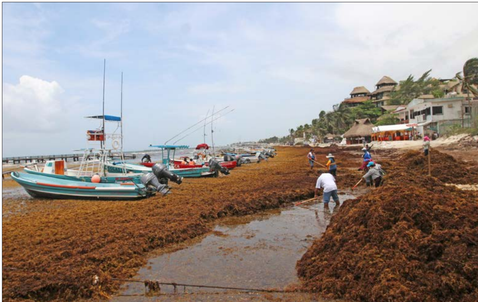
▲ De acuerdo a cálculos de expertos, se requieren 400 millones de pesos para trasladar las 500 mil toneladas de sargazo que llegan a las costas de Quintana Roo cada año.

*Premio nacional al Mérito Ecológico daldana@cinvestav.mx