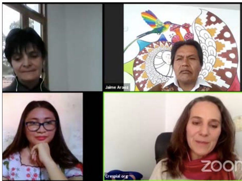
▲ El foro Miradas del patrimonio cultural inmaterial de Latinoamérica frente al COVID-19 reunió virtualmente a líderes indígenas de la Amazonía, Perú y Yucatán.

Los líderes indígenas expresaron que la pandemia en algunos casos ha generado mucho miedo y preocupación en las comunidades, ha ocasionado pérdidas de ancianos, de ancestros, pero por otro lado ha servido para generar una resistencia ante esta emergencia; muchas personas, por la crisis, han retornado a sus lugares de origen y se han conectado con otros pueblos