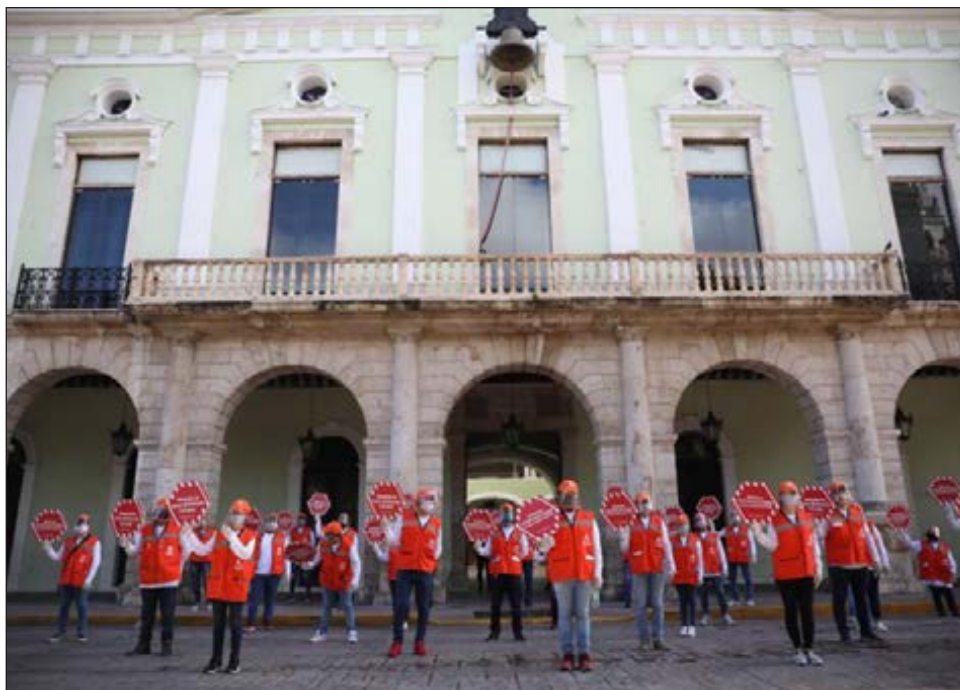
▲ Las brigadas de amigos de la salud visitarán domicilios se pondrán en marcha hoy miércoles y visitarán los puntos donde residen más personas contagiadas.

Sobre el sistema de rastreo vía mensajes SMS y llamadas telefónicas, éste tiene como objetivo la localización y monitoreo de personas que estuvieron en contacto con personas diagnosticadas, para ser canalizadas a través de la asistencia telefónica 800YUCATÁN (800