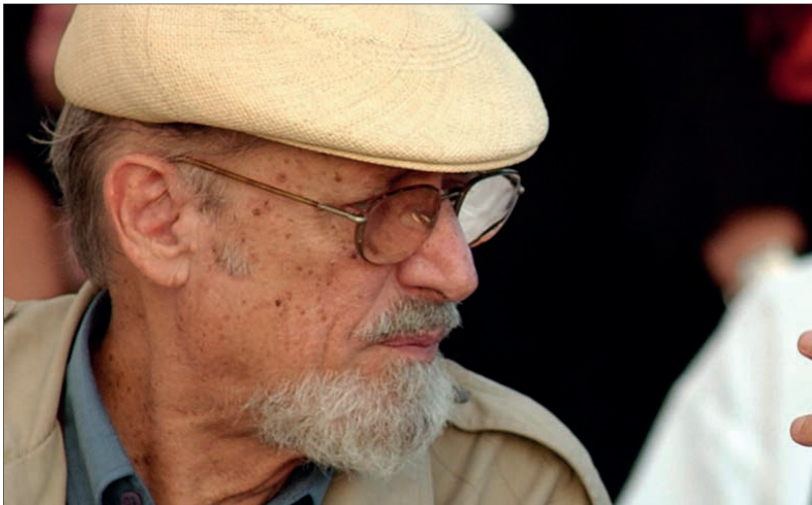
▲ La obra de Roberto Fernández Retamar es un llamado a la superación de las sombras arrastradas como lozas.

Roberto Fernández Retamar dejó a la posteridad una obra marcada por la identidad latinoamericana, construida como hibridez histórica, heredera de los pueblos originarios, el mundo occidental y representada en la actualidad por la diversidad que tanto enriquece a los pueblos de Nuestra América, fue justamente para ellos, para los pueblos y culturas, que Retamar hizo con las palabras el poema más hermoso en los profundos ideales de la revolución en el pensamiento y en la realidad concreta latinoamericana.