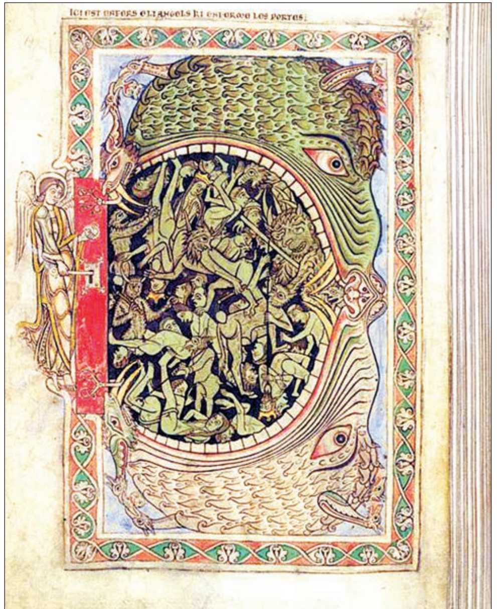
▲ Boca del Infierno cerrada por un arcángel, del Salterio de Winchester (libro de salmos), alrededor del año 1150, tomada del libro Hombres y mujeres de la Edad Media , del historiador medievalista y escritor francés Jacques Le Goff.

Catástrofes como la pandemia que azotó Europa fueron entendidas como castigos y pecados del hombre, y como pruebas del inmenso poder sobre el universo que Satanás recibió del pecado original. Desde entonces, el arte da testimonio en múltiples formas del miedo al diablo y sus acólitos que se apoderan de una civilización, añade Le Goff.