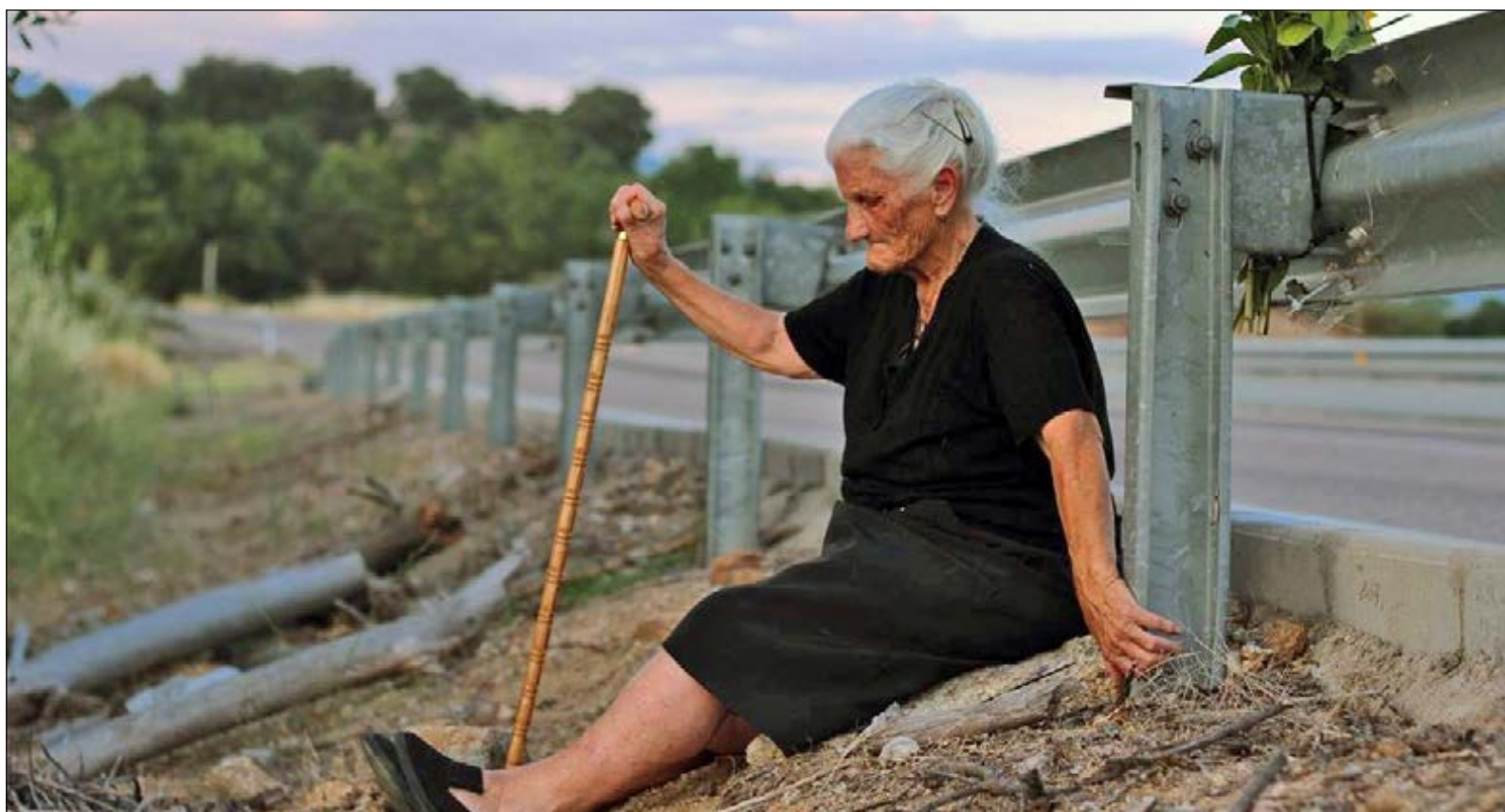
▲ El documental arranca con una anciana, casi sin voz, pero que rompe el silencio y señala el lugar de la fosa común en la que yace su madre. Foto fotograma de El silencio de los otros