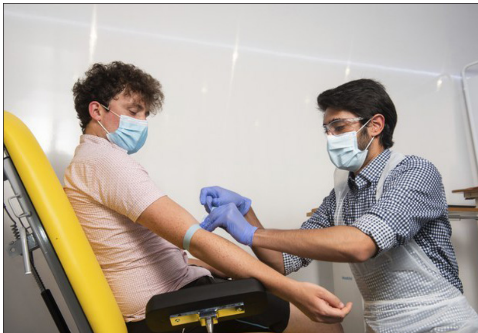
▲ Laboratorios como Johnson & Johnson y AstraZeneca se comprometieron a vender inicialmente sus vacunas sin obtener ganancias.