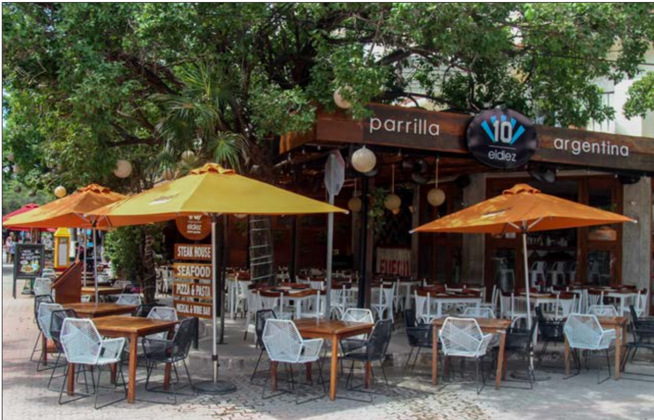
▲ De acuerdo con la semaforización, en todo el estado se ha pedido a los restaurantes vender específicamente servicios para llevar, con tal de evitar el aforo en los establecimientos.

"En temas de alimentos se han cerrado lugares por detectar que no se contaba con las medidas adecuadas, como desinfección, filtro sanitario o no había verificación del personal de que no tuviera síntomas de COVID-19 o de plano se detectó gente trabajando enferma", precisó Pino Murillo.