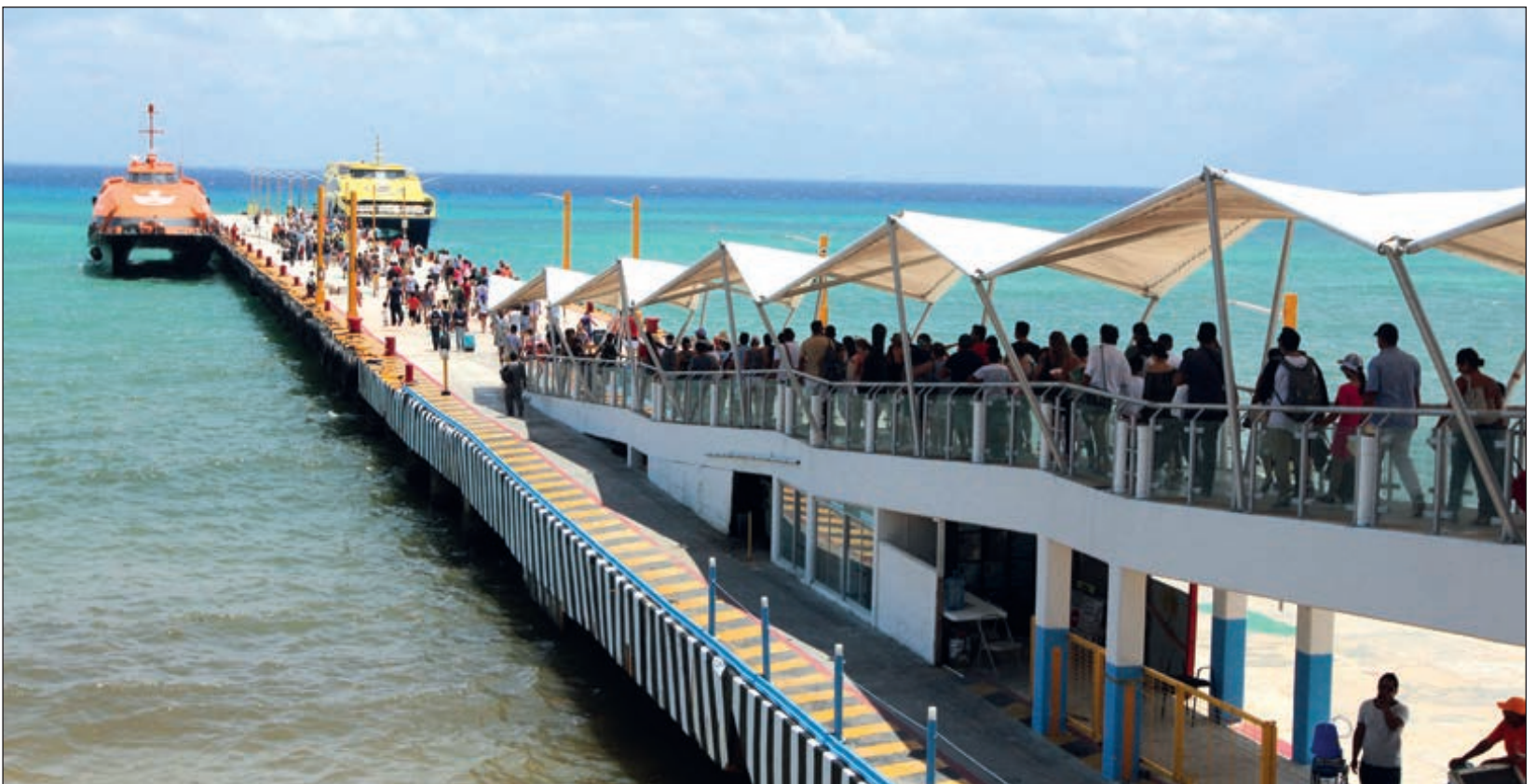
▲ Para la zona norte de Quintana Roo es fundamental el servicio de transporte marítimo ya que por esta vía se establece comunicación y traslado de pasajeros de y hacia Isla Mujeres y Cozumel. La imagen corresponde a abril del año pasado, en Playa del Carmen.

Ahora de nueva cuenta están en el ojo del huracán y de ser nuevamente responsables la Secretaría de Comunicaciones y Transportes (SCT) podrá emitir la regulación de tarifas en favor de la población usuaria y los visitantes al Caribe mexicano; apenas en noviembre pasado hubo un alza en los costos para los quintanarroenses de más de 100%, es decir, de 70 pesos que pagaban antes por un viaje sencillo, subió hasta 150 pesos, y el redondo pasó de 140 a 300 pesos.