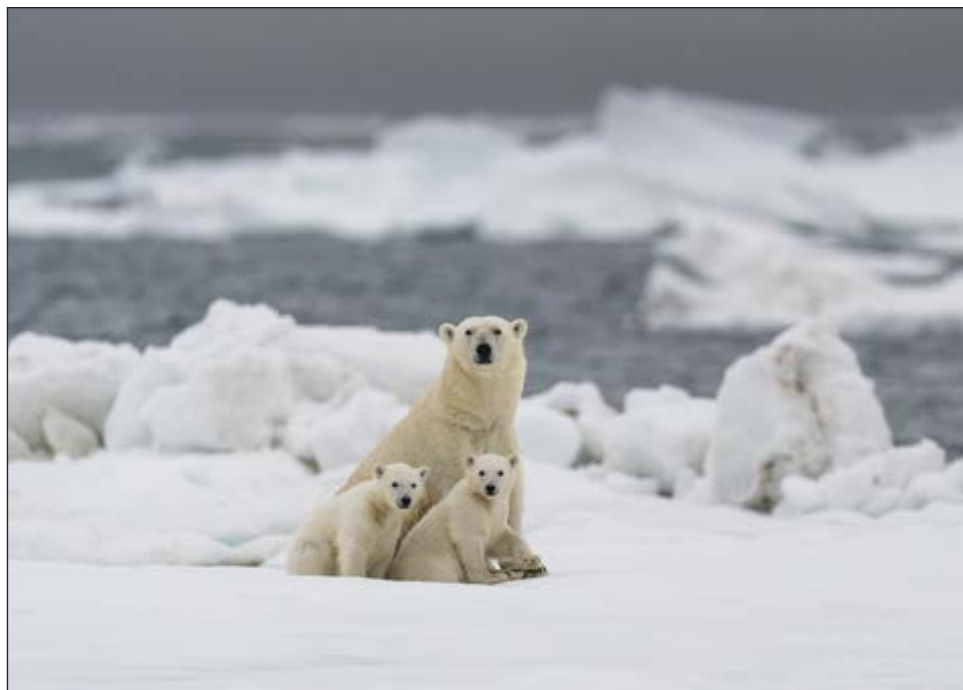
▲ El desafío es mayor para las hembras que entran en sus refugios para parir en medio del invierno y salen en la primavera con sus oseznos.

Con el calentamiento del planeta, dos veces más rápida en el Ártico, la falta de hielo dura cada vez más tiempo. Incapaces de hallar