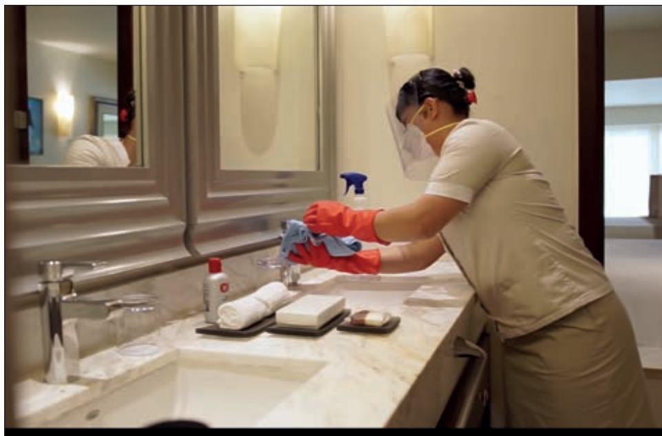
▲ Las mujeres se ocupan más en el sector de servicios, por lo que el riesgo de contagio es mayor que el de los hombres.

Y una vez que la economía abre, la situación no mejora ya que los expertos alertaron que para las mujeres es más difícil encontrar trabajo a tiempo completo.