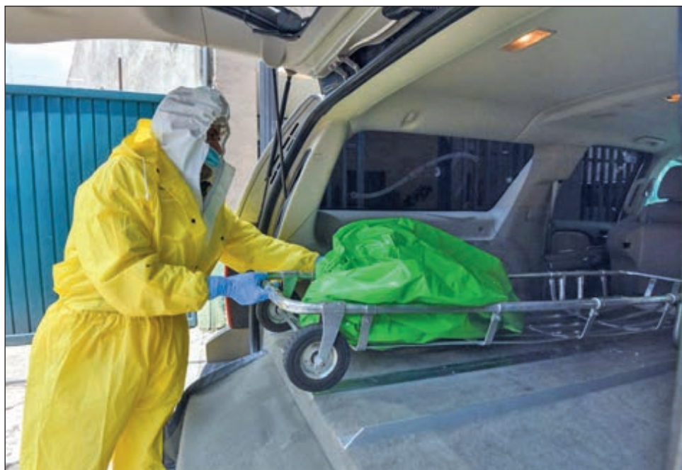
▲ Entre todas las funerarias de Yucatán, diariamente ofrecen más de 50 servicios, el doble de los que brindaban antes de la pandemia.

Indicó que, antes de la pandemia, en promedio registraban 25 fallecimientos en la capital yucateca. Sin embargo, ahora la cifra va más arriba del doble; entre todas las funerarias, diariamente ofrecen más de 50 servicios.