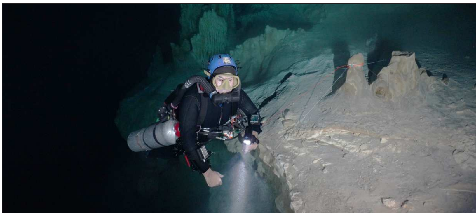
▲ Los responsables movieron el esqueleto de un puma de 15 mil años de antigüedad y dañaron el esqueleto de un oso de al menos 12 mil años.

“Es un problema que debemos atender en conjunto: autoridades, centros de buceo, quienes llenan tanques, guías independientes y quienes hospedan a los buzos. Si hay sitios prohibidos, deben respetarse; y si se abren, debe hacerse con protocolos estrictos”, señaló.