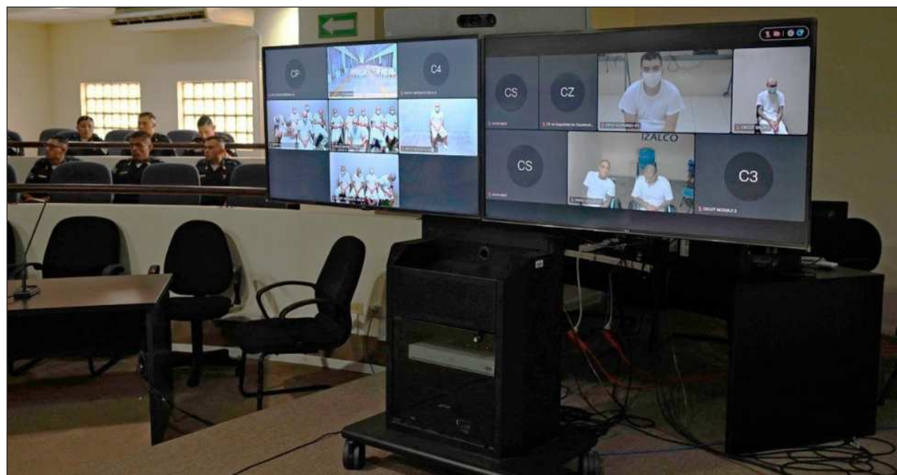
▲ La MS-13 y su rival, Barrio 18, son dos agrupaciones salvadoreñas consideradas terroristas por Washington.

Centros Judiciales de El Salvador, que reúne a los juzgados, precisó en su cuenta en