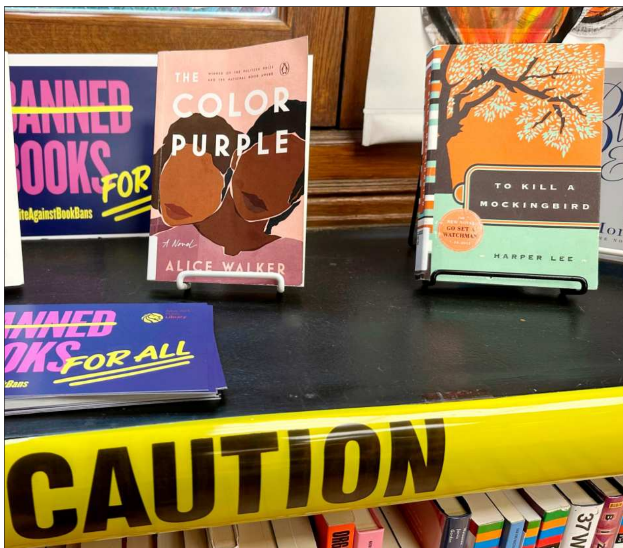
▲ Los intentos de censura se mantienen en niveles récord, según la Asociación Estadunidense de Bibliotecas, la cual publicó este lunes su lista anual de los libros más impugnados en las bibliotecas del país, como parte del informe State of America's Libraries Report .

Los boletos ya se encuentran a la venta a través del número de WhatsApp 9902287462 y cuestan 280 pesos la entrada general, pero hay descuentos para quienes presenten su credencial de estudiantes y para quienes tengan credencial del Inapam.