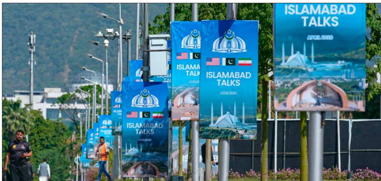
▲ El vicepresidente de Estados Unidos, JD Vance, retrasa viaje para las negociaciones con gobierno iraní en Pakistán.

El mandatario estadounidense aseguró que el bloqueo contra los puertos seguirá vigente