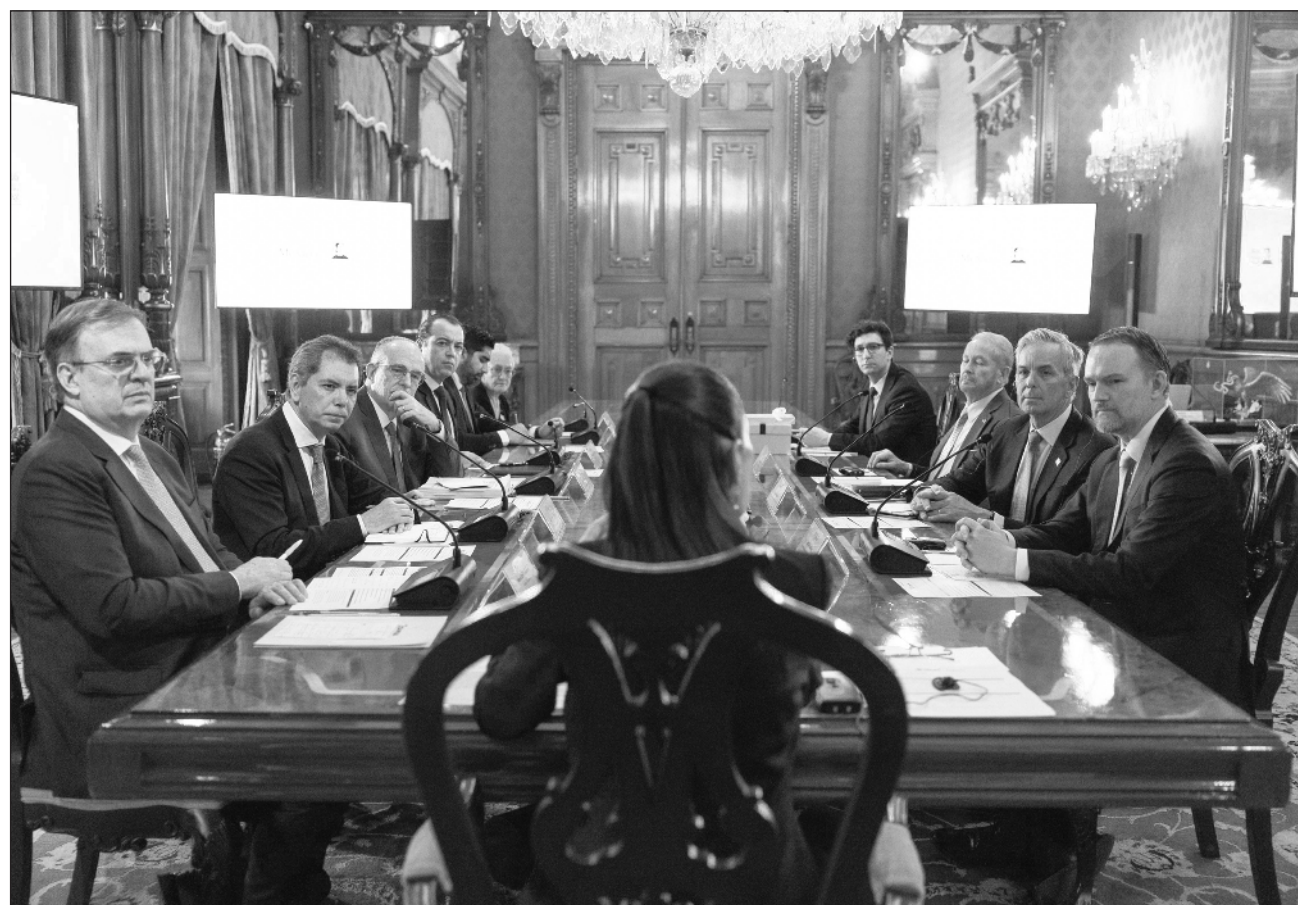
▲ “Coincidimos en la importancia de mantener el tratado”, destacó la mandataria federal acerca del encuentro.

En tanto, añadió, el gobierno de México expuso su interés “que en el caso de