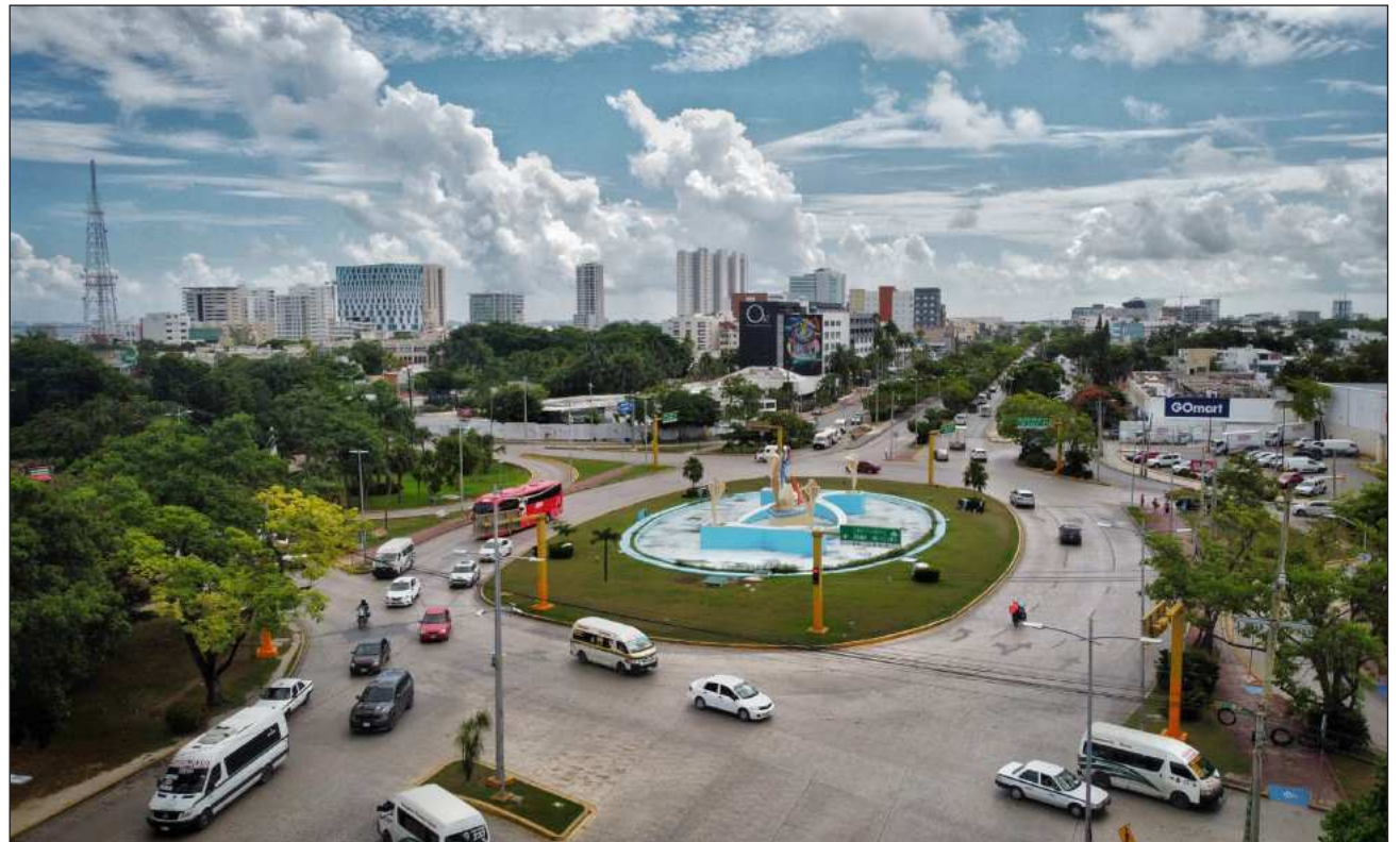
▲ La campaña busca que cada habitante identifique el valor particular que aporta a la comunidad.

La campaña, apuntó, propone acciones tangibles que cualquier ciudadano puede adoptar en su vida cotidiana; a través de la plataforma mktcancun.org se invita a las personas, asociaciones y empresas a sumarse con compromisos específicos que reflejen su orgullo y