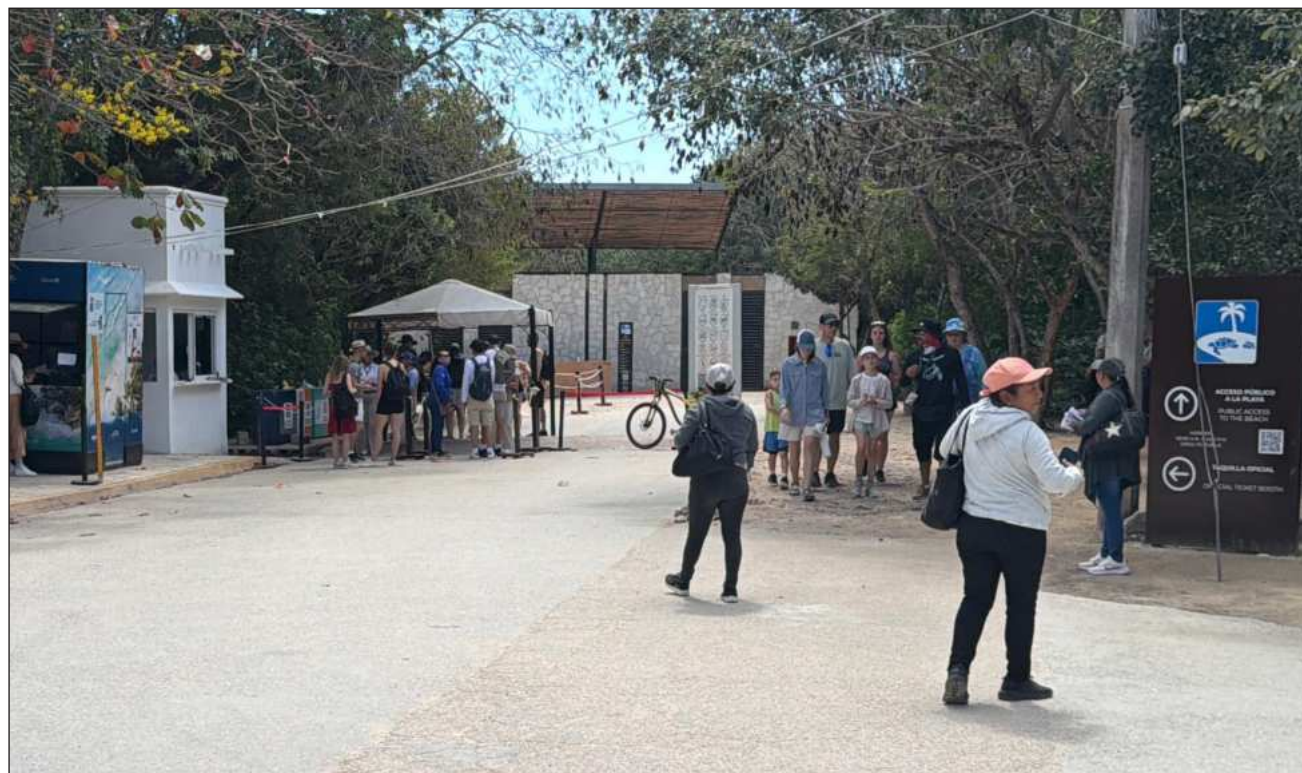
▲ La zona arqueológica de Tulum es una de las más visitadas del país, sólo después de Teotihuacán y Chichén Itzá.

Sin embargo, en una visita realizada el martes al sitio de monumentos mayas se pudo comprobar que en este punto aún no hay un despliegue mayor de las Fuerzas Armadas.