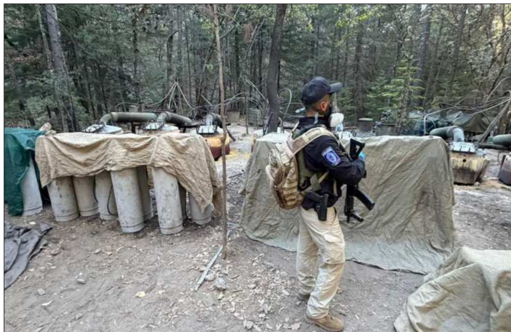
▲ Queda la sospecha de que existen más agentes estadounidenses operando en suelo mexicano.

Por otro lado, queda también la sospecha de que existen más agentes estadounidenses encubiertos operando en suelo mexicano. Esto, tomando en cuenta que ya han iniciado las negociaciones del Tratado México -Estados Unidos y Canadá (T-MEC), no hace más que enrarecer lo que debiera ser una operación comercial de alto nivel de la cual debieran resultar favorecidos los tres países. Ahora, lo que se impone es un extrañamiento y la solicitud de no repetición, cuestiones que Trump tomaría como una agresión personal; más si viene de una mujer como la presidenta Sheinbaum.