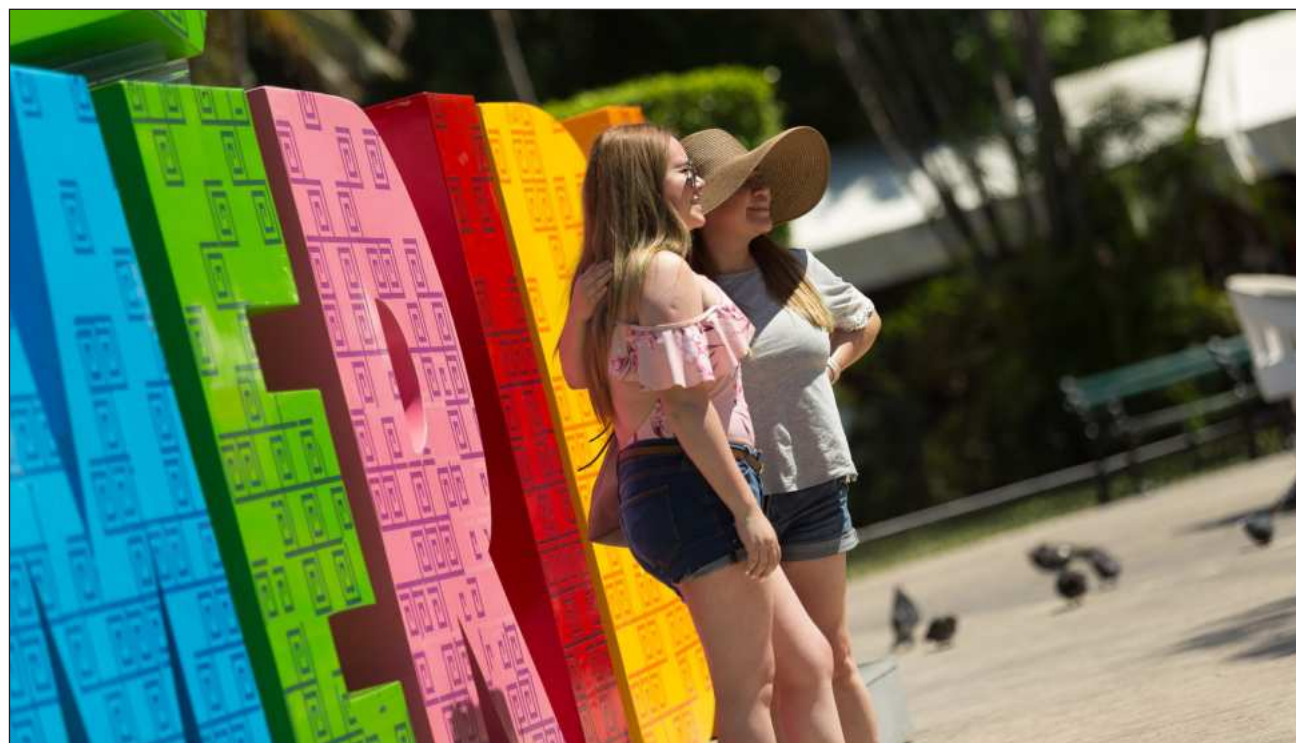
▲ Los hoteleros esperan una ocupación de 70% durante el Mundial 2026, del 11 de junio al 19 de julio.