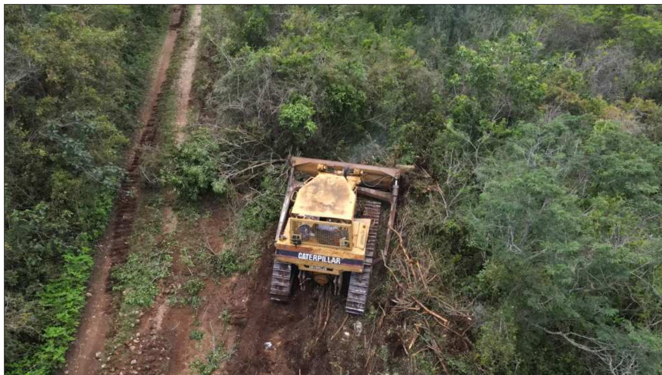
▲ Los imputados fueron descubiertos provocando afectaciones al equilibrio ecológico de la zona.

Los hechos se registraron en julio de 2025, según información del ayuntamiento