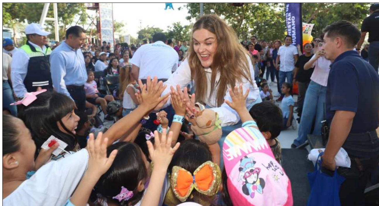
▲ Las actividades culminarán el 3 de mayo y pueden consultarse en merida.gob.mx .

cluye servicios como Ver Mejor Infantil, este 22 de abril durante el Miércoles Ciudadano, reafirmando el compromiso del Ayuntamiento con la salud visual de las niñas y niños, así como acciones integrales para su desarrollo.