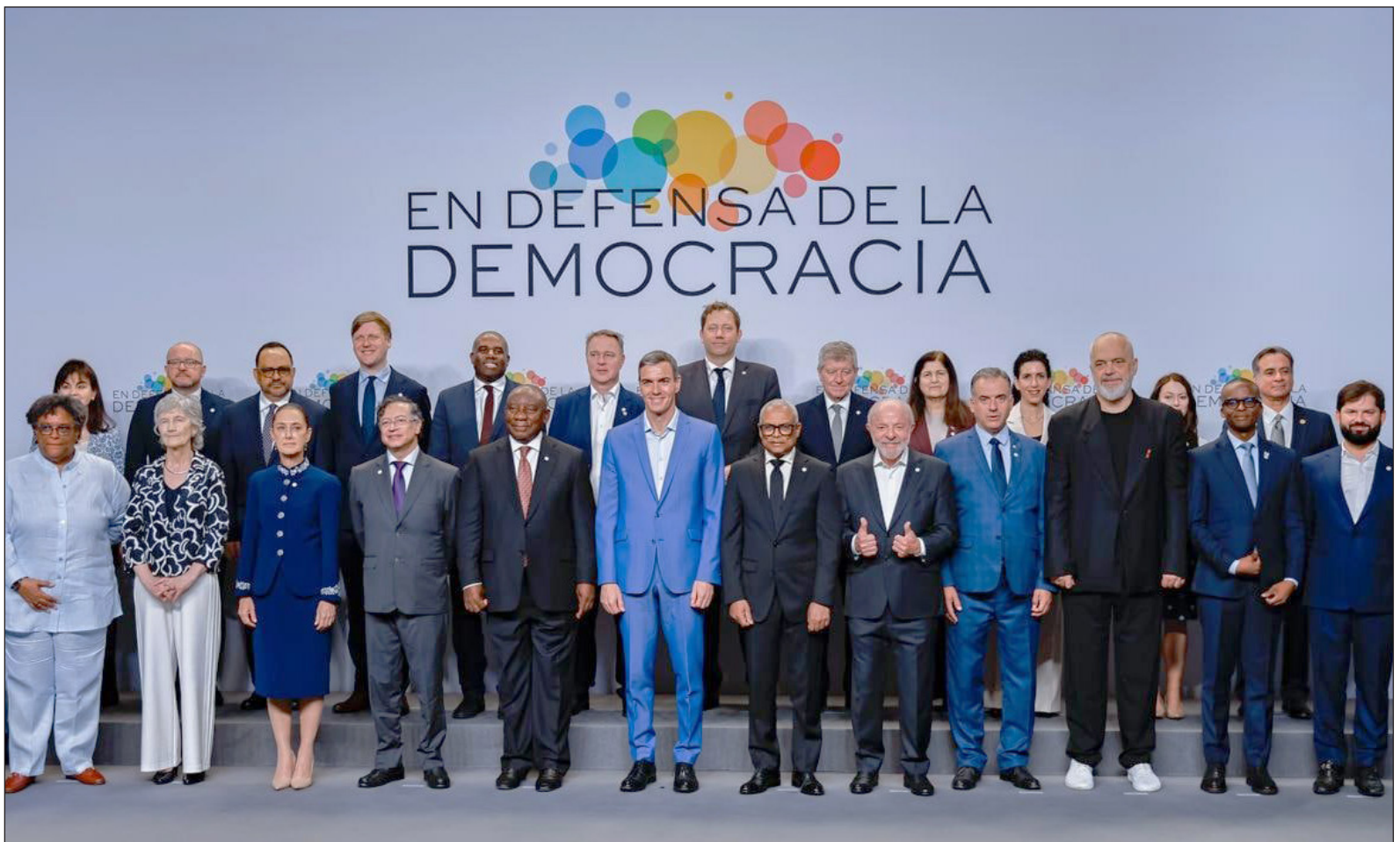
▲ “El mensaje enviado desde Barcelona trasciende la retórica social; es anuncio de un bloque que aspira a una autonomía operativa frente a la hegemonía”.