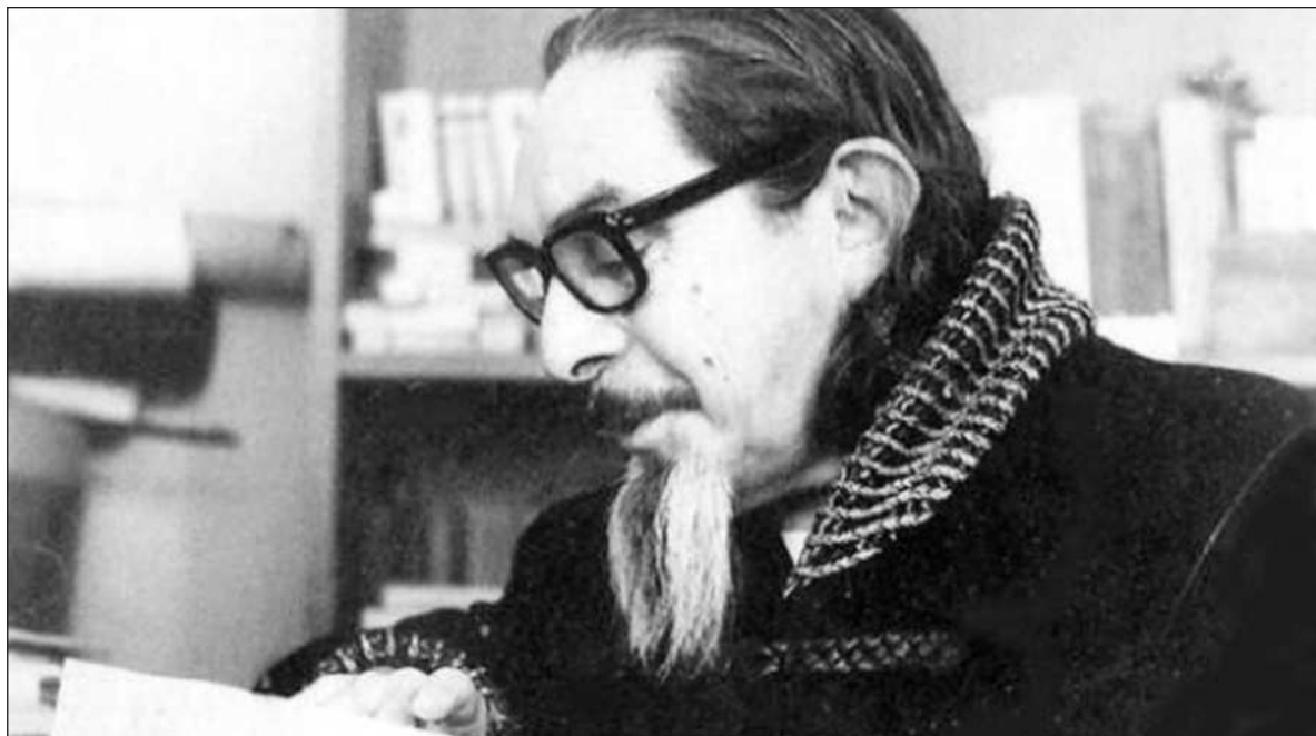
▲ En la lápida de Revueltas “fue inscrita la famosa frase de Goethe que animó mucho de su vida y que era la favorita de su querido Carlos Marx: ‘Gris es la teoría, verde es el árbol de oro de la vida’”.