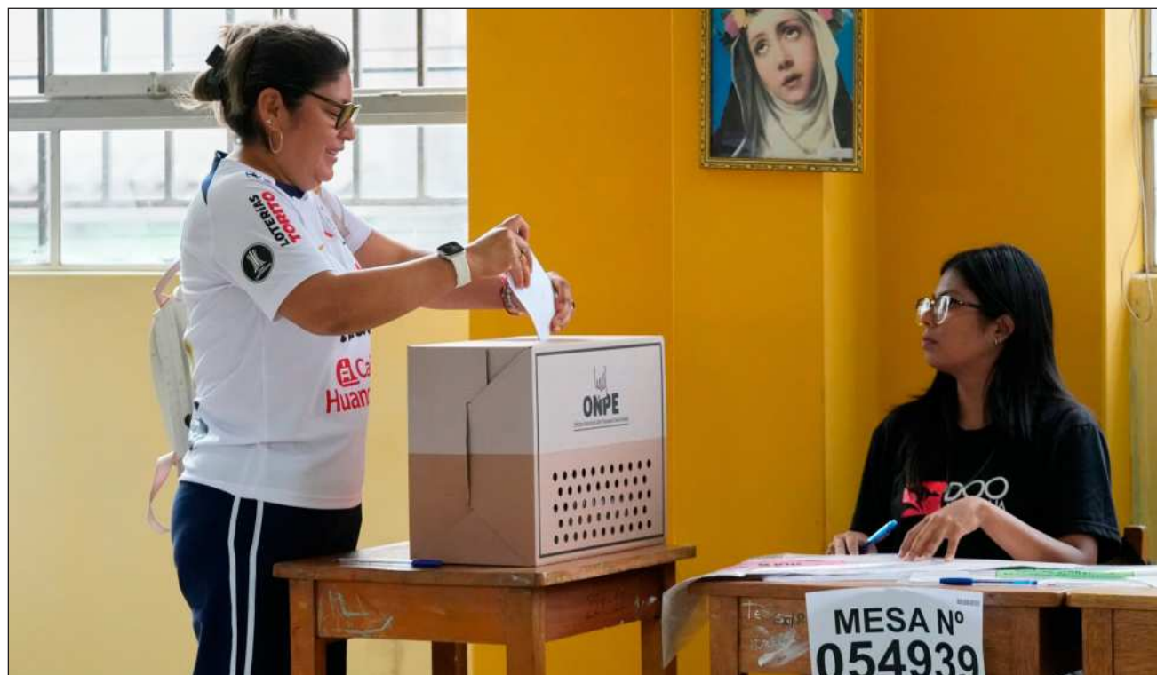
▲ Hasta 52 mil peruanos tuvieron que esperar un día más para poder votar debido a la falta de materiales .

El funcionario dijo que "luego de los problemas técnicos operativos suscitados en el despliegue del material electoral" en Lima, considera "necesario e impostergable renunciar a la responsabilidad otorgada", en el interés que se organice y ejecute la segunda vuelta de la elección presidencial en un "con-