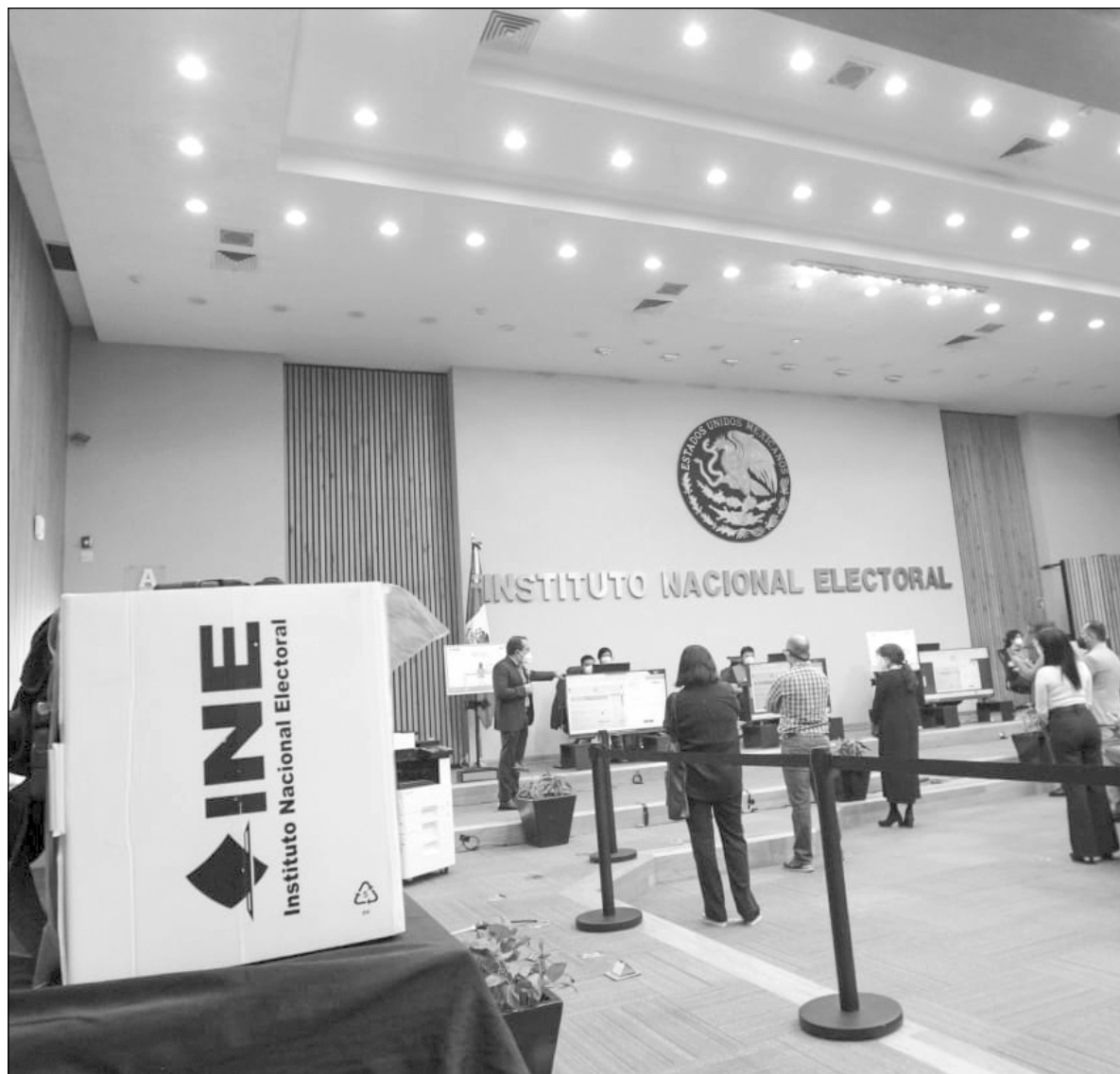
▲ La cuna del INE es neoliberal, y tristemente, sus consejeros han actuado como tal.

SU CUNA ES neoliberal y tristemente han actuado como tales. Así se explica que las violaciones a la legislación sobre financiamiento de los "Amigos de Fox" por muchos millones de pesos, opacos y superiores a lo permitido, recibieron una sanción exigua. Los escándalos de millones de pesos de compra de votos con tarjetas Monex, los sobornos de Odebrecht para la campaña de Peña Nieto, bien gracias.