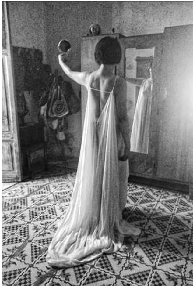
▲ En la versión de Torres, la obra se aleja de una representación costumbrista.

Como parte de la leyenda maya-quiché, agregó, los personajes del padre y el hijo dicen textos del Chilam Ba-