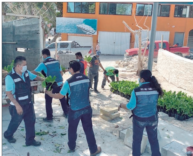
▲ La concesionaria ha dedicado al menos la última década a llevar un mensaje pro ambiental a todos los niveles y ámbitos posibles.

Asimismo, por más de 25 años, Aguakan ha trabajado junto con diversas instituciones públicas y privadas en programas de educación ambiental dirigidos a difundir las claves para el cuidado del agua, indispensables para