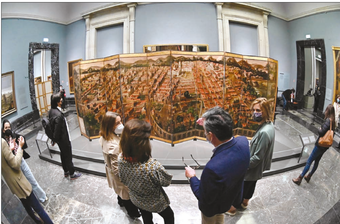
▲ El Biombo de la Conquista de México y la muy noble y leal Ciudad de México llegó a España hace 150 años.

El biombo se podrá ver en el Museo del Prado hasta el próximo 26 de septiembre, para luego formar parte, también en el Museo del Prado, de una exposición temporal del arte virreinal que se llamará Tornaviaje. Después, el biombo regresará a la colección particular y no se tiene previsto que salga de España ni que viaje a México.