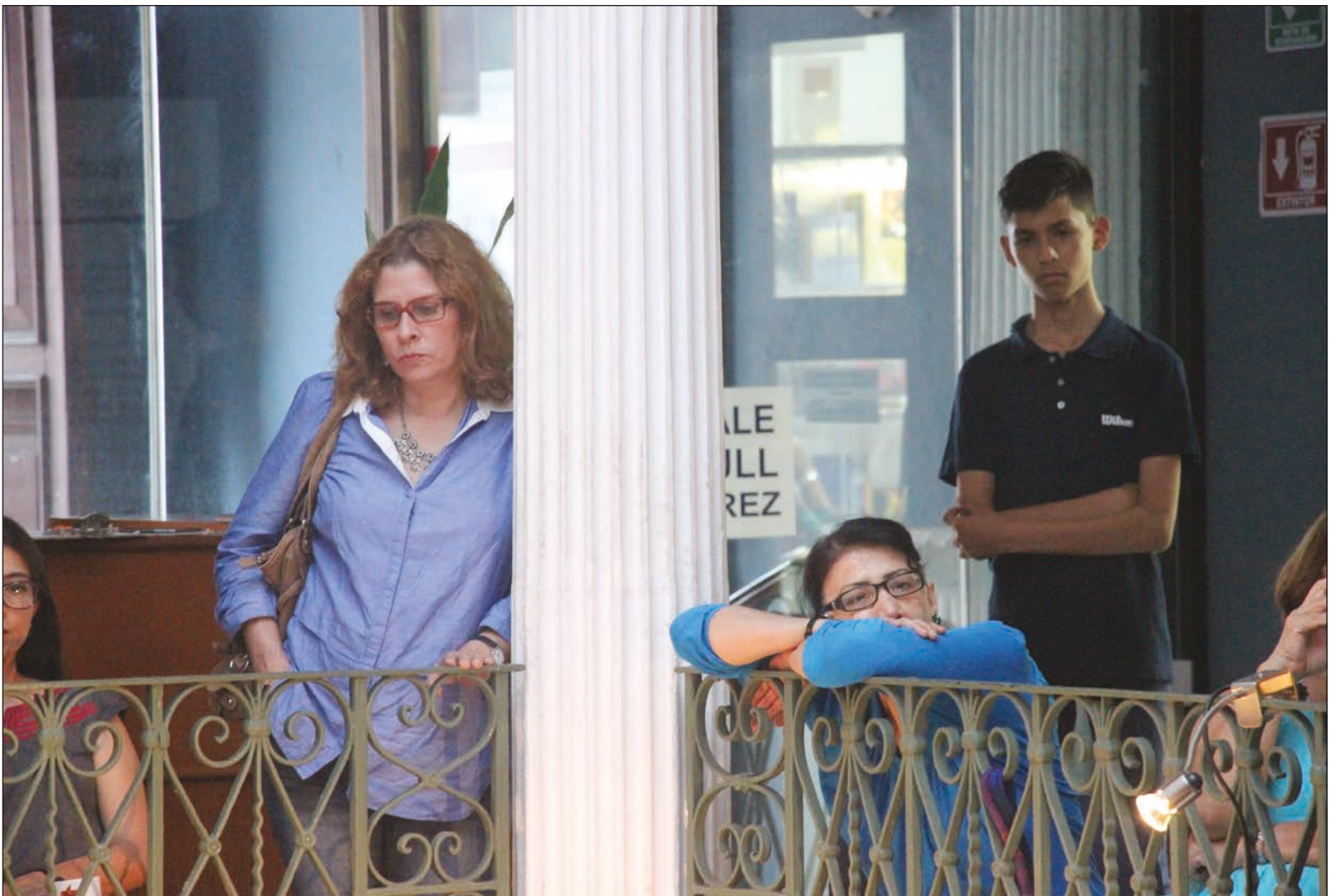
▲ Repensar el papel de los intelectuales en las sociedades actuales es una necesidad imperante.