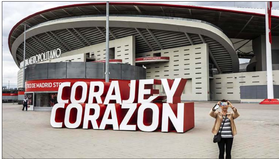
▲ El Wanda Metropolitano, casa del Atlético de Madrid.

El Madrid y el Barcelona no formularon comentarios sobre la decisión de los otros fundadores de abandonar la