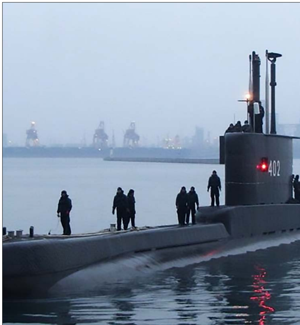
▲ El submarino KRI Nanggala 402 participaba en un ejercicio de entrenamiento.

El país ha enfrentado numerosos desafíos recientes a sus reclamos marítimos, incluidos varios incidentes con naves chinas cerca de las islas Natuna.