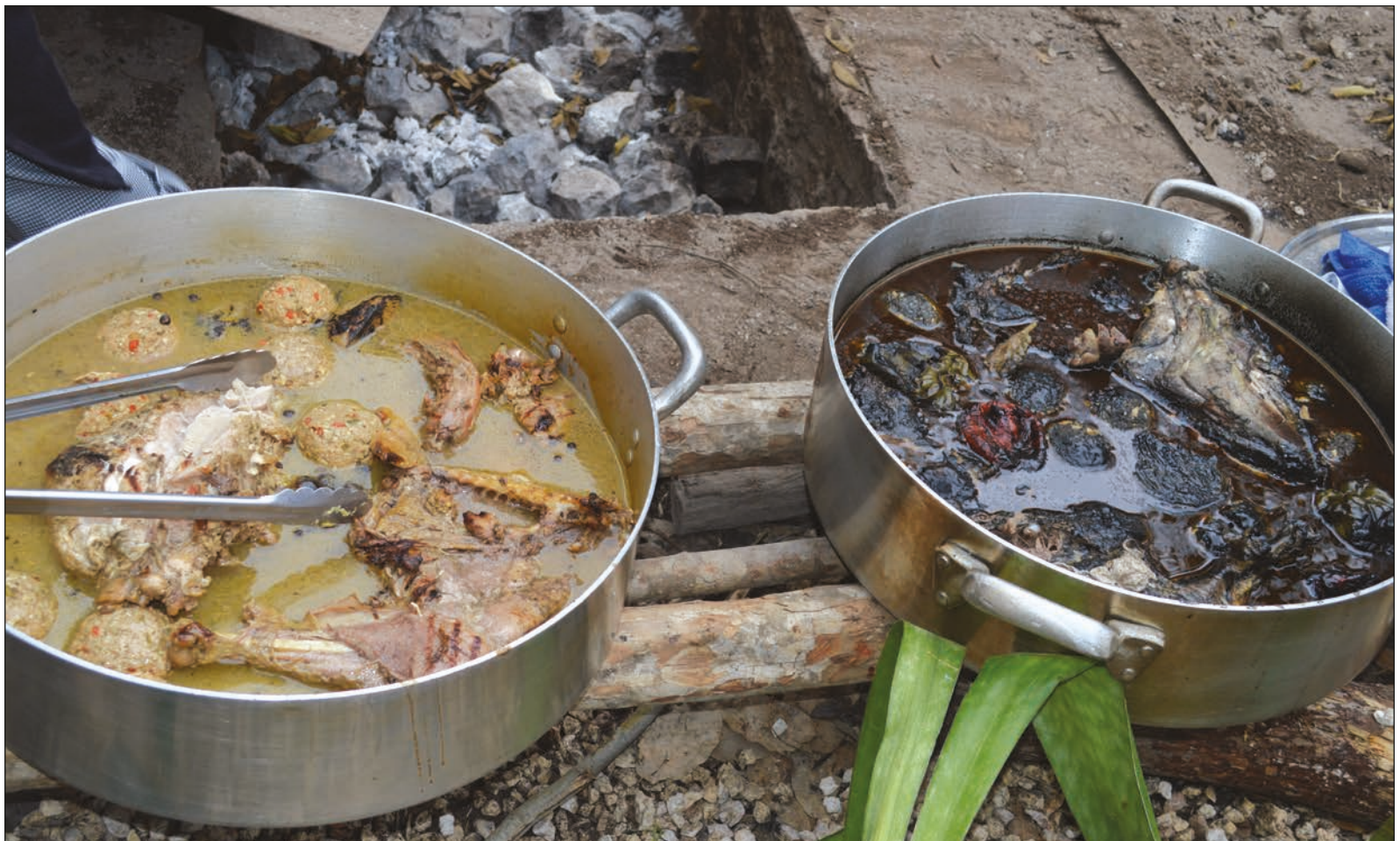
▲ Al cocinar no puedo evitar recordar a mi, los olores, los sabores, los sonidos de la cocina, me remiten a sus ojos de pimienta, a su sonrisa canela, a sus manos de cebolla, a su corazón de achiote.