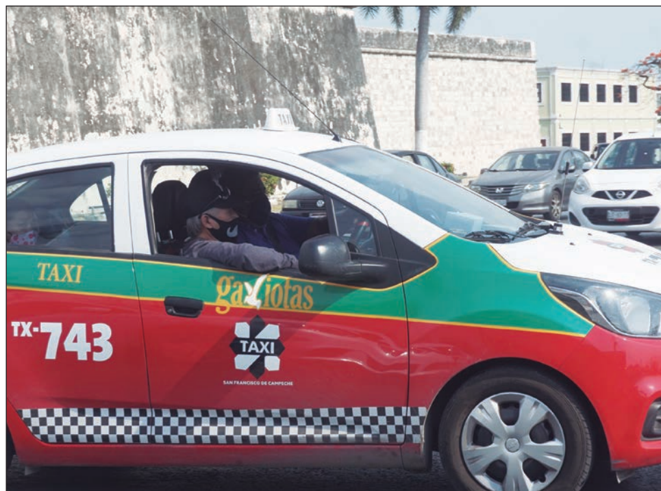
▲ Según el dirigente sindical de los taxistas, la propuesta de transporte busca ayudar a los agremiados a recuperarse del golpe económico que ha significado la pandemia.

El dirigente de los taxistas manifestó que tras presentar la propuesta, el SUTV se encuentra a la espera que el IET les autorice el aumento en el cupo del pasaje, ya que por las limi-