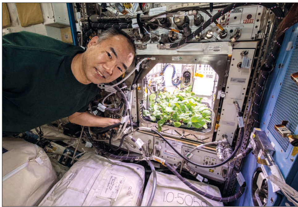
▲ El interior del laboratorio internacional, que se halla a 400 kilómetros de altitud, tiene un tamaño similar a un terreno de fútbol.

Los astronautas se relevan en las tareas de laboratorio y los experimentos “se conciben a largo plazo, independientemente de las misio-