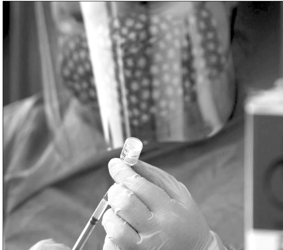
▲ Las vacunas ilícitas se ofrecen vía las redes sociales, sin garantía alguna.

Barbosa insistió en que sólo se puede confiar en