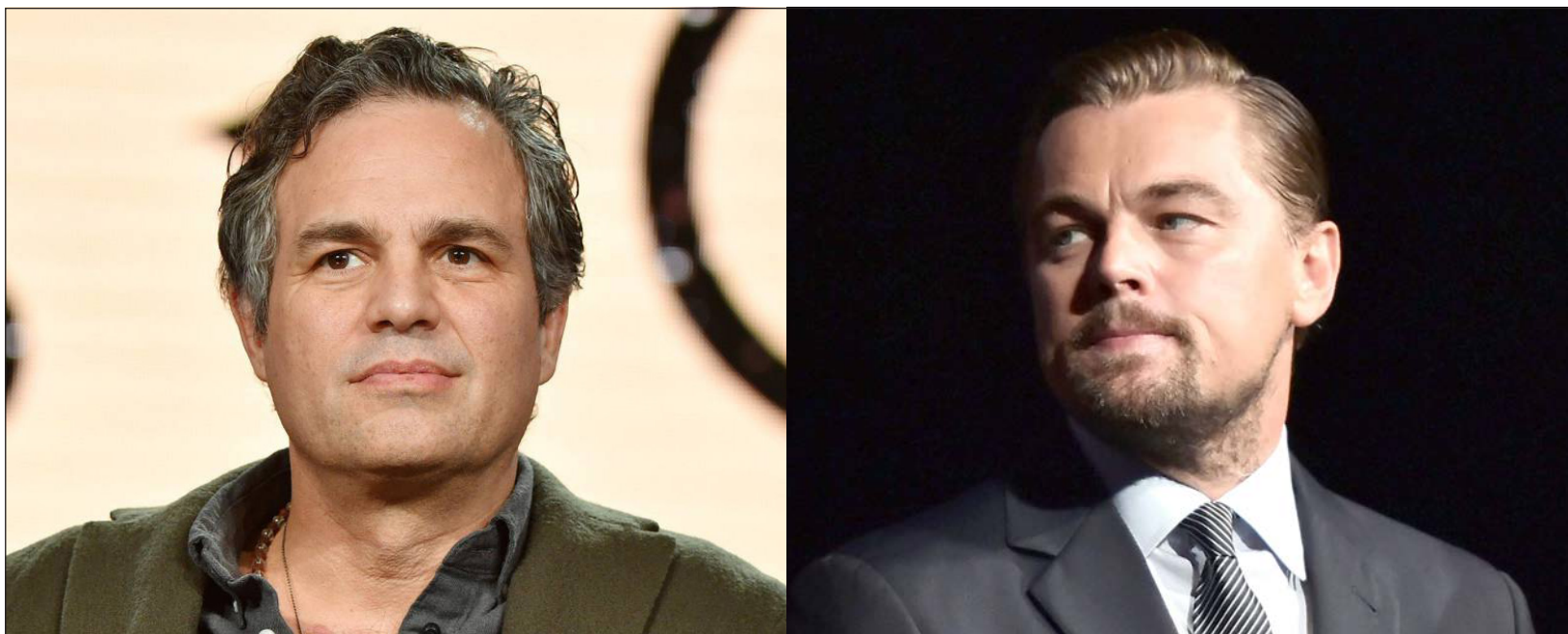
▲ Las tierras indígenas han sido invadidas, registradas y quemadas impunemente, señalan las celebridades, entre las que se encuentran nombres como Mark Ruffalo y Leonardo DiCaprio.