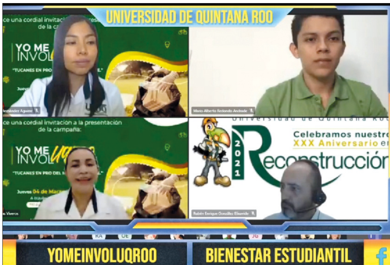
▲ La presentación de la campaña se realiza en el marco de la conmemoración del 30 aniversario de la UQROO y del Día de la Naturaleza.

También se abordaron la definición de algunos términos como la sensación, percepción, sentimiento, emoción, enojo, miedo, alegría y tristeza les afecta y como puede servir para su desenvolvimiento en la vida diaria.