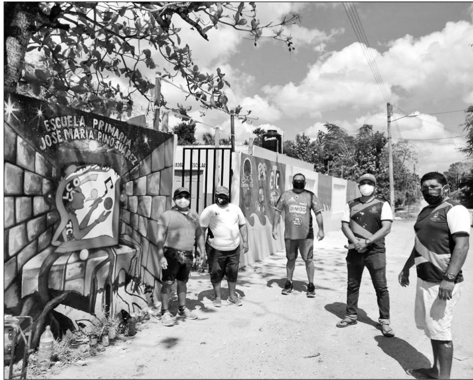
▲ Las labores de restauración se realizaron bajo protocolos sanitarios para evitar contagios.

Bajo los protocolos sanitarios para evitar contagios por Covid-19, la SEQ informó que seguirán trabajando para que los centros escolares se encuentren en