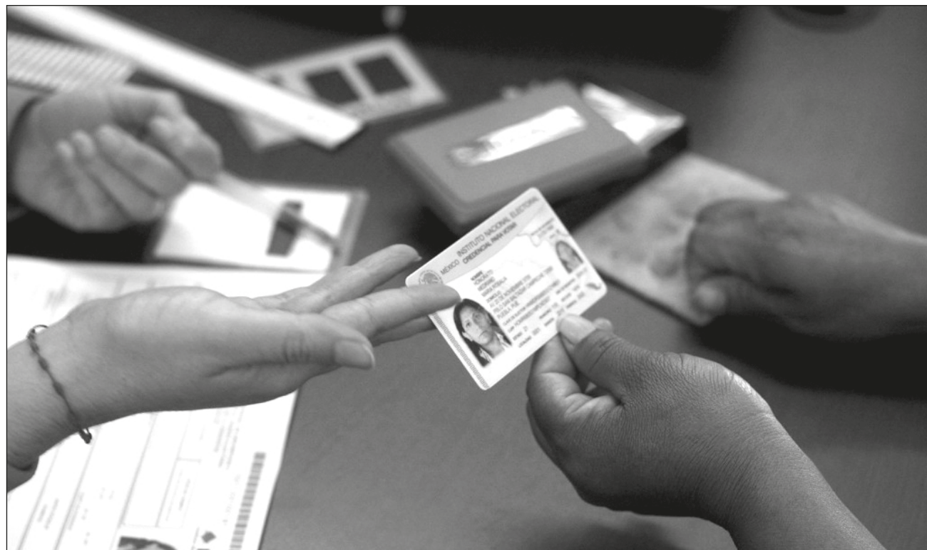
▲ En Yucatán hay un millón 641 mil 64 votantes registrados ante el Instituto Nacional Electoral.

Mientras, las extraordinarias son destinadas para atender a residentes que por alguna condición de vías de comunicación o socioculturales es de difícil acceso.