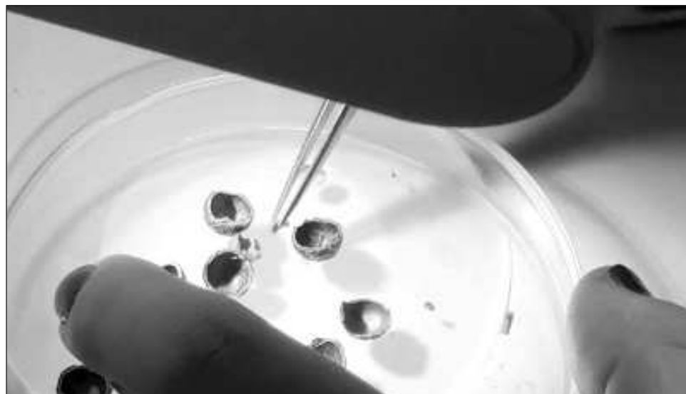
▲ El objetivo del espacio es resguardar las semillas para que las especies no desaparezcan y que sea viable reintroducirlas en su hábitat en caso de que sea necesario para evitar la pérdida de vegetación.

Para lograrlo, los guardianes de la biodiversidad mexicana salen una vez al mes a recolectar semillas a las sierras, valles y montañas