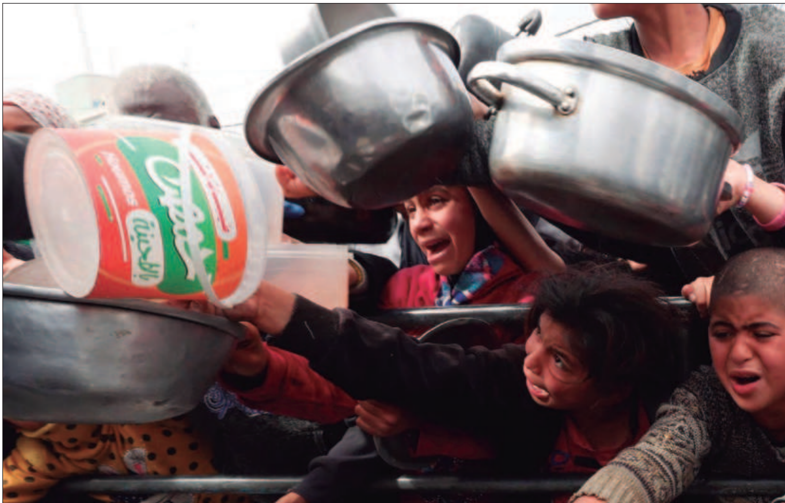
▲ “No debemos olvidar que el primer ministro israelí, Benjamín Netanyahu, antes del 7 de octubre pasado enfrentaba una serie de manifestaciones contra su gobierno; lo que muestra cómo la industria de la guerra y sus estrategias mediáticas sirven para dominar a los pueblos”.