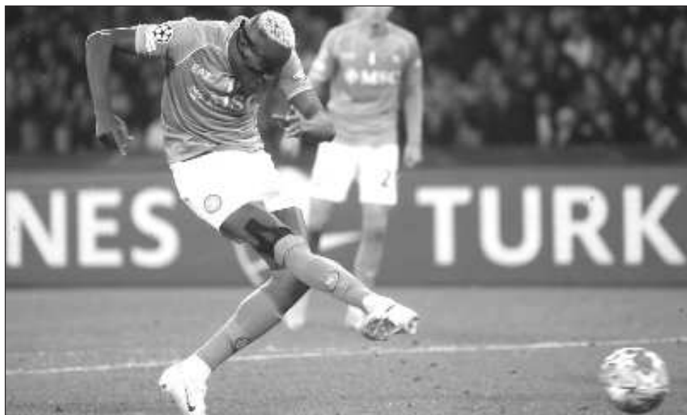
▲ Víctor Osimhen anota el gol con el que el Napoli rescató un empate ayer ante el Barcelona.

"Jugando así tenemos muchos números para pasar. Hemos hecho muy buen partido, aunque nos desajustamos con el gol", dijo el técnico azulgrana Xavi Hernández. "Hemos estado muy bien y el equipo ha hecho méritos para ganar. Me voy satisfecho, pero con la sensación amarga de que, viendo el