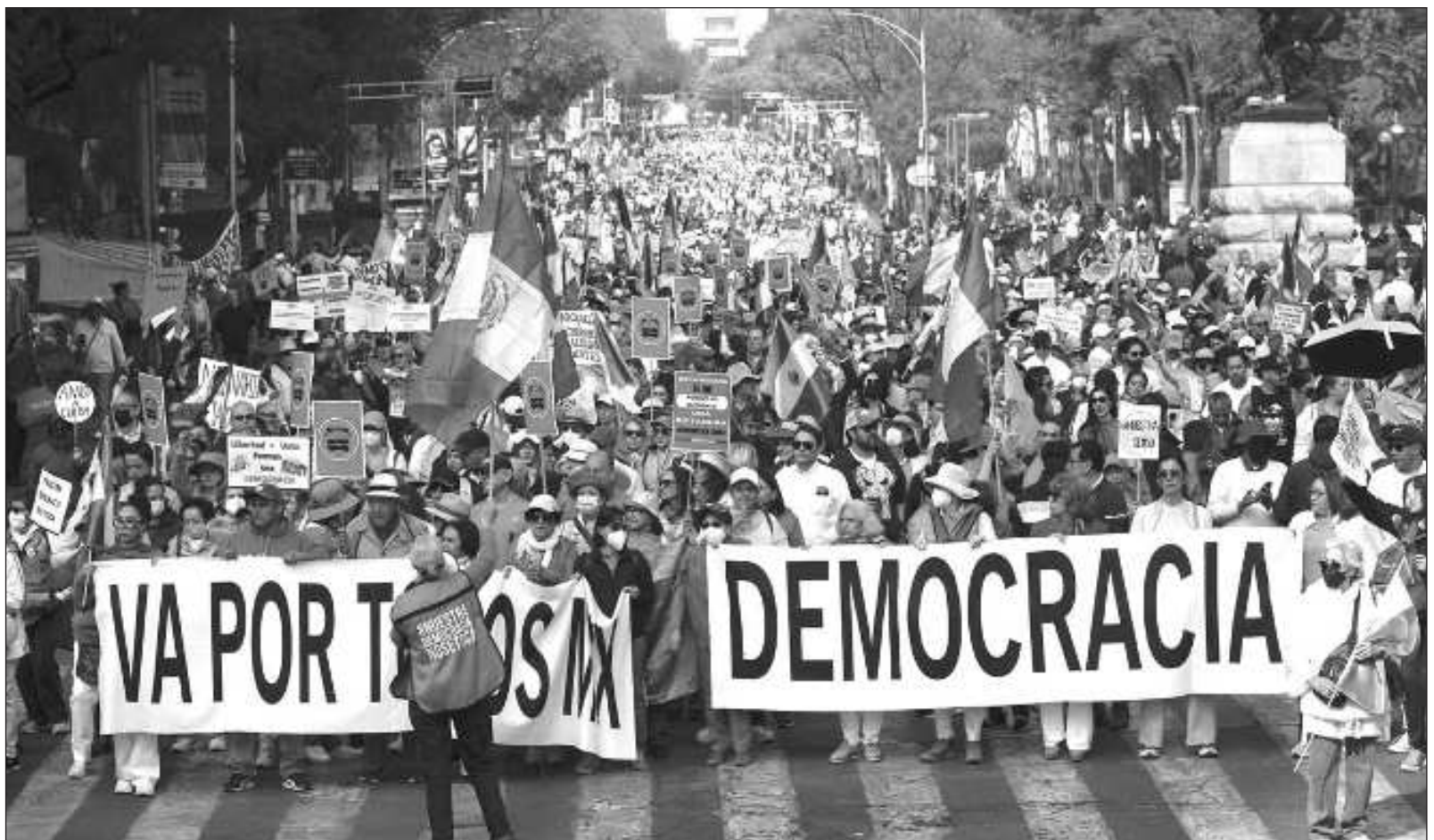
▲ "Nadie impidió a la 'marea rosa' reunirse, manifestarse y tomar el Zócalo de la Ciudad de México, ni hacer lo propio en varias ciudades del país", por lo que es absurdo "denunciar una dictadura que sólo existe en la narrativa impuesta por los organizadores de la marcha".