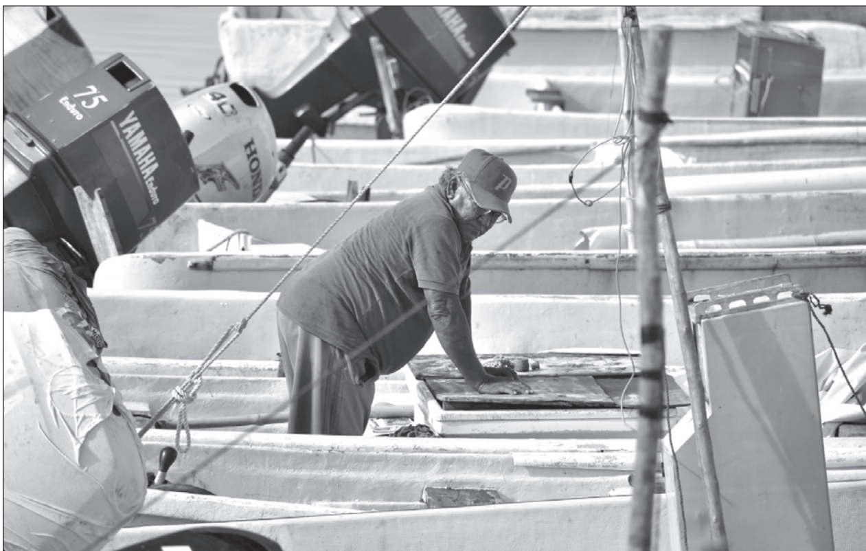
▲ El presidente de la Canainpesca destacó que los pescadores han solicitado apoyos, programas, proyectos y subsidios al gobierno federal, pero éstos se han negado a ocupar correctamente los recursos presupuestales disponibles.

Se trata de tres sujetos que viajaban a bordo de un automóvil y fueron interceptados por agentes de la SPSC. Se les decomisó un arma de fuego de uso exclusivo de las fuerzas armadas por lo que fueron puestos a disposición de la Fiscalía Federal en el Estado de Campeche, pero también ante la fiscalía estatal por el delito de robo con violencia de acuerdo con la denuncia presentada por la gerencia de la gasolinera asaltada.