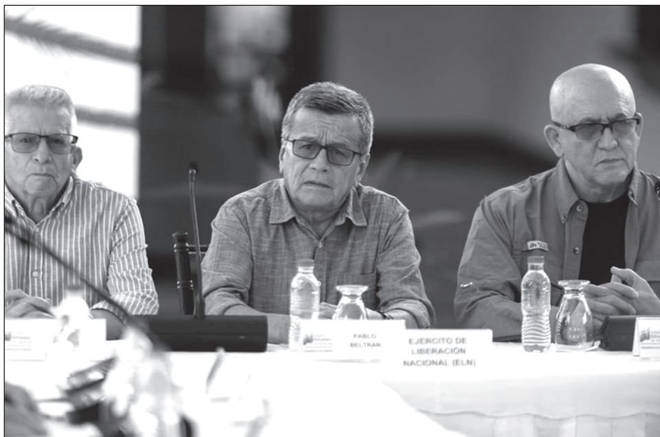
▲ En un comunicado fechado el 19 de febrero, la guerrilla acusó al gobierno de Gustavo Petro de “acciones violatorias a lo pactado en la Mesa de Conversaciones”.

En armas desde 1964, el ELN tiene una fuerza de