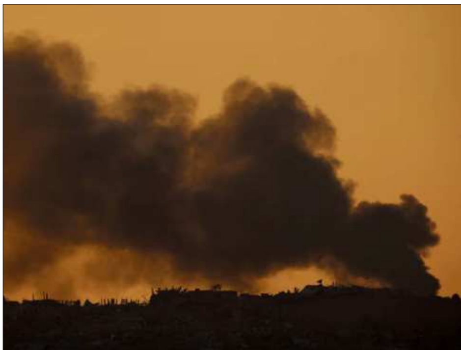
▲ "¿En qué mundo vivimos cuando la gente no puede obtener comida o agua, o cuando los trabajadores sanitarios se arriesgan a ser bombardeados mientras salvan vidas?", preguntó Tedros al denunciar las atrocidades que están ocurriendo en Gaza.

Tedros denunció que la agencia de la ONU que provee ayuda alimentaria no tiene acceso al norte de Gaza y que desde que empezó la guerra en Gaza, el pasado 7 de octubre, la malnutrición grave ha pasado de 1 por ciento a más de 15 por ciento y que la situación empeorará a medida