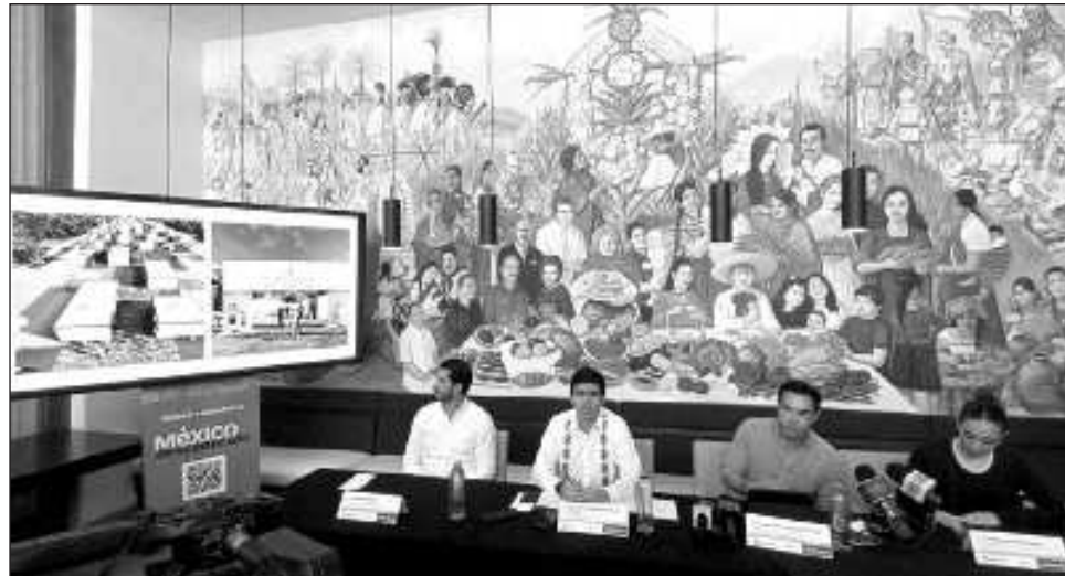
▲ El subsecretario de promoción de la Secretaría de Turismo puntualizó que “es un evento por demás importante en el marco del 50 aniversario de Quintana Roo y que más allá de las actividades, suma mucho a la identidad que tanto se ha buscado en Cancún”.

El evento ya pasó por Cabildo, por lo que quedó estipulado que se llevará a cabo los próximos años y que tendrá espacio para