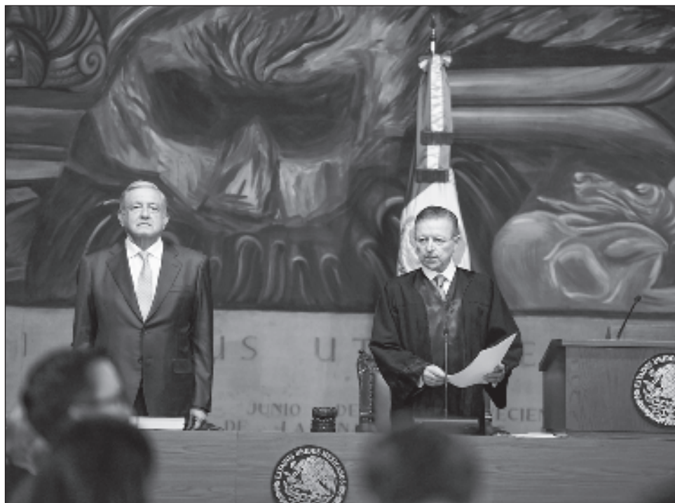
▲ El Presidente consideró que cuando estaba el ministro Arturo Zaldívar al frente de la Suprema Corte había más recato y apoyaba cuando se le alertaba de una eventual liberación.

—Sí, sí. En muchos otros casos si hubiera estado Zaldívar difícilmente se le descongelan las cuentas a la esposa de (Genaro) García Luna, Zaldívar no hubiese contratado a un asesor de García Luna que trabaja ahora de ayudante de la presidente Norma Piña.