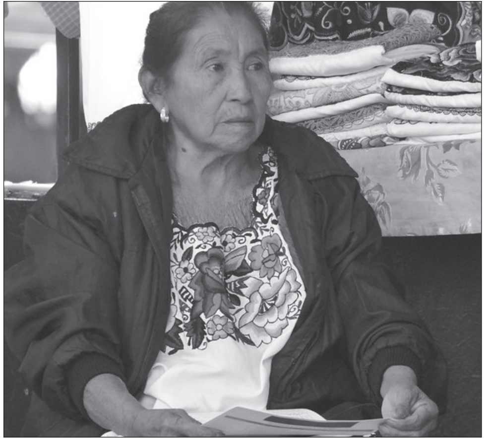
▲ Protección Civil informó que las condiciones frías van a durar cuatro días.

Los termómetros marcarán temperaturas máximas en el mencionado periodo de los 24° a los 33° Celsius, en tanto que las mínimas persistirán de 13° a 16°C en el cono sur, en particular en los municipios de Ticul, Oxkutzcab, Tekax, Peto, Tixmehuac, Teabo, Chikinzonot y Cantamayec, entre otros.