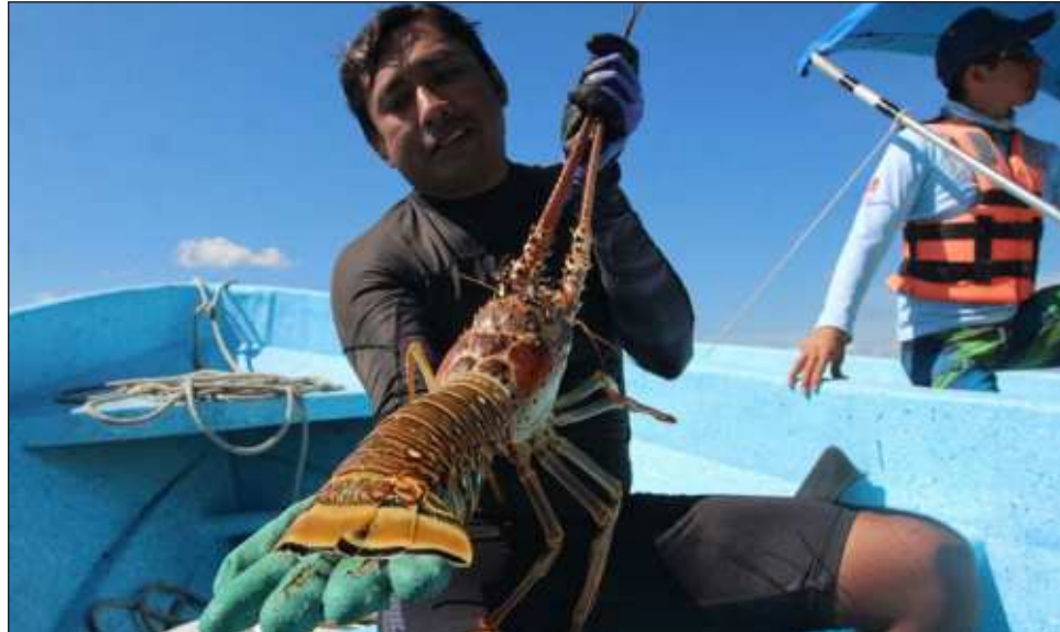
▲ La meta para la temporada 2023-2024 era obtener 60 toneladas de langosta; a pocos días de que comience la veda, los pescadores sólo han capturado 52.

Dijo que estas condiciones del clima son algo que no habían experimentado desde 1968, cuando comenzó esta práctica pesquera en esta comunidad,