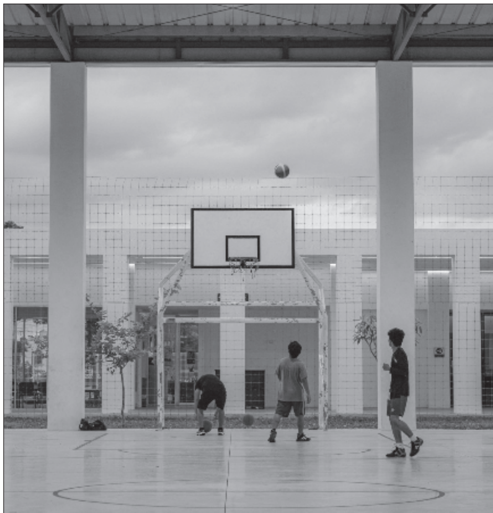
▲ Los dos proyectos son el Centro de Capacitaciones y Biblioteca y Parque Cantaritos, y el Centro de Desarrollo Comunitario El Papa, así como el parque con el mismo nombre.

Con estos galardones la Sedatu suma ya 188 premios y reconocimientos nacionales e internacionales a proyectos de infraestructura que benefician a las colonias más vulnerables del país.