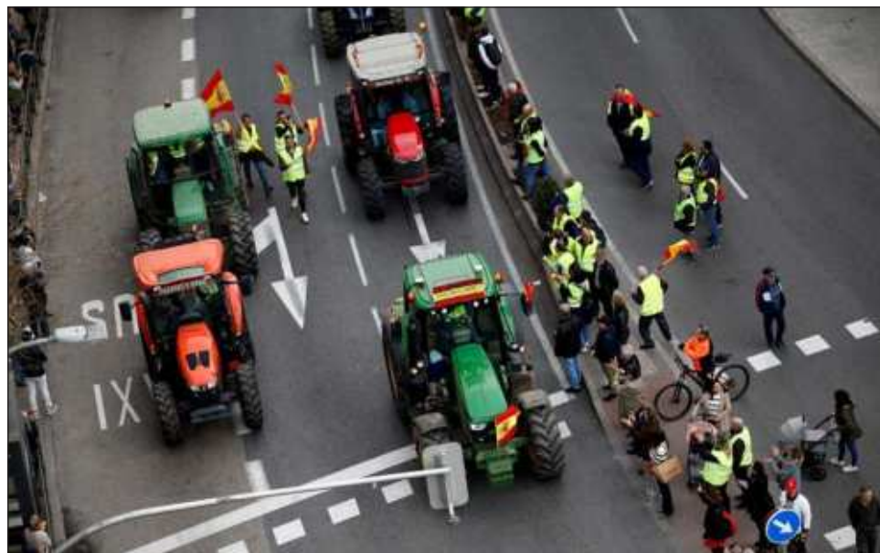
▲ Los agricultores advirtieron que no acabarán con sus movilizaciones hasta que no se atiendan sus demandas, como la regulación de las ayudas por las secuelas de la sequía y las modificaciones de calado en la normativa europea y tratados internacionales.

Madrid, que hasta ahora sólo había sido penetrado por un reducido grupo de agricultores previa autorización oficial, vivió un día de caos y colapso de tráfico. Desde cinco columnas, procedentes de distintos puntos de la geografía del país, fueron entrando a la ciudad centenares de tractores