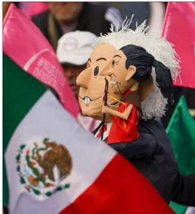
▲ El clima de sospecha de que el narco participa en las elecciones presidenciales, ¿no sería un indicio de que ya controla la política y que se encuentra inmiscuido en todos los partidos?

El escenario electoral de este año no es en realidad muy distinto del que ha habido anteriormente. Ya Francisco I. Madero mencionaba en su libro La sucesión presidencial en 1910 que si los mexicanos pretendían transitar hacia un régimen de-