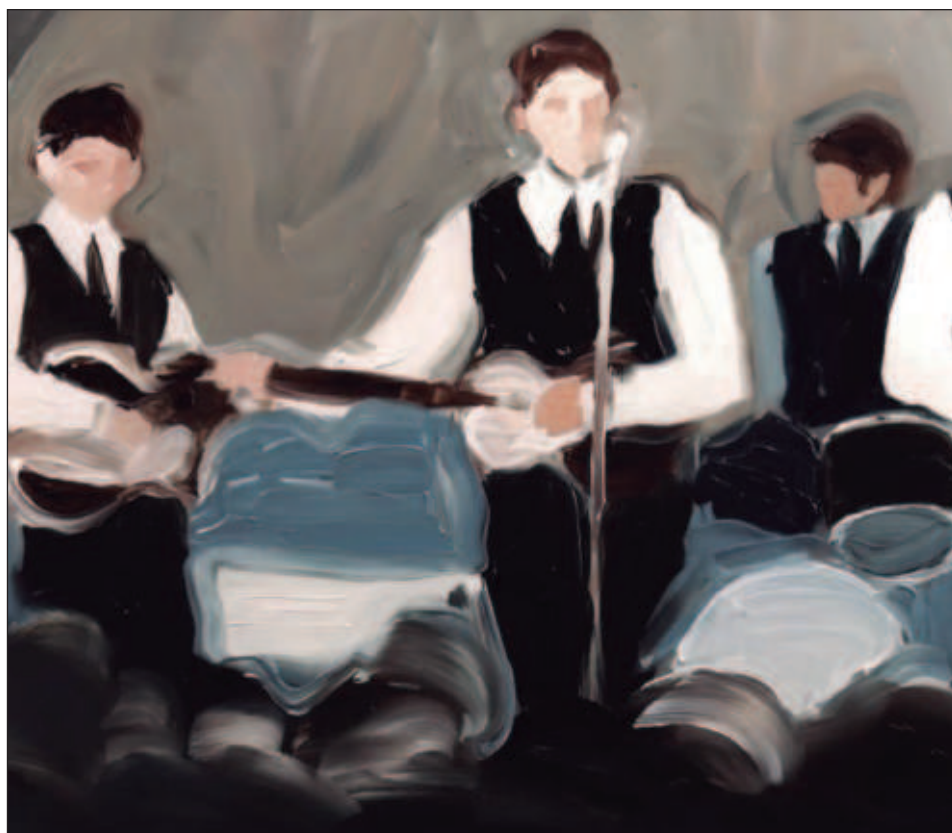
▲ La productora Pippa Harris aseguró que su objetivo "que sea una experiencia cinematográfica única, emocionante y épica: cuatro películas, abordadas desde cuatro visiones diferentes que cuentan una sola historia sobre la banda más célebre de todos los tiempos".

"Me siento honrado de contar la historia de la mejor banda de rock de todos los tiempos, y emocionado de desafiar la noción de lo que constituye un viaje al cine", señaló Mendes en un comunicado.