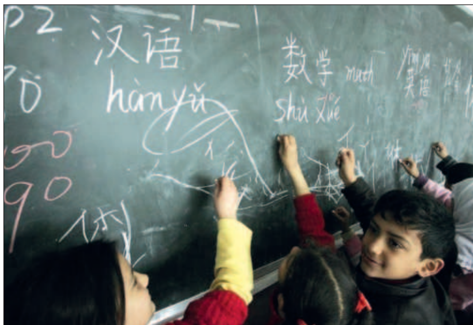
Cada dos semanas desaparece una lengua, lo cual merma el patrimonio cultural del mundo, y casi la mitad de las 6 mil lenguas que se calcula perviven están en peligro de extinción.

El proyecto pretende reconocer a quienes son parte de esas comunidades como sujetos de derecho público