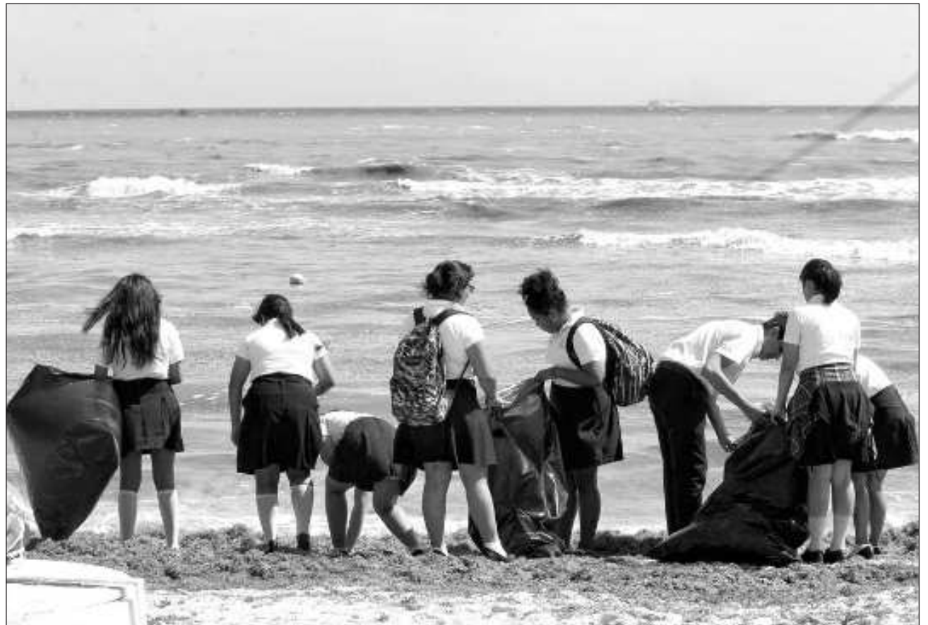
▲ A partir de la pandemia, los casos de ansiedad, estrés y depresión aumentaron en los adolescentes.

“En un momento en donde por naturaleza el adolescente tendría que separarse de su núcleo familiar para buscar su propia identidad, la pandemia los