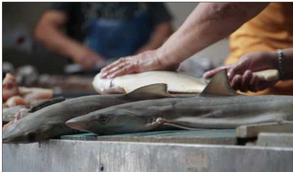
▲ Señalan que esta temporada hubo buenas capturas, por lo que hay variedad.

Explicó que pese a la complicada situación económica que se reciente en la isla por el incumplimiento de pago por parte de Petróleos Mexicanos (Pemex) a sus proveedores, que impacta en el muni-