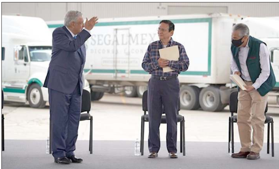
▲ Al ser cuestionado sobre la permanencia del titular de Segalmex, López Obrador respondió que “si no hay pruebas, si no se comprueba que se cometió delito, no se puede juzgar a nadie”.

Mientras antes “operaban” con impunidad, “ahora ya no,