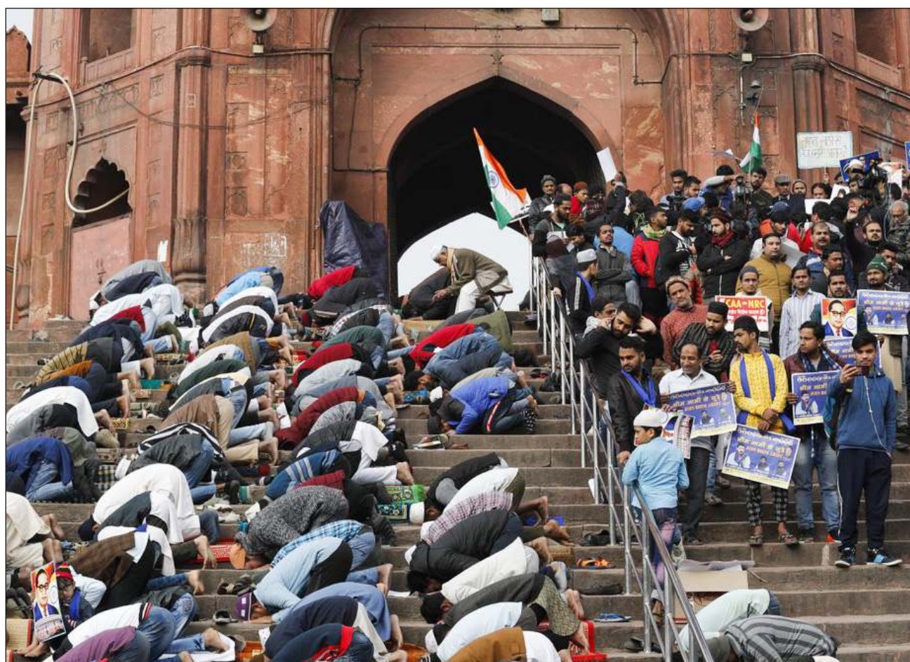
▲ La aprobación en el 2019 de la Ley de Enmienda de la Ciudadanía provocó una ola de violencia de la mayoría hindú contra la población musulmana en la India.

“Las autoridades deben procesar a los responsables de la violencia y dejar de