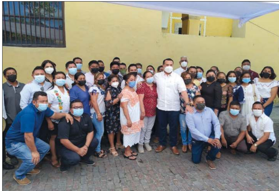
▲ El alcalde asistió a la celebración del Día Internacional de la Lengua Materna y el aniversario del Instituto Municipal para el Fortalecimiento de la Cultura Maya.

En el caso mexicano, comentó, la ley de derechos lingüísticos es contribución de el yucateco Uuc-kib Espadas Ancona, egresado de la facultad de antropología de