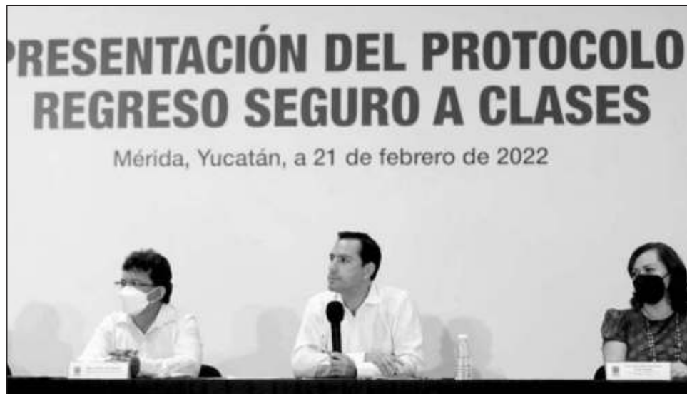
▲ A causa de la pandemia, 21.8 por ciento de la población de Yucatán se encuentra en rezago educativo, y seis de cada 10 personas entre 16 y 20 años no asisten a la escuela.