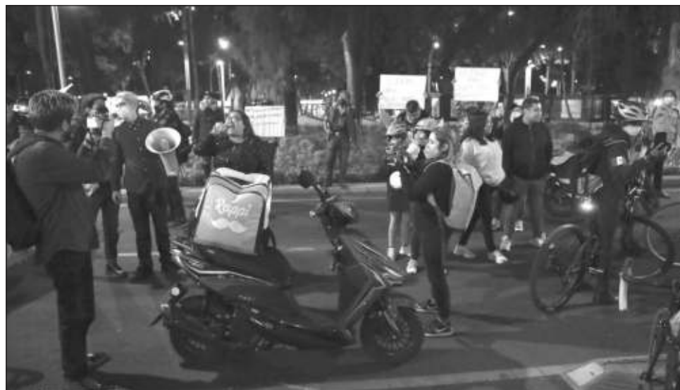
▲ Los repartidores por aplicación laboran en promedios seis días y 40 horas a la semana.

Sin embargo, Oxfam aseguró que la situación económica de estas personas es de alta vulnerabilidad y posibilidad de caer en pobreza, ya que de las mil personas que entrevistaron para el estudio, casi 50 por ciento reportó que realizó un "gasto catastrófico por accidente o enfer-