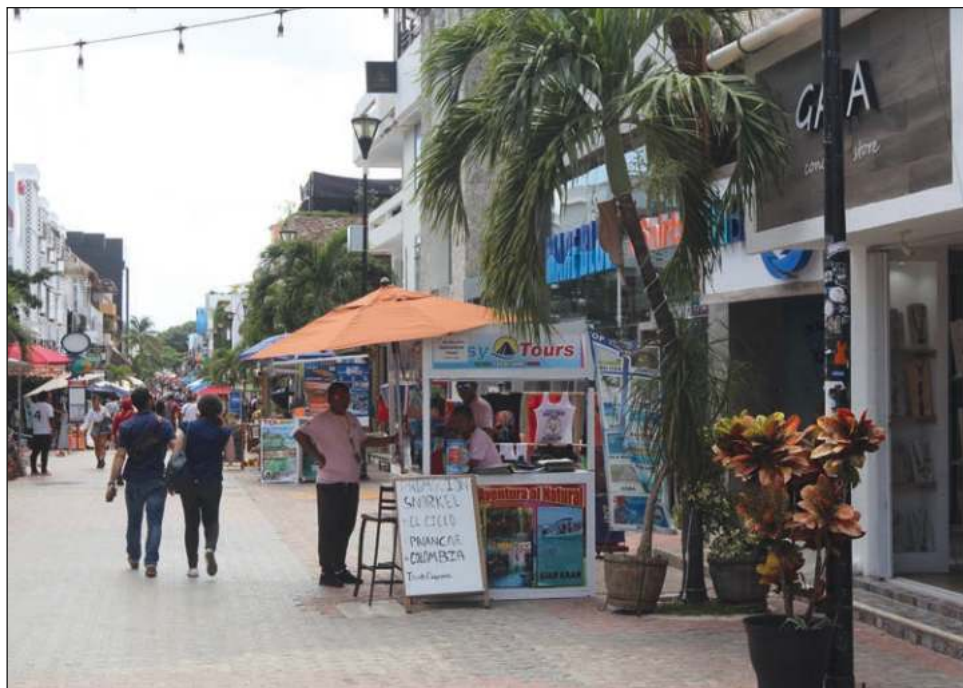
▲ El impacto mayor se dio en el sector de restaurantes y servicios de alojamiento, con un aumento de 49 mil personas.

Los ocupados en micro-negocios incrementaron en 38 mil personas, con un incremento en los que no cuentan con establecimiento para operar. La población subocupada registró 59 mil personas en el trimestre en cuestión. La tasa