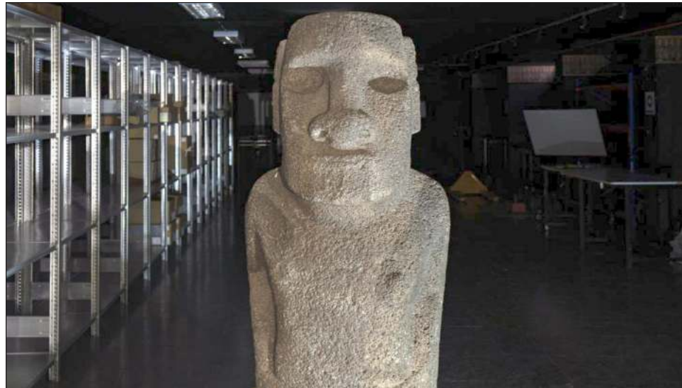
▲ El moai fue tallado en roca basáltica y pesa 715 kilos; para su traslado, el Centro Nacional de Conservación y Restauración de Astilleros y Maestranzas de la Armada construyó una nueva base de metal, lo que sumado al embalaje especial de protección supondrán un peso de mil 255 kilos.

El retorno, que se concretará en un desplazamiento en barco desde el puerto de Valparaíso el 28 de febrero, se enmarcará en el Programa de Repatriación Ka Haka Hoki Mai Te Mana Tupuna , que trata de restituir a la isla que se sitúa a cinco horas de vuelo del territorio continental chileno “los cuerpos de sus ancestros, sus objetos sagrados y funerarios”. Para los isleños los moai representan el espíritu