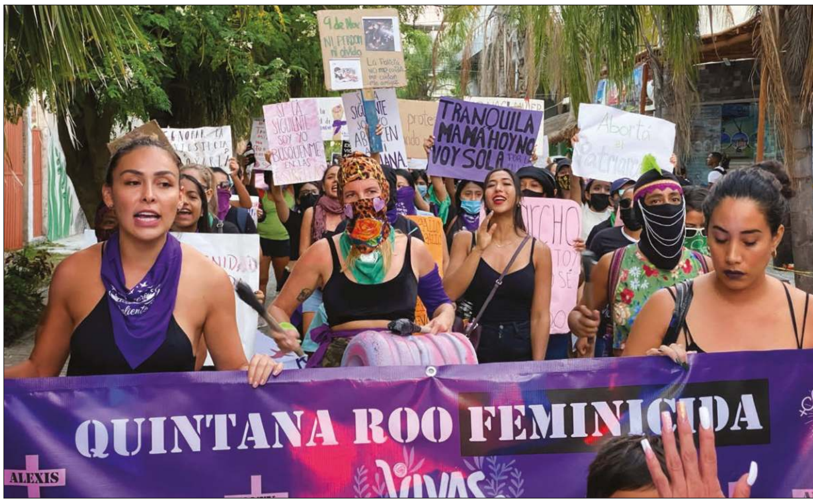
▲ La gran mayoría de las mujeres victimizadas guarda silencio. No sienten que hay las condiciones para recibir una verdadera justicia ni que la violencia disminuya o se extinga.