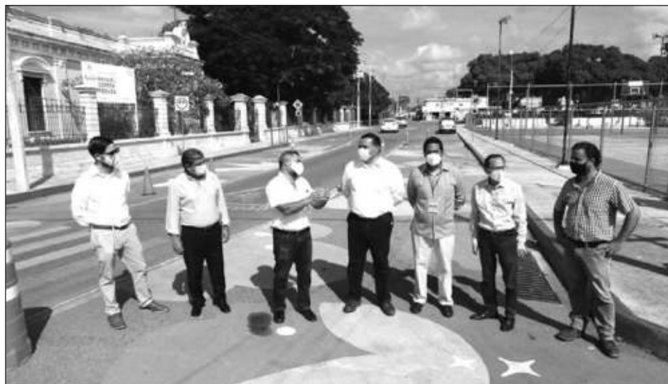
▲ Renán Barrera informó que Mérida fue seleccionada como una de las cuatro ciudades de Latinoamérica que mantiene acciones para proteger a peatones.

En su mensaje, Barrera Concha resaltó que Mérida es una ciudad que cuida a su población, con el impulso de acciones y estrategias para proteger la salud de peatones y conductores. “Seguiremos trabajando año con año con