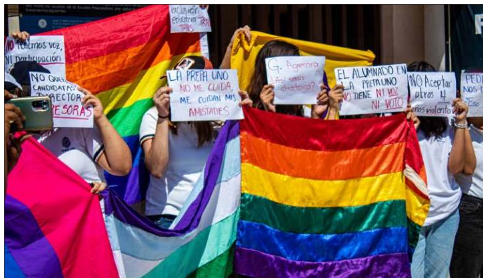
▲ El reclamo de los estudiantes es dar cumplimiento al pliego petitorio que entregaron la semana pasada, que incluye una disculpa pública de la institución.

Aseguró que el alumnado quiere estudiar y llegar hasta la vida universitaria, pero esto solo