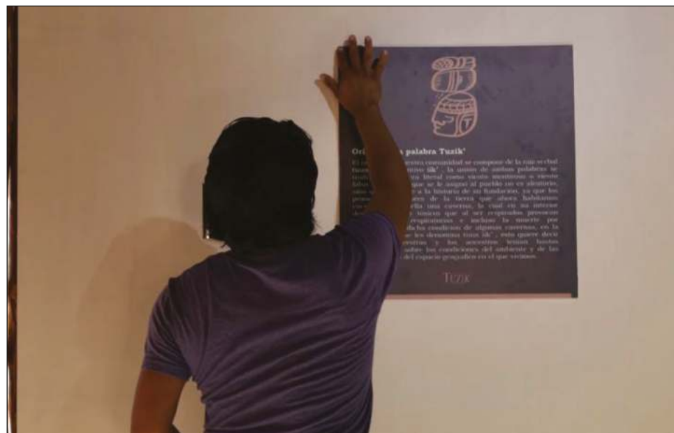
▲ Tras cinco años de investigación, se llevó a cabo la inauguración de la Fototeca Tuzik, proyecto encabezado por jóvenes originarios de la comunidad.

Comentó que fue significativo para todas y todos los habitantes, y el equipo que construyó este espacio, adicionado a que desde el 2017 se han dedicado a investigar y documentar la historia de su comunidad a través de las