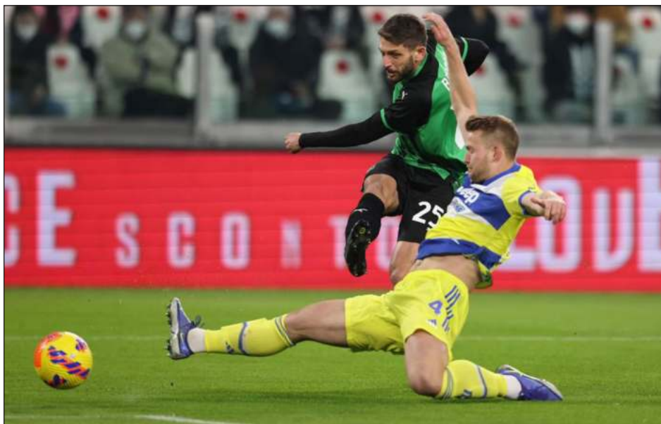
▲ Juventus, cuarto lugar en la Serie A, visita hoy al Villarreal.

El entrenador Thomas Tuchel necesita que Romelu Lukaku sea más incisivo. Fuera de sus dos goles