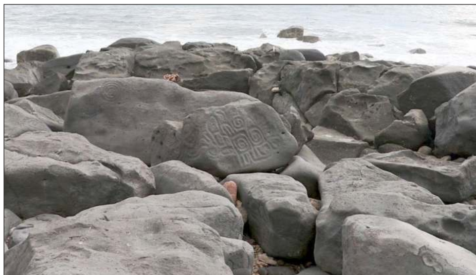
▲ Pese a la falta de recursos, arqueólogos del INAH continúan estudiando los petrograbados y trabajan en la museografía de una sala introductoria.

El arqueólogo del INAH señala que el principal hallazgo fue explorar el área, así como registrar, clasificar e interpretar los petrograbados; definir sus características tipológicas e integrar toda la información: primero en una planimetría y