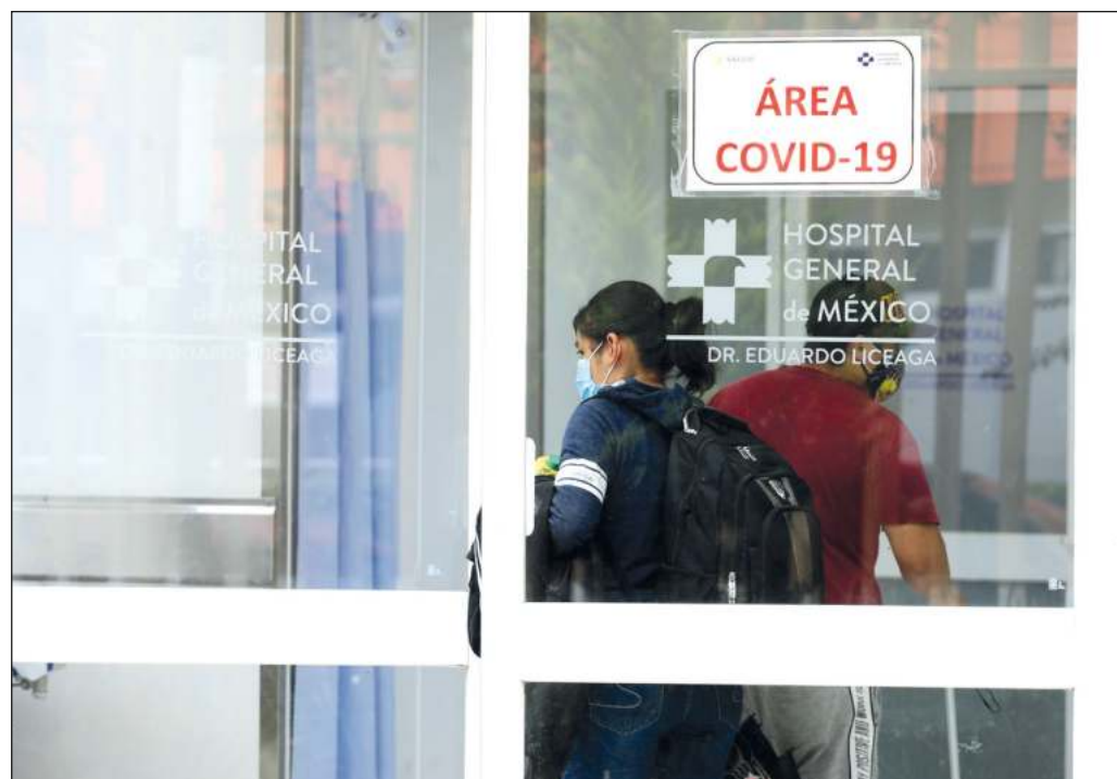
▲ Las irregularidades en los procesos de adquisición de diversos insumos que requiere el sector salud deben ser esclarecidas y, en su caso, sancionadas.

En términos generales, pues, y habida cuenta de la situación por la que atravesó México en 2020, puede afirmarse que las irregularidades reportadas por la ASF en los procesos de adquisición del sector salud fueron mínimas. Al margen de su escala y monto, es necesario investigar cada peso de los faltantes y de las afectaciones al presupuesto.