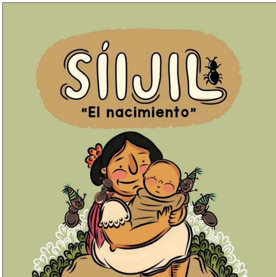
▲ Cada cuento es un elemento que irá nutriendo el ser maya; por eso empezaron desde el nacimiento.

“Si bien es un ejercicio político, creo que los usuarios tenemos que pasarlo a una política de lenguaje. Yucatán y nosotros los mayas tenemos mucho por hacer. Tenemos que ser nosotros quienes comiencen a ejercitar el uso de la lengua; y obligar al estado a la apertura para ello”, concluyó.