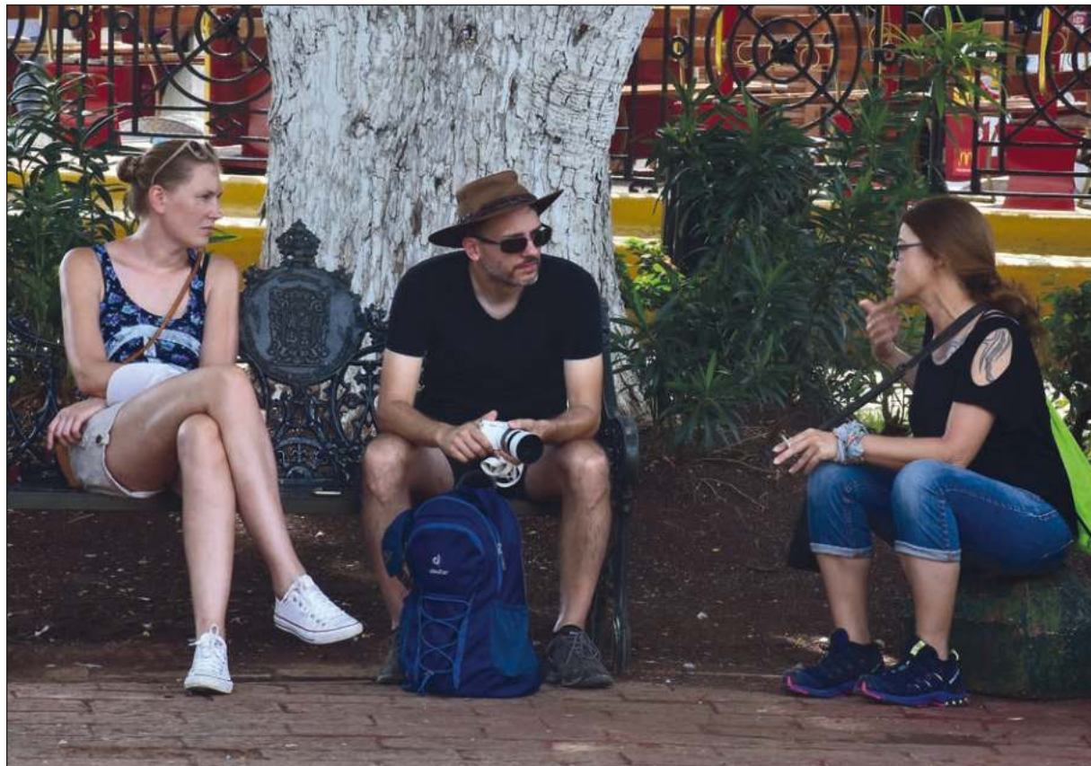
▲ Cada cultura representa un conjunto de valores único e irremplazable, ya que las tradiciones y formas de expresión de cada pueblo constituyen su manera más eficaz de manifestar su presencia en el mundo.

Y nuestro reconocimiento parte de nuestra propia Constitución, que reconoce el carácter plurilingüe de España, siendo cooficiales varias lenguas (el aranés, el catalán, el euskera, el gallego y el valenciano), y declara que la riqueza de las distintas modalidades lingüísticas de