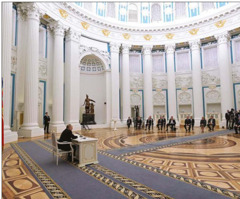
▲ Los países miembros del Consejo de Seguridad, salvo China e India, aseguraron que hubo un atentado contra la integridad territorial y soberanía de Ucrania.

La sesión terminó sin ningún acuerdo y sin que el bloque de los países aliados de Estados Unidos anunciara las nuevas sanciones contra Rusia que hoy prometieron desde sus respectivas capitales y que supuestamente se concretarán en las próximas horas