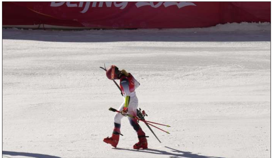
▲ Se esperaba que Mikaela Shiffrin fuera una de las estrellas de los Juegos Olímpicos, pero la esquiadora se fue de Beijing con las manos vacías.

Tras la experiencia de Beijing, el COI tiene 29 meses para oprimir el botón de re-