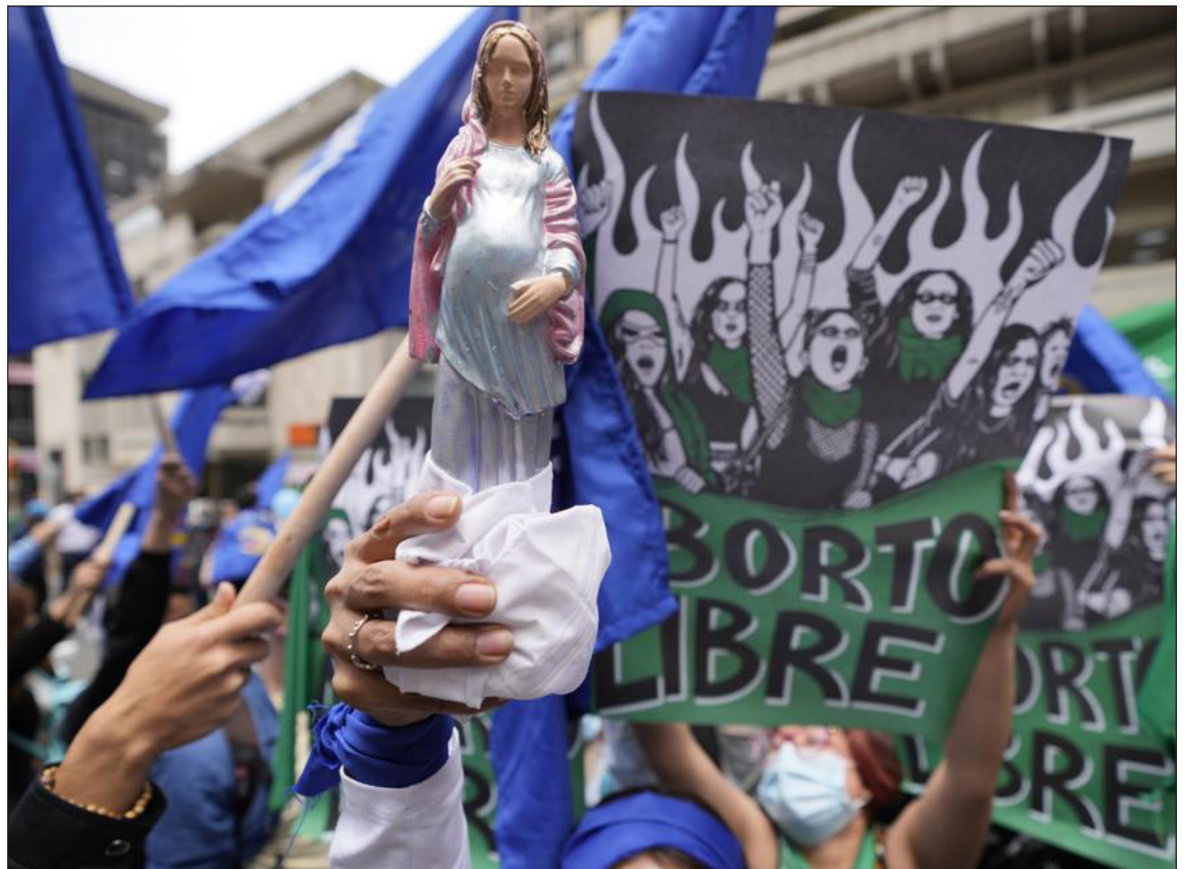
▲ La despenalización fue aceptada en sesión extraordinaria por cinco votos a favor y cuatro en contra.

Hasta la fecha el aborto sólo estaba permitido en Colombia por tres causas: cuando está en riesgo la salud o la vida de la madre, cuando es fruto de violación o incesto, o si hay malformación del feto, mientras que en el resto de casos está penado hasta con cuatro años y medio de cárcel.