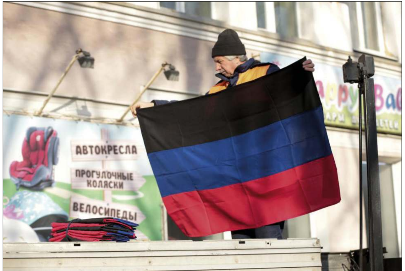
▲ El presidente ruso, Vladimir Putin, reconoció la independencia de la República Popular de Donetsk y la República Popular de Lugansk, con cuyos líderes firmó sendos tratados de amistad y asistencia mutua este lunes.

Putin tomó esta decisión después de recibir este lu-