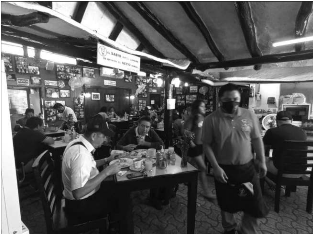
▲ Para algunos hoteleros y comerciantes, es importante conservar los protocolos sanitarios como el uso de cubrebocas y la sana distancia.

Los Servicios Estatales de Salud hacen un llamado a la población para continuar con las medidas de prevención, como el uso obligatorio y correcto del cubrebocas, el lavado frecuente de manos con agua y jabón o la desinfección con alcohol gel, la sana distancia y respetar los aforos.