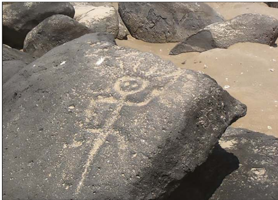
▲ Con casi 700 grabados rupestres, Las Labradas es un testimonio alucinante de los antiguos pobladores.

Con casi 700 grabados rupestres, entre representaciones humanas estilizadas, círculos concéntricos, espirales, cruces, y un importante número de figuras abstractas, de diversos diseños y tamaños, Las Labradas es un testimonio alucinante de los antiguos pobladores cuyos tesoros naturales,