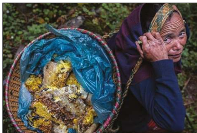
▲ Apicultores extraen el fluido en las montañas de Nepal y para llegar a él deben escalar grandes distancias, que pueden resultar peligrosas.