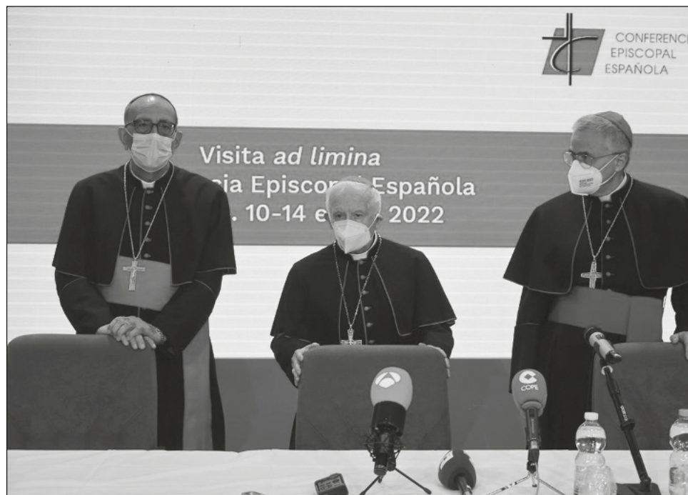
▲ En España, la iglesia católica ha descartado una investigación exhaustiva sobre la pederastia en su seno.

El despacho Cremades & Calvo Sotelo también ayudará a “establecer un sistema de prevención que satisfaga las demandas sociales al respecto”, agregó la CEE, quien convocó una rueda de prensa el martes para dar detalles del alcance de la auditoría independiente.