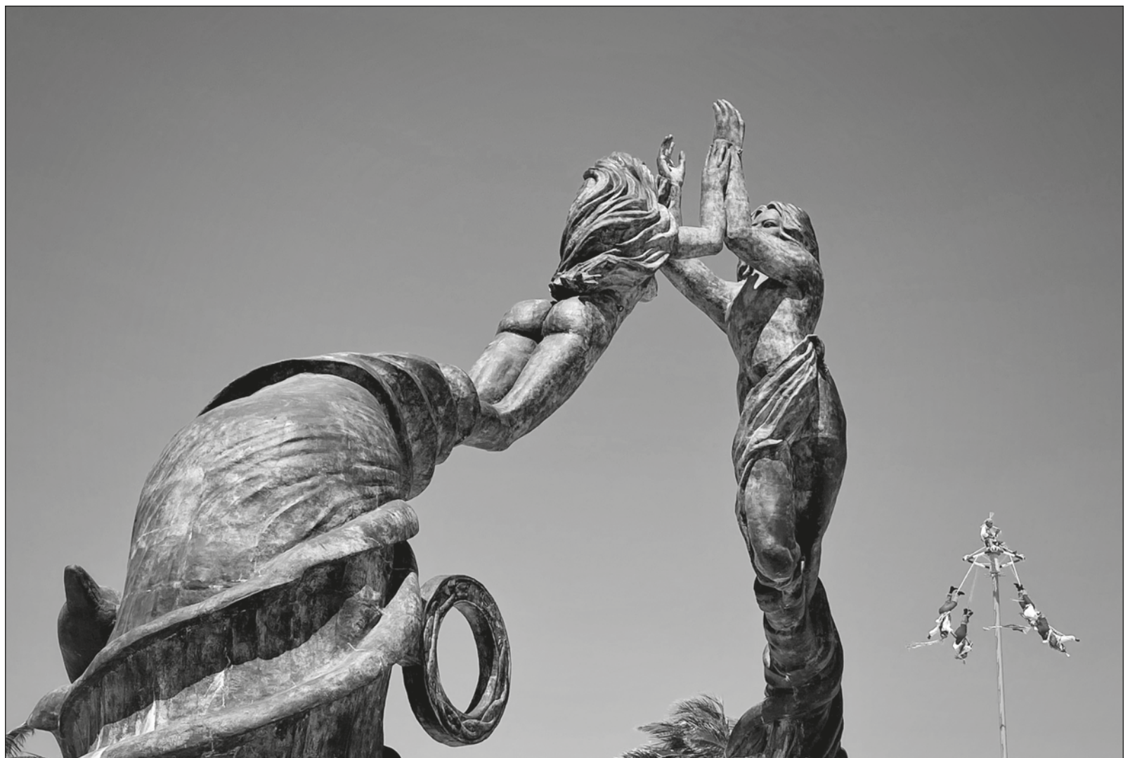
▲ Los voladores de la Papantla política, dispuestos al salto desde la veleta, no saben vivir de otra cosa; nunca lo han hecho.