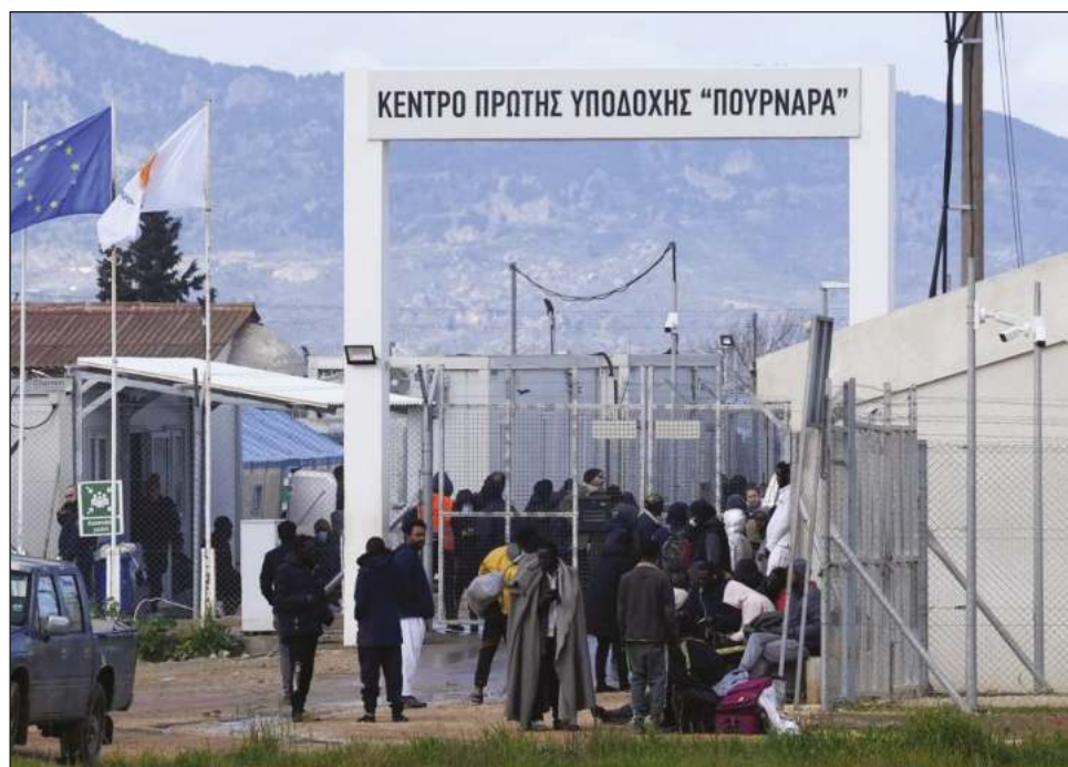
▲ La ACNUR manifestó tener registro de 540 incidentes de retornos informales de migrantes desde Grecia, tanto de las fronteras terrestres como marítimas.

El alto comisionado de la ACNUR, Filippo Grandi, denunció “el número creciente