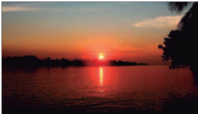
▲ “¿Cómo podemos conservar bosques y selvas bajo un modelo que está presentando erosión y el avance de la mancha urbana?”.

Un decreto de Área Natural Protegida sobre su territorio no modificará su estilo de vida, es decir, abrirán monte para sembrar, cortarán árboles para construir o venderán tierras para obtener ganancias. Solamente que la comunidad reciba ganancias iguales o superiores a lo recibido por sus actividades convencionales se dedicará a la conservación y protección del territorio. Esta situación se encarece en las áreas protegidas cercanas a las urbes o zonas turísticas,