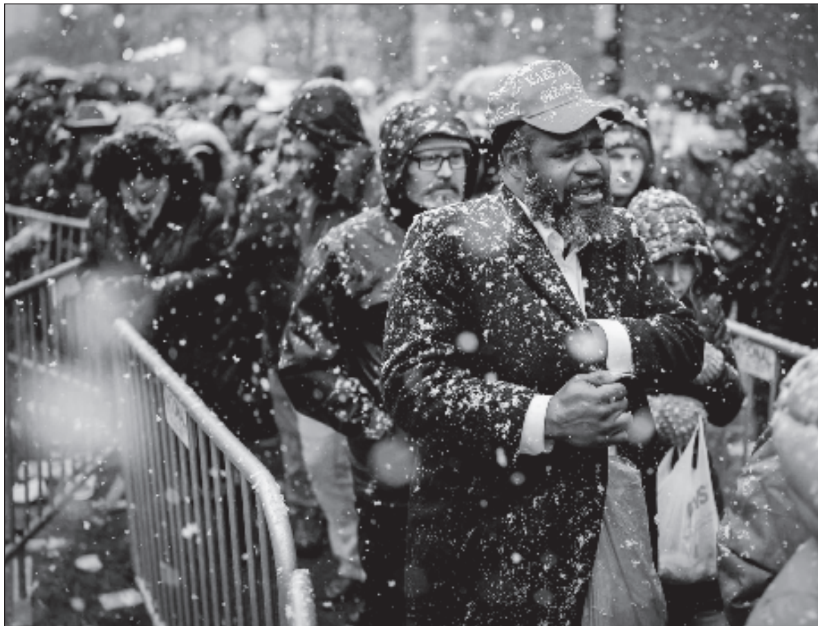
▲ "MAGA es la expresión del nacionalismo blanco estadounidense. La nostalgia de los tiempos en que una América de mayoría eurodescendiente, anglosajona y protestante definía la identidad estadounidense".

¿Cómo? Distorsionando su significado y oponiendo nuestra propia MAGA a la MAGA trumpista. ¿Y cuál es nuestra MAGA? La que conforman las iniciales de cuatro