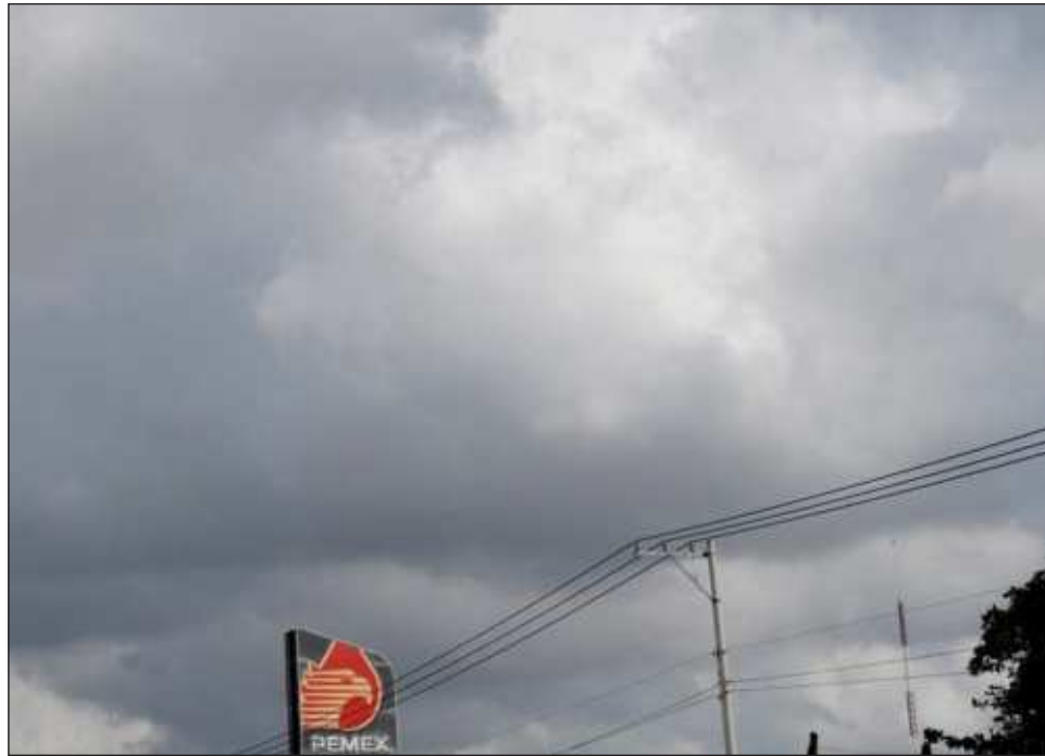
▲ Confió en que el Plan de Pagos de propuesto por la presidenta de México, Claudia Sheinbaum Pardo, se cumpla, dispersando en este mes de enero un abono más sustancial.

Indicaron que es necesario continuar con el giro de la