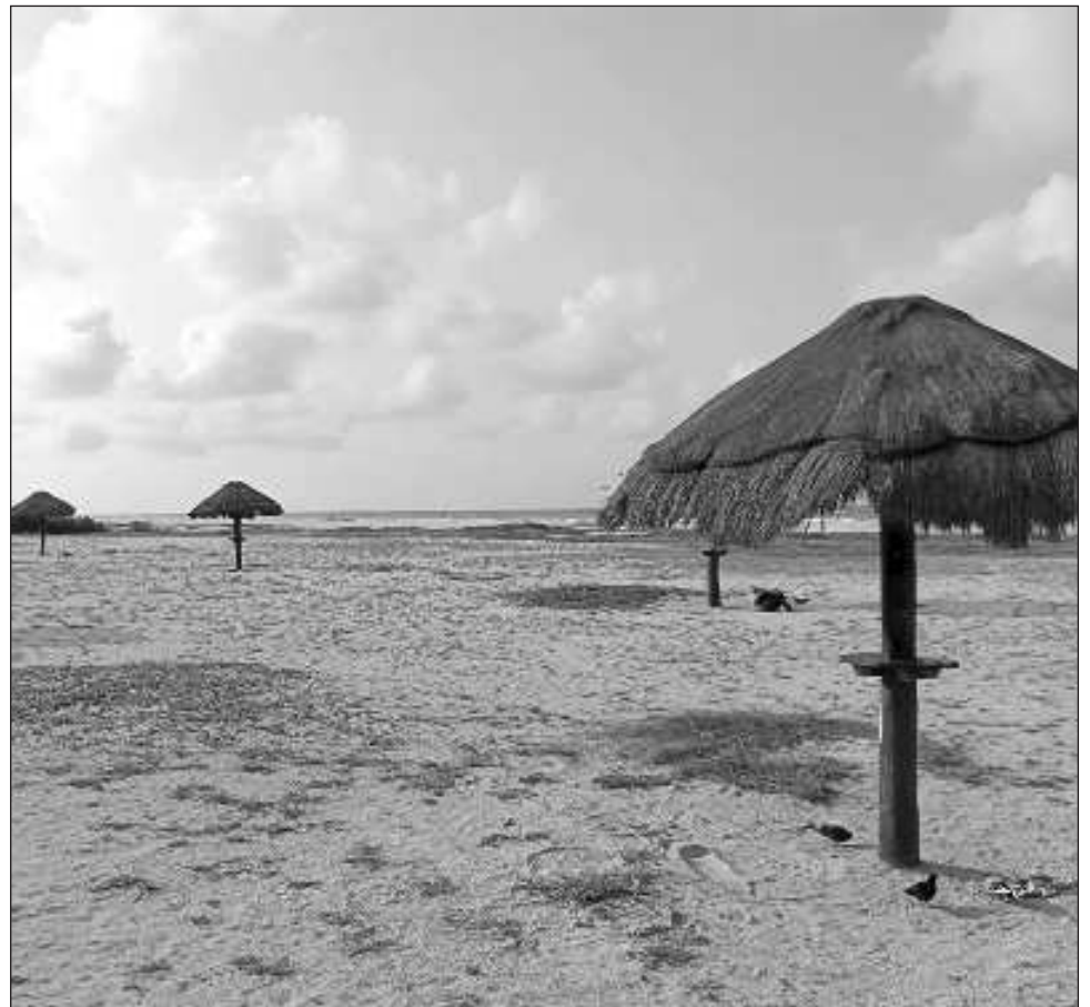
▲ Integrantes de la familia pidieron a las autoridades de Medio Ambiente y de Protección de la Fauna Silvestre que investiguen el comportamiento de estas aves.

Al respecto, alertaron a las autoridades de Medio Ambiente y de Protección de la Fauna Silvestre, para que investiguen el comportamiento de estas aves y eviten en la medida de lo posible, que se afecte a más