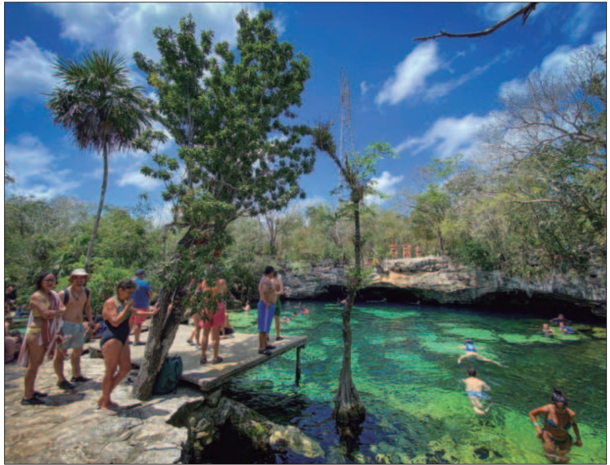
▲ “El país ha sido desde hace décadas un destino de sol y playa, en otros momentos se apostó por los destinos coloniales, pero los intereses de los viajeros por placer han cambiado y todo el sector lo sabe”.

EL PAÍS HA sido desde hace décadas un destino de sol y playa, en otros momentos se apostó por los destinos coloniales, pero los intereses de los viajeros por placer han cambiado y todo el sector lo sabe, por eso es que la idea de promoción internacional de nuestro país lleva una cimentación amigable con el medio ambiente y cultural, que comprende todo: naturaleza, biodiversidad, historia, identidad, costumbres, producción artesanal, co-