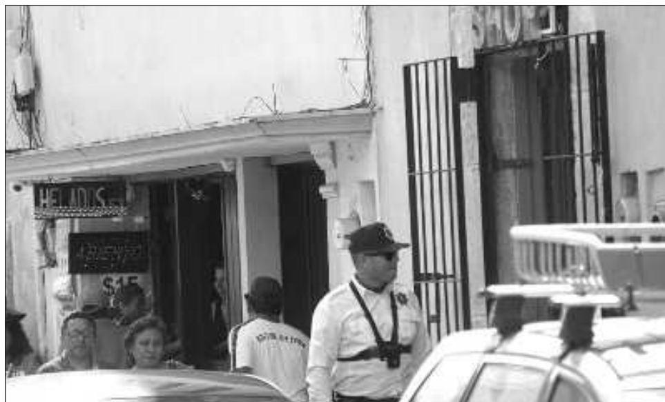
▲ Campeche tuvo 12 mil 436 incidentes delictivos, cifra mucho menor comparada con el mismo periodo del año anterior cuando fueron registrados 25 mil 849 hechos.

En el caso de Yucatán pasó de 4 mil 280 delitos