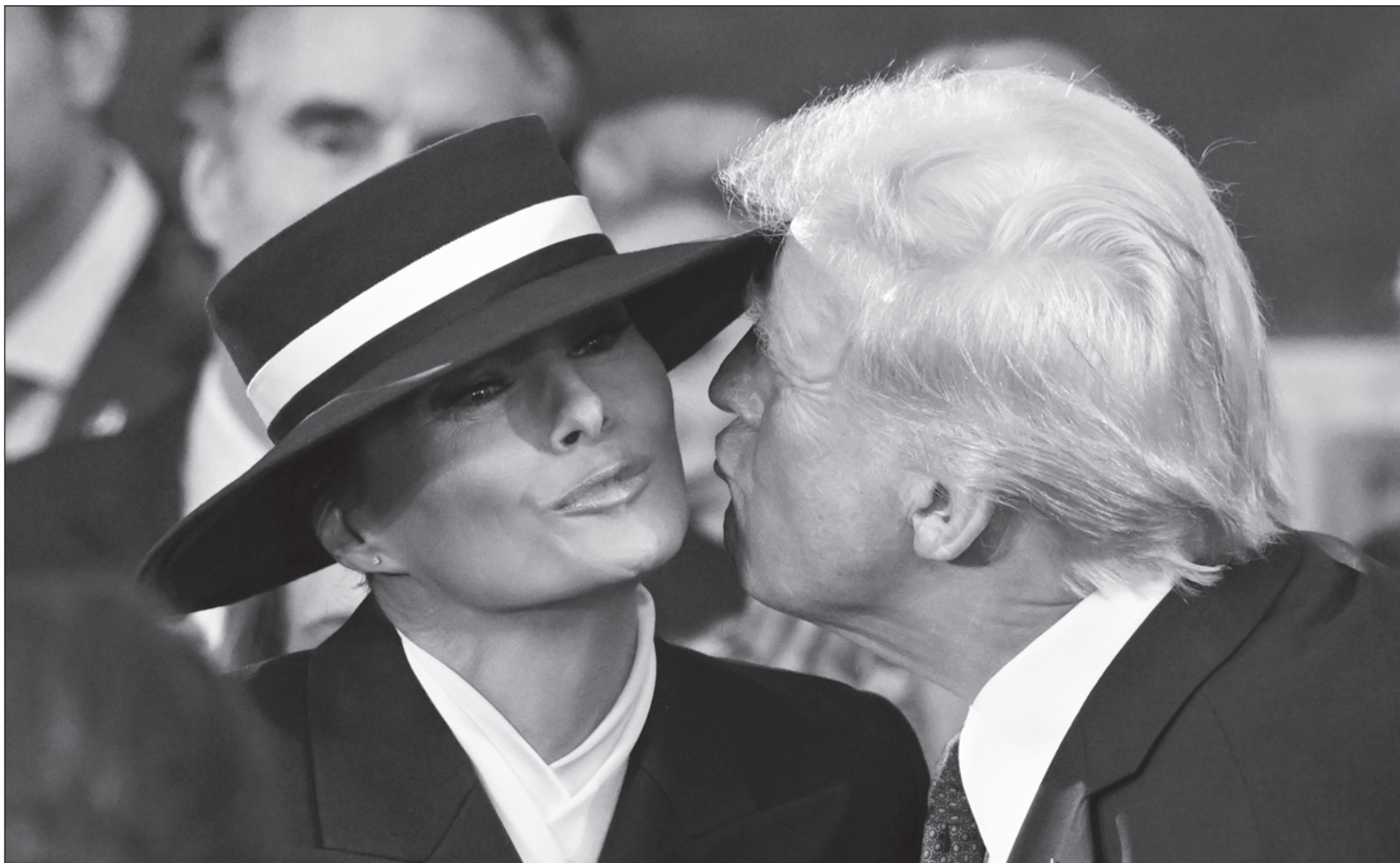
▲ “Un beso al aire, en la frontera de la nada, para que las capas de maquillaje no se deslajaran: la amenaza de un alud naranja”.