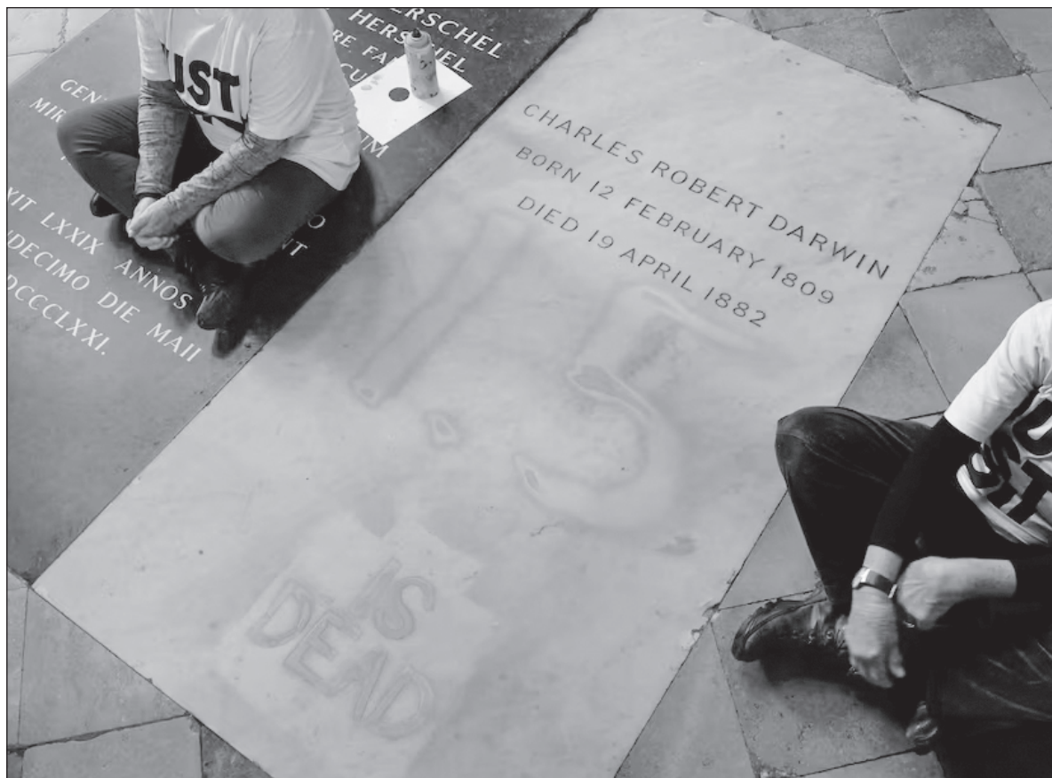
▲ “Quienes decidieron que era buena idea desfigurar la lápida del sepulcro de Darwin parecen no haber tenido en cuenta que buena parte de los que niegan la realidad del cambio climático suelen también negar la vigencia de la propuesta darwiniana de la evolución mediante selección natural o las bondades de las vacunas”.

La resiliencia de las comunidades a una circunstancia cada vez más adversa resultará cada vez más precaria, y las medidas de adaptación resultarán técnicamente más complejas, y económicamente más onerosas. A pesar de que esto se sabe más allá de toda duda razonable, los países más ricos que han sido además los responsables de la mayoría de las emisiones de gases de efecto invernadero, continúan resistiéndose a cargar con una porción equitativa de los gastos que se requieren para abatir las causas y efectos del cambio climático, y las naciones más pobres reclaman su derecho a impulsar el desarrollo de sus pueblos, con base en modelos que poco contribuyen