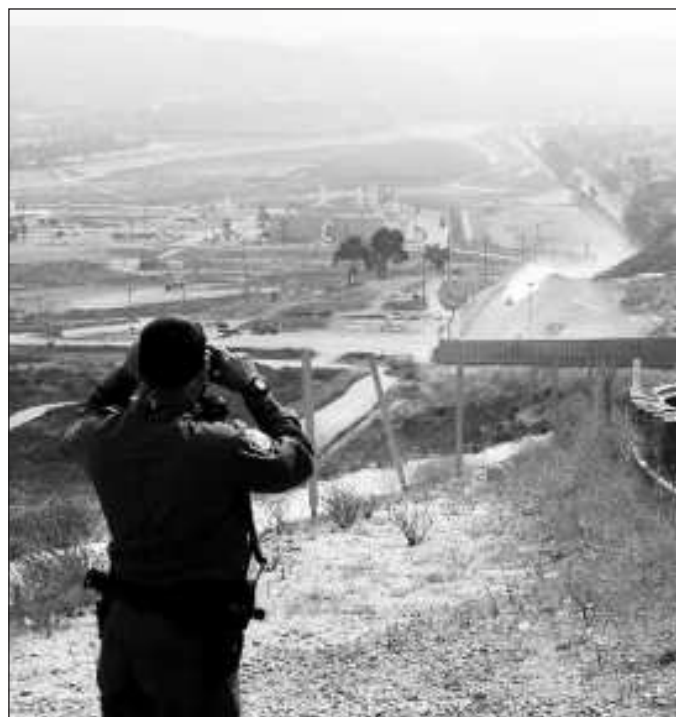
▲ La opción de que México termine siendo país de acogida es real y aquí es aquí donde no hemos escuchado qué se hará con los migrantes que pretendan establecerse.

Igualmente, el programa Quédate en México no es nuevo, pero la clave no es el cierre de la frontera y que ya no se pueda solicitar asilo a los Estados