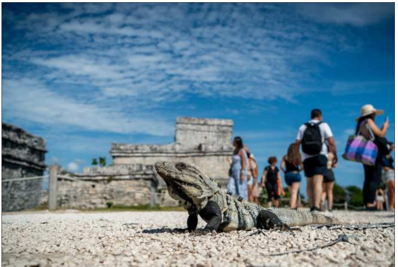
▲ En las zonas arqueológicas de Edzná y en Tulum es notable la presencia de iguanas. Los individuos de esa especie protegida por la ley discurren con elegancia entre las piedras de los monumentos.

La arqueóloga Sara Novelo comentó que en Edzná los canes acompañan a los veladores y se acercan a los turistas y custodios por custodios. "Una zona arqueológica sin perros no es zona arqueológica. La verdad no son agresivos, a menos que los veas en la noche. Se transforman: son nuestros 'huayes', nuestros espíritus protectores".