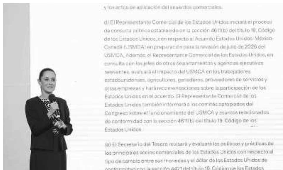
▲ La presidenta Claudia Sheinbaum publicó el decreto de estímulos fiscales para incentivar a las empresas, principalmente manufactureras, a que permanezcan en la frontera de México.

En el Artículo Quinto del Decreto que publica el gobierno federal, se establece la creación del Comité de Evaluación para la aplicación de los estímulos fiscales, el cual estará integrado por un representante de la Secretaría de Economía, uno del Consejo Asesor de Desarrollo Económico Regional y Relocalización, quien sólo tendrá voz sin derecho a voto, y uno de la Secretaría de