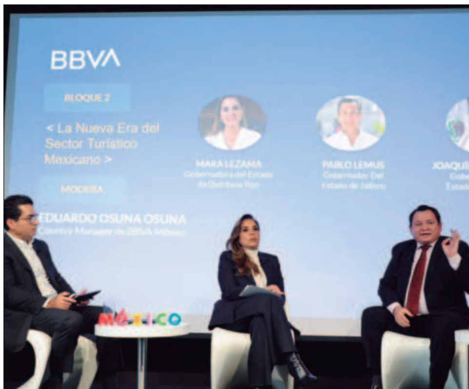
▲ Ante directivos de BBVA y empresarios españoles, el gobernador de Yucatán participó en un panel de la Feria Internacional de Turismo 2025.