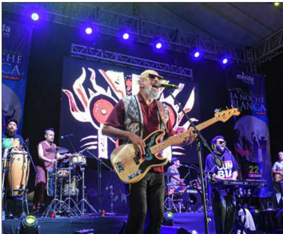
▲ La agrupación liderada por El Macha se presentará el 21 de marzo en el Sindicato Único de Filarmónicos de Yucatán (SUFY) ubicado en el barrio de Santiago.

Los boletos en pre venta se pueden conseguir en https://accesos.tusaccesos.com/tickets/en/merida-chico-trujillo