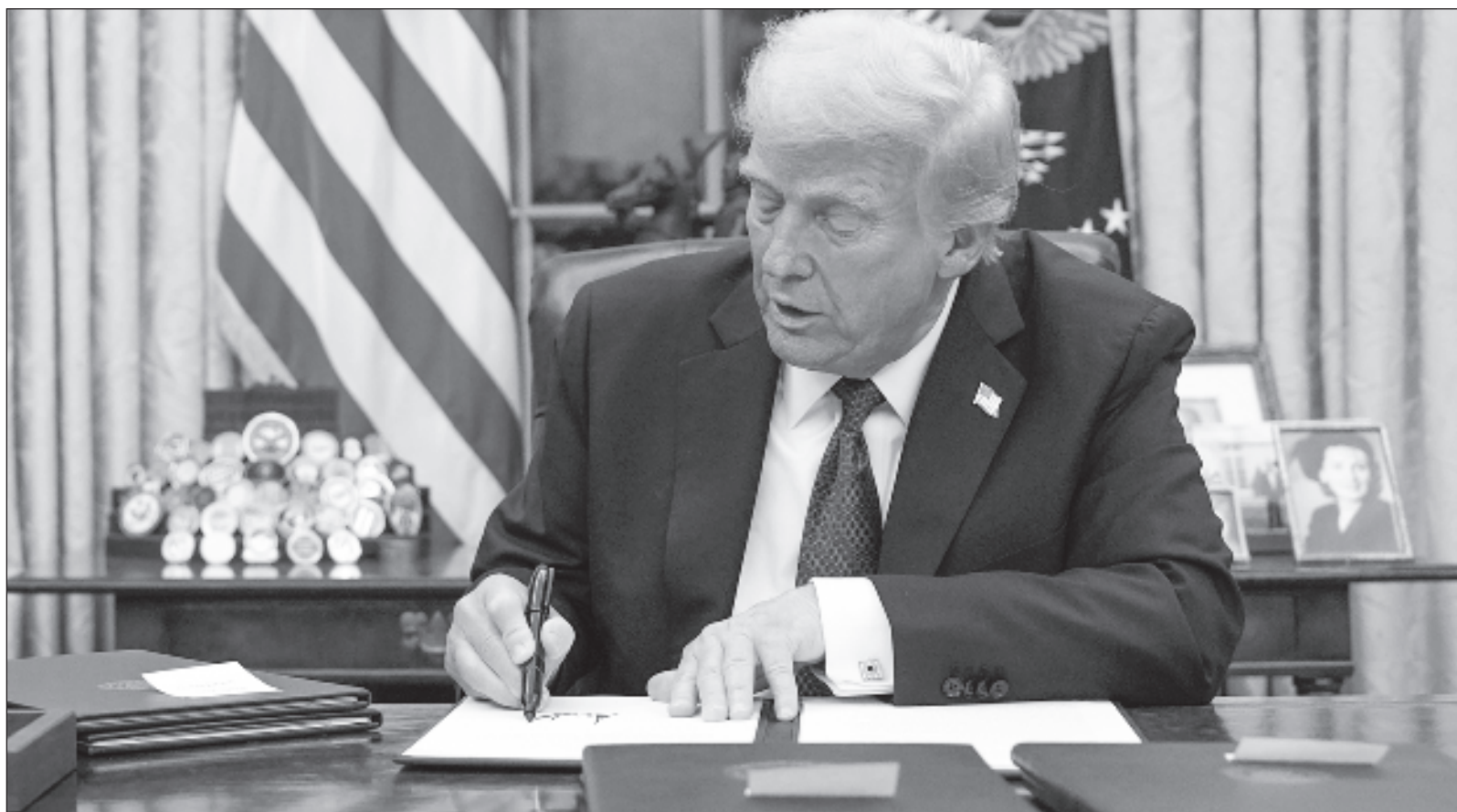
▲ “El megalómano empoderado reiteró líneas generales de su guion de chantaje a México, pero este lunes no fue notablemente más allá de lo ya previsto. El peso resistió, las deportaciones masivas aún no se producen y las acciones punitivas contra los cárteles mexicanos no iniciaron de inmediato”.