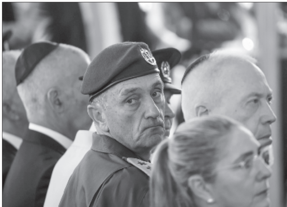
▲ El 7 de octubre de 2023, el ejército bajo la dirección de Halevi, “fracasó en su misión de proteger a los ciudadanos israelíes”: el ataque de Hamas dejó mil 210 muertos.

Halevi, de 57 años, ocupaba esta función desde diciembre de 2022.