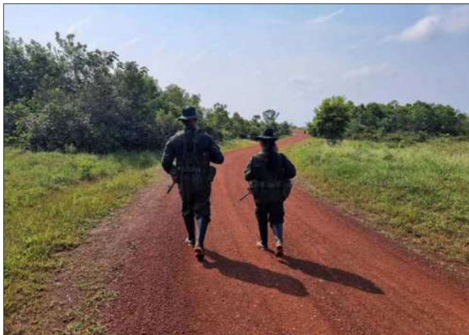
▲ El ELN ha justificado su accionar asegurando que los firmantes asesinados en los últimos días eran en realidad miembros activos de las disidencias de las FARC.

Londoño, quien en sus tiempos de guerrillero era