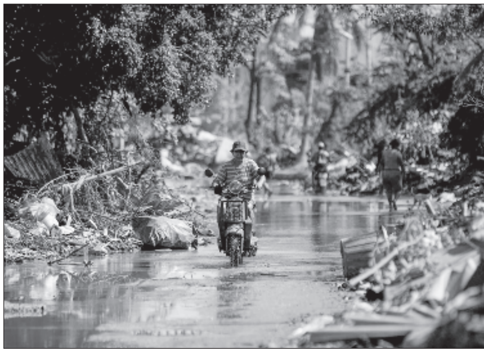
▲ López Obrador dijo que la gente empezó a trabajar para mejorar sus casas pero hace falta mano de obra calificada para terminar lo más pronto posible la reconstrucción.

En cuanto a la entrega de enseres domésticos en paquetes (que incluyen refrigerador, estufa, colchones, ventilador y vajilla), dijo