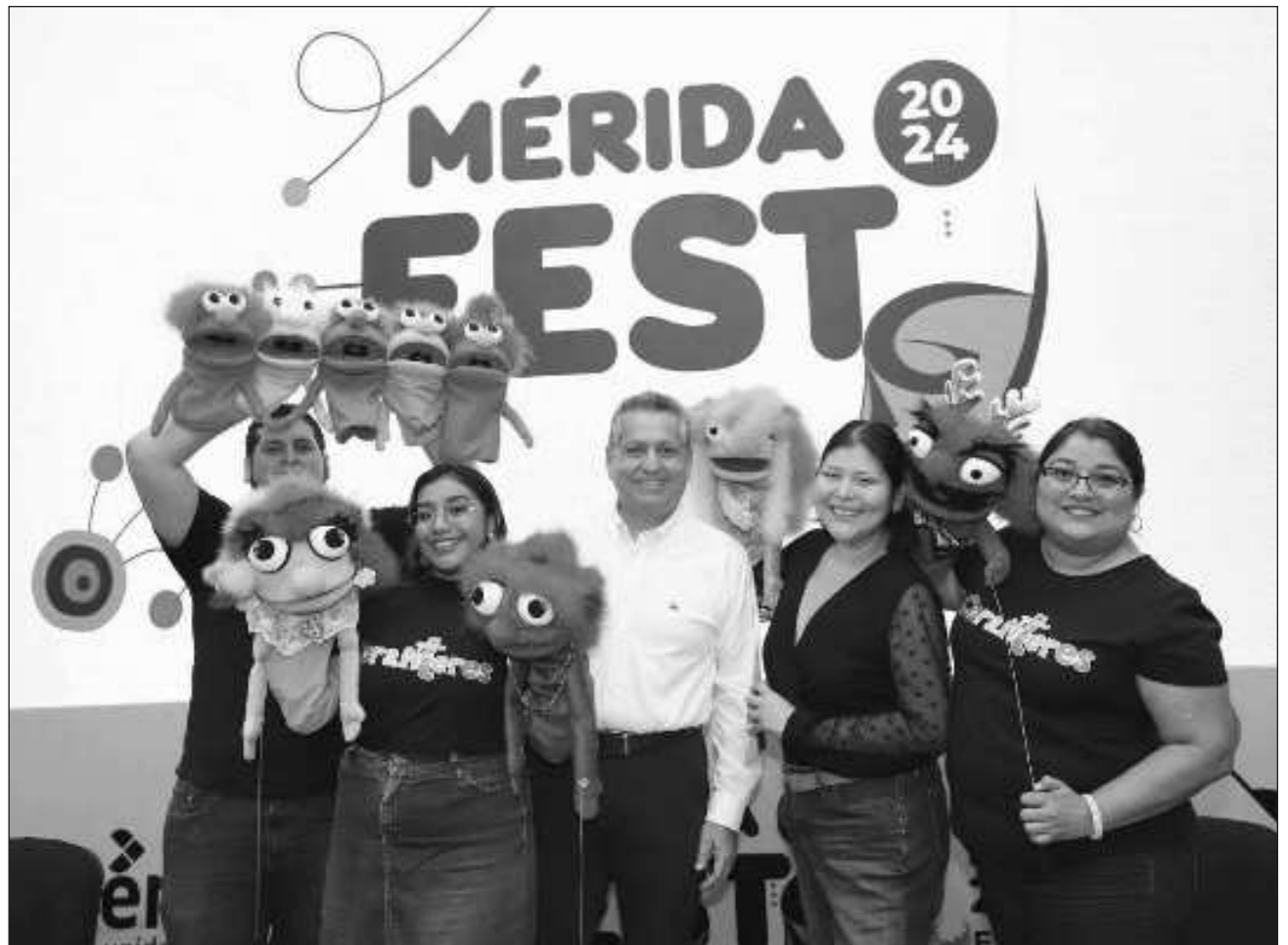
▲ Más de 760 artistas locales y extranjeros se presentarán en los eventos a realizarse del 5 al 24 de enero.

Asimismo, el presidente municipal destacó que eventos como el Mérida Fest posicionan cada vez mejor a Mérida ante los ojos del mundo, por armonizar la