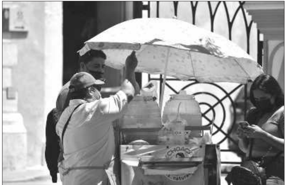
▲ De acuerdo con el IMCO, el trabajo doméstico implica labores de limpieza en el hogar, de artículos personales y también labores de cocina por las cuales normalmente no hay un pago dentro de los hogares, pero fuera de él tienen un costo.

Resalta que las mujeres realizan la principal contribución económica por el trabajo no remunerado ya que ellas aportan 2.6 veces más valor económico que los hombres.