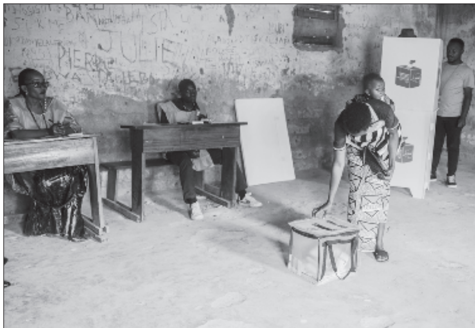
▲ El proceso electoral también se vio sacudido por la precaria seguridad que se vive en el este del país, donde la violencia armada en curso desde mediados de la década de 1990 alcanzó un punto álgido de tensión en los dos últimos años.

En algunos centros electorales hubo “problemas” con las “máquinas” de vo-