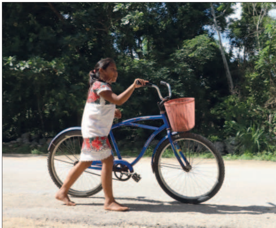
▲ Las mujeres mayas “tardan en salir de sus hogares porque a muchas no las dejan estudiar la licenciatura (...) Tienen que casarse para salir de sus casas”.

“Dentro de esta cultura donde predomina el machismo se le quita oportunidades a las mujeres y hay preferencia hacia los hombres, entonces esto ha provocado que muchas mujeres, como yo, logren la superación personal con muchísimo esfuerzo, y me refiero a que tardan en salir