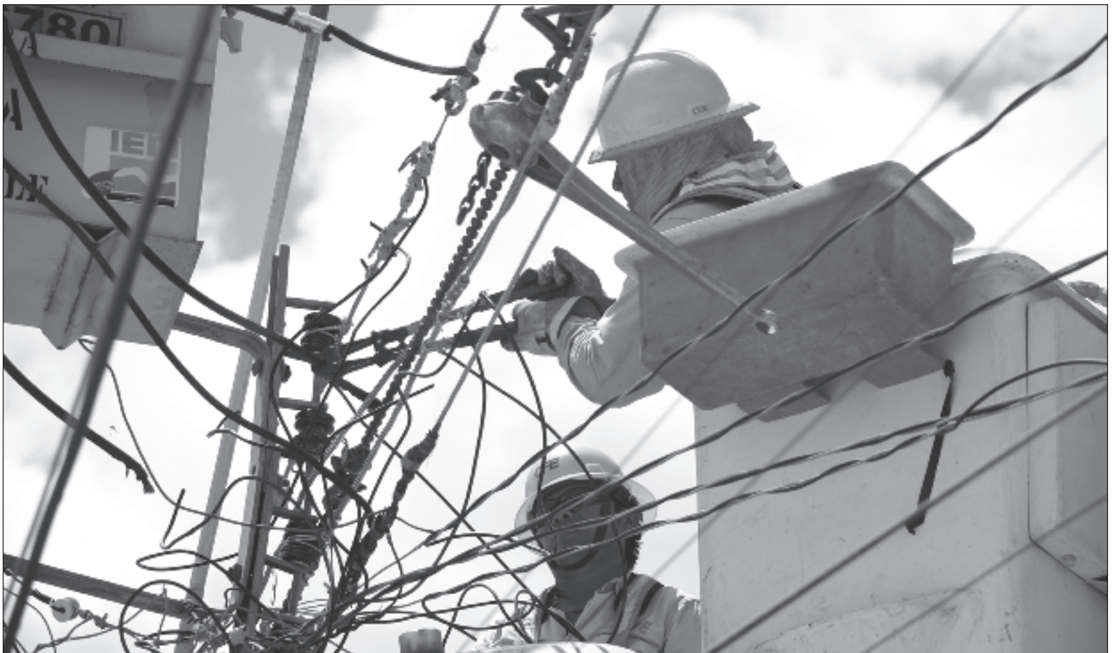
▲ Las élites “consideran que es ‘monopolio’ que la Comisión Federal de Electricidad produzca la energía que requiere la población mexicana”.