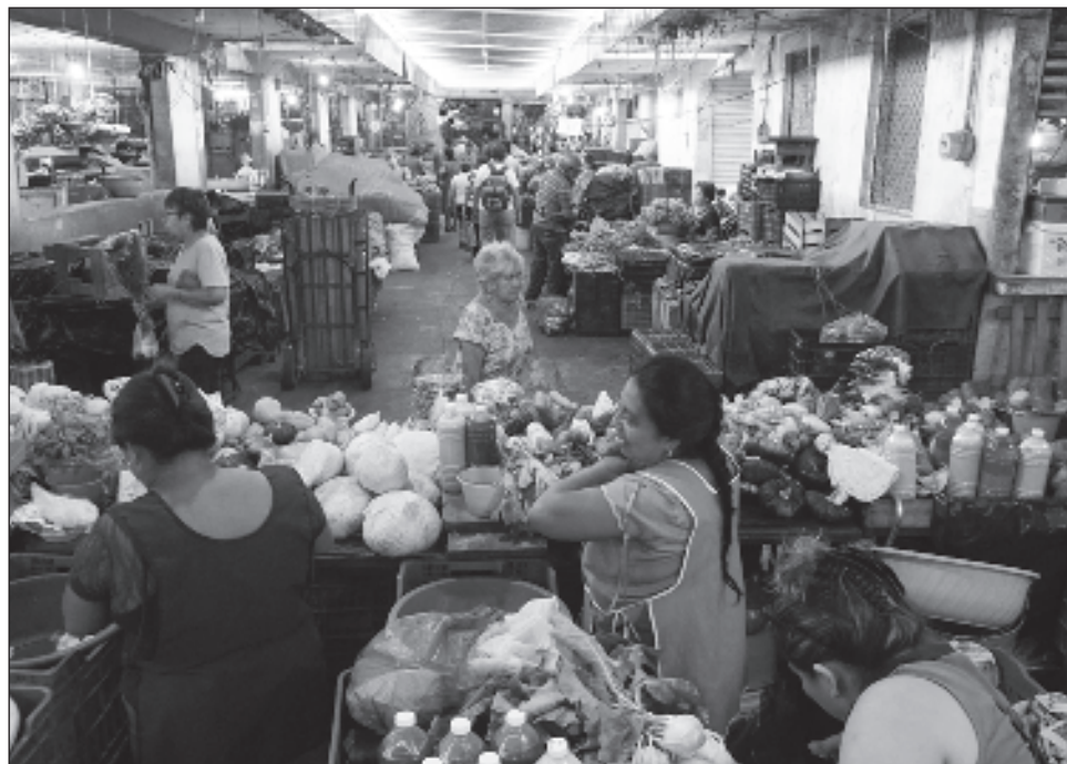
▲ El Fondo Monetario Internacional estima que el PIB de México cerrará el año en el equivalente a 1.81 bdd, colocándose en el sitio 12 del listado.

Con la actualización hecha por el Fondo Monetario Internacional, México se mantiene como la segunda mayor economía de América Latina, después de Brasil.