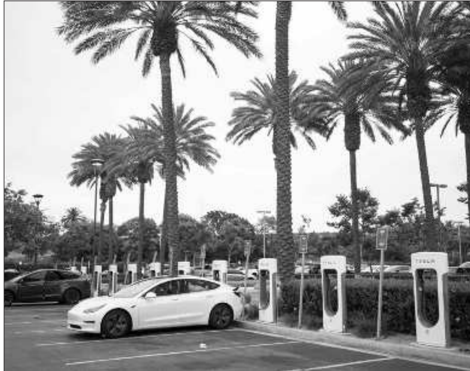
▲ "Tesla is set to remain an important player in world energy markets".

WHEN MOTOR CARS were first produced, many argued that they wouldn't last because of the major infrastructural requirements for their operation. Roads would have to be built, refueling stations created en masse, and the gasoline industry