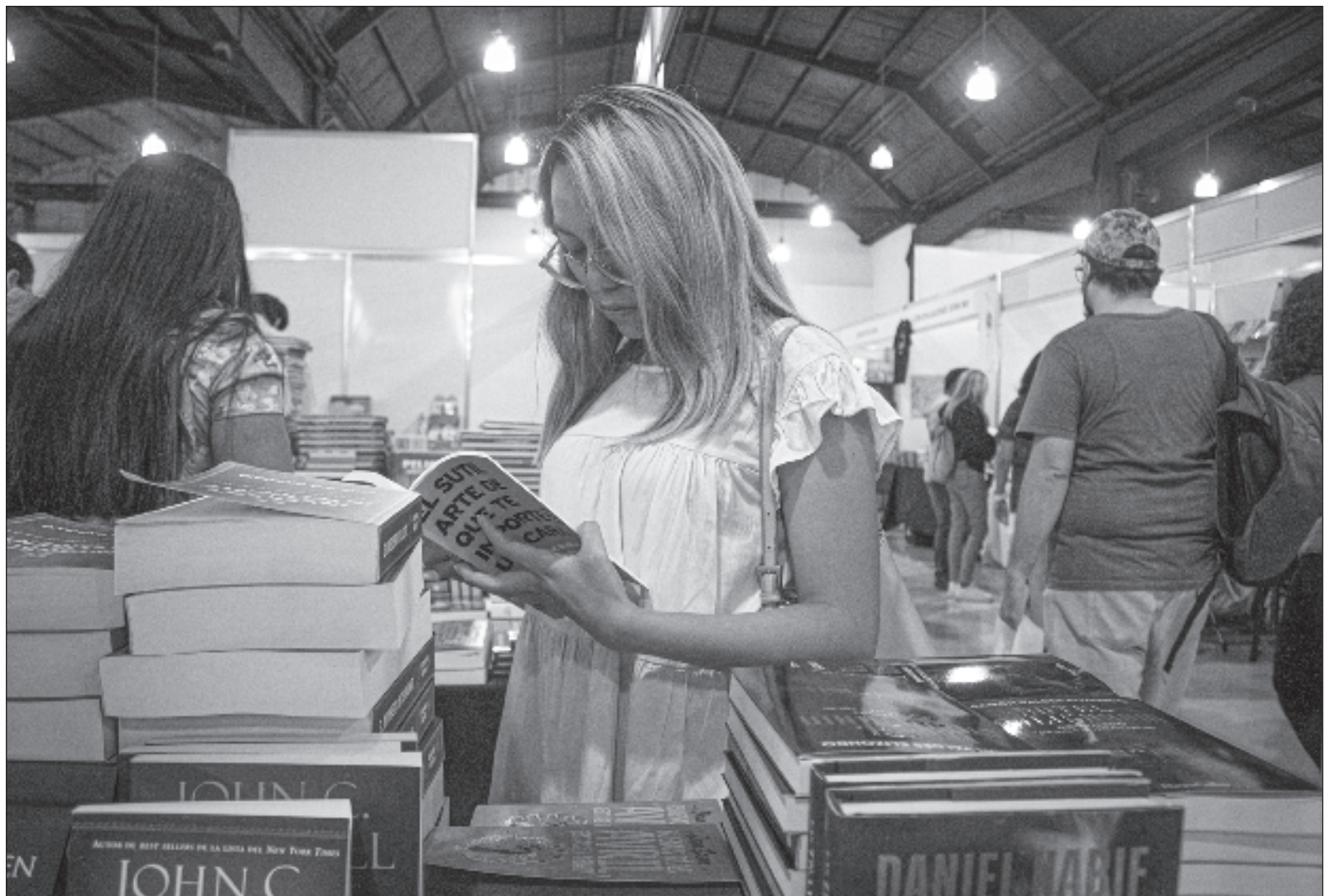
▲ “La literatura de autoayuda opera desde un esquema maniqueo pues parte de que el autor se ubica en una posición de poder con respecto del receptor: ‘tú tienes problemas y yo tengo la solución mágica para ellos’; a partir de allí todo se convierte en mercancía y en perversión”.