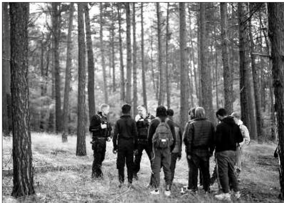
▲ La reforma aprobada por los Estados miembros de la Unión Europea prevé controles más estrictos en la llegada de migrantes a la UE y centros cerrados cerca de las fronteras exteriores para expulsar más rápidamente a quienes no tengan derecho a asilo.

La reforma prevé controles más estrictos en la llegada de migrantes a la UE, centros cerrados cerca de las fronteras exteriores para expulsar más rápidamente a quienes no tengan derecho a asilo, y un mecanismo de solidaridad obligatoria entre los Estados miembros, en beneficio de los países bajo mayor presión migratoria.