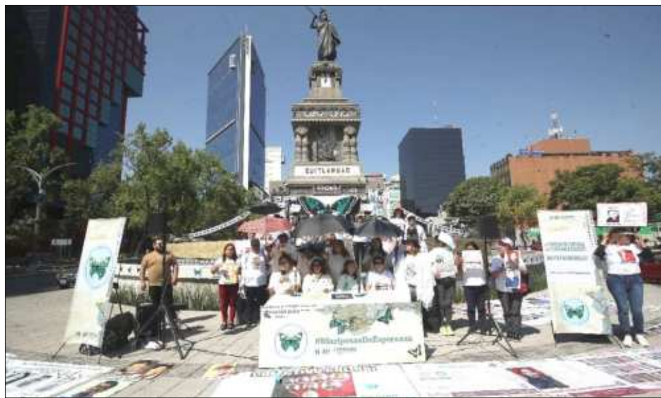
▲ El CNC denunció la falta de transparencia en el proceso para elaborar el censo, “violando principios establecidos” en la Ley General en Materia de Desaparición.

En la conferencia matutina, la titular de la dependencia, Luisa María Alcalde, expuso que la investigación también arrojó a 17 mil