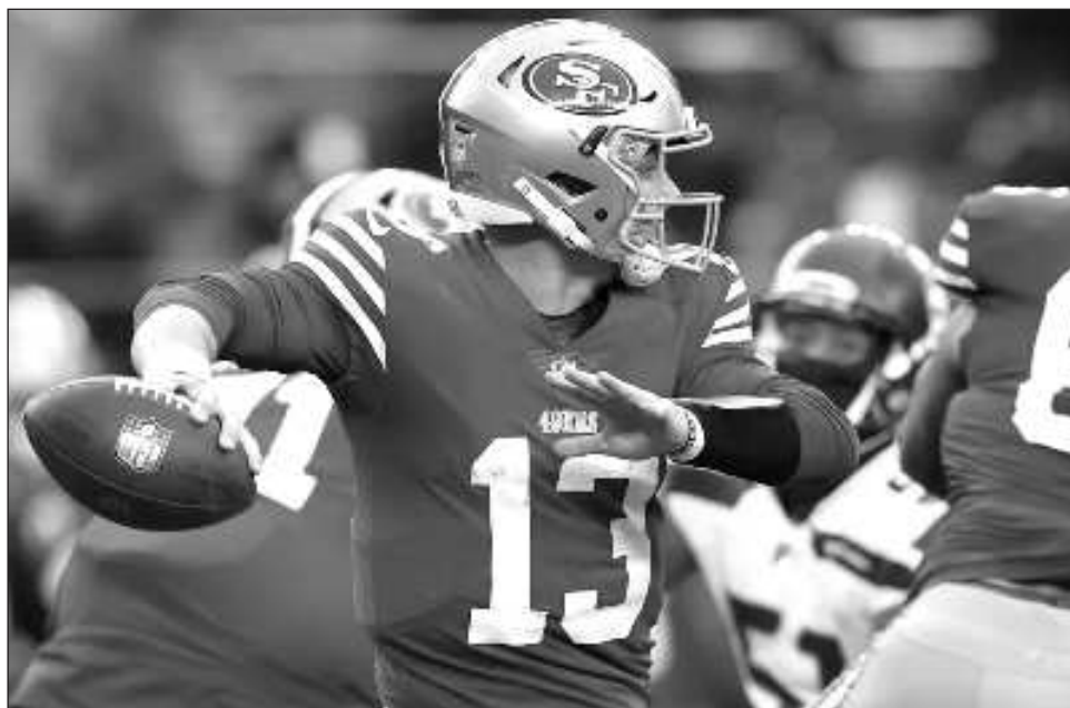
▲ Brock Purdy y los 49's lucen imparables; son un equipo balanceado que no da respiro al rival.

También el domingo llama la atención el viaje de los Leones de Detroit a Minnesota. Los "Lions", terceros en la NFC con 10-4, clasificarán si derrotan a los Vikingos, 7-7, que necesitan triunfar para mantenerse dentro de los siete equipos que avanzarán a playoffs;