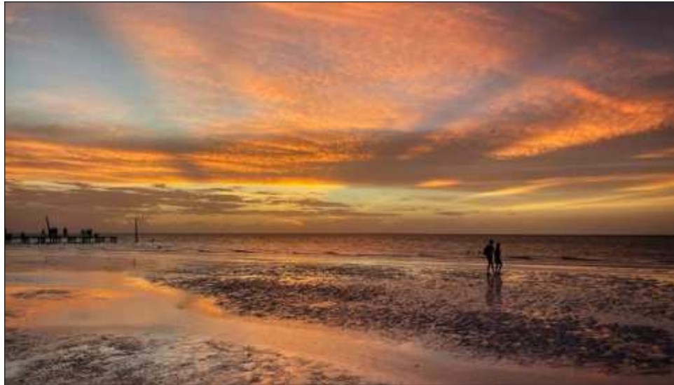
▲ El siguiente movimiento importante del Sol es el 21 de marzo, cuando se celebra el equinoccio de primavera; le sigue el solsticio de verano, el 21 de junio.

importante del Sol –dijo– es el 21 de marzo, cuando se celebra el equinoccio de primavera, allí la estrella continúa su viaje hacia el sur y después se presenta el solsticio de verano, el 21 de junio. El entrevistado expuso que la observación de estos fenómenos conocidos como “arqueoastronómicos” fue descubierta