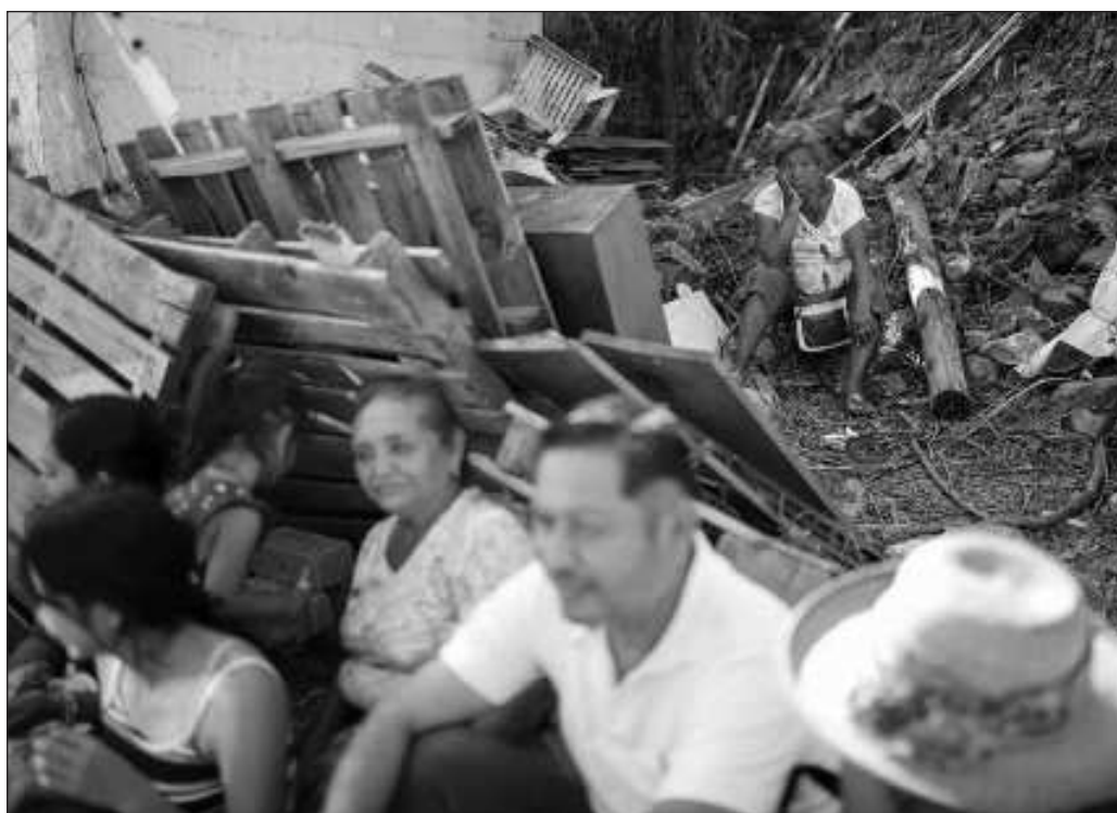
▲ En unas cuantas horas, la naturaleza arrasó con años de inversiones, de creación de infraestructura y, también es necesario decirlo, signos de acendrada desigualdad social.

Acapulco se encuentra lejos todavía de su antigua normalidad, una que también significaba abusos por parte de empleadores y falta de servicios para aquellos que encuentran el sustento precisamente en servir al turismo. Levantar al puerto para que se convierta en un destino ejemplar y en el cual las oportunidades para sus habitantes sean dignas, y no se reduzcan a habitar en casas de materiales endebles en los cerros, careciendo de lo básico, llevará todavía más y requerirá que nadie abandone a Acapulco.