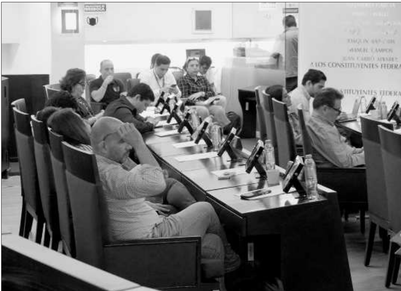
▲ La Unidad de Comunicación Social tiene presupuestada una cantidad mayor a la de la Secretaría de Desarrollo Económico.

NUESTRO CREADOR NO sé cómo pudo inventar tanta cosa. Creo que lo más difícil fue matar al Quijote a través del despertar del sueño que lo llevaba a un mundo desconocido cada noche. Pobre Quijote.