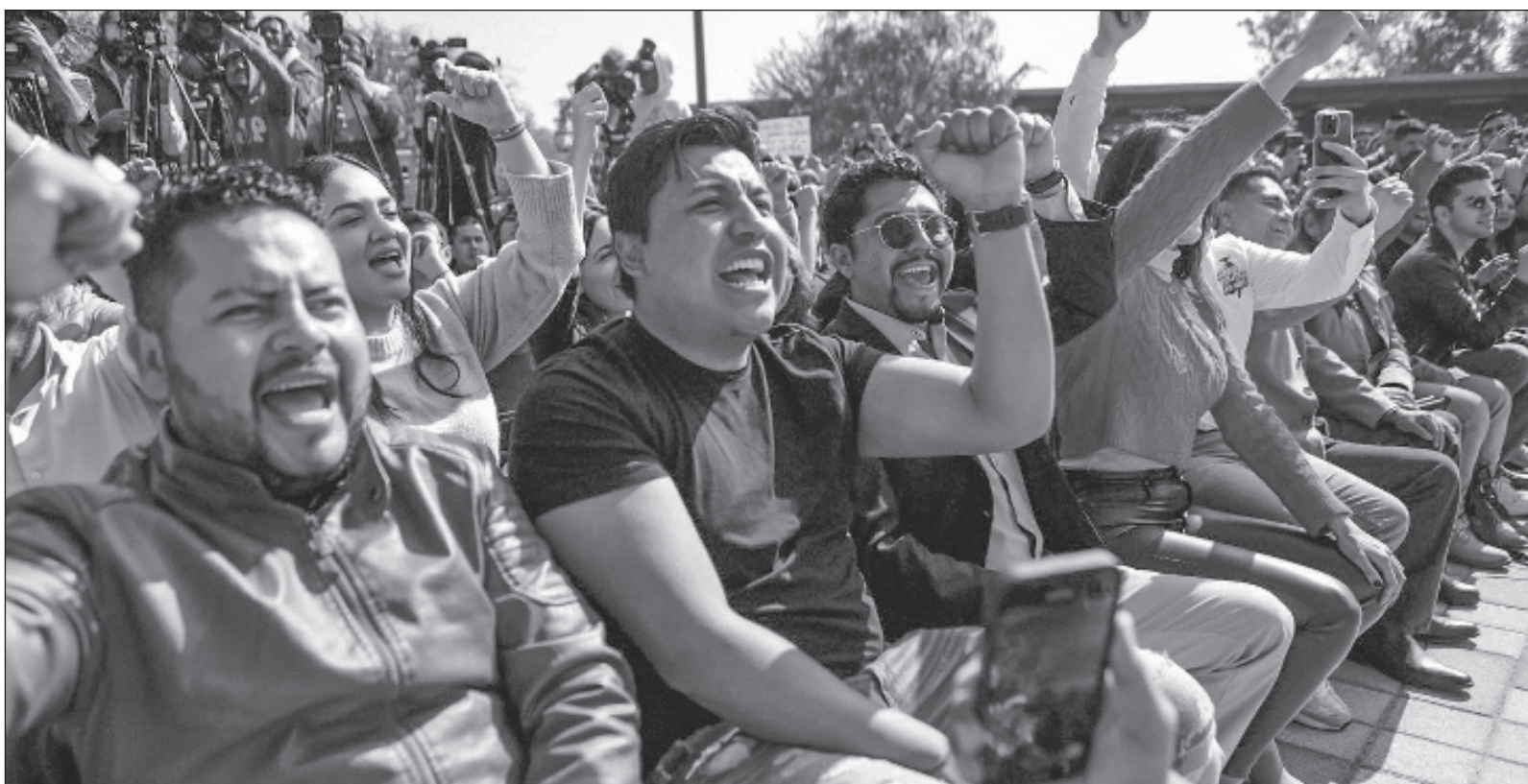
▲ "Este martes fue presentada una asociación política delicada: dos ex gobernadores de historial (cuando menos) complicado". Foto Claudia Sheinbaum

Twitter: @julioastillero juliohdz@jornada.com.mx