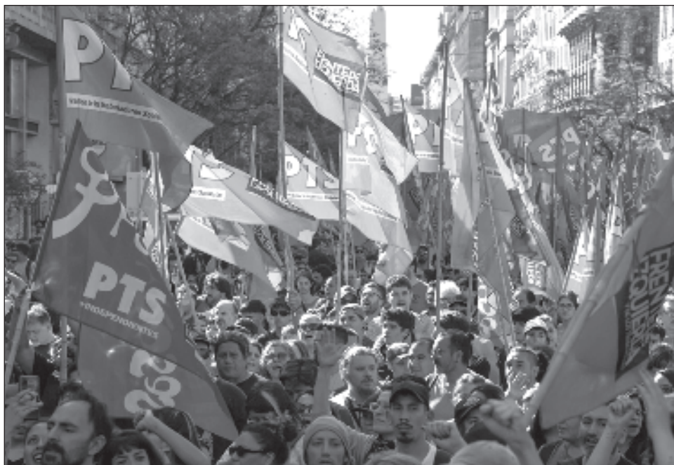
▲ Manifestantes y efectivos de seguridad se confrontaron en un breve choque a golpes de puño y empujones en una avenida capitalina donde los primeros se habían congregado para iniciar su marcha hacia la Plaza de Mayo, destino final de la movilización.

El plan incluye una devaluación del peso de más del 50 por ciento, el despido