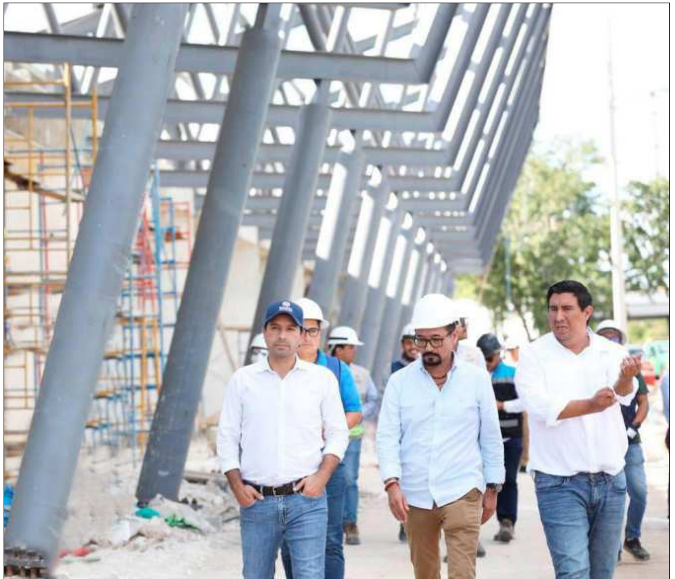
▲ El Centro de Transferencia Multimodal Caucel contará con un diseño integral e inclusivo con sala de espera, oficinas administrativas y áreas de descanso para operadores y permitirá a los usuarios el acceso a la parada del Va y Ven.

La infraestructura del Cetram contempla una sala, área de descanso para operadores, baños públicos para mujeres y hombres, una