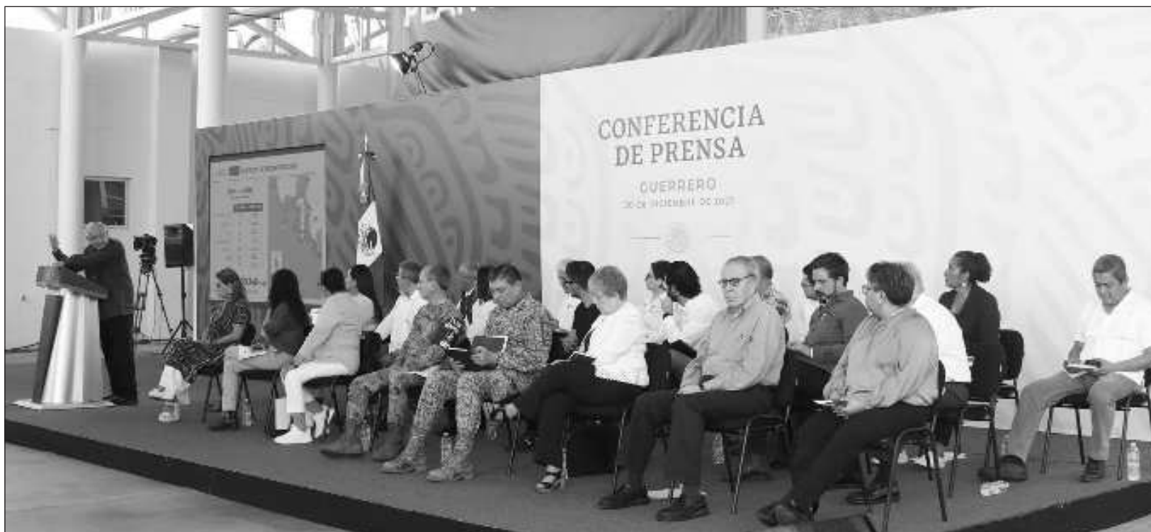
▲ Durante su conferencia efectuada en el puerto de Acapulco, Andrés Manuel López Obrador dijo que ya la gente está consciente de todas estas estrategias de guerra sucia que se han padecido siempre y, en su caso, de que se le acusó de ser un peligro para México, por lo que confió en que la población esté bien informada.