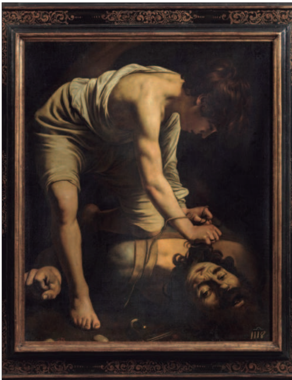
▲ La obra restaurada de Caravaggio se encuentra en una de las salas dedicadas a las obras del naturalismo europeo, del que el pintor italiano fue su principal precursor.

Sánchez explicó que la tonalidad amarillenta del viejo barniz transformaba el cromatismo original de Caravaggio aportando a los tonos claros y luminosos de las carnaciones y las vestiduras una gama cálida que alteraba totalmente la idea del artista. A su vez, la pérdida de transparen-