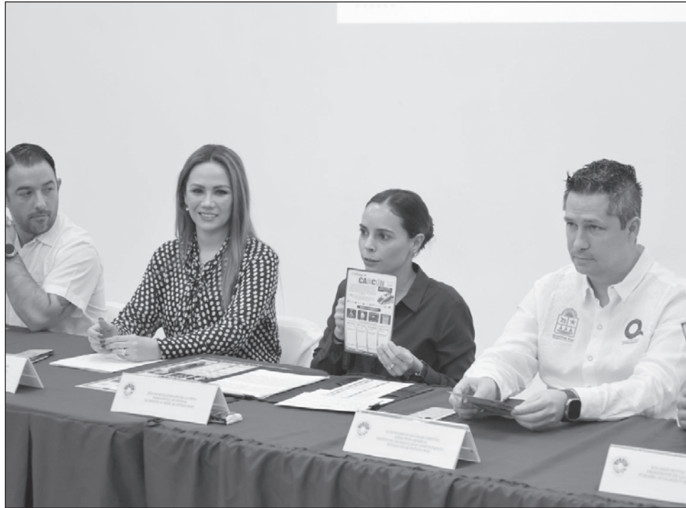
▲ El tarjetón turístico permitirá disminuir las quejas recibidas por parte de los visitantes que se encuentren en Cancún, y se espera que otros municipios lo implementen.

Exhortó a los arrendadores a brindar su apoyo para que este programa cumpla su propósito, que hagan de conocimiento a todos los turistas que cuen-