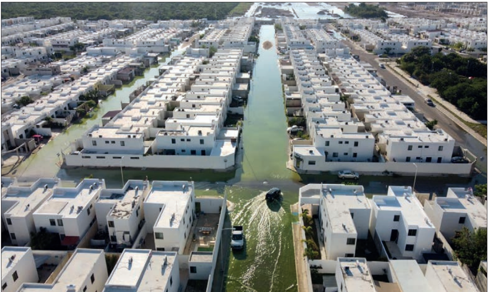
▲ En el desagüe de Las Américas y otras zonas del municipio de Mérida, el Ayuntamiento ya gastó 14 millones de pesos, pero el agua sigue brotando por las alcantarillas y el drama continúa.