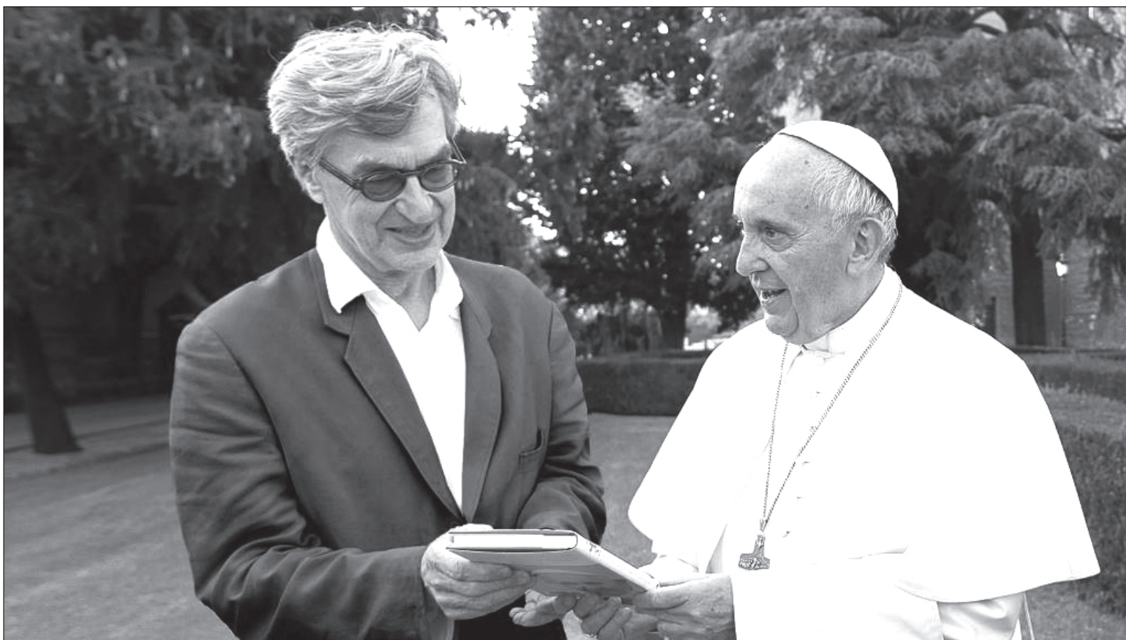
▲ Tanto la película de Wenders, El Papa Francisco , como la encíclica Fratelli tutti , son un soplo de solidaridad en un mundo dividido.