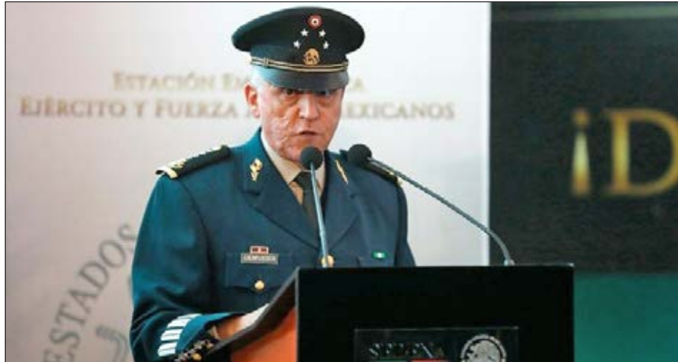
▲ El general Salvador Cienfuegos, ex secretario de la Defensa, es acusado por cuatro cargos relacionados con el narcotráfico.

El fiscal federal en Los Ángeles indicó que un traslado de este tipo po-