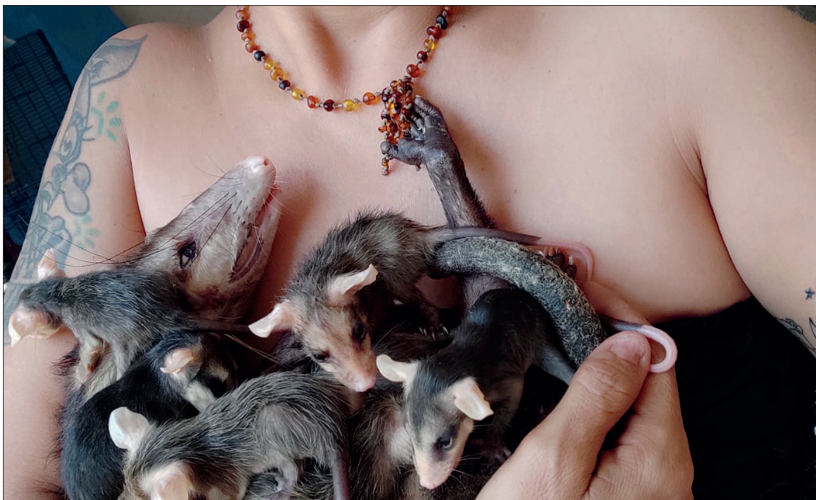
La organización Tlacuatitlán, con sede en Cancún, rescata un promedio de 800 tlacuaches anualmente.

Eugenia Poblete cree que en los últimos años ha habido avances importantes para proteger esta especie y ellas ponen su granito de arena otorgando pláticas en escuelas y con la sociedad civil sobre su importancia y preservación.