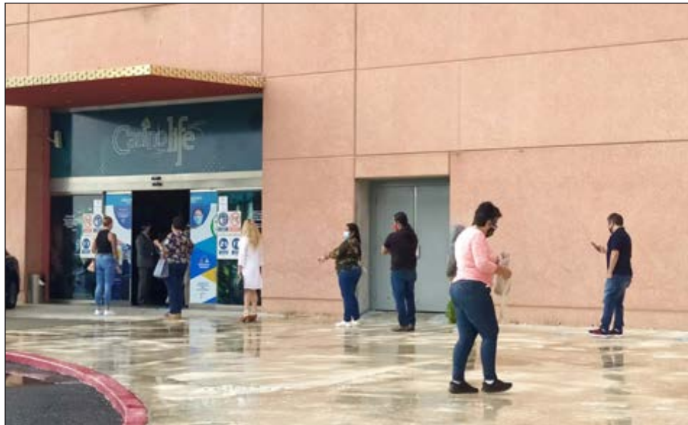
▲ Con sana distancia, máquinas desinfectadas continuamente y al 30 por ciento de su capacidad, los casinos se reactivaron.

En la fila, los ansiosos jugadores comentan entre sí lo difícil que han sido estos meses para ellos, pues prescindir de un hábito que se arraiga con tanta facilidad no es tarea sencilla. Uno a uno, los apasionados del azar entran a Casino Life, guardando sana distancia en todo momento, mientras