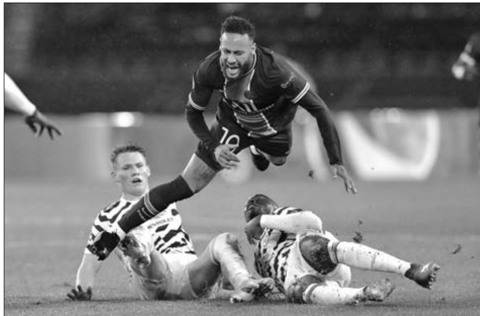
▲ Neymar y el PSG sucumbieron ante el Manchester United.

En el otro duelo de la llave, el delantero Álvaro