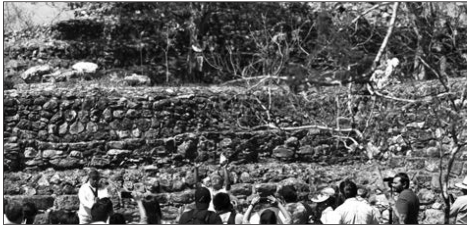
▲ La propuesta de Warnel May contempla que el 21 de septiembre haya actividades en algún lugar específico como Izamal o Valladolid. En la imagen, la zona arqueológica de Chaltún Ha, en Izamal.

Agregó que la iniciativa fue presentada el 9 de octubre de 2019, antes de la pandemia, “y eso nos ha hecho cambiar toda esa perspectiva. Sin embargo, que quede