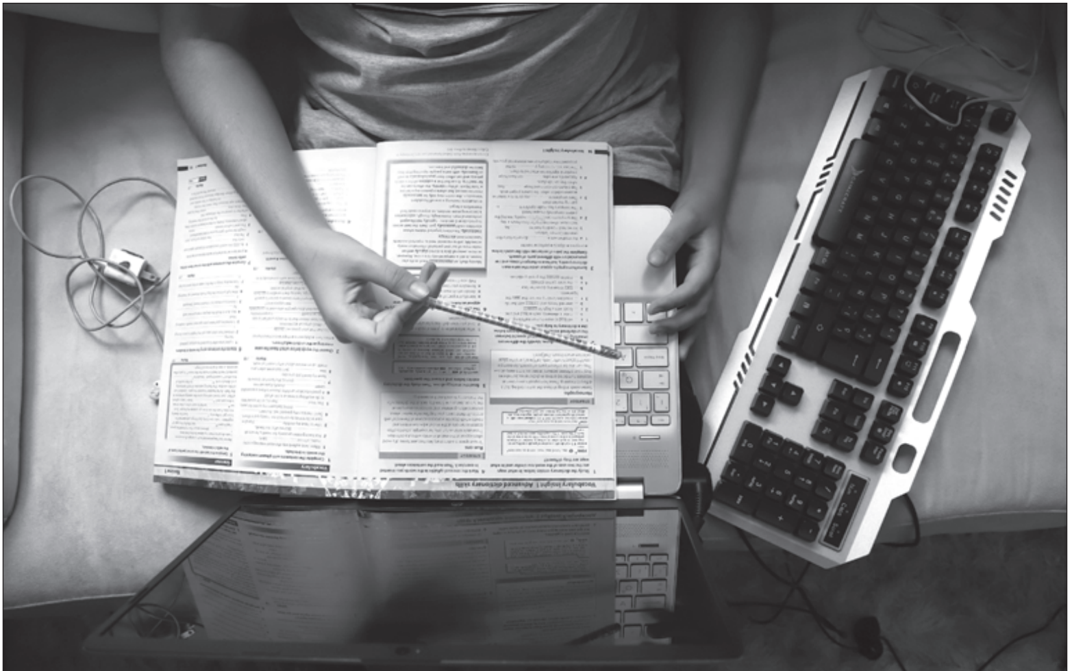
▲ Escribir a mano activa las partes sensoriales y motoras del cerebro, lo que no sucede al escribir sobre un teclado.