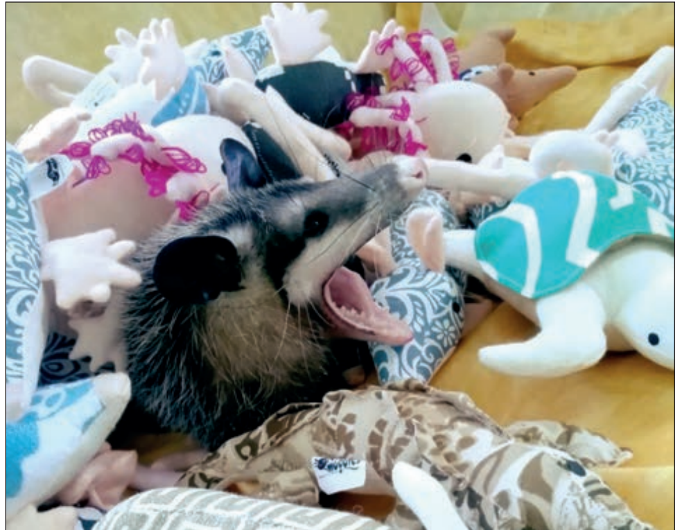
Aunque hay quien tiene zarigüeyas como mascotas, los especialistas no lo recomiendan pues se trata de una especie silvestre.

Hasta ahora no han publicado la información con la que cuentan, sin embargo, tienen la meta de monitorear por lo menos a 200 ejemplares y comparar los del centro, con los del periférico de Mérida, al notar que las que viven en zonas céntricas aparecen muy enfermas