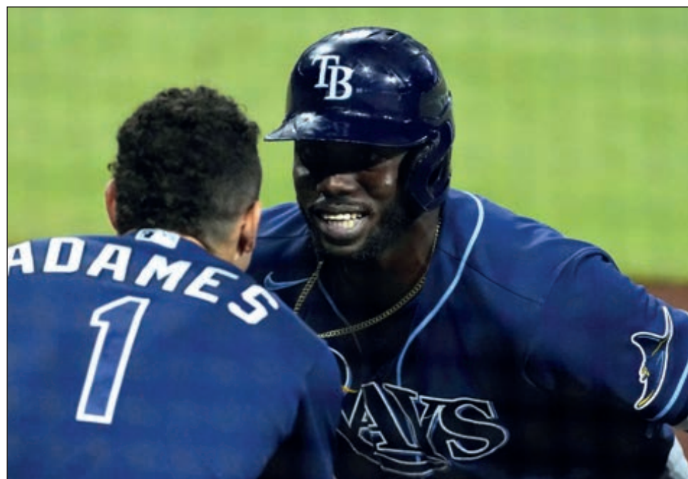
▲ Randy Arozarena condujo a las Mantarrayas a su segunda Serie Mundial.

Arozarena fue la gran revelación de la postemporada 2020 y su galardón de "MVP" refleja su proeza en este mes. "Esto ha sido muy