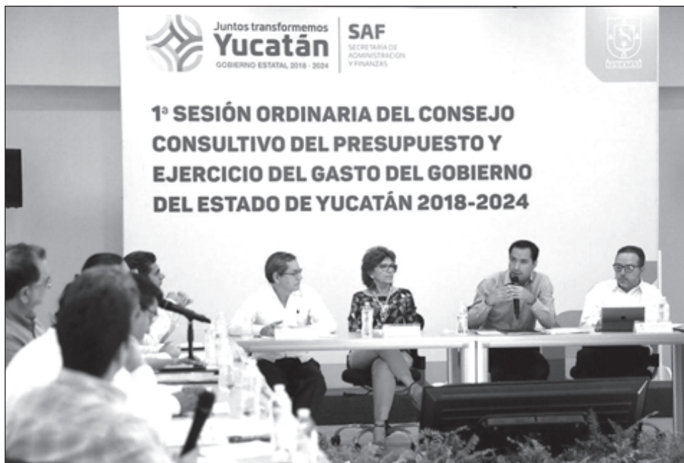
▲ El estado de Yucatán podrá trabajar con organizaciones de la sociedad civil locales e internacionales, en una agenda que contribuya a mejorar la forma en que la administración estatal trabaja por y para los yucatecos.

En esta ocasión, este organismo internacional añade a otros 55 nuevos miembros locales, compuestos por 64 gobiernos locales de 32 países para unirse a OGP Local. Esta expansión, la más grande en su historia y se produce en un momento crítico en el que las ciudades y las comunidades locales están a la vanguardia de los esfuerzos para responder a la pandemia por el COVID-19, al mismo