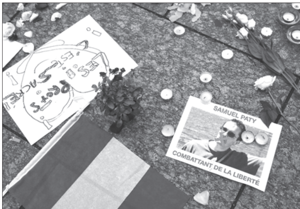
▲ Miles de personas se manifestaron en diferentes ciudades francesas el pasado 18 de octubre luego de que un profesor fuera decapitado por mostrar a sus alumnos caricaturas del profeta Mahoma.

Las autoridades francesas emprendieron el lunes una