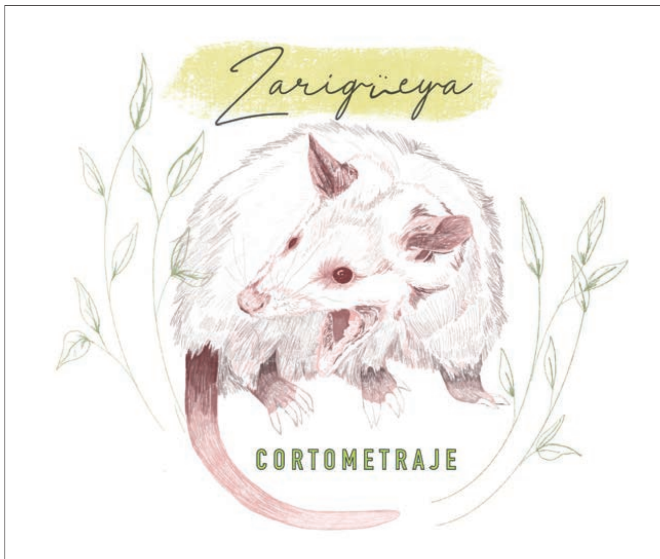
El cortometraje es un esfuerzo para promover el respeto hacia los tlacuaches y destacar su valor para los ecosistemas.

De igual modo, Zarigüeya pretende retratar el paisaje de las comunidades rurales en Yucatán, así como sus usos y costumbres con respecto a estos mamíferos que han sido históricamente vulnerados a