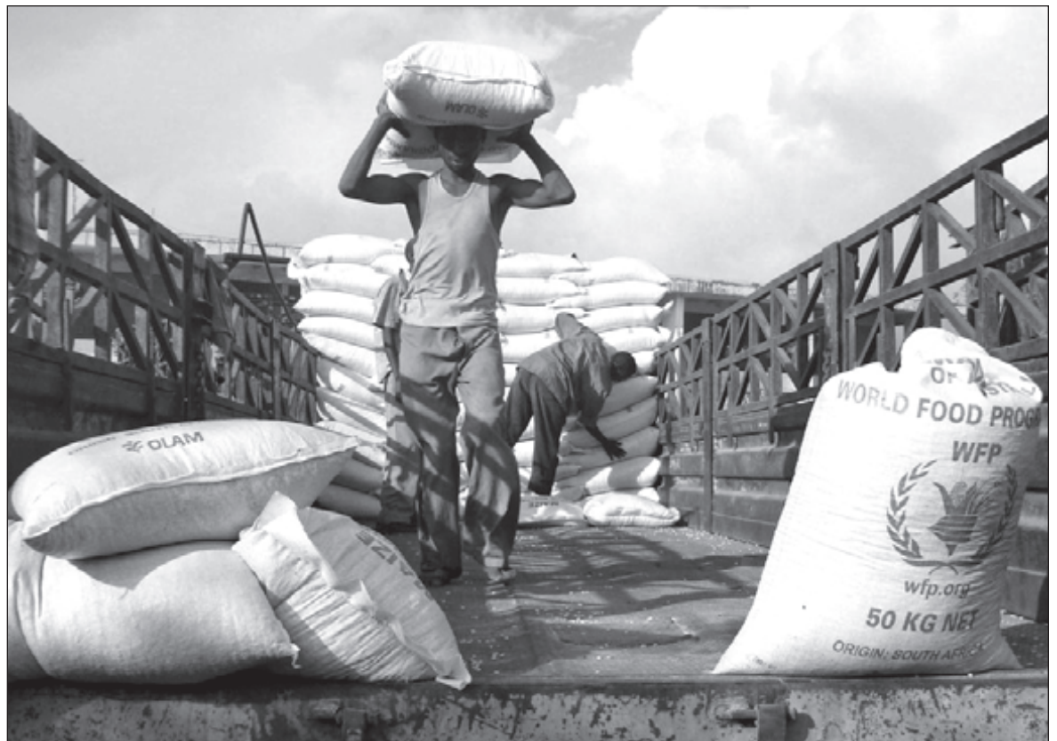
▲ While the World Food Program rarely sees media coverage, tens of millions of people around the world would likely starve without it.

THESE COUNTRIES ARE not exactly paragons of respect for human rights given their large scale of qualified and quantified abuses and, in some cases, support for genocidal practices.