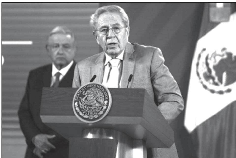
▲ El secretario de Salud, Jorge Alcocer Varela, enfatizó que con estas acciones el Gobierno Federal trabaja en el aspecto de la prevención.

Al respecto, el secretario de Salud, Jorge Alcocer destacó que con esto se privilegia el aspecto más importante que hay en la atención a la salud, que es la prevención. Señaló que aún se está en el diseño de esta nueva etapa para adelantarnos en la adopción de medidas, se trata de un complemento, para cubrir regiones. En el caso de los hospitales privados, tienen un trabajo que están evaluando donde poner a los pacientes covid, con certeza de que se tengan los equipos, diferencias de atención, no sólo ventiladores, porque hay complejidades como se hace en institutos de salud y de alta especialidad.”