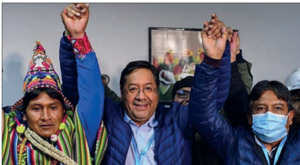
▲ Luis Arce derrotó de manera contundente a los aspirantes de derecha que apoyaron el golpe de 2019

Cabe felicitar, pues, por el retorno de Bolivia a la democracia, por la derrota del golpismo y por la recuperación en ese país hermano de un camino de justicia social, igualdad y soberanía.