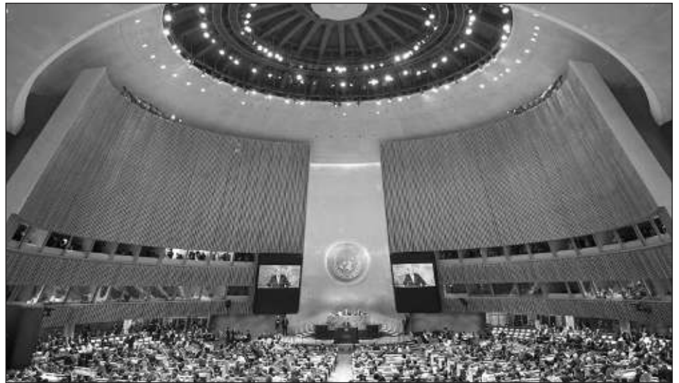
▲ Por primera vez luego del inicio de la pandemia, los líderes mundiales se apersonarán en Nueva York para tratar temas como la paz en Europa y las crisis económica, alimentaria y energética.

El gobernador de Puerto Rico, Pedro Pierluisi, advirtió que podrían pasar varios días antes de que todo el mundo tuviera electricidad.