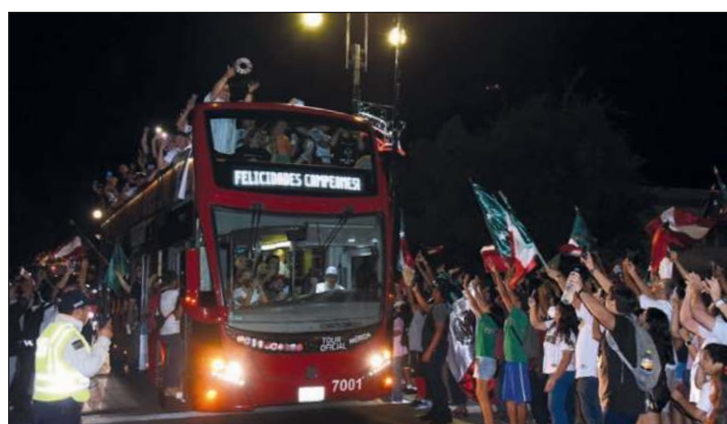
▲ Los Leones celebraron anoche la obtención de su quinta estrella en la Liga Mexicana de Beisbol con un desfile que fue vitoreado por cientos de personas en Paseo de Montejo. El equipo yucateco que venció 4-3 a los Sultanes de Monterrey en la Serie del Rey.