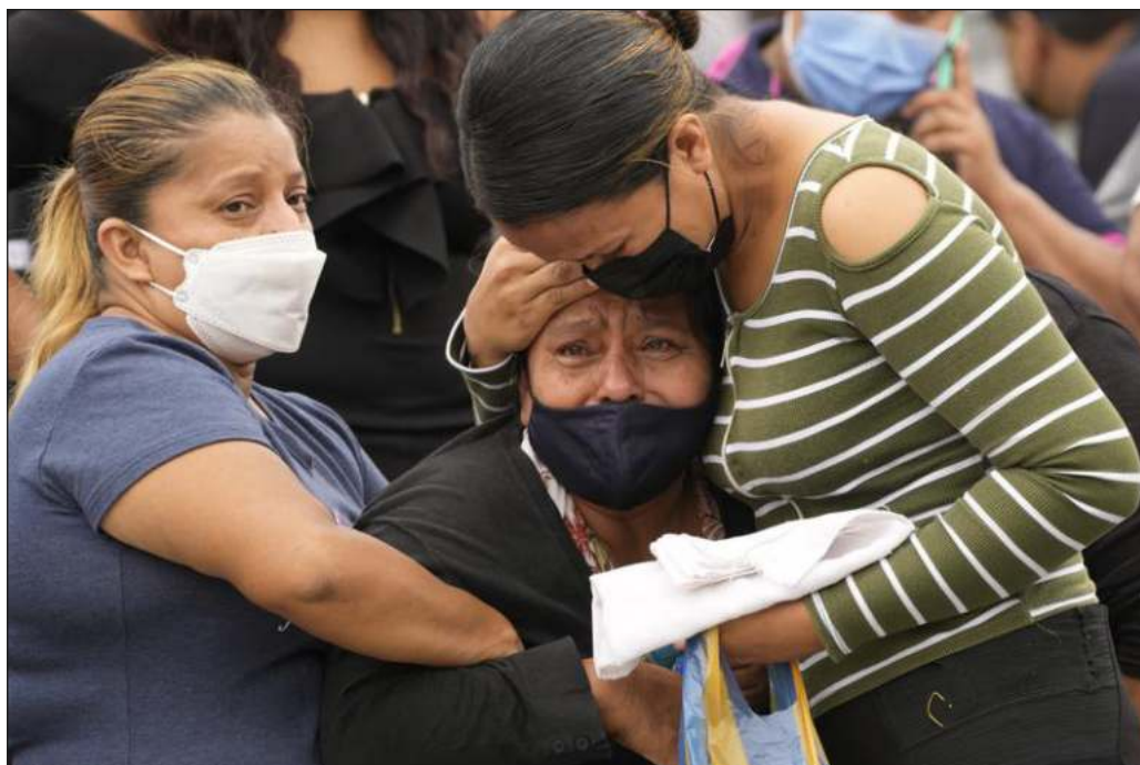
▲ En lo que va de 2022 han sido asesinadas 206 mujeres en casos tipificados como feminicidio, según cifras de la Fundación Aldea; el país registra además una alta tasa de homicidios.

Cabe esperar que los asesinatos de mujeres y de quienes tendrían que esclarecerlos y sancionarlos lleve al gobierno ecuatoriano a emprender dichas acciones a la brevedad.