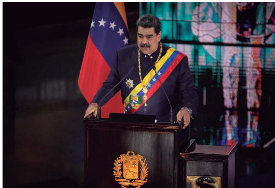
▲ Naciones Unidas documentó 122 casos de víctimas que fueron sometidas a tortura, violencia sexual y otros tratos crueles, inhumanos o degradantes por agentes del DGCIM en una de sus sedes en Caracas, y otros estados gobernados por Nicolás Maduro.

En concreto, la misión ha subrayado que tanto la Dirección General de Contrainteligencia Militar (DGCIM) como el Servicio Bolivariano de Inteligencia Nacional (SEBIN) llevaron a cabo ataques a partir de 2014 contra opositores, algunos resultando en crímenes de lesa humanidad.