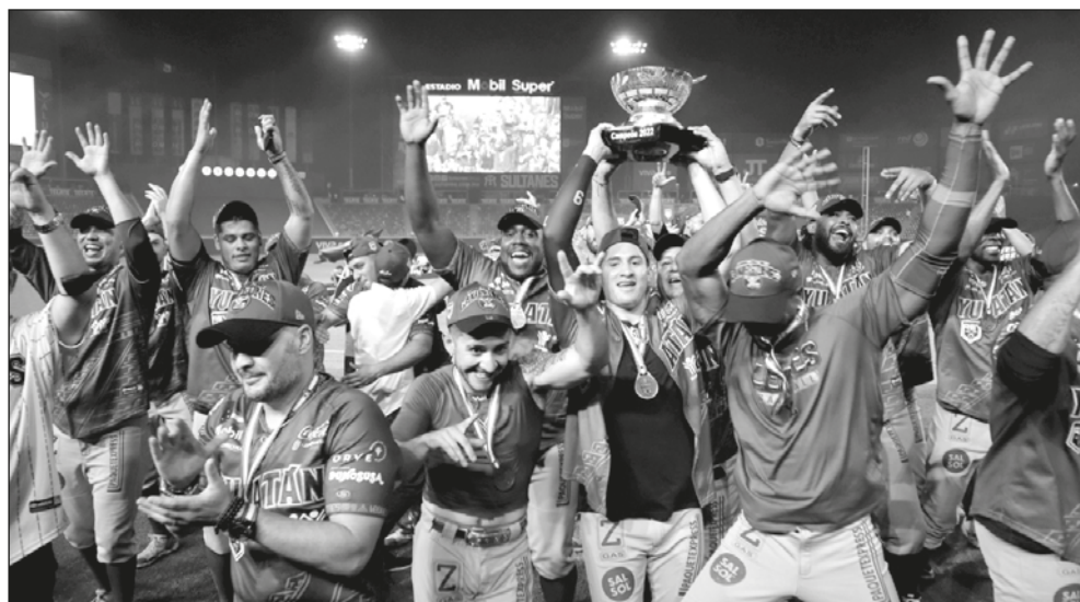
▲ Los selváticos, tras la conquista de la Copa Zaachila en el “Palacio Sultán”.

Los “reyes de la selva” les ganaron a los regios en su propio juego -Monterrey tuvo el cuerpo de serpentinillas más efectivo de los playoffs-, al registrar un porcen-