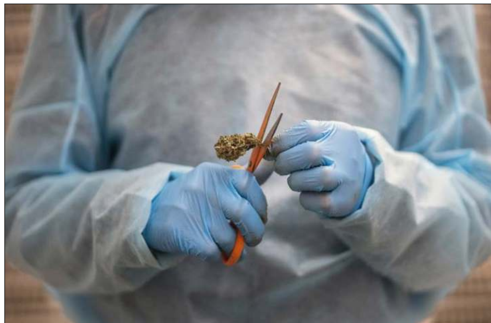
▲ Las farmacias habilitadas son pocas en relación a la población total y persisten las dificultades para acceder al sistema financiero a causa de las legislaciones internacionales.

Según datos del portal Uruguay XXI, en 2020 se doblaron las exportaciones del año anterior hasta alcanzar 7.3 millones de dólares. En 2021 los ingresos fueron de 8.1 millones de