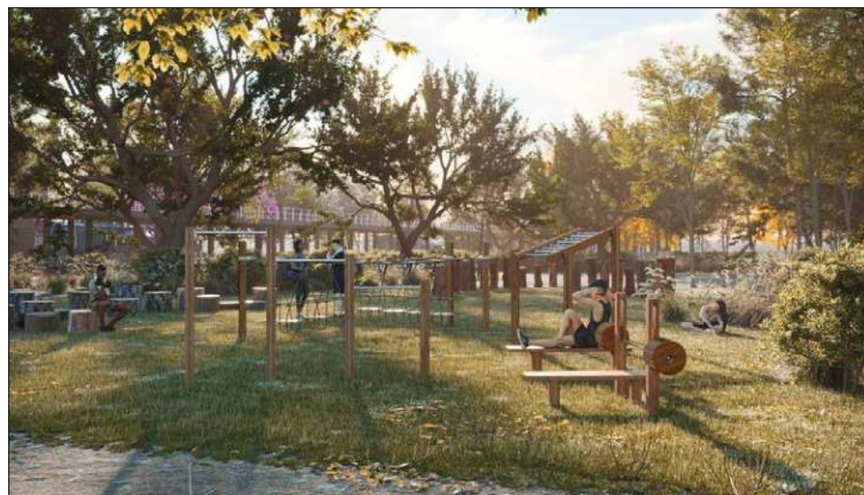
▲ El Gran Parque de la Plancha contará con áreas verdes, de juegos infantiles, mercado gastronómico, gimnasios, anfiteatro para 10 mil personas y una estación del IE-Tram.

Plancha podía ser una de las posibilidades.