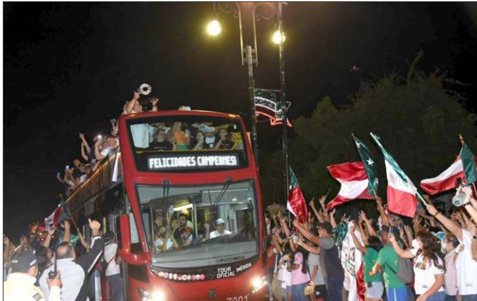
▲ Los campeones de la LMB fueron vitoreados anoche por cientos de personas.

Luego de quedarse a un paso de la gloria en las series del rey de 2019 y 2021, los selváticos ganaron su cuarta serie final con un aut involida-