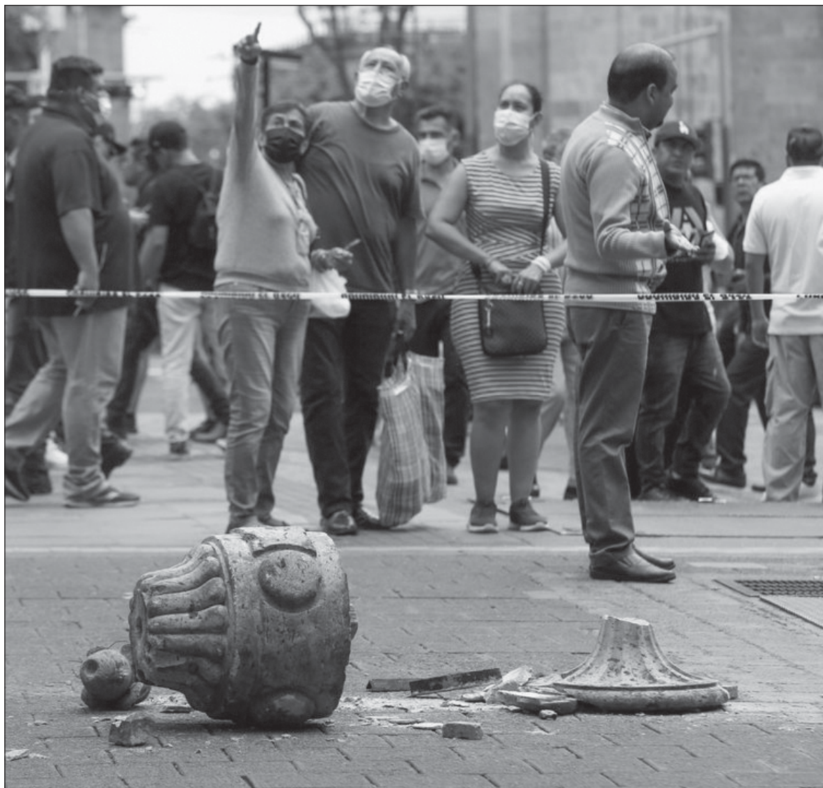
▲ “Esos terremotos los viví amurallado en la laja, mientras que hay personas que cuando leen las réplicas de aniversario aún sienten los escalofríos de aquel día, y no creen que sea sólo una coincidencia”.

Fue el diciembre de hace 37 años, y precisamente ese recuerdo me asaltó de nuevo en estos días, cuando mi hermano cumplió sus propios 50. En esos años han pasado muchísimas cosas, ha cambiado casi todo: el tiempo ha sido inclemente, como una tormenta, o como un terremoto. Sin embargo, hay cosas que se han mantenido en pie y que incluso están más fuertes que nunca. Por ejemplo, la admiración a mi hermano. Esa vez, por sus dibujos — están súper padres, Vico —. Ahora, porque precisamente el supermán es él, y eso debería reconocérselo más seguido. Meses después del cumpleaños de mi papá, y dos días después del de mi hermano, cuando regresaba de la escuela vi a mi familia en la sala, sentados enfrente de la televisión. Qué pasó, pregunté, viendo sus rostros tristes, y preocupados. Tembló en México. Tembló muy fuerte . Durante horas estuvimos viendo los reportes en una televisión, pe-