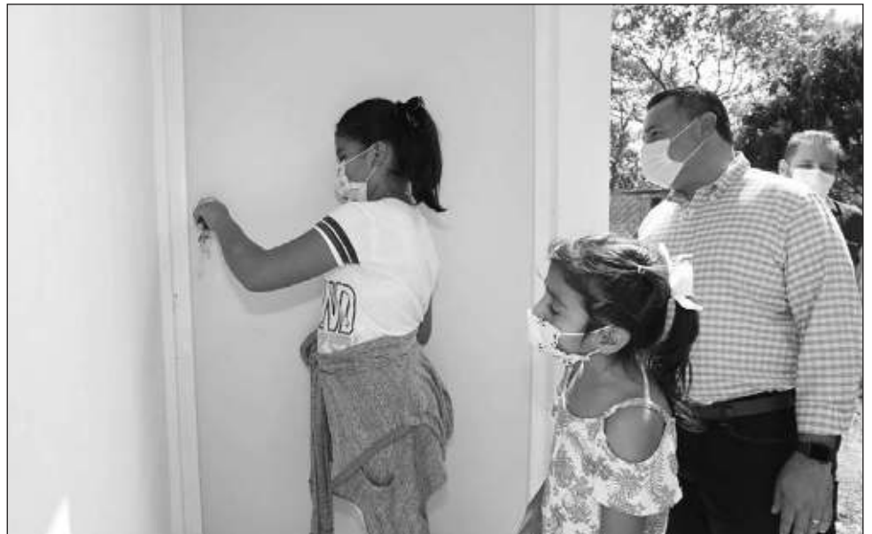
▲ En la actual administración, encabezada por Renán Barrera, se realizaron 167 tomas domiciliarias beneficiando a 256 personas de 170 viviendas.

En el caso de las colonias las sedes son el Instituto Municipal de la Mujer Sur (Calle 88-A Número 311-D entre 141 y 143, Col. Emiliano Zapata Sur I y II), Centro de Desarrollo integral Xoclan Susulá (Calle 130 S/N x 67 a y 69 Col. Xoclán Susulá), Centro de Superación Integral de San