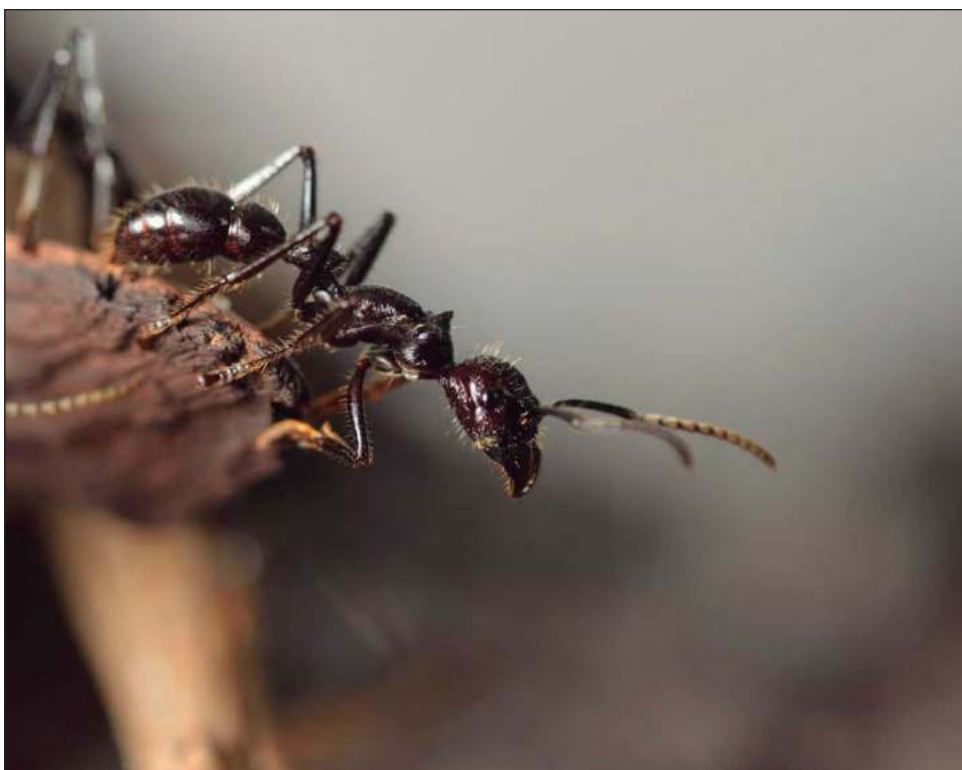
▲ Xaak'al beeta'abe' tu chiikbesaje' k'a'ananiil u yojéelta'al tu'ux ku yantal le mejen ba'alche'oba' ti'al u na'ata'al xan bix u péeksiko'ob lu'um xan, ichil uláak' ba'alob.