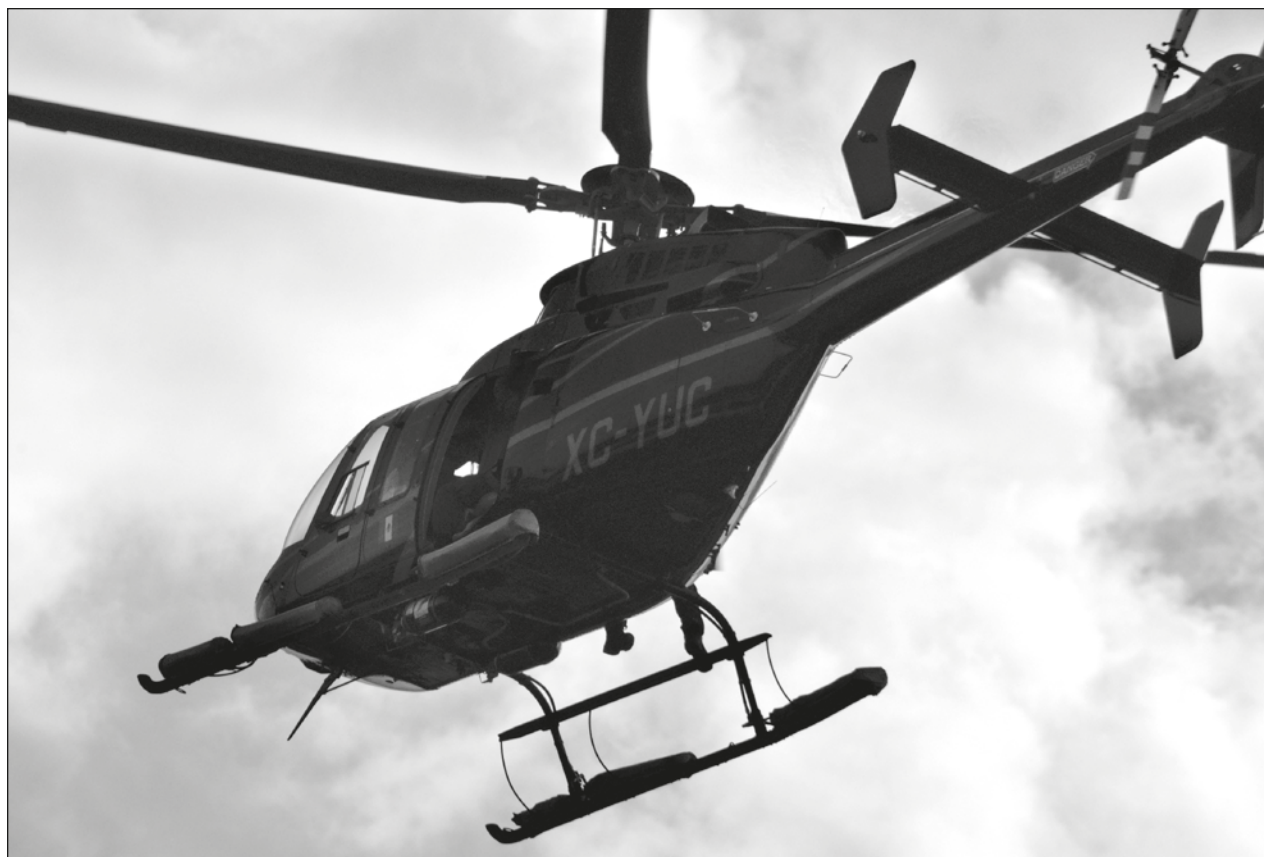
▲ El pasado 26 de junio fallaron las hélices del helicóptero que transportaba al director de Pemex.

Esperan que tras la vacunación de los menores de entre 5 y 11 años se programe una nueva campaña para los mayores.