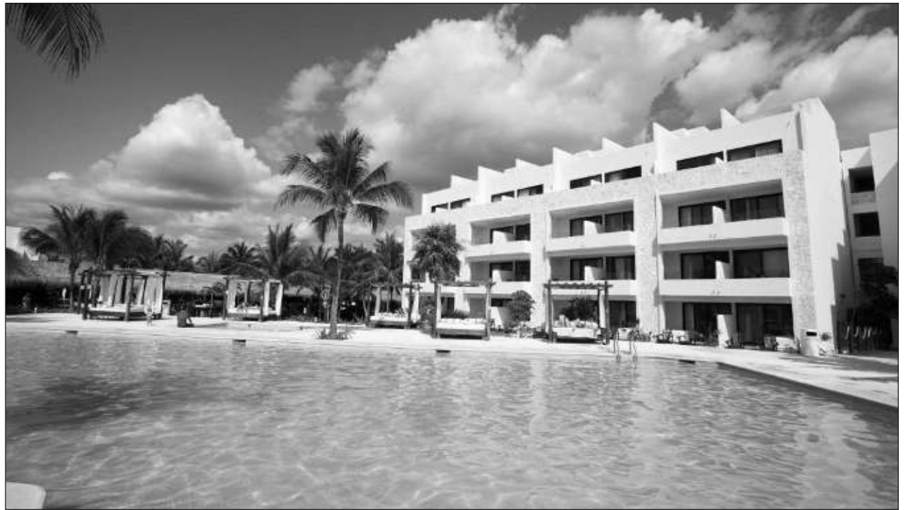
▲ La campaña de promoción busca mejorar el posicionamiento de la marca del destino Tulum.

El líder hotelero refirió que esta campaña de promoción no depende de la asistencia que tengan los hoteleros a ferias como por ejemplo el World Travel Market 2022, a efectuarse el próximo noviembre en Londres, o la Feria Internacional de Turismo (Fitur), que se llevará a cabo en Madrid a principios de 2023, por men-