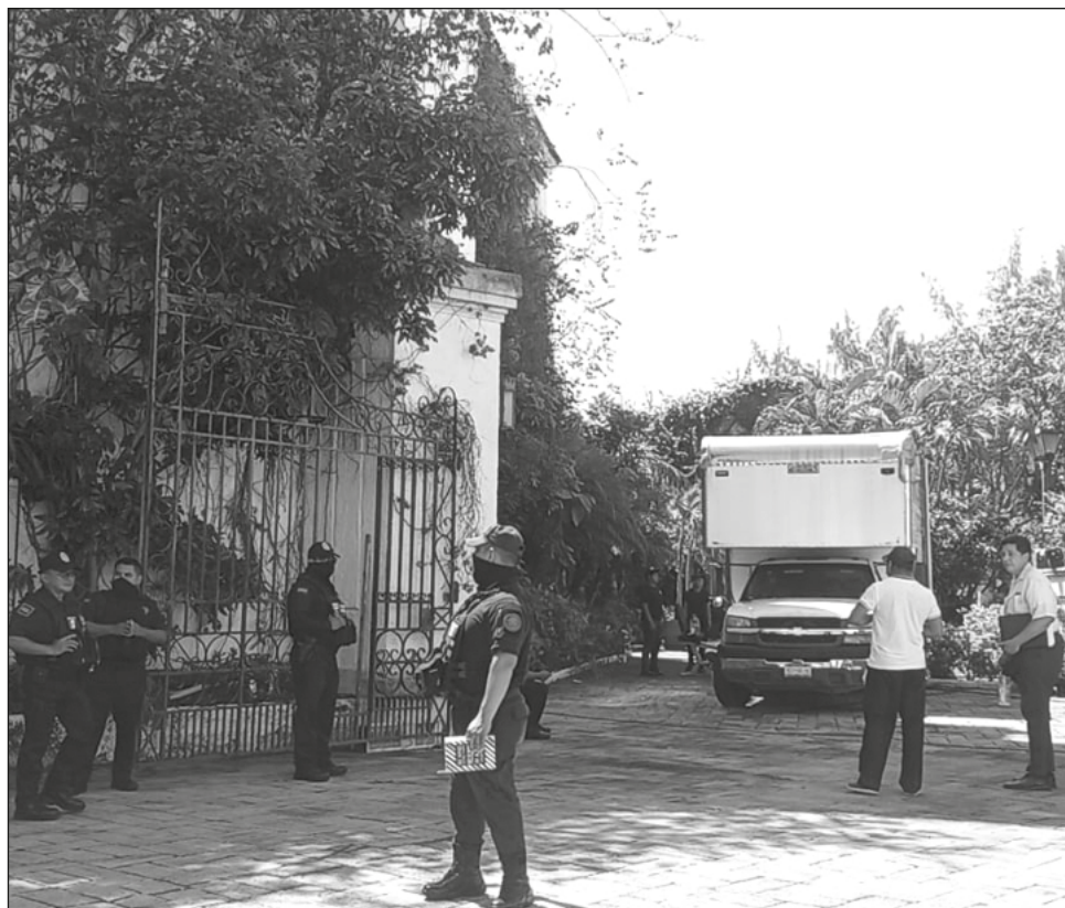
▲ El litigio por despido injustificado comenzó hace 20 años; la propiedad del centro de hospedaje fue adjudicado en favor de los trabajadores demandantes.

Durante la mañana de este martes, elementos de la Policía Quintana Roo acudieron al inmueble a cum-