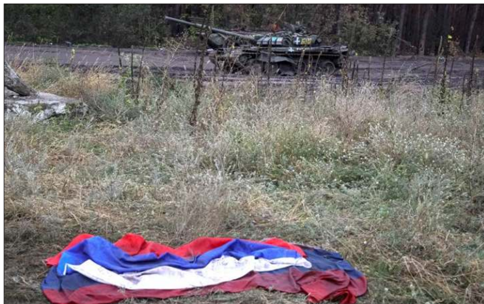
▲ Los referendos podrían allanar el camino para que Moscú intensifique el conflicto en momentos en que las fuerzas ucranianas están recuperando territorio gradualmente.

Denis Pushilin, titular de la región de Donetsk, declaró que "el sufrido pueblo del Donbás se ha ganado el derecho de ser parte del gran país