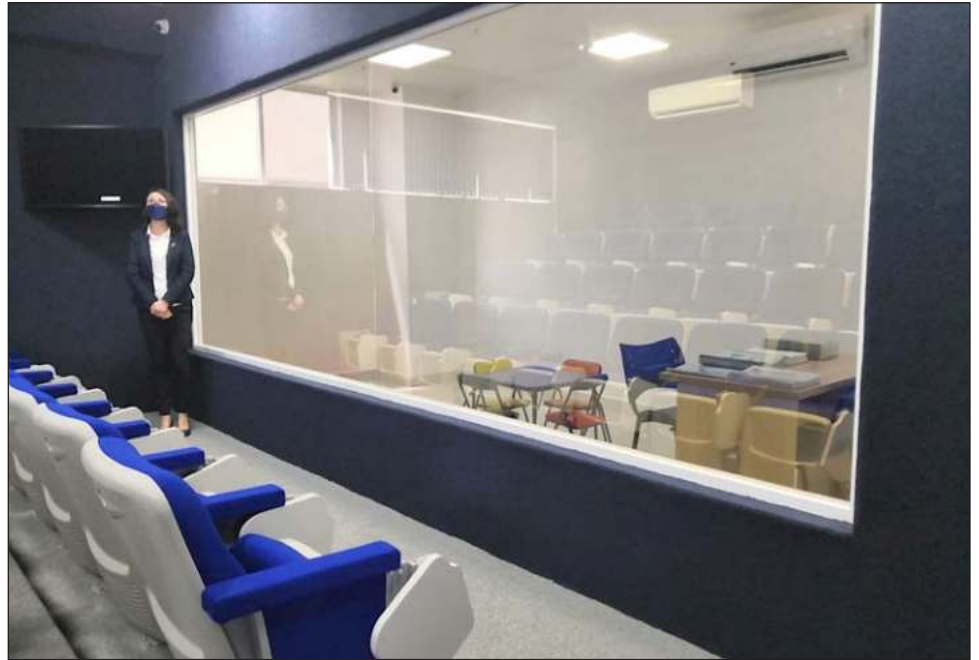
▲ En el campus ubicado en Mérida impartirán las licenciaturas en Administración de Empresas, en Criminología y Criminalística, en Derecho, Gastronomía e idiomas.