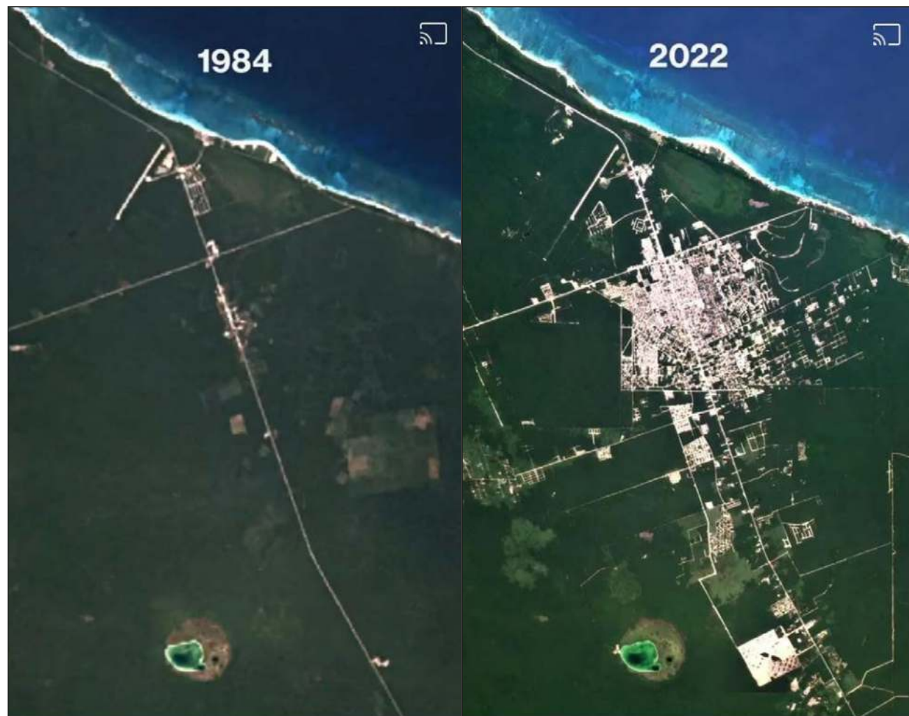
▲ La media anual de nuevas construcciones -desde micro hasta megaobras- es de aproximadamente 600.