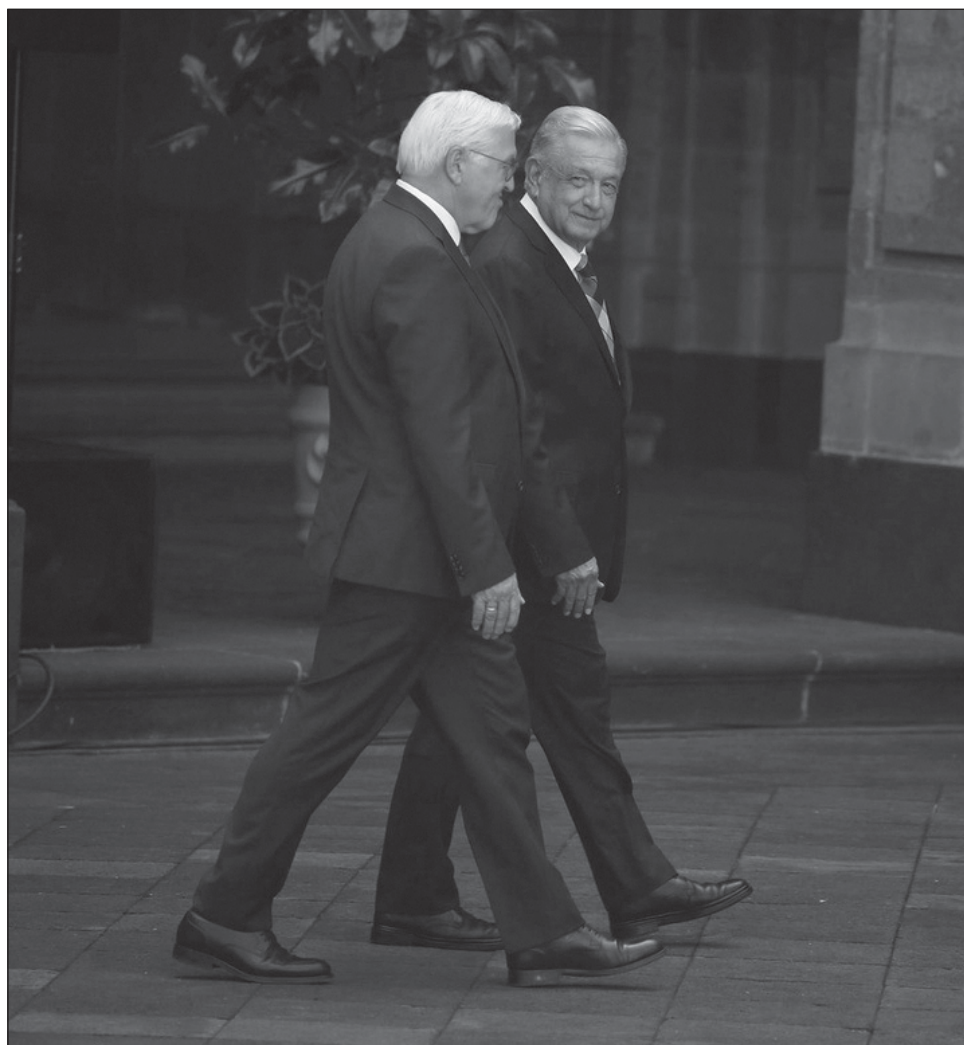
▲ La reunión bilateral con empresarios alemanes y el gabinete económico del gobierno mexicano en Palacio Nacional fue de carácter privado.

Comentó que en su visita a Reino Unido, llevó la representación de México para acompañar al pueblo británico en estos momentos difíciles. "Pude saludar al rey (Carlos III), desearle éxito para su reinado y creo que se cumplió cabalmente con la misión que teníamos".