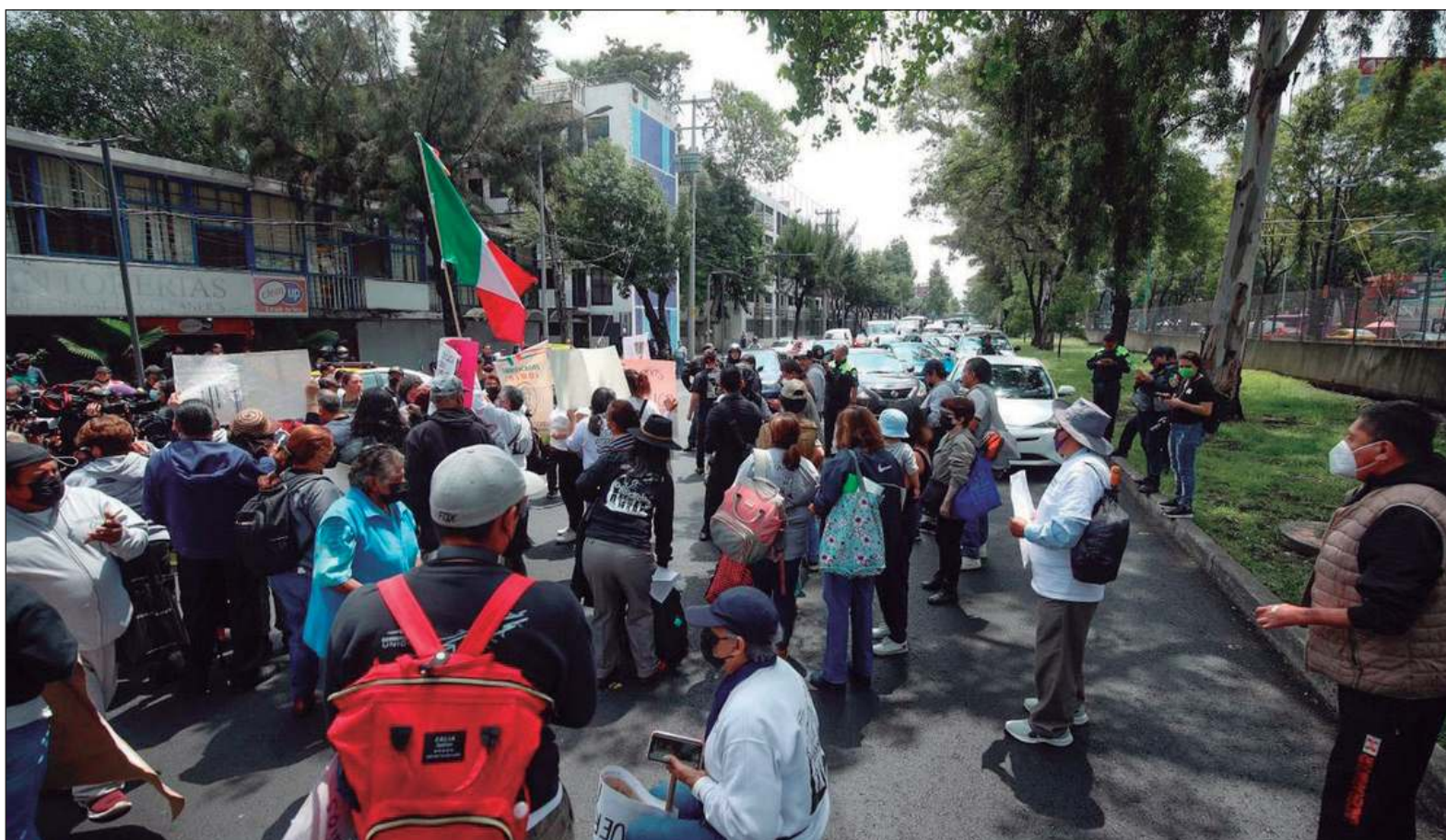
▲ “Como testigos del 19S de 2017 hay edificios, escuelas y hospitales que cinco años después no han terminado de reconstruirse”.