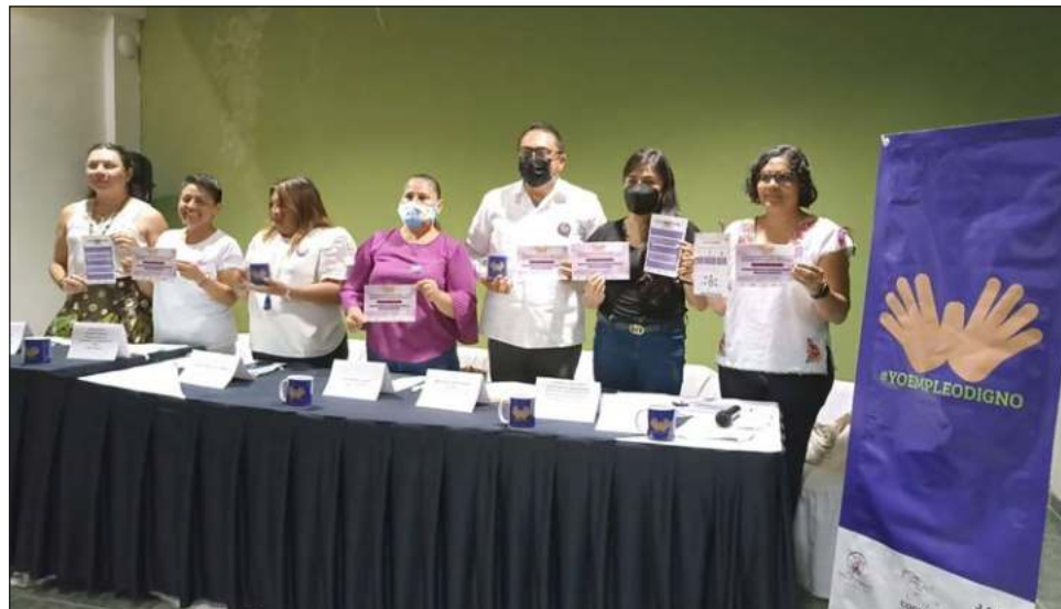
▲ Agrupaciones reunidas en la Mesa Multisectorial para Promover los Derechos de las Trabajadoras del Hogar Remuneradas en Yucatán presentaron #YoEmpleoDigno.