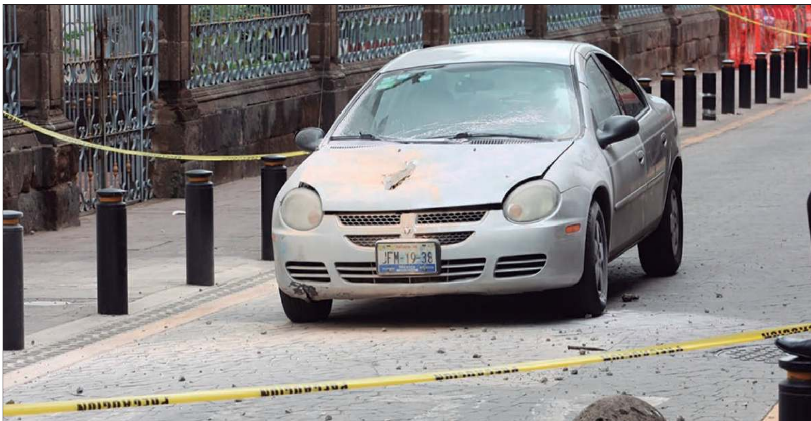
▲ "En varias ciudades, pero en particular en la de México, hay una acumulación de viviendas y edificios estructuralmente dañados desde sismos anteriores a los que no se ha dado una respuesta gubernamental adecuada y que podrían incubar posteriores tragedias".