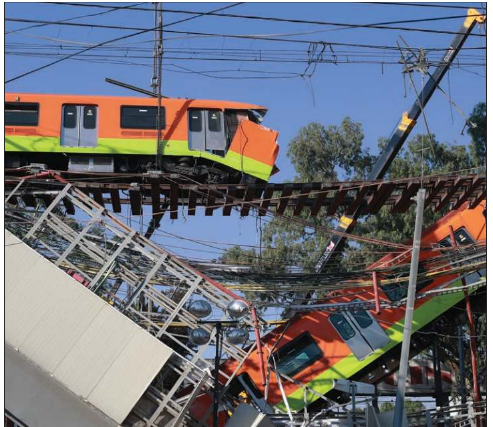
▲ En el desplome de la Línea 12, el 4 de mayo de 2021, murieron 24 personas.