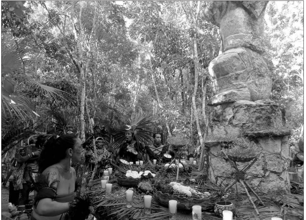
▲ Antes de iniciar la caminata, en el malecón Rafael E. Melgar, los peregrinos sahumaron las ofrendas que serían llevadas a la diosa de la Luna y solicitaron su permiso para que el recorrido fuese exitoso y sin contratiempos.

Las mejoras incluyen cambio total de pisos internos, cambio total de piso externo, aires acondicionados nuevos, impermeabilización de los dos edificios principales y la pintura a los edificios y salones.