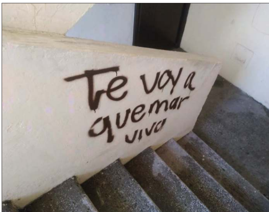
▲ Las medidas cautelares de protección fueron giradas, pero la autoridad judicial nunca las hizo efectivas, como quedó plasmado en redes.

En lo que respecta al robo de hidrocarburos: al inicio de gobierno (2018) se perdían por esta causa 72 mil barriles diarios, ahora el promedio diario por huachicol es de 6 mil barriles.