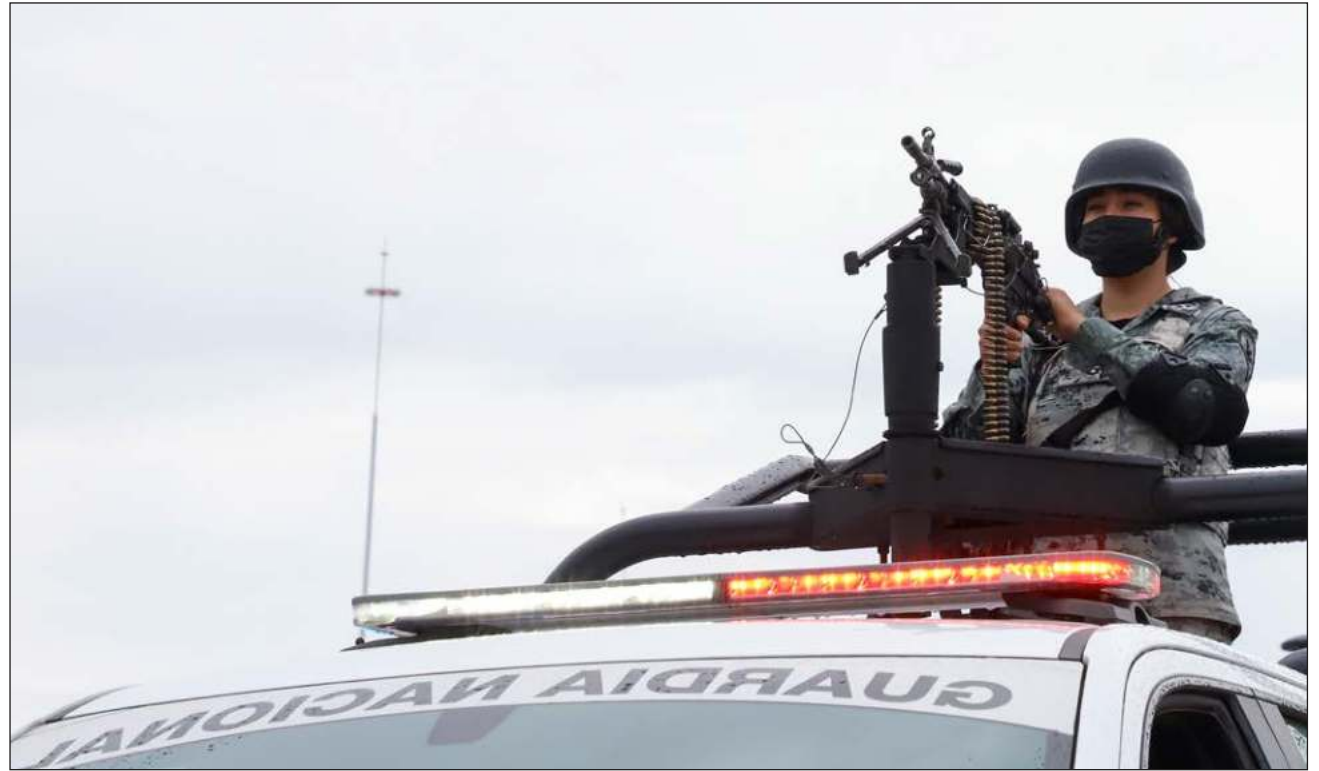
▲ En el operativo participan 3 mil 915 elementos de la SSP, Batallón Turístico, Guardia Nacional y la Marina.

Desafortunadamente, reconoció, se siguen presentando muchos problemas en algunas playas, mismos