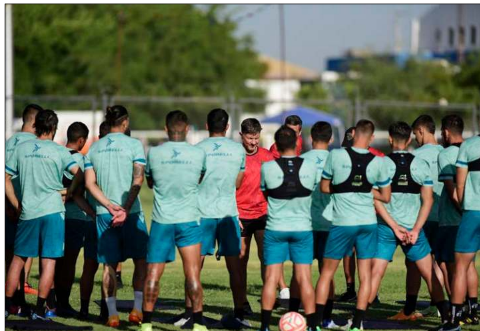
▲ El gremio de futbolistas confirmó adeudos a los Bravos de Ciudad Juárez.

"El problema es que no se arreglan contratos por meses, sino por una cantidad