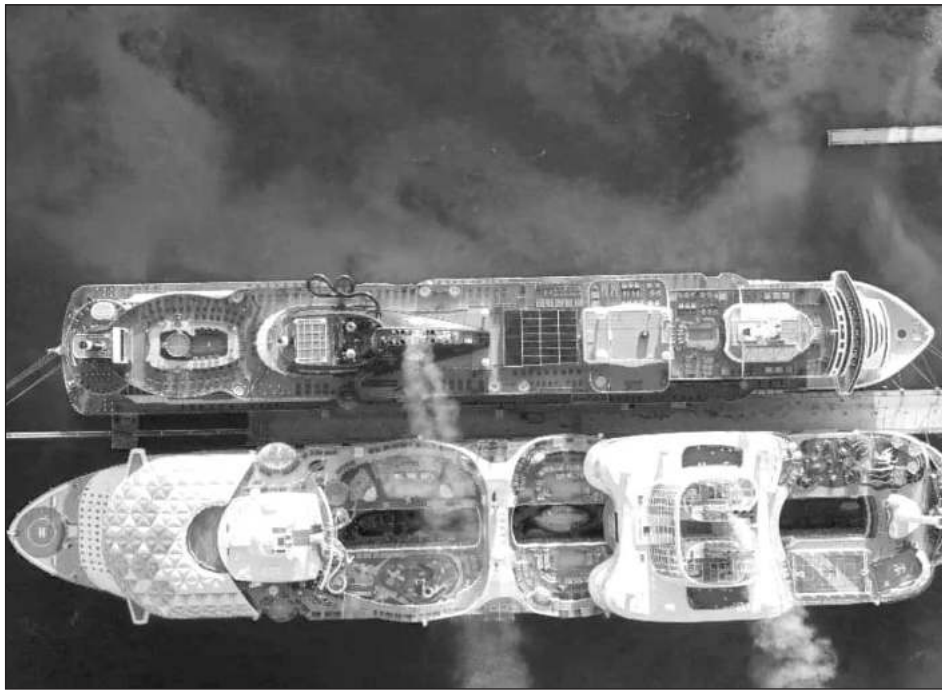
▲ Cozumel recibió un millón 912 mil 13 pasajeros en 926 cruceros, repartidos entre los muelles Puerta Maya, Punta Langosta y SSA México.

Mientras que del mes de junio de 2021 a junio de 2022 llegaron a Cozumel un total de un millón 912 mil 13