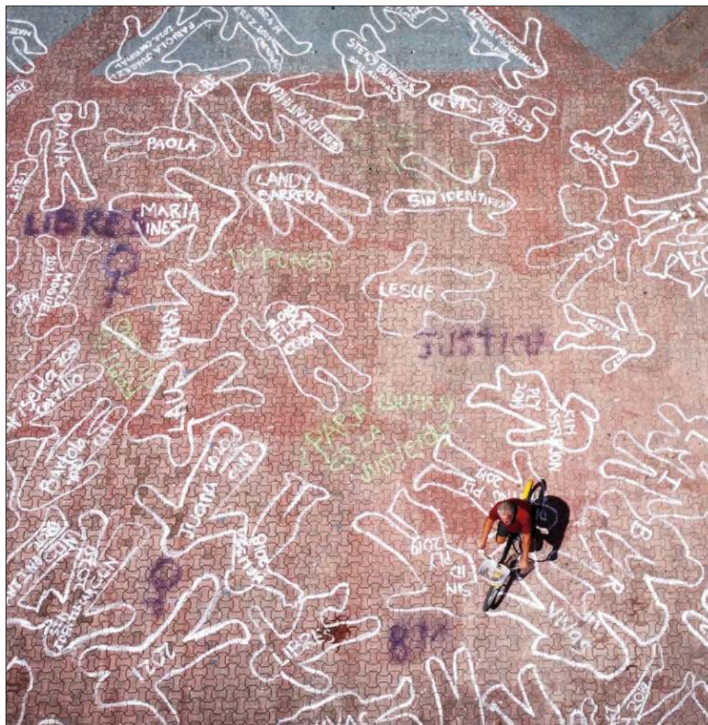
En Campeche llegó alguien y dijo que cuando la viera la mataría; en Q. Roo alguien no amenazó, mató porque era mujer; en Yucatán alguien más murió sólo por eso, ser mujer.

Cuando llegue otra vez ella a un escritorio para pedir seguridad, protección, salvar su vida, quien la escuche... ¿lo sabrá? ¿entenderán? ¿o simplemente dejarán que todo pase? ¿y que mueran y pase y pase otra vez?