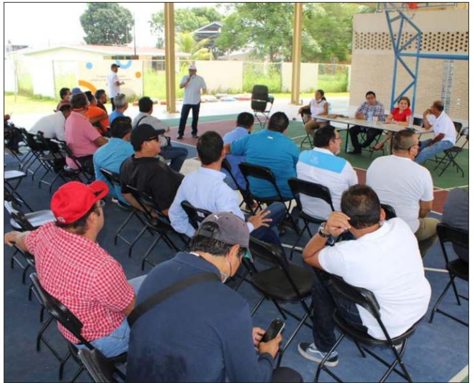
▲ Una de las principales preocupaciones de los prestadores del servicio de transporte público es la posible entrada de Grupo ADO a las rutas de Campeche.