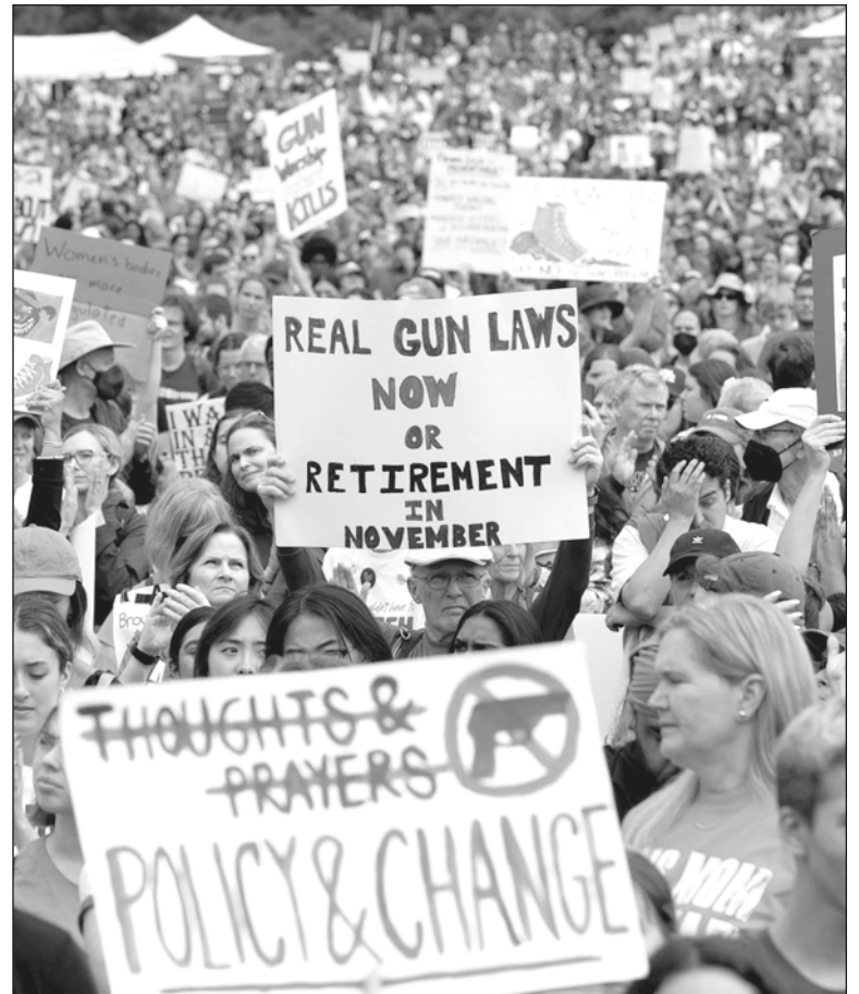
▲ While 80% of Americans want strong anti-gun legislation, their "representatives" constantly vote down any measure that aims to satisfy this demand because the NRA funds their political campaigns.

BUT WHEN VOTERS abandon political involvement, are they