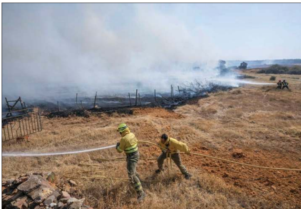
▲ El calor potenció numerosos incendios en varias regiones españolas.

La cantidad de muertos que citó Sánchez es una referencia a las estimaciones realizadas por el Instituto público Carlos III, que hace un cálculo estadístico del aumento de la mortalidad provocado por causas precisas como el alza de las temperaturas, comparando estas cifras con las series estadísticas históricas.