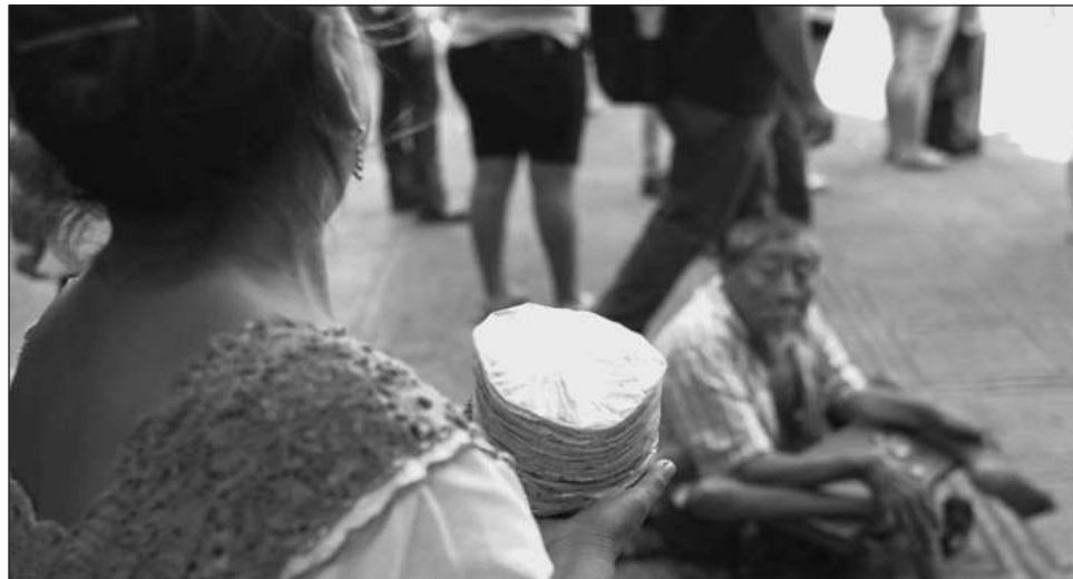
▲ Experto informó sobre el riesgo del consumo de tortillas provenientes del comercio ilegal, pues expuso que logran ahorrar dinero evitando costos de producción a costa de no pagar seguridad social, reprocesar maíz de un día anterior y, en general, con malas prácticas de salubridad.

Detalló que hasta el pasado mes de junio, el precio de las tortillas en Yucatán oscilaba entre los 22 y 26 pesos el kilo, mientras que ahora podría alcanzar hasta 28 pesos. Este ajuste de precio se da por el alza