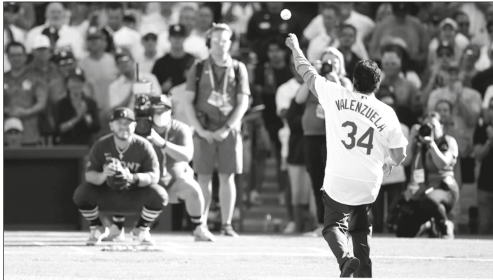
▲ Momento histórico en el Juego de Estrellas en Dodger Stadium: Fernando Valenzuela hace el lanzamiento de la primera bola al receptor tijuaneño Alejandro Kirk, quien se unió al selecto club de mexicanos con participación en el clásico.

Clayton Kershaw, seleccionado estrella en nueve ocasiones, abrió por primera vez en un clásico y lo hizo en su