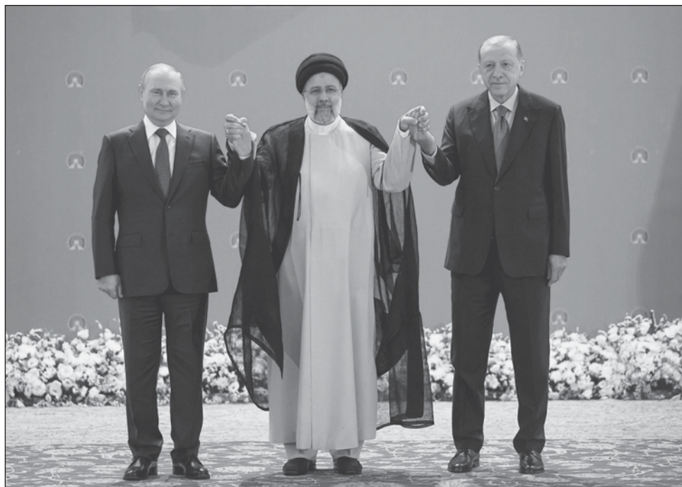
▲ El mandatario ruso agradeció a Recep Tayyip Erdogan que haya propuesto una “plataforma turca para las negociaciones” sobre la exportación de granos.

El ministerio ruso de Defensa indicó el viernes que dentro de poco estará listo un documento final que permita la exportación de granos. El acuerdo permitiría la salida por el Mar Negro de 20 millones de toneladas de granos bloqueados en los puertos ucranios debido a la ofensiva rusa.