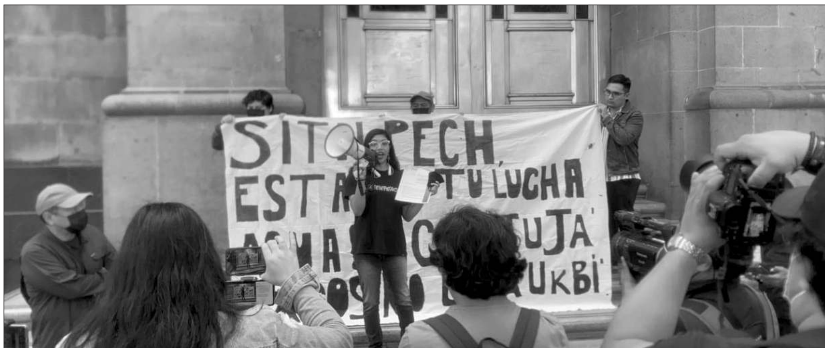
▲ Los vecinos de Sitalpech presentaron más de 700 firmas respaldando su solicitud para que la Corte intervenga en un recurso de queja que, en su consideración, pone en riesgo el juicio de amparo en contra de una meggranja porcícola.