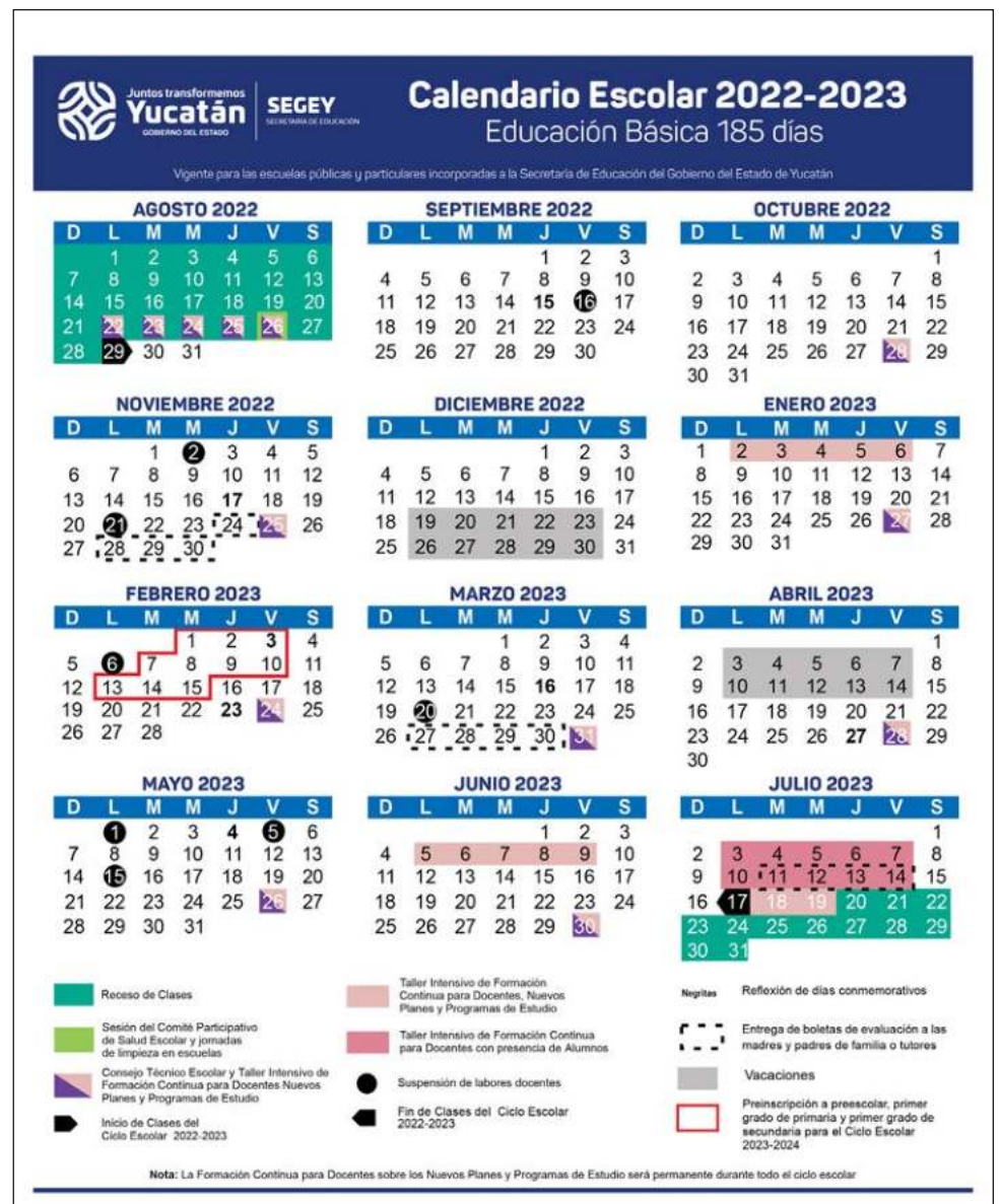
▲ El calendario escolar de Yucatán para 2022-2023 es de 185 días, mientras que el establecido a nivel nacional contempla 190 jornadas y termina el 26 de julio.

En preparación al regreso a clases, la Segey enfocará sus esfuerzos en la rehabilitación, mantenimiento y construcción de infraestructura educativa.