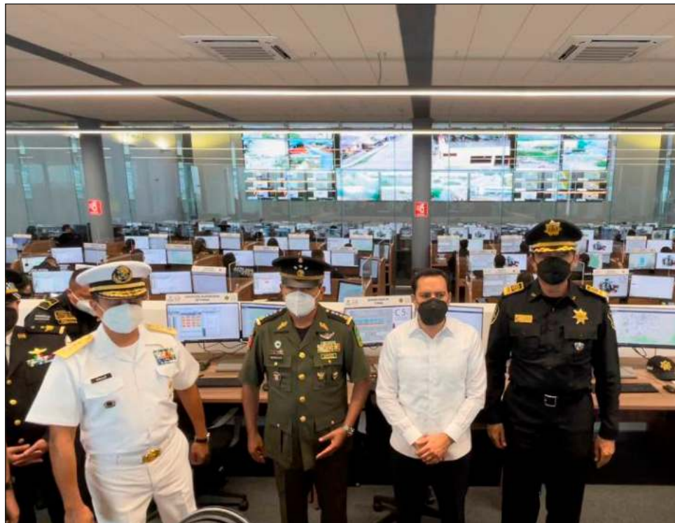
▲ El reporte señala que Yucatán continúa manteniéndose como la entidad con menor tasa de homicidios dolosos en el país, 11 veces menor a la nacional.

En materia de percepción de seguridad, la En-