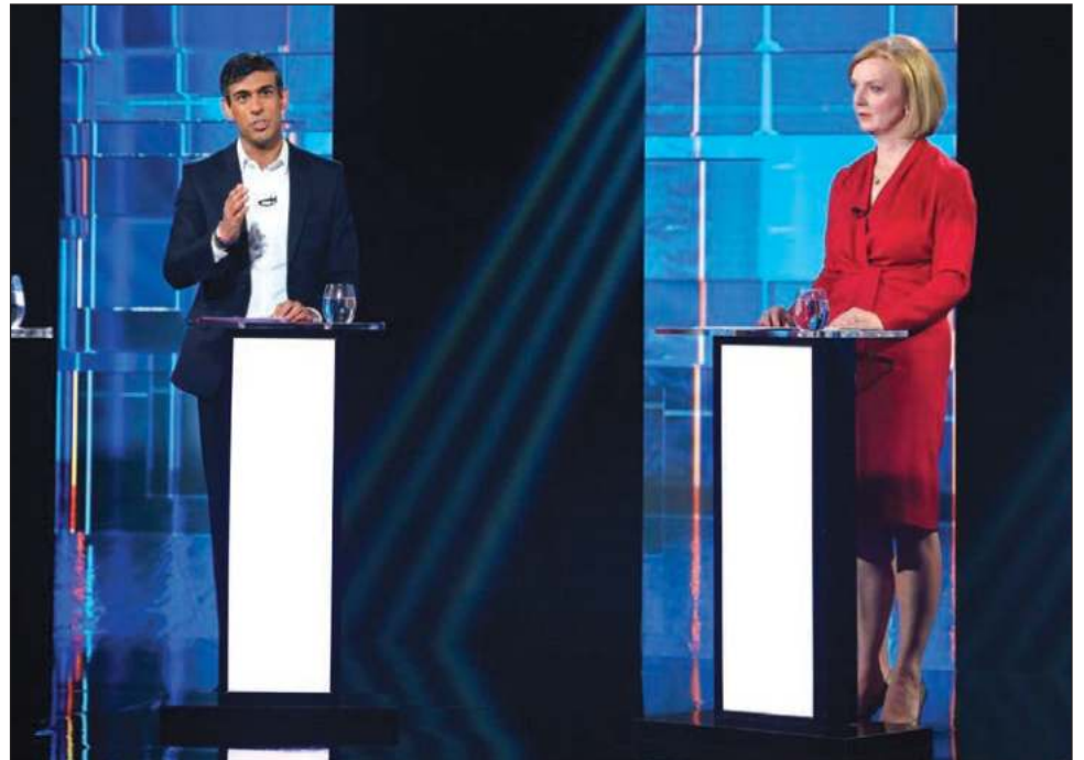
▲ La amarga campaña ha expuesto profundas divisiones en el Partido Conservador al final del reinado de tres años de Johnson empañado por el escándalo.

La amarga campaña ha expuesto profundas divisiones en el Partido Conservador al final del reinado de tres años de Johnson empañado por el escándalo.