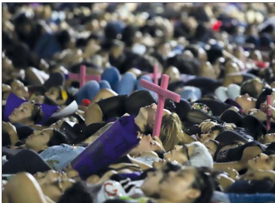
“Son procesos tan largos que por eso los feminicidas se terminan yendo, es muy fácil matar a alguien y huir porque no hay una acción pronta de las autoridades”.

Beltrán Aragón recuerda que Apis Sureste es un espacio seguro para las víctimas porque cuenta con personal especializado. Las puertas de la asociación están abiertas para quienes requieran atención psicológica, asesoría jurídica y, en caso de ser necesario, refugio temporal. Las oficinas se encuentran en Calle 27A, número 114A, entre 22 y 24A, Loma Bonita Xcumpich, en Mérida y el teléfono de contacto es el 999 988 4048.