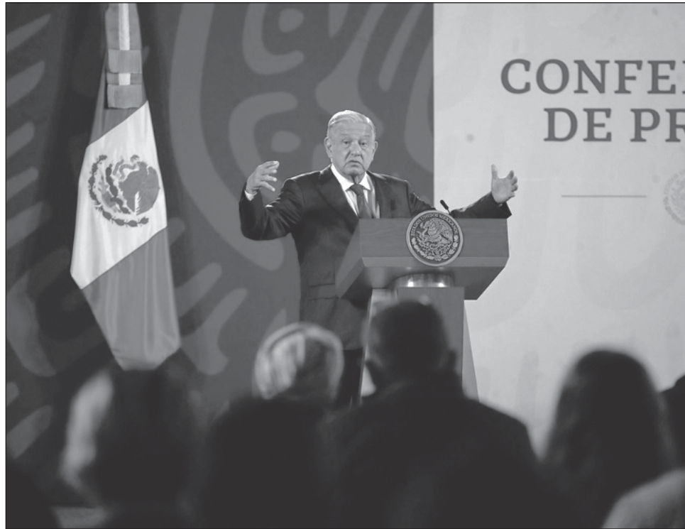
▲ López Obrador indicó que la Secretaría de Economía recibirá y analizará la solicitud de la Oficina de Representación Comercial de Estados Unidos.

“Vamos a recibir la propuesta, se va a analizar, lo hará la secretaría de Economía. No hay ningún problema, de nada, todo lo que estamos haciendo en materia energética,