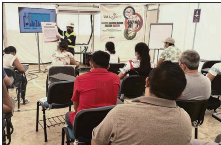
▲ Tan sólo en 2021, el Centro de Excelencia Operacional capacitó a más de tres mil personas recién ingresadas.

Parte importante de los talleres teórico-prácticos –abunda– es el concepto de inocuidad, debido a que es una de las características