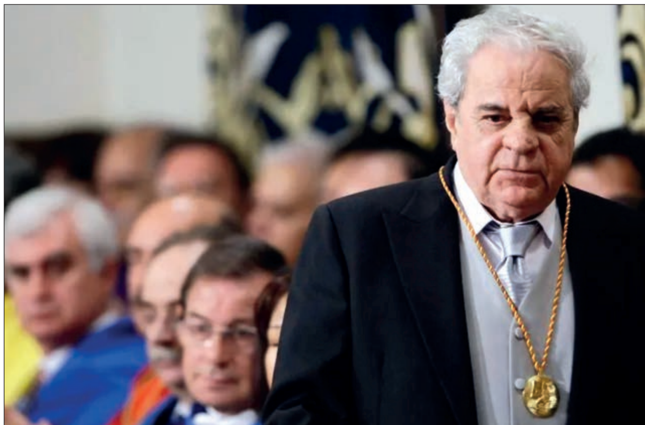
▲ Marsé era un hombre sencillo y tímido que vivió al margen de los reflectores.

Por eso muchas veces se definía como un escritor obrero. Un trabajador infatigable que derivó en las letras por su devoción de los libros de aventuras –su primer autor de culto fue Stevenson–