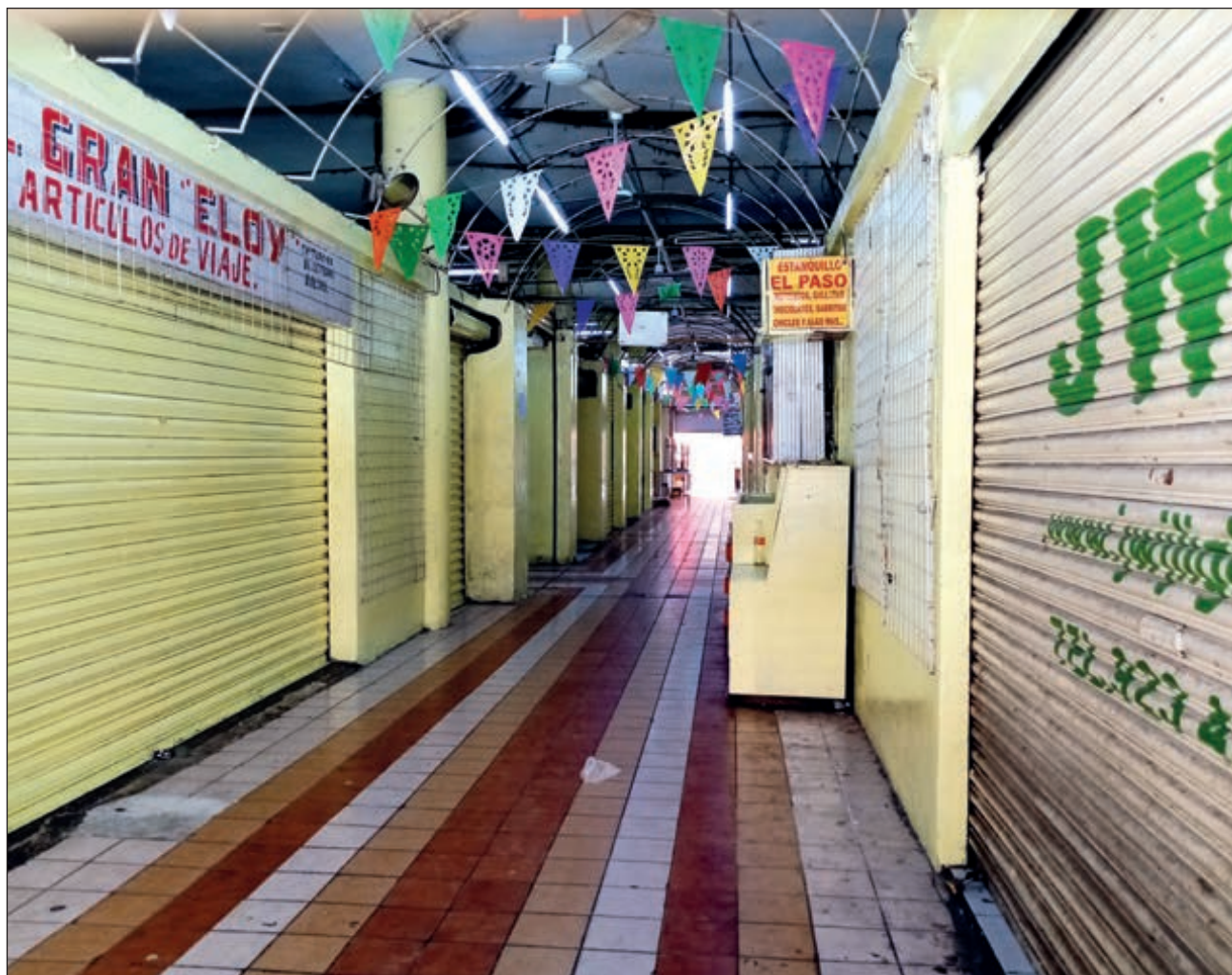
▲ En opinión del presidente de la Canaco Mérida, quienes tienen negocios no esenciales tendrán la garantía de que al cerrar a las seis de la tarde, no habrá empresas como Elektra o Coppel vendiendo de todo sin ninguna restricción. En la imagen, el bazar García Rejón, en el centro de Mérida.