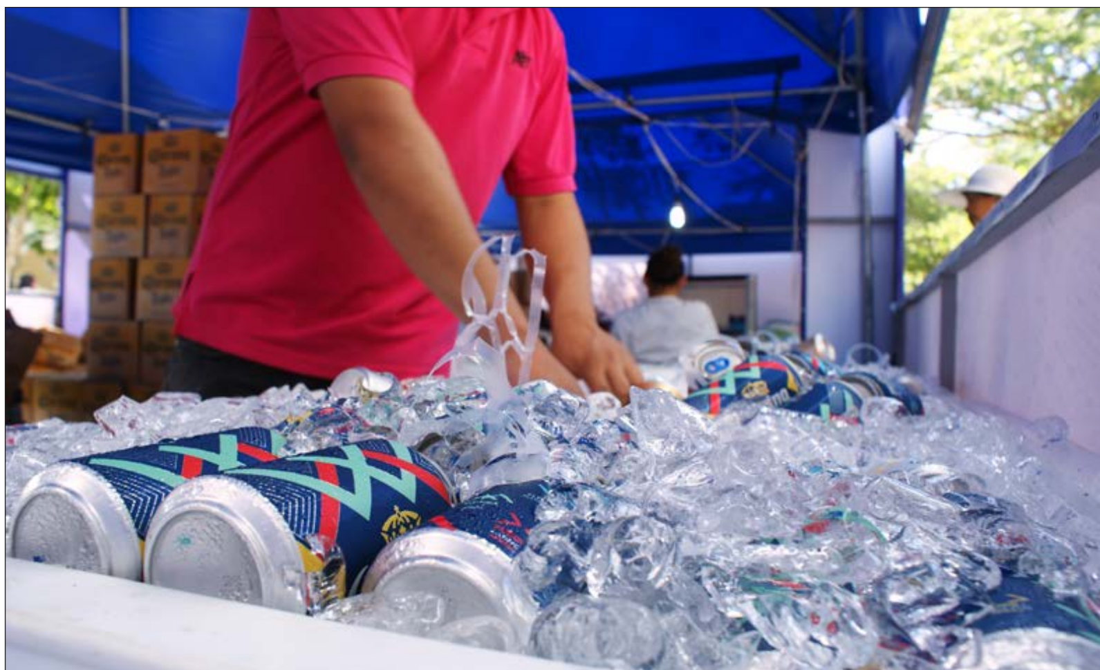
▲ Durante el interruptus que nos aplicó el gobernador pude conseguir algo de bastimento, gracias al señor; al señor de la agencia, por supuesto, que registró mi teléfono y tuvo la cortesía de avisarme para que pudiera hacer un encargo.