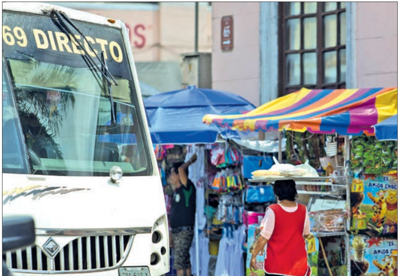
▲ Los residentes de las colonias en las que hay más personas infectadas con COVID-19 son los grandes usuarios del servicio de transporte público, que coinciden en el centro de Mérida.

A estas condiciones debe añadirse la deficiente venti-