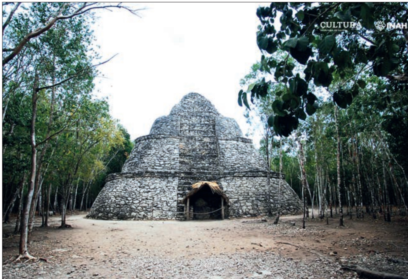
▲ Pese a los nuevos hallazgos dinásticos del sitio, aún no se ha develado por completo la historia antigua de Cobá. Los arqueólogos refieren que sólo ha sido explorado uno por ciento de la urbe maya.

“El uso de los puntos suspensivos indica que existe una porción del nombre que no podemos leer; mientras que a los cinco soberanos cuyo antropónimo desconocemos, se les designa con una letra mayúscula: A, B, C, D y E”, explica el especialista.