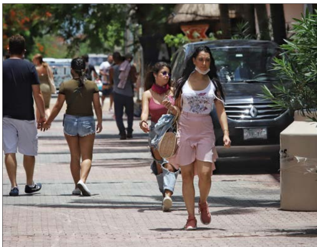
▲ Forzar el acatamiento de precauciones de sentido común da pie a la comisión de atropellos. En la imagen, peatones en Playa del Carmen.

Ni las actitudes autoritarias por parte de autoridades civiles ni las posturas irresponsables asumidas por organizaciones religiosas contribuyen a concientizar a la sociedad ni a reforzar las conductas informadas, sensatas y solidarias que tanto se necesitan en la actual circunstancia.