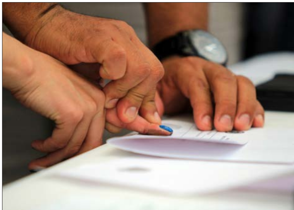
▲ El mérito ubica a Yucatán de nuevo como punta de lanza cuando se habla de la investigación de los delitos a través de huellas dactilares.

Añadió que ya son cuatro los Laboratorios de la FGE con una certificación internacional, lo que avala cada uno de sus métodos y procedimientos para la investigación de los delitos y pone a Yucatán a la vanguardia, hecho que además "nos hace sentirnos orgullosos de la institución para la que trabajamos".