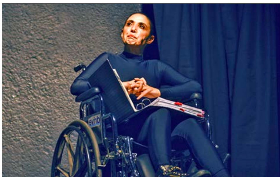
▲ En el montaje se desarrollan seis historias reales y una ficticia de mujeres que viven con discapacidad.

La temporada es cada jueves, hasta el 13 de agosto y tras cada función se lleva a cabo una mesa de debate a través de Facebook Live para reflexionar sobre el tema de la discapacidad. El acceso es gratuito. Para acceder a cada función, el registro se hace en el sitio web www.lamanchaproducciones.com