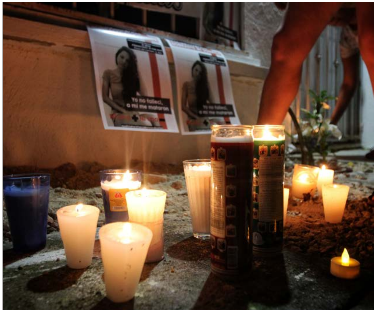
▲ Del 26 de marzo al 7 de junio, que coincide con el periodo de aislamiento, se atendieron 237 llamadas de auxilio por violencia sexual y familiar.