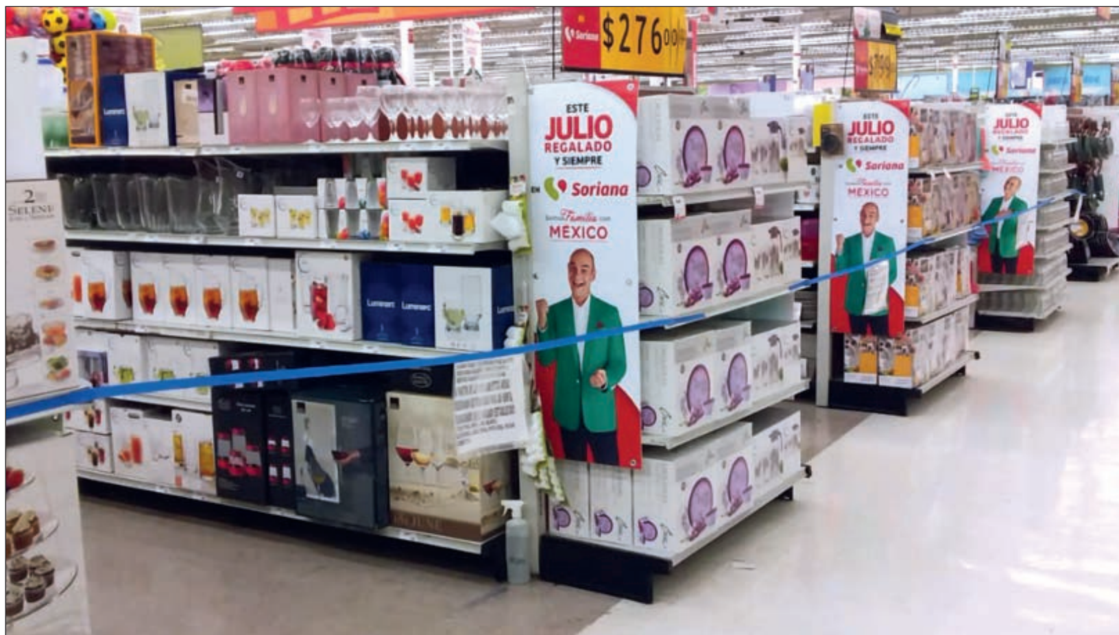
▲ Algunos establecimientos, como Walmart y Soriana, ofrecen la modalidad a domicilio con un costo adicional, en caso de que el cliente requiera productos como alimento para mascotas, ropa o artículos de perfumería.

Algunos estuvieron de acuerdo, afirmando que mucha gente va al supermercado de curioso y ocioso, por lo que las medidas deben ser rigurosas para que haya menos gente.