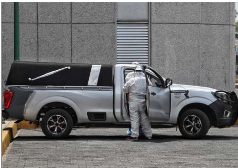
▲ México acumula 39 mil 184 muertos por COVID-19. En Yucatán, por segundo día consecutivo, la cifra diaria de fallecimientos disminuyó, luego de varias jornadas arriba de 30 decesos.

En total, ya son 7 mil 475 infectados, 89 de los cuales son de otro país o estado.