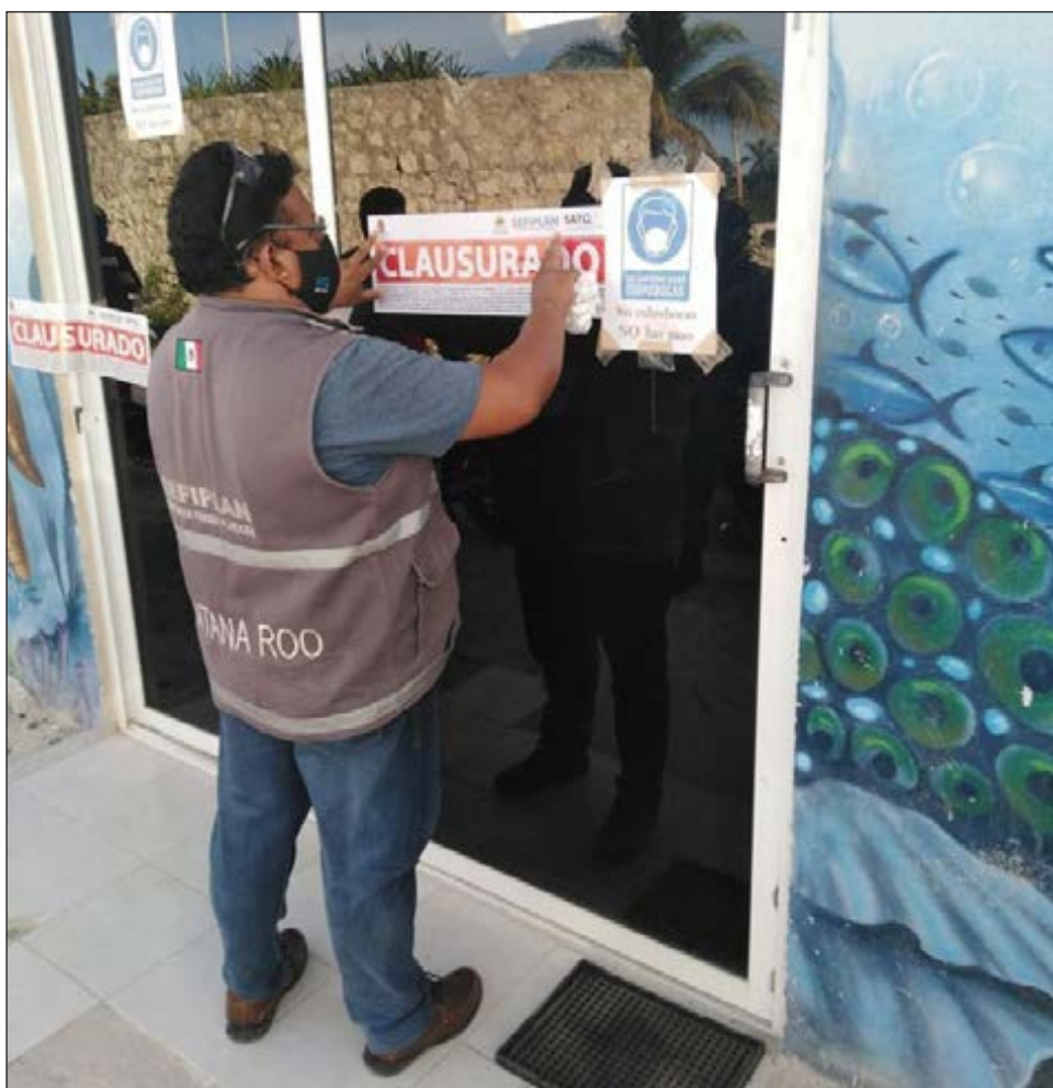
▲ La Sefiplan detuvo las actividades de 24 establecimientos tan sólo en el municipio de Benito Juárez.

Othón P. Blanco, municipio donde hay mayor número de denuncias de clandestinos