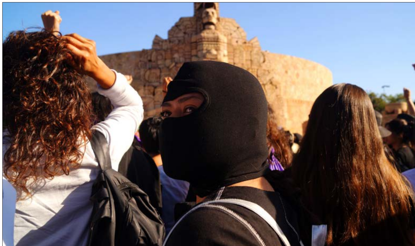
▲ Jamás podrá robarnos la esperanza de que todo esto pasará, y de qué seguiremos en la lucha. Porque como se dijo el 8 de marzo: nos matan, pero ni así nos callan.