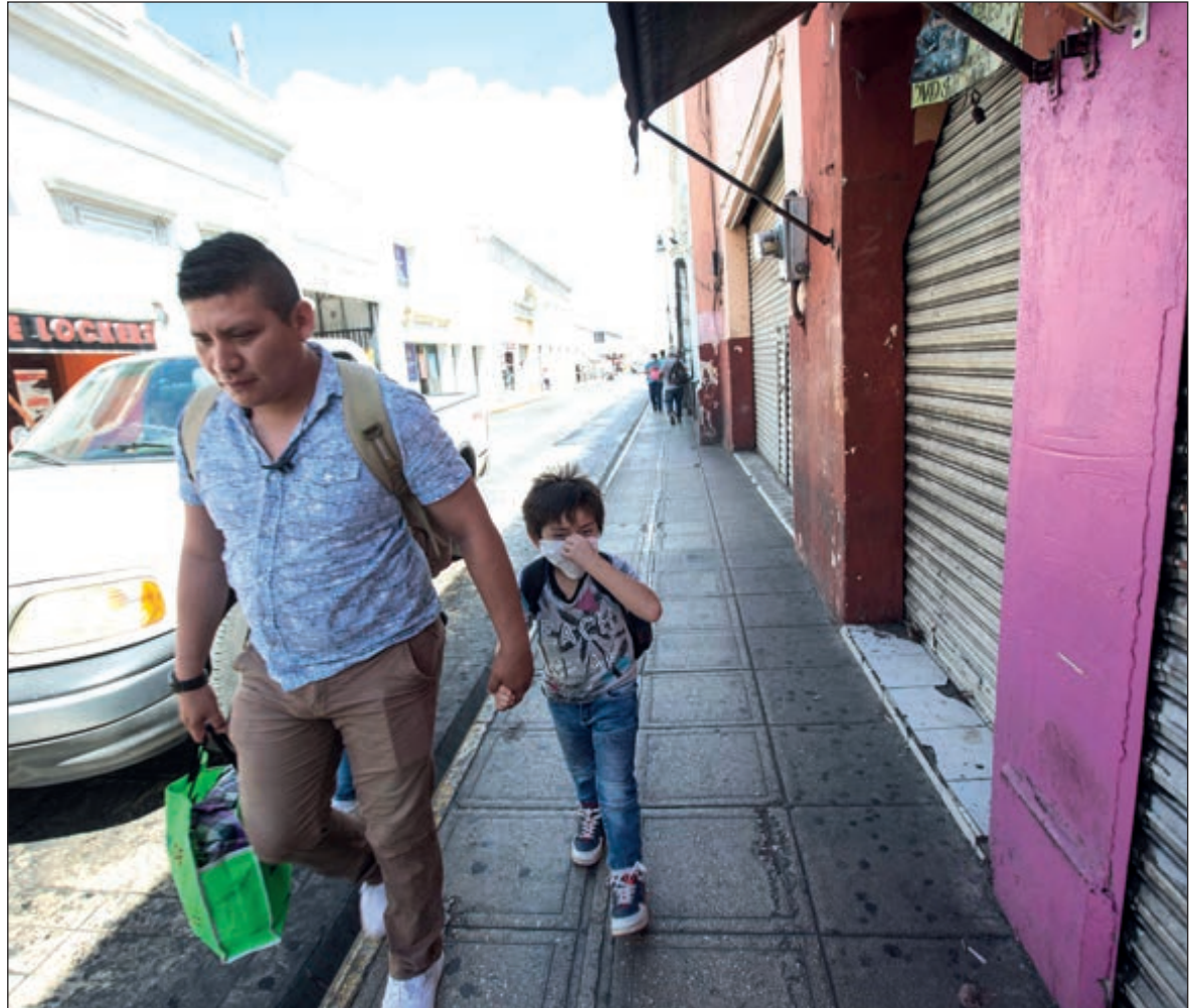
▲ Mucha gente, demasiada, no toma las precauciones necesarias. ¿Dónde quedó el instinto de sobrevivencia?

Sabemos también que uno de los elementos de la evolución en el ser humano es el instinto de