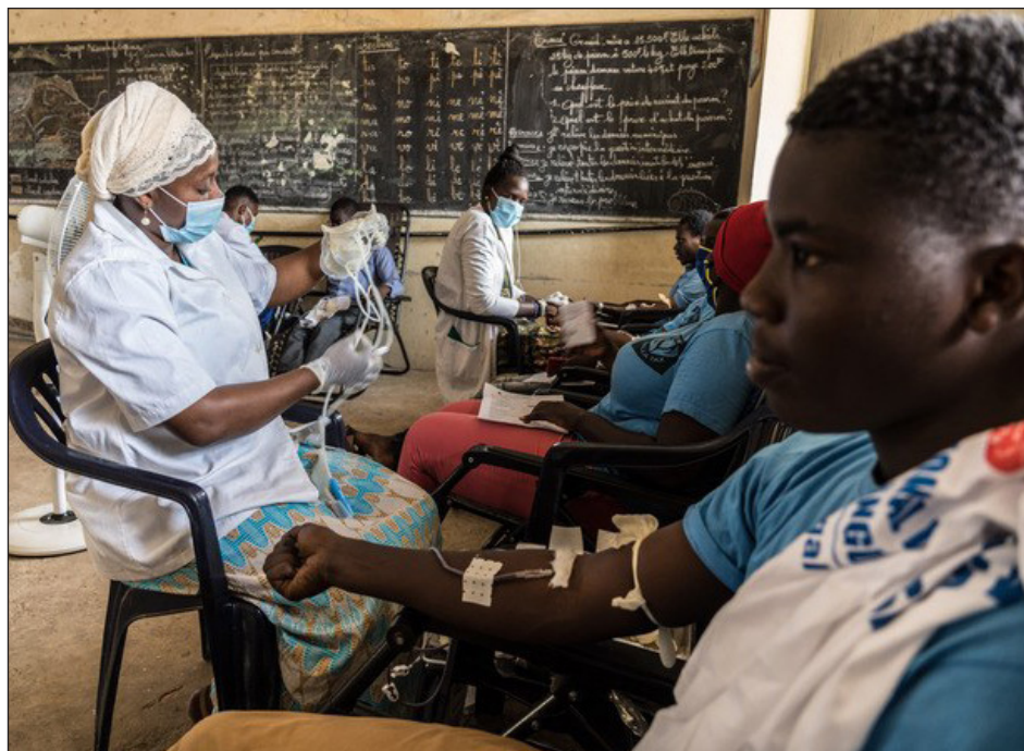
▲ Sudáfrica corre el riesgo de ser un precursor de lo que va a pasar en el resto del continente, asegura el director de emergencias sanitarias de la OMS.