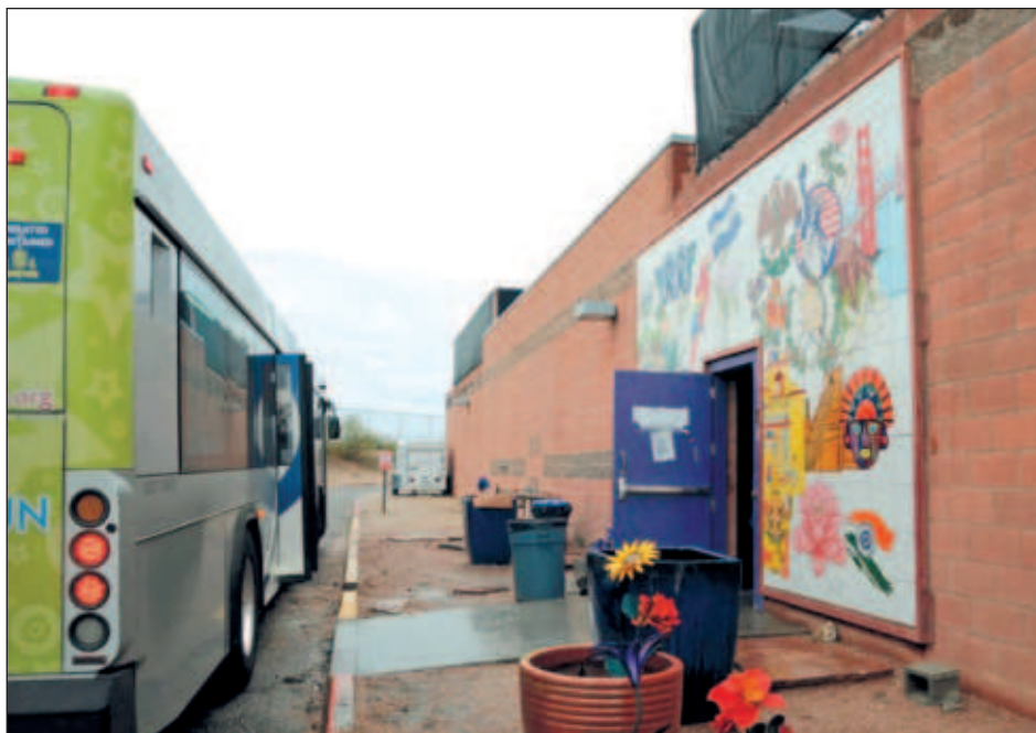
▲ Casa Alitas opera dos instalaciones en la ciudad de Tucson y recibe entre 500 a mil migrantes diariamente; tiene más de una década sirviendo como refugio, además de que se ha convertido en un modelo a seguir que asiste a indocumentados.

El centro, que opera dos instalaciones en la ciudad de Tucson, recibe entre 500 a mil migrantes diariamente. Casa Alitas que tiene más de una década de operaciones, se ha convertido en un modelo a seguir que asiste a migrantes a lo largo de la frontera con México. Sin