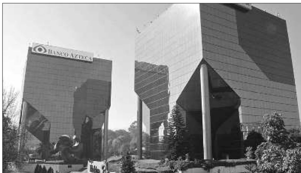
▲ El titular del Servicio de Administración Tributaria dijo “nosotros no vemos nombres de personas y empresas, sino vemos operaciones contables con repercusiones fiscales”.

Durante la conferencia de presidencia, Martínez dijo que en una parte importante el consorcio intentó utilizar el mecanismo de consolidación fiscal que desapareció en 2013 mediante el cual las empresas de un grupo presentaban sus cuentas fiscales en conjunto lo que les permitía postergar