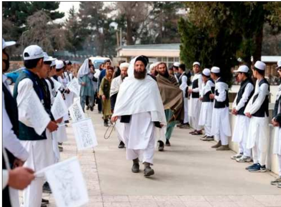
▲ “Desde hace más de 900 días, las niñas mayores de 12 años no pueden ir a la escuela”, lamentó la Misión de Asistencia de las Naciones Unidas en Afganistán.

“Desde hace más de 900 días, las niñas mayores de 12 años no pueden ir a la escuela”, lamentó la Misión de Asisten-