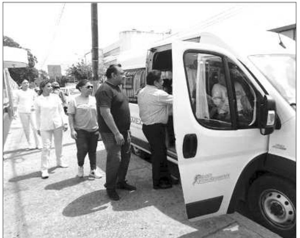
▲ Con este simulacro se activó el "código café", mismo que permitió evaluar el adiestramiento del personal ante la respuesta a emergencias, en caso de presentarse un fenómeno meteorológico.

Tras el simulacro, que tuvo una duración de aproximadamente 40 minutos, el personal del Hospital de Pemex, de Seguridad Física de Pemex, de Protección Civil, entre otros, evaluaron los alcances de este simulacro.