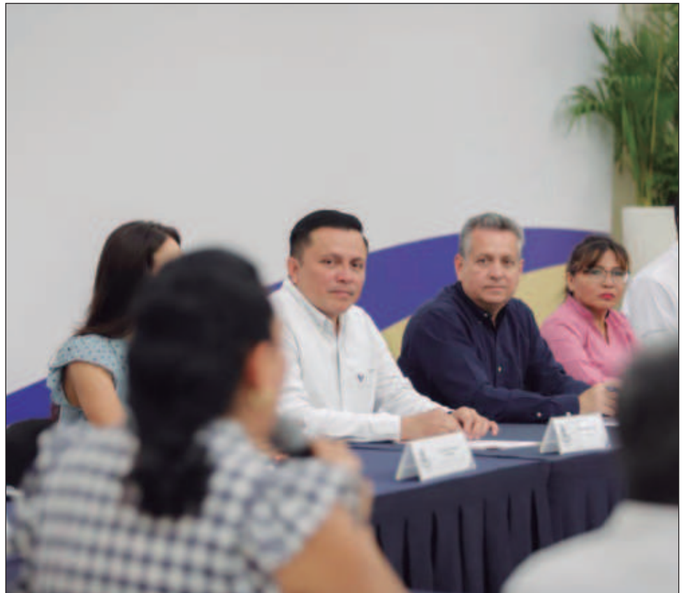
▲ El alcalde de Mérida encabezó la novena Sesión Ordinaria del Consejo Municipal de Salud, donde informó que se brindaron 18 mil consultas médicas.

De igual manera, mencionó la realización de los talleres de cocina saludable en la Universidad Mesoamericana de San Agustín (UMSA) y Centro Universitario Rodríguez Tamayo (CERT), así como la creación del QR para conocer el catálogo de sesiones y talleres de este centro municipal