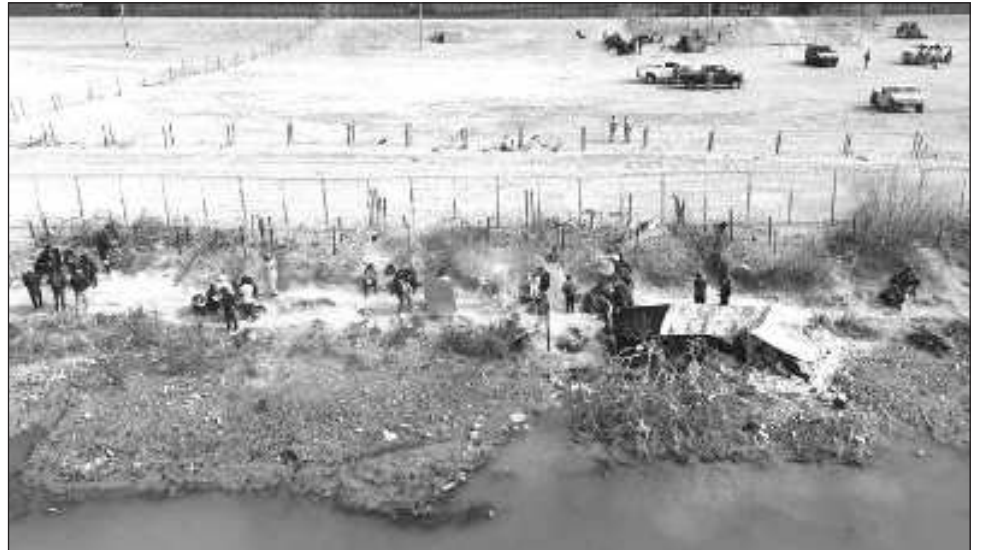
▲ Los migrantes que lograron ingresar al territorio estadounidense tenían la intención de entregarse a la Patrulla Fronteriza para pedir asilo, pero fueron regresados a México.

Aparte en declaraciones públicas, la gobernadora panista de Chihuahua, María Eugenia Campos Galván, ofreció colaboración con Texas y con el gobernador Gregg Abbot, tras la entrada en vigor de la Ley SB4.