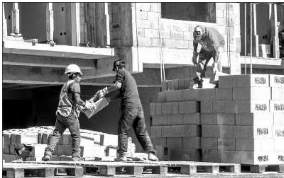
▲ El presidente nacional de la cámara dijo que “este documento se está presentando en diferentes foros, principalmente en donde hay elecciones” para mejorar la oferta de casas.

En esta ocasión el presidente nacional de la cámara llegó a Cancún para presentar el plan antes mencionado a integrantes del sector, así como a diputados locales y la idea es hacer lo mismo con los candidatos que también buscarán un cargo público en el actual proceso a nivel local.