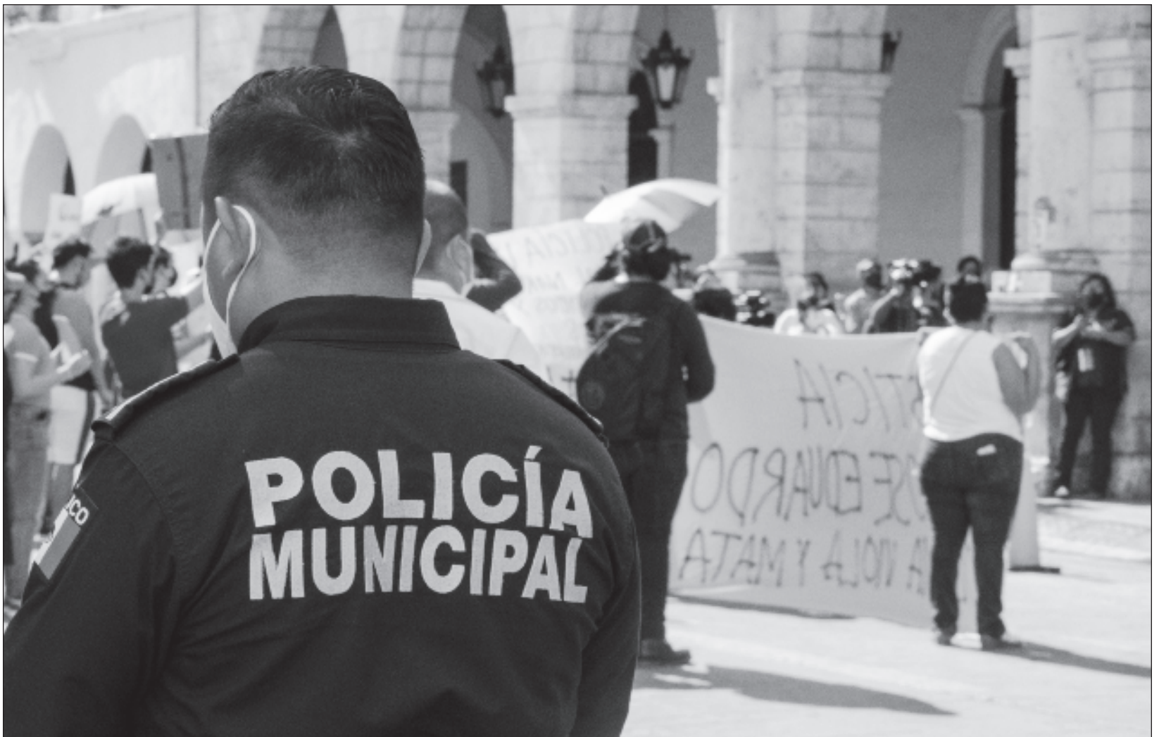
▲ Respecto a los gobiernos municipales por área metropolitana, Mérida aparece en la encuesta del Inegi con una confianza de 58.6 por ciento, ocupando el quinto lugar nacional; San Francisco de Campeche está en el lugar 14 con 54.4 por ciento y la ciudad de Cancún en la posición 22.

La ENCIG ofrece información sobre la satisfacción con servicios públicos básicos y bajo demanda entre la población de 18 años y más que reside en localidades con al menos 100 mil habitantes, explica el Inegi.