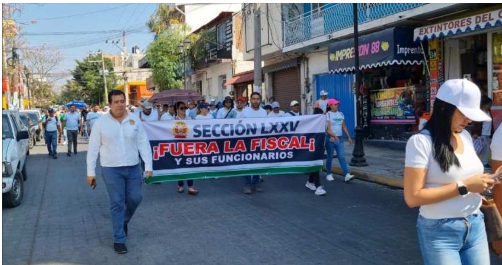
▲ Demandan la intervención de la gobernadora para que no haya militares en la Fiscalía, ya que es un organismo de investigación de carácter civil y no castrense.