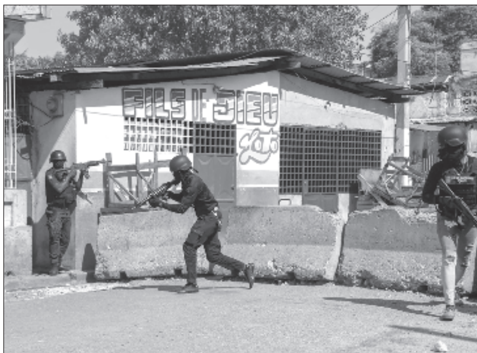
▲ Embajadas y organizaciones internacionales están procediendo a reducir y evacuar personal en Haití, a causa de la escalada de violencia a manos de bandas armadas.

El lunes pasado, el primer ministro haitiano, Ariel Henry, anunció en un mensaje a la nación que dimitirá en cuanto esté implementado un consejo presidencial de transición, que deberá ponerse de acuerdo para designar un nuevo jefe de Gobierno y abrir el camino a que se celebren elecciones presidenciales.