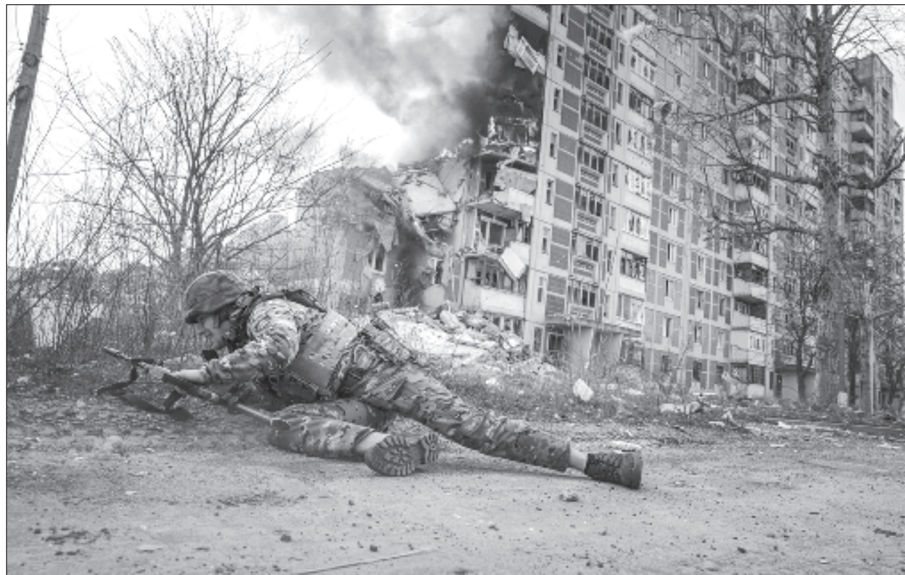
▲ La financiación puente es un mecanismo acordado entre Bruselas y Kiev para atender las necesidades presupuestarias urgentes.

Von der Leyen valoró que es “un buen día” para Ucrania porque los fondos ya fluyen desde Bruselas para que Kiev haga frente a los gastos más acuciantes de su administración, sometida a una gran tensión por la guerra de invasión rusa.