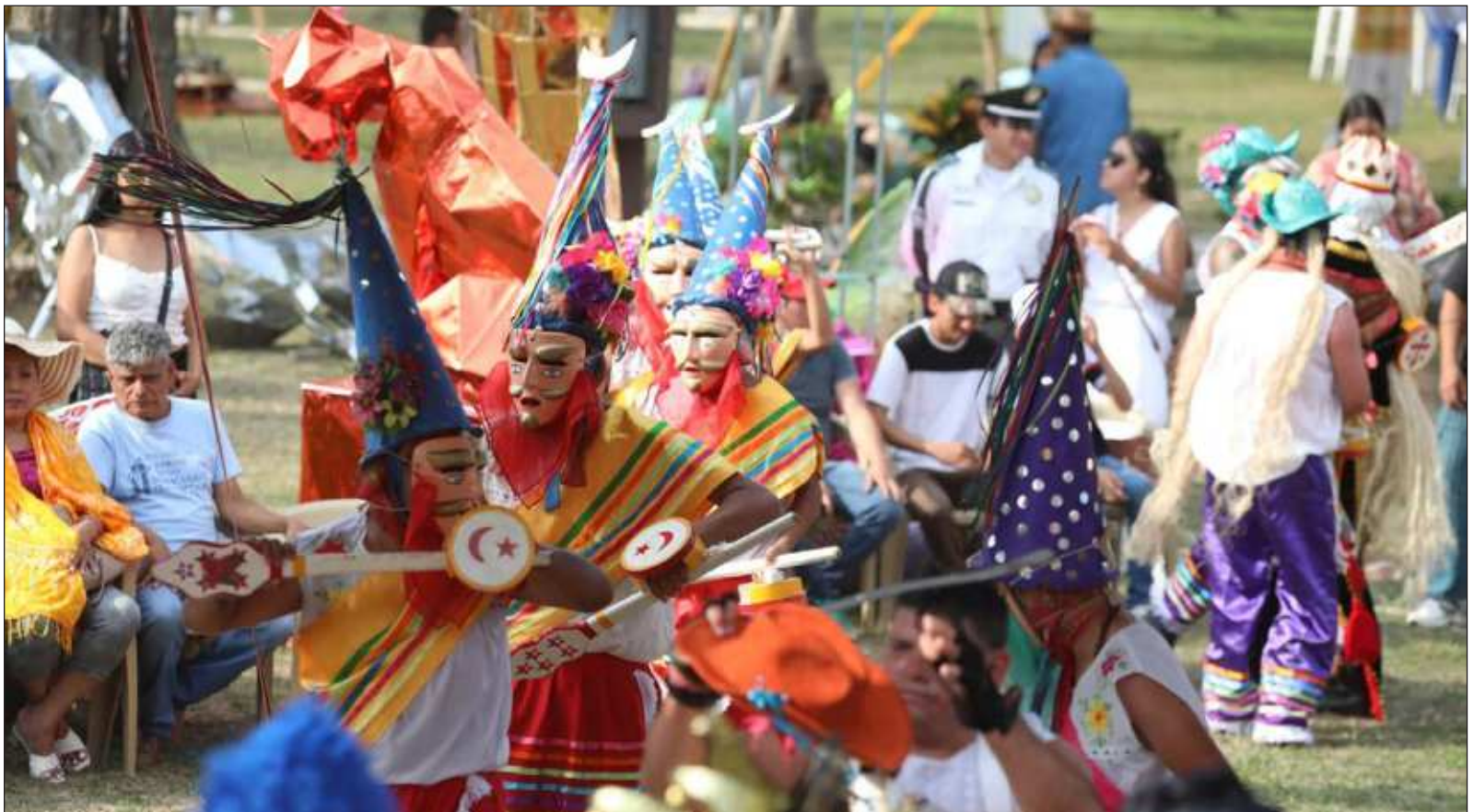
▲ Cumbre Tajín "ha detonado una serie de proyectos sociales, educativos y culturales que han conseguido que el Totonacapan sea una de las regiones culturales más vitales y un modelo para diversos pueblos indígenas para salvaguardar y revitalizar su tradición".