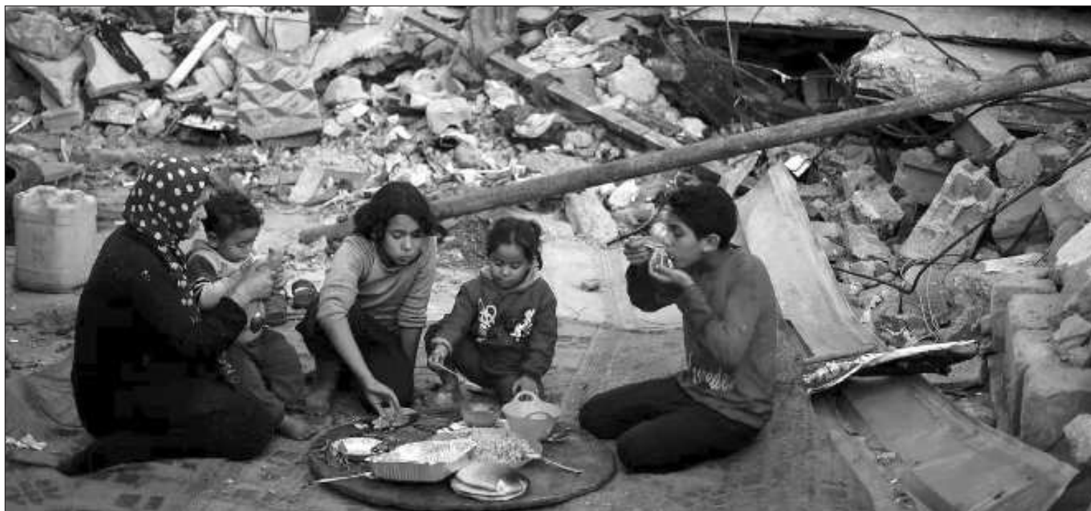
▲ "Iniciar la campaña 'No dejemos de hablar de Palestina', destinada a la denuncia, divulgación y análisis de la agresión sistemática del Estados sionista".

Las cartas a las autoridades universitarias se entregarán de manera presencial en las diversas instituciones en el transcurso de los próximos días. Las cartas a los gobiernos progresistas se entregaron el día 23 de enero de 2024.