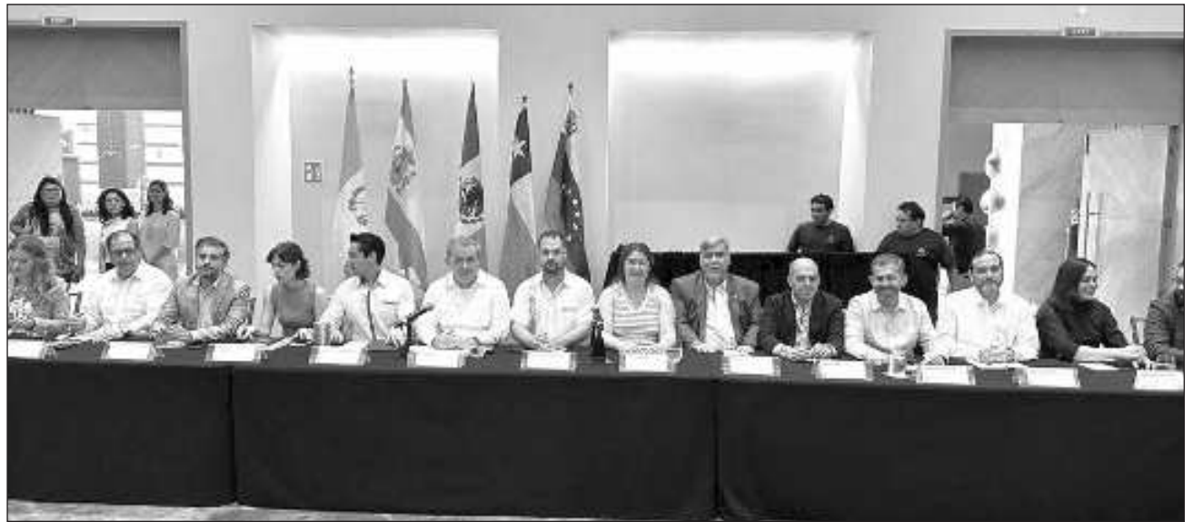
▲ Durante la primera jornada del evento, los expertos coincidieron en que México es “uno de los países líderes en el desarrollo del turismo” porque logró darle visibilidad a las comunidades y territorios rurales.

“Como destino líder en materia turística de México y América Latina, el