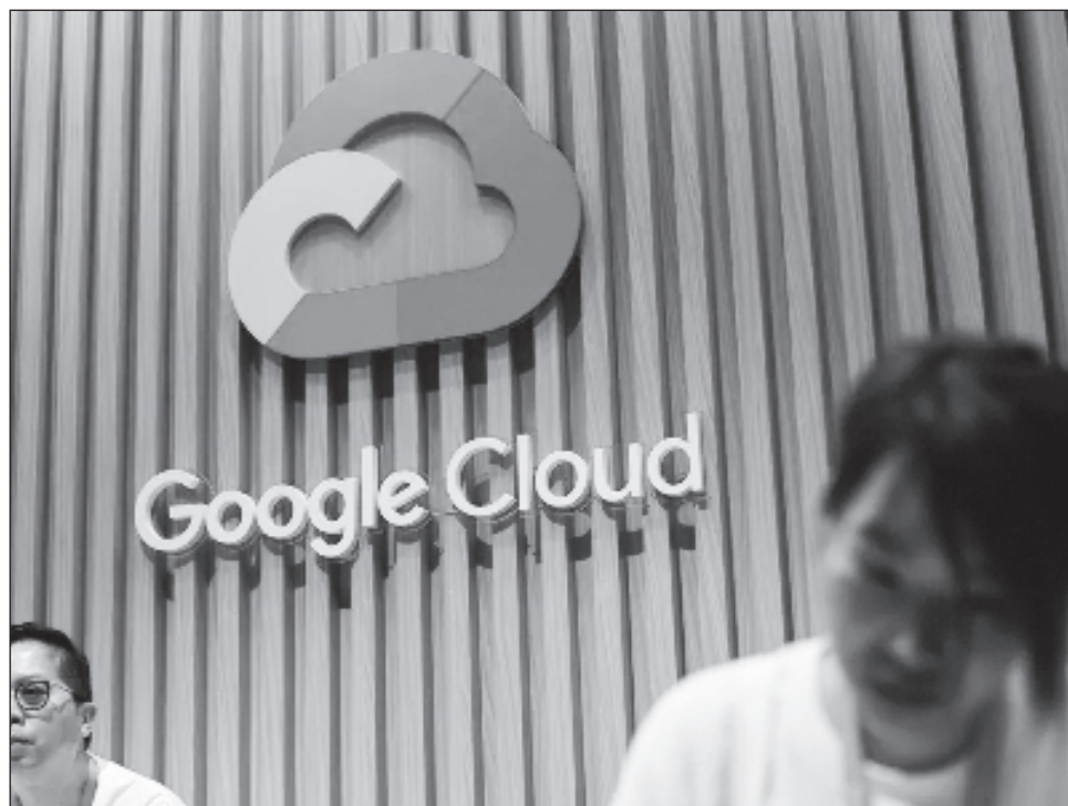
▲ La autoridad francesa reprocha al gigante estadounidense no haber negociado "de buena fe" con los editores de prensa para evaluar su remuneración en virtud de esos derechos.

También señaló que el grupo estadounidense había utilizado "contenido de editores y agencias de noticias" sin advertirles, con el objetivo de capacitar a su aplicación