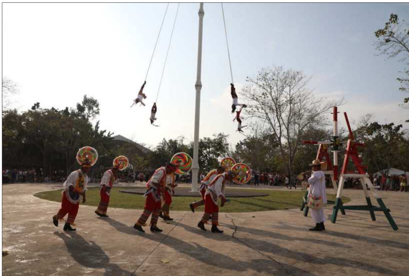
▲ "Hoy, el municipio de Papantla -Pueblo Mágico que ha dado al mundo la mejor vainilla y asegurado la permanencia del encuentro, desde hace 25 años- es en nuestros días el único municipio mexicano con más Patrimonios diversos reconocidos por la UNESCO".

*Miembro fundador de la Cumbre Tajín y del Centro de las Artes Indígenas