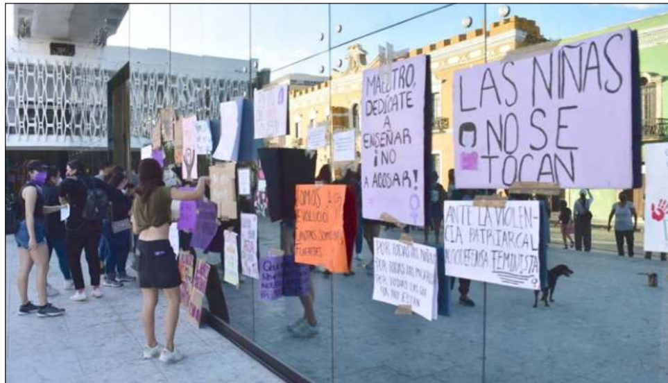
▲ El médico detenido es esposo de una diputada local por Movimiento Regeneración Nacional, por lo que el caso ha tomado mayor interés entre la población universitaria y de Carmen.

Por su parte, la Unacar emitió un comunicado en el que reiteró su política de cero