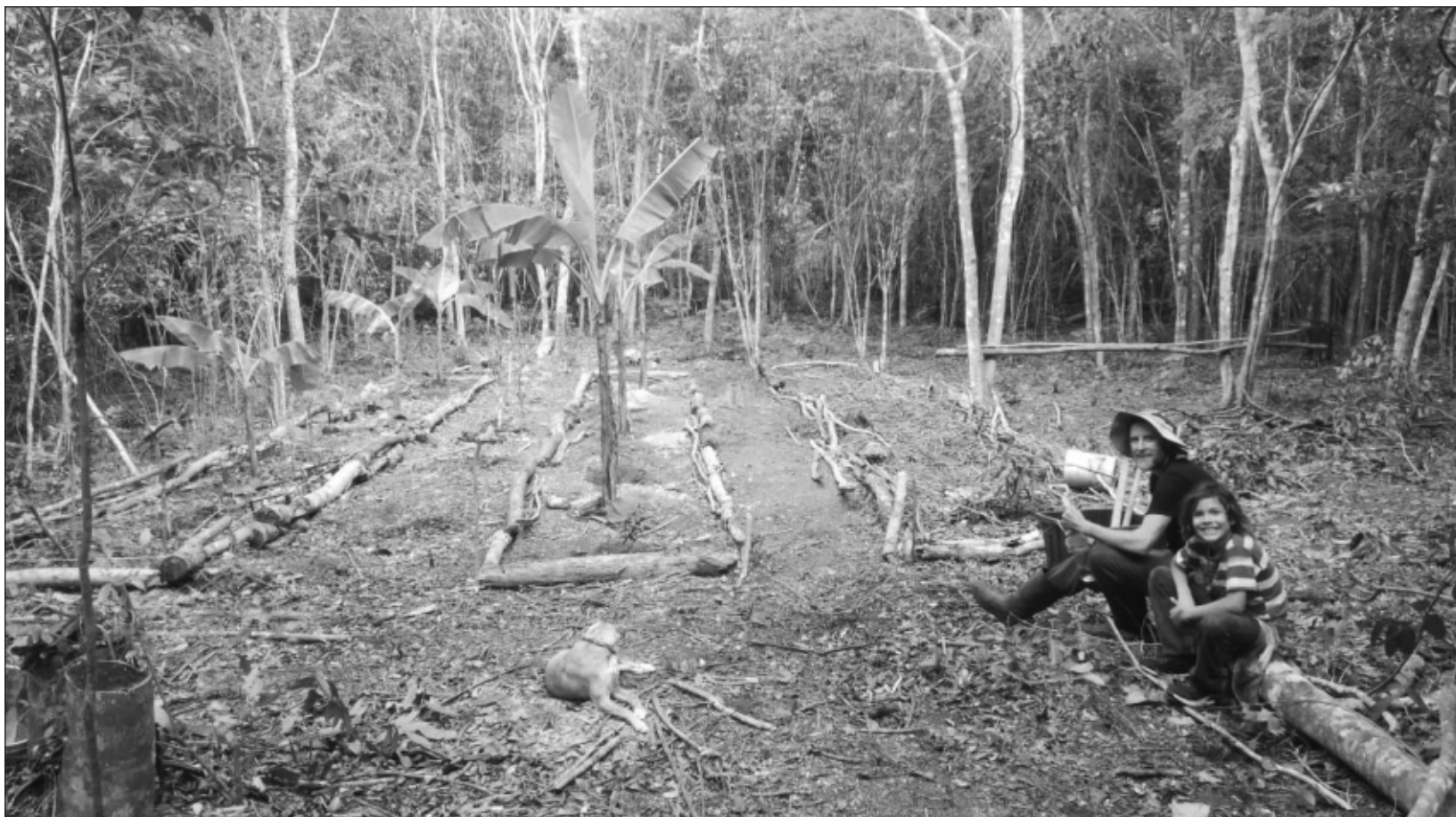
▲ En su nueva casa, Alma y su hijo de 9 años están en estrecha convivencia con la naturaleza. Tienen una huerta donde cultivan diversos alimentos y le dan vida a materiales reciclados que la gente desecha.