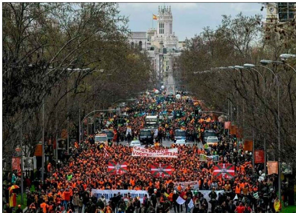
▲ Los productores españoles se quejan de la escalada de precios en los combustibles y los fertilizantes así como las exiguas ganancias que obtienen.

“Este gobierno es una ruina, el combustible está cada vez más caro”, afirmó