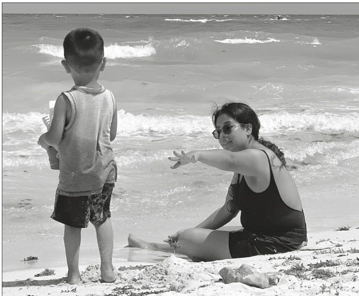
▲ Además de la casa, vestido y sustento, salud, educación, respeto y cultura, los niños tienen el derecho de sentirse deseados, de alimentarse durante nueve meses del amor y el placer de la espera.

Siempre me he preguntado si, junto con la planeación de la boda,