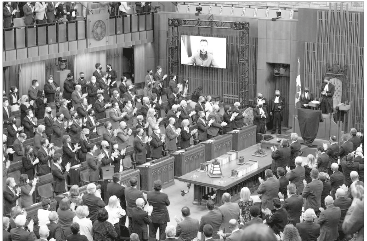
▲ With his words and actions, Zelensky has made heroes of the Ukrainian people. He has personified bravery and courage, tenacity, and sheer will.

ON MARCH 14TH, Russian newscaster Marina Ovsyannikova made an astonishing display of bravery. On a national prime time newscast viewed by millions, she appeared with a sign opposing Putin's war and calling on Rus-