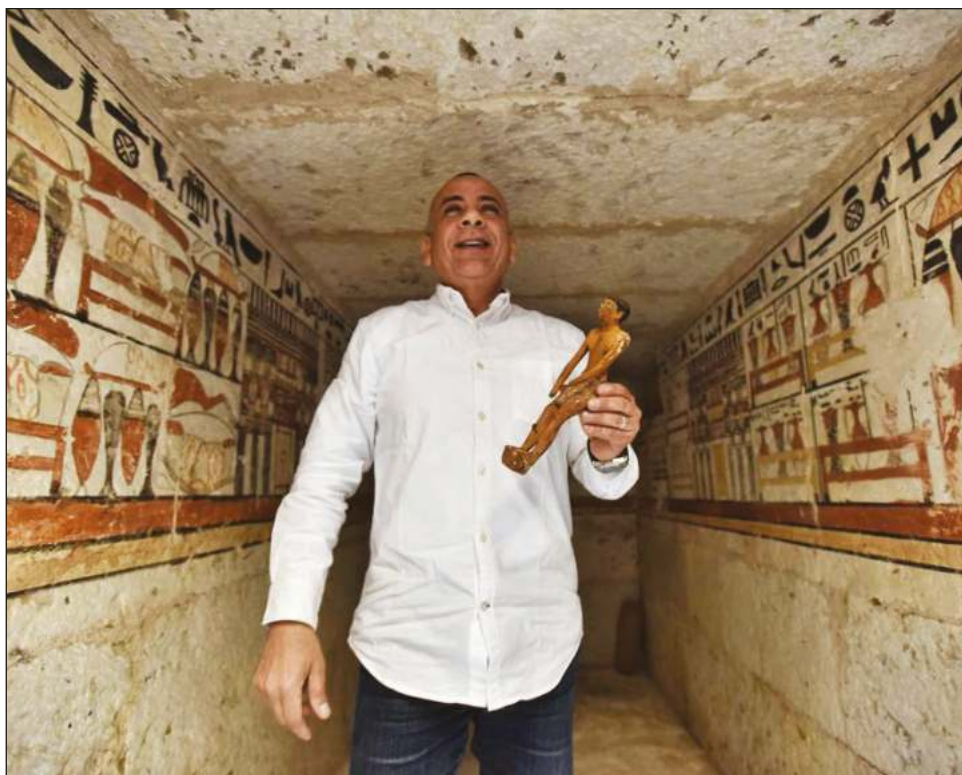
▲ Las cinco tumbas descubiertas están bien pintadas, decoradas; pertenecen a altos funcionarios y gobernadores regionales.

El sitio en Saqqara es parte de una vasta necrópolis en la capital ancestral de Menfis que incluye las pirámides de Giza y otras menores en Abu Sir, Dahshur y Abu Ruwaysh. Las ruinas de Menfis fueron declaradas Patrimonio de la Humanidad por la Unesco en la década de los setenta.