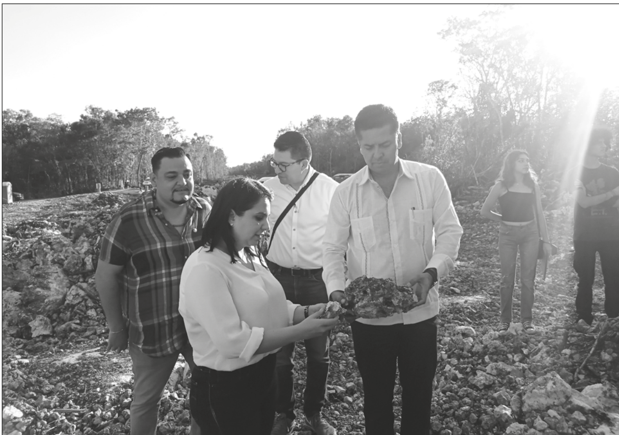
▲ Acompañados de ambientalistas locales, los senadores constataron la fragilidad del suelo y se adentraron en las cuevas para conocer el ecosistema.

Para expresar su malestar tuvieron que caminar nueve kilómetros selva adentro pues “como sabían que veníamos a quejarnos no nos dieron transporte”. Ese transporte consiste en vans que los llevan y sacan de la selva para que hagan su trabajo, que consiste en mover toda la vegetación que tala la maquinaria e ir “limpiando” el trazo por donde pasará el tren.