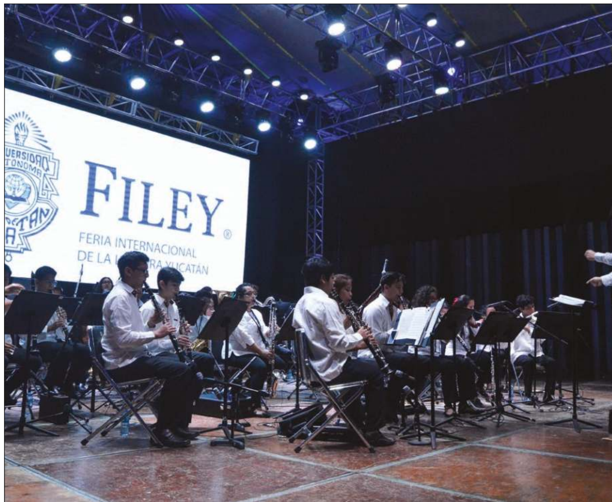
Además de conversatorios y conferencias, la Filey ofrecerá actividades dedicadas a los niños y la presencia de poetas mayas.

Desde luego, señaló Martín Briceño, habrá poetas mayas como