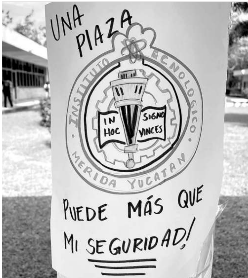
▲ El pasado 16 de marzo, alumnas del ITM se manifestaron, asegurando haber sido víctimas de acoso y abuso sexual por parte de profesores de esa institución.