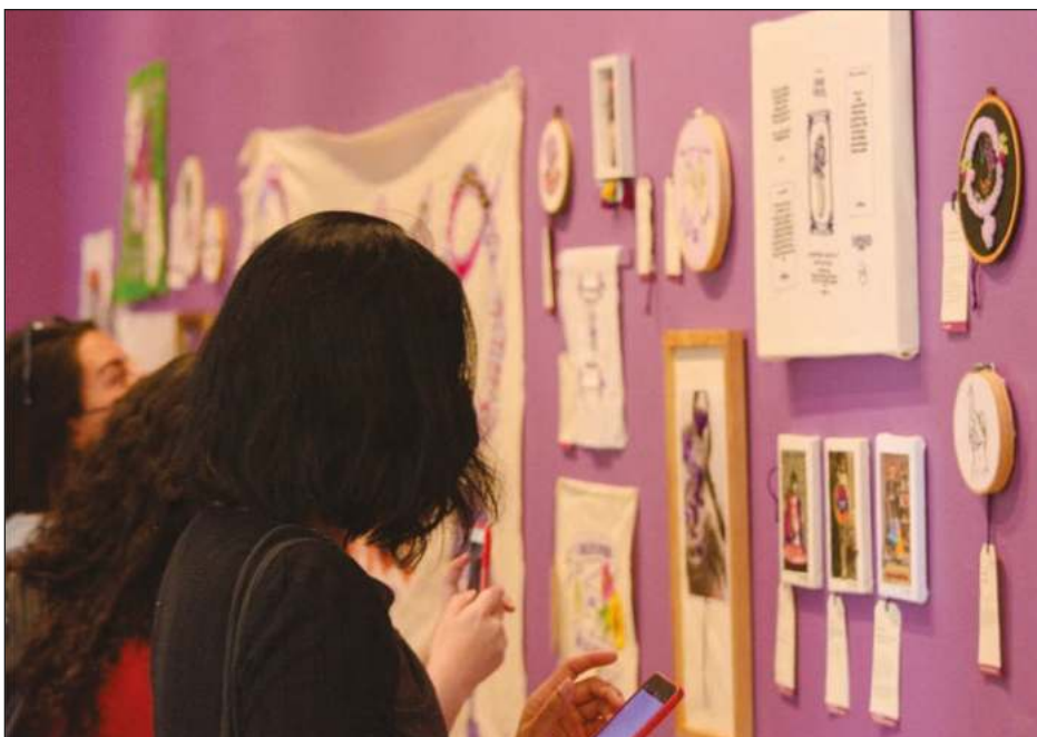
▲ La exposición Des-bordando: Con el corazón morado estará en exhibición en el Museo Nacional de Culturas Populares hasta el 3 de abril.

Además de hacer música para el público infantil, grabar álbumes y ganar un Grammy, así como tener programas de radio y televisión tanto en México como en Argentina, ha publicado más de 30 libros, entre ellos la novela El ciudadano de mis zapatos , reconocida con el Premio Casa de las Américas en 1997.