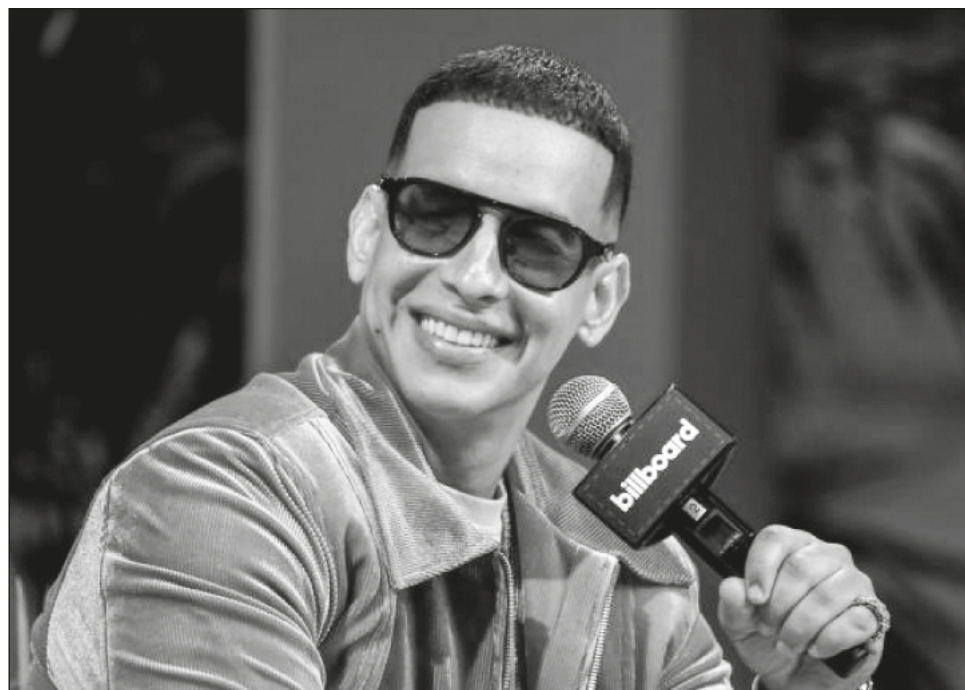
▲ El último álbum del cantante puertorriqueño se llamará Legendaddy , integrado por todos los estilos que lo han conformado como artista.

El artista de 45 años reconoció que sus seguidores han sido “el tesoro más grande que puedo tener en mi carrera” que se