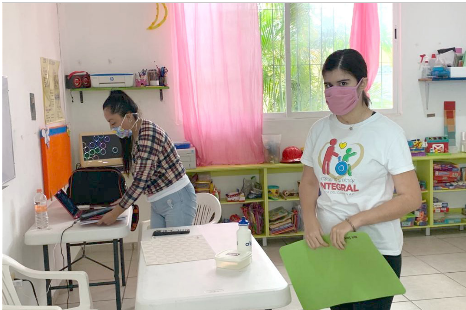
El Centro de Atención Integral de Playa del Carmen es una asociación civil que atiende a niños y jóvenes con discapacidad motriz e intelectual a partir de los cuatro años.