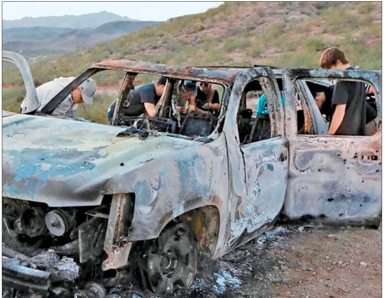
▲ El detenido fue aprehendido y trasladado al Cefereso Número 1, en Almoloya de Juárez, por su presunta participación en el atentado que sufrieron los LeBarón.

Fue aprehendido en Ascensión, Chihuahua, en cumplimiento de una orden de cateo por la probable comisión de los delitos de homicidio calificado, homicidio calificado en grado de tentativa, lesiones, daño doloso y lo que resulte, y trasladado al Centro Federal de Readaptación Social #1 Altiplano, en Almoloya de Juárez, Estado de México, para los procedimientos que correspondan.