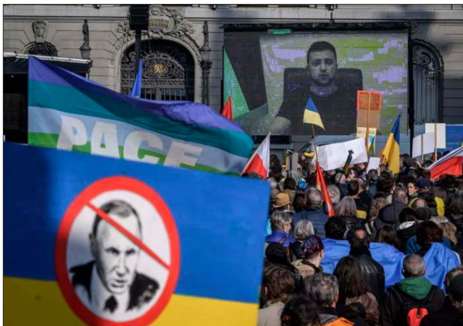
▲ “Debemos utilizar todos los formatos, todas las posibilidades de hablar con Vladimir Putin”, aseguró el presidente ucraniano.

“Ante la invasión de Ucrania por el ejército ruso para