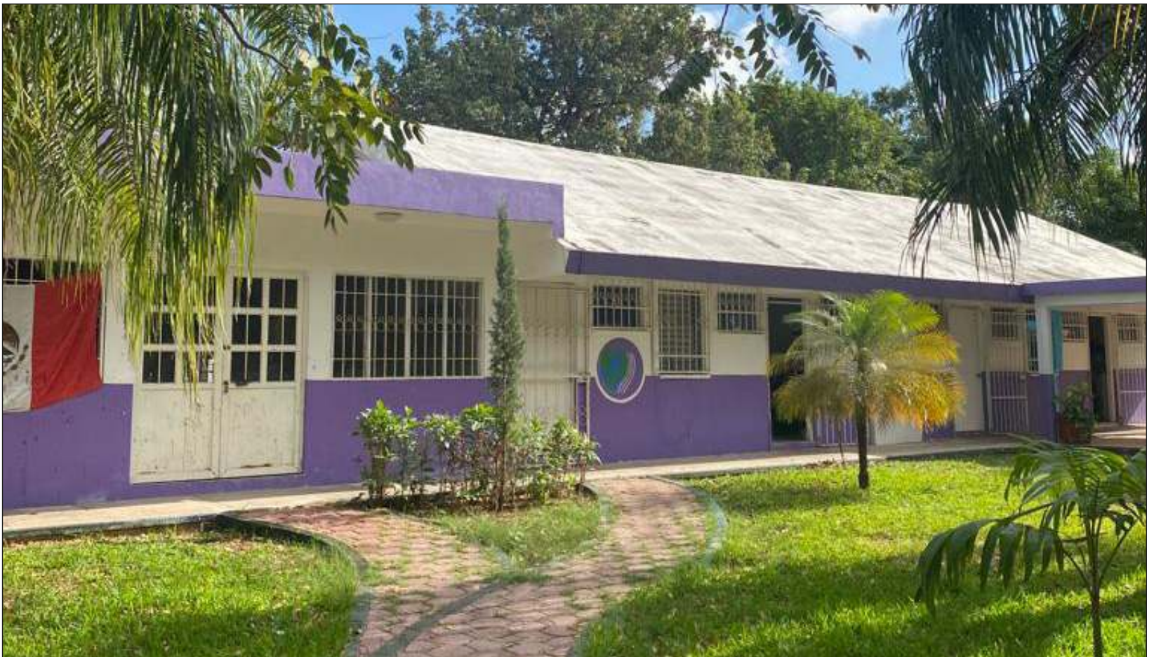
La asociación Pro Down apoya a las personas con este síndrome en el desarrollo de sus habilidades, para así integrarlos a la sociedad y hacerlos independientes.

No obstante, advierte que la sociedad debe tener más información de cómo tratarlos, de qué hacer para integrarlos, cómo podemos apoyarlos para que se integren, “pues muchas veces son rechazados por cómo son, hablan o caminan”.