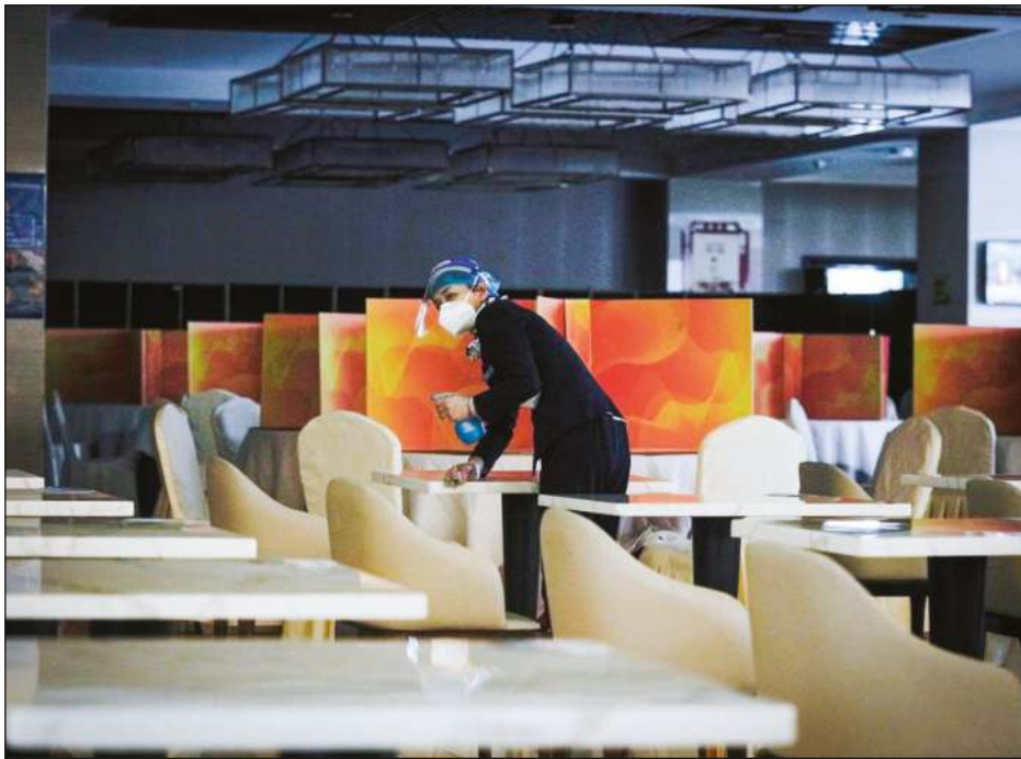
▲ El país asiático registró este domingo 4 mil 53 nuevos casos de Covid-19.