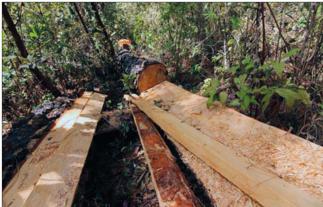
▲ En 2017, el negocio de la madera ilegal rondaba los 7 mil 123 millones de pesos, cifra que hoy podría ser mayor.

Con independencia del desenlace de los hechos suscitados en la México-Cuernavaca, es evidente que hoy por hoy el desmonte clandestino es una de las prácticas más lesivas para el equilibrio ambiental y el bienestar de las generaciones presentes y futuras, por lo que cabe esperar que sociedad y gobernantes de todos los niveles le concedan la importancia que merece y propugnen por adoptar todas las medidas necesarias a fin de erradicarlo.