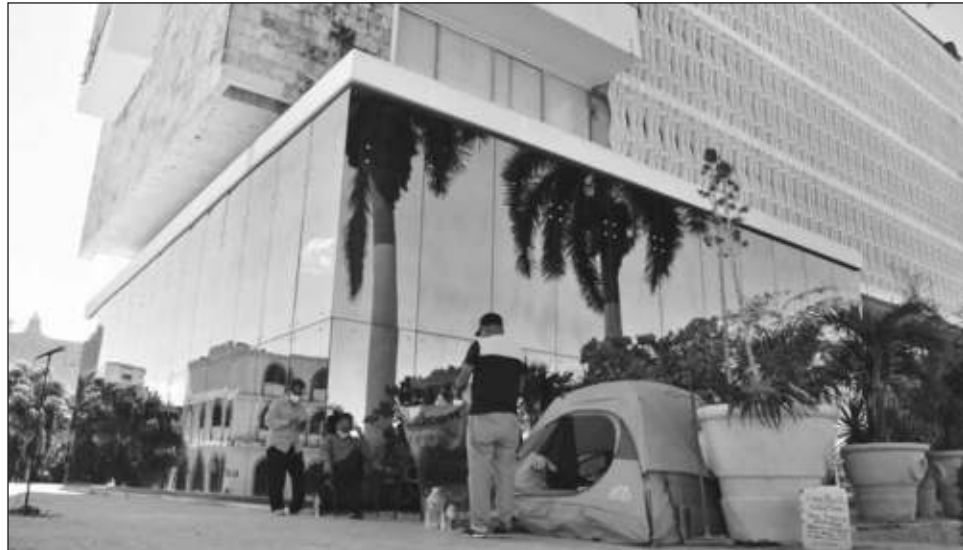
▲ Según se mencionó en conferencia de prensa, tres de los manifestantes en el plantón frente a Palacio de Gobierno manifestaron problemas de salud.

Esa conferencia de prensa fue rápida y se limitó al anuncio de la sus-