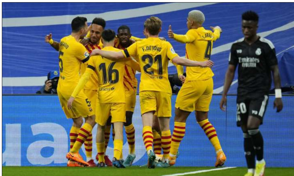
▲ Pierre-Emerick Aubameyang (segundo a la izquierda) condujo la paliza del Barcelona al Real Madrid.

En los primeros compases del complemento, Ferran Torres amplió con un remate