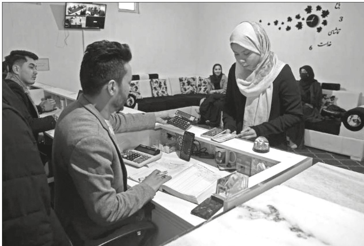
▲ Las transferencias de criptomonedas permiten a Code to Inspire sortear obstáculos y asegurarse que cada donación llega a quienes más lo necesitan en Afganistán.

Casi un año después, sufrió un golpe de Estado militar seguido por una dura represión contra la disidencia que ha dejado más de mil 600 muertos y ha castigado también los negocios, con numerosas firmas internacionales abandonando el país.