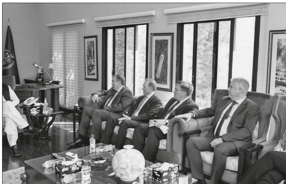
▲ La mina está situada en la zona de Reko Diq, en la provincia de Baluchistán.

El primer acuerdo para explotar esta importante veta se firmó en 1993 e incurrió en varias irregularidades que invalidaron en origen la licencia, concedida inicialmente a la empresa BHP, con sede en Estados Unidos.