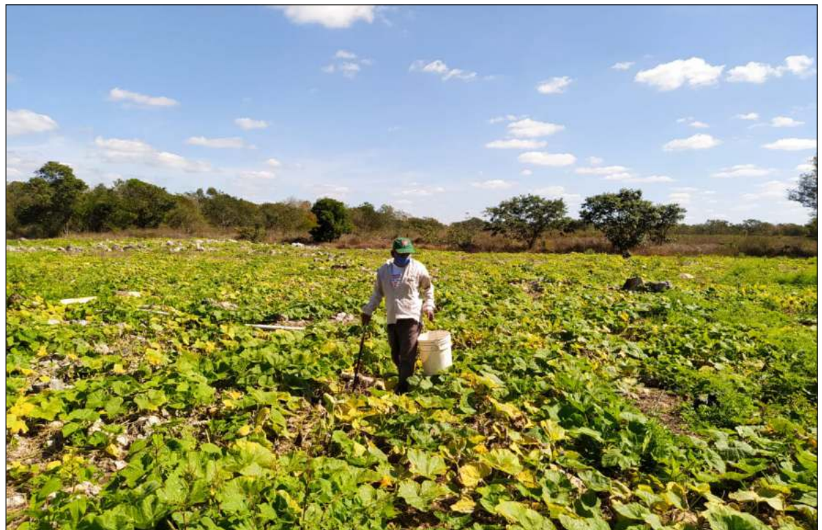
▲ En la península de Yucatán es evidente el deterioro de las prácticas agrícolas tradicionales del pueblo maya, pero existen agrupaciones de campesinos que resisten en el interior de los tres estados que la conforman.

• Para la transformación alimentaria es necesario cambiar los sistemas de investigación, educación e innovación. Es momento de impulsar nuevas investigaciones que reconozcan y aprendan de las distintas evidencias, sistemas de conocimiento y formas de saber relacionadas con las prácticas agroecológicas.