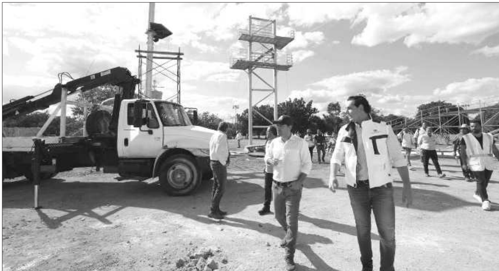
▲ A través de una inversión sin precedentes de más de 146 mdp, la remodelación y modernización de la Unidad Deportiva del Sur Henry Martín contempla obras como canchas de basquetbol, futbol, jaulas de bateo y un centro de usos múltiples con tableros, techo y gradas.