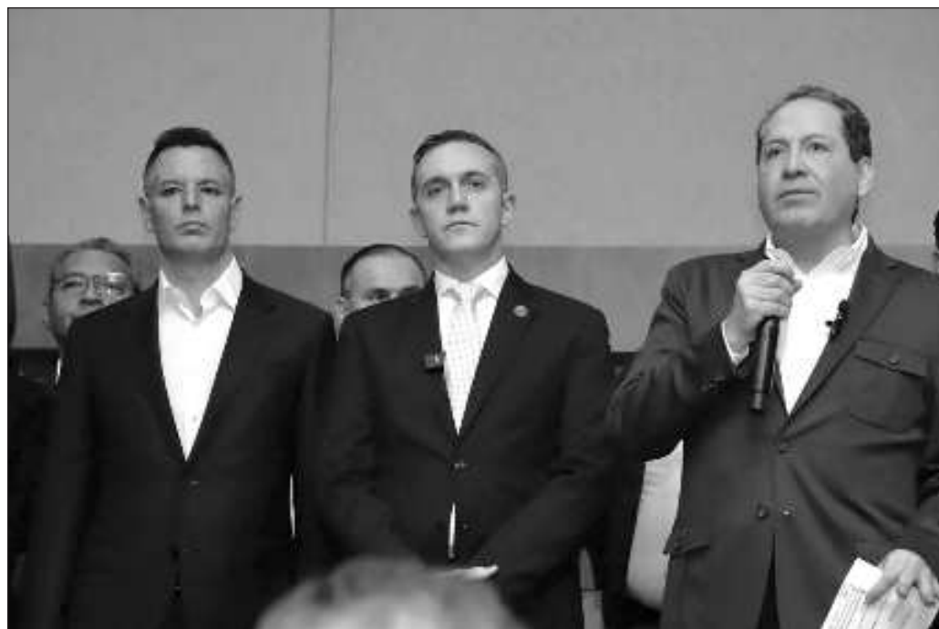
▲ Difícilmente puede decirse que los impulsores de la Alianza son de izquierda, pero sí han sido opuestos a confundirse con el PAN, muchos de ellos se formaron considerándolos enemigo.

Queda pendiente cuánto podrá sumar la Alianza a la causa de Claudia Sheinbaum, pero si a paralelismos históricos nos atenemos, la Revolución Mexicana se hizo con porfiristas; a nadie extraña entonces que sea necesario abrir espacios a priistas de viejo cuño.