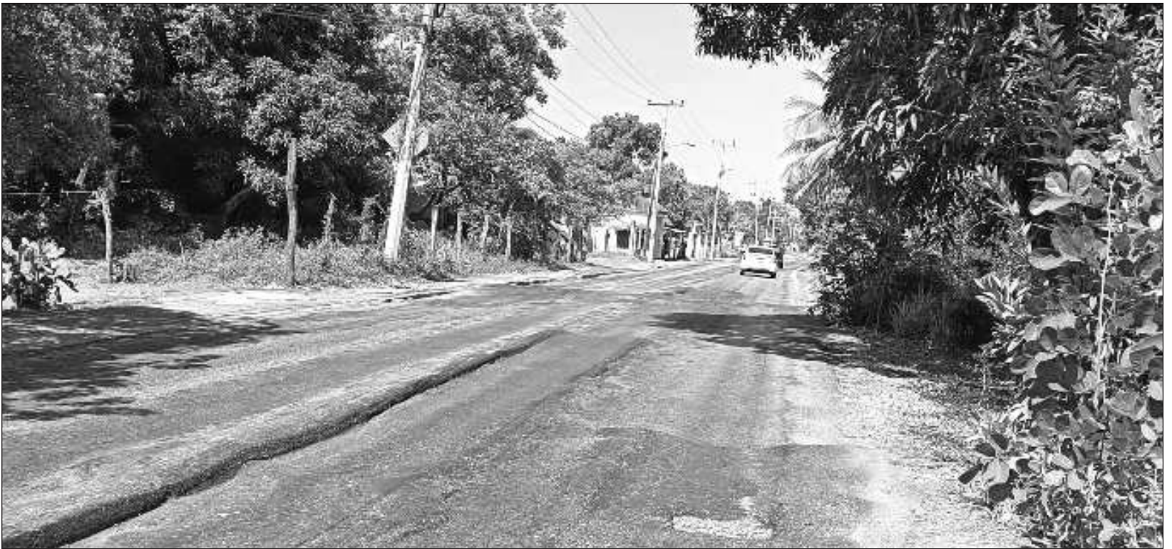
▲ Los carmelitas han visto pasar frente a sus ojos la riqueza que ha generado grandes beneficios para el país, pero muy poco para la entidad y para la Isla.

“La importancia económica de Carmen radicaba en que solo en tres regiones en el mundo se producía el palo de tinte: en Brasil, en Belice y en Carmen, por lo que este puerto mantenía una relación comercial con los principales puertos a nivel mundial de ese entonces como Liverpool, Habsburgo, Cádiz, y Lisboa, entre otros”.