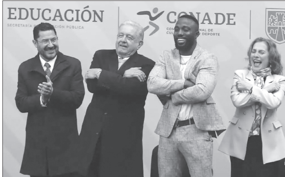
▲ El presidente Andrés Manuel López Obrador entregó el Premio Nacional del Deporte 2023 a la novena mexicana que participó en el Clásico Mundial de Beisbol, y celebró junto a Randy Arozarena realizando su pose para festejar.

El presidente elogió el trabajo de las familias y los en-