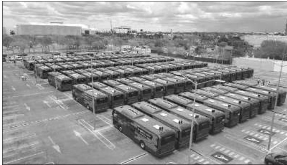
▲ Las nuevas unidades híbridas -amigables con el medio ambiente- son Yutong, contaminan 60 veces menos que un autobús convencional y no generan ruido. Además, combinan un sistema de propulsión diésel-eléctrico, con capacidad para 70 personas.

El horario de funcionamiento será de lunes a do-